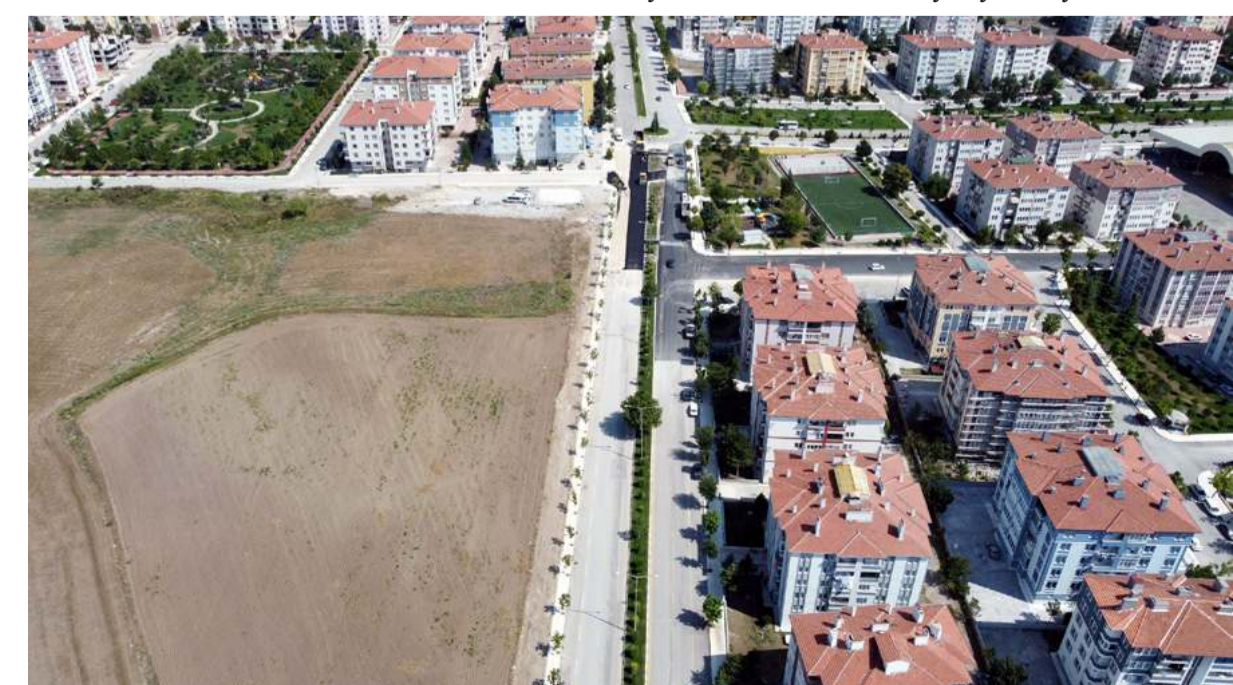
Çorum'da konut fiyatları artan en çok mahalle ise Buharaevler oldu.

Amortisman süreleri dikkate alındığında Haziran 2022 sonu itibarıyla Çorum ilinde en geç geri dönüşe sahip ilçeler sırasıyla Osmaniye, Alaca, Merkez, İskilip, Sungurlu oldu.