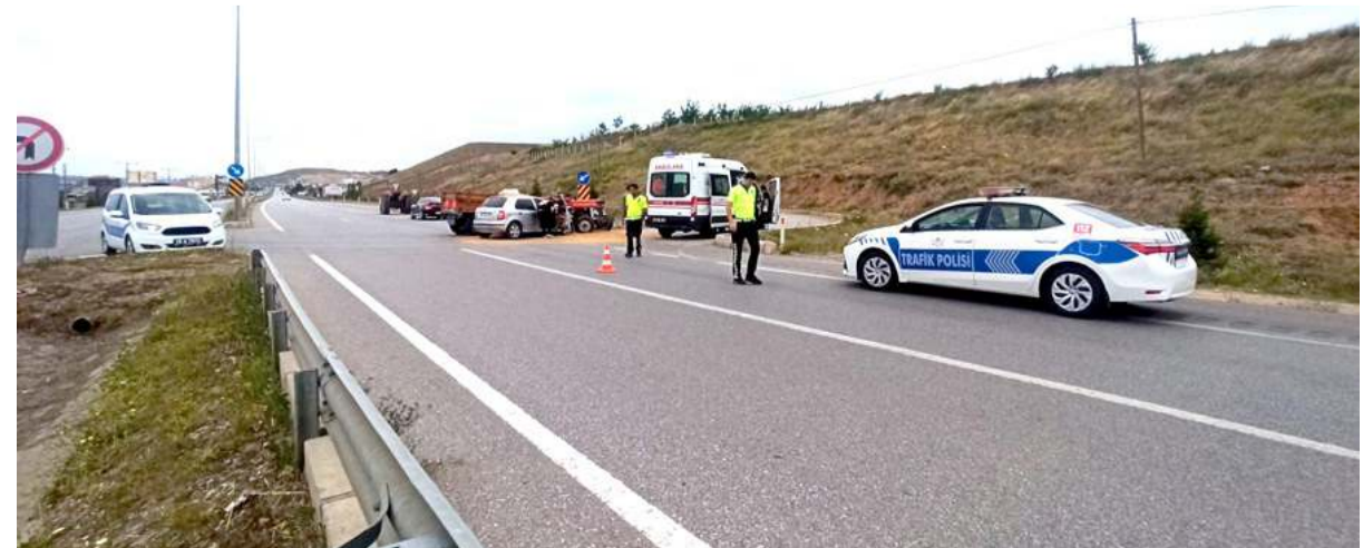
Kaza nedeniyle trafik bir süre kontrollü olarak verildi.