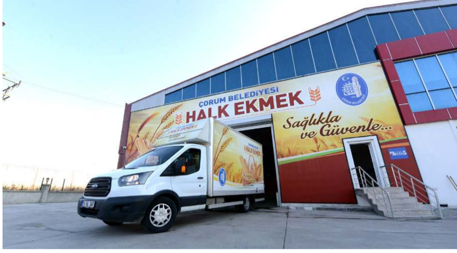
Halk Ekmek, 200 gr.'lık ekmeği 2,50 TL'den satacak.

Çöplü, güncel fiyatın 21 Temmuz Cumartesi gününden itibaren geçerli olacağını sözlerine ekledi. (Haber Merkezi)