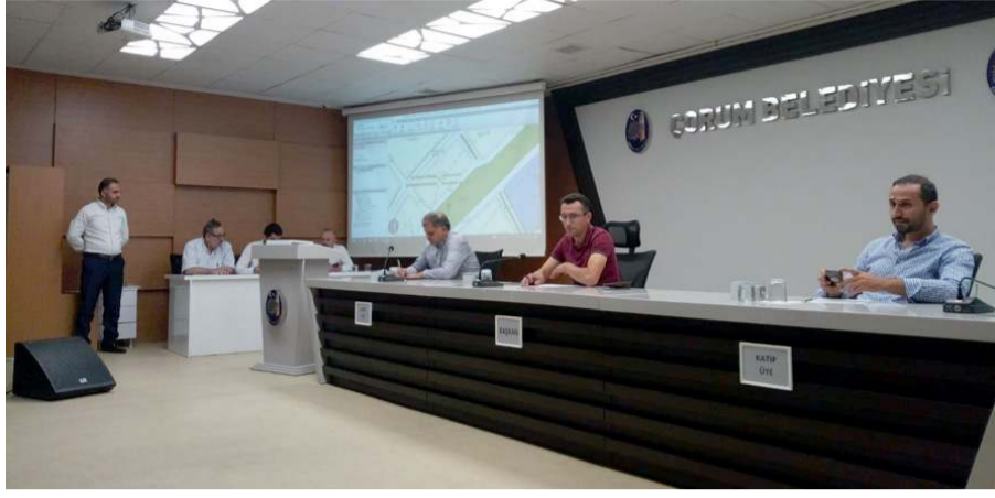
İhale Belediye Encümeni huzurunda yapıldı.