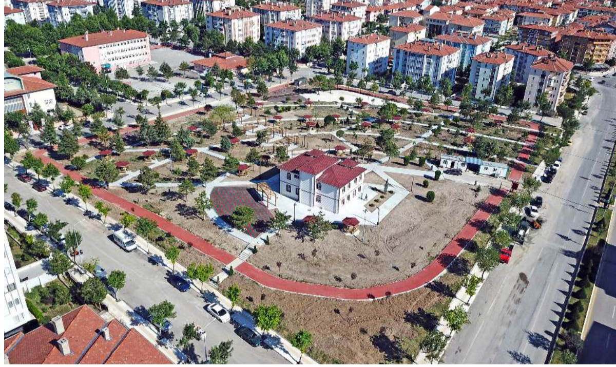
Çorum'da konut fiyatları artan en çok mahalle ise Buharaevler oldu.