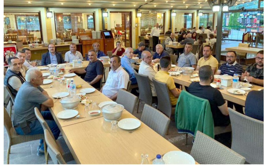
Yemekte kömür ve odun satıcılarının genel durumu ve mesleki konularla ilgili istişarede bulunuldu.