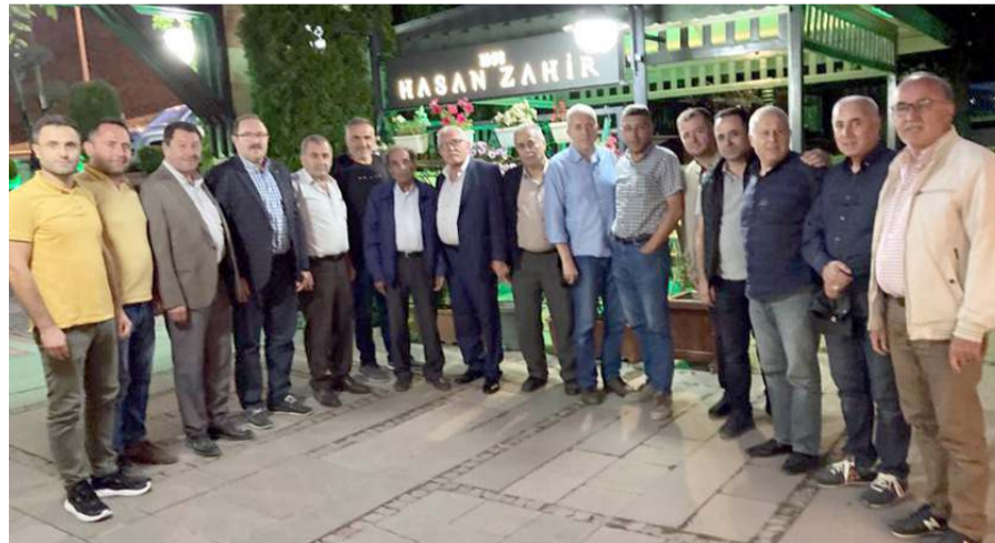
Toplantıyı Çorum Kömür ve Odun Satıcıları Yardımlaşma Derneği düzenledi.

Çorum Kömür ve Odun Satıcıları Yardımlaşma Derneği üyeleri, organize edilen yemekte bir araya geldiler.