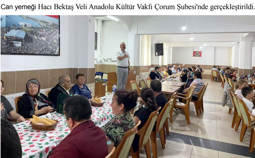
Can yemeğine merhumun yakınları ile çok sayıda seveni katıldı.