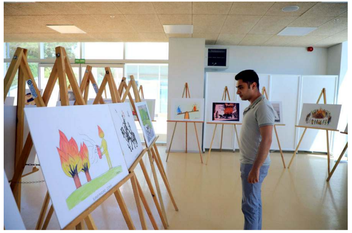
Sergi Türkan Saylan Çağdaş Yaşam Merkezi’nde açıldı.

Resmi İlanlar: www.ilan.gov.tr ’de (Basın: 1661584)