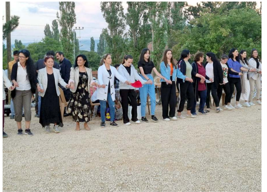
Davetliler bol bol halay çekerek güzel bir gün geçirdiler.