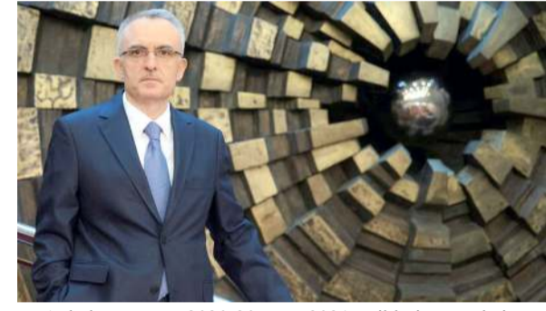
Ağbal, 7 Kasım 2020-20 Mart 2021 tarihleri arasında ise Merkez Bankası başkanlık koltuğunda oturmuştu.