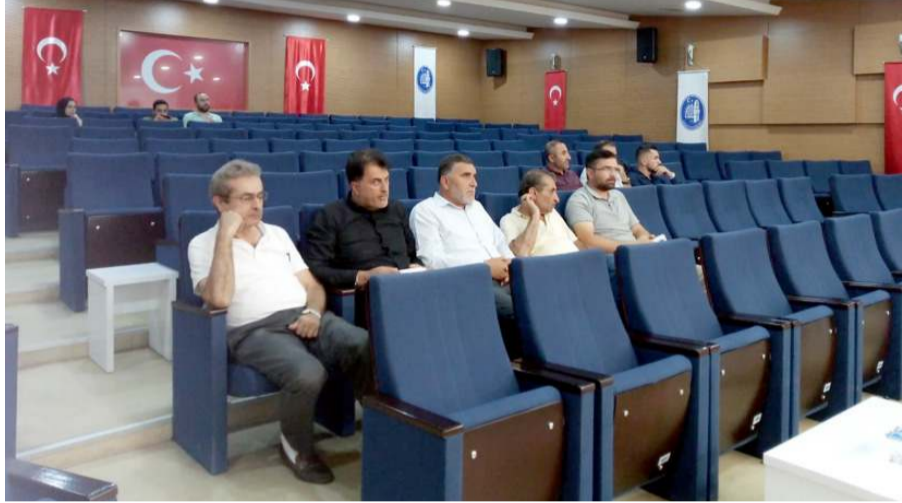
İhaleye ilgi az oldu.