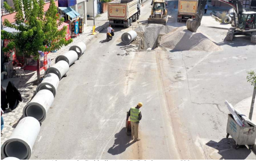
Aksaray 3. Cadde ile Ata 17. Sokak arasında 500 metre uzunluğunda yağmur suyu hattı döşeniyor.

Başkan Aşgın, Çorum'u daha yaşanılabilir, daha müreffeh bir şehir haline getirmek için insan odaklı hizmet belediyeçiliği anlayışı doğrultusunda altyapı ve üstü yapıda yeni yatırımları şehre kazandıracaklarını da sözlerine ekledi. (Haber Merkezi)