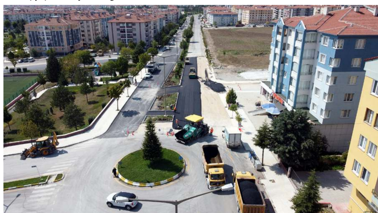
5.Cadde'de ortalama ev fiyatları 2.5 milyon TL'nin üzerine çıktı.