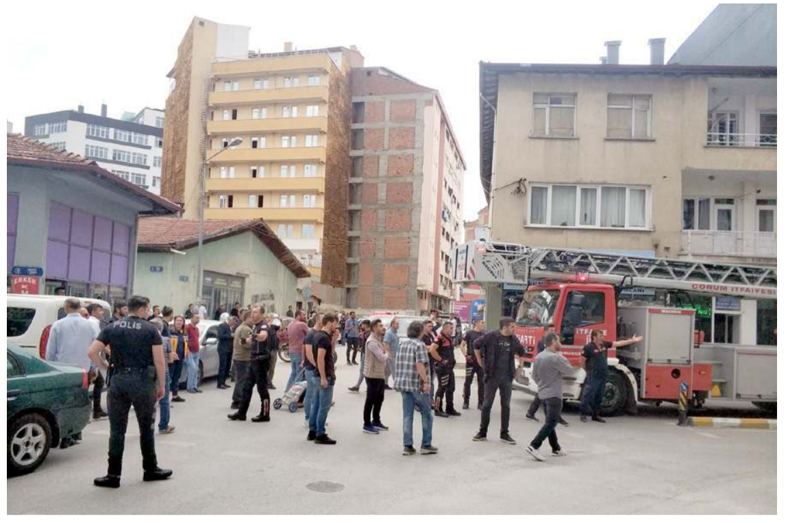
Polis ekipleri olay yerinde güvenlik önlemi aldı.