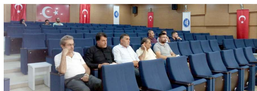
İhaleye ilgi az oldu.