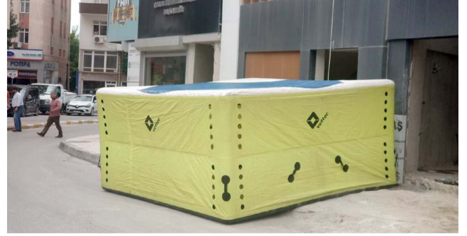
İtfaiye olay yerine hava yastığı açtı.