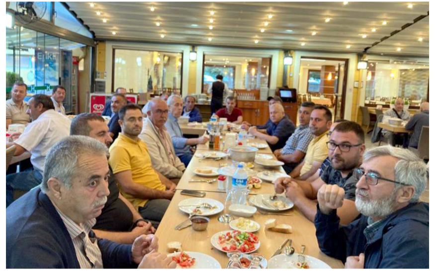
Toplantı Hasan Zahir Et Lokantası'nda yapıldı.