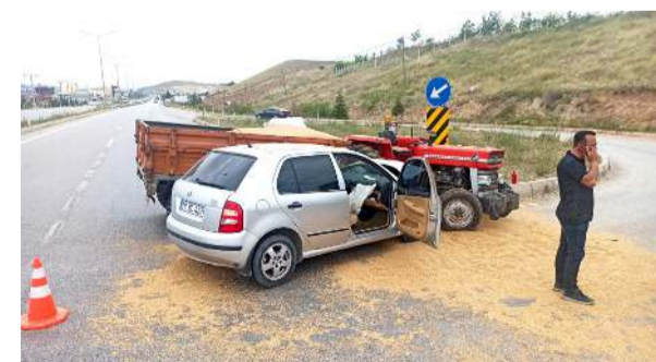
Kaza, Sungurlu-Kırıkkale karayolunun 6. kilometresinde meydana geldi.