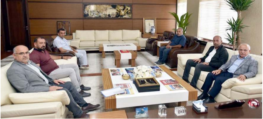
Ziyarete Hizmet İş Sendikası Çorum Şubesi yöneticileri de katıldı.