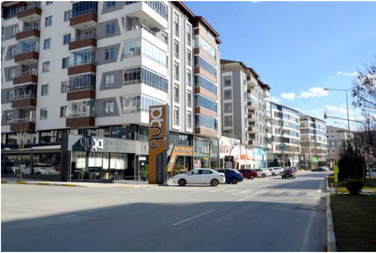
2 yıl önce 400-500 bin lira olan evler bu yıl 2 milyon TL'den satılıyor.

Yüksek enflasyon ve inşaat maliyetlerinin artması nedeniyle konut fiyatlarında inanılmaz