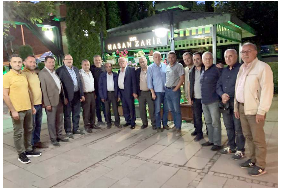
Toplantıyı Çorum Kömür ve Odun Satıcıları Yardımlaşma Derneği düzenledi.

Orman Bakanlığınca düzenlenmektedir. Söz konusu yönetmelikte belirtilen bitki koruma ürünleri bayilik ve toptancılık belgesi verilecek kişilerde aranacak şartları, sınava başvuru yapıldığı tarih itibarıyla sağlamadığı halde yanlış beyanda bulunarak sınava giren adayların sınavları başarılı olmuş olsalar bile geçersiz sayılacaktır. Sınav 17 Eylül 2022 Cumartesi günü saat 10.00'da Ankara, İstanbul (Anadolu-Avrupa), İzmir, Antalya, Adana, Samsun ve Diyarbakır illerinde yapılacaktır. Sınavla ilgili ayrıntılı bilgiler ile Sınav Takvimi ve Uygulama Talimatına, Tarım ve Orman Bakanlığının https://www.tarimorman.gov.tr/Duyuru/1653/Bitki-Koruma-Urunleri-Bayilik-Ve-Toptancilik-Sinavi-Duyurusu ve Ankara Üniversitesi Sürekli Eğitim Merkezinin http://ankusem.ankara.edu.tr/2022/06/17/bitki-koruma-urunleri-bayi-ve-toptancilik-sinavi/ internet adreslerinden ulaşılabilir. Sınav katılmak isteyenlere önemle duyurulur" ifadelerini kullandı. (Haber Merkezi)