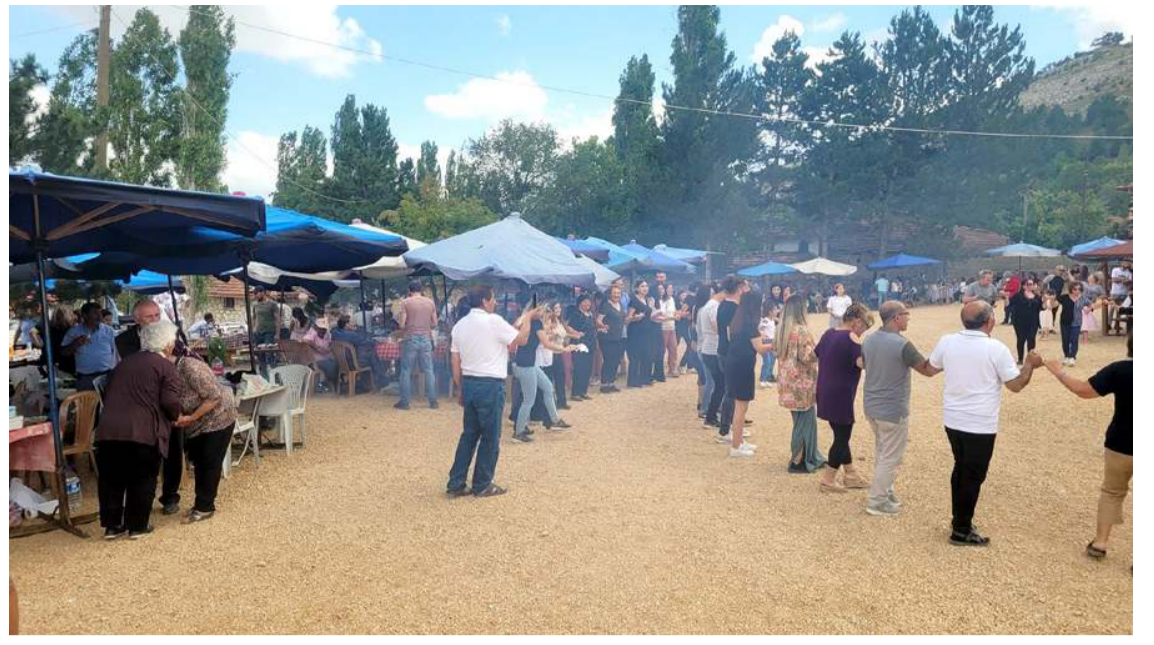
Etkinliği Kuşsaray Köyü Muhtarlığı ve Kuşsaray Dernekleri Platformu düzenledi.

Böylece bu belgeyi alan firma sayısı 8'e yükseldi" dedi.