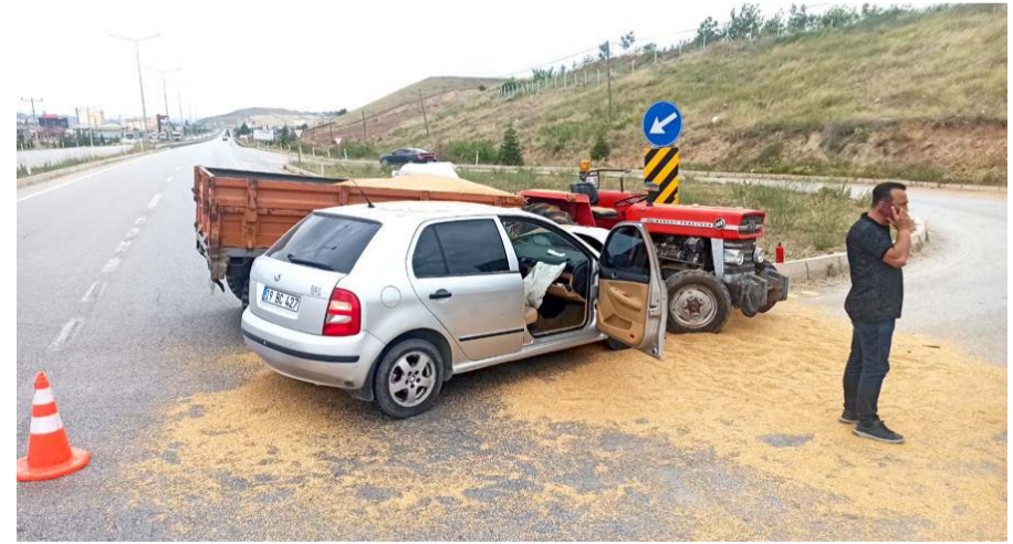
Kaza, Sungurlu-Kırıkkale karayolunun 6. kilometresinde meydana geldi.

Kazayla ilgili başlatılan soruşturma sürüyor. (İHA)