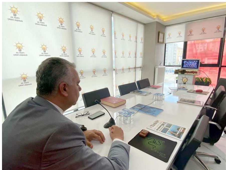
Toplantı video konferans yöntemiyle gerçekleştirildi.

Kendileri için her seçimin önemli olduğuna değinen