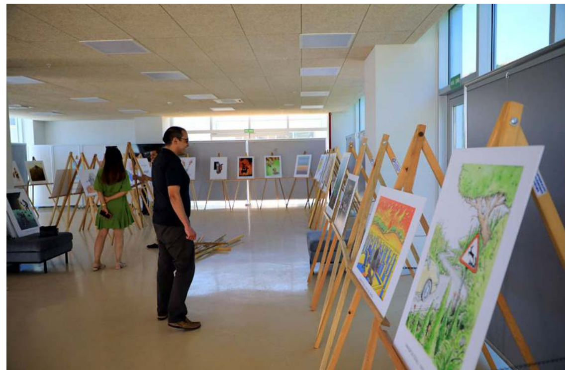
Sergide 18 yaş altı 9 karikatür, 18 yaş üstü 11 karikatür olmak üzere toplam 50 karikatür yer alıyor.