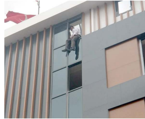
Davut G. isimli bir vatandaş ailevi nedenlerden dolayı intihar girişiminde bulundu.