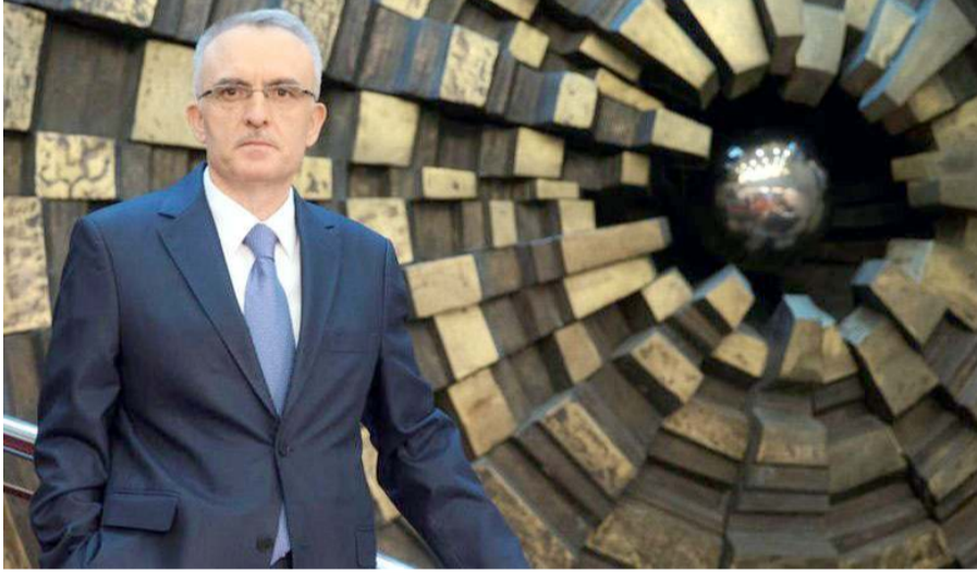
Ağbal, 7 Kasım 2020-20 Mart 2021 tarihleri arasında ise Merkez Bankası başkanlık kol-tuğunda oturmuştu.

Ağbal Kasım 2015-Temmuz 2018 tarihleri arasında Maliye Bakanı olarak görev yapmıştı. 7 Kasım 2020-20 Mart 2021 tarihleri arasında ise Merkez Bankası başkanlık kol-tuğunda oturmuştu. (Haber Merkezi)