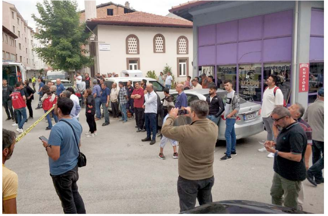
Vatandaşlar intihar girişimini meraklı gözlerle izledi.