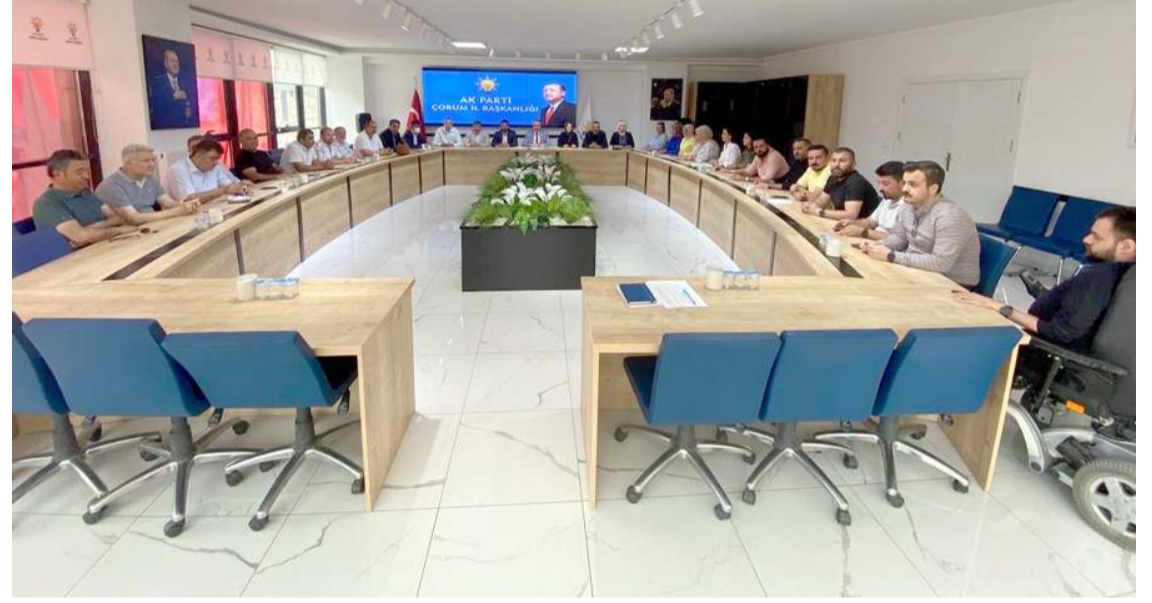
Toplantıda parti çalışmaları masaya yatırıldı.

Cumhurbaşkanı Recep Tayyip Erdoğan'ın KYK'dan kredi kullanan öğrencilere yönelik verdiği müjdeyi de değerlendiren Ahlatcı, kredi geri ödemelerinin herhangi bir enflasyon farkı olmaksızın, sadece alınan kredi rakamı üzerinden yapılacağını kaydetti. (İHA)