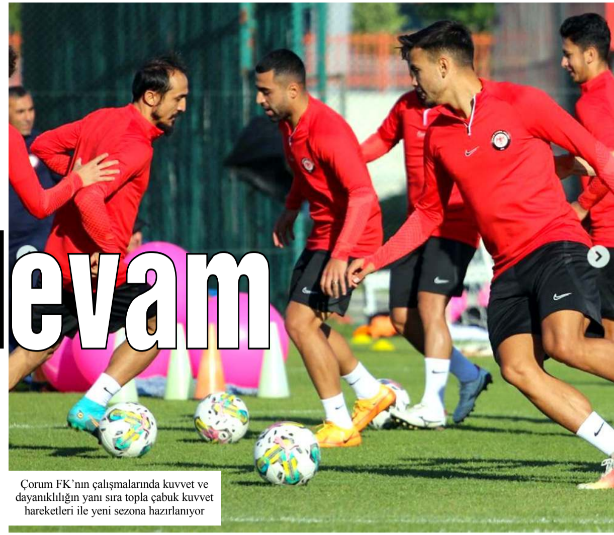
Çorum FK'nın çalışmalarında kuvvet ve dayanıklılığın yanı sıra topla çabuk kuvvet hareketleri ile yeni sezona hazırlanıyor