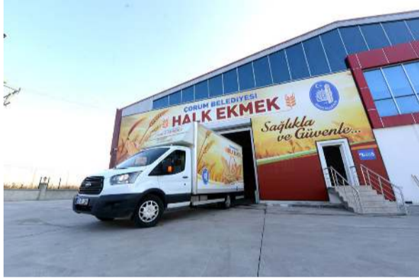
Halk Ekmek, 200 gr.'lık ekmeği 2,50 TL'den satacak.