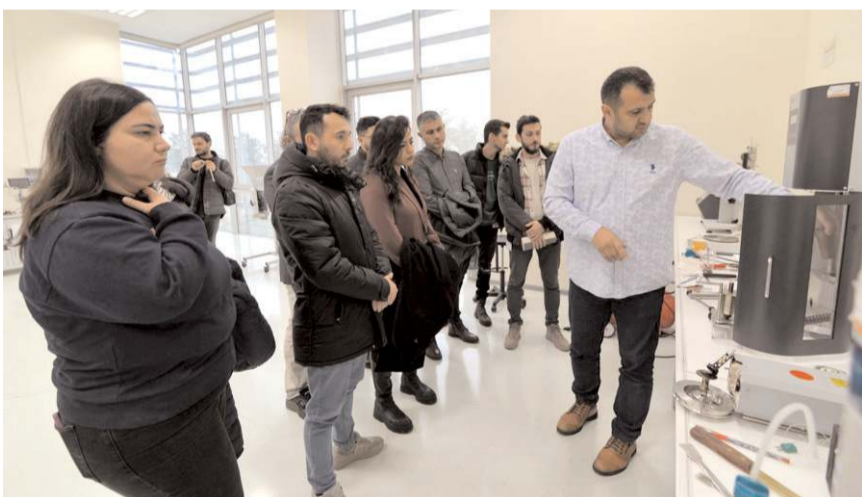
Silverline heyeti HÜBTUAM'ı gezdi.

"Türkiye'de sayılı imkanlara sahip önemli bir laboratuvara sahibiz. Türkiye İlaç ve Tıbbi Cihaz Kurumu ve Türk Akreditasyon Kurumu ile yakın işbirliği içerisindeyiz. Diş implant analizlerinden deri ve oyuncaklardaki zararlı madde tayinine kadar geniş yelpazede bir çalışma alanımız mevcut. HÜBTUAM, implantların mekanik analizi üzerine 21 ve tekstil, deri ve plastiklerde zararlı madde tayini üzerine 6 olmak üzere toplam 27 alanda TÜRKAK akreditasyonuna sahip, ulusal düzeyde hizmet sunuyor. Ayrıca, bu alanlardaki uygunluk testleri ve analizlerin yapılmasında yurt dışına olan bağlılık, Hitit Üniversitesi bünyesinde faaliyet gösteren modern laboratuvarlar sayesinde büyük oranda ortadan kalktı. İmplantların üretiminde yerli ve milli sanayinin büyük bir gelişim gösterdiği ülkemizde, yerli üreticinin test ve analiz hizmetlerindeki dışa bağımlılık da büyük oranda sonlandırıldı. Bu kapsamda son yıllarda Almanya ve Hollanda gibi Avrupa ülkelerine de hizmet vermeye başladık." (Haber Merkezi)