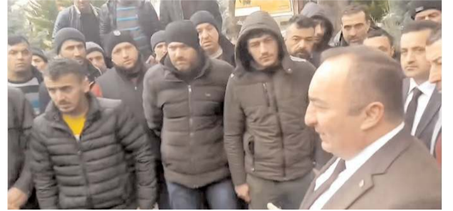
İşten çıkarılan işçiler ayrıca İskilip Belediye Başkanı Ali Sülük'ü ziyaret ettiler.

İşten çıkarılan işçiler ayrıca İskilip Belediye Başkanı Ali Sülük'ü ziyaret ederek, yar-