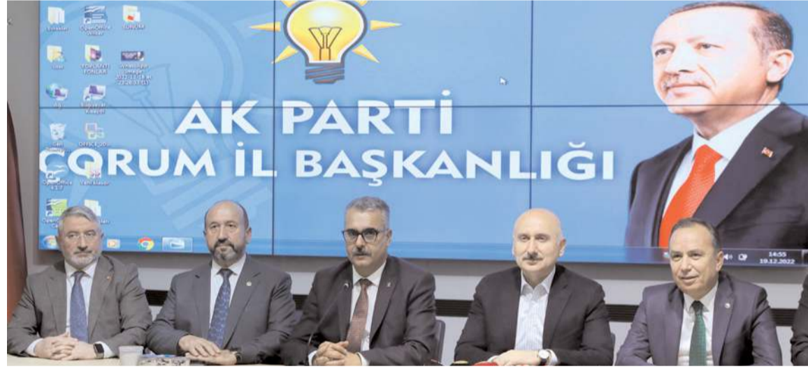
Adil Karaismailoğlu, demiryolu projesi hakkında açıklamalarda bulundu.

Ulaştırma ve Altyapı Bakanı Adil Karaismailoğlu, 2023 yılında Delice-Çorum arasında demiryolu ve hızlı treni yatırım programına alarak ihaleye çıkacaklarını belirterek, "Çorum demiryolunun yatırım programına alınma süreci başladı. İnşallah hedefimiz yakında yatırım programına almak ve ihale sürecini başlatmak" dedi. * HABERİ 4'DE