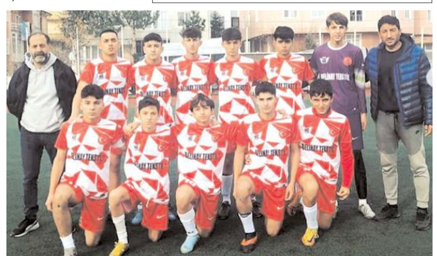
Hattuşa Gençlikspor ligdeki ilk iki maçını kazanarak liderliğe yükseldi

Üçüncü hafta maçları cumartesi günü oynanacak. Haftanın maçında ilk iki sırada yer alan Hattuşa Gençlikspor ile Mimar Sinan Gençlikspor zorlu maçta karşılaşırken diğer kayıpsız takım Alaca Belediyespor ise Mecitözü Gençlerbirliği deplasmanında galibiyet serisini sürdürmek için mücadele edecek.