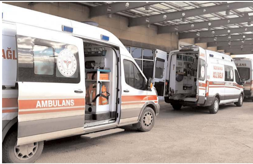
O.Y hastanede tedavi altına alındı.

Bacağınan bıçakla yaralanan lise öğrencisi, sağlık ekiplerinin müdahalesinin ardından kaldırıldığı Hitit Üniversitesi Erol Olçok Eğitim ve Araştırma Hastanesi'nde te-