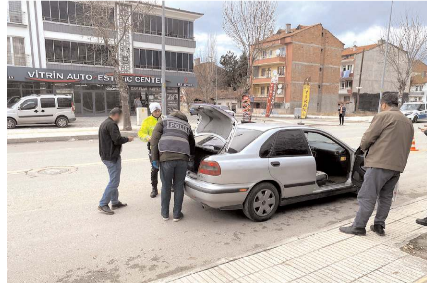
Ekipler denetimlerde 450 aracı kontrol etti.

Ekipler denetimlerde 450 aracı kontrol ederken 9 araca toplam 8 bin 196 TL idari para cezası uyguladılar. (Haber Merkezi)