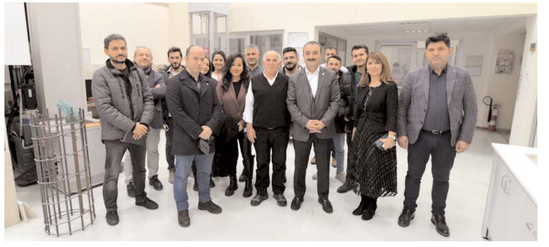
Silverline heyeti HÜBTUAM'ı gezdi.