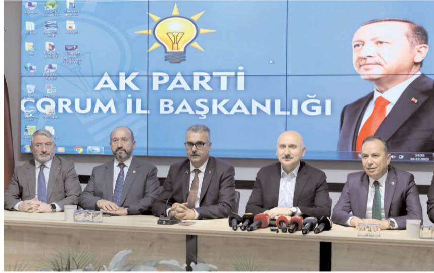
Adil Karaismailoğlu, demiryolu projesi hakkında açıklamalarda bulundu.

Konuşmasında önümüzdeki seçimlerde değinen Karaismailoğlu, şunları söyledi: “Çok çalışmamız gerekiyor. Yaptığımız işlerden eminiz. Vatandaşımız da kimin ne yaptığını ne için çalıştığını görüyor ama biraz da anlatmamız, vatandaşın gönlüne girmemiz gerekiyor. Eksiklerimizin olduğu bölümler, vatandaşlar da olabilir. Onlara daha çok anlatacağız. Cumhurbaşkanımızın liderliğinde 'durmak yok yola devam' demek için çok çalışmak gerekiyor. Öyle ithal danışmanlarla ithal mühendislerle bu iş olmaz. Vatandaşın, milletini seven kadrolar geldiği zaman bakın neler oldu Türkiye'de. Türkiye bütün dünyanın gıpta ettiği işleri nasıl yaptığını bütün dünya biliyor, bütün dünya artık Türkiye'yi izliyor. Cumhurbaşkanımızın vizyonu, onun dünyaya verdiği yön, söylediklerinin dünya tarafından nasıl hissedildiği, yorumladıkları ve dünyadaki olan hareketlerde nasıl Cumhurbaşkanımızın ve Türkiye'nin görüşleri aranıyorsa bundan sonra çok