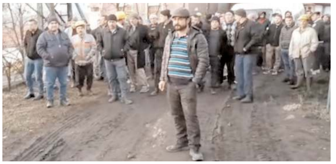
125 işçiye hiç bir bildirimde bulunulmadan işlerine son verildiği öğrenildi.