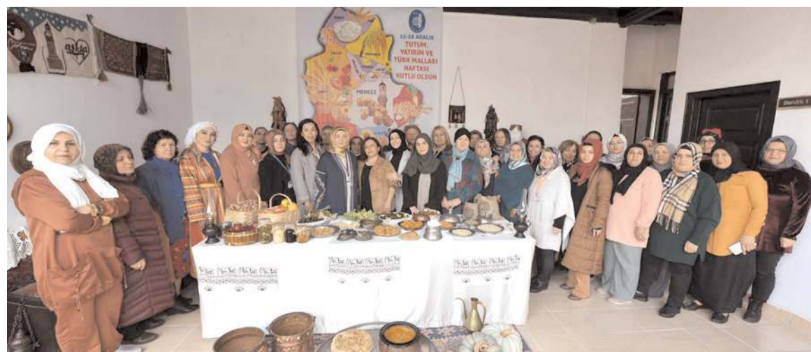
Programın sonunda hatıra fotoğrafı çekildi.