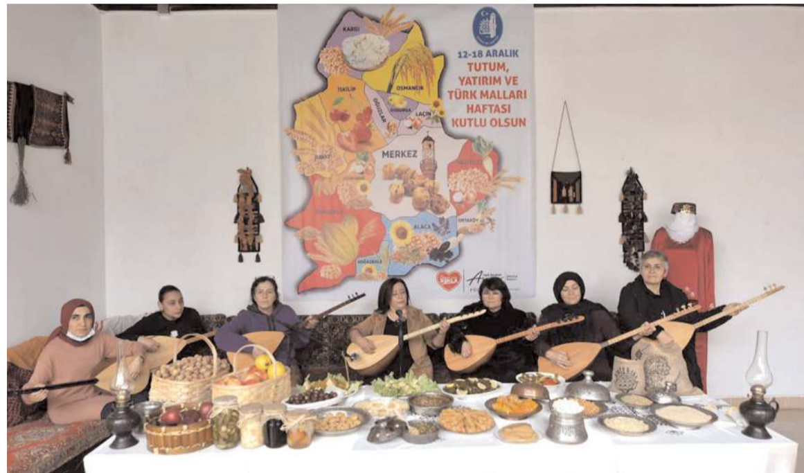
Kadın Kültür Merkezi kursiyerleri tarafından bir kutlama programı düzenlendi.

Özten, "100 bin usta öğretici kadrolu öğretmenlerle kamuda aynı işi yapan, ek ders ücreti ile çalışanlardır. 100 bin usta öğretici Milli Eğitim Bakanlığı'nın eğitimci personeldir. 100 bin usta öğretici emekçidir. 100 bin usta öğretici geleceğe umutla bakmak istiyor. 100 bin usta öğretici kadro ile tahsis edilmek istiyor. Sizleri de haklı mücadelemize destek olmaya davet ediyoruz" ifadelerini kullandı.