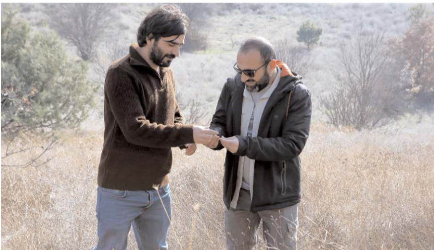
Ekipler yüzeysel araştırmayı yaptı.