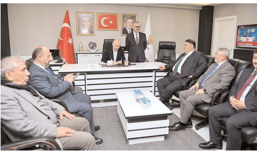
Ulaştırma ve Altyapı Bakanı Adil Karaismailoğlu, AK Parti İl Başkanlığını ziyaret etti.