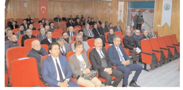
Projenin açılış toplantısı RAM konferans salonunda yapıldı.