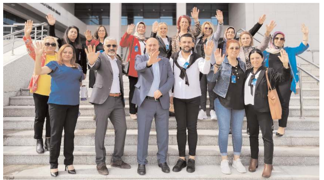
Meslek Eğitimcileri Usta Öğreticiler Federasyonu, kadro taleplerini Ankara'da bir kez daha dile getirecekler.

Usta Öğreticiler 27-28 Aralık'ta Ankara'da toplanarak kadro talebini 3. kez dile getirecek