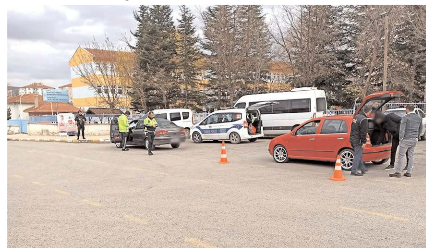
Denetimlerde 9 araca toplam 8 bin 196 TL idari para cezası uygulandı.