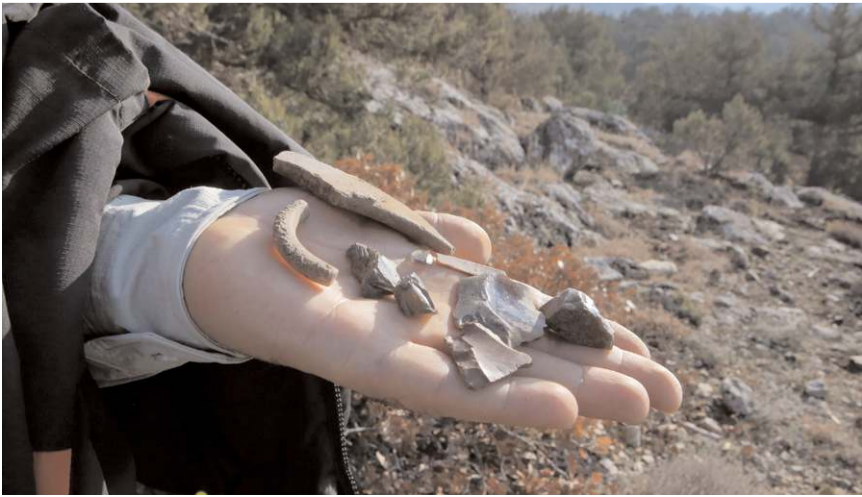
Elde edilen bulgular bilim dünyasına kazandırılacak.