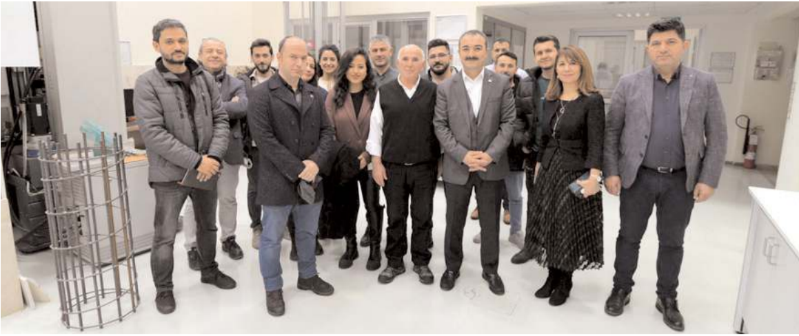
35 kişilik Silverline heyeti Hitit Üniversitesi'ni ziyaret etti.