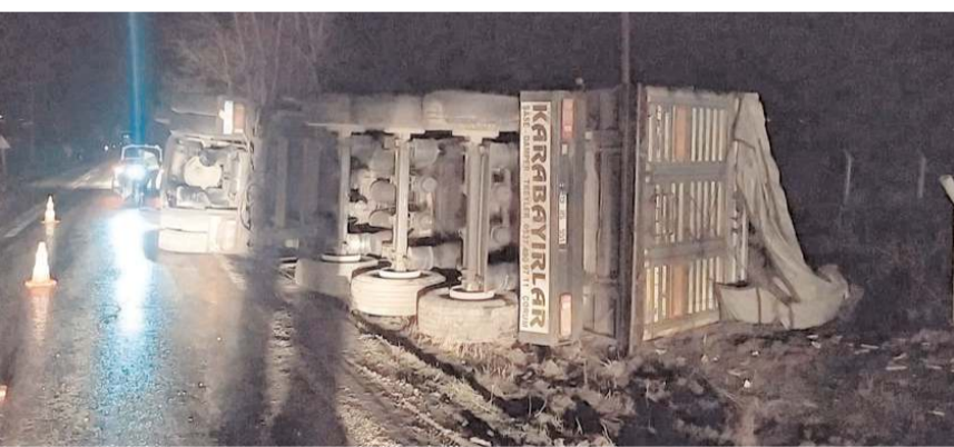
Kaza, Çorum-İskilip yolunda meydana geldi.

betmesi sonucu kontrolden çıkarak devrildi. Yoldan geçen sürücülerin ihbarı üzerine kaza yerinde sağlık ekipleri sevk edildi. Olay yerinde yapılan ilk müdahalenin ardından yaralı sürücü Hitit Üniversitesi Erol Olçok Eğitim ve Araştırma Hastanesi'ne kaldırılarak tedavi altına alınırken tırda yüklü yem yola dö-