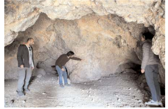
Yaklaşık 40'ı daha önceden bilinen 237 noktada genellikle çakmak taşından yapılmış "kesici ve delici aletler"e ait parçalar bulundu.

ICF'i kullanan MEB'e bağlı ilk eğitim kurumu Çorum RAM oldu. * HABERİ 2'DE