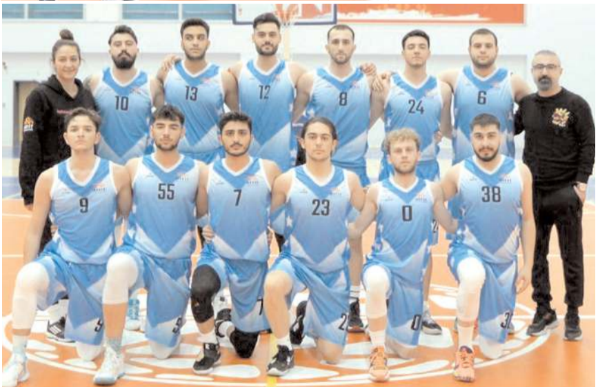
Hitit Üniversitesi erkek basketbol grupta bir galibiyet ve bir mağlubiyet aldı

Çorum temsilcisi Hitit Üniversitesi ilk maçını önceki gün Konya Karatay Üniversitesi ile oynadı. Hitit Üniversitesi erkek takımı bu maçı 82-71 kaybetti. İkinci maçında dün saat 11.00'de Sinop Üniversitesi ile karşılaşan Hitit Üniversitesi Spor Bilimler Fakültesi 15 Temmuz Spor Kompleksi'nde oynanacak olan bu karşılaşma saat 14.00'de başlayacak.