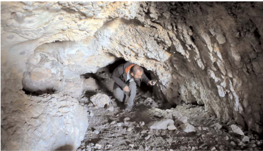
Araştırma ekibi şimdilik 200 bin yıla kadar ulaşan veriler buldu.