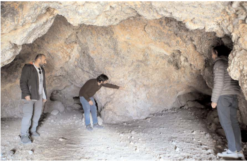
Yaklaşık 40'ı daha önceden bilinen 237 noktada genellikle çakmak taşından yapılmış "kesici ve delici aletler"e ait parçalar bulundu.

Resmi İlanlar: www.ilan.gov.tr 'de (Basın: 1753169)