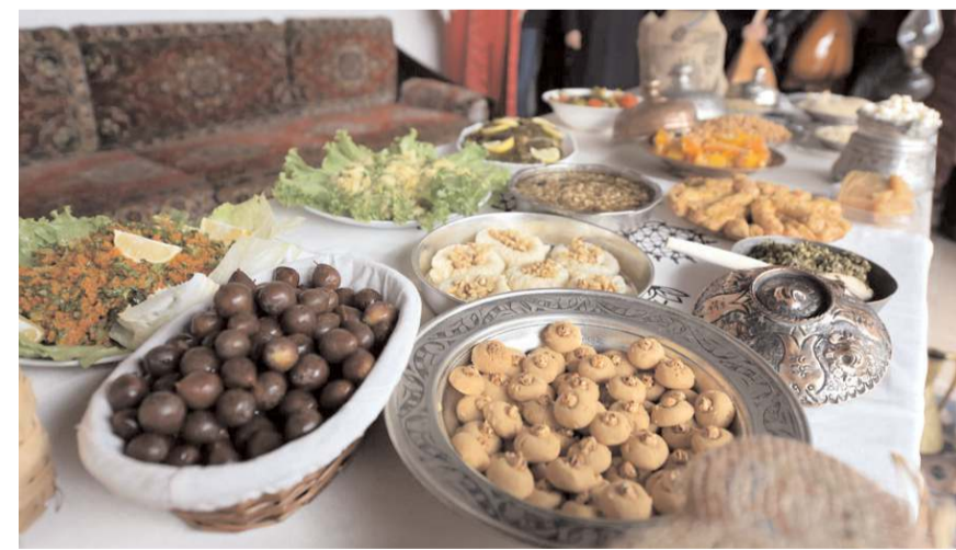
Kutlama programında geleneksel lezzetlere de yer verildi.

Veli Paşa Konağı'nda gerçekleştirilen yerli malı haftası kutlamasında kursiyerler yaptıkları lezzetli geleneksel yemeklerden tattıktan sonra çaldıkları saz eşliğinde türkü söyleyerek hoşça vakit geçirdiler.