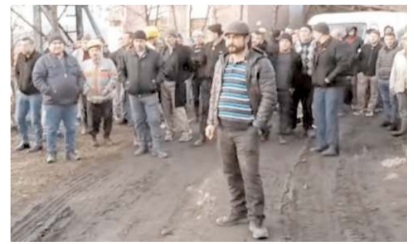
125 işçiye hiç bir bildirimden bulunulmadan işlerini son verildiği öğrenildi.