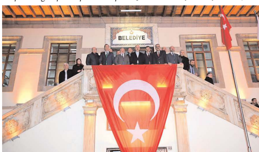
Ziyaretin sonunda toplu hatıra fotoğrafı çekildi.