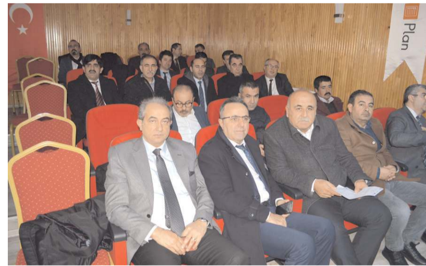
Toplantıya okul müdürleri katıldı.