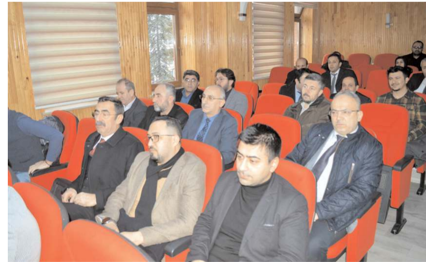
Okul müdürlerine proje hakkında bilgiler verildi.

ICF ile özel gereksinimli öğrencilerin bireysel eğitimlerinde ortak bir dil kullanılacağını ifade ederek, "Ancak bu ortak dilin oluşturulmasında okul müdürlerinin önemi büyük ve onlara da önemli görevler düşüyor" diye belirtti.