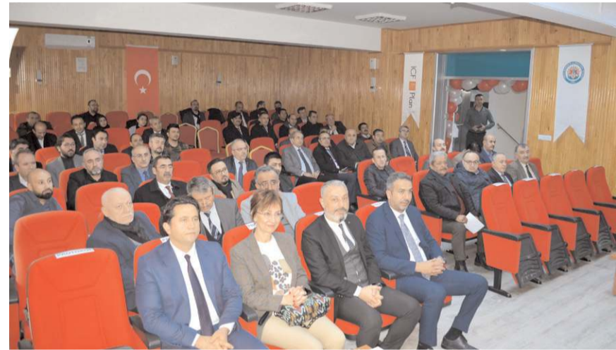
Projenin açılış toplantısı RAM konferans salonunda yapıldı.