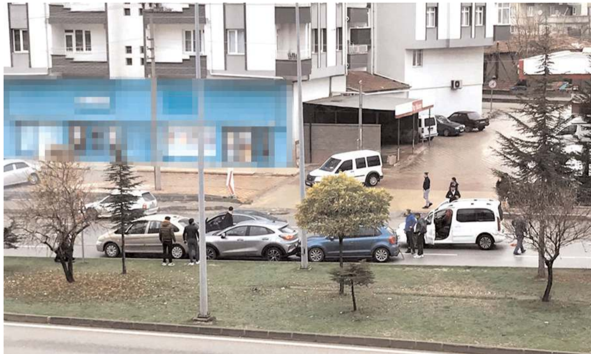
Kaza, Sungurlu-Çorum Karayolu Hitit Kavşağı yakınlarında meydana geldi.

Tedavileri tamamlanan 3 şüpheli gözaltına alındı.(AA)