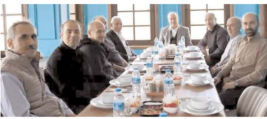
Toplantı Osmancık Gazeteciler Cemiyeti'nin ev sahipliğinde yapıldı.

■ Çorum Gazeteciler Cemiyeti Yönetim Kurulu Toplantısı hafta sonu Osmancık'ta gerçekleştirildi. * HABERİ 5'DE