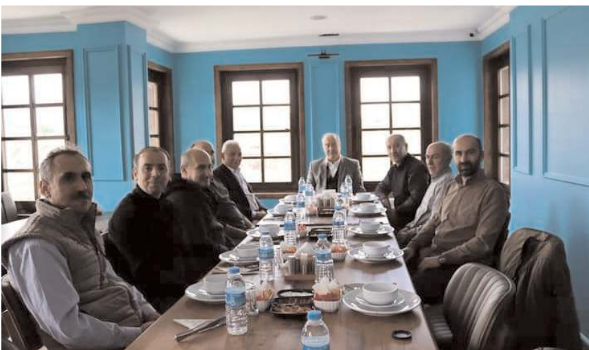
Toplantı Osmancık Gazeteciler Cemiyeti'nin ev sahipliğinde yapıldı.