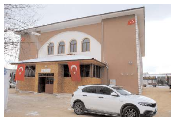
Caminin borçları ve minaresi için hayırseverlerden destek bekleniyor.