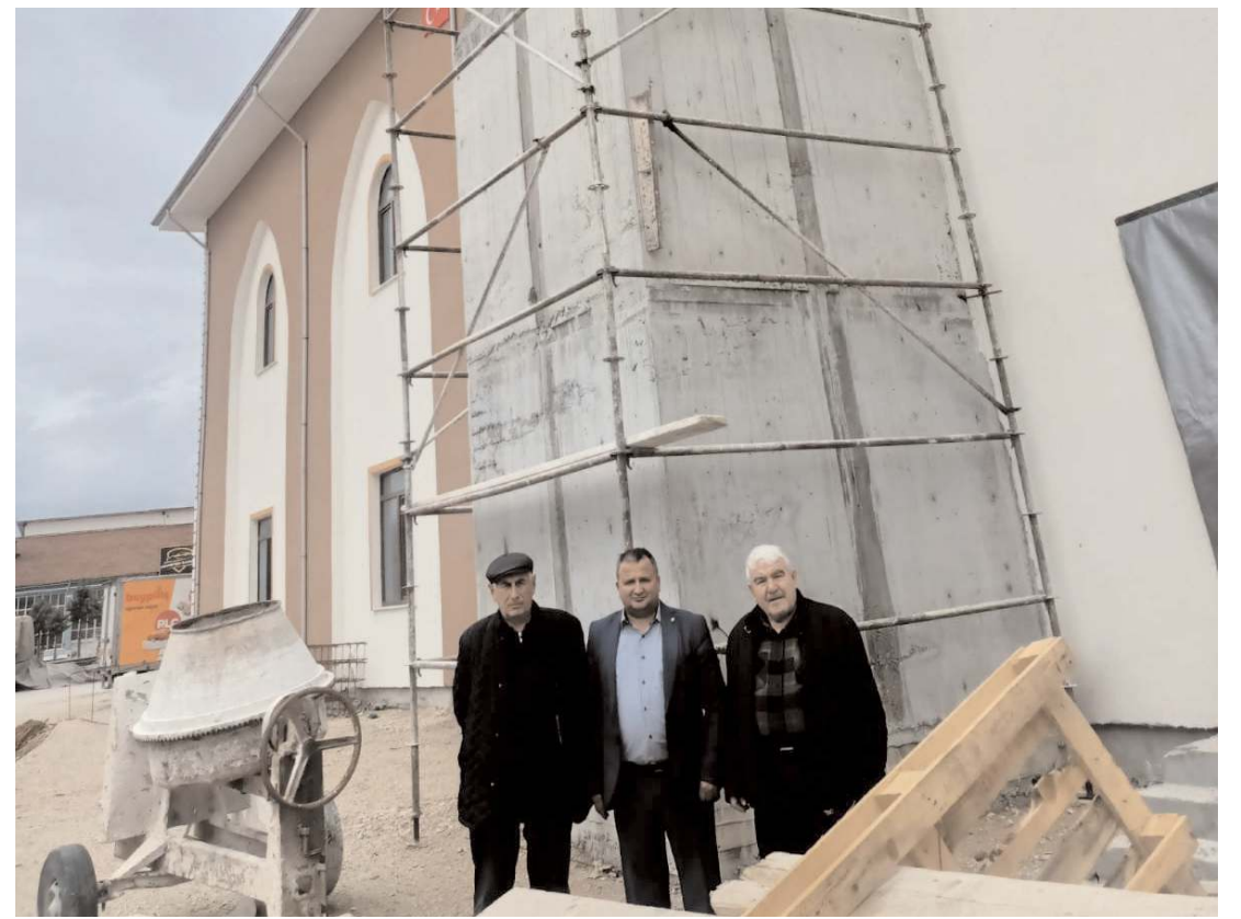
Caminin borçları ve minaresi için hayırseverlerden destek bekleniyor.