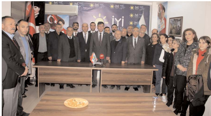
Basın açıklamasına katılım yüksek oldu.