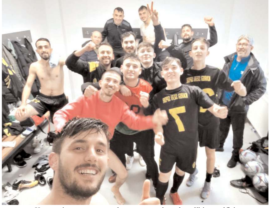
Kargıserispor maçı sonunda soyunma odasında galibiyet selfisi