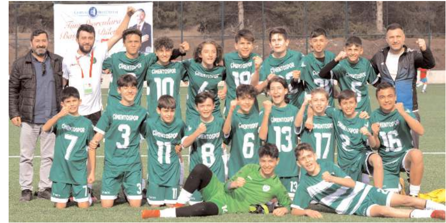
Çimentospor U14 takımı Kastamonu grubunda mücadele edecek

de karşılaşacak. Kazanan takım yarı final grubunda mücadele edecek.