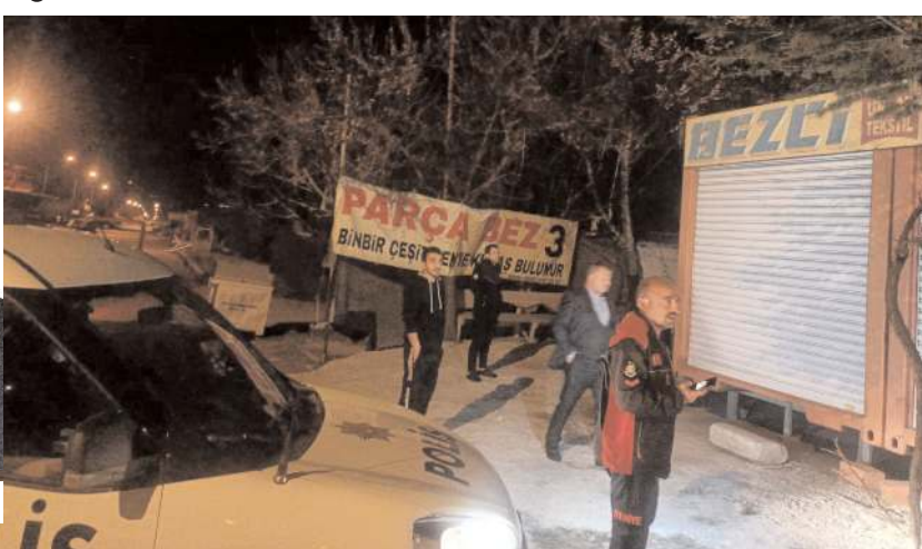
İtfaiye ekipleri yangını büyümeden söndürdü.