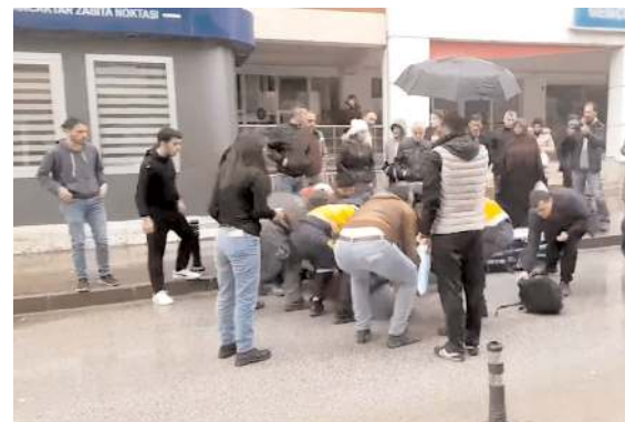
Ağır yaralanan genç olay yerinde yapılan ilk müdahalenin ardından hastaneye kaldırıldı.