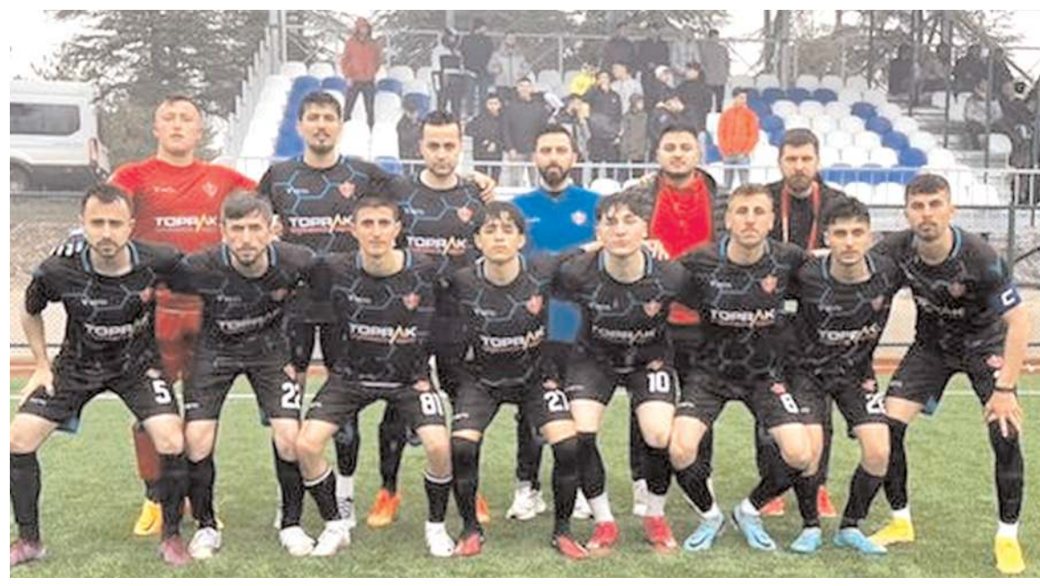
Osmancıkücü, Dodurga deplasmanından üç puanla dönerek iddiasını ortaya koydu