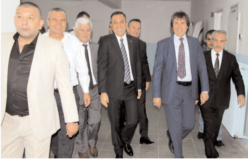
TSO Başkanı Behiç Akkaş, Muhsin Dere ile ilgili yapılan eleştirilere tepki gösterdi.

düşen, ilk defa samimi, ilk defa kalbi vatan aşkı ile yanan, ilk defa entrika bilmeyen, ilk defa şov yapmayan, ilk defa içimizden biri çıktığı için bu birilerini rahatsız etti. Anlaşıyor ki; bazı çevrelerce Bakan Yardımcısı Muhsin Dere'nin çalışmalarından rahatsız. Sadece çalışmalarından değil, kişiliğinden, efendiliğinden, çalışkanlığından, samimiyetinde... Bu böyle uzayıp gider. Herkese yutturulan siyasetçi-bürokrat kalıbının dışında, gerçekten samimi çalışıyor. Haliyle bu durumdan bazıları rahatsız olmaya başladı. Akla hayale gelmeyen yorumlar, karalamalar, niyet okumalar ve itibarsızlaştırma çabaları çoğalmaya başladı. Bazıların önüne atılan kemiklerle daha çok havlamaya başladılar. Küçük beyinleriyle bir şeyler yapmaya çalıştıklarını zannediyorlar. Herkes kimin ne olduğunu, kalibresini gayet iyi biliyor. Biz Bakan Yardımcımız Muhsin Dere'nin çalışmalarından ve davranışlarından samimi olduğuna inanıyoruz. Biz, Muhsin Dere'nin sonuna kadar yanındayız ve destekçisiyiz. Muhsin Dere'yi sizler gibi çapulculara yedirmeyiz." (Haber Merkezi)