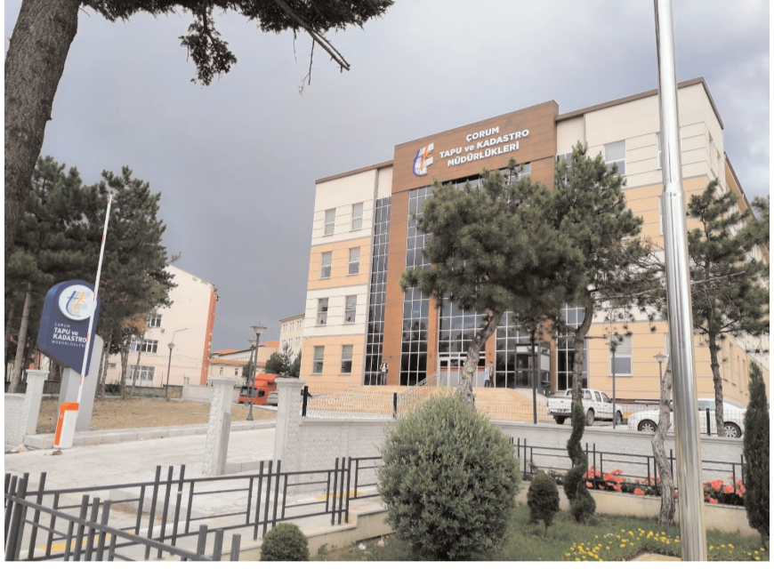
Tapu ve Kadastro İl Müdürlüğü bir süre önce yeni binasına taşınmıştı.