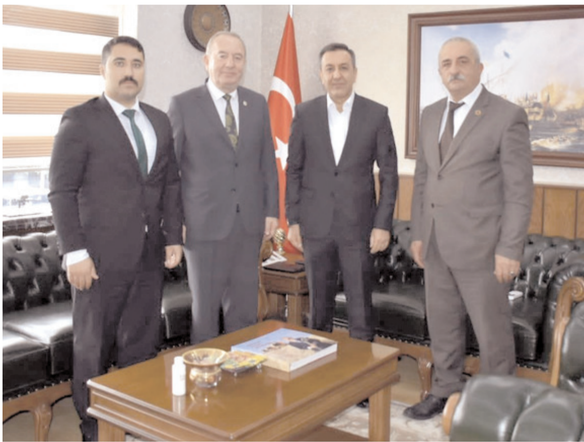
Sungurlu Belediye Başkanı Abdulkadir Şahiner, Milli Savunma Bakan Yardımcısı hemşehrimiz Muhsin Dere'ye destek verdi.

yorumu yaptı: "Terbiyesizliği, utanmazlığı, iftirayı meslek edinmeyin, beni anladığınız dilden konuşturmayın. Bakanlığımızın iki şirketin de görevim var, mevzuata uygun olarak sadece birinden ek ücret alıyorum. Bakan yardımcısı maaşım ve ek görev ücretim dahil aldığım toplam maaş ve ücret 50.000 (elli bin) TL civarında. Başka hiçbir yerden beş kuruş gelirim de yok. Allah'a şükür ülkemiz şartlarına göre gayet iyi olan bu maaş da fazlasıyla yetiyor. Yalanlarınızı sürdürürseniz hakkınızda yasal yollara başvuracağım."