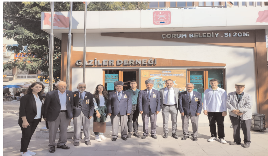
Ziyaretin anısına toplu fotoğraf çekildi.