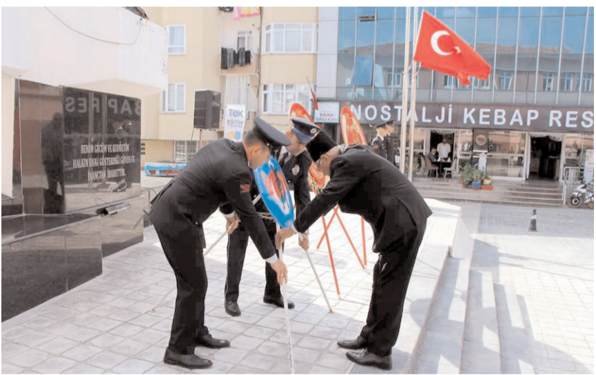
Törende ilk olarak Atatürk Anıtı'na çelenk bırakıldı.