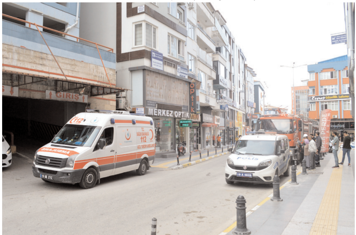
Olay Sel Sokak'ta bulunan bir iş merkezinde meydana geldi.

ekipleri yangını kısa yerinde maddi hasar ilgili inceleme başlatıldı. sürede söndürürken iş meydana geldi. Olayla di.