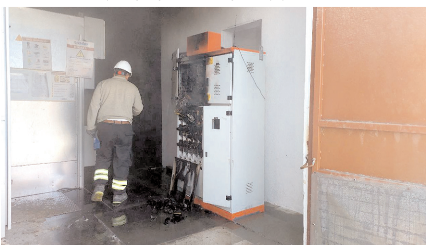
Arıza ekipleri trafoda inceleme yaptı.

Alaca'da bir elektrik trafosunda çıkan yangın itfaiye ekiplerince söndürüldü.