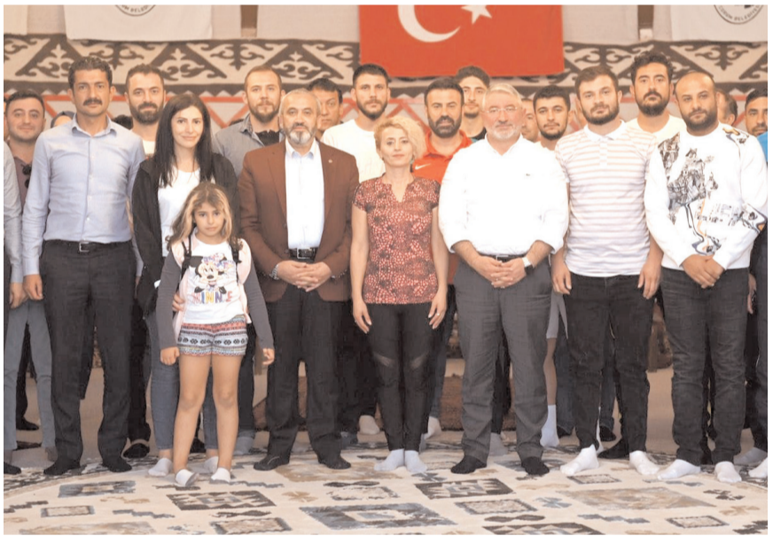
Gençlik Spor Antrenörleri toplantısına katılanlardan bir grup toplu halde

Çorum Belediyesi toplantı sonunda antrenörlere yemek ve çay ikramında bulundu. Bu toplantının önümüzdeki yıllardan itibaren her yıl geleneksel olarak her sezon başı yapılacağı açıklandı.