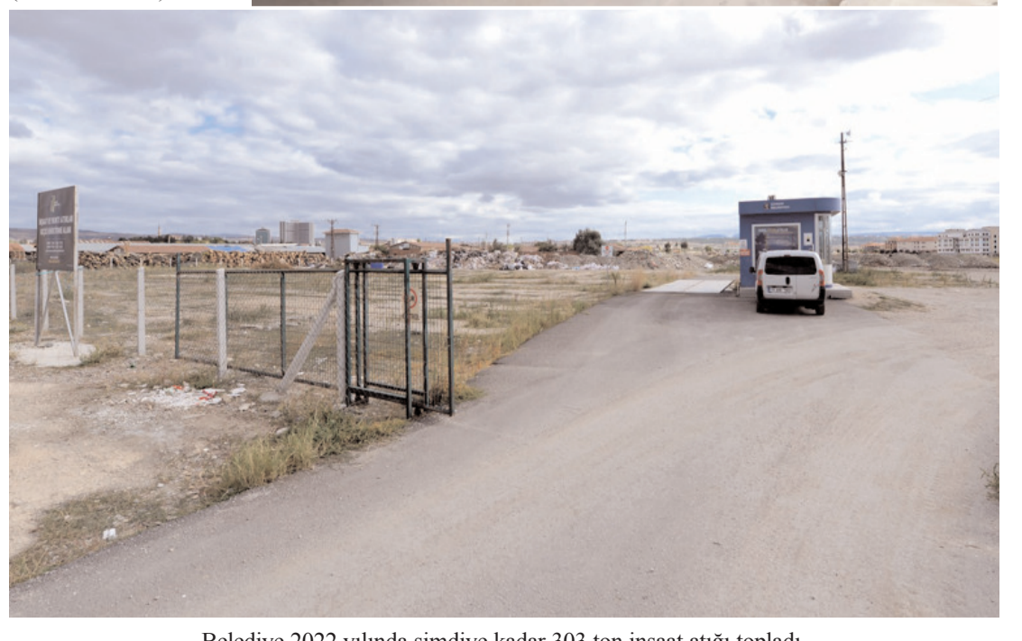
Belediye 2022 yılında şimdiki kadar 303 ton inşaat atığı topladı.