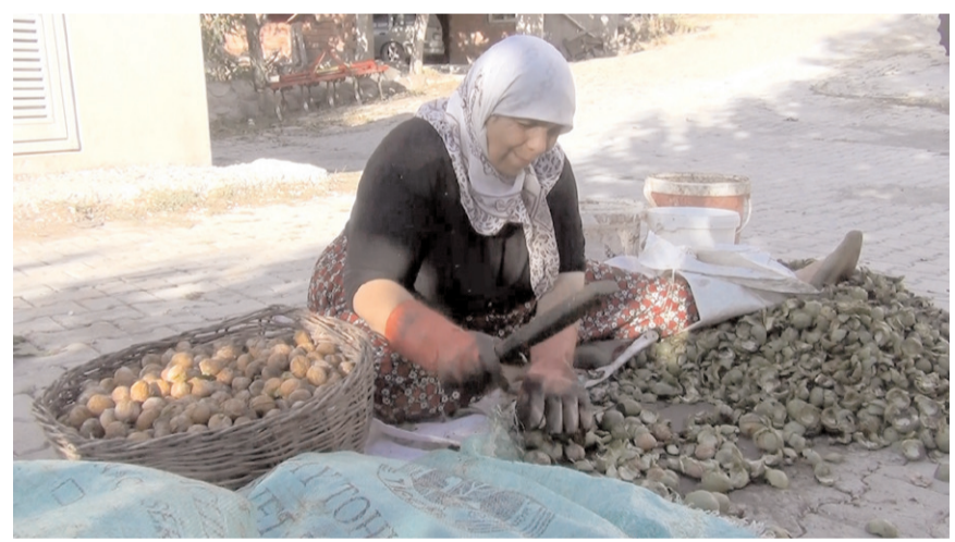
Ceviz zorlu bir sürecin ardından sofralara geliyor.