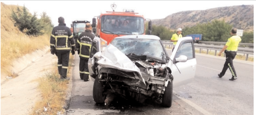
Kaza Merzifon-Çorum kara yolu 28. kilometrede meydana geldi.