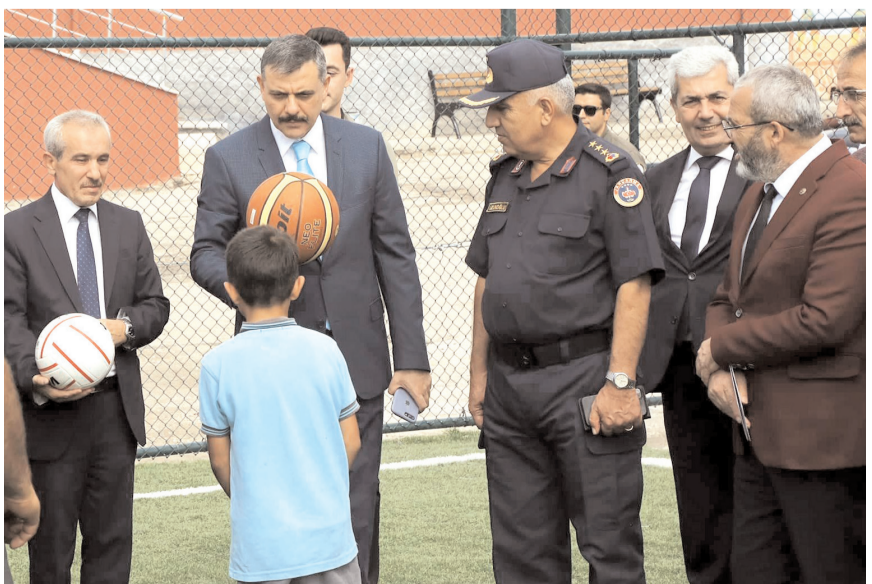
Vali Mustafa Çiftçi çocuklara değişik branşların toplarını hediye etti

Okul Müdürü ve idarecilerinden yeni eğitim öğretim yılı ile ilgili bilgiler alan Vali Çiftçi ve beraberindekiler daha sonra okul bahçesinde yaptırılan futbol sahasını inceledi ve burda çalışma yapan öğrencileri değişik branşların toplarından hediye etti.