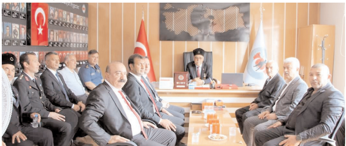
Protokol üyeleri Sungurlu Şehit ve Gaziler Derneği'ni ziyaret etti.