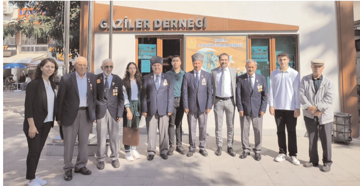
Ziyaretin anısına toplu fotoğraf çekinildi.