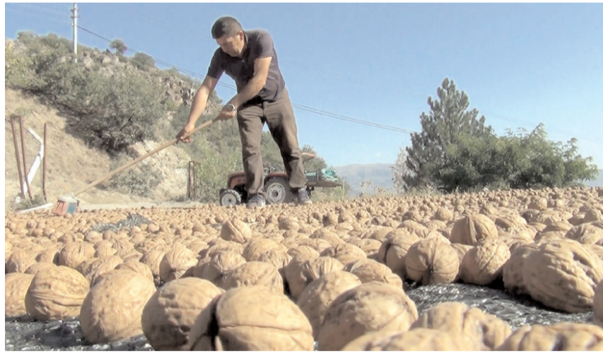
Toplanan cevizler kurutuluyor.

Türkiye'deki ceviz üretiminin yüzde 8'inin gerçekleştirildiği Oğuzlar'da, hasat dönemi başladı.