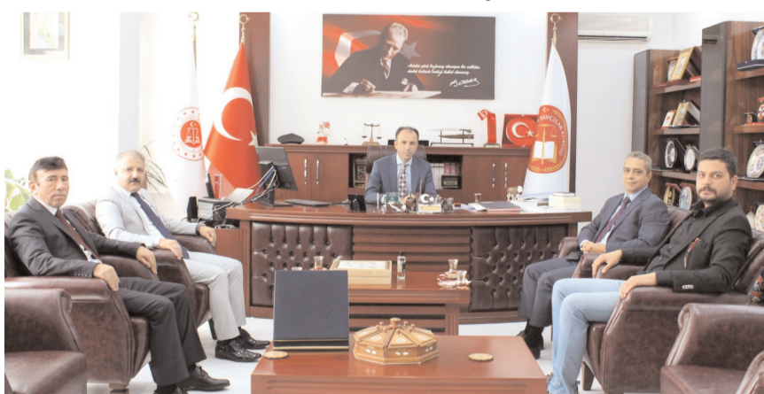
Çorum Kamu Sen heyeti Cumhuriyet Başsavcısı Ahmet Bektaş'a hayırlı olsun ziyaretinde bulundu.