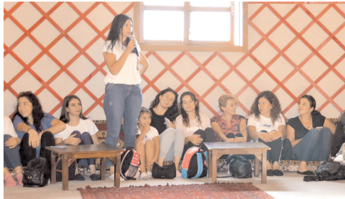
Antrenörler toplantı sırasında görüş ve isteklerini tek tek söz alarak dile getirdiler