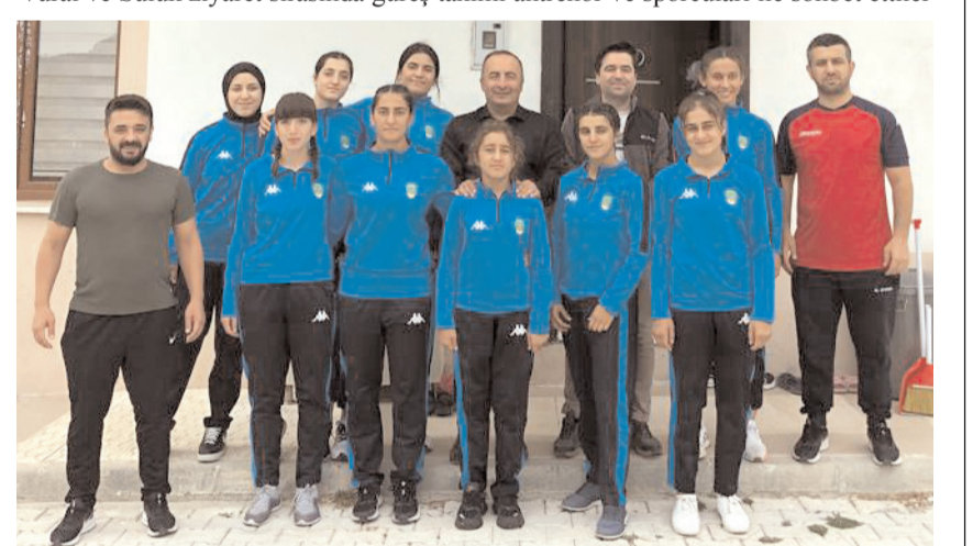
Kaymakam ve Belediye Başkanı'nın kadın güreş takımını ziyaretlerinde toplu halde