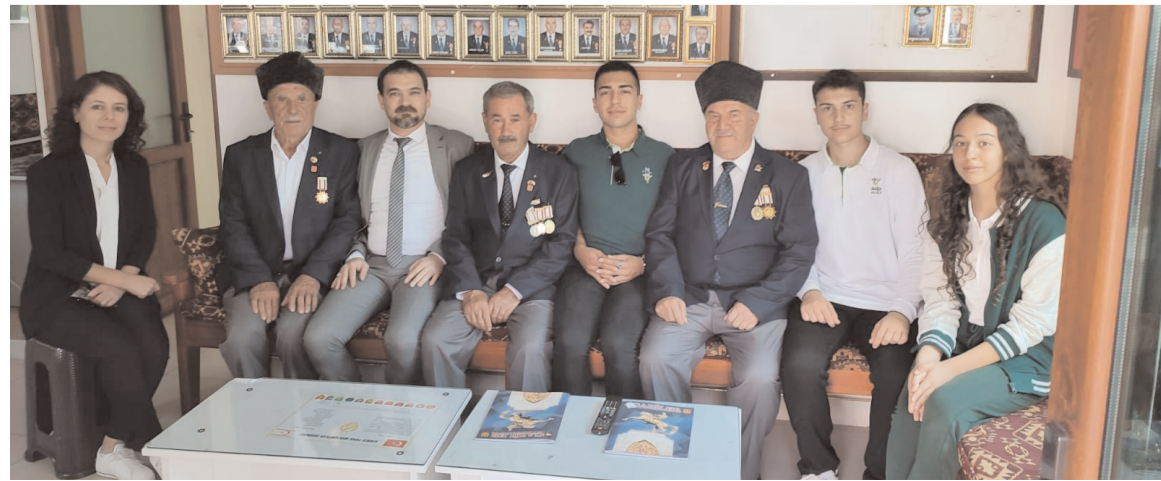
Doğa Koleji T-MBA Liderlik Akademisi öğrencileri, Gaziler Günü nedeniyle Muharip Gaziler Derneği'ni ziyaret etti.

Başta Gazi Mustafa Kemal Atatürk olmak üzere 5 bin yılı aşkın Türk tarihinde bu toprakları milletimize vatan kılan tüm şehit ve gazileri hayır ve minnetle yâd ettiklerini ifade eden Çorum Doğa Koleji Müdürü Fatih Yanılma, ziyaret ilişkin notlarında şunları söyledi, "Gazilerimizi ziyaret ederek Gaziler Günü'nü kutladık. Vatan sevgisinin ve cesaretin sembolü Türk Milletinin bağımsızlık meşalesi Gazilerimizi yeni nesillere tanıtmak tanıştırmak vatan topraklarının ne zahmetle müdafaa edildiğini ilk ağızdan dinleyip öğrenmeleri ve Gazilerimize teşekkür etmek amacıyla ziyaretimizi gerçekleştirdik. Gazilerimizden acı tatlı birçok anı diledik. Yaşanan savaşların acı hatıralarını gazilerimizden sessizce dinlerken boğazımızın düğümlendiğini hissettik. Hüzünlü anlar yaşadığımız anlarda Gazilerimiz kahramanlık destanlarını anlatarak bizleri hem gururlandırdı hem de nasihatleri ile öğrencilerimizdeki Milli Şuur ve Milli bilinç duygularını pekiştirdiler. Onlara ne kadar teşekkür etssek az kalır, bugün vesilesi ile Kahraman Gazilerimizin Gaziler Günü'nü tekrar tekrar kutlarız. Başta Gazi Mustafa Kemal Atatürk olmak üzere 5 bin yılı aşkın Türk Tarihinde topraklarımızı bize vatan kılan arzusunda olan tüm Şehit ve Gazilerimizi hayır ve minnetle yad ediyoruz. Son olarak yetiştirdiğimiz donanımlı nesiller ile Türkiye Cumhuriyetini ilelebet muhafaza müdafaa ve muasır medeniyet yapma sözünü Gazilerimize vererek, bu kutlu günlerini tekrar kutluyoruz."