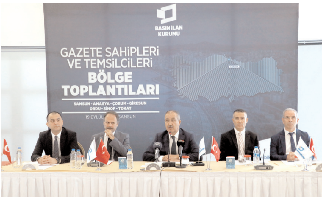
BİK Gazete Sahipleri ve Temsilcileri Bölge Toplantısı Samsun'da yapıldı.