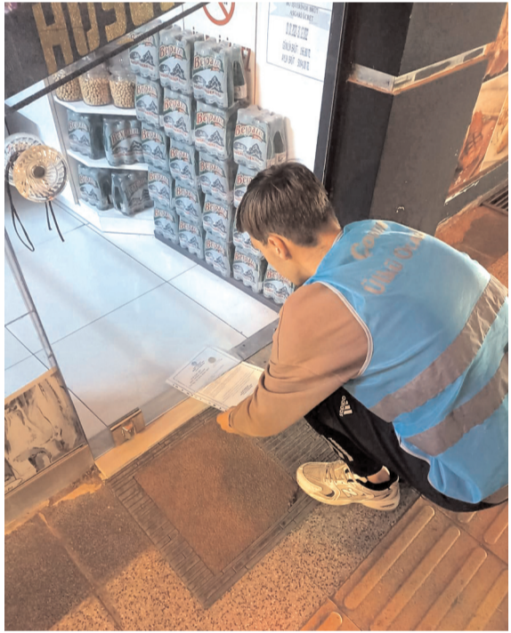
Ülkücü gençler sabah erken saatlerde esnafa siftah parası bıraktılar.