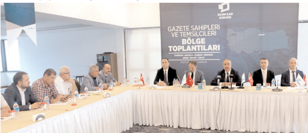
Toplantıda, basının gelişimi, mevzuat düzenlemeleri, dijital dönüşüm süreçleri ve kurumsal işbirliklerinin güçlendirilmesi gibi konular ele alındı.

Bölge toplantısı soru, cevap ve öneri bölümüyle devam etti.(AA)