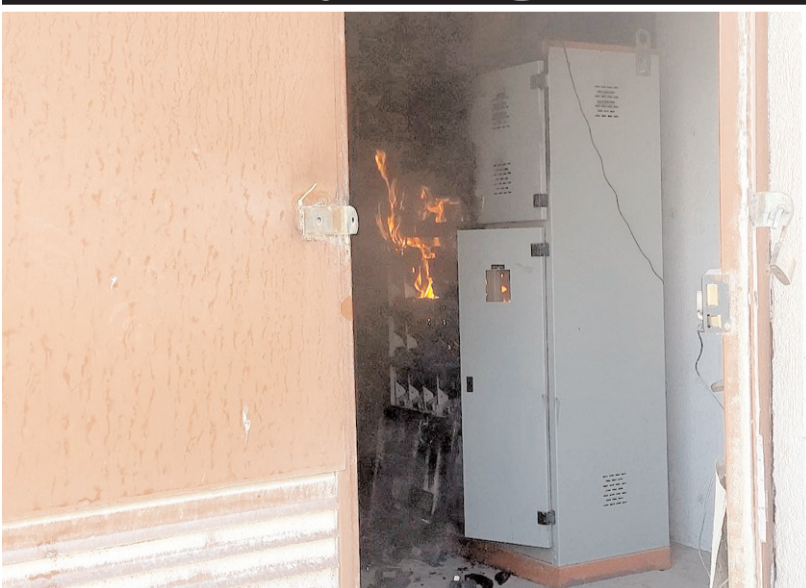
Trafonun yandığını gören vatandaşlar itfaiyeye haber verdiler.