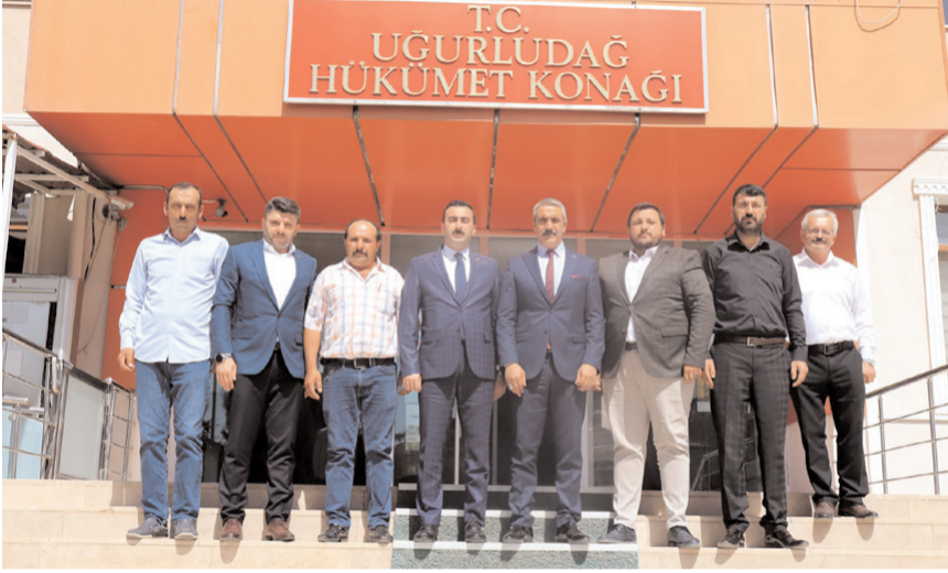
Karapıçak, Uğurludağ Kaymakamı Erkan Şahin'i ziyaret etti.