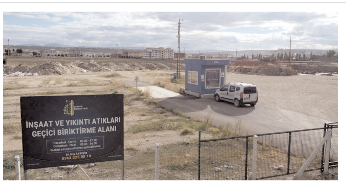
Belediye'nin inşaat ve yıkıntı atıkları geçici biriktirme alanı yeni spor salonu yanında bulunuyor.