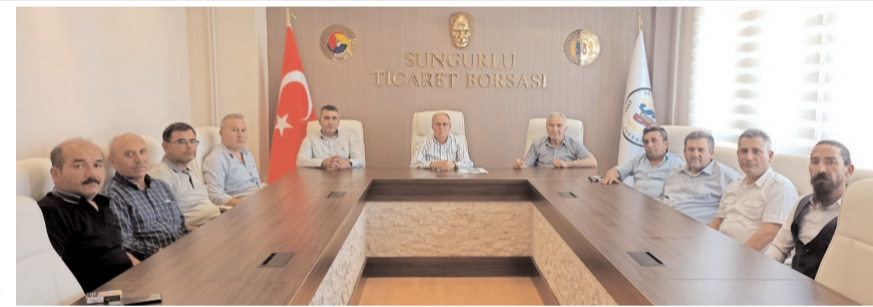
Sungurlu Ticaret Borsası yönetimi seçim tarihini açıkladı.