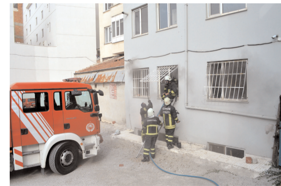
İtfaiye ekipleri demir parmaklıkları keserek yangına müdahale ettiler.

Alaca'da bir elektrik trafosunda çıkan yangın itfaiye ekiplerince söndürüldü. * HABERİ 5'DE