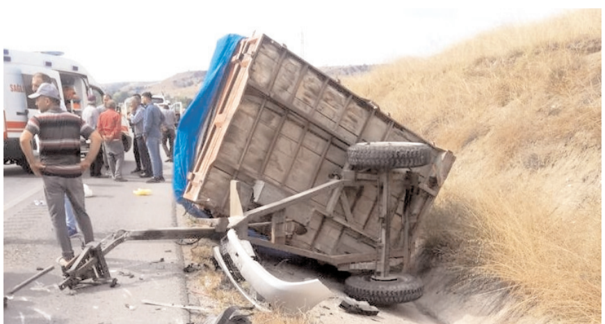
Kazada her iki araçta da maddi hasar meydana geldi.

A m a s y a ' n ı n Merzifon ilçesinde otomobil ile traktörün çarpışması sonucu 3 kişi yaralandı.