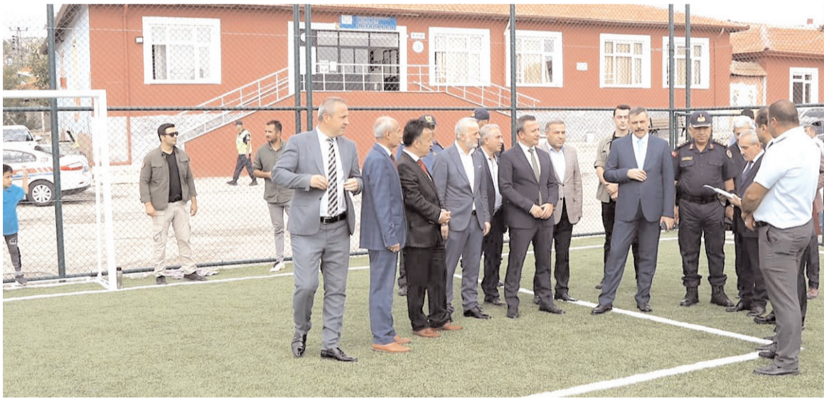
Vali Mustafa Çiftçi Arifegazili Okulu bahçesindeki halı saha hakkında yetkililerden bilgi aldı