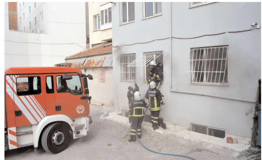
İtfaiye ekipleri demir parmaklıkları keserek yangına müdahale ettiler.

Kısa sürede olay yerine gelen itfaiye ekipleri demir parmaklıkları keserek camlardan büroya girip hem yangına müdahale ettiler hem de içeride birilerinin olup olmadığını kontrol ettiler. İtfaiye