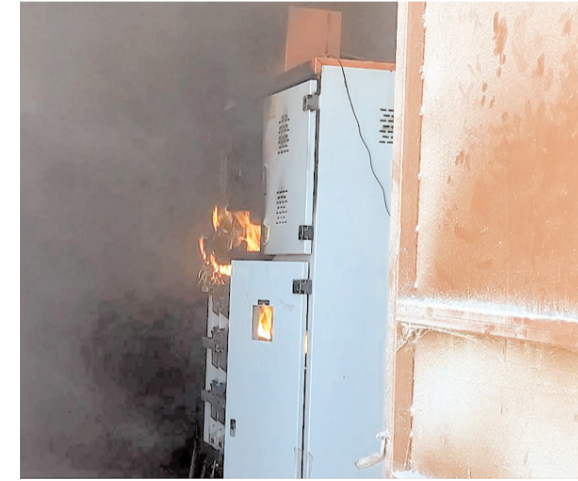
Trafonun yandığını gören vatandaşlar itfaiyeye haber verdiler.