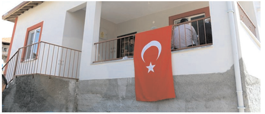
Şehit babası Hikmet Körkem'in evi baştan aşağıya yenilendi.