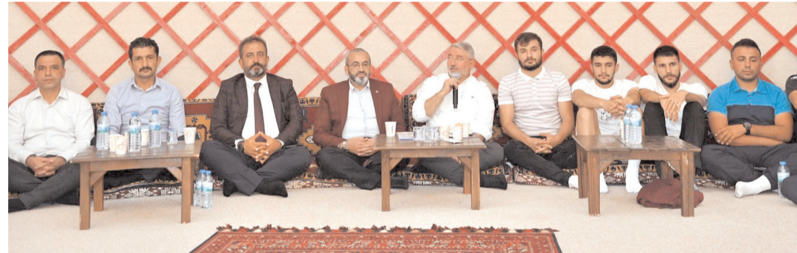
Toplantıda Belediye Başkanı Dr. Halil İbrahim Aşgın bir konuşma yaparak Çorum'u spor şehri yapmak için el birliği ile çalışmalarını gerektiğini belirterek antrenörlerden bu konuda destek istedi