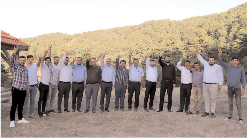
Karapıçak, Yeniyanıp ve Aşlıarmut köylerini ziyaret etti.