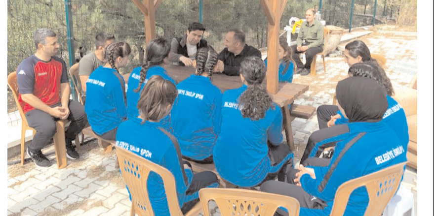
Vural ve Sülük ziyaret sırasında güreş takımı antrenör ve sporcuları ile sohbet ettiler

Belediye İskilipspor kadın güreş millî takımında 11 sporcu bulunuyor. Büyükler kategorisinde mücadele eden kadın güreşçiler zorlu şampiyonaların hazırlıklarını sürdürüyorlar.