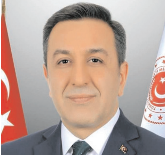
Milli Savunma Bakan Yardımcısı hemşehrimiz Muhsin Dere

Milli Savunma Bakan Yardımcısı hemşehrimiz Muhsin Dere, kendisine yönelik yapılan algı operasyonlarına sert cevap verdi. "Terbiyesizliği, utanmazlığı, iftirayı meslek edinmeyin. Beni anladığınız dilden konuşturmayın" diyen Dere, yalanların devamı durumunda yasal yollara başvuracağını söyledi. Fazla maaş aldığı yönünde bazı basın organlarında hakkında çıkan yorumlara tepki gösteren Muhsin Dere,, kendisiyle ilgili değerlendirmelerin altına şu