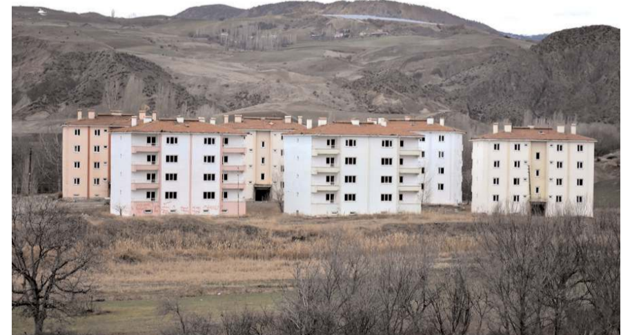
İskilip'te afet konutlarında 6 blokta 48 daire bulunuyor.

Kaymakam Yunus Emre Vural yapılan çalışmaları yerinde takip etti. (Haber Merkezi)