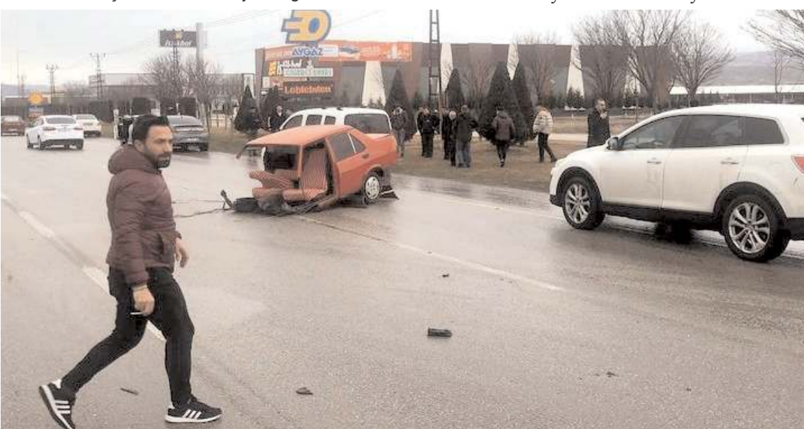
Kaza nedeniyle trafik bir süre durdu.

Yaralanan sürücü ambulansla hastaneye kaldırılırken, kaza nedeniyle Samsun istikametinde trafik yoğunluğu oluştu. Aracın çekilmesiyle bir süre duran trafik yeniden normal seyrine döndü.