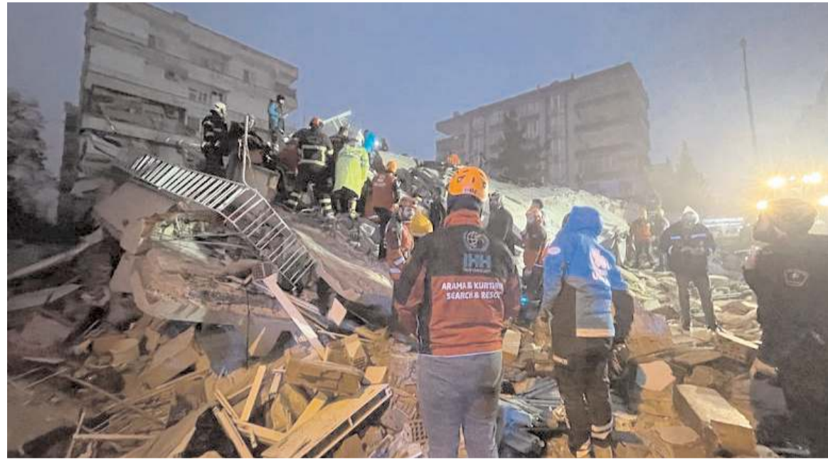
Kahramanmaraş merkezli depremlerde binlerce insan hayatını kaybetti.

1942 yılında Osmancık bölgesinde 18 gün ara ile