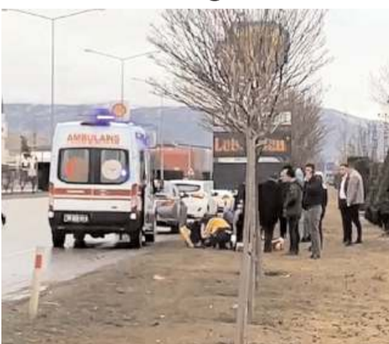
Kaza Çevre Yolunda meydana geldi.