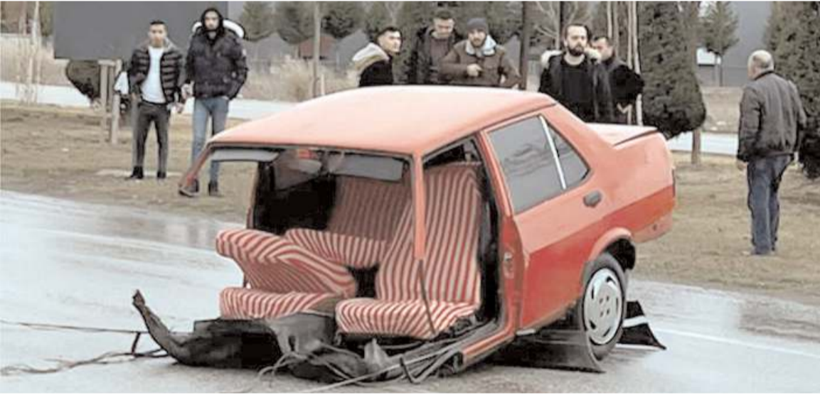
Yolun ortasında ikiye bölünmüş otomobili gören vatandaşlar şaşkınlıklarını dile getirdiler.

Gün birlik olma yaralarını sarma zamanıdır. Acılarımız üzerinden siyasi çıkar sağlamayı bırakıp kardeş olma zamanıdır. CHP'nin Çorum il örgütüne naçizane tavsiyemiz, ellerine tutuşturulan kağıtlardan basın açıklamaları yapmak yerine tüm teşkilatlarını toplayarak deprem bölgesinde yer alan insanların yanlarına koşmaları yaralarının salınmasına yardımcı olmalarıdır. "Deprem asrın felaketi değildir, asrın felaketi Erdoğan"dır iğrenç yakıştırmasını yapan CHP'ye 2023 seçimlerinde sağduyulu ve aziz milletimizle beraber gereken cevabı vereceğimize kimsenin kuşkusu olmasın."