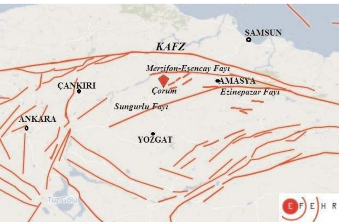
Çorum, Türkiye'de en aktif ve en uzun fay olan Kuzey Anadolu Fay Zonuna (KAFZ) kuş uçuşu 40-50 km uzaklıkta bulunuyor.

Depremin ne zaman olacağını bilmemekle birlikte, depremin nerede, ne kadar büyüklükte olacağını ve deprem bölgesindeki var olan aktif fayların durumu ve her bölgenin zemin özellikleri konusunda yerbilimciler gerekli bilgilendirmeleri yapıyorlar. İlave olarak, şehir bölge planları, mimarlar ve inşaat mühendisleri de binaları ve evlerin nereye yapılması gerektiğini ve nasıl inşa özellikleri olması gerektiğini de söylüyorlar. O zaman bizlere düşen görev bilimin işaret ettiği verilere göre hareket etmektir. Ayrıca, yöneticilerden de popülizm olmayan, ranta dayanmayan ve insan hayatına öncelik veren bir yaklaşım sunmasını talep etmekteyiz."