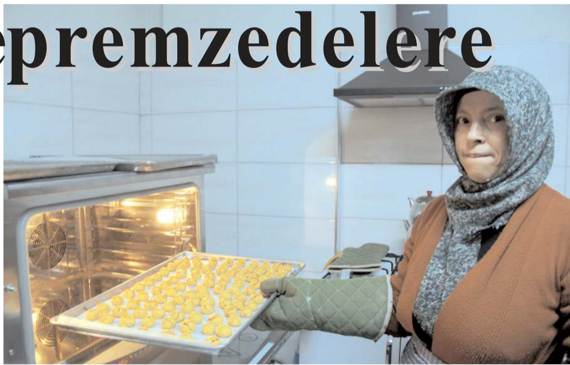
Çorum Çölyak Derneği depremlerin etkilediği illerdeki çölyak hastaları için glutensiz ürünler üretip talep edilen yerlere gönderiyor.