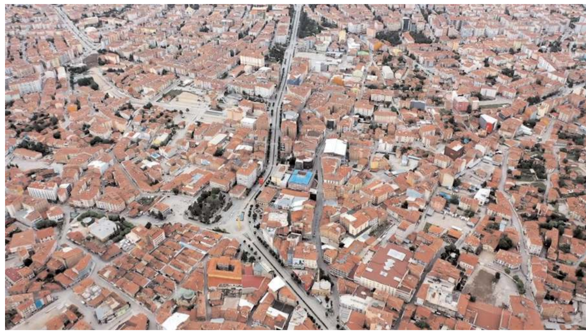
Binaların zemine uygun bir teknikle inşaa edilmesinin önemi büyük.