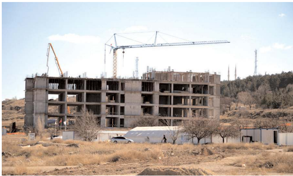
Diş Hastanesi'nde 50 ünite bulunacak.