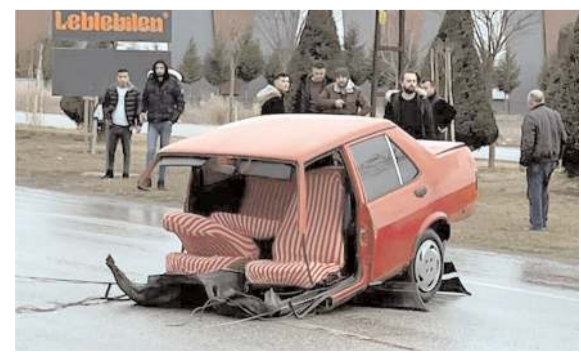
Yolun ortasında ikiye bölünmüş otomobili gören vatandaşlar şaşkınlıklarını dile getirdiler.