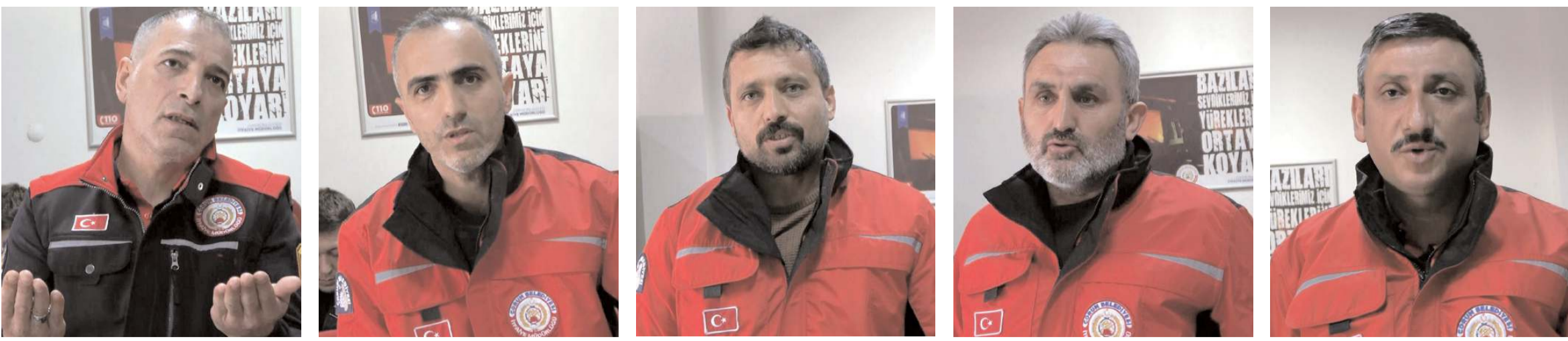
Çorum Belediyesi İtfaiye Müdürlüğü arama kurtarma ekibi deprem bölgesinde yaşadıklarını anlattı.