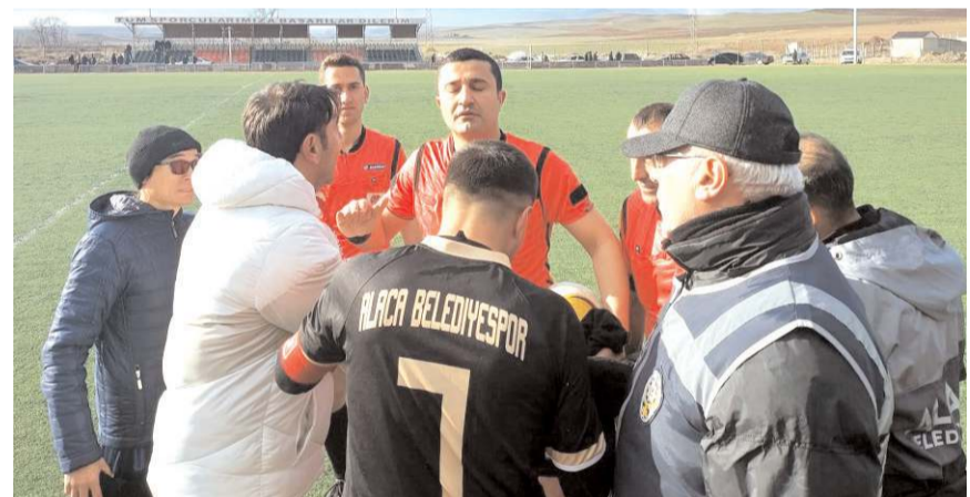
Alaca Belediyespor'lu yöneticiler maçın son dakikasında hakemlere saldırarak darp etmişti