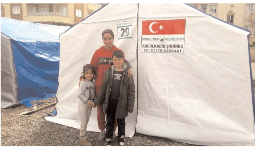
Çadır kente çok sayıda depremze kalıyor.