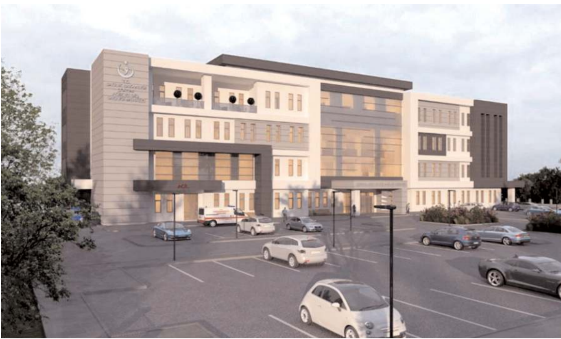
Eylül ayında temeli atılan Diş Hastanesi'nde çalışmalar hızla devam ediyor.