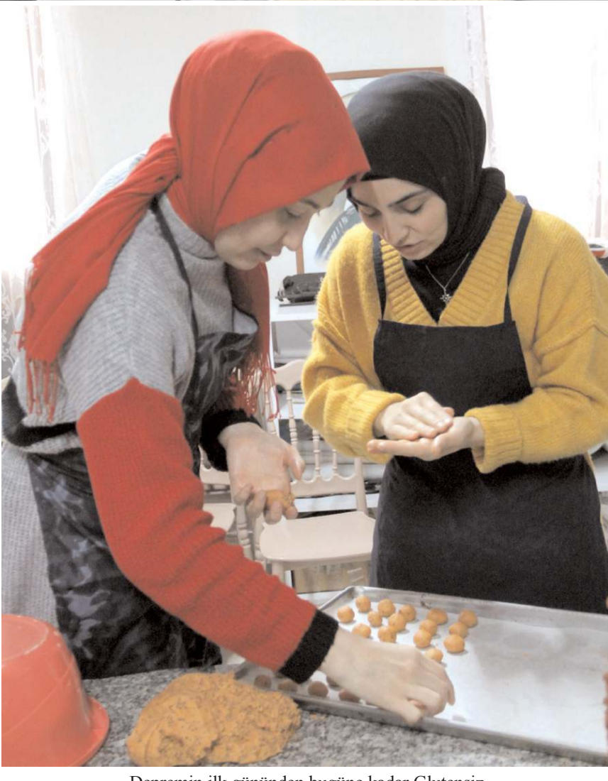
Depremi ilk gününden bugüne kadar Glütensiz Mutfak'ta üretilen 10 koli ürün afet bölgesine gönderildi.