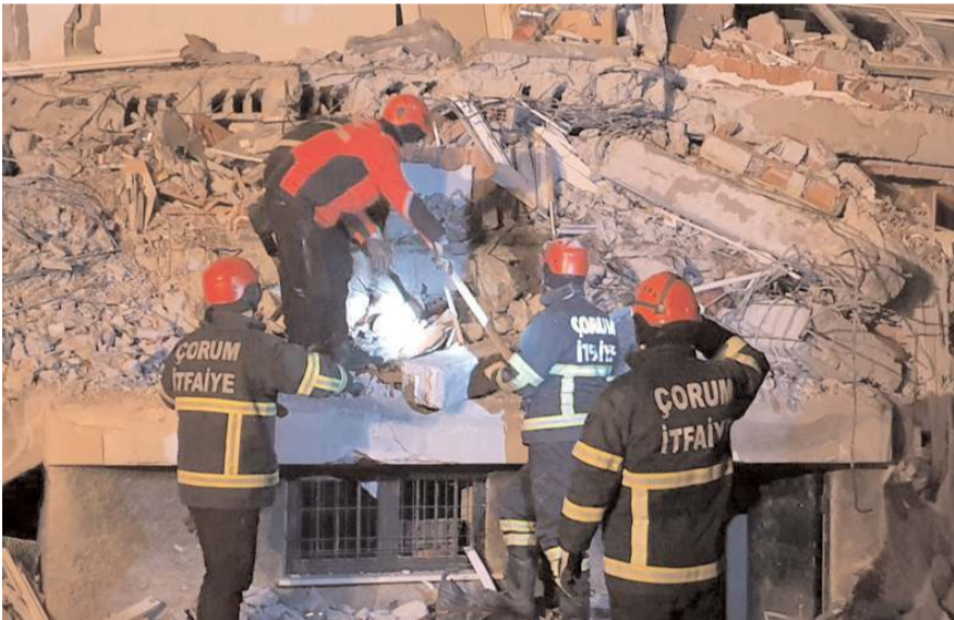
Çorum Belediyesi İtfaiye Müdürlüğü arama kurtarma ekibi Afşin ve Adıyaman'da arama kurtarma çalışmalarına katıldı.