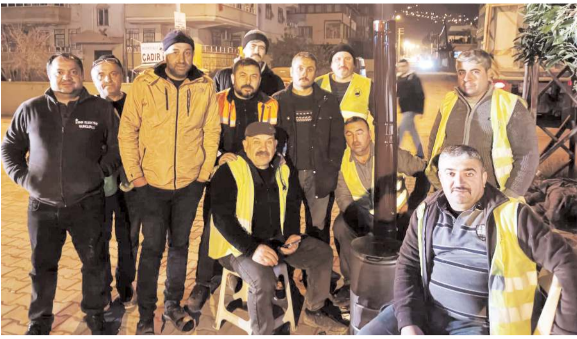
Sungurlu'da faaliyet gösteren tesisatçı ustaları Hatay'a giderek çadır kent kurulumunu tamamladı.