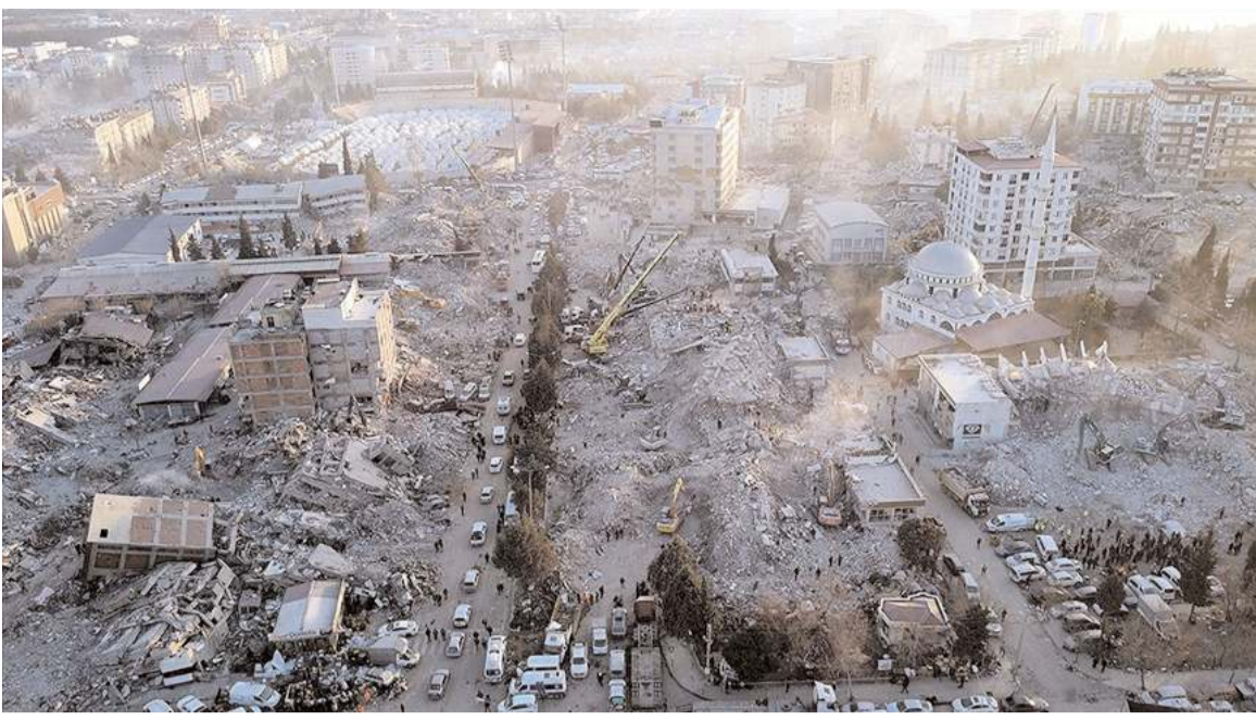
Kahramanmaraş merkezli depremler etkilediği şehirlerde büyük yıkıma neden oldu.