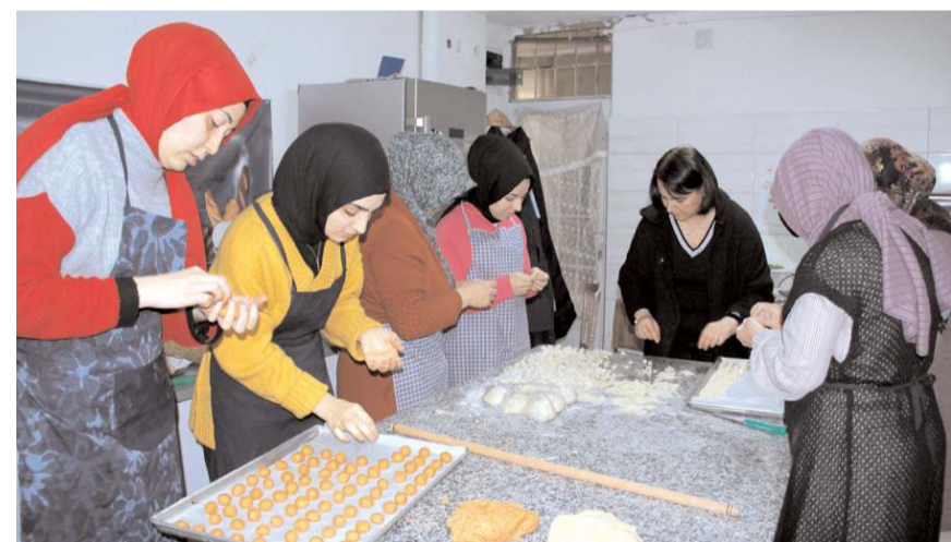
Glütensiz Mutfak'ta çölyak hastası depremzedeler için yoğun bir tempoda çalışıyor.