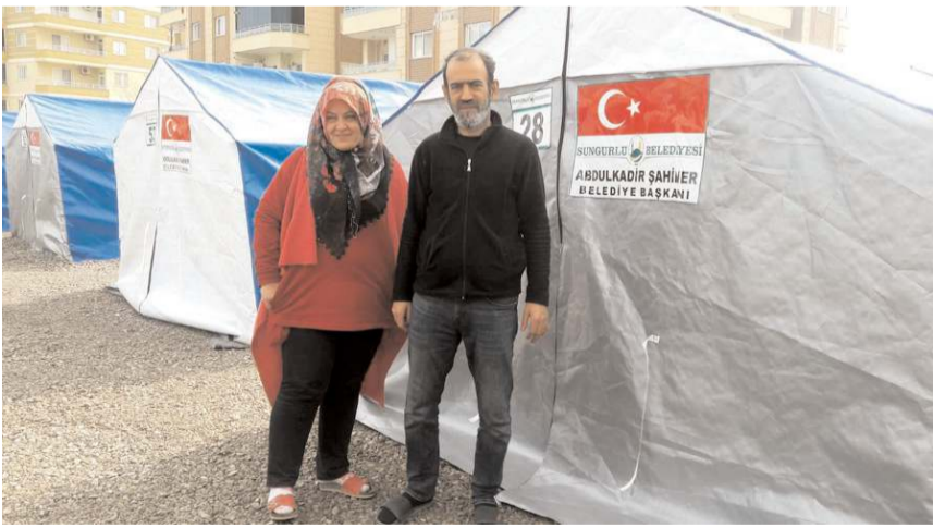
Vatandaşlar Sungurlu Belediyesi'ne teşekkür ettiler.