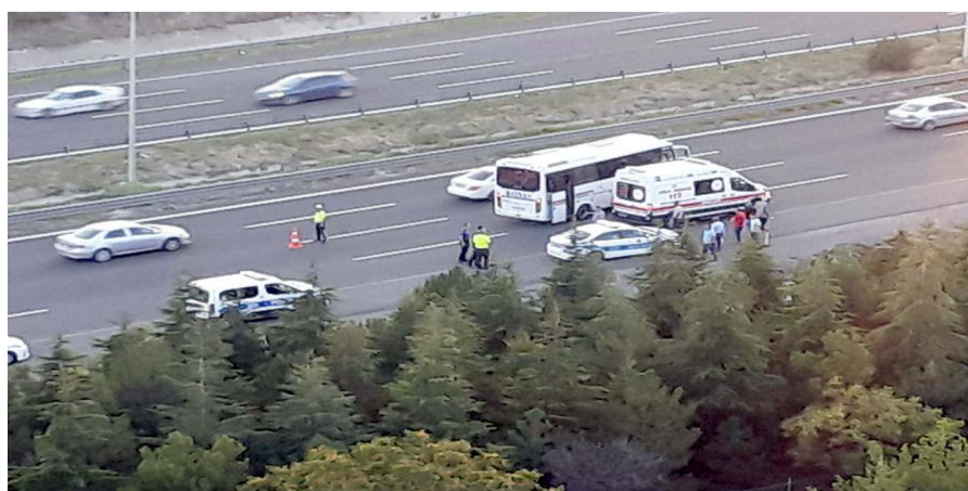
Olay Ankara'nın Pursaklar ilçesinde meydana geldi.