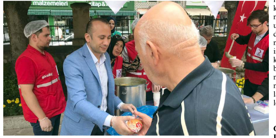
Çorum ikramı Ulu Cami bahçesinde yapıldı.