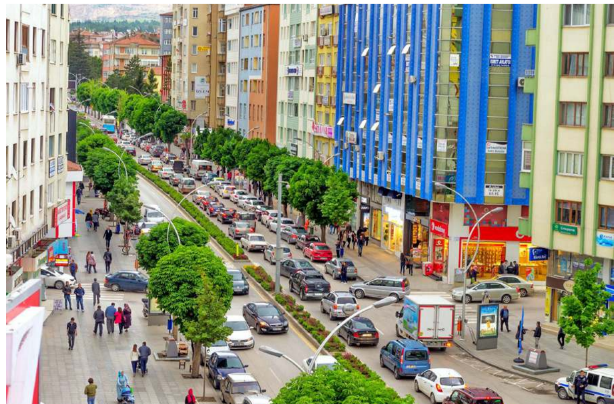
Atatürk Anıtı ile Saat Kulesi arası 23 Temmuz'a kadar 20.30-24.00 arası araç trafiğine kapalı olacak.

Gazi Caddesi (Atatürk Anıtı-Saat Kulesi arası) 21-22-23 Temmuz'da Hitit Festivali Etkinlikleri çerçevesinde saat 20.30-24.00 arası araç trafiğine kapalı olacak.