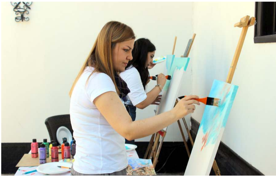
Etkinliğe 21 ressam katılıyor.