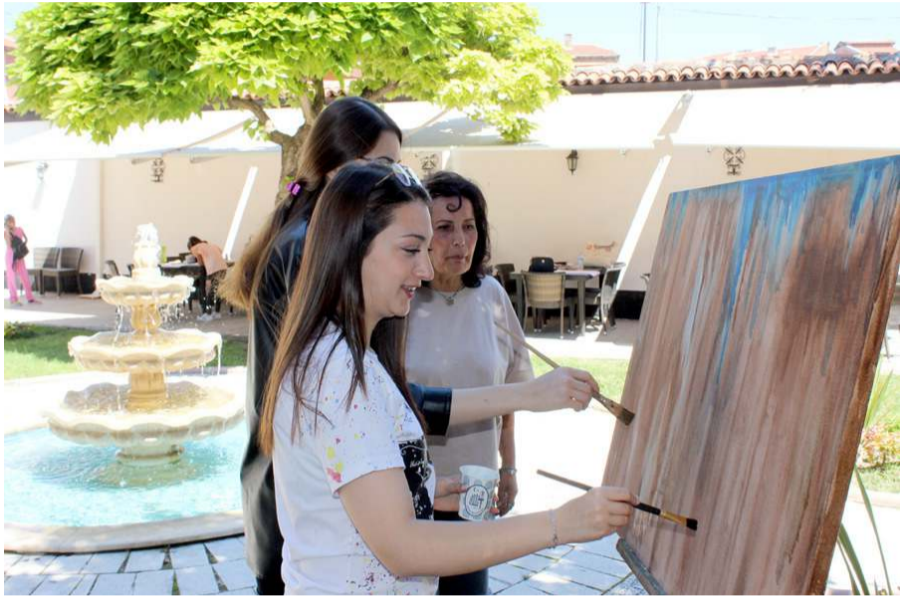
Ressamlar Velipaşa Konağında resim yaptılar.

Sanat buluşması etkinliklerinin 23 Temmuz tarihine kadar devam edeceği belirtildi.