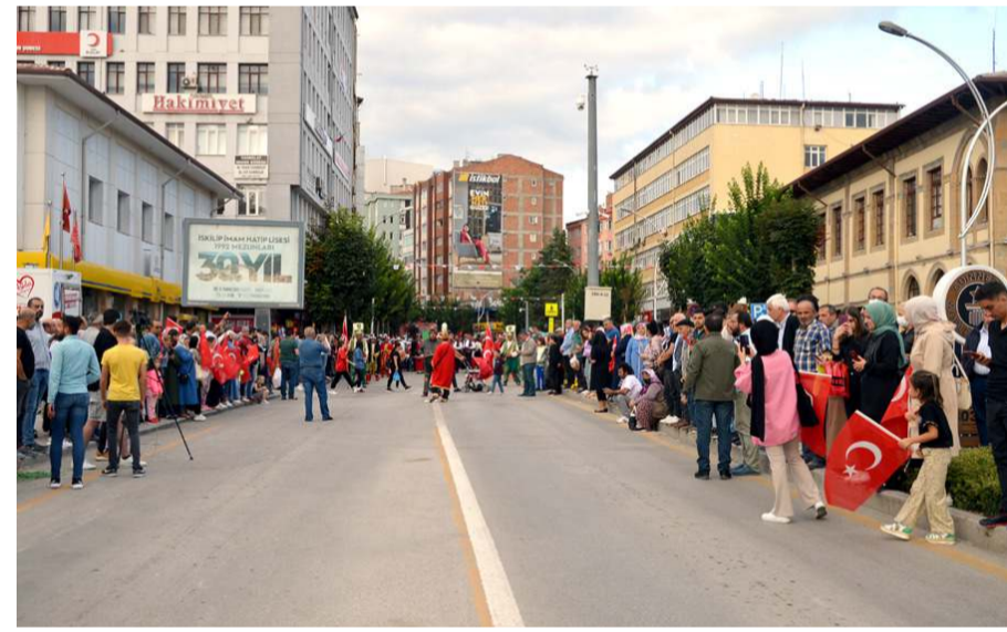
Açılış törenine halkın ilgisi yüksek oldu.