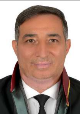
Av. Turan Kalıpcı