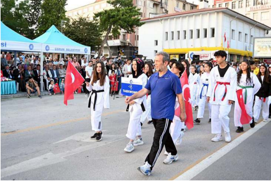
Festivalin açılış programı Gazi Caddesi Hürriyet Meydanı'nda gerçekleştirildi.