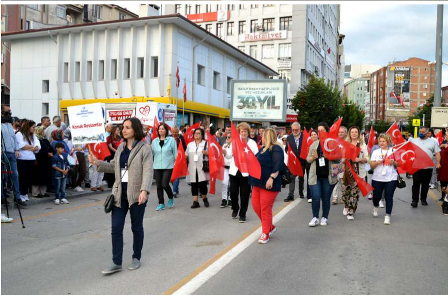
Kortejde ressamlarda yer aldı.