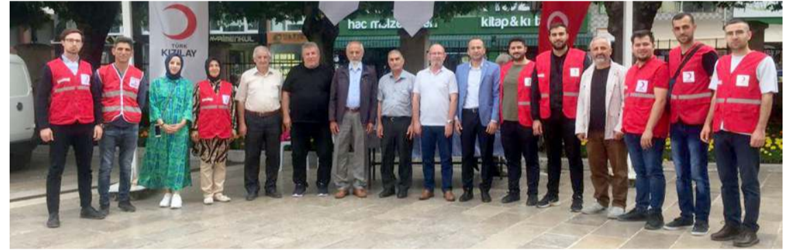
Kızılay Çorum Şubesi Kibris Barış Harekatı'nın yıldönümü nedeniyle vatandaşlara çorba ikram etti.