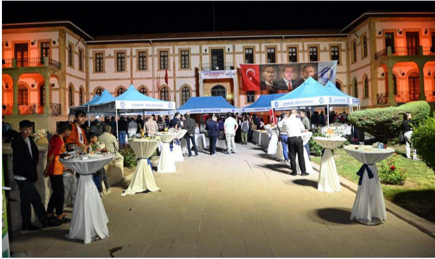
Bu yıl 37'ncisi düzenlenen Uluslararası Çorum Hitit Fuar ve Festivali'nin açılış kokteyli müze bahçesinde yapıldı.