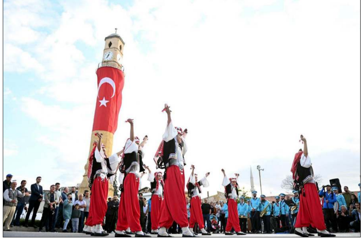
Açılış töreninde halk oyunları ekipleri gösteri yaptılar.

Vali Mustafa Çiftçi ise festivallerin yerel ekonominin, kültürel yapının ve toplumsal birlikteliğin güçlenmesine katkı sağladığını belirterek, Anadolu'nun coğrafi konumu, doğal