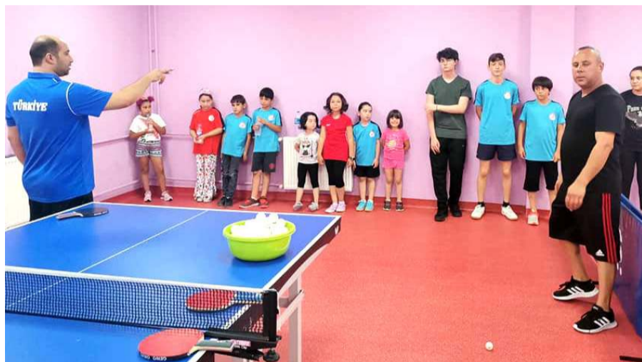
Yüzme Havuzundaki masa tenisi solonunda minik raketler yeni şampiyonlar olmak için deneyimli antrenörler gözetiminde çalışmalarını sürdürüyorlar

çukları lisans ederek Çorum ve Türk sporuna kazandırmak. Tabiki bu okulların asıl amacı ise topluma spor bilincini kazandırmak.