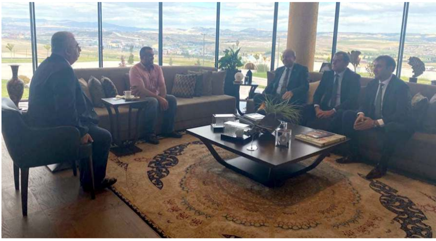
Ziyarete Sungurlu'ya yapılacak yatırım konuşuldu.