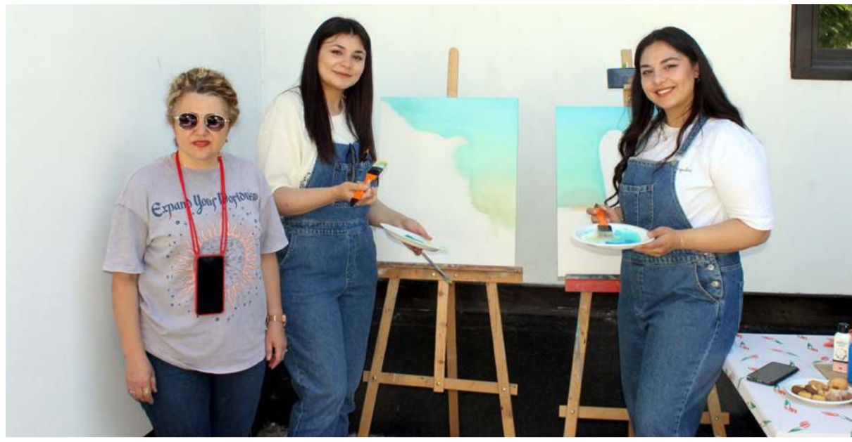
Hitit Fuar ve Festivali kapsamında "Sanat Buluşmaları Sokak Çalışmaları" etkinliği gerçekleştirildi.