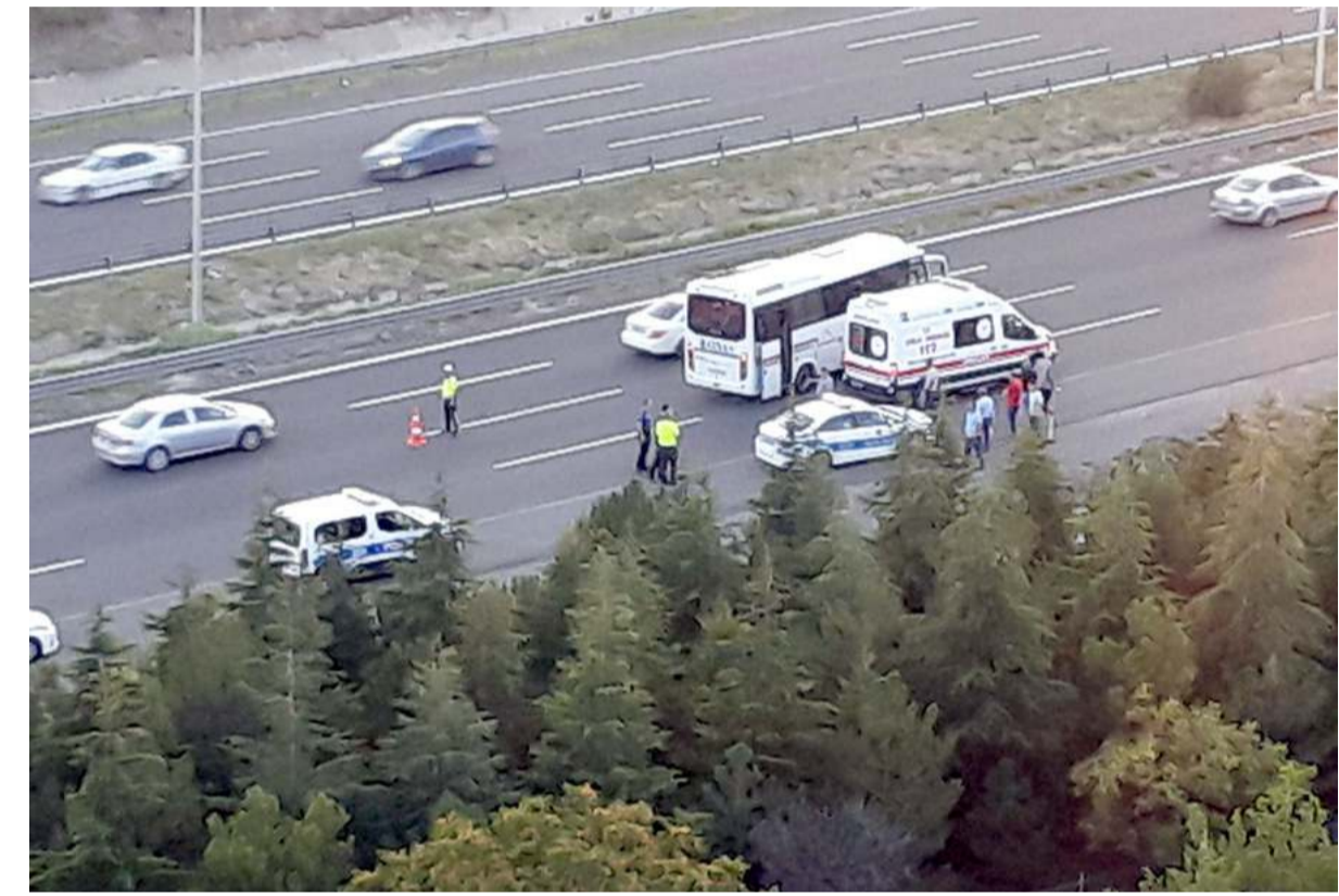
Olay Ankara'nın Pursaklar ilçesinde meydana geldi.

Konu ile ilgili firmadan yapılan açıklamada; "20.07.2022 tarihinde 17:00 Bayat-Ankara seferini gerçekleştiren otobüsümüz, saat 19:30 sularında Pursaklar-Bağlum arası otoyolda seyir halinde iken 2 araç tarafından zorla durdurulmuş olup yolcularımızdan birisi araçtan alınmak istenmiş, yolcunun inmek istememesi üzerine araç şoförü tarafından kapılar açılmamıştır. Otobüsün kapıları açılmadığı için yolu kesen şahıslar tarafından otobüsün lastiklerine ve camlarına zarar verilmiştir. Yapılan bu saldırının şirketimiz ve başka firmalarla hiçbir alakası yoktur. Olay tamamen araç içerisindeki yolcu-muz ve yakınlarıyla alakalıdır. Konu ile ilgili adli tahkikat devam etmektedir. Yapılan bu saldırıyı şiddetle kınıyoruz. Şirketimiz ve yolcularımıza geçmiş olsun." ifadelerine yer verildi