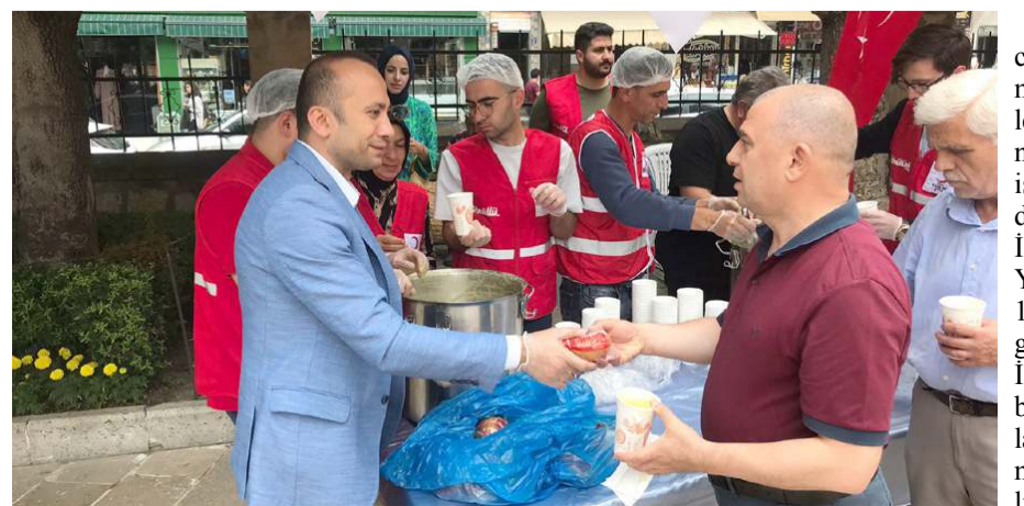
Vatandaşlar ikramdan dolayı Kızılay'a teşekkür ettiler.