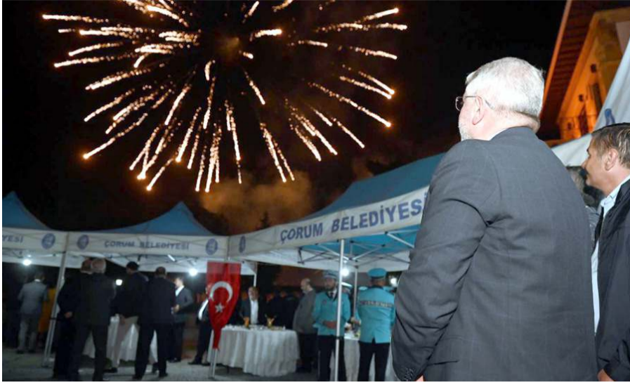
Müze bahçesinde gerçekleştirilen kokteyilde havai fişek gösterisi yapıldı.