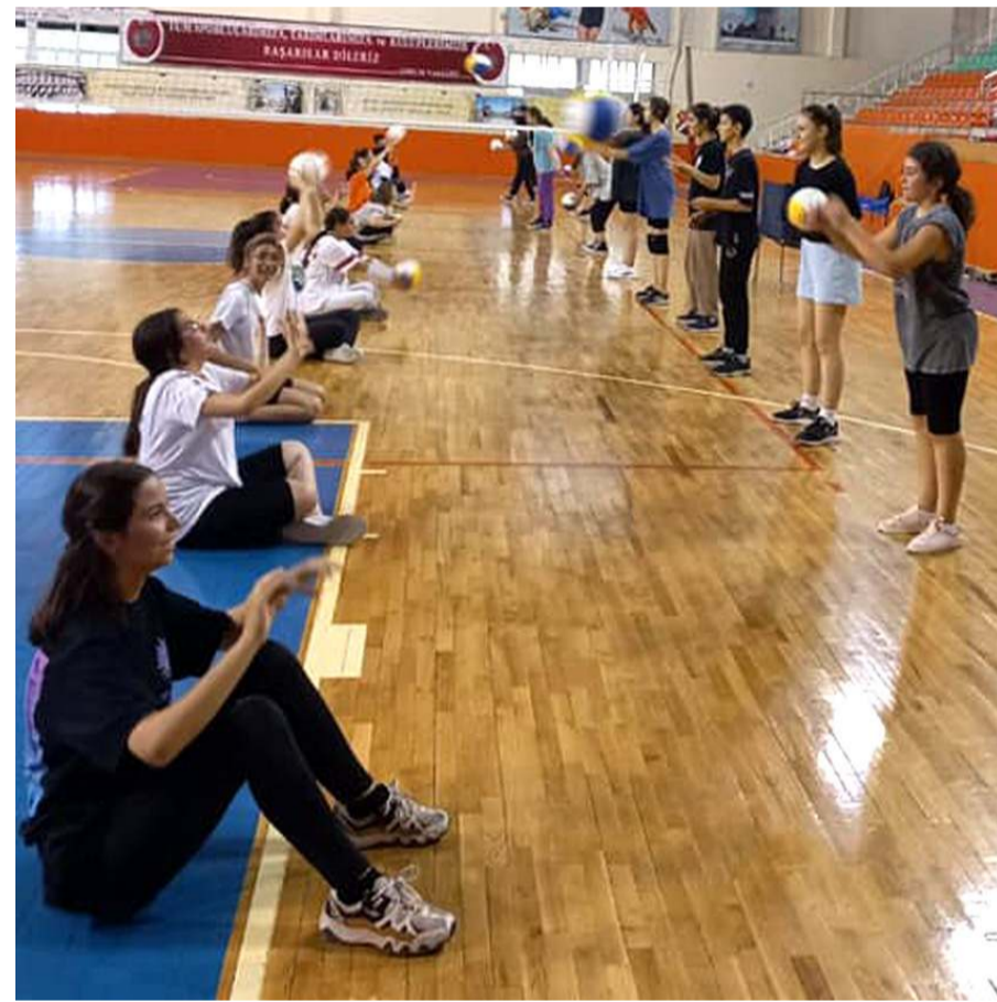
Türkiye'de son yıllardaki başarılar ile özellikle bayanların büyük ilgisini çeken voleybol branşında rekor sayıda katılım ile çalışmalar bir çok salonda sürüyor

Bu yıl yapılan yeni bir uygulama ise her çalışma saatine düşen sporcu sayısına mümkün olduğunca en aza indirmek. Antrenörler çalış-