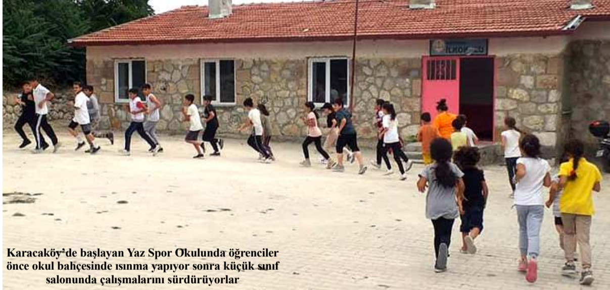
Karacaköy'de başlayan Yaz Spor Okulunda öğrenciler önce okul bahçesinde ısınma yapıyor sonra küçük sınıf salonunda çalışmalarını sürdürüyorlar