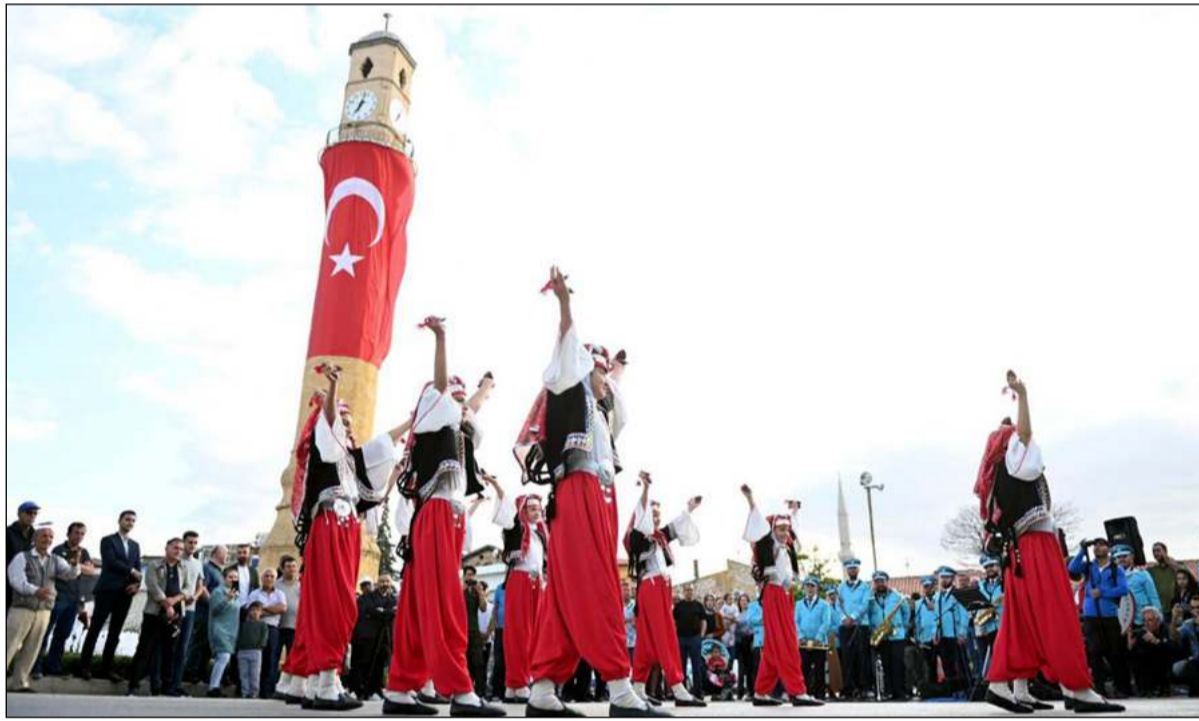
Açılış töreninde halk oyunları ekipleri gösteri yaptılar.