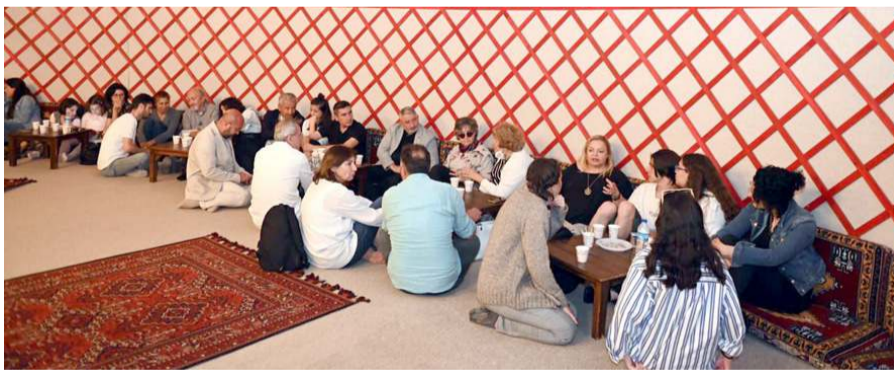
21 ressam Çorum Belediyesi'nin misafiri oldu.