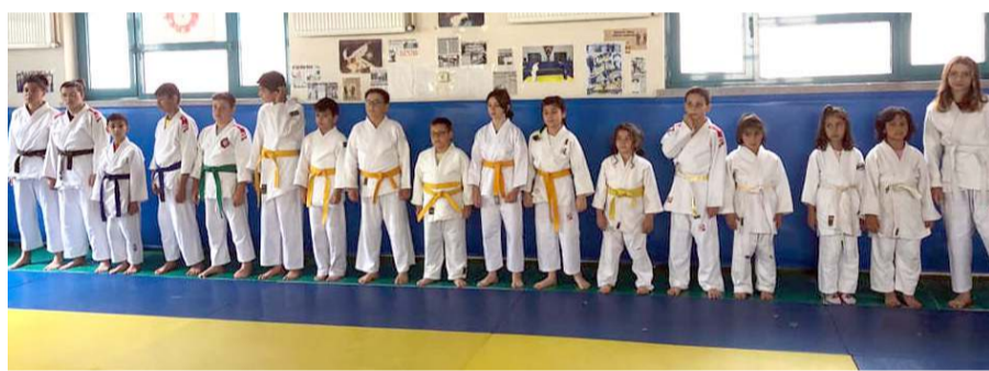
Judo branşında yeniden yapılanma süresinde yeni şampiyonlar yetiştirmek hedefleniyor