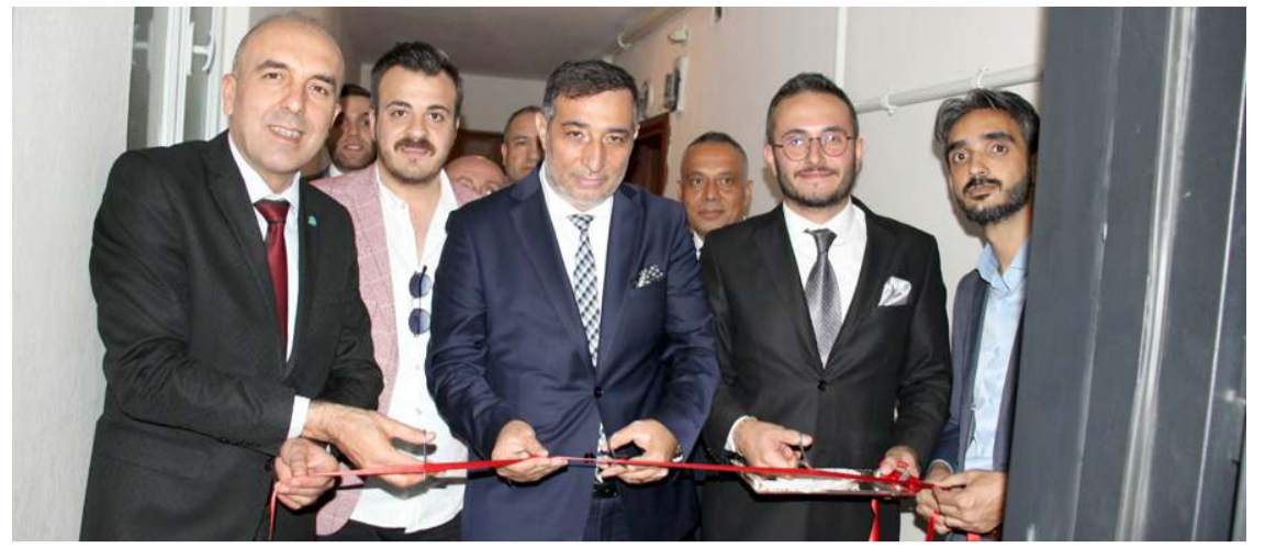
Av. Murat Darbaş'ın bürosu Aziz Enver Apartmanında açıldı.