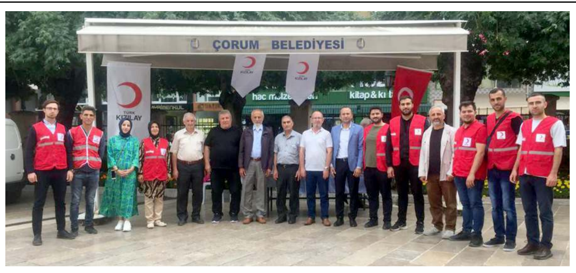
Kızılay Çorum Şubesi Kıbrıs Barış Harekati'nin yıldönümü nedeniyle vatandaşlara çorba ikram etti.