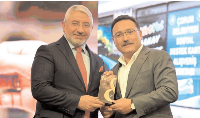
Aşgın, ödülünü Kayseri Valisi Gökmen Çiçek'in elinden aldı.

Ziyarette Şoförler ve Nakliyeciler Odası Başkanı Tahsin Şahin, Sebzeçiler ve Pazarcılar Odası Başkanı Erdoğan Yılmaz ile Dikiciler ve Kunduracılar Odası Başkanı Cumhuriyet Palabıyık da hazır bulundu. (Haber Merkezi)