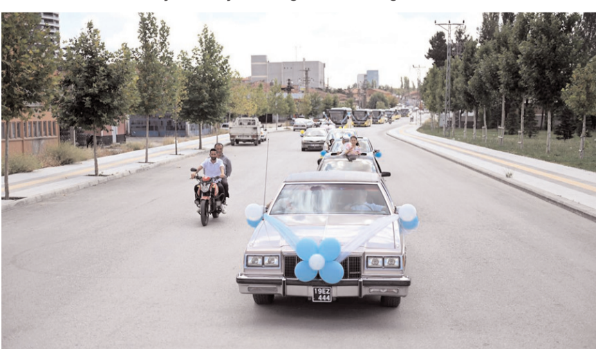
Çocuklar aileleri ile birlikte konvoy eşliğinde şehir turu attı.