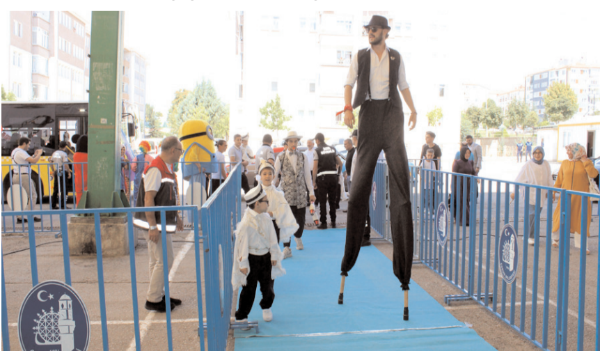
Şölenle çocuklar gönüllüleriyle eğlendi.