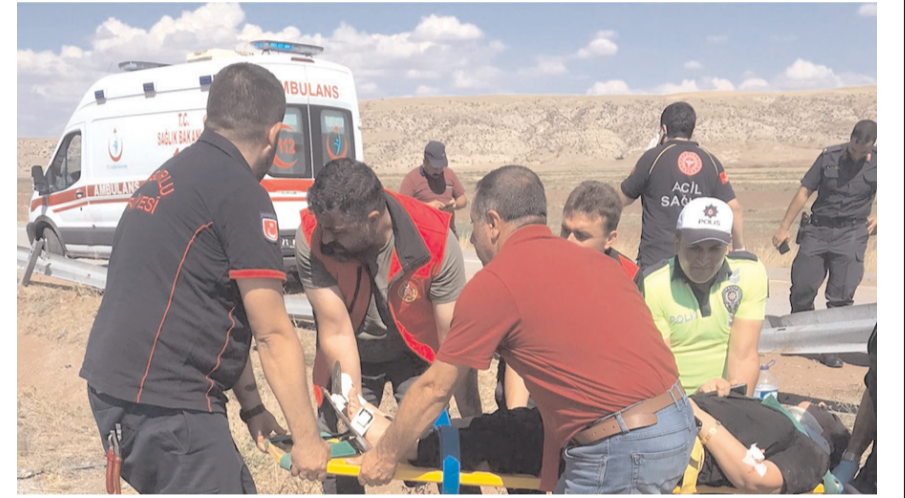
Kaza, Sungurlu-Kırıkkale karayolunun 20. kilometresinde meydana geldi.

Öte yandan, Sungurlu-Kırıkkale karayolu Organize Sanayi Kavşağı yakınlarında bir başka trafik kazası meydana geldi. Ankara'dan Sungurlu istikametine seyir halinde olan otomobil, sürücüsünün direksiyon hakimiyetini kaybetmesi sonucu