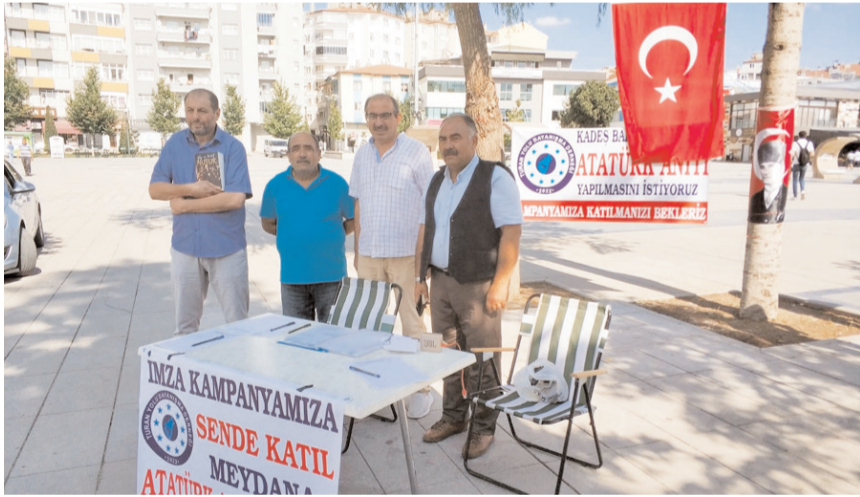
Atatürk Anıtı yapılması için Kadeş Barış Meydanı'nda imza kampanyası başlatıldı.