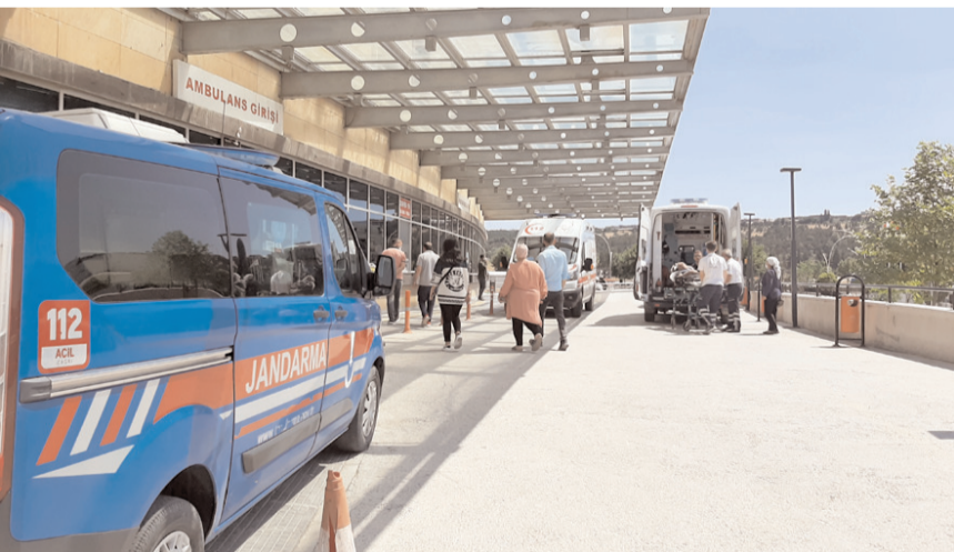
Kavgada yaralanan İ.G.'nin hayatı tehlikesinin bulunmadığı öğrenildi.