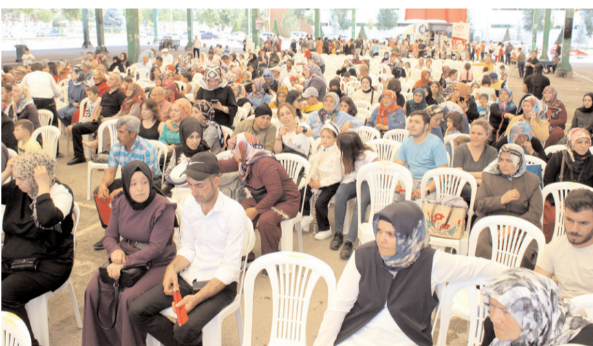
Perşembe Pazarı'ndaki Sunnet Şölenine çocukların aileleri de katıldı.