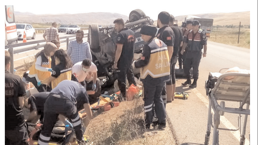
Olay yerine çok sayıda sağlık ekipleri sevk edildi.