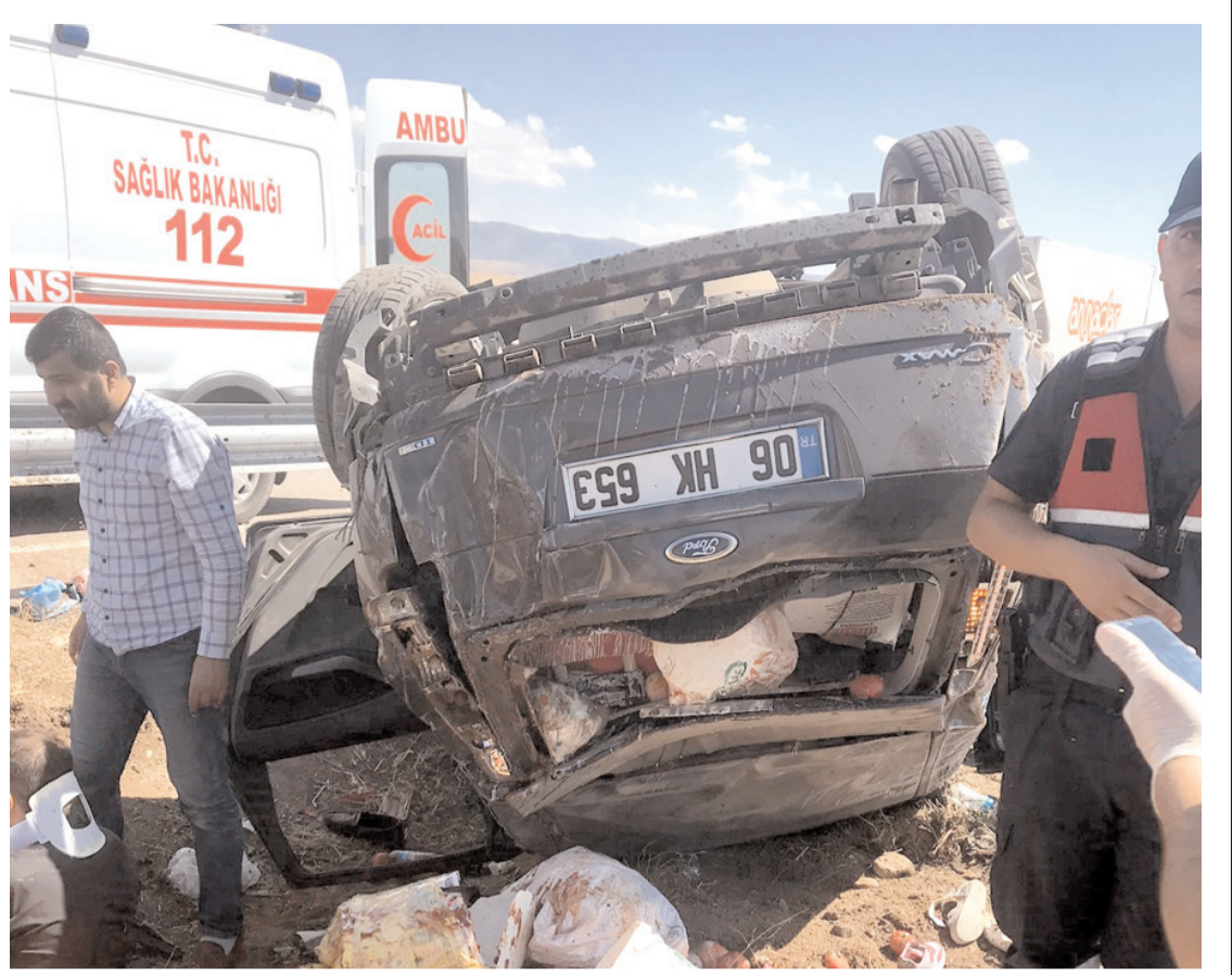
Sürücünün direksiyon hakimiyetini kaybetmesi sonucu otomobil takla atarak orta refüje devrildi.