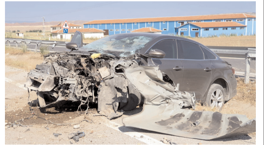
Kazayı gören diğer sürücüler durumu itfaiye, polis ve sağlık ekiplerine haber verdi.