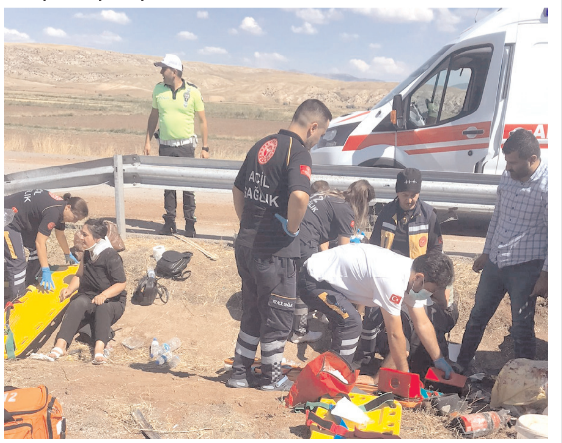
Yaralıları ilk müdahale olay yerinde yapıldı.

Her iki trafik kazası ile ilgili olarak başlatılan soruşturmanın devam ettiği bildirildi. (İHA)