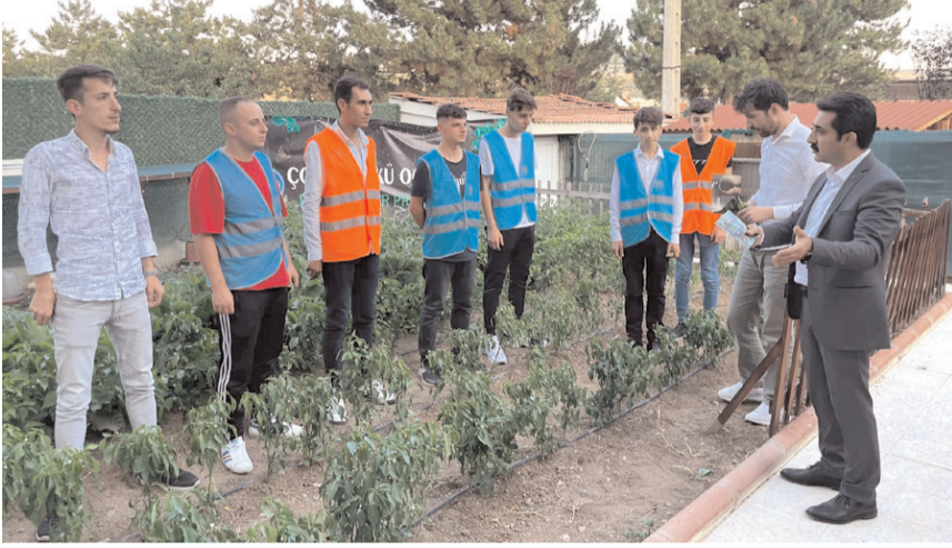
Projenin toprağa dayalı üretimin önemine dikkat çekmek amacıyla hayata geçirildiği belirtildi.

Eğitimlerini tamamlayan temsilciler, istikbalimizin teminatı olan gençlere Sürdürülebilir Tarım Projesi'ni uygulamalı bir şekilde anlatarak eğitimler vermeye devam ediyor." (Haber Merkezi)