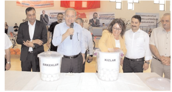
Hediyelerin sahipleri çekilen kura ile belirlendi

Çekilişte 20 adet bisiklet hediyesinin yanı sıra çok sayıda voley-