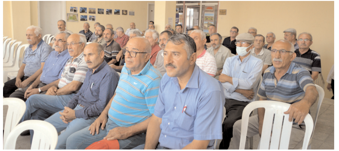
Kurulda faaliyet raporları okunarak ibraz edildi.