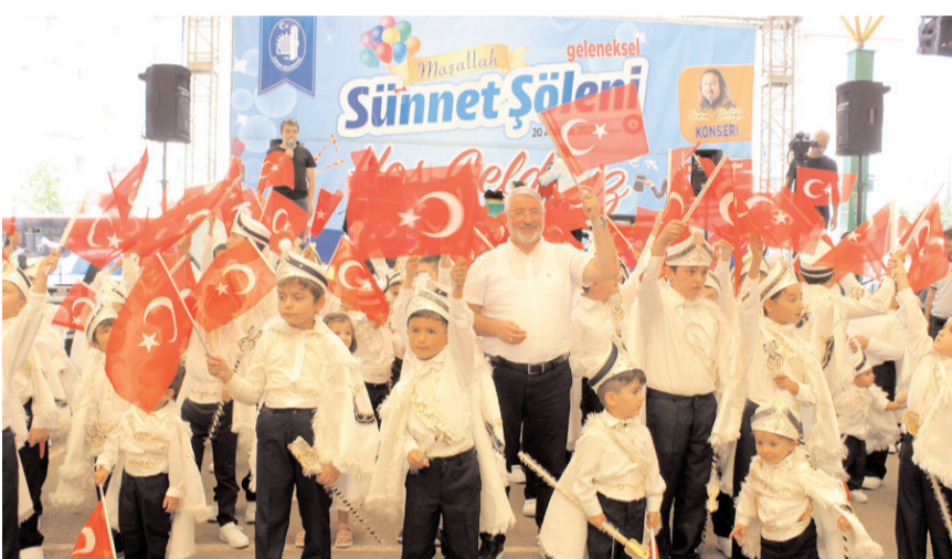
Geleneksel Sunnet Şöleninde 150 çocuk erkeklığe ilk adımını attı.