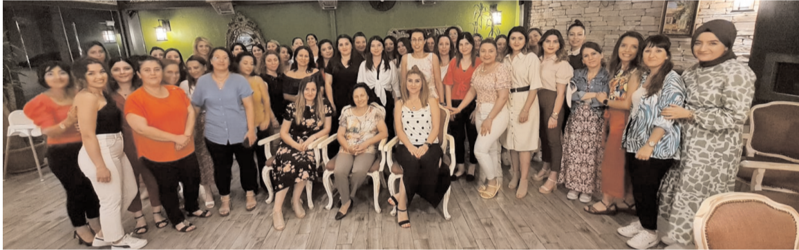
Lila'da gerçekleşen buluşmaya 43 firmadan 52 muhasebe yöneticisi katıldı.