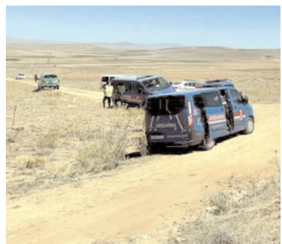
Hayvanların gölgelik alanda dinlendirilme sırası nedeniyle çıkan tartışmada 1 kişi yaralandı.