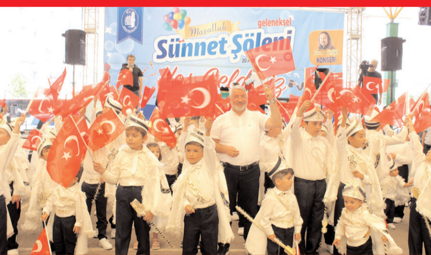
Geleneksel Sünnet Şöleninde 150 çocuk erkeklige ilk adımını attı.

Çorum Belediyesi tarafından her yıl geleneksel olarak düzenlenen Sünnet Şöleninde bu yıl 150 çocuk erkeklige ilk adımını attı. * HABERİ 6'DA