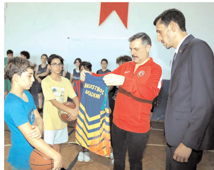
Vali Mustafa Çiftçi Basketbol Akademisi'ne yeni katılan sporculara formalarını verdi

belirterek bu doğrultuda çalışan tüm antrenörleri tebrik etti ve başarılar diledi.