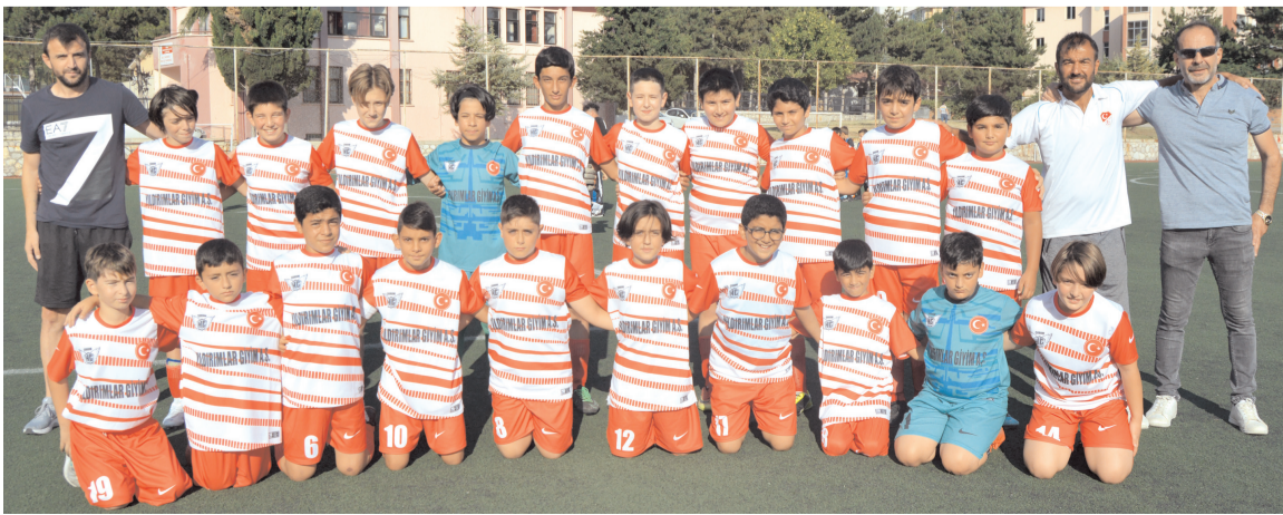
Hattuşa Gençlikspor turnuvadaki ilk maçında farklı galip gelerek iyi bir başlangıç yaptı

F grubunda ilk maçta Hattuşa Gençlikspor, Devamespor'u 7-0 Çorum Vefaspor ise Alaca İdman Ocağı takımını 4-0 yendi. G urubunda Çorum Demirspor- Hattuşa Gençlikspor1 takımını 3-0 yenerken Alaca Belediyespor ise HE Kültürspor'u 3-1 yenerek gruba üç puanla başladı. H grubunda ise ilk hafta maçında Çorum FK 1 takımını Bosnaspor'u 4-0, 1907 Gençlikspor ise Mecitözüspor'u 2-0 yenerek gruba iddialı başladılar. Gruplarda ikinci maçlar dün akşam Park Bahçeler Müdürlüğü ile 1 nolu sentetik sahalarda oynandı.