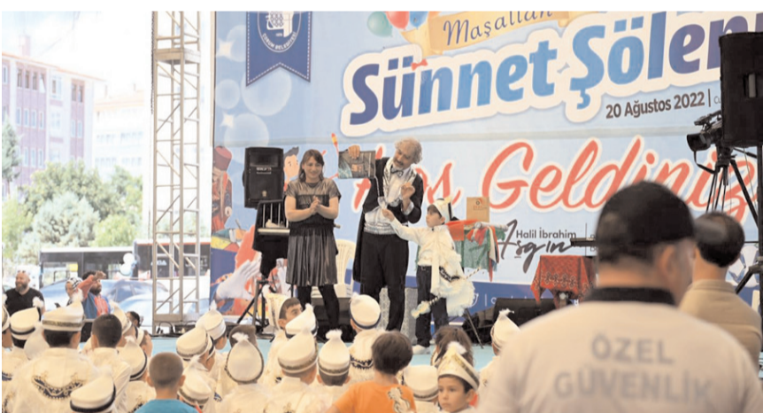
Çeşitli etkinlikler programa renk kattı.