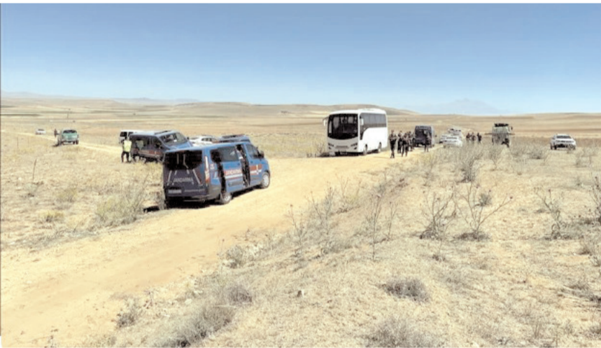
Hayvanların gölgelik alanda dinlendirilme sırası nedeniyle çıkan tartışmada 1 kişi yaralandı.

S.Ç. ise jandarma ekiplerince gözaltına alındı. (AA)