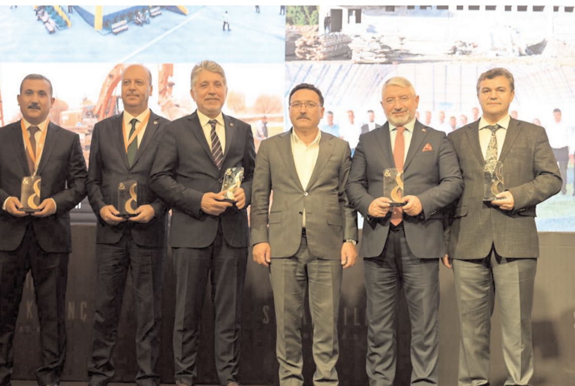
Aşgın, Çorum'da hayata geçirilen sosyal destek kart projesi ile yılın belediye başkanı seçildi.