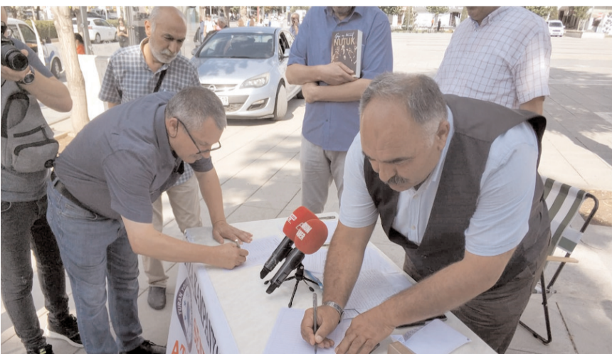
İmzalar toplandıktan sonra Çorum Belediyesi'ne teslim edilecek.