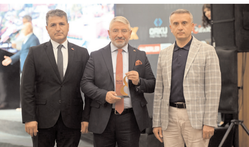
Aşgın, göreve geldikleri günden beri pek çok örnek projeye imza attıklarını söyledi.