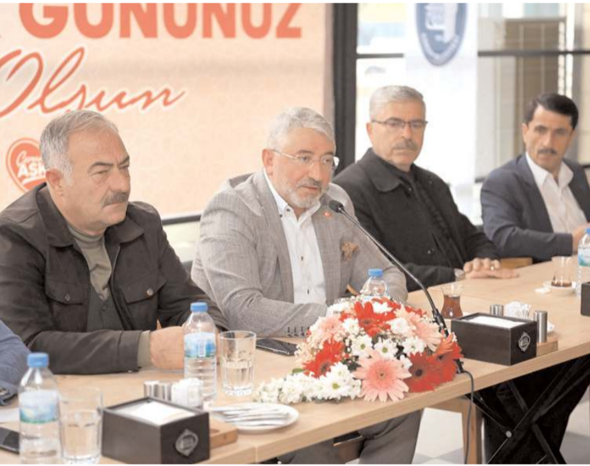
Başkan Aşgin, toplantıda açıklamalarda bulundu.