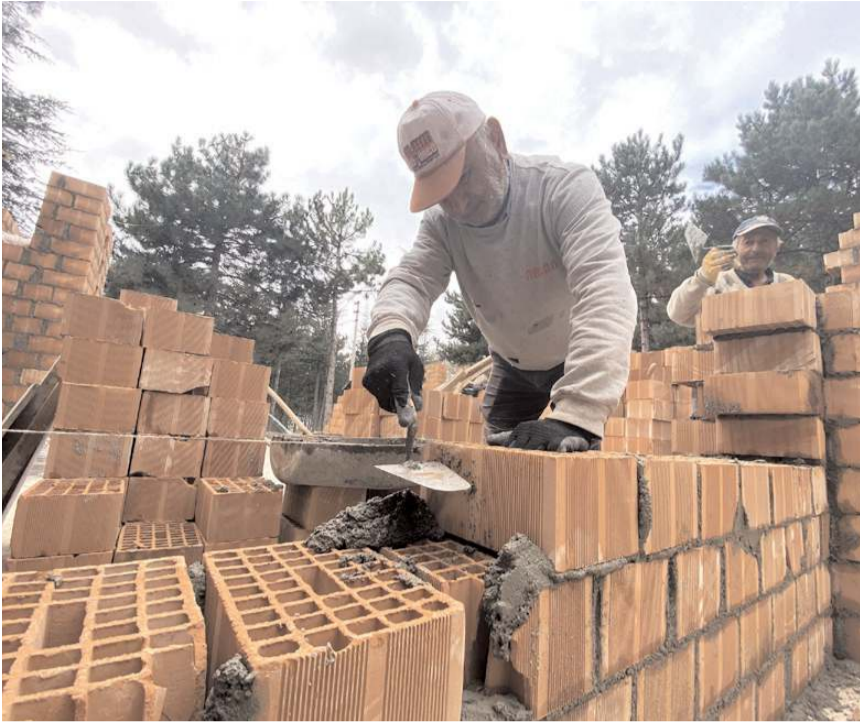
Kediler müşahede binası 140 metrekare alana sahip olacak.