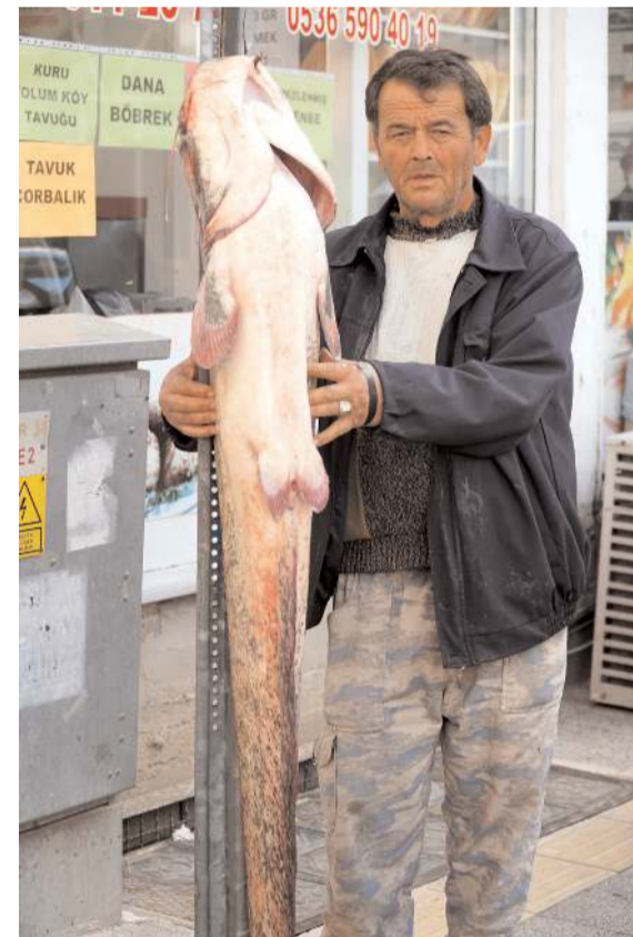
Balıklardan birisi Obruk Baraj Gölü'nde yakalandı.