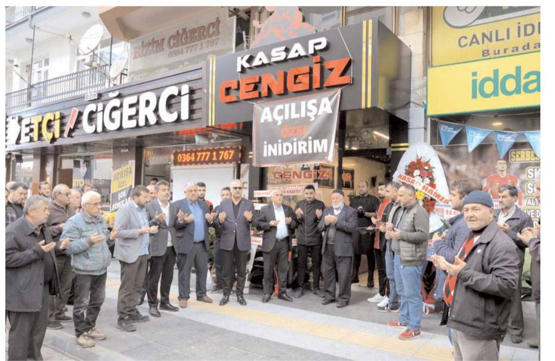
Açılış öncesinde dua edildi.

Çeşitli ikramların ardından açılış sona erdi.