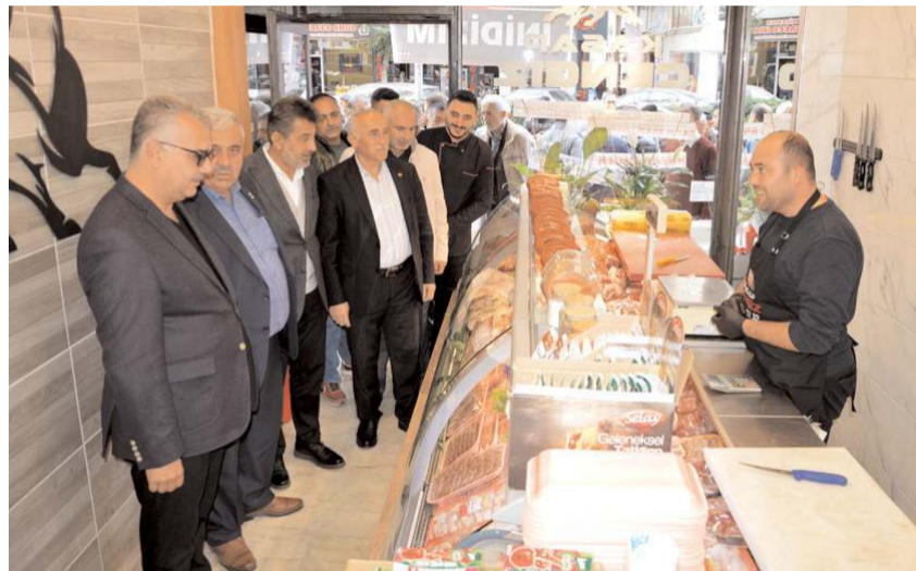
İşletme personeli ürünler hakkında bilgi verdi.