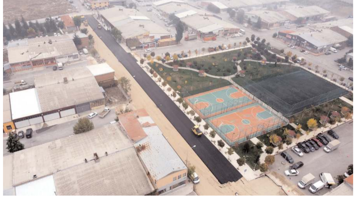
Çorum Sanayi Sitesi 6.Cadde, 400 metre uzunluğa 17 metre genişliğe sahip.

Şehrin farklı bölgelerinde alt ve üst yapı çalışmalarının yanı sıra yeni yollar açmaya ve asfalt serimine devam ettiklerini kaydeden Belediye Başkanı Dr. Halil İbrahim Aşgın, kış mevsiminin kendisini yavaş yavaş hissettirmeye başladığı günlerde ekiplerin çalışma programında yer alan işlerini tamamlamak için çalışmalarını büyük bir hızla sürdürdüğünü ifade etti. Başkan Aşgın, "Ekiplerimiz 400 metre uzunluğa 17 metre genişliğe sahip Çorum Sanayi Sitesi 6.Cadde'nin önce zeminini güçlendirerek 9 bin 500 ton stabilize, 2 bin 500 ton mekanik serimi gerçekleştirdi. Hemşehrilerimiz ve sanayi esnafımız uzun yıllar hizmet edecek caddemize Bin 600 ton asfalt serimi gerçekleştiriyoruz. Hayırlı olsun" diye konuştu. (Haber Merkezi)