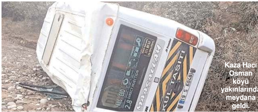
Kaza Hacı Osman köyü yakınlarında meydana geldi.

Sungurlu'da okul servisinin devrilmesi sonucu sürücü ve 15 ilkökul öğrencisi yaralandı.