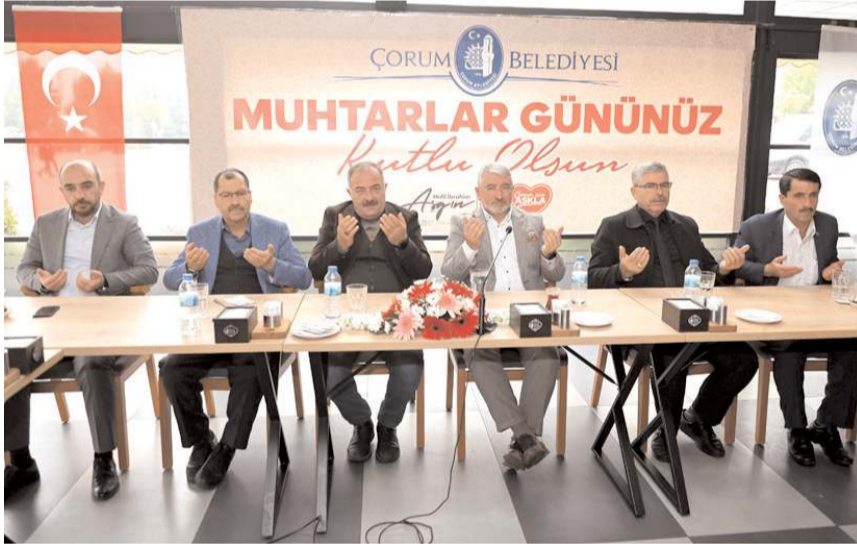
Program Meydan Sosyal Tesisleri'nde gerçekleştirildi.