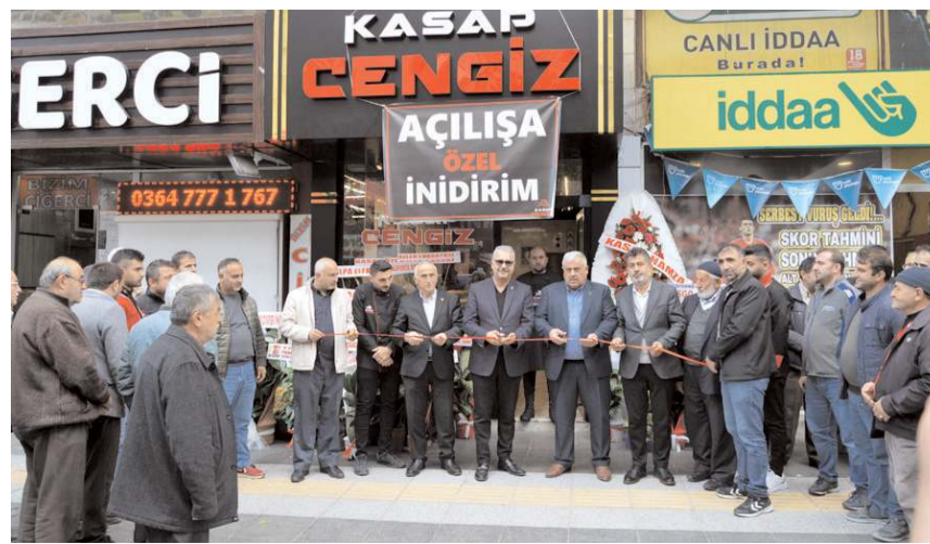
Açılış kurdelesini davetliler tarafından kesildi.