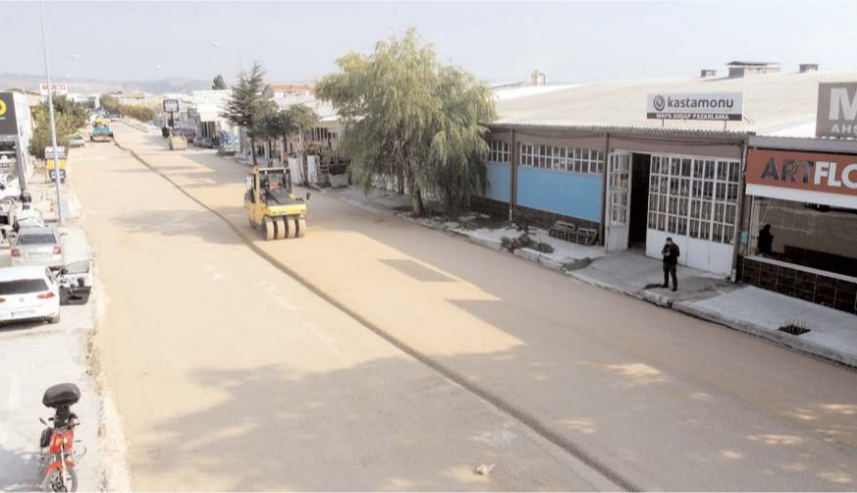
Caddede ilk olarak zemin güçlendirilerek 9 bin 500 ton stabilize, 2 bin 500 ton mekanik serimi yapıldı.

Çorum Belediyesi çalışma programında yer alan Çorum Sanayi Sitesi 6.Cadde'nin asfalt serimini gerçekleştiriyor.