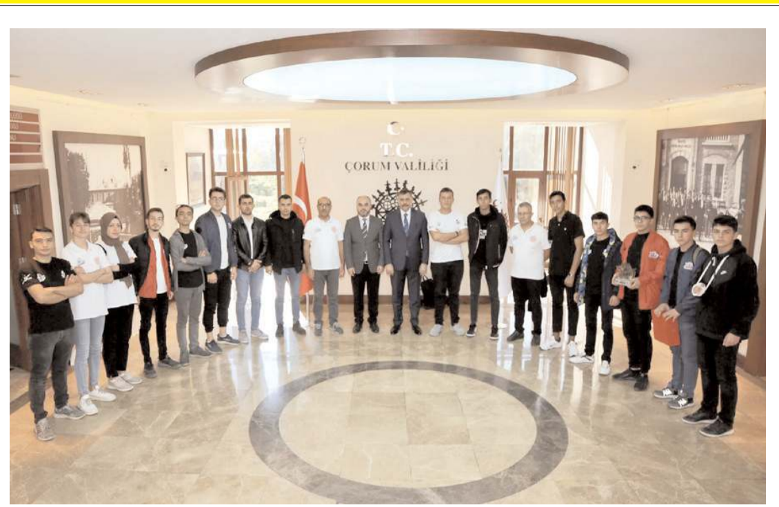
Ziyaretin anısına toplu hatıra fotoğrafı çekildi.

TEB'in yaptığı açıklamaya göre eczacıların sorunlarını anlatmak için yapacağı miting 27 Kasım'da gerçekleşecek.