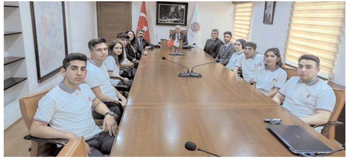
Pınar Teknoloji Koleji'nin 8 öğrencisi ve yöneticileri Vali Yardımcısı Erdoğan Kanyılmaz'ı ziyaret etti.

hulâsa bir milletin hedefi saadet olan müşterek bir istikamette yürümesini teminde, basın başlı başına bir kuvvet, bir mektep, bir rehberdir" sözü de unutulmamalıdır. Bu vesileyle; Hakkı, halkı, adaleti gözeterek haber yapan, meslek onurunu koruyan ve bu minvalde zor şartlar altında görev icra eden şehrimizde bulunan gazeteci arkadaşlarımız olmak üzere, tarafsız ve doğru haber için gece gündüz çalışan tüm gazetecilerimizin 21 Ekim Dünya Gazeteciler Günü'nü kutlar, meslek hayatlarında başarılar dilerim. Bugüne kadar verdiğimiz basın şehitlerimiz ile vatanımızın bekası, al bayrağımız için şehit düşen kahraman evlatlarımızı bu vesile ile yad ediyor, gazilerimize de hayırlı uzun ömür temenni ediyorum." şeklinde ifadelerde bulundu. (Haber Merkezi)