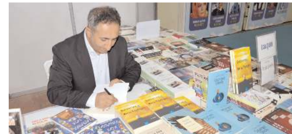
Yazar Erdal Şahin'in üç kitabı bulunuyor.