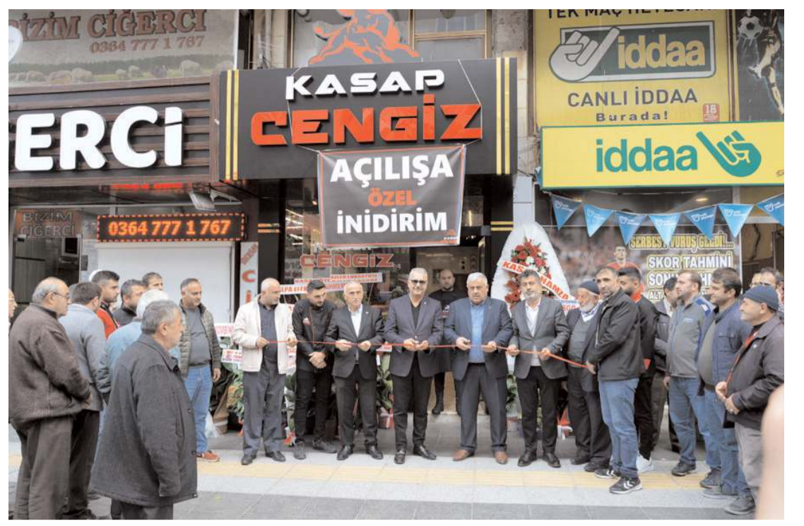
Açılış kurdelesini davetliler tarafından kesildi.