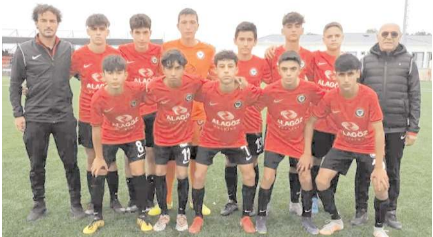
Çorum FK U 15 takımı yarın evindeki ilk maçta Eskişehirspor ile karşılaşacak