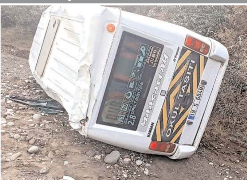
Kaza Hacı Osman köyü yakınlarında meydana geldi.

Sungurlu'da okul servisinin devrilmesi sonucu sürücü ve 15 ilkököl öğrencisi yaralandı. H.L. idaresindeki 19 S 6048 plakalı öğrenci servisi, Hacı Osman köyü yakınlarında dere yatağına devrildi. Kazada sürücü ile servisteki 15 ilkököl öğrencisi hafif şekilde yaralandı. İhbar üzerine kaza yerine jandarma ve sağlık ekipleri sevk edildi. Yaralılar, sağlık ekiplerince ambulanslarla Sungurlu Devlet Hastanesi'ne kaldırıldı. Yaralıların hayati tehlikesinin bulunmadığı öğrenildi. (AA)