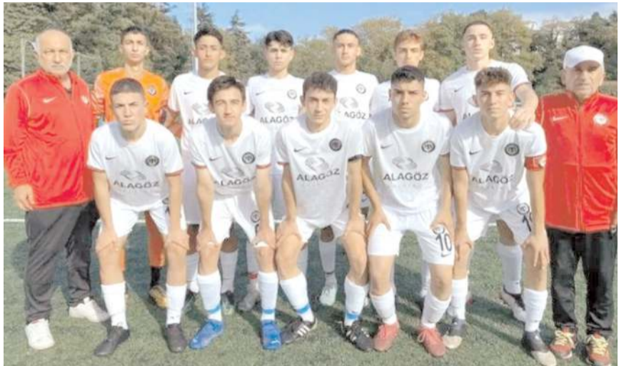
Çorum FK U 17 takımı bugün Kırıkkale Anadolu Spor önünde galibiyet arayacak