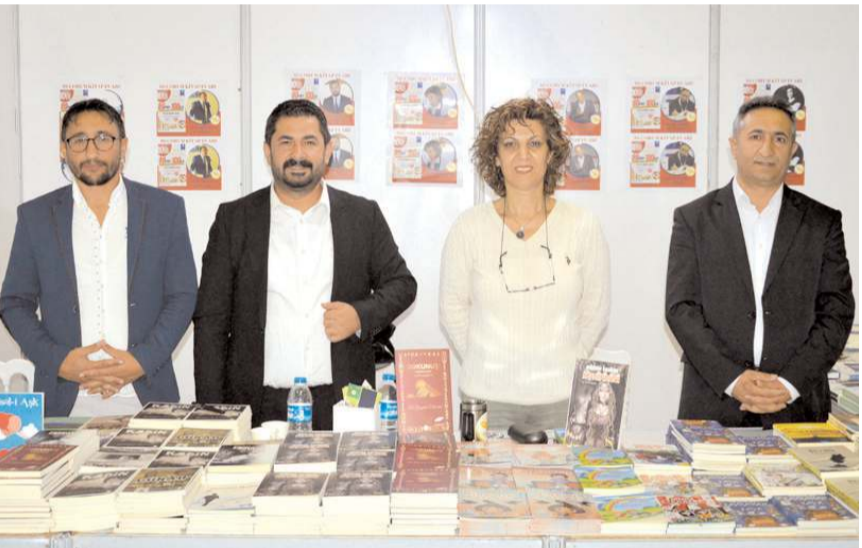
Yazar Erdal Şahin'in üç kitabı bulunuyor.