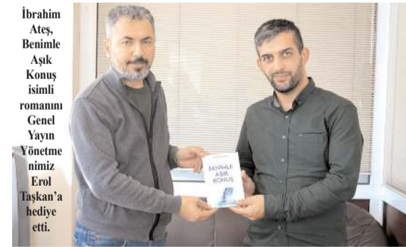
İbrahim Ateş'in 3. kitabı çıktı