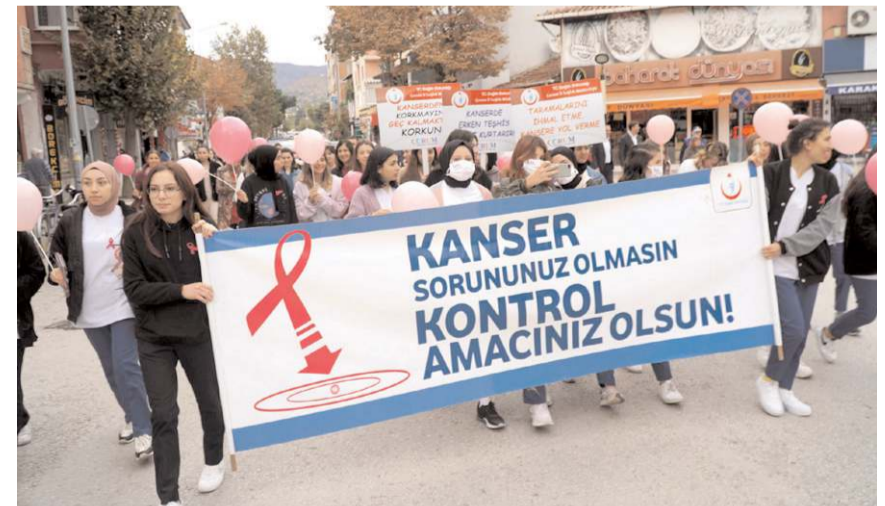
Yürüyüş sırasında kadınlara meme kanseri hakkında bilgiler içeren broşür ve pembe balonlar dağıtıldı.