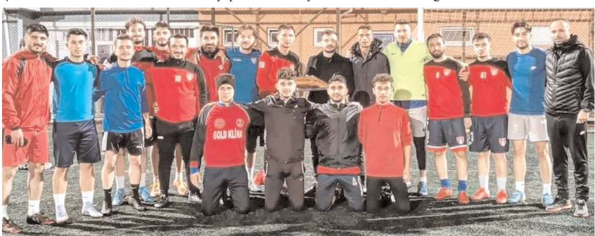
Amatör Spor Kulüpleri Federasyonu Başkanı Ferhat Arıcı Mimar Sinan sahasında çalışan dört takımı ziyaret etti

ASKF yönetimi 1. Amatör Küme takımlarını ziyaretlerini önümüzdeki günlerde sürdürecektir.