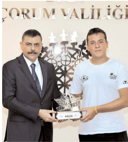
Öğrenciler Vali Çiftçi'ye hediye takdim ettiler.