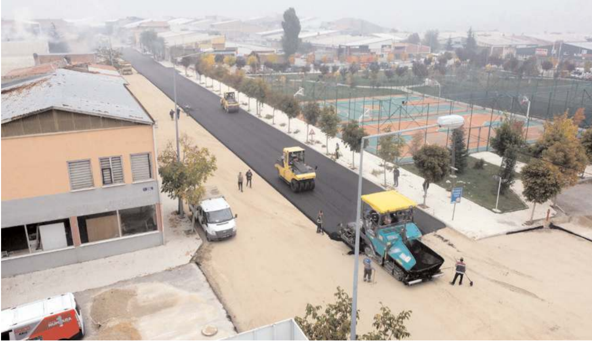
İlk olarak alt yapısı tamamlanan Çorum Sanayi Sitesi 6.Cadde'nin asfalt serimi yapılıyor.