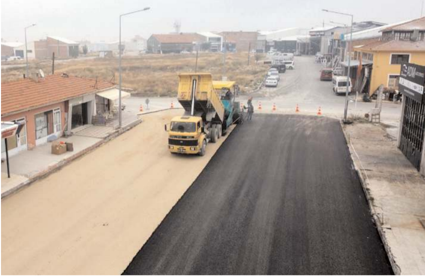
Caddede Bin 600 ton asfalt serilecek.