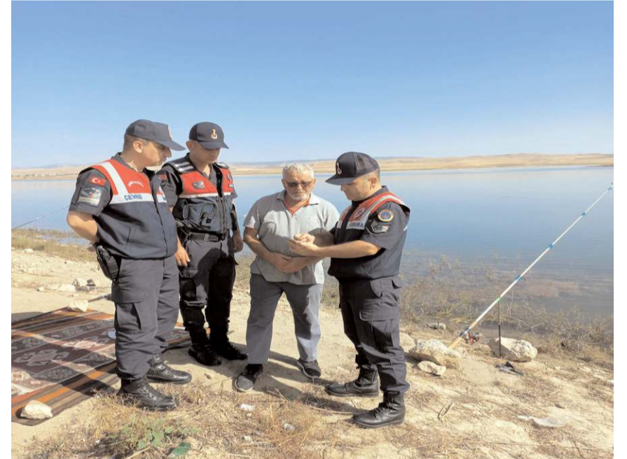
Jandarma ekipleri bilgilendirme çalışması da yapıyor.