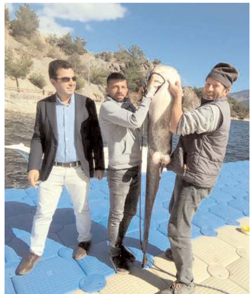
Balıklardan birisi Obruk Baraj Gölü'nde yakalandı.