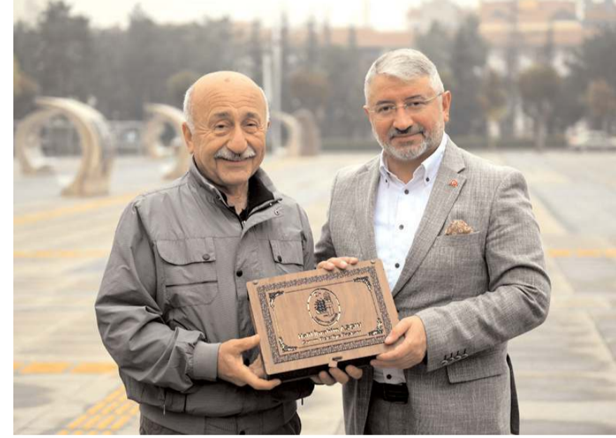
Başkan Aşgin, programın sonunda muhtarlara hediye verdi.

Başkan Aşgin, konuşmasının ardından mahalle muhtarlarının taleplerini dinledi. Aşgin, program sonunda mahalle muhtarlarına günün anısına hediye verdi. (Haber Merkezi)