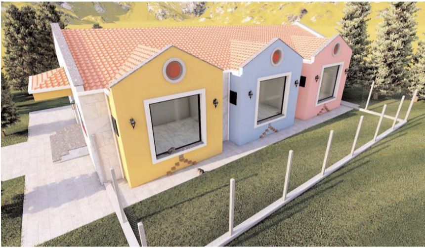
Bina içerisinde 6 bağımsız oda yer alacak.