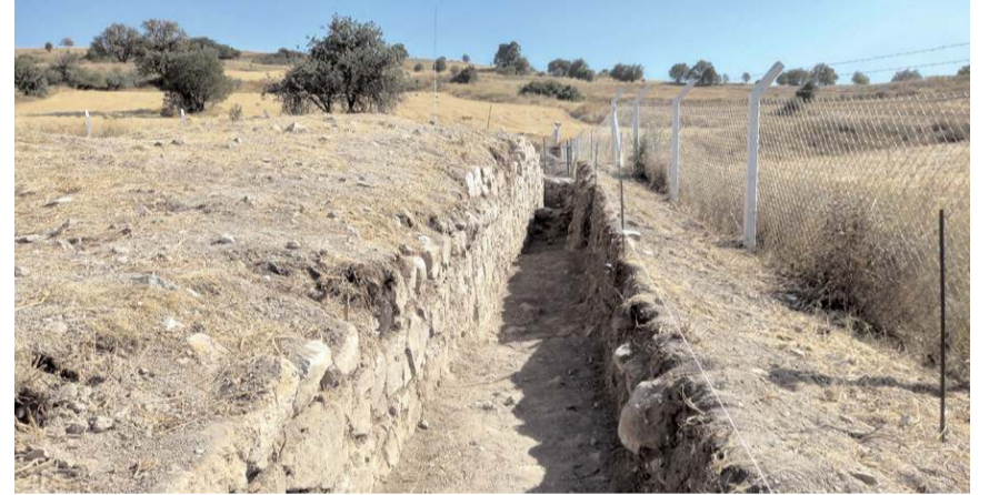
Kalehisar ören yeri Alaca'nın Mahmudiye köyünde bulunuyor.