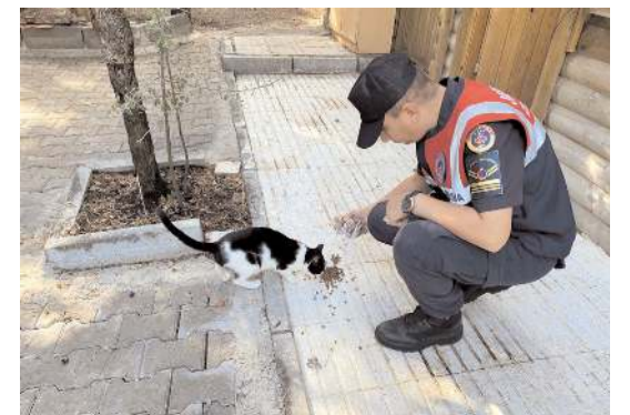
Jandarma ekipleri sokak hayvanlarına yem bırakıyor.

Güzel şeydir PAYLAŞMAK KERMESİNE DAVETLİSİNİZ