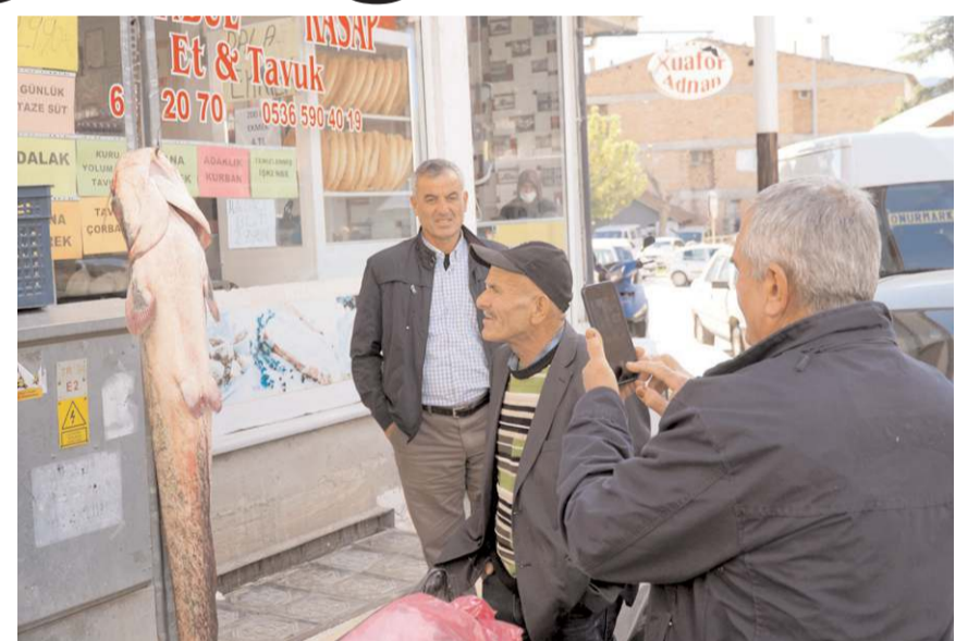
Vatandaşlar dev yayın balığının fotoğrafını çektiler.

Mercimekci, bu yıl Obruk Baraj Gölü'nde 4. kez büyük balık yakaladıklarını dile getirerek, balığı sattıklarını kaydetti. (AA)