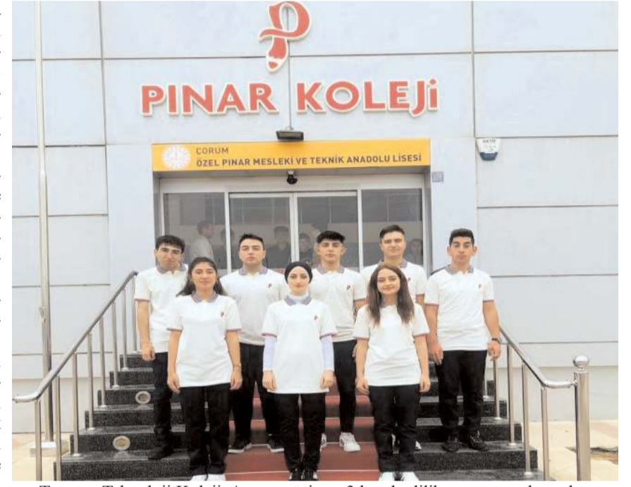
Tasarım Teknoloji Koleji, Avrupa stajının 3 hareketlilik programında toplam 15 öğrencinin 8'ine Almanya'da iş bulma fırsatı sağladı.

Pınar Koleji'nin öğrencilerine sağladığı tüm Avrupa ülkelerinde geçerli olan Europass Belgesi (Avrupa'nın farklı ülkelerinde eğitim görme ve ça-