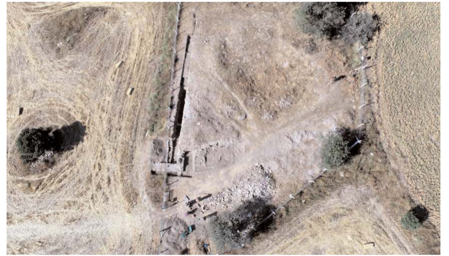
Bu yıl devam eden çalışmalarda kentte ilk kez bilinmeyen bir yapının varlığı açığa çıkarıldı.