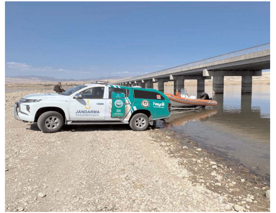
İç sularda yapılan denetim ve kontrollerde son bir ay içerisinde yaklaşık 3.500 metre uzunluğunda misina balık ağı ele geçirildi.

Yapılan açıklamada vatandaşların ihbarlarını 112 Acil Çağrı Merkezi üzerinden Jandarma'ya bildirmesinin, olayların önlenmesi ve aydınlatılmasına büyük katkı sağlayacağı belirtildi. (Haber Merkezi)