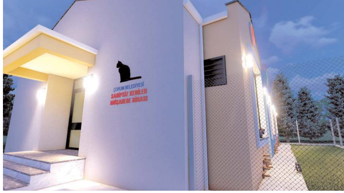
Projenin 90 günde bitmesi bekleniyor.

Sahihsiz Kedi Müşahede Evi ile ilgili de bilgiler veren Başkan Aşgın, "6 odalı ve yerden ısıtmalı olacak, önlerinde yaklaşık 80 metre kare bahçesi ile yeni yerimizde hasta, yaralı, bakıma muhtaç ve gelen ziyaretçilerimizin sahihsiz kedilerimizi sevebileceği bir yer olacak. Kedi evimizin içerisinde kedi oyuncakları, kedi tırmalama tahtaları, kedi yatakları gibi malzemeler olacak ve kedilerimiz daha güzel ortamlarda yaşamlarını sürdürecektir" diye konuştu. (Haber Merkezi)