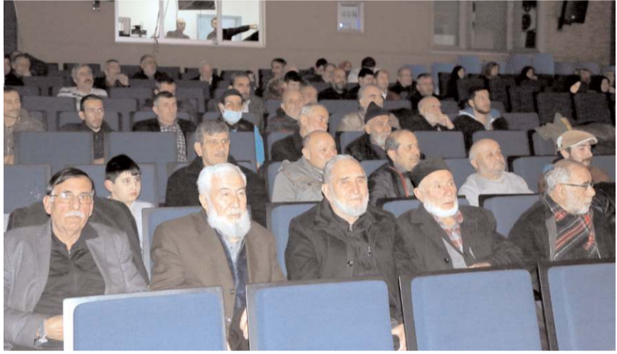
Konferans Çorum Belediyesi Buhara Kültür Merkezi'nde yapıldı.