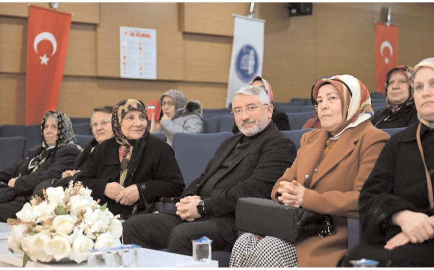
Tokat gezisi için bin 35 müracaat yapılmış.