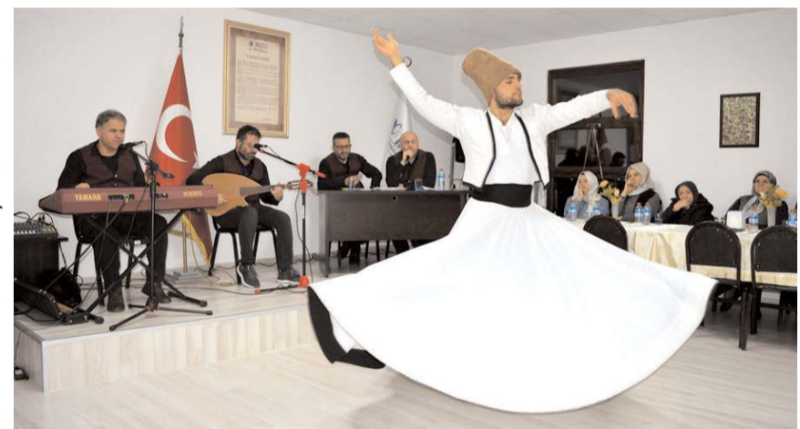
Programda sema gösterisi yapıldı.