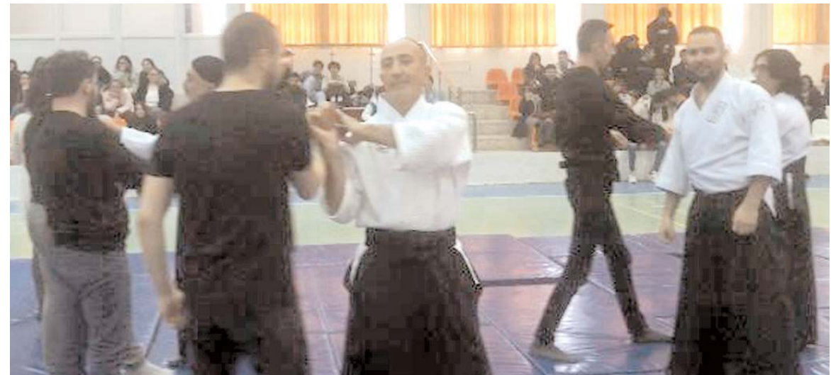
Seminer sonunda usta öğreticiler öğrencilere savunma sanatı konusunda uygulamalı bilgiler verdiler