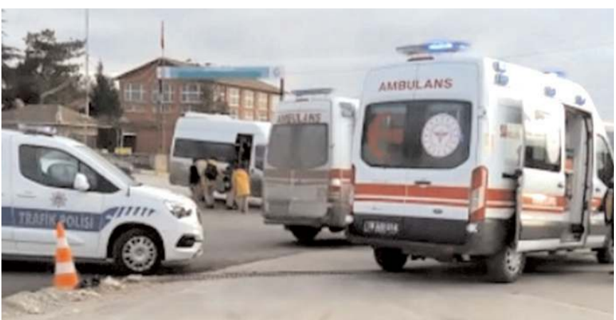
Yarahlılara ilk müdahaleyi 112 sağlık ekipleri yaptı.

Bu arada vatandaşlar da İskilip yolunda yeni açılan yolda sık sık kazaların yaşandığını belirterek, önlem alınması gerektiğini söyledi.