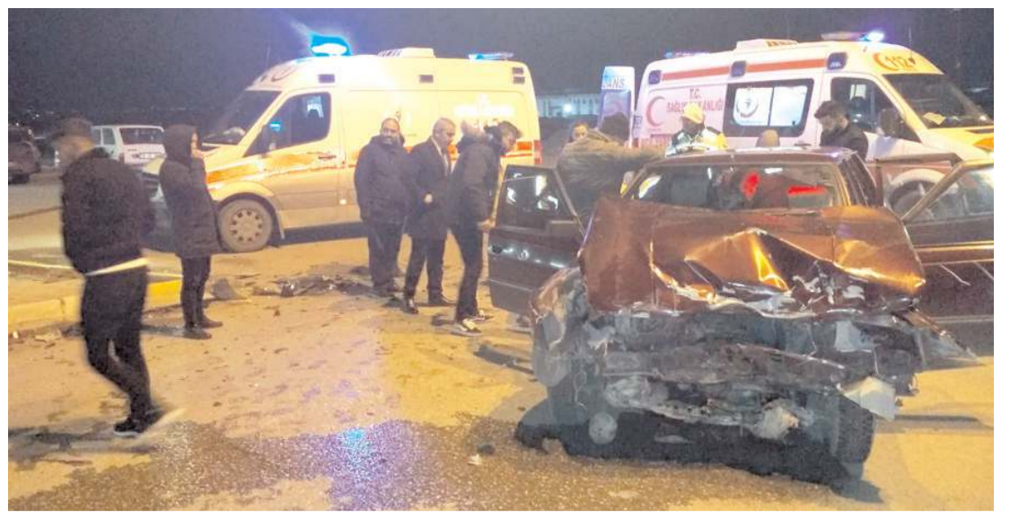
Kaza, İskilip yolunda bulunan benzinliğin çıkışında meydana geldi.