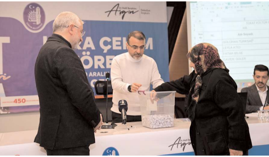
Geziye katılacak olan 450 kişi noter huzurunda çekilen kurayla belirlendi.