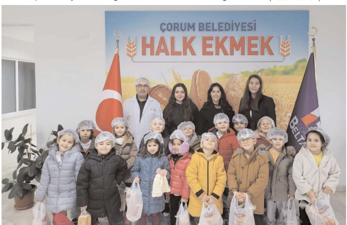
Ziyaretin anısına toplu fotoğraf çekinildi.

Ziyaret toplu hatıra fotoğrafı çekinilmesi ile sona erdi. (Haber Merkezi)