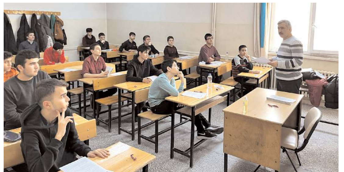
Yarışmanın Çorum bölümünde dereceye giren öğrencilere ödülleri 31 Aralık'ta Devlet Tiyatro Salonunda yapılacak Mekke'nin Fethi programında verilecek.

Siyer-i Nebi Yarışması sınav sonuçları 31 Aralık 2022 tarihinde www.efendimizinizinde.com adresinden açıklanacak. Dereceye giren öğrencilere ödülleri 31 Aralık'ta Devlet Tiyatro Salonunda yapılacak olan Mekke'nin Fethi programında verilecek. (Haber Merkezi)