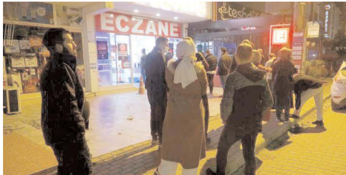
Eczanelerdeki yoğunluk nedeniyle vatandaşlar dışarıda soğukta sıra beklemek zorunda kalıyor.