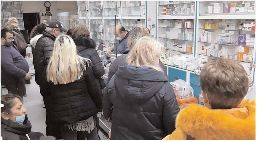
Vatandaşlar, nöbetçi eczanelerde yaşanan yoğunluktan şikayetçi.

Nöbetçi eczanelerde akşam saatlerinde ve hafta sonlarında ciddi kuyruk oluştuğunu ifade eden vatandaşlar; "Artık eczanelerde ilaç bulmak için eczane eczane geziyoruz. Antibiyotik bile zor bulunuyor. Üstüne bi de akşamları nöbetçi eczanelerde soğuk havada dakikalarca hatta saatlerce sıra bekliyoruz. Aradığımız ilaç yoksa başka nöbetçi eczane bulmak için Çorum'un başka köşesine kadar gidiyoruz. Arabası olmayan vatandaşlarımızın vay haline. Biz en azından üç olan nöbetçi eczane sayısının beş yada altıya çıkarılmasını, vatandaşların mağduriyetinin bir nebze de olsa giderilmesini bekliyoruz." ifadelerini kullandılar.