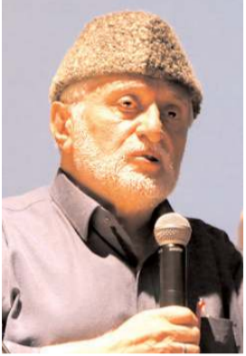
Muhittin Hamdi Yıldırım

Konferans konuşmacı olarak katılan Din Görevlileri Birliđi Derneđi Genel Bařkanı ve SP YİK Üyesi Muhittin Hamdi Yıldırım, "Şahısların kazanması için değil, prensiplerin kazanması için. O ülkenin temel kazanımları için. Deđişirse insan deđişir, ilkeler deđişmez. Milli görüş hareketi hem bulunduğu ülke de Türkiye'de hem de İslam alemindeki İslâmi hareketlere çatışma kültürünü deđil, uzlaşma kültürünü öğretmiştir. Haktan taviz vermeden öğretmiştir. Bu da bir hizmettir. Erbakan hoca başkaydı herkesle görüşebiliyordu diyorlar, řuan genel başkamızda öyle yapıyor. Kutuplaştırmacı bir dil kullanmıyor, şahısları itham edici bir dil kullanmıyor" dedi.