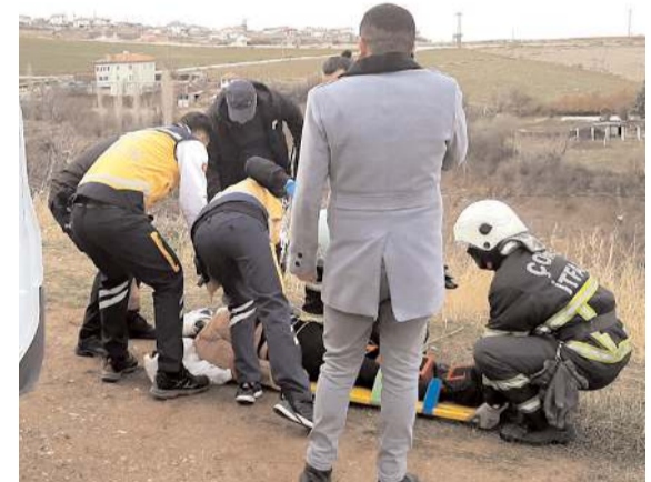
Yaralı kadına ilk müdahaleyi 112 sağlık ekipleri yaptı.

■ AK Parti MKYK Üyesi ve Çorum Milletvekili Ahmet Sami Ceylan, Çorumlu çiftçilerin tarım alanındaki beklentilerini ve teklif edilen projeleri sunmak üzere Tarım ve Orman Bakanı Prof. Dr. Vahit Kirişçi ile görüştü. * HABERİ 8'DE