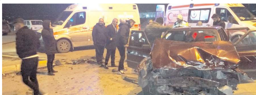
Kaza, İskilip yolunda bulunan benzinliğin çıkışında meydana geldi.