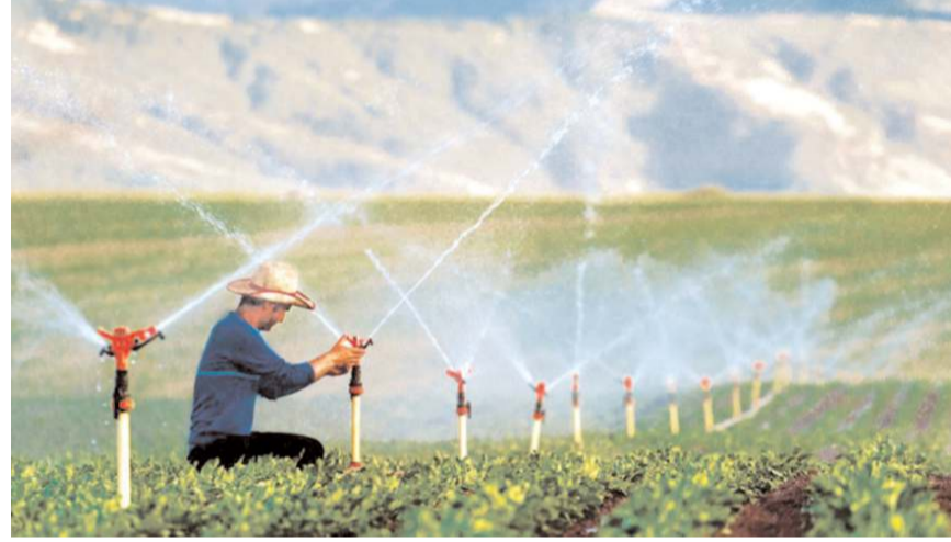
Hayata geçecek projelerle toplam 121 bin 100 dekar arazi suya kavuşacak.

Arazi Toplaştırma ve Tarla İçi Geliştirme Hizmetleri kapsamında Alaca'da toplam 21 bin 500 hektar alanda arazi toplulaştırma tescili yapılmıştır. Alaca ilçesinde 20 adet yerleşim biriminde tapu tescil işlemleri tamamlanmış ve hak sahiplerine tapuları dağıtılmıştır. Toplaştırma ve tarla içi geliştirme hizmetleri ile toprağımız daha kıymetli ve daha verimli olmaktadır." (Haber Merkezi)