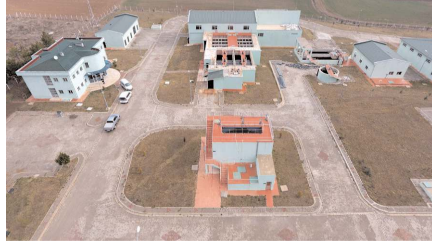
Alaca İçmesuyu Arıtma Tesisi projesi hayata geçirildi.