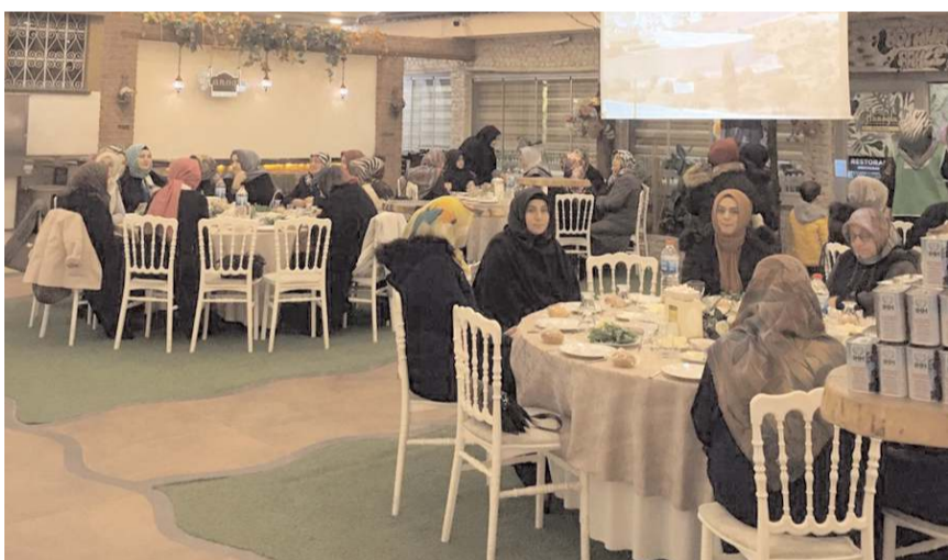
Program Hanoğlu Konağı'nda yapıldı.