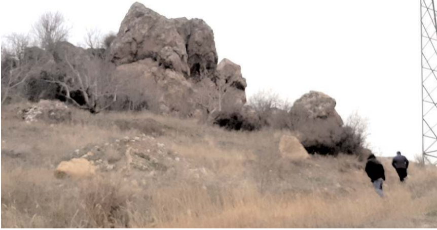
Olay Melik Gazi Bağları bölgesinde meydana geldi.

Vücudunda kırıklar bulunan S.Ö'nün tedavisi sürüyor.