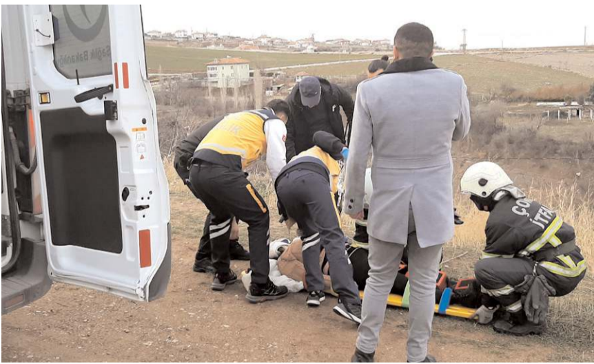
Yaralı kadına ilk müdahaleyi 112 sağlık ekipleri yaptı.