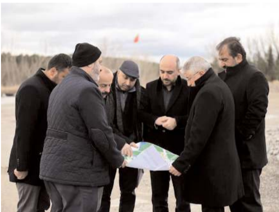
Başkan Aşgın, proje hakkında bilgi aldı.