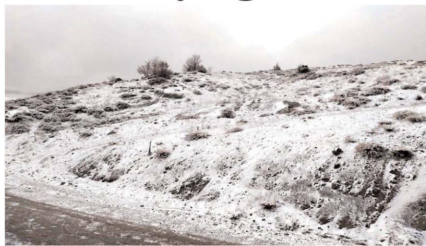
Yukarıbeşköz köyünde yoğun kar yağışı nedeniyle her yer beyaza büründü.

Sungurlu'ya bağlı bazı köylerde dün gece başlayan ve aralıksız devam eden yağmur, günün ilk saatlerinde yerini kar yağışına bıraktı. İlçeye bağlı Yukarıbeşköz köyünde yoğun kar yağışı nedeniyle her yer beyaza büründü.