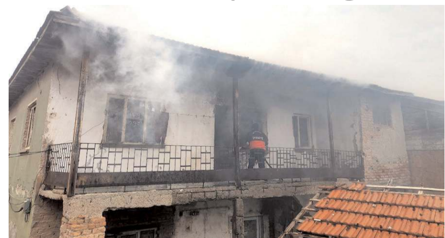
Yangın Denizhan Mahallesi Kirazlı Sokak'taki bir evde çıktı.

Nargile ateşinden başlamış olabileceği değerlendirilen yangın, evde hasara neden oldu. (AA)