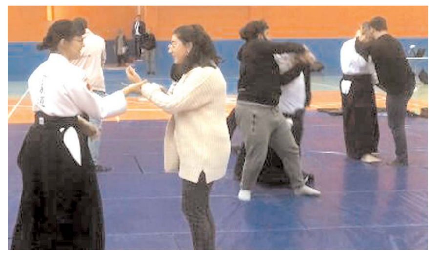
Bayan öğrencilerde usta öğreticilerden savunma sanatı bilgileri aldılar

nan savunma sanatı olduğunu belirten kurs hocaları daha sonra savunma için yapılması gerekenlere salonda uygulamalı olarak gösterdi ve öğrencilere uygulattı.