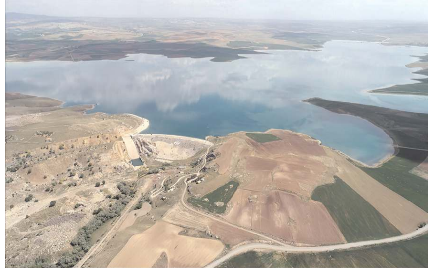
Koçhisar Barajı'nın hem tarımsal sulama hemde içme suyu açısından Alaca için önemi büyük.