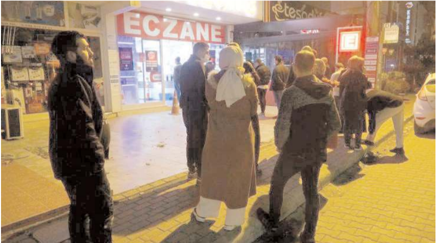
Eczanelerdeki yoğunluk nedeniyle vatandaşlar dışarıda soğukta sıra beklemek zorunda kalıyor.