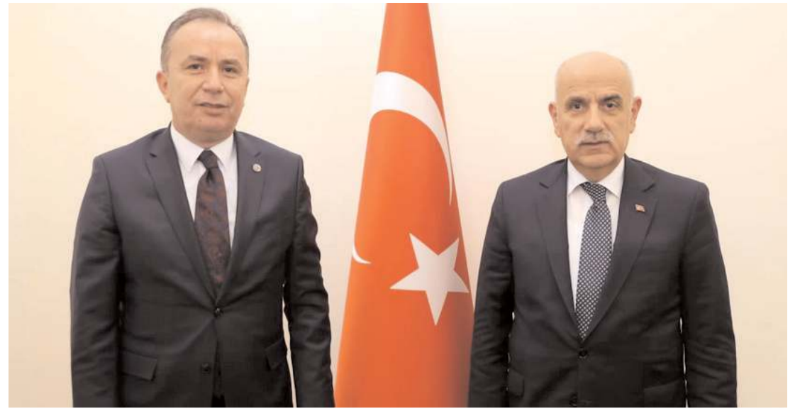
Milletvekili Ahmet Sami Ceylan, Tarım ve Orman Bakanı Prof. Dr. Vahit Kirişçi'yi ziyaret etti.