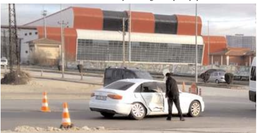
Kaza, İskilip yolunda yeni Kapalı Spor Salonu'nun karşısındaki benzinlik önünde meydana geldi.