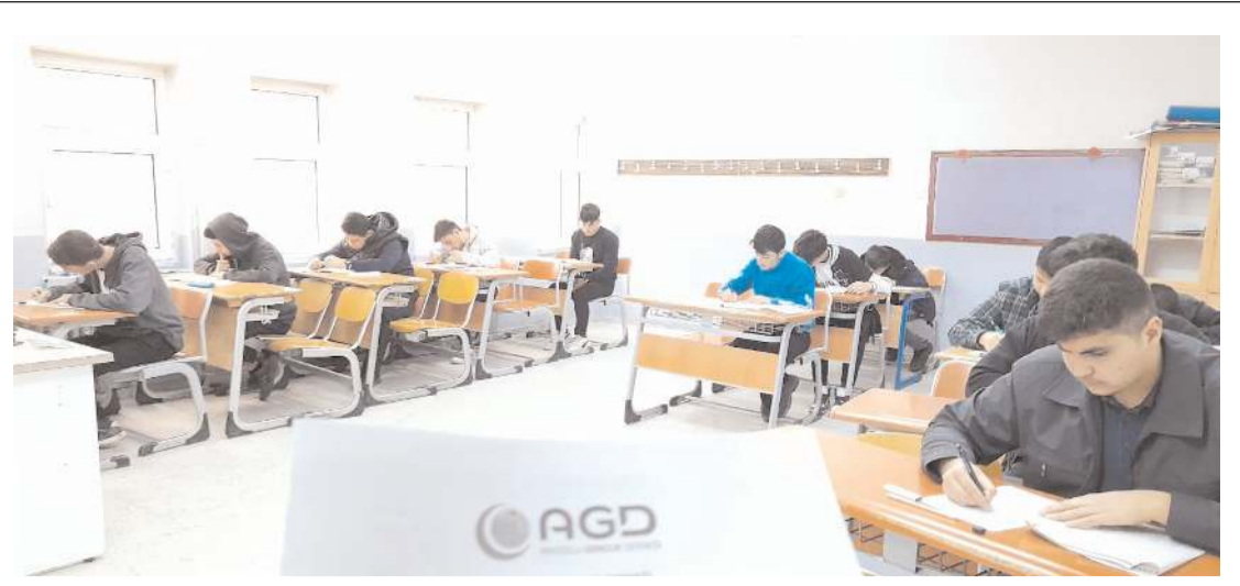
Yarışma Çorum'da merkezde 3 okulda ve 8 ilçede yapıldı.