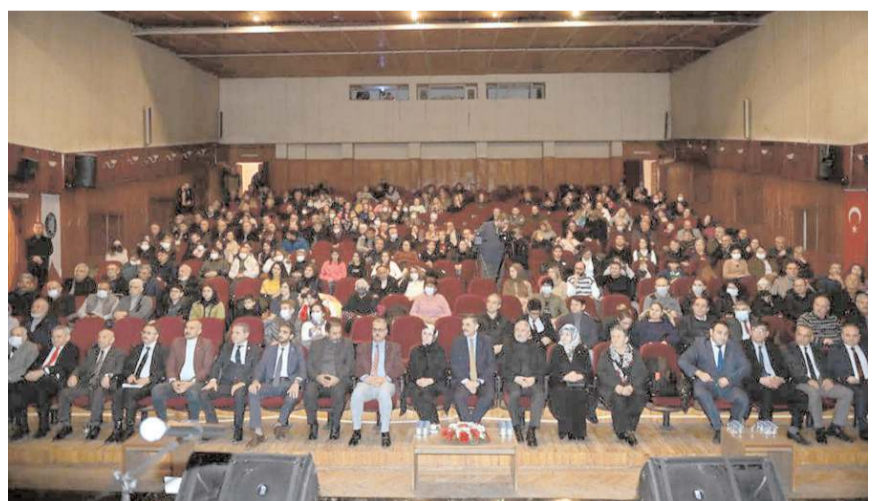
Anma programı Devlet Tiyatro Salonu'nda yapıldı.