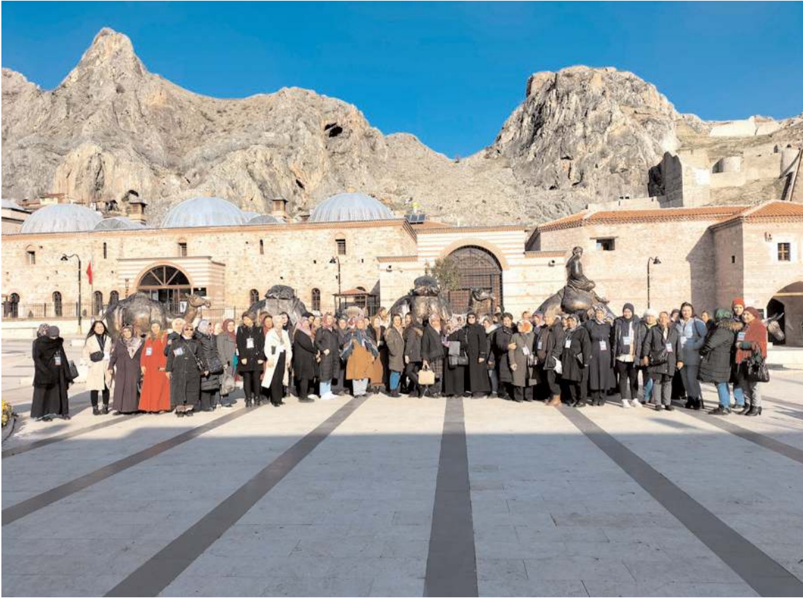
2 otobüsten oluşan ilk katile, Çorum Belediyesi tarafından Tokat'a götürüldü.