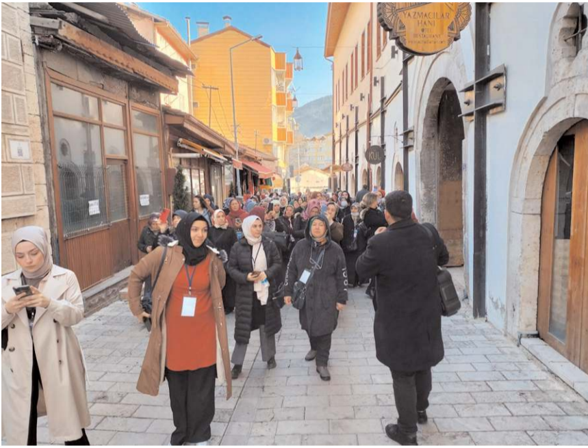
Katile Tokat'ın tarihi ve turistik yerlerini gezdi.

Tokat Kültür Gezileri kapsamında katilede yer alan kadınlar Tokat'ın tarihi ve doğal güzelliklerini yakından görme