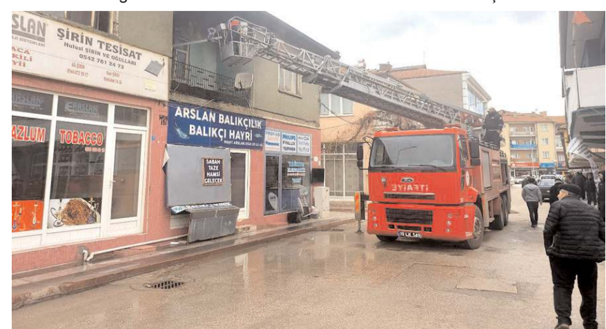
İtfaiye ekipleri yangını büyümeden söndürdü.