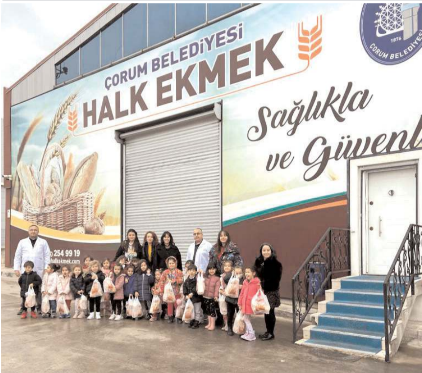
TED Çorum Koleji Anaokulu öğrencileri Halk Ekmek Fabrikasını gezdi.

TED Çorum Koleji Anaokulu öğrencileri Çorum Belediyesi Halk Ekmek Fabrikasını ziyaret etti.