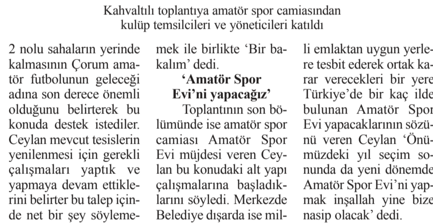
Kahvaltılı toplantıya amatör spor camiasından kulüp temsilcileri ve yöneticileri katıldı

2 nolu sahalardan yerinde kalmasının Çorum amatör futbolunun geleceği adına son derece önemli olduğunu belirterek bu konuda destek istediler. Ceylan mevcut tesislerin yenilenmesi için gerekli çalışmalarını başlatıldığını söyledi. Merkezde Belediye dışarda ise mil-