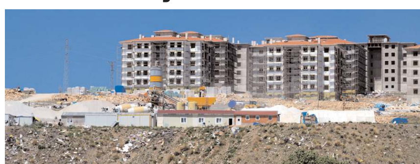
Silmkent TOKİ projesinde inşaat yüzde 85 seviyesine geldi.

Temeli 2018 yılında atılan Silmkent TOKİ'de konutların hak sahiplerine 2023 Nisan ayında teslim edileceği açıklandı. * HABERİ 2'DE