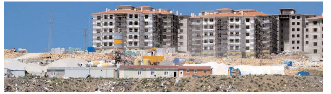
Silmkent TOKİ projesinde inşaat yüzde 85 seviyesine geldi.