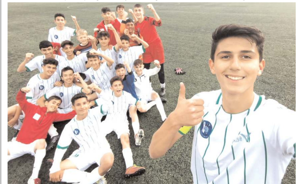
Mimar Sinan takım kaptanı şampiyonluğu garantiledikleri maçın ardından şampiyonluk selfisini böyle çekti

namağlup ve kayıpsız olarak zirvedeki yerini korurken diğer maçta Çimentospor'un HE Kültürspor'u 3-0 yenmesi ile bitime iki hafta kala şampiyonluğu garantiledi. Mimar Sinan 12 puanla lider durumda, HE Kültürspor 6 puanla ikinci Çimentospor 4 puanla üçüncü Hattuşa Gençlikspor ise 1 puanla dördüncü sırada bulunuyor.