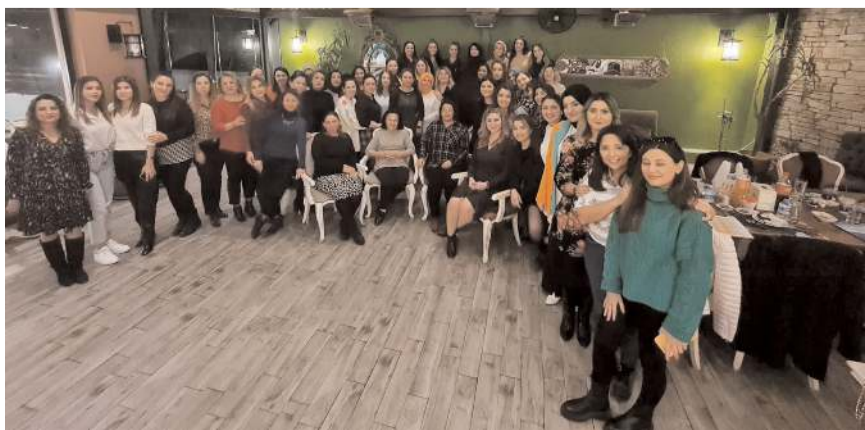
Toplantının sonunda hatıra fotoğrafı çekinildi.

Muhasebe esaslarına dayanarak kayıt süreçlerinin en doğru şekilde yapılması, belge ve bilgilerin toplanması, yevmiye defterine kayıt aşamaları ve gelir tablosu kalemleri ayrıntılı olarak dile getirildi. (Haber Merkezi)