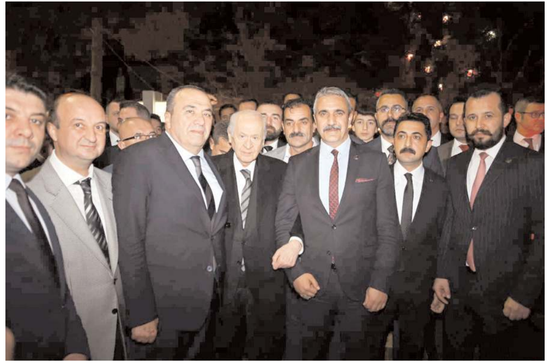
MHP Genel Başkanı Devlet Bahçeli, Çorum'da teşkilat yöneticileri ve partililer tarafından karşılandı.