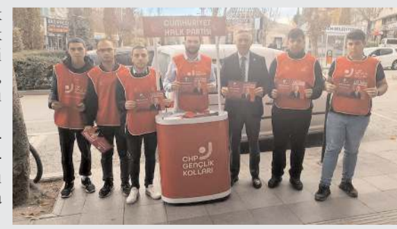
CHP Çorum İl Gençlik Kolları, Gazi Caddesi üzerinde stant açarak, "Sınır Namustur" adlı bildirimleri dağıttı.

"1 yıl önce ortaya koyduğumuz sınır politikalarımızı, Genel Başkanımız Sayın Kemal Kılıçda-roğlu'nun iradesiyle tekrarlıyoruz: Türkiye'ye yönelen kontrolsüz göçlere ilişkin 'sınır namustur' di-