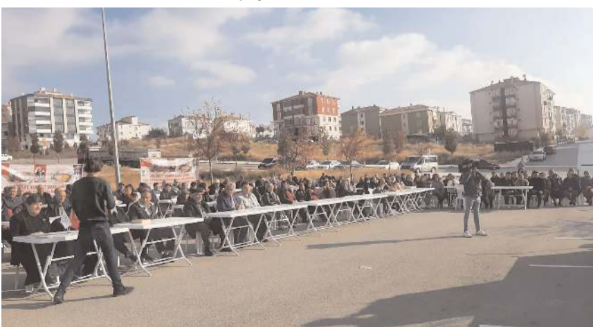
Şükür lokmasına yaklaşık 2.500 kişi katıldı.