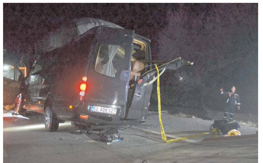
Kaza da minibüs hurdaya döndü.

dırıldı. Tiyatro oyuncularının dün Çorum Devlet Tiyatrosu Salonu'nda "Başbelası" adlı tiyatro oyununu sahneledikleri öğrenildi. (AA)