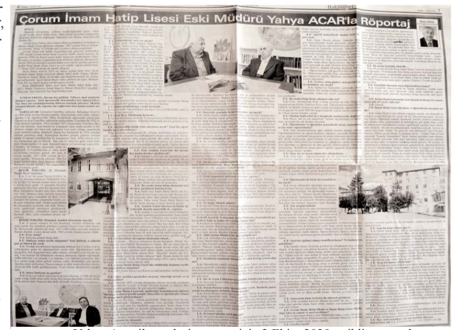
Yahya Acar ile söyleşi gazetemizin 2 Ekim 2020 tarihli sayısında yayınlamıştı.

Onu rahmetle, muhabbetle, saygıyla anmaya devam edeceğiz. Ailesine, yakınlarına, mesai arkadaşlarına ve talebelerine de baş sağlığı diliyoruz.