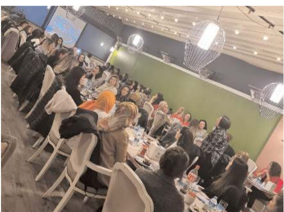
Toplantı Taçmak Makina sponsorluğunda Lila'da gerçekleşti.

Kadın muhasebeciler geleneksel hale getirdikleri toplantılara devam ediyor.