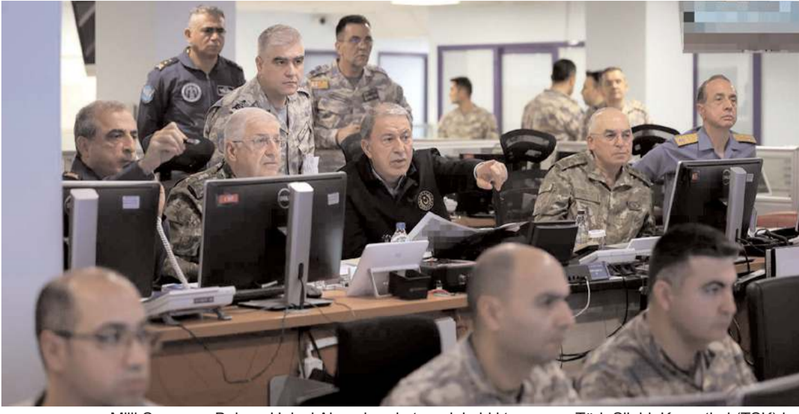
Milli Savunma Bakanı Hulusi Akar, harekat emrini aldıktan sonra Türk Silahlı Kuvvetleri (TSK) komuta kademesi ile 'Pençe-Kılıç Harekatı'nı, Hava Kuvvetleri Harekat Merkezi'nden sevk ve idare etti.