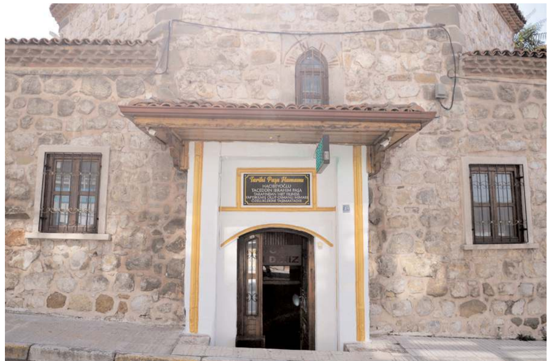
Hamamın erkek bölümünde saat 07.00 ile 23.00 arasında, bayan bölümünde ise saat 09.00 ile 18.00 arası hizmet veriliyor.