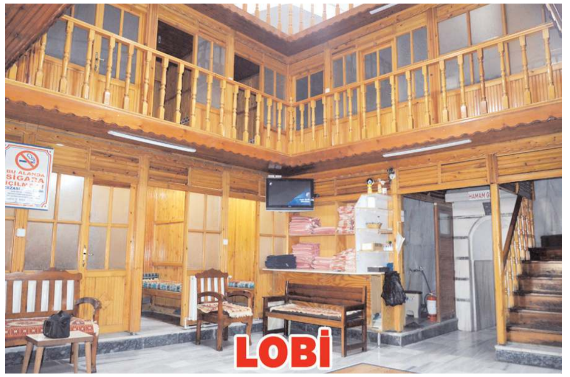
Paşa Hamamı yenilenen yüzüyle müşterilerine hizmet vermeye devam ediyor.