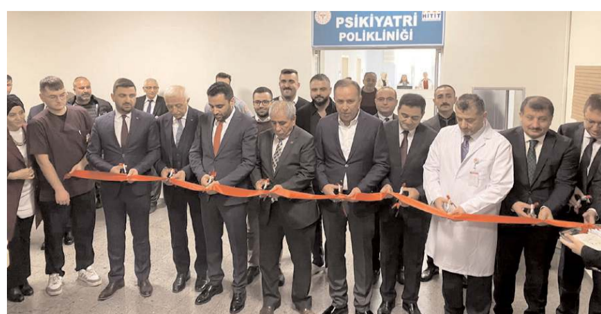
Açılış kurdelesini kesen protokol üyeleri tarafından kesildi.

Poliklinik ruhsal bozukluklar ile başvuran tüm erişkin hastalara hizmet verecek. Bölümde ayrıca ruhsal şikayetleri olan hastaların tanı değerlendirmesi, tedavi planlamasının yapılması ve yürütülmesi şeklinde hizmet verilecek.