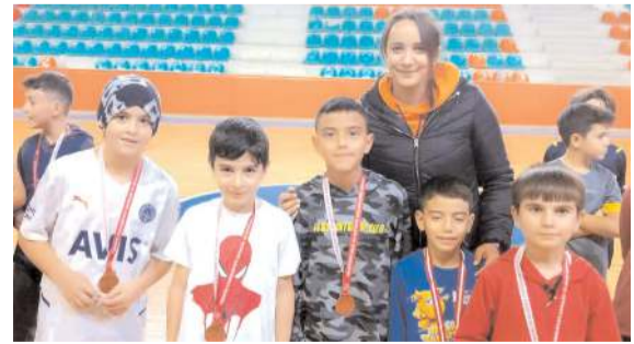
dereceye giren sporculara madalyaları antrenörlerden tarafından verildi.

Yapılan müsabakalar sonunda Gençlikspor A takımı birinciliği Gençlikspor B takımı ikinciliği Gençlikspor C takımı üçüncü olurken Basketbol İhtisas takımı ise dördüncülüğü kazandı. Müsabakalar sonunda