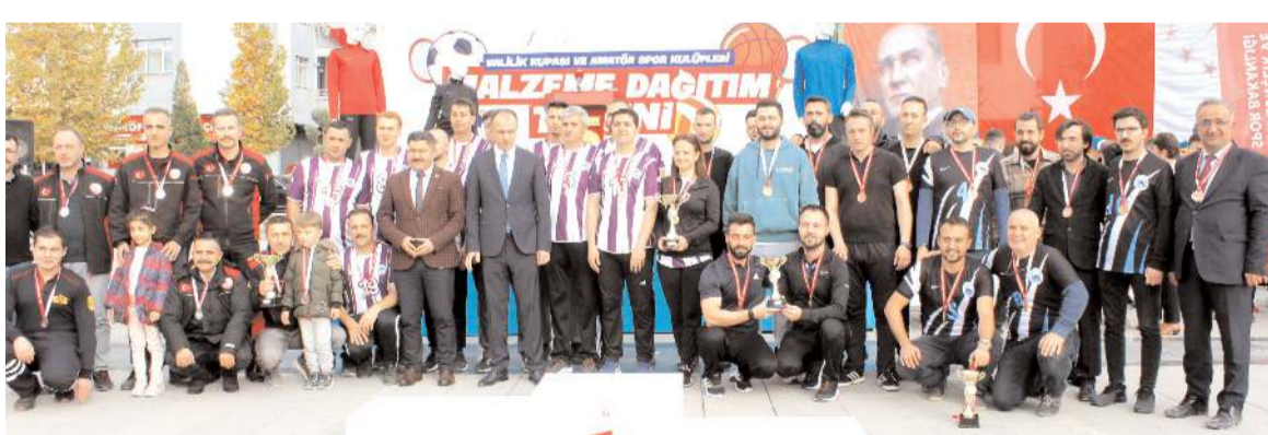
Erkekler voleybol turnuvasında dereceye girenlerin ödülleri Cumhuriyet Başsavcısı Ahmet Bektaş verdi