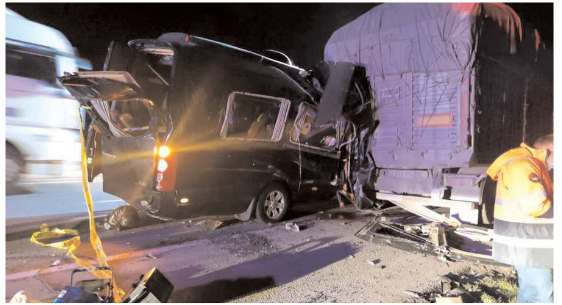
Kaza Merzifon'a bağlı Çaybaşı köyü mevkinde meydana geldi.

Aşıklar sazları ile deyişler söyledi ve program saat 17.00'den sonrada vakıf cem evi içinde çok geç saatlere kadar devam ederek lokma ikramı sunuldu ve Çorum'da yedincisi düzenlenen şükür lokmasına yaklaşık 2.500 kişinin katıldığı bildirildi. (Haber Merkezi)