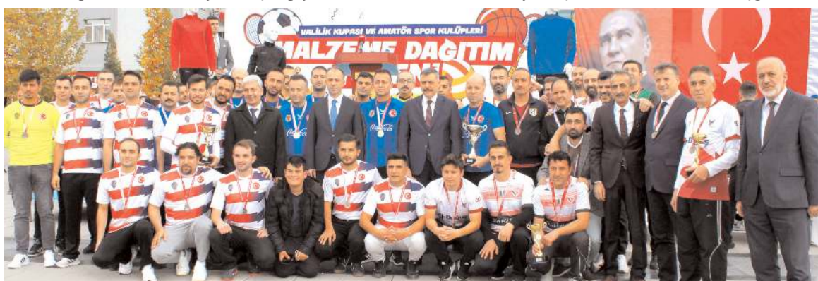
Valilik Kupası futbol turnuvasında dereceye giren takımların kupalarını Vali Mustafa Çiftçi verdi