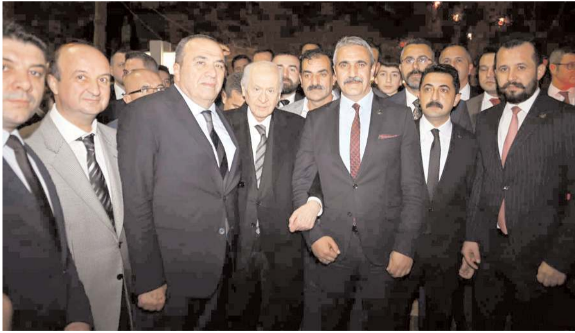
MHP Genel Başkanı Devlet Bahçeli, Çorum'da teşkilat yöneticileri ve partililer tarafından karşılandı.

Milliyetçi Hareket Partisi (MHP) Genel Başkanı Devlet Bahçeli, Samsun mitinginin ardından Ankara'ya dönerken uğradığı Çorum'da Ülkücülerle buluştu. Samsun mitinginde yoğun bir katılımı Çorum'u temsil eden MHP'liler miting dönüşü MHP Lideri Devlet Bahçeli'yi ağırladı. * HABERİ 4'DE