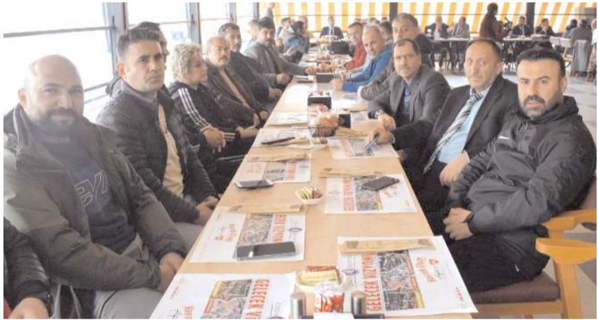
Toplantıya amatör camia başkanı yönetim, antrenör ve il temsilcileri yoğun ilgi gösterdi