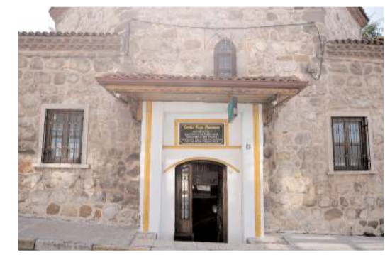
Hamamın erkek bölümünde saat 07.00 ile 23.00 arasında, bayan bölümünde ise saat 09.00 ile 18.00 arası hizmet veriliyor.