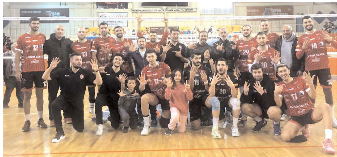
Türkiye 1. Voleybol liginin tek namağlup takımı Çorum Belediyesi Gençlikspor'un galibiyet pozunu

Temsilcimiz ligin dokuzuncu hafta da da evinde Hatay Erzin Yeşilkent takımını konuk edecek. Grupta son sırada bulunan rakibi önünde galip gelerek namağlup ünvanını sürdürmek istiyor.