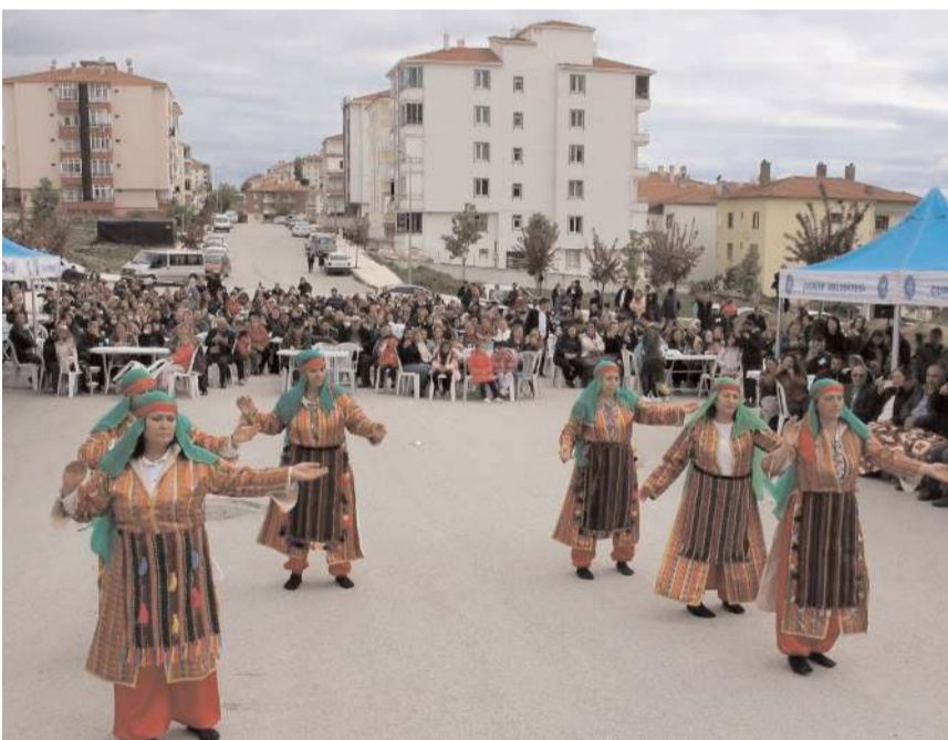
Saygı duruşunda bulunulması ve İstiklal Marşı'nın okunması ile başlayan etkinlikte semah döndü.