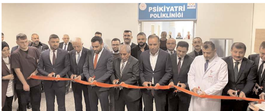
Açılış kurdelesini protokol üyeleri tarafından kesildi.

Hitit Üniversitesi Erol Olçok Eğitim ve Araştırma Hastanesi'nde Psikiyatri Polikliniği hizmete açıldı. * HABERİ 2'DE