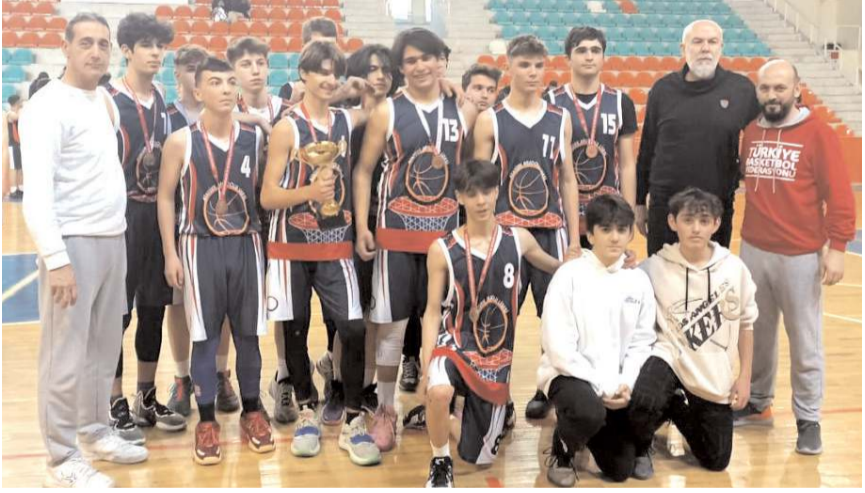
U 16 Erkekler Basketbol'da şampiyon olan Basketbol İhtisas takımı birincilik kupası ile

Atatürk Spor Salonu'nda oynanan il birin-