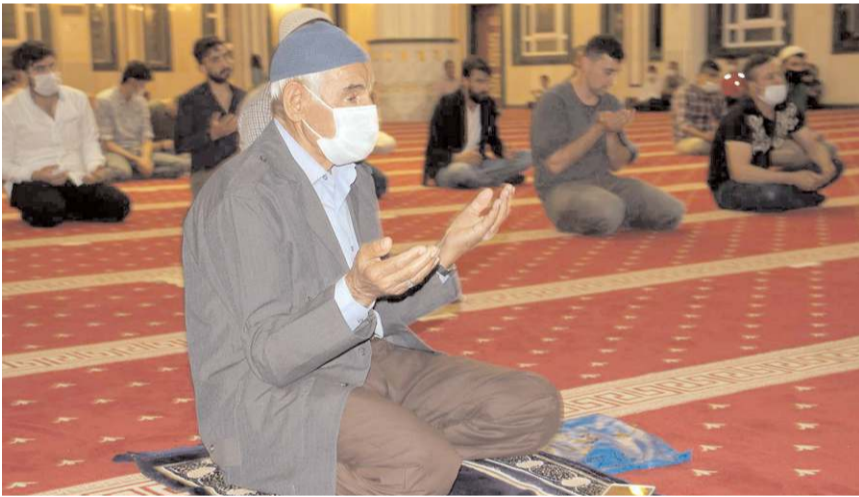
Türkiye'de 81 ilde Cuma namazında camilerde yağmur ve kar duası yapıldı.

Camileri dolduran binlerce ellerini semaya kaldırarak, "Kar ve yağmur olarak tecelli edecek ilahi rahmete muhtacız. Geliniz, hep birlikte rahman ve rahim olan Rabbimize yakaralım. Ey merhameti bol Allah'ım acziyetimizi sana arz ediyoruz. Bizlerden rahmetini esirgeme. Allah'ım semadan rahmet damlalarını indiren sensin. Üzerimize bereketli kar ve yağmur indir. Topraklarımızı ve bizi suya hasret bırakma" diyerek yağmur ve kar yağması için dua etti.