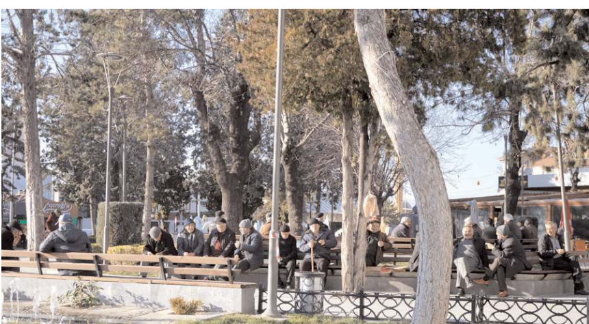
Sıcak havayı fırsat bilen vatandaşlar parklara akın etti.

Meteoroloji verilerine göre Çorum'da sıcak havanın önümüzdeki günlerde devam etmesi bekleniyor.