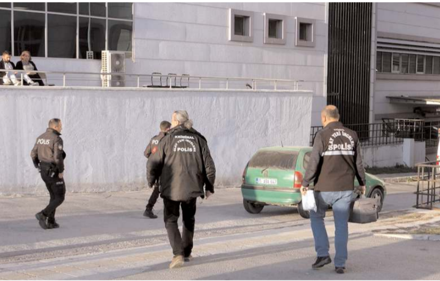
Bebeğin cenazesi otopsi yapılmak üzere hastane morguna kaldırıldı.