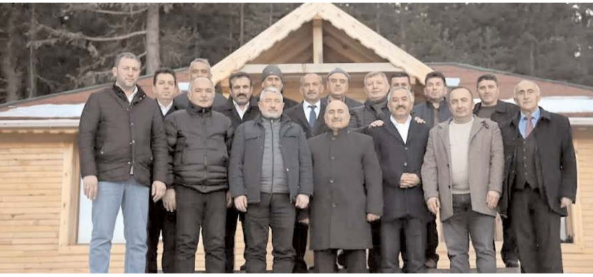
Toplantıda 2023 seçimlerine yönelik istişare ve değerlendirmelerde bulunuldu.

Cumhur İttifakı belediye başkanları Bayat'ta buluşarak istişare ve değerlendirmeler ve toplantısı gerçekleştirdi.