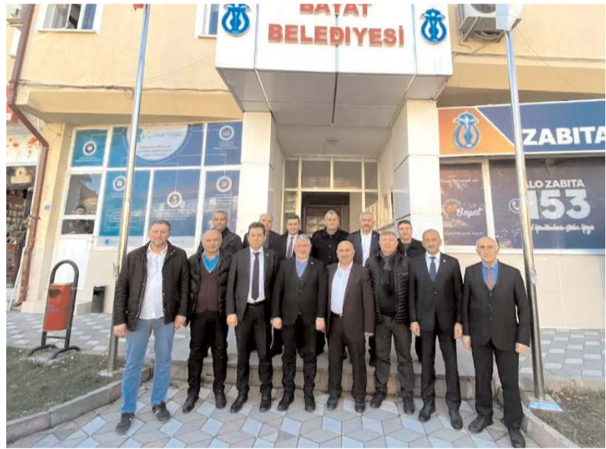
Başkanlar Bayat Belediyesi'ni ziyaret etti.

Çorum Belediye Başkanı Dr. Halil İbrahim Aşgın da yaptığı konuşmada Türkiye Yüzyılı'nın başarısını, üretimin, yerli ve yenilikçi milli teknolojinin, güven ve istikrarın yüzyılı olacağını belirterek, "Cumhurbaşkanımız, liderimiz Sayın Recep Tayyip Erdoğan, yeniden Cumhurbaşkanlığı olacak, yine mazlumların umudu, ezilenlerin, hor görülenlerin sesi olacak. Günü kurtarmak değil, geleceği inşa etmek için Türkiye Yüzyılı'nı hep beraber inşa edeceğiz. Allah birliğimizi, dirliğimizi ve muhabbetimizi daim etsin" dedi.