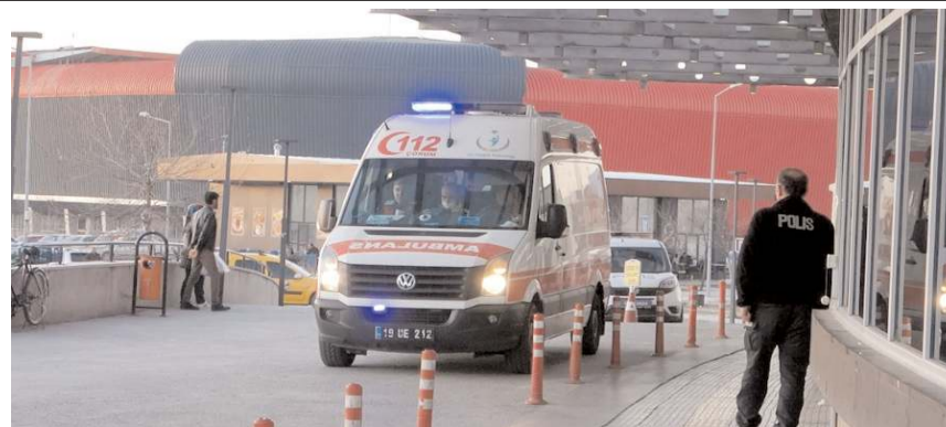
Hastanede yapılan kontrolde bebeğin öldüğü belirlendi.