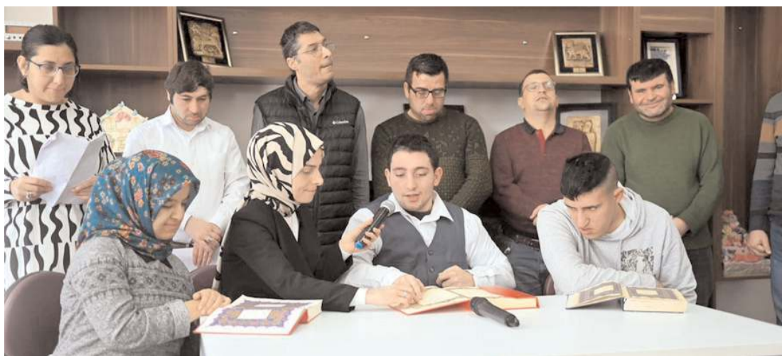
Özel öğrenciler Engelli Eğitim Merkezi'nde Kur'an-ı Kerim okumayı öğrendi.