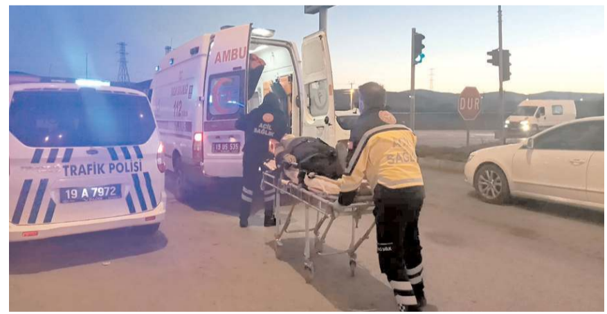
Yaralıları olay yerinde yapılan ilk müdahalenin ardından hastaneye kaldırıldı.

Sungurlu'da hafif ticari araç ile otomobilin çarpışması sonucu meydana gelen trafik kazasında 7 kişi yaralandı.