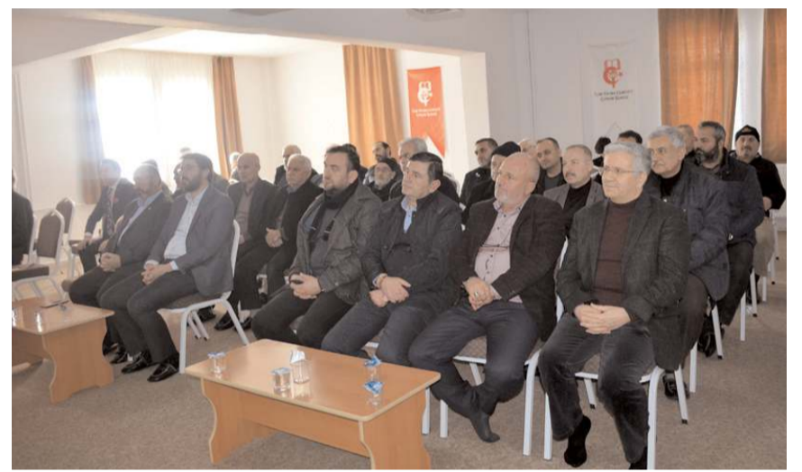
Genel kurul Buhara Yükseköğretim Erkek Öğrenci Yurdu'nda yapıldı.