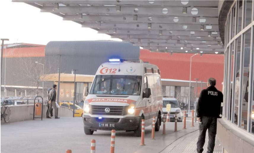
Hastanede yapılan kontrolde bebeğin öldüğü belirlendi.

Çorum'da 6 aylık bir bebek, yatağında ölü bulundu.