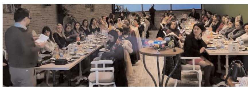
Kadın muhasebeciler 13. toplantısını yaptı.

Kadın muhasebeciler, KADMUDER olarak eğitimlerine daha da büyüterek devam edeceklerini ve artık bir dernek olarak sosyal sorumluluk projelerinde yer alacaklarını ifade ettiler. (Haber Merkezi)