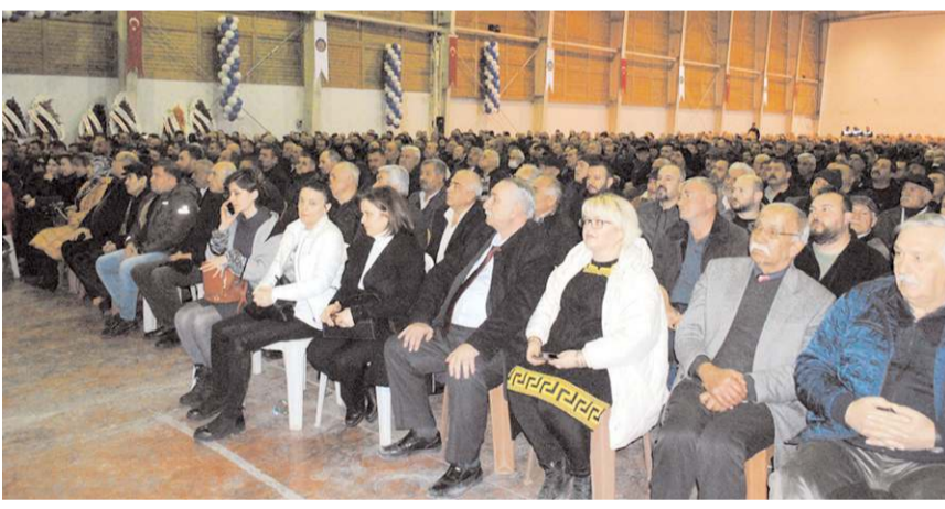
Genel kurul TSO Fuar Kompleksi'nde yapıldı.