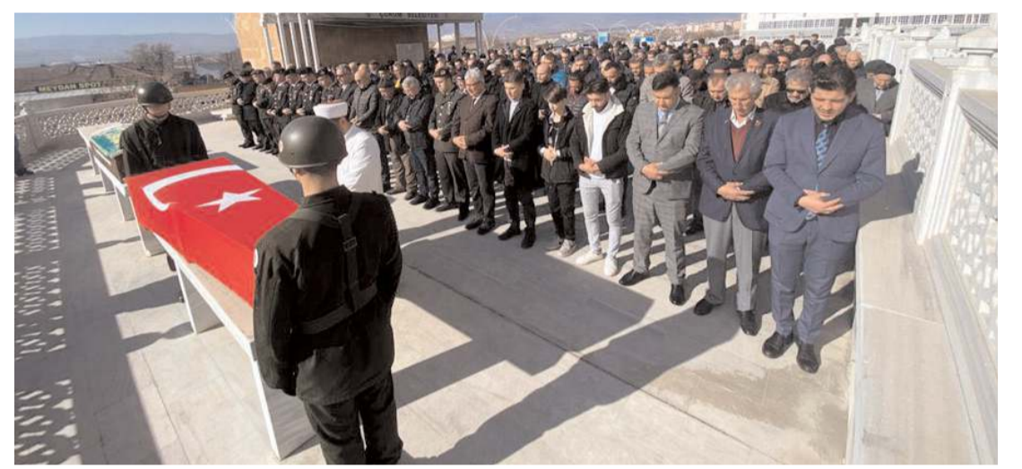
Kılınan cenaze namazının ardından merhumun cenazesi Hıdırlık Mezarlığı'nda toprağa verildi.