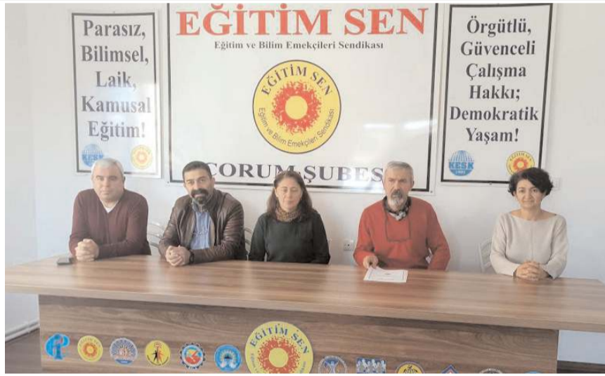
Eğitim Sen Çorum Şube Yürütme Kurulu basın açıklaması yaptı.

ÖMK sonrasında bir okulda aynı derse girip, tamamen aynı müfredatı işleyen ve 25 yıllık kıdemli olan üç öğretmeninden kariyer basamakları sınavına girmeyen normal bir öğretmenin 14 bin 480 TL, uzman öğretmenin 16 bin 930 TL, başöğretmenin 19 bin 385 TL maaş alması haksız ve adaletsiz bir uygulamadır. Aynı işi yapan öğretmenler arasında sadece derece ve kademe bakımından maaş farklılığı olabilir. Bu kadar yüksek maaş farklılığının olduğu bir eğitim sisteminde eşitlikten, adaletten ve nitelikli eğitimden bahsetmek mümkün değildir.