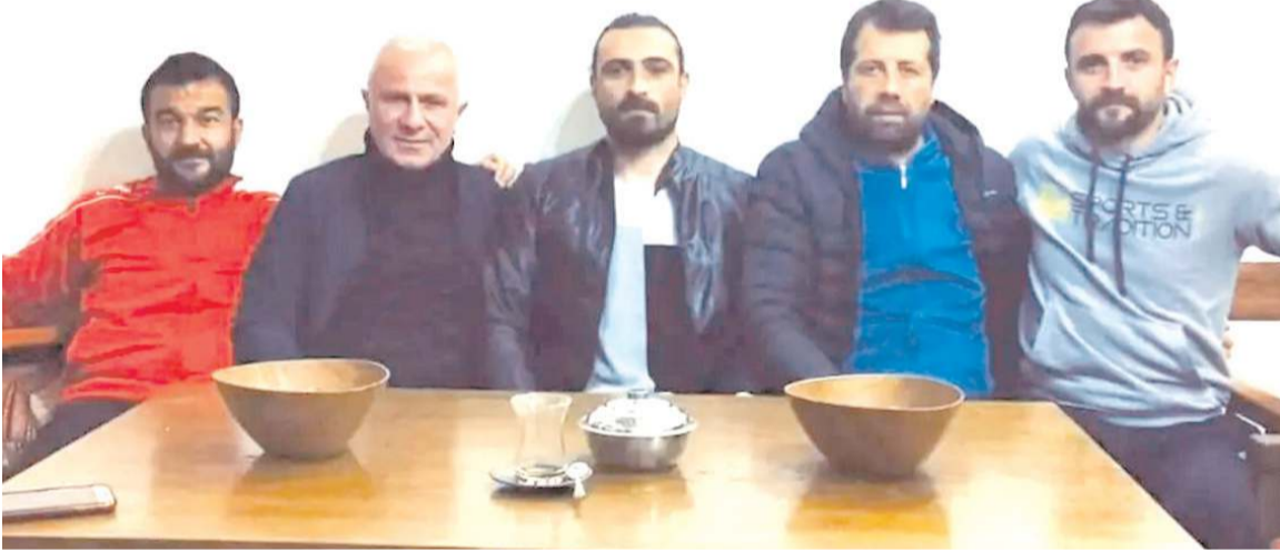
Çorumspor eski futbolcularından oluşan tertip komitesi yapacakları eylemler için bir araya geldiler

Sosyal medyadan yapılan bu açıklamaya çok sayıda destek yorumu geldi. Bu alana yapılacak millet bahçesi için ihaleyi kazanan firmaya yer tahsisini yapan Çorum Belediyesi yıkıma ise başladığı görüldü. Bugün başlayacak ve hafta boyu farklı etkinliklerle konuya dikkat çekmek isteyen Tertip Komitesi tüm Çorum halkını bu haklı tepkiye destek vermek için saat 11'de ailece sahada olmaya davet etti.