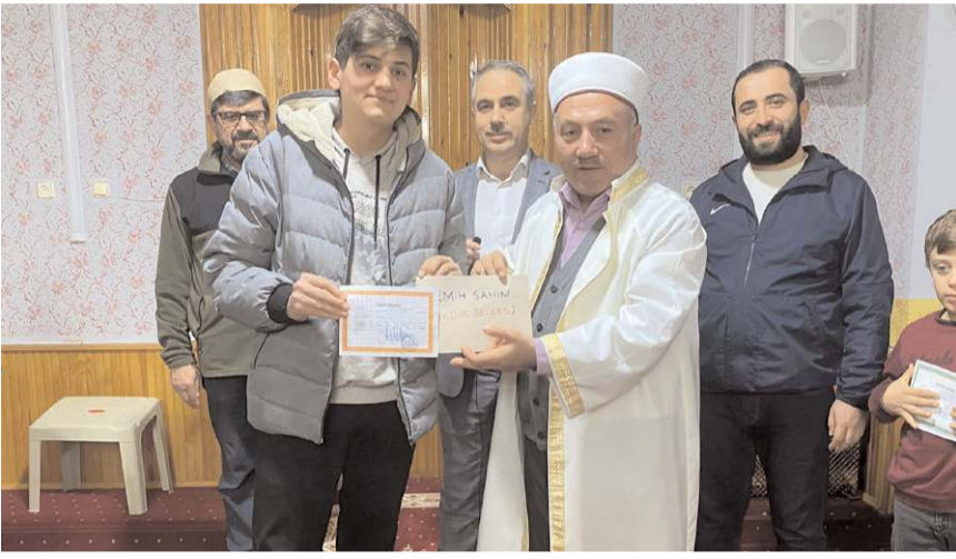
Başarılı öğrencilere karne hediyesi verildi.