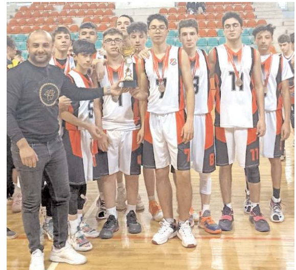
İkinci olan Gençlikspor A takımının kupasını alırken