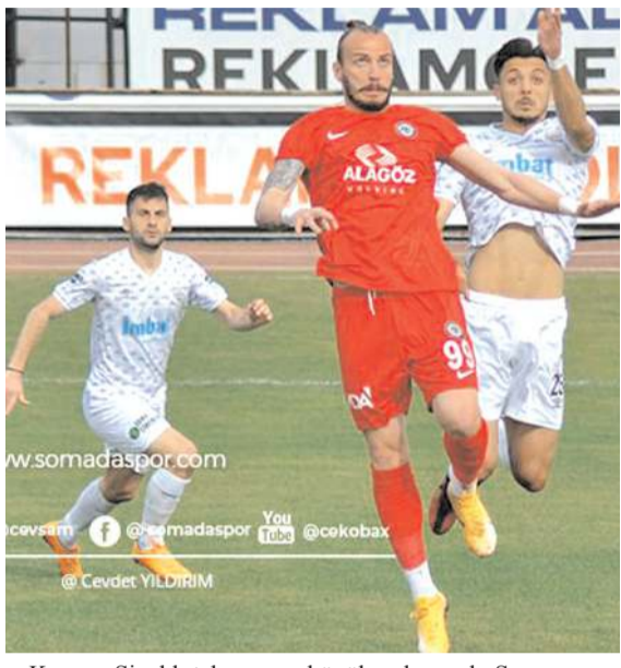
Kırmızı Siyahlı takımın en büyük gol umudu Somaspor deplasmanında da beklentilerin çok uzağında kaldı