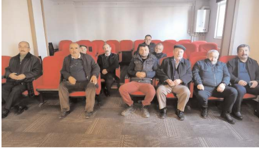
Toplantıya partililerde katıldı.