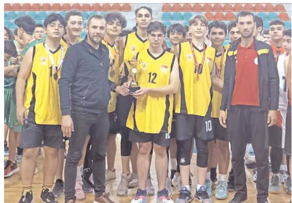
Üçüncülüğü Gençlikspor B takımı kazandı