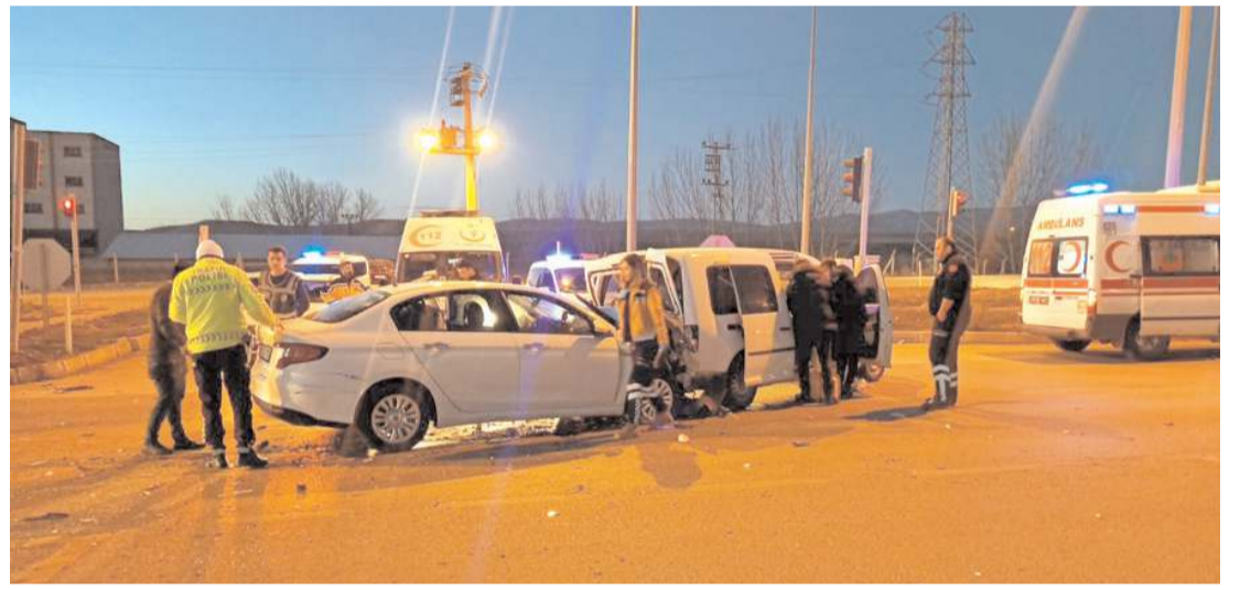
Kaza, Ankara-Samsun karayolunda meydana geldi.

Olayla ilgili soruşturma devam ediyor.