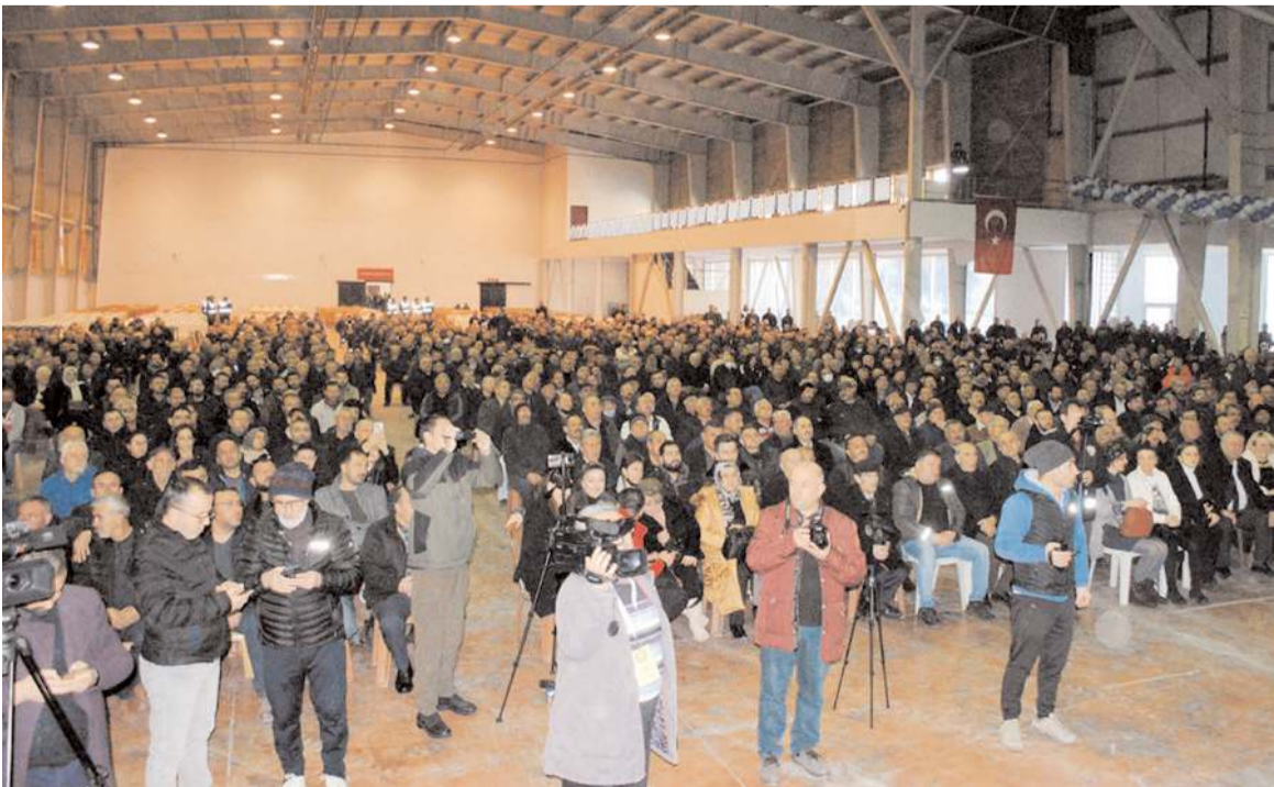
Genel kurula katılım yüksek oldu.