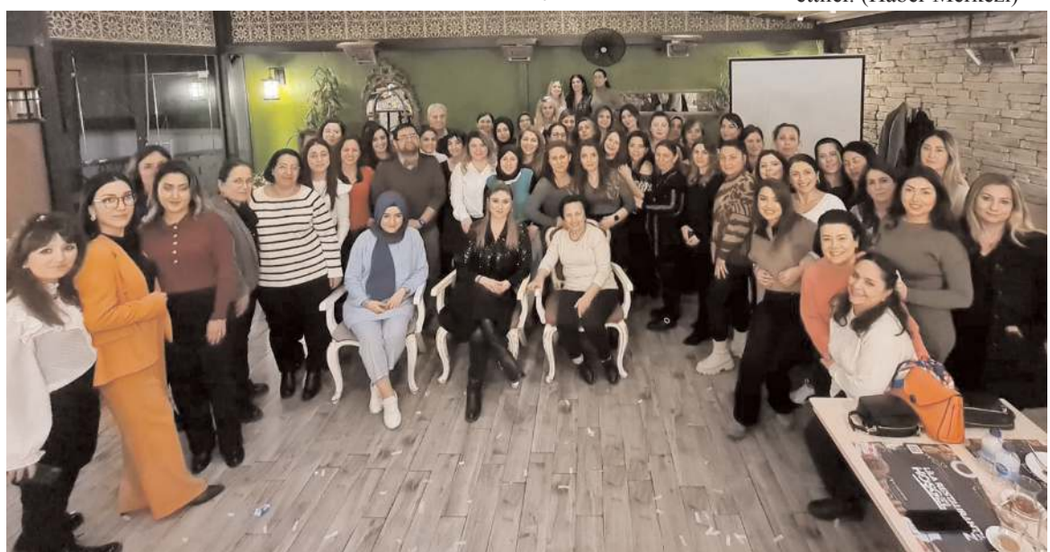
Kadın muhasebeciler dernekleşmenin mutluluğunu yaşadılar.