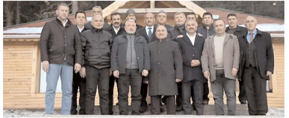
Toplantıda 2023 seçimlerine yönelik istişare ve değerlendirmelerde bulunuldu.

Çorumlu vatandaşlar için mevcut hükümete her seçim döneminde verilen oy oranlarına bakıldığında halkımızın bu oy oranlarına göre alınan hizmetleri hiç hak etmedikleri aşikar. Tabiri yerindeyse kepçeyle oy alan hükümet çay kaşığıyla hizmet veriyor. Bunu çevre ilere baktığımızda daha net olarak anlamaktayız. Gelecek Partisi'nin de içinde bulunduğu Millet İttifakı olarak Mayıs ayında yapılacak olan seçimlerde iktidara gelerek, içinde bulunduğumuz tüm sorunları aşacağıımıza da yürekten inanıyoruz" dedi. (Haber Merkezi)