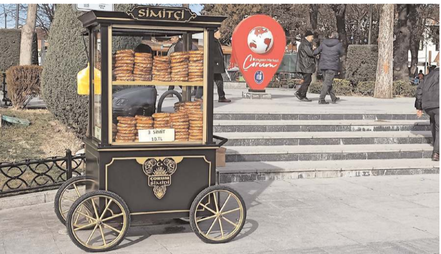
Seyyar simit arabaları hijyenik ve estetiğe uygun hale getirildi.