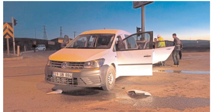
Kaza nedeniyle trafik bir süre durdu.