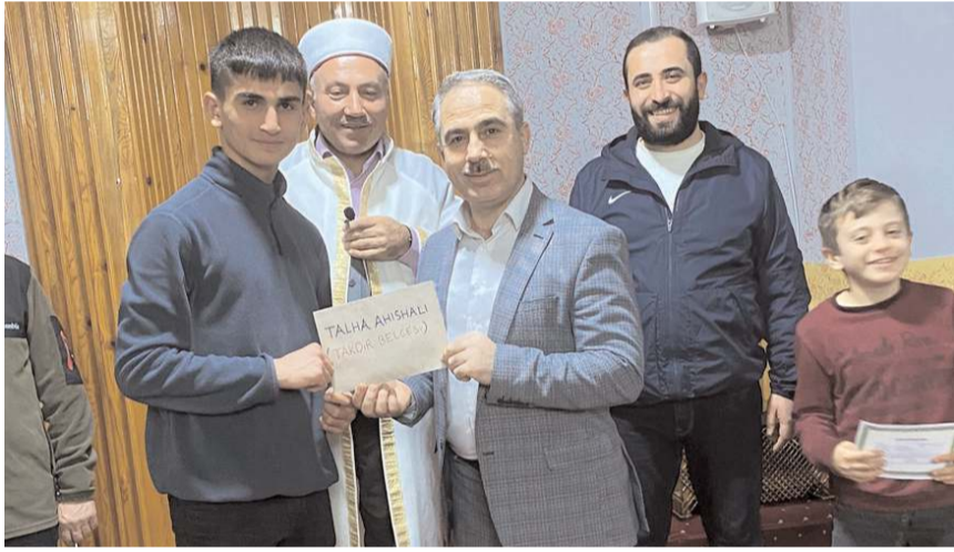
Öğrenciler cami görevlilerine hediyelerden dolayı teşekkür ettiler.