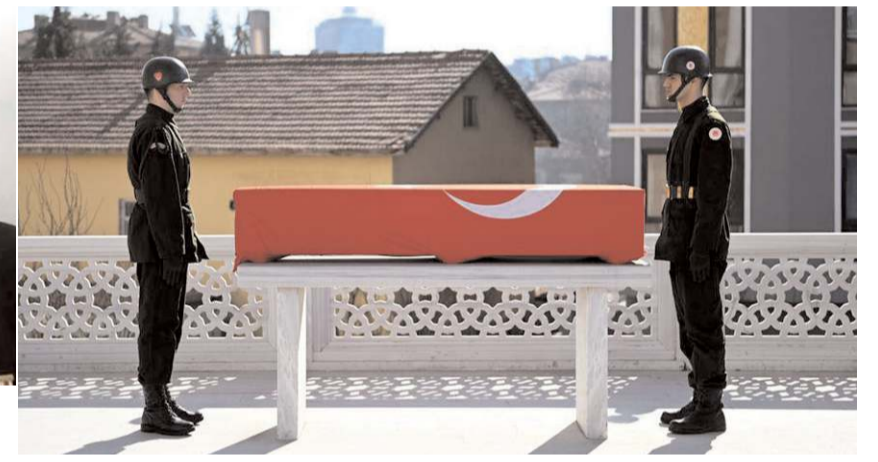
Ahmet Yağlı, için Akşemseddin Camii'nde cenaze töreni yapıldı.