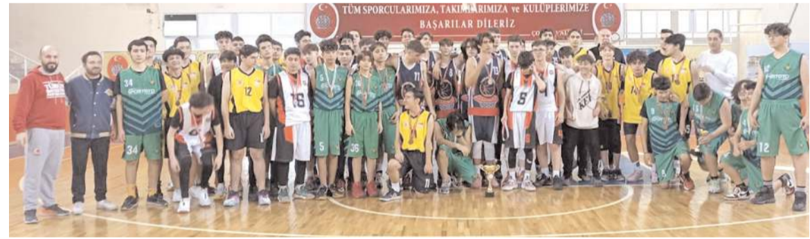
Erkekler Basketbol U 16'da dereçeye giren kulüplerin sporcuları ödül töreninde toplu halde görüntü

Sinop'ta oynanan maçın ilk setinde oyuna girmekte zorlanan temsilcimiz seti 25-15 kaybetti. İkinci sette ise savunmada az hata yapan ve hücumda daha etkili olan Osmancık Belediyespor final bölümüne kadar karşılıklı gitti son bölümdeki hataları ile seti 25-21 kaybetti. Üçüncü sette zorlu geçen mücadeleyi 25-23 kazanan Osmancık Belediyespor maça ortak oldu. Dördüncü sette ise ilk sayılarda oyundan erken kopan temsilcimiz seti 25-14'lik skorla kaybedince maçtan 3-1 galip ayrılan ev sahibi takım üç puanın sahibi oldu.