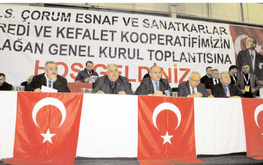
Genel kurulda ilk olarak divan heyeti belirlendi.