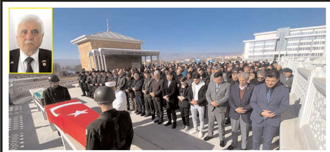
Kılınan cenaze namazının ardından merhumun cenazesi Hıdırlık Mezarlığı'nda toprağa verildi.