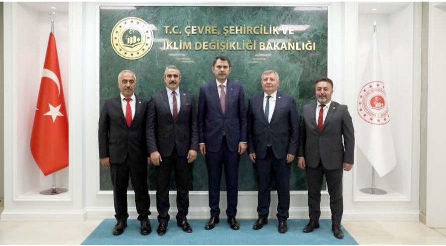
MHP heyeti Çevre, Şehircilik ve İklim Değişikliği Bakanı Murat Kurum'u ziyaret etti.