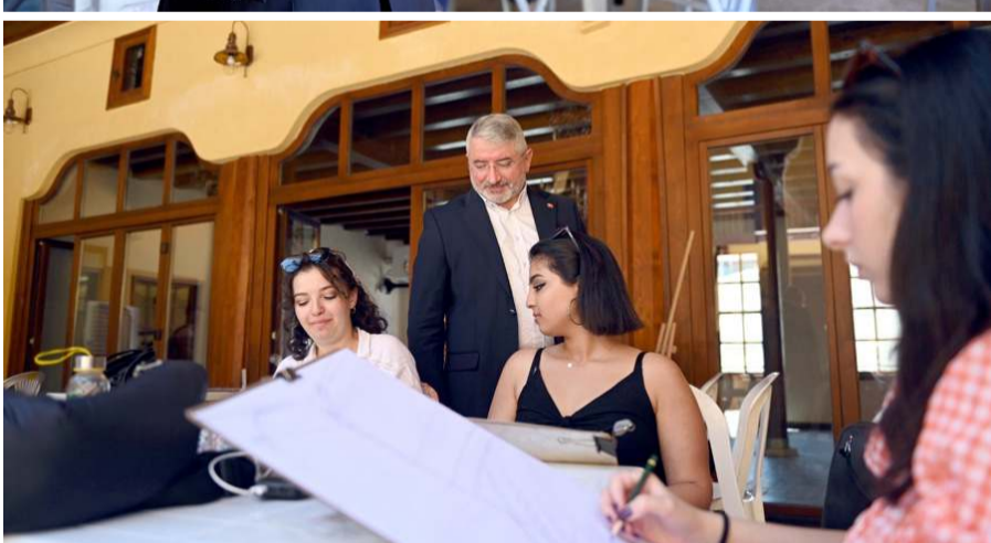
Velipaşa Han kahvesi yeniden açılacak.