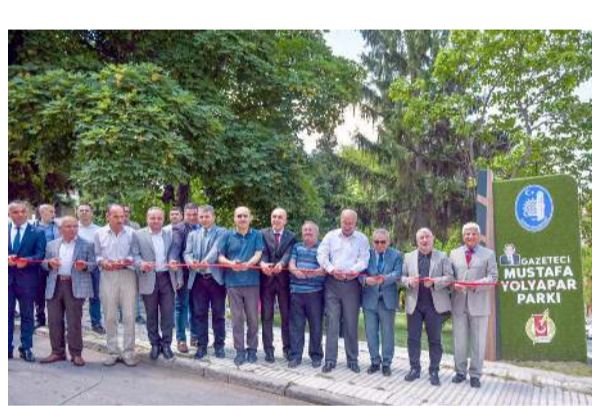
Konuşmaların ardından park kurdele kesilerek hizmete açıldı.

Türkiye Gazeteciler Konfederasyonu (TGK) Genel Başkanı Nuri Kolaylı, sansürün kaldırılışının yıldönümü olan 24 Temmuz Basın Dayanışma Günü nedeniyle yaptığı açıklamada, basının sansürle değil, özgürce yayın yapması halinde topluma katkı sağlayacağını söyledi.