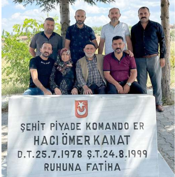
Ziyarete şehidin ailesinde katıldı.