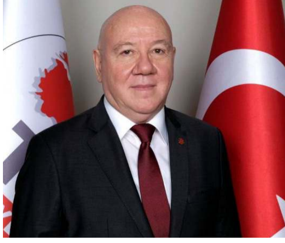
Türkiye Gazeteciler Konfederasyonu Genel Başkanı Nuri Kolaylı

"Türk basınında sansür, gazetecilerin 24 Temmuz 1908 tarihinde gerçekleştirdiği onurlu direniş sonucu kalkmış, ancak süreç içerisinde yapılan çeşitli yasal düzenleme ve baskılarla yeniden gündeme gelmiştir. Basınımız 2022 yılının 24 Temmuz'una da, geçtiğimiz yıllarda olduğu gibi birçok sorunla giriyor. Bu sorunların başında da, TBMM'de görüşülmesi ertelenen 40 maddelik "Basın Kanunu ile Bazı Kanunlarda Değişiklik Yapılmasına Dair Kanun Teklifi" gelmektedir. Kanun Teklifi, Türkiye Gazeteciler Konfederasyonu olarak dile getirdiğimiz mesleki sorunların bir bölümüne çözüm getirecek içerikte olsa da, birçok maddede düzenleme yapılması gerekmektedir. Kanun değişikliğinin gerekçesi olan "dezenformasyon"; dünyanın ortak, önemli ve acil çözüm bekleyen sorunlarından biridir. Dezenformasyon sadece iktidarların değil, iktidarı ve muhalefetiyle tüm ülkemizin sorunudur ve mutlaka mücadele edilmelidir. Bu soruna yasal düzenleme ile çözüm aranmasını destekliyoruz. Ancak bu düzenleme, basın özgürlüğünü engelleyici yönde olmamalıdır. Kanuna ilişkin karar verici konumdaki tüm taraflara, basının sansürlenerek değil,