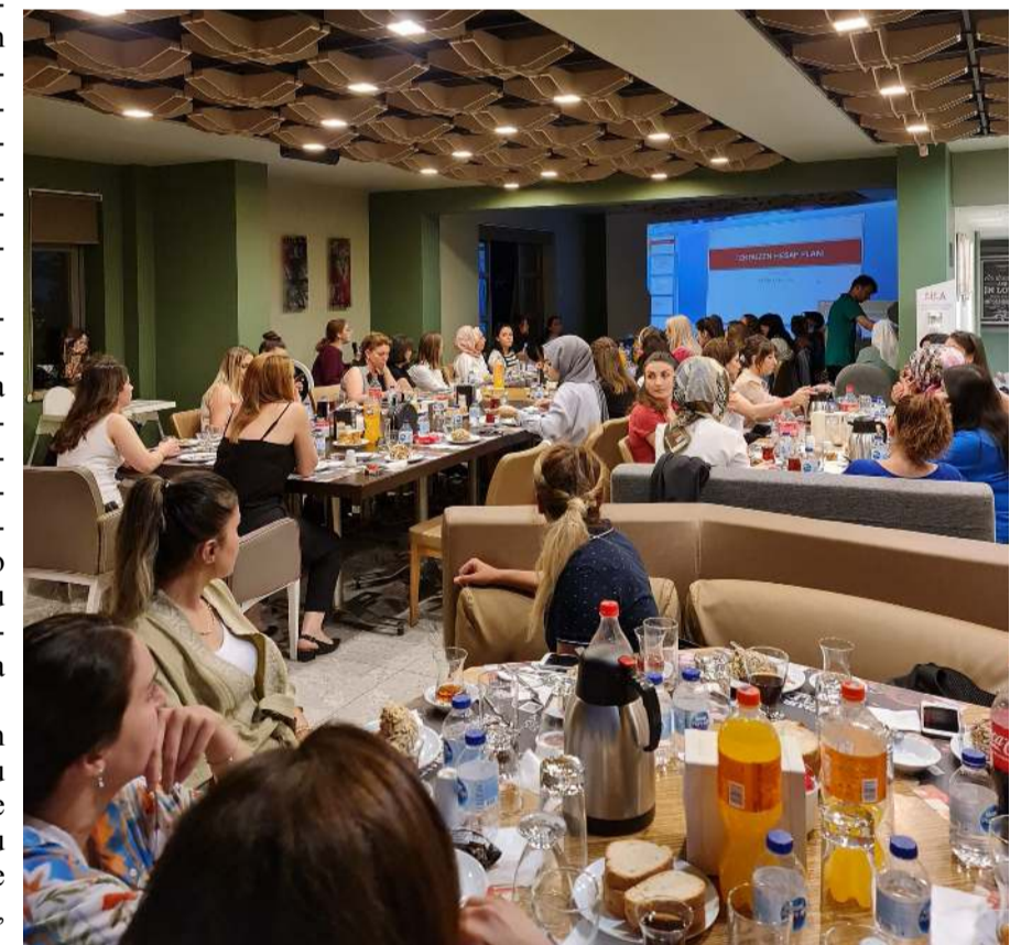
Toplantı Şamlıoğlu Toyota Plaza sponsorluğunda Lila'da gerçekleştirdi.