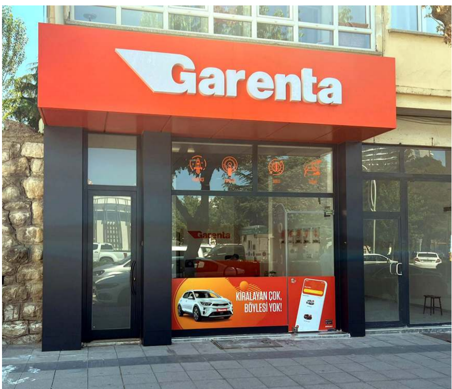
Çorum Garenta, İnönü Caddesi No:95/A adresinde bulunuyor.

Garenta Çorum bayisi Gülabibey Mahallesi İnönü Caddesi No:95/A adresinde bulunuyor. (Haber Merkezi)