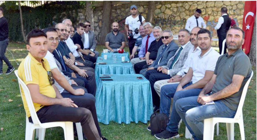
Törene çok sayıda basın mensubuda katıldı.