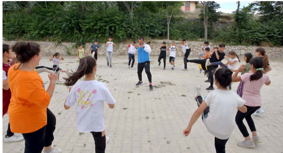
Öğrenciler okul dışında da anretim yapıyorlar.