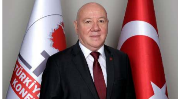
Türkiye Gazeteciler Konfederasyonu Genel Başkanı Nuri Kolaylı

TGK Genel Başkanı Nuri Kolaylı'dan 24 Temmuz açıklaması: