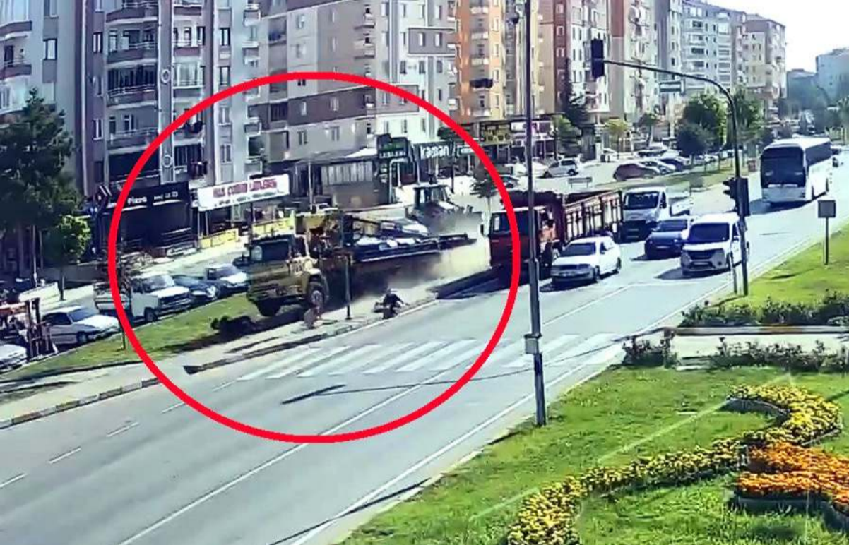
İki kişinin ölümüyle sonuçlanan feci kaza, İlim Yayma Kavşağında meydana geldi.