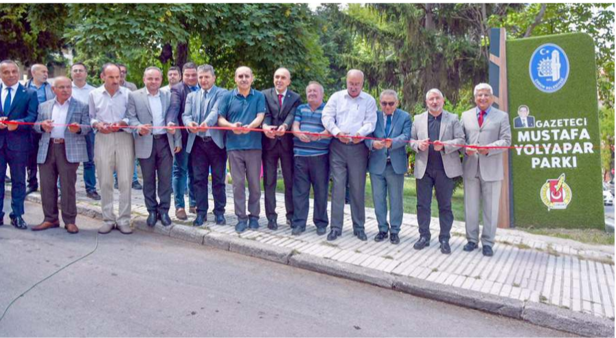
Konuşmaların ardından park kurdele kesilerek hizmete açıldı.

Mustafa Yolyapar'ın isminin parka verilmesi Çorum Gazeteciler Cemiyeti'nin talepleri doğrultusunda 1 Şubat 2022 tarihli Belediye Meclisi Toplantısında karar altına alınmıştı.