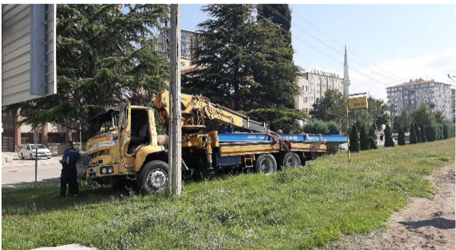
Kazaya neden olan kamyon PT Başmüdürlüğü önünde durabildi.