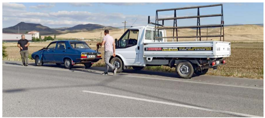
Kaza, Sungurlu-Kırıkkale karayolunun 4. kilometresinde meydana geldi.

Sungurlu'da meydana gelen trafik kazasında 1 kişi yaralandı. Kaza, Sungurlu-Kırıkkale karayolunun 4. kilometresinde meydana geldi. Ankara'dan Sungurlu istikametine seyir halinde olan H.N. yönetimindeki 06 N 8407 plakalı otomobil, bir başka araca arkadan çarptı. Kazada çarpmanın etkisi ile savrulan otomobilin sürücüsü H.N. yaralandı. Yaralı sürücü kaza yerine gelen ambulansla Sungurlu Devlet Hastanesi'ne kaldırılarak tedavi altına alındı. Kazayla ilgili olarak başlatılan soruşturmanın devam ettiği öğrenildi. (İHA)