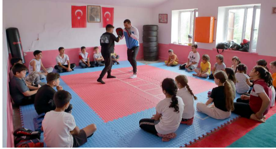
Kursu öğrencilerin ilgisi yüksek oldu.