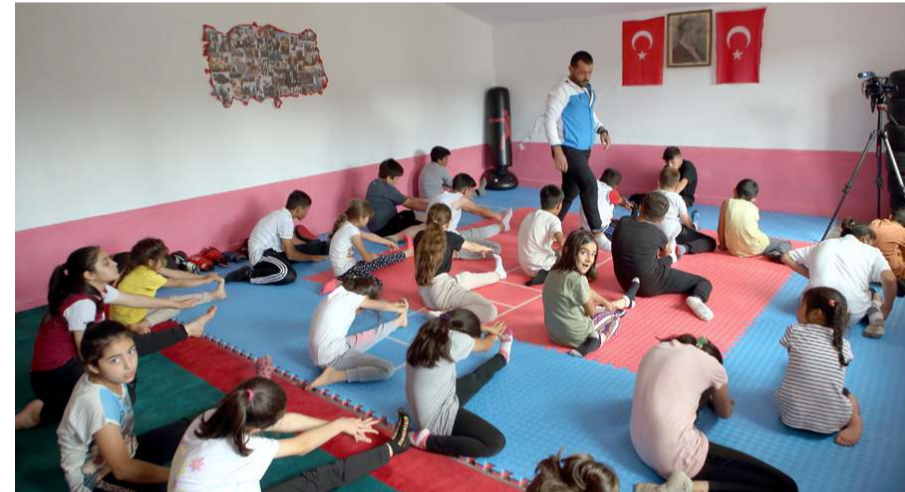
Kursta 5-14 yaş aralığında 30 çocuk, her gün kick boks antrenmanı yapmaya başladı.