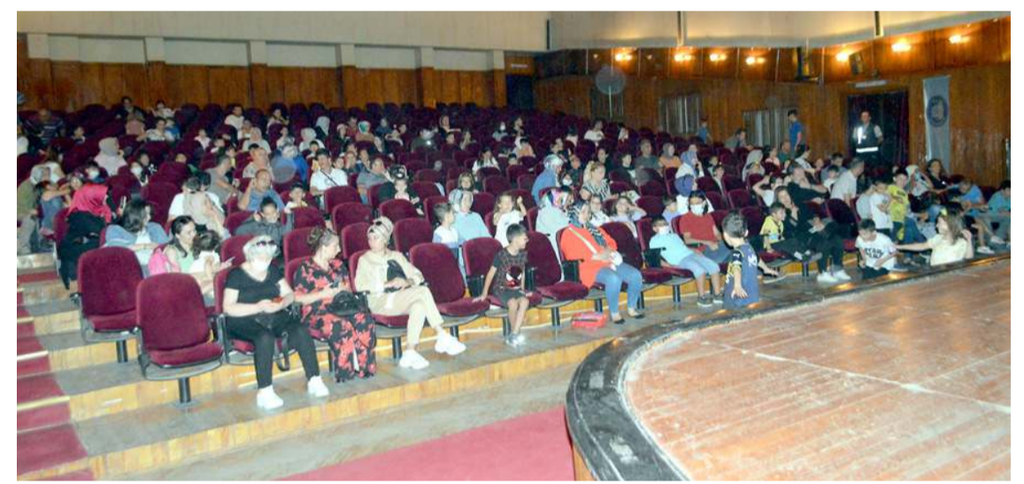
Çocuklar oyunda neşeli anlar geçirdiler.

Gösteri çocukları güldürürken aileleri de eğlendirdi.