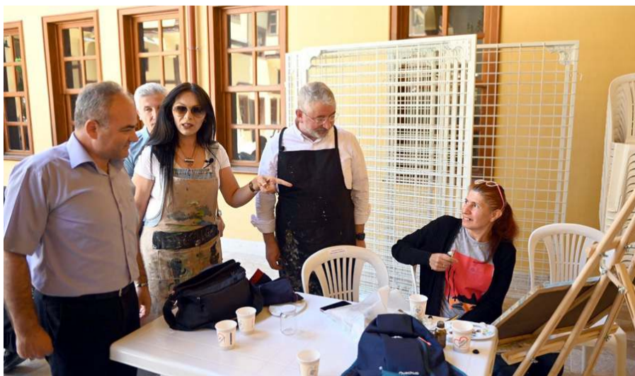
Bedri Rahmi Eyüpoğlu'na atfen 80 yıl sonra yine aynı yerde sanatçılarımız izlenimlerini tuallerine döküyorlar.