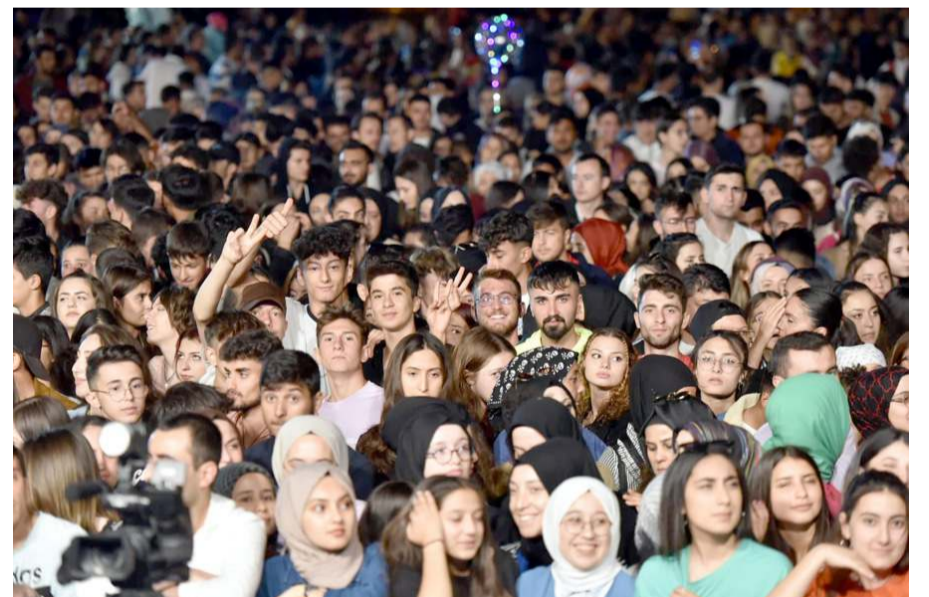
Konsere gençlerin ilgisi yüksek oldu.