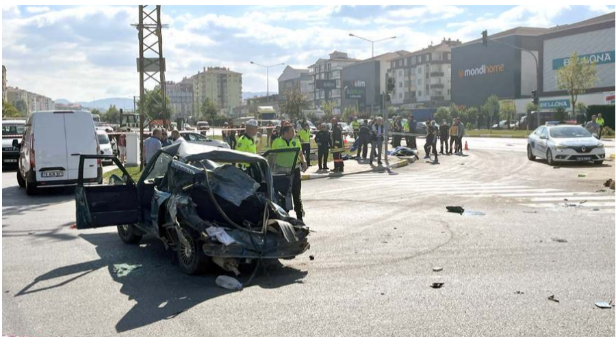
Freni boşalan tır bir otomobilde arkadan çarptı.