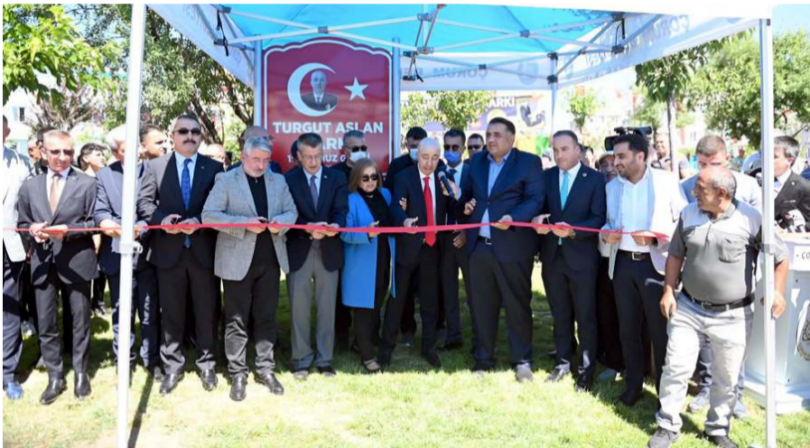
Yapılan duanın ardından parkın açılış kurdelaşı kesildi.