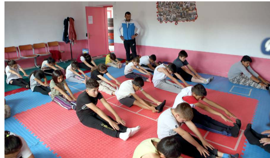
Öğrenciler de kick boks sporunu beğendiler.