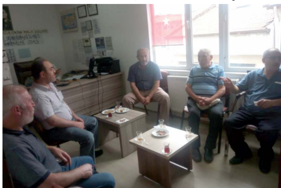
Toplantıya yorgancı esnafı katıldı.