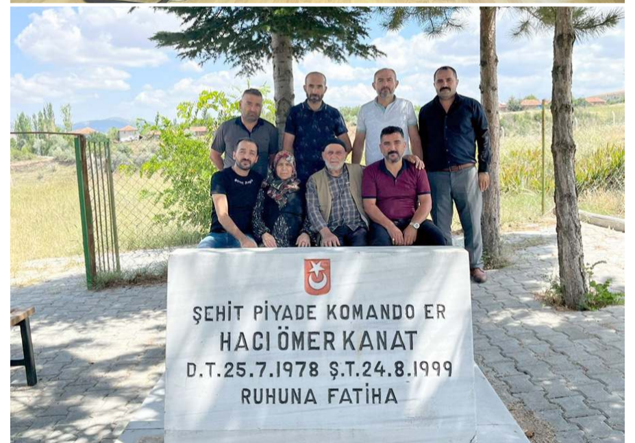
Ziyarete şehidin ailesinde katıldı.