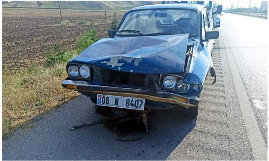
Kazada iki araçta da maddi hasar meydana geldi.