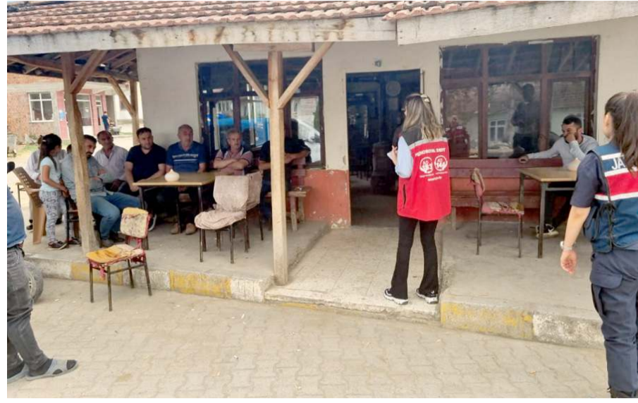
Aile ve Sosyal Hizmetler İl Müdürlüğü ile jandarma ekipleri konu hakkında bilgilendirici broşürler dağıttı.