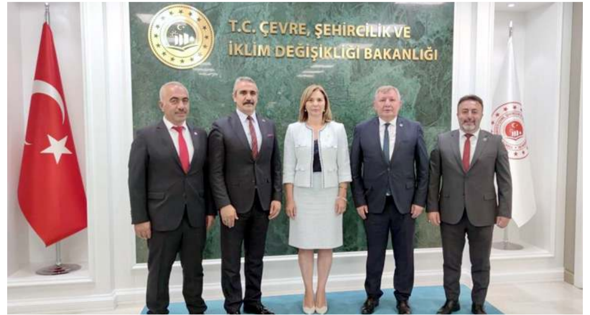
MHP heyeti TBMM Çevre Komisyonu Üyesi Milletvekili Ayşe Sibel Ersoy'u ziyaret etti.

Belediye Başkanları tarafından ilçelerinin talep ve isteklerinin Bakan Kurum'a iletildiğini belirten Başkan Karapıçak, "Belediye Başkanlarımızın taleplerine samimi yaklaşımlarından, desteklerinden ve bizlere gösterdikleri alakalardan dolayı Sayın Bakanımıza, bizlere bu imkanı sağlayan Genel Başkan Yardımcımız Sayın Sadir Durmaz Başkanımıza ve TBMM Çevre Komisyonu Üyesi Adana Milletvekilimiz Sayın Ayşe Sibel Ersoy'a çok teşekkür ediyoruz" ifadelerini kullandı. (Haber Merkezi)