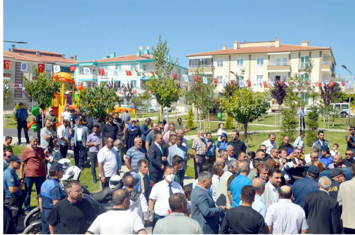
Turgut Aslan Parkı Gülabibey Mahallesi Kapaklı 51.Sokak'ta bulunuyor.

"FETÖ'nün devlet mekanizmalarına sızdığı ve birçok kamu görevlisini sindirdiği dönemde, Terörle Mücadele Daire Başkanlığı görevine geldim. Sayın Cumhurbaşkanımızın himayelerinde, mesai arkadaşlarımla birlikte, bu hain terör örgütünün yapılmasını ortaya koyan bir rapor hazırladım. Bu rapor sayesinde, örgüt yasal zeminde de, silahlı terör örgütü olarak kabul edildi. Aynı dönem Çukur Barikat operasyonlarında, PKK-PYD terör örgütüne de büyük kayıplar verdirdik. Zaten birlikte hareket eden bu terör örgütleri, şahsımı hedef haline getirdiler. Malumunuz 15 Temmuz'da yaşanan darbe kışkırtmada müdahale için gittiğim Jandarma Genel Komutanlığında infaz edilme istenildi. Büyük sıkıntılar yaşadım, ama, hamd olsun, şu an karşınızda, dimdik ayakta'yım. Vatandaşlarımızın, özellikle siz hemşerilerimin, çok desteğini ve yardımlarını