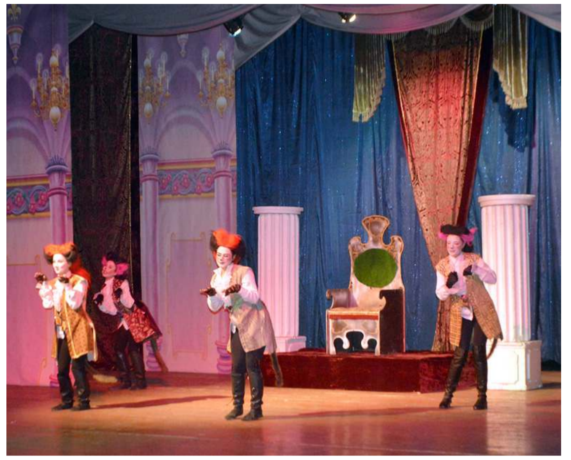
Çizmeli Kedi Müzikali Devlet Tiyatro Salonu'nda sahnelendi.