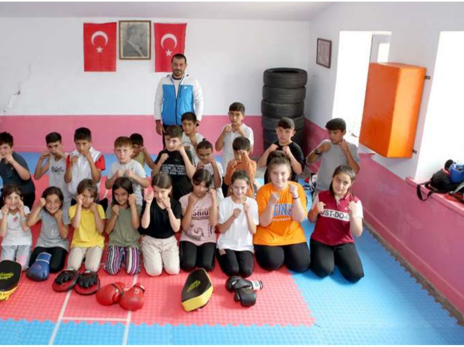
Köy okulu II Gençlik ve Spor Müdürlüğünün desteğiyle spor salonuna dönüştürüldü.

"Burada Türkiye'ye örnek olacak bir çalışma yapıldı. Atıl halde bulunan köy okulumuza Alim hocamızı aracılığıyla malzeme desteğinde bulduk. Bu çalışmayı çok değerli buluyoruz. Şehir merkezine ulaşamayan çocuklara yaşadıkları yerde spor yapma imkanı sağladık. Bu nedenle çok değerli bir proje. Spor hem eğlence, hem rekabet için yapılabiliyor. Hiç spor yapmayan çocuklara bu imkan sağlanarak belki de buradan dünya şampiyonları çıkarılabilir. Devletimiz burada insanlara varlığını hissettiriyor. Bu anlamda da projemiz çok değerli." (AA)