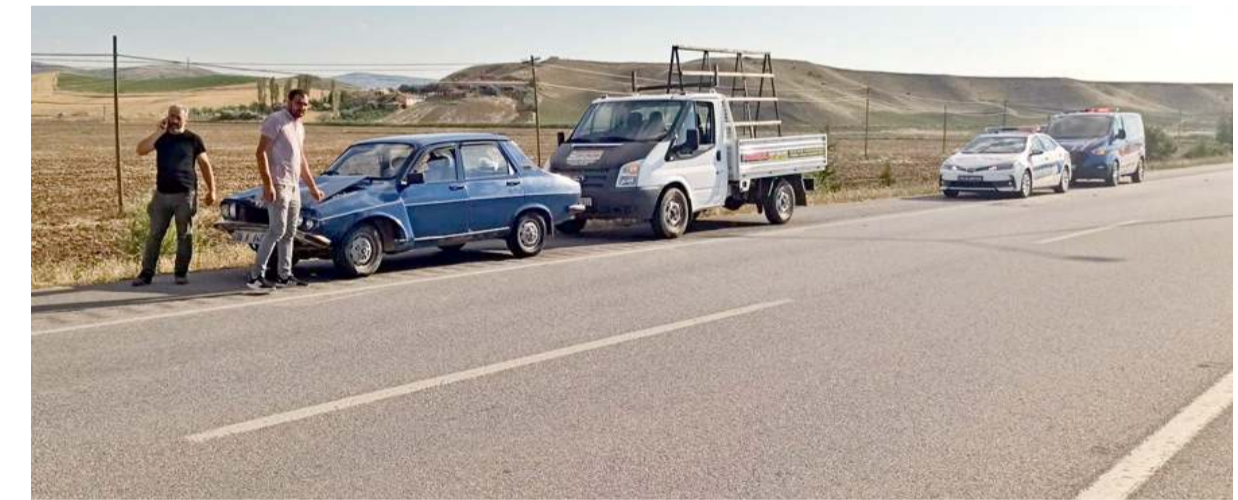
Kaza nedeniyle trafik bir süre kontrollü olarak verildi.