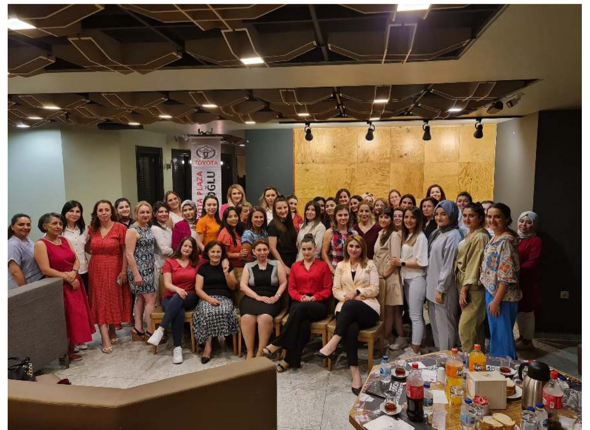
Toplantının sonunda toplu hatıra fotoğrafı çekildi.