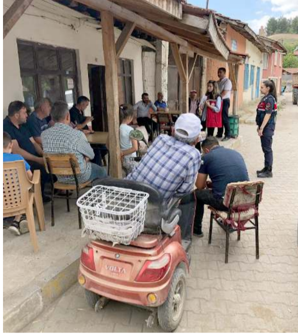
Ekipler köylerde erkek vatandaşlara bilgilendirme faaliyeti yaptılar.

Aile ve Sosyal Hizmetler İl Müdürlüğü ile İl Jandarma Komutanlığı tarafından yürütülen 'Kadına Yönelik Şiddetle Mücadelede 5 Milyon Erkeğe Farkındalık Eğitimi' kapsamında çalışmalar devam ediyor.