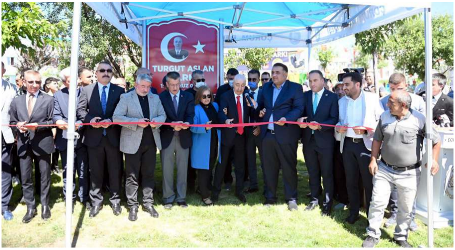
Yapılan duanın ardından parkın açılış kurdelaşı kesildi.

Çorum Belediyesi, kahramanımızın ismini parkta yaşatacak