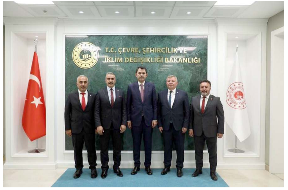
MHP heyeti Çevre, Şehircilik ve İklim Değişikliği Bakanı Murat Kurum'u ziyaret etti.