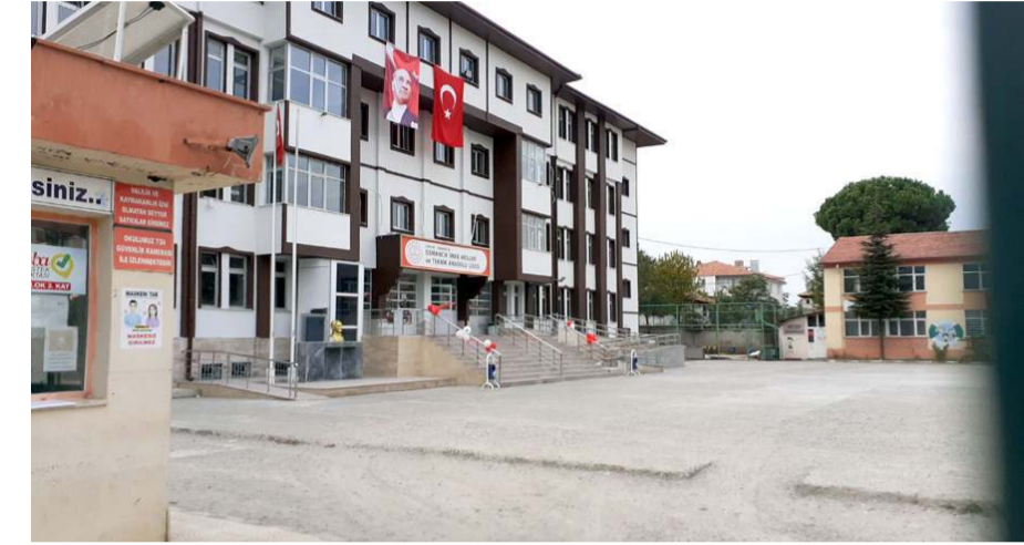
Tarım Lisesi, önümüzdeki eğitim-öğretim yılında faaliyete geçecek.

olan lisenin LGS sonucuna göre merkezi yerleştirme ile 30 öğrenci alacağı, 2022-2023 eğitim öğretim yılında Gemici Mahallesi Dr. Cihat Aytaç Caddesi üzerindeki Osmancık Borsa İstanbul Mesleki ve Teknik Anadolu Lisesi bünyesinde eğitim vereceği öğrenildi. (İHA)