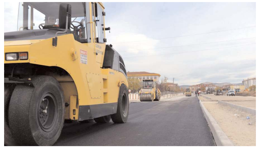
Yola 1.700 ton asfalt serilecek.