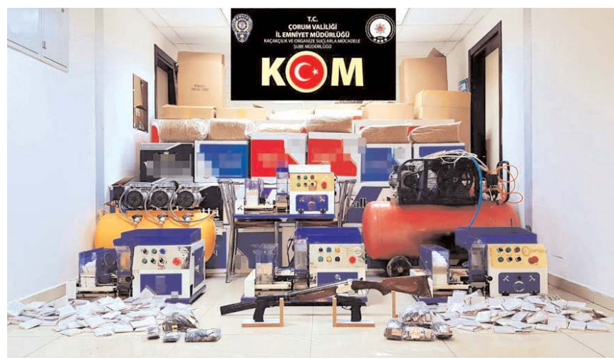
Operasyonda kaçak sigara yapımında kullanılan makine ve malzemeler ele geçirildi.