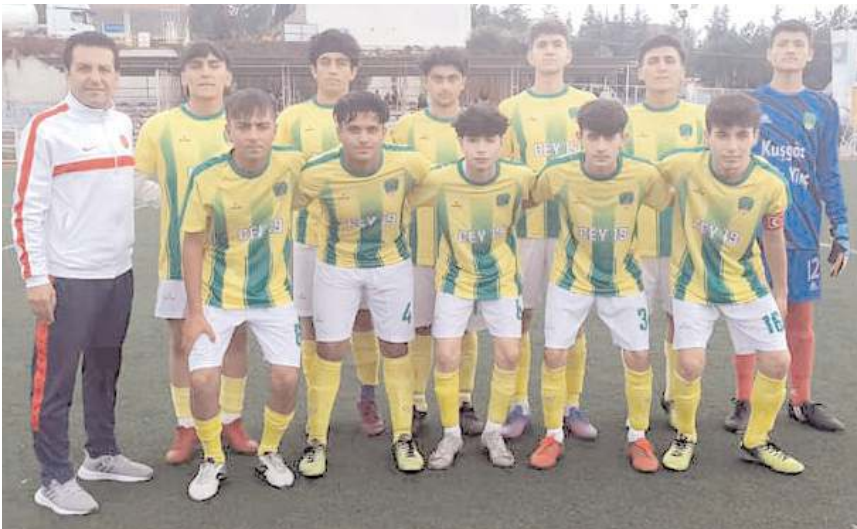
İskilipspor U 18 takımı evinde farklı kazanarak ikincilik iddiasını sürdürdü

HE Kültürspor- İskilipspor. Hattuşa Gençlik-Bayat Belediyespor. Alaca Belediyespor- Mimar Sinan.