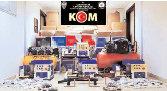
Operasyonda kaçak sigara yapımında kullanılan makine ve malzemeler ele geçirildi.

Edinilen bilgiye göre, Çorum Emniyet Müdürlüğüne bağlı Kaçakçılık ve Organize Suçlarla Mücadele