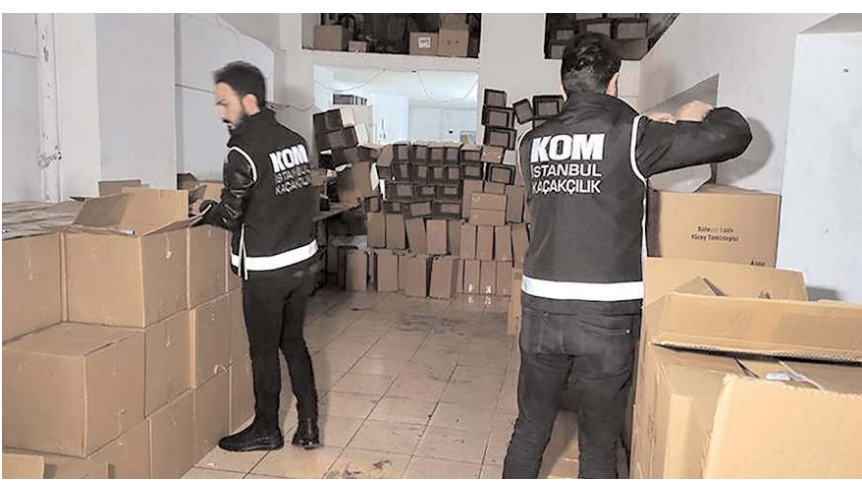
Operasyonda sahte alkol üretilen, bunları yılbaşında piyasaya sürmeye hazırlanan 32 şüpheli yakalandı

Şüphelilerin yakalanmaması için "kumaş kesiyoruz işte, arabanın tamiri bitti mi, yazlık" gibi şifreli cümlelerle iletişimde buldukları öğrenildi. Sahte içkiler imha edilmesi için emniyete götürülürken, yakalanan şüpheliler sorgulanmak üzere İstanbul Kaçakçılık Suçlarıyla Mücadele Şubesine getirildi. Şüphelilerin polisteki sorgusu devam ediyor. (İHA)