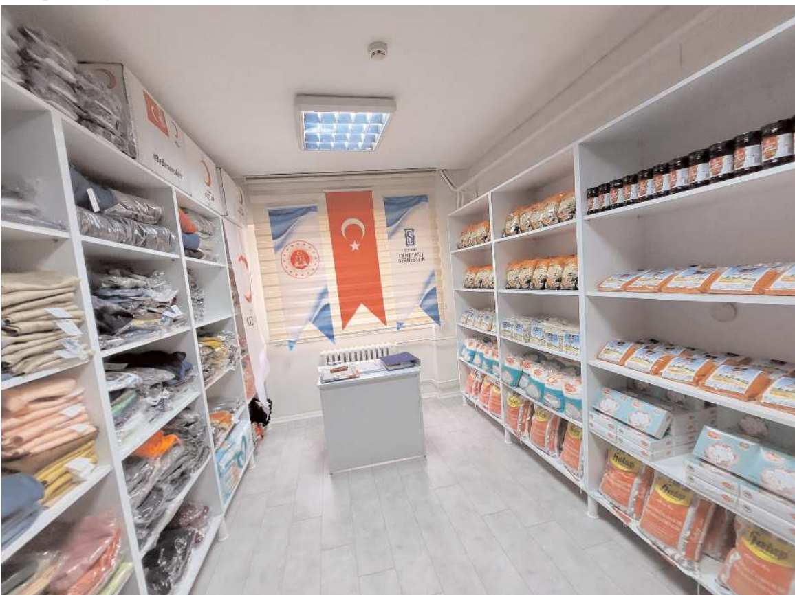
'Sosyal Market'te yiyecek ve giyim malzemeleri bulunuyor.

Hatap Değirmenleri Gıda Sanayi Şirketi ve Çorum Şeker Fabrikası'ndan da çeşitli türlerde gıda desteği sağlandı. (Haber Merkezi)