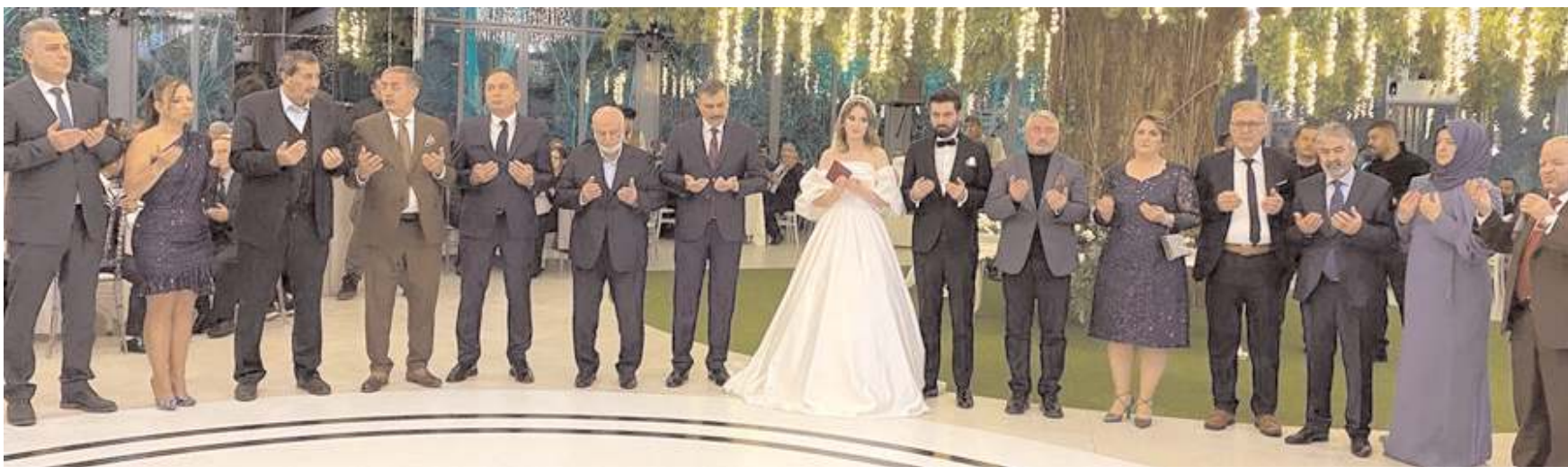
Genç çiftin düğününe çok sayıda davetli katıldı.