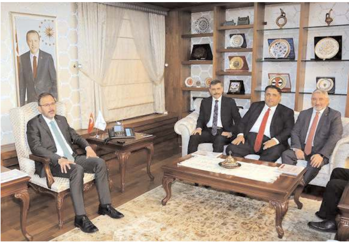
Cumhurbaşkanı Recep Tayyip Erdoğan'ın fotoğrafı Valilik makamının misafir köşesinde yer alıyor.

Birileri yalan temelinde bina ettiği iftiralarla bir yerlere varmaya çalışsa da, her zaman olduğu gibi kazanan yine doğruluk oldu.