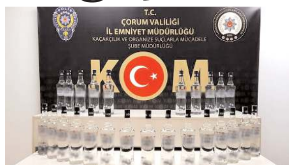
Aramada 25 adet gümrük kaçağı rakı ele geçirildi.

Gümrük kaçağı alkollü içkilere el koyan polis ekipleri, şüpheli şahıs hakkında adli işlem başlattı. (İHA)