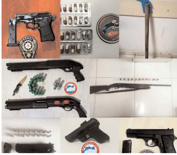
Operasyonlarda çok sayıda silaha ele geçirildi.

haklarında arama kararı bulunan 31 şahıs yakalanırken, 4 adet tüfek, 9 adet tabanca olmak üzere toplamda 13 adet silah ve 38 adet sentetik ecza maddesi ele geçirildi. (Haber Merkezi)