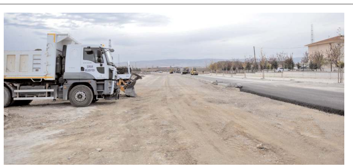
Yol 850 metre uzunluğa 14 metre genişliğe sahip.

bir konu da su tasarrufu. Çünkü tüm dünyada su kaynakları giderek azalmaktadır. Su en değerli varlığımızdır. Su kaynaklarımızın korunması için herkesin bir şeyler yapması lazım. Vatandaşlarımızdan en büyük ricam suyu tasarruflu kullanınlar, asla israf etmesinler." diye konuştu.(AA)