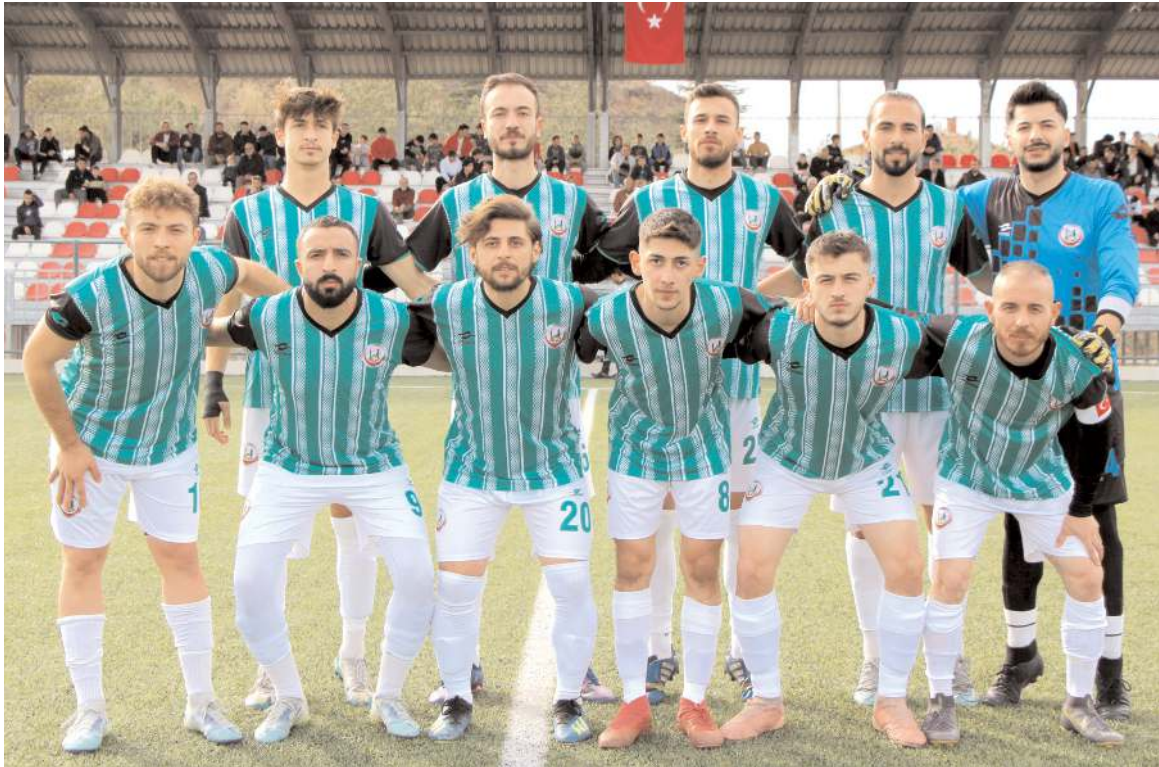
Sungurlu Belediyespor ilk maçını farklı kazanarak liderlik koltuğuna oturdu