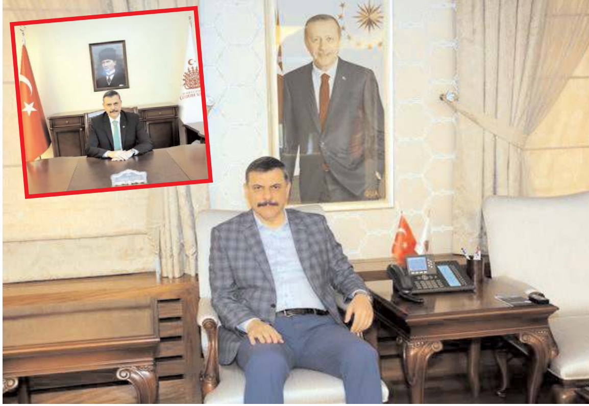
Cumhurbaşkanı Recep Tayyip Erdoğan'ın fotoğrafı Valilik makamının misafir köşesinde yer alıyor.