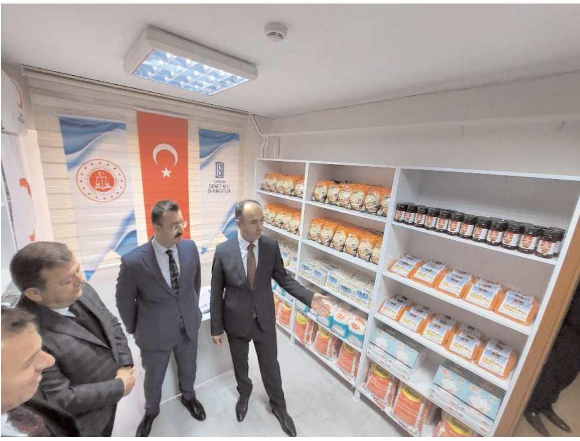
'Sosyal Market' Çorum Denetimli Serbestlik Müdürlüğü hizmet binasında açıldı.