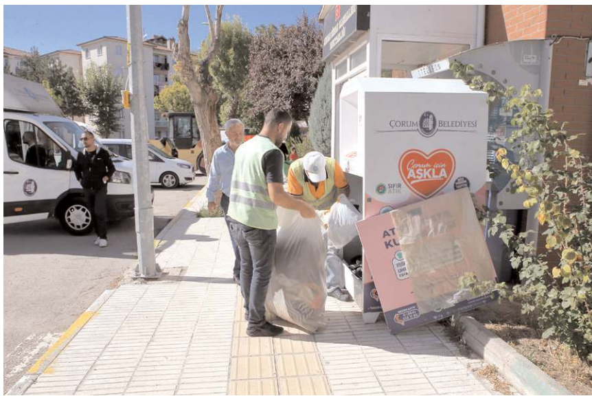
Ekipler belirli aralıklarla kumbaraları boşaltıyor.