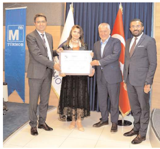
SMMM'dan yeni ruhsat alan üyeler için ruhsat töreni gerçekleştirildi.

İl Jandarma Komutanlığı'ndan yapılan açıklamada, "Çorum İl Jandarma Komutanlığı sorumluluk bölgesinde, vatandaşlarımızın can ve mal güvenliğinin sağlanması, özellikle hırsızlık olaylarının önlenmesine yönelik önleyici tedbirlere ve şüphelilerin yakalanması çalışmalarına kararlılıkla devam edilmekte olup, vatandaşlarımızın şüpheli durumları 112 Acil Çağrı Merkezi üzerinden Jandarma'ya bildirilmesi olayların önlenmesi ve aydınlatılmasına büyük katkı sağlayacaktır" denildi. (Haber Merkezi)