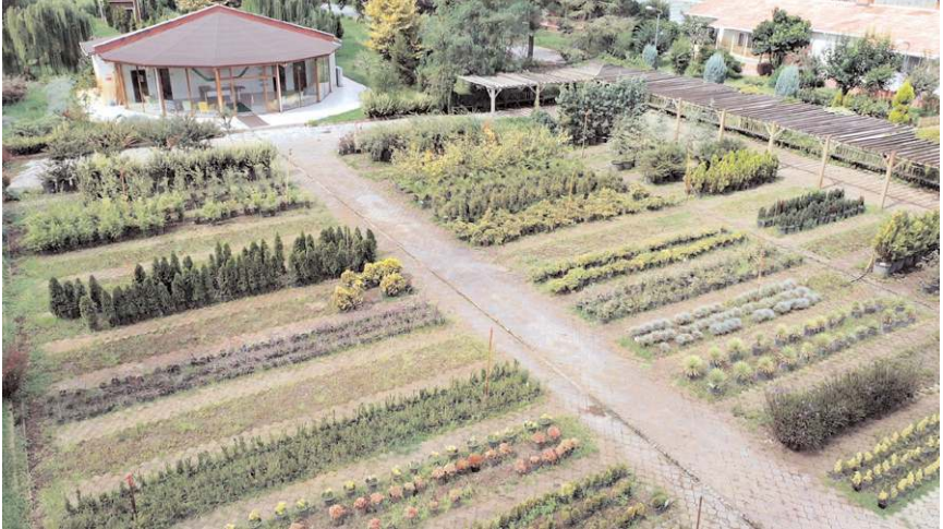
130'un üzerinde karaçam, sarıçam, kızılçam, sedir, servi gibi türlerde fidanlar üreten müdürlük, orman yangını yaşanan yerlere de fidan göndererek buraların yeniden yeşermesine katkıda bulunuyor.