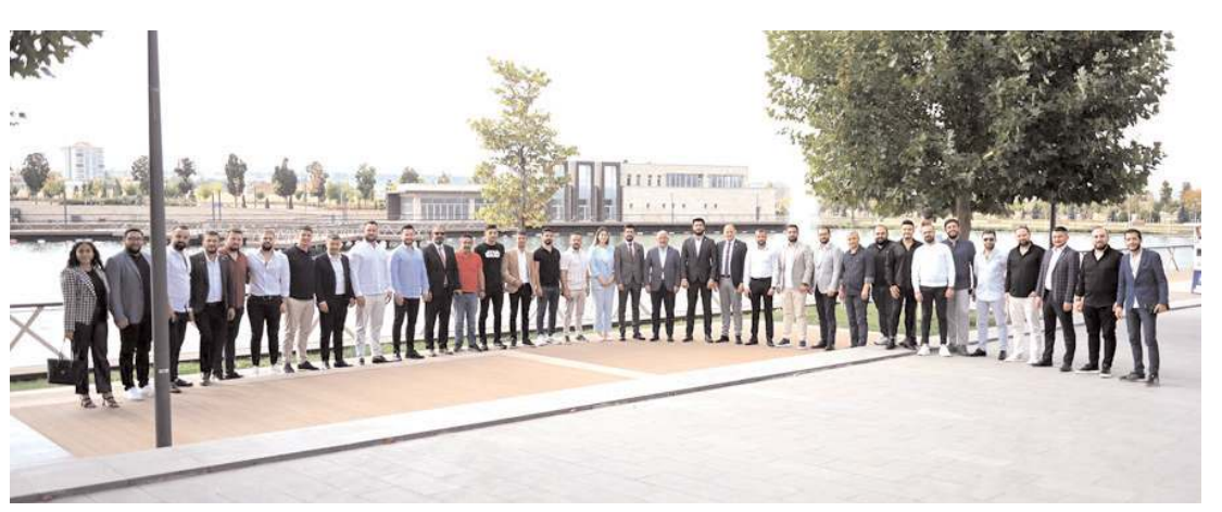
Toplantı sonrasında toplu hatıra fotoğrafı çekildi.

Millet İttifakı'nın bileşenlerini oluşturan 6 siyasi partinin Çorum'daki temsilcileri yaptıkları toplantıda seçim güvenliği başta olmak üzere güçlendirilmiş parlamenter sistem, ortak cumhurbaşkanı adayı ve ülkemizin ve ilimizin temel sorunları hakkında görüş alışverişinde bulundular. * HABERİ 3'DE