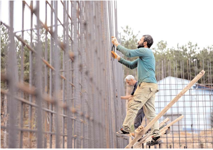
Su deposunun inşaatı hızla devam ediyor.