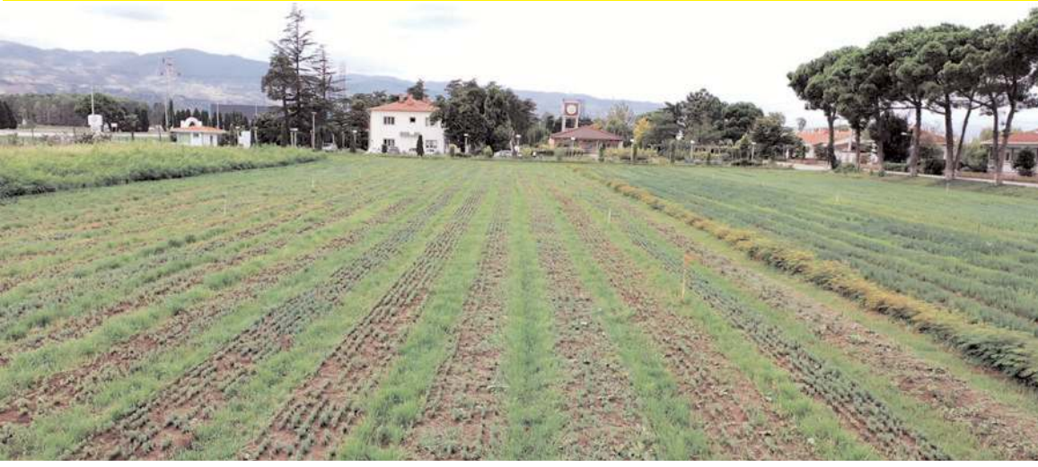
Samsun Orman Fidanlık Müdürlüğü, Bafra, Vezirköprü, Amasya, Çorum, Tokat ve Niksar Orman Fidanlık şefliklerinde yılda 10 milyonu aşkın fidan üretiliyor.