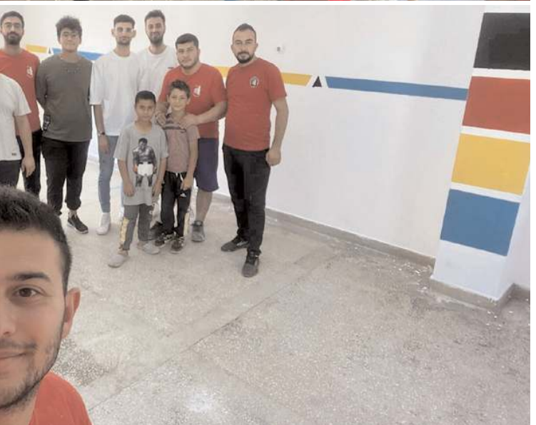
Gençler hatıra fotoğrafı çekindiler.