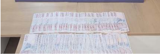
Şahıslarda 35 bin lira nakit para, 2 adet cep telefonu ele geçirildi.