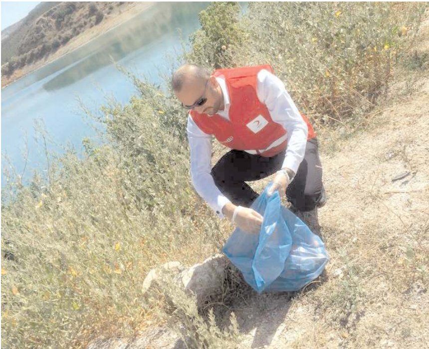
Çorum Barajı çevresindeki çöpleri topladılar.