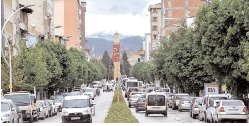
Çorum'da trafiğe kayıtlı araç sayısı Ağustos ayı sonu itibarıyla 183 bin 884 oldu.

Ağustos ayında geçen yılın aynı aya göre trafiğe kaydı yapılan taşıt sayısı kamyon %71,2, otobüste %40,3, motosiklette %40,2, traktörde %34,4, özel amaçlı taşıtlarda %22,5, otomobilde %4,3 artarken minibus %30,6 ve kamyonette %6,1 azaldı.