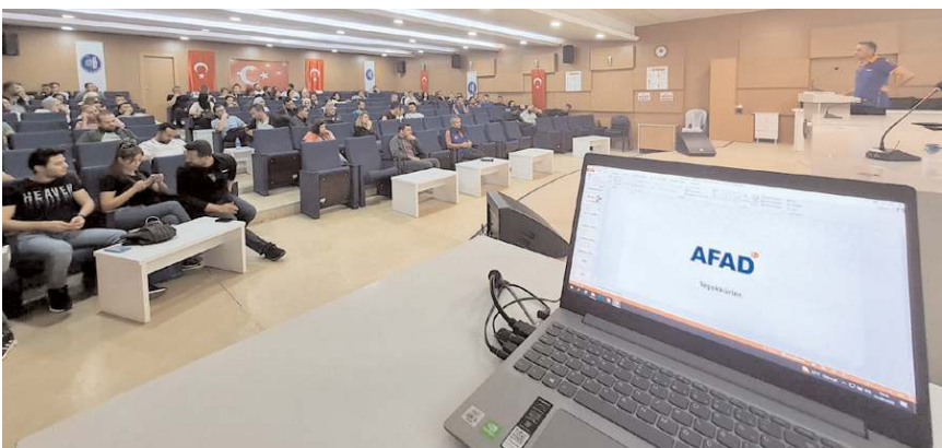
Eğitime İl Sağlık Müdürlüğü, İtfaiye Müdürlüğü, İl Emniyet Müdürlüğü ve İl Jandarma Komutanlığı personelleri katıldı.