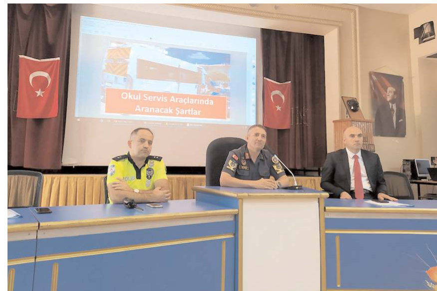
Eğitimi Okul Servis Denetim Komisyon üyeleri gerçekleştirdi.