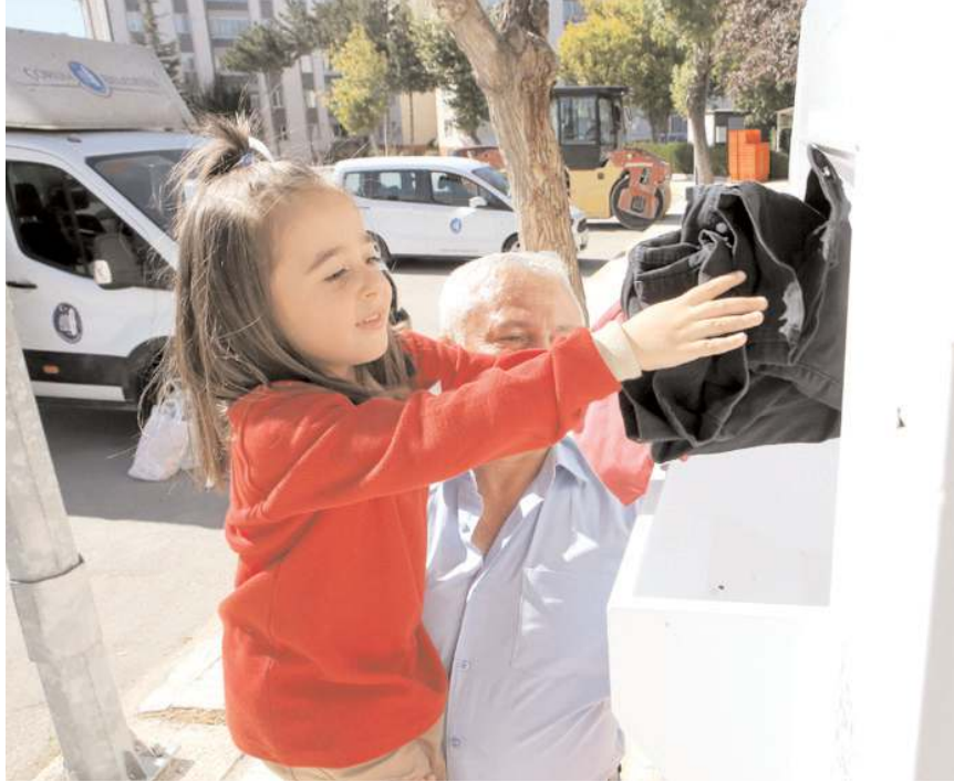
Vatandaşlar kullanmadıkları tekstil ürünlerini bu kumbaralara atıyor.