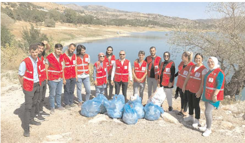
Kızılay Çorum Şubesi, 'Dünya Temizlik Günü' nedeniyle çöp toplama etkinliği düzenledi.