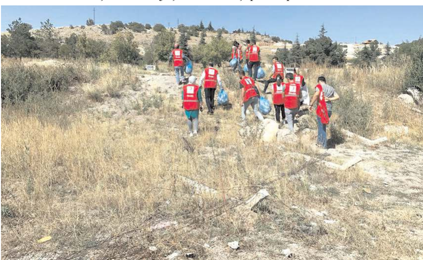
Toplanan çöpler, görevliler tarafından belediye araçlarına yüklendi.

Kızılay Çorum Şubesi, '17 Eylül Dünya Temizlik Günü' dolayısıyla çevre temizliğinin önemine dikkat çekmek amacıyla 'çöp toplama' etkinliği düzenledi.