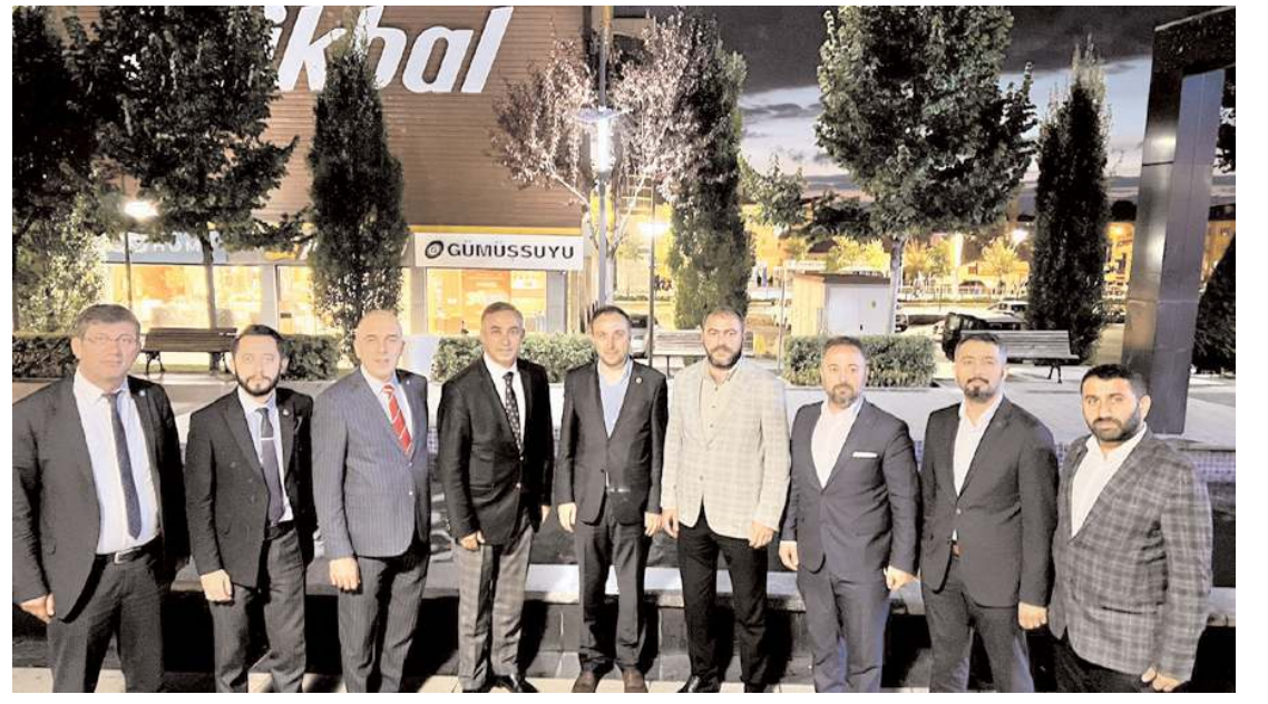
Millet İttifakı'nın bileşenlerini oluşturan 6 siyasi partinin Çorum'daki temsilcileri toplantı yaptı.