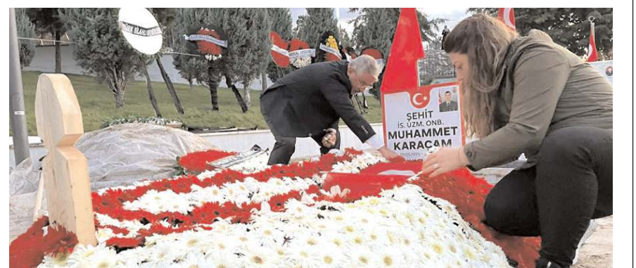
Şehit Uzman Onbaşı Muhammed Karaçam'ın mezarı cenaze töreninin ardından şehit eşleri tarafından çiçeklerle donatıldı.

Şehit eşleri şehidimizin kabri başına toplanmışlar ve çelenklerdeki karafilere şehidimizin kabrini çiçeklerle donatıyorlar. Yeryüzünde bunu yapabilecek başka bir millet yok. Şehidini, daha önce şehit olmuş vatan evlatlarının eşlerinin bu şekilde uğurladığı bir millete kimse diz çöktürmez."