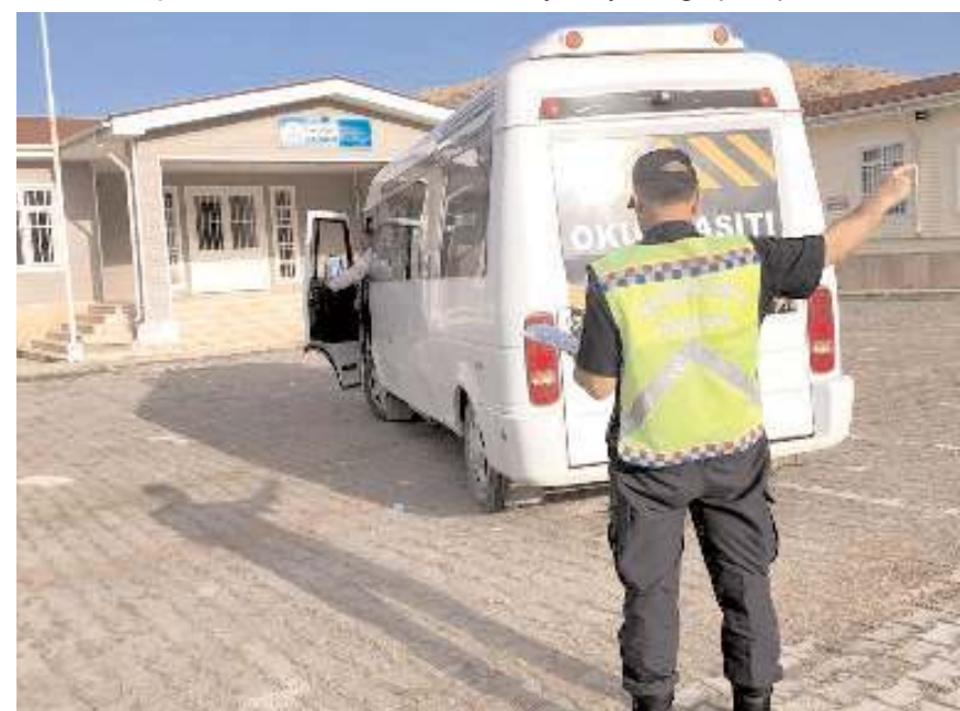
Ekipler okul servislerini şartları taşıyıp taşımadığını kontrol etti.