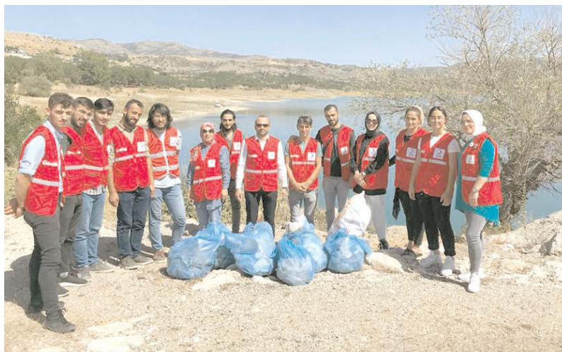
Etkinliğe Kızılay Çorum Şubesi Gençlik Kolları, Kadın Kolları ve merkez çalışanları katıldı.