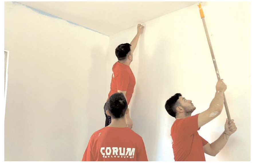
Öğrenciler sınıfı boyadılar.