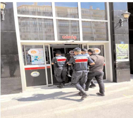
20 hırsızlık olayında 33 şüpheli hakkında adli soruşturma başlatıldı.