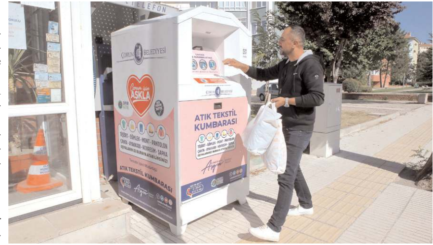
Kumbaralar nüfus yoğunluğunun yüksek olduğu yerlere yerleştirildi.