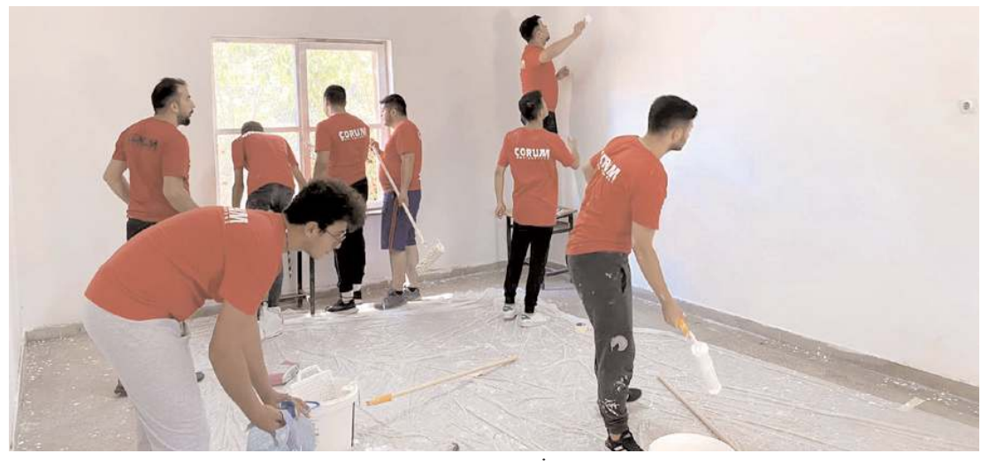
Kent Konseyi Gençlik Meclisi, İyilik Atölyesi projesi kapsamında köy okullarında bakım ve onarım çalışması yapıyor.

Kampanyadan faydalanmak isteyen konut ve iş yeri alıcıları Gayrimenkul Satış Sözleşmesini imzalamış oldukları aracı bankalardan konut kredisi kullanabilecekler. (Haber Merkezi)