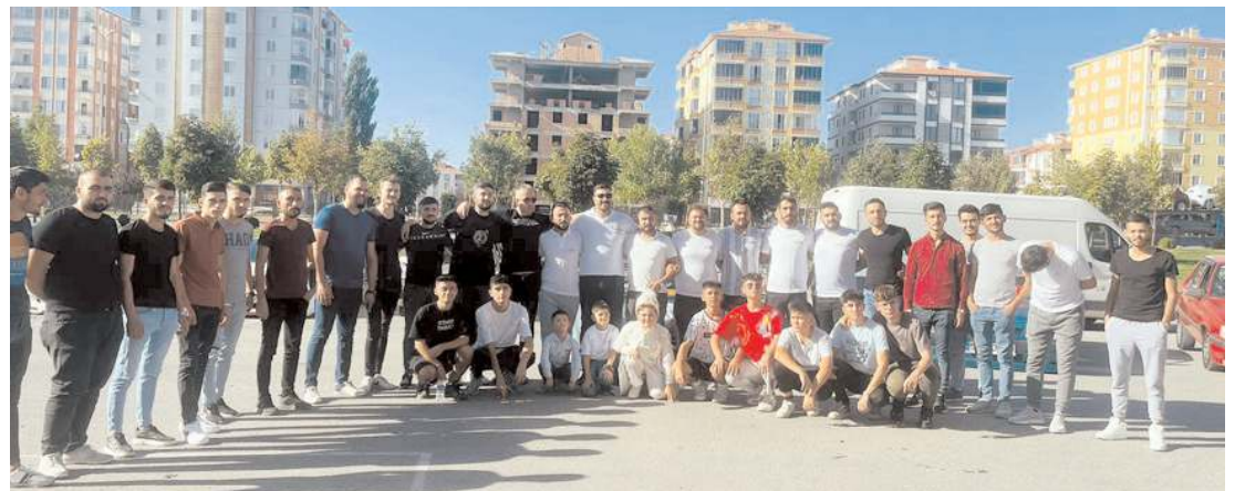
Günün anısına hatıra fotoğrafı çekildi.