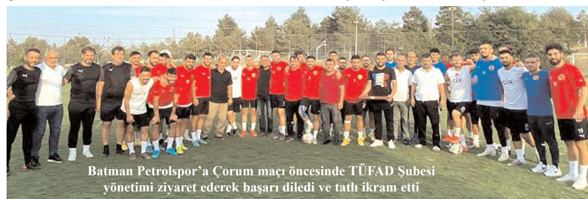
Batman Petrolspor'a Çorum maçı öncesinde TUFAD Şubesi yönetimi ziyaret ederek başarı diledi ve tatlı ikram etti

Sezonun ilk maçında 2 Ekim pazar günü Niksar Belediyespor ile deplasmanda karşılaşacak olan Çorum Belediyesi Gençlikspor bu dörtlü turnuvada lig öncesi son provalarını yaparak eksikleri görme ve giderme imkanı bulacak.