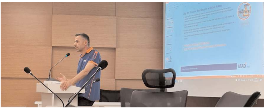
Eğitimi AFAD uzmanları verdi.

Çorum İl Afet ve Acil Durum Müdürlüğü'nün (AFAD) olaası afet durumlarında ilgili kurum personellerinin olay yerinde nasıl hareket edeceğine yönelik eğitimlere devam ediyor. Turgut Özal İş Merkezi Belediye Konferans Salonu'nda gerçekleştirilen eğitimde AFAD uzmanları, İl Sağlık Müdürlüğü, İtfaiye Müdürlüğü ve İl Emniyet Müdürlüğü ve İl Jandarma Komutanlığı personeline olay yeri yönetimi, koordinasyonu ve irtibat noktası eğitimi verdi.