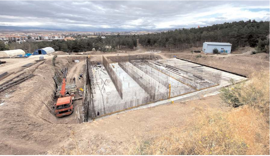
Su deposunun kapasitesi 10 bin m3 olacak.