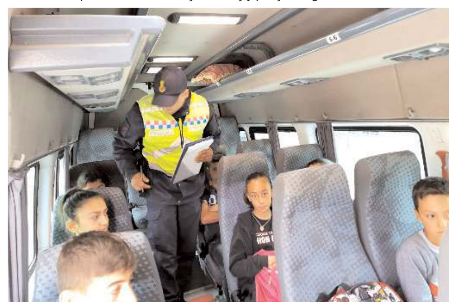
Okul servis araçları ve şoförler, okul önlerinde ve taşıma güzergahları üzerinde denetlendiler.