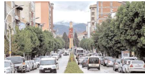
Çorum'da trafiğe kayıtlı araç sayısı Ağustos ayı sonu itibarıyla 183 bin 884 oldu.