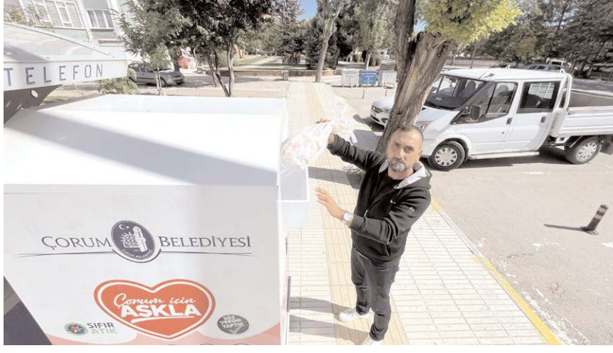
Belediye 150 noktaya atık tekstil kumbarası yerleştirdi.