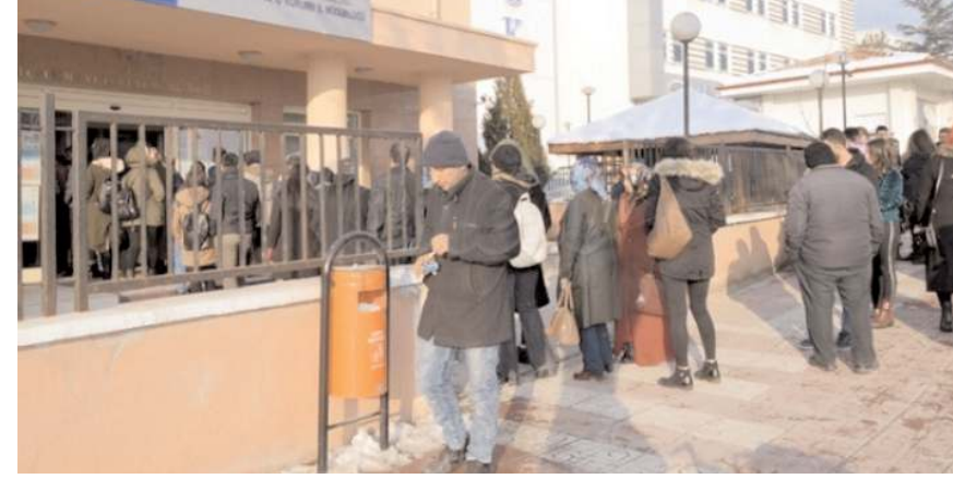
Toplum Yararına Çalışma Programı kapsamında 39 kişi alınacak.

net tutarının bir buçuk (1,5) katını aşması halinde söz konusu adreste oturan kişiler TYP'den yararlanamamaktadır.