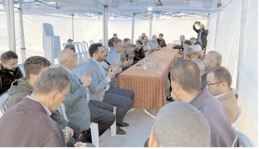
Şehidin evinin önünde açılan taziye çadırında şehit için dua edildi.