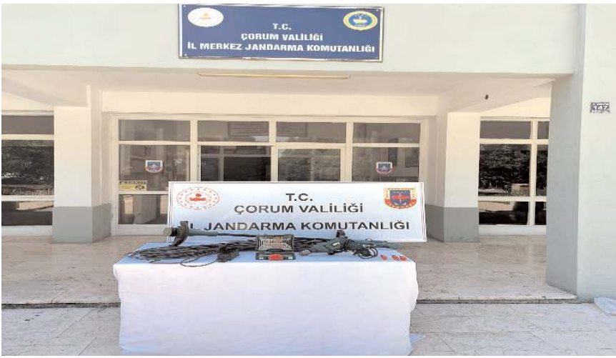
Çalıntı mallarda ekipler tarafından ele geçirildi.