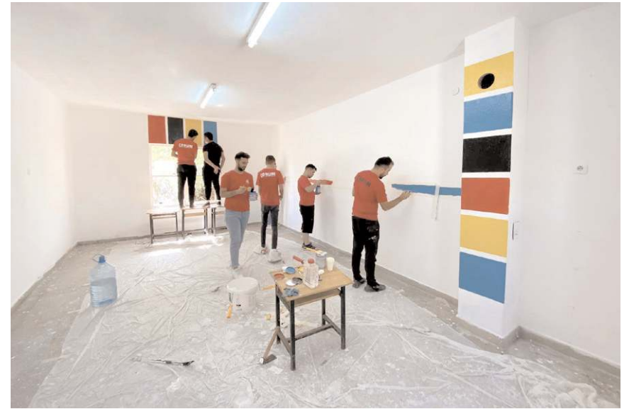
Gençler Kozören Köyü İlkokulu'nun bakım ve onarımını gerçekleştirdiler.