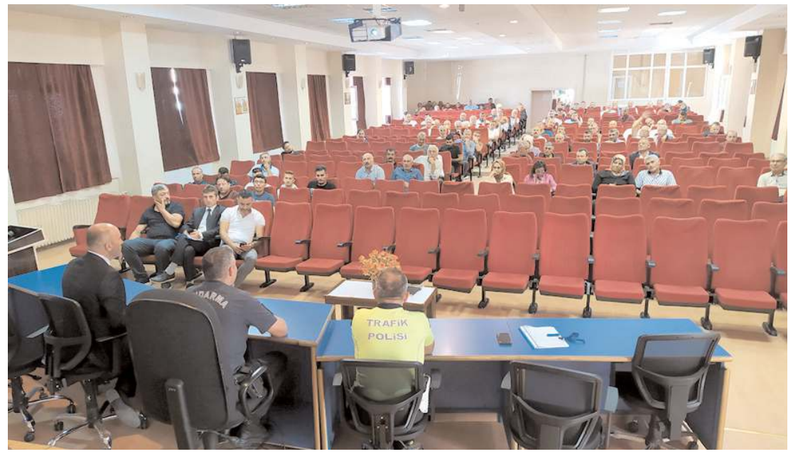
Okul servis şoförlerine, rehber personele ve servis araçlarından sorumlu okul müdür yardımcılarına eğitim semineri düzenledi.