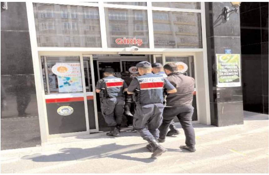
20 hırsızlık olayında 33 şüpheli hakkında adli soruşturma başlatıldı.