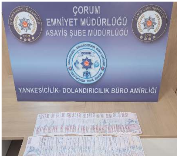
Şahıslarda 35 bin lira nakit para, 2 adet cep telefonu ele geçirildi.

Şahısların araçlarında yapılan aramada 35 bin lira nakit para, 2 adet cep telefonu ele geçirilirken, gözümlenilen şüpheliler Bartın Emniyet Müdürlüğü Asayiş Şube Müdürlüğü ekiplerine teslim edildiler. (Haber Merkezi)