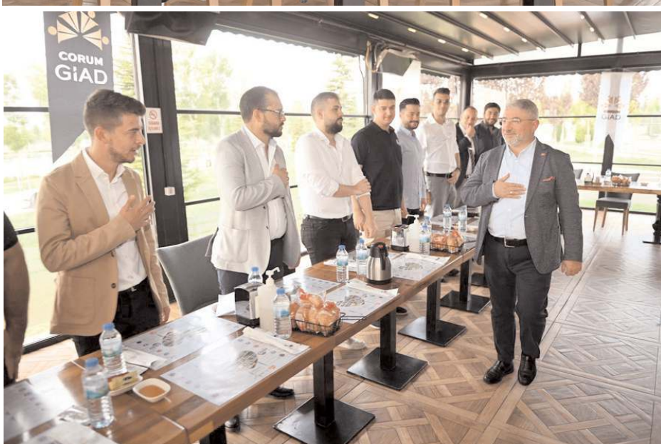
Başkan Aşgın, toplantıya katılan gençlerle sohbet etti.