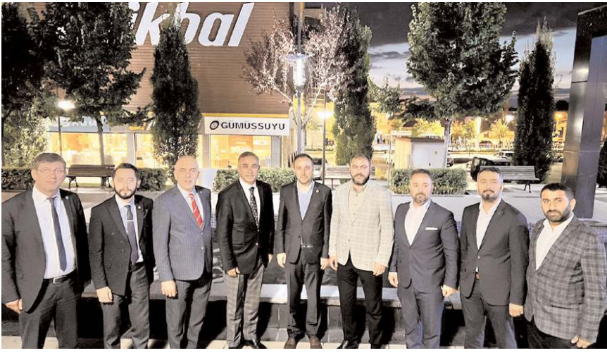
Millet İttifakı'nın bileşenlerini oluşturan 6 siyasi partinin Çorum'daki temsilcileri toplantı yaptı.

Millet İttifakı'nın bileşenlerini oluşturan 6 siyasi partinin Çorum'daki temsilcileri yaptıkları toplantıda seçim güvenliği başta olmak üzere güçlendirilmiş parlamenter sistem, ortak cumhurbaşkanı adayı ve ülkemizin ve ilimizin temel sorunları hakkında görüş alışverişinde bulundular. * HABERİ 3'DE