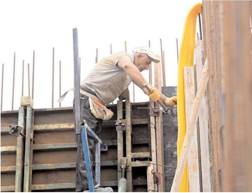
Deponun tamamlanıp hizmete girmesiyle olası şebeke arılarında en az 15 saat içme suyu temin edilebilecek.