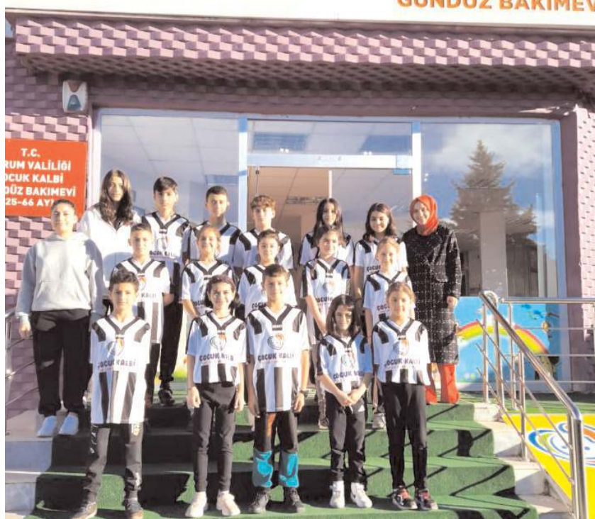
Çocuk Kalbi Gündüz Bakımevi Badminton sporcuları teşekkür ziyareti