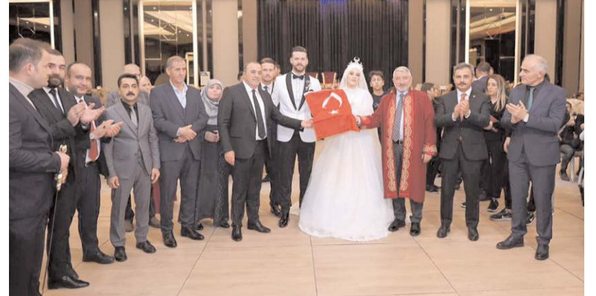
Düğünde genç çifte Türk bayrağı hediye edildi.