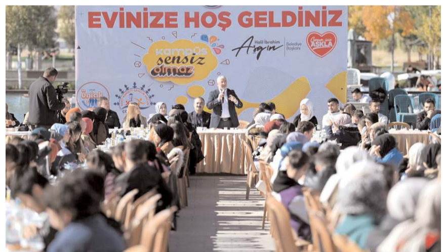
Program Millet Bahçesi'nde yapıldı.

Bilim, kültür, sanat ve spor alanında Çorum'u hep birlikte en üst sralara taşıyacaklarını vurgulayan