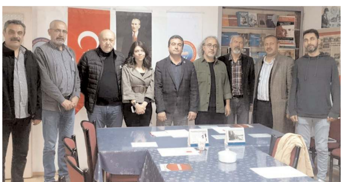
Eğitim sendikaları 2 Kasım'da yapılacak ortak iş bırakma eylemini değerlendirdiler.