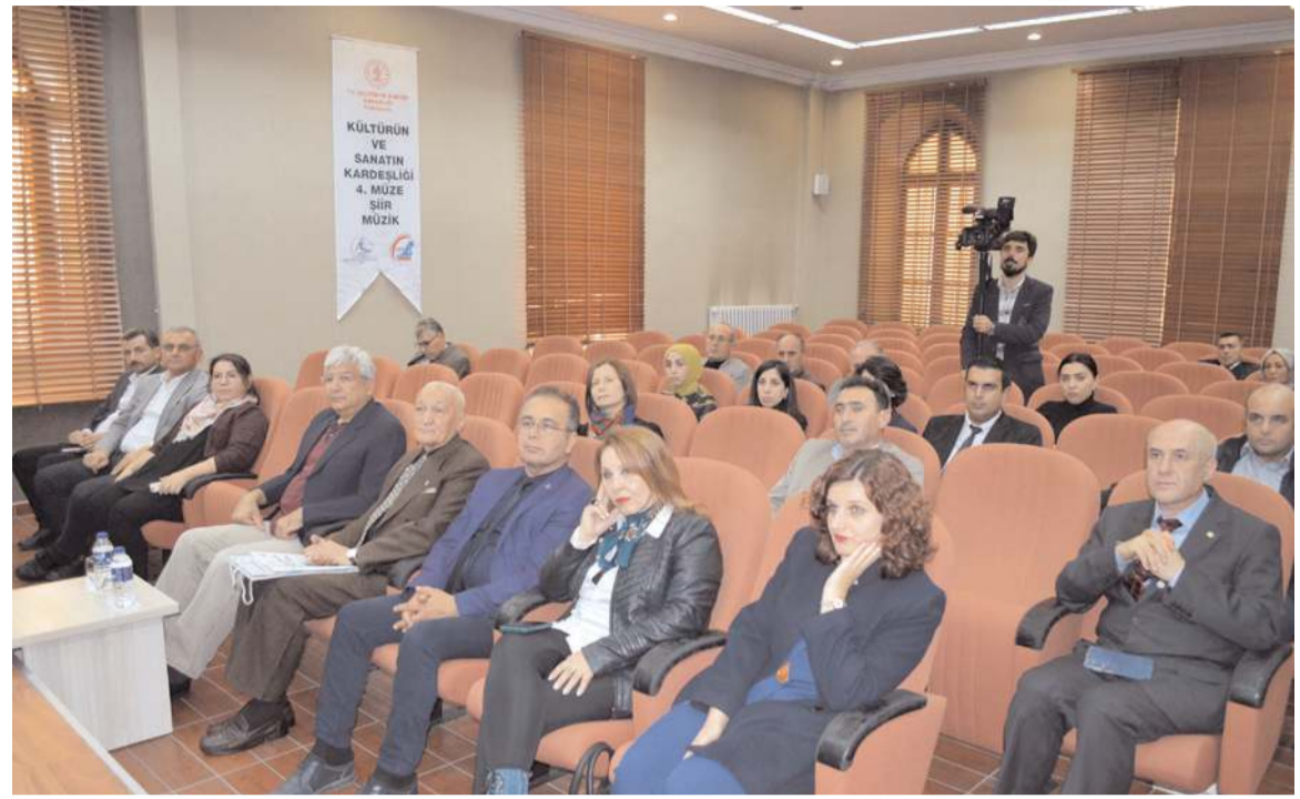
Program Çorum Müzesi konferans salonunda yapıldı.

Proje kapsamında 'Şiir Dinletisi ve Türk Sanat Müziği Konseri' programı ise Turgut Özal İş Merkezi Belediye Konferans Salonunda dün akşam yapıldı.