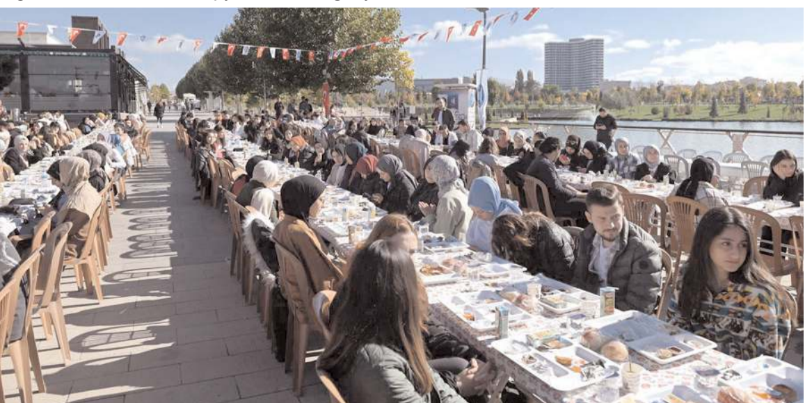
Kahvaltı programına çok sayıda üniversiteli genç katıldı.

Hitit Üniversitesi öğrencileri, Millet Bahçesi'nde düzenlenen kahvaltının ardından çeşitli spor aktivitelere katıldı.