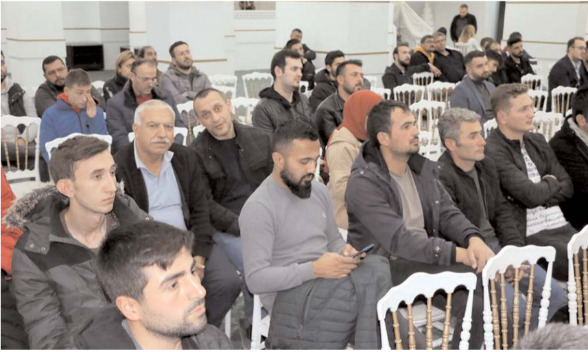
Toplantı Anitta Otel'de yapıldı.