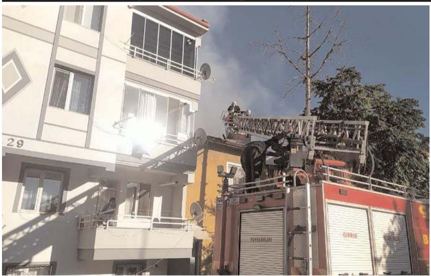
Olay Gülabibey Mahallesi Millet Caddesi'nde meydana geldi.

Çorum'da bir binanın çatısında çıkan yangın itfaiye ekiplerince söndürüldü.