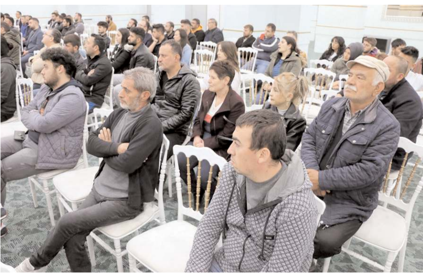
Toplantıda Almanya'da en çok ihtiyaç olan meslekler hakkında bilgiler verildi.