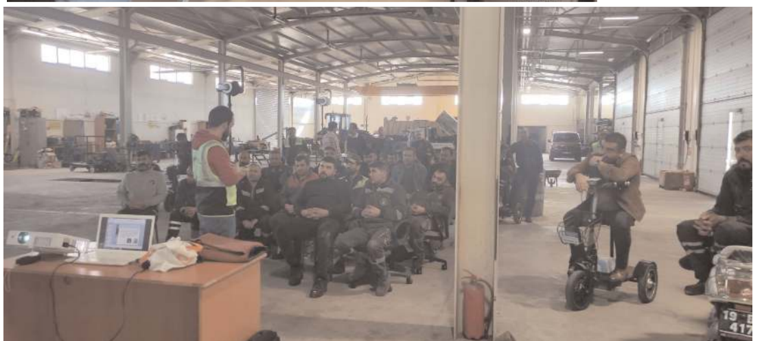
Seminer Temizlik İşleri Müdürlüğü ve Makine İkmal Bakım ve Onarım Müdürlüğünde yapıldı.

İnsan Kaynakları ve Eğitim Müdürlüğüne bağlı İş Güvenliği Birimi tarafından yıllık düzenli olarak yapılan eğitim seminerinin bu seferki konusu iş sağlığı ve güvenliği oldu. Temizlik İşleri Müdürlüğü ve Makine İkmal Bakım ve Onarım Müdürlüğünde verilen seminerde işverenin genel yükümlülükleri, çalışanın genel yükümlülükleri, tehlike ve risk kavramları ve sağlık gözetimi gibi konulara yer verildi. (Haber Merkezi)