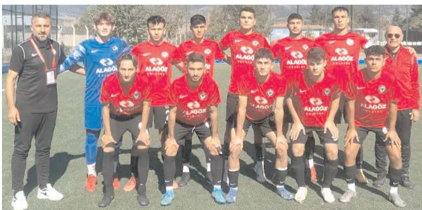
Çorum FK U 19 takımı Erbaaspor deplasmanında tek golle üç puanın sahibi oldu