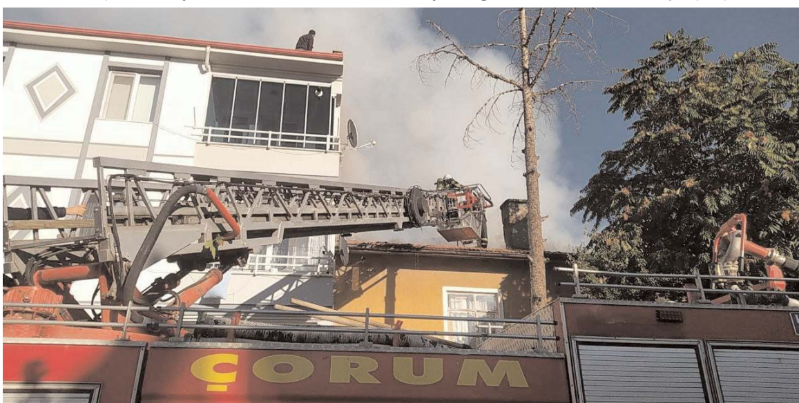
İtfaiye ekipleri yangını büyümeden söndürdü.