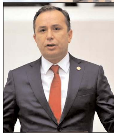
Ceylan, yüklenici firma ile sözleşmenin 25 Ekim 2022 tarihinde imzalanacağını açıkladı.