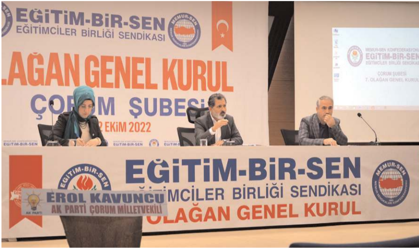
Genel kurulda ilk olarak divan heyeti seçildi.

mücadele ettik. Yine bir kaç gün önce adının başında Türk olan Türk Tabipler Birliği, ne Türklükle ne Müslümanlıkla ne de insanlıktan nasibini almamışlar, ülkesinin gözbebeği Türk Silahlı Kuvvetleri'nin 'kimyasal silah kullandı' diyecek kadar gözü dönmüş bir zihniyetle karşı karşıyayız. Halk arasında 'Fincancı Kartırları' yada 'Allah yüzünün rabbiyesini almış insan' denir buna. Bunlarla mücadele sonuna kadar kararlılıkla devam edeceğiz" şeklinde konuştu.