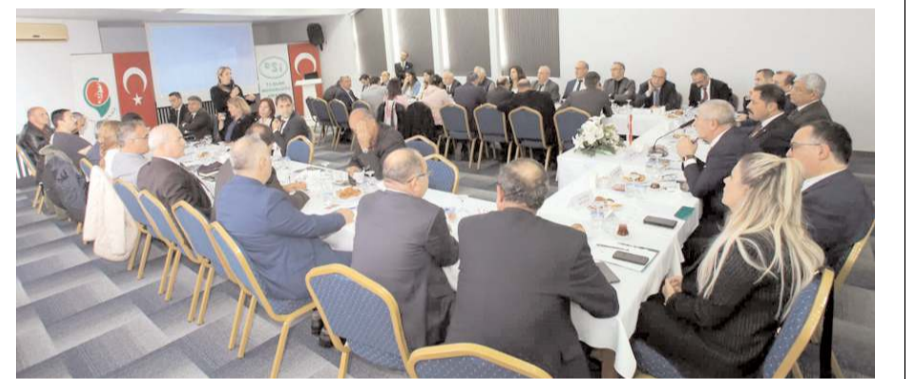
Toplantıda Yeşilirmak'ta yaşanan kirliliği önlemek için yapılması gerekenler ele alındı.