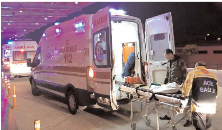
Yaralı kadın hastanede tedavi altına alındı.