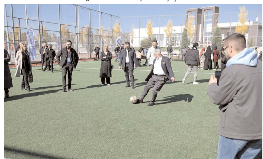
Başkan Aşgın da gençlerle birlikte sportif aktivitelere katıldı.

Başkan Aşgın, kapılarının tüm öğrencilerin projelerine açık olduğunu kaydetti.