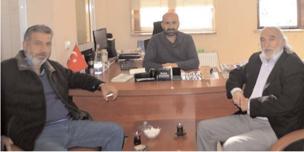
Doğru Yol Partisi yöneticileri ziyarette Dünya Gazeteciler Günü'nü kutladılar.

ları bilinçlendirmek ve haberdar etmek için verdikleri mücadelenin her türlü takdiri hak ettiğini ifade ederek, "Bu vesileyle, kamu yararı gözeterek emek veren, uzun çalışma saatlerini ve zorlu çalışma koşullarını önemsemeyen fedakarca çalışan, basın ahlak ve meslek ilkelerine bağlı olarak, kamuoyunun bilgilendirilmesi ve yönlendirilmesinde büyük rol üstlenen tüm basın mensuplarının gününü kutluyorum" dedi.