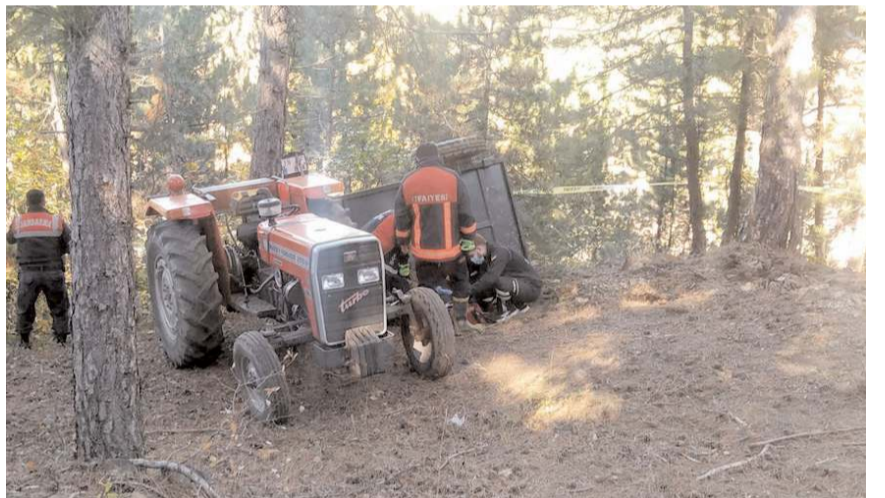
Traktör kontrolden çıkarak yol kenarında bulunan şarampole devrildi.