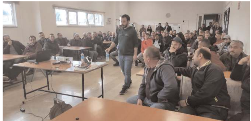
Eğitimde personele iş sağlığı ve güvenliği hakkında bilgiler verildi.