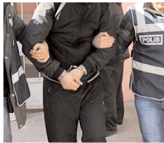
Çorum'da gözaltına alınan 10 şüpheliden 6'sı tutuklandı.