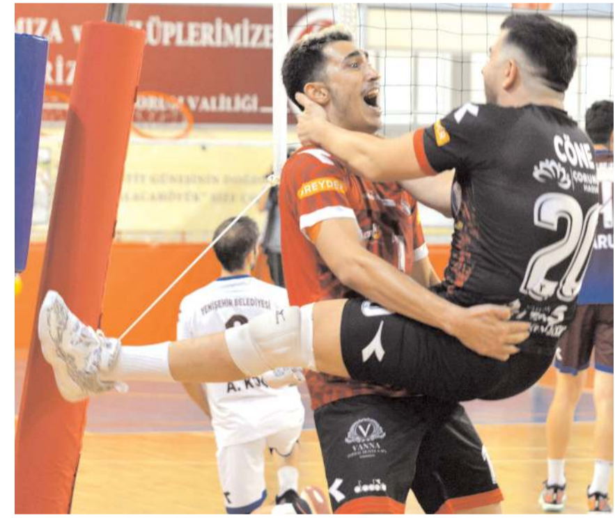
Çorum Belediyesi Gençlikspor'da bir hücum sonunda alınan sayının sevinci