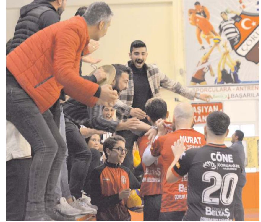
Maç sonunda sporcular ile taraftarların galibiyet sevinci görülmeye değerdi