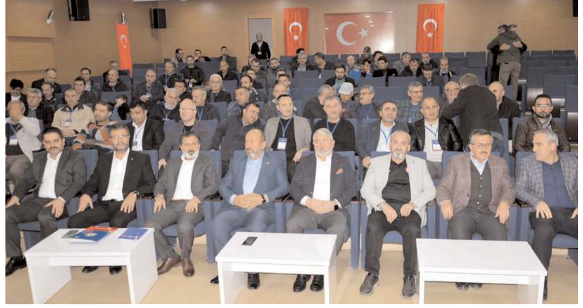
Genel kurulda yeni yönetim kurulu belirlendi.