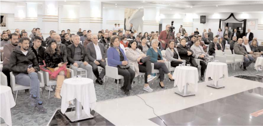
Alanbey Danışmanlık, Almanya'da iş fırsatları ile ilgili bilgilendirme toplantısı düzenledi.