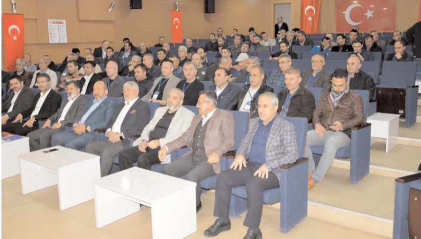
Genel kurul Turgut Özal İş Merkezi Belediye Konferans Salonu'nda yapıldı.