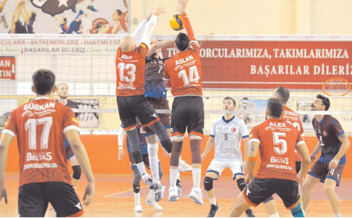
Çorum Belediyesi Gençlikspor rakibi önünde hücumda ve savunmada oldukça etkili oldu ve set vermeden kazandı