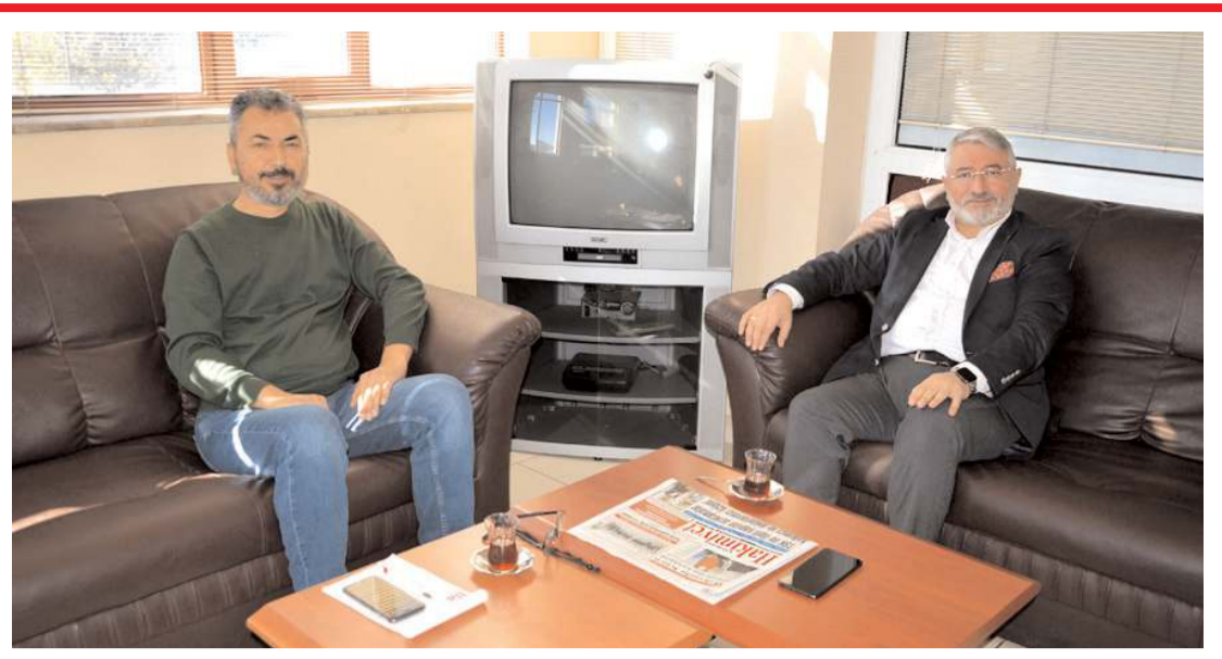
Ziyarete geçmişten bugüne dostluk anıları tazelandı.