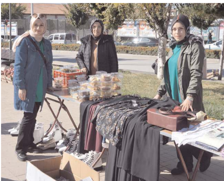
Kermeste yiyecek ve giyecek maddeleri satışa sunuldu.