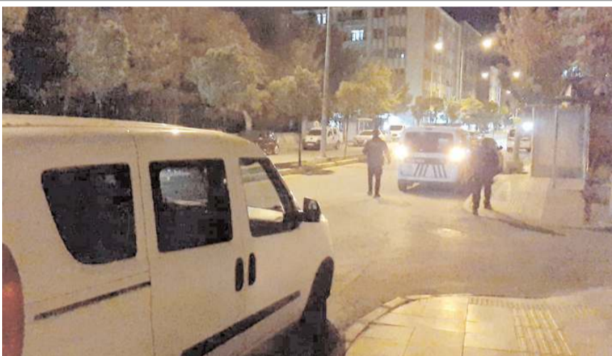
Olay Cengiz Topel Caddesi'nde meydana geldi.

Polis ekipleri bıçaklı saldırganı yakalamak için çalışma başlattı.(AA)