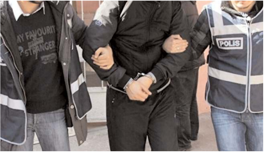
Çorum'da gözaltına alınan 10 şüpheliden 6'sı tutuklandı.

Şüphelilerden 6'sı cezaevine gönderildi, 4'ü adli kontrol şartıyla serbest bırakıldı.(AA)