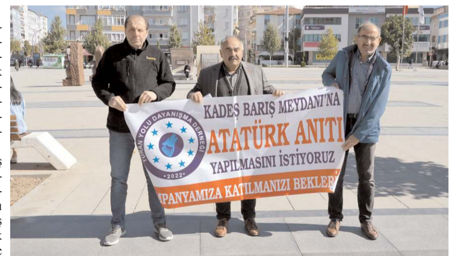
Turan Yolu Dayanışma Derneği, Kadeş Barış Meydanı'nda açıklama yaptı.

Batum, konuşmasında şu ifadelerle yer verdi: "Bizim talebimizde mevcut anıtın yıkılması diye bir ibaremiz mi var? Niçin atıl duruma düşecekmiş anlaşılır gibi değil. Herhalde talebimizin anlaşılmasında, kavranmasında bir sıkıntı, bir anlaşılma durumu var. İstenilen devasa bir anıt değildir. Atatürk'ü ve silah arkadaşlarımızı temsil eden, Kurtuluş Savaşı'nı anlatan bir kabartma, bir rölyef bir büst olabilir. Şu an Çorum'da, etkinliklerin, törenlerin, göste-