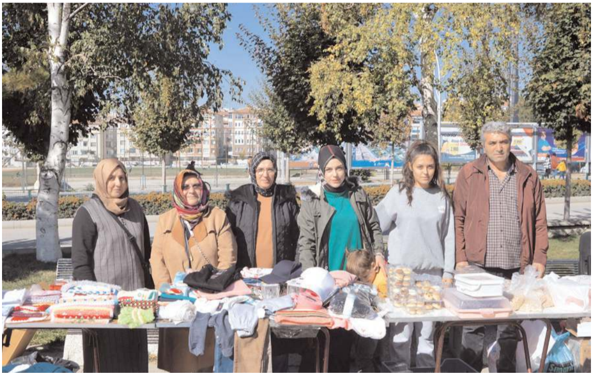
Kermes Yunus Emre Parkı'nda açıldı.