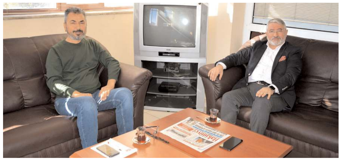
Ziyarete geçmişten bugüne dostluk anıları tazeleni.

TL TR 73 0001 0013 9548 2463 7250 13 $ TR 46 0001 0013 9548 2463 7250 14 € TR 19 0001 0013 9548 2463 7250 15