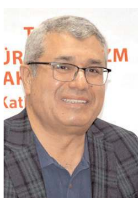
Seyit Ahmet Arslan

Kültürün ve Sanatın Kardeşiği 4.Müze Şiir Müzik Projesi konferansında konuşan Kültür Varlıkları ve Müzeler Genel Müdür Yardımcısı Seyit Ahmet Arslan, "Zengin bir medeniyetin evlatlarıyız. Medeniyetin izlerini sürmek istiyorsanız Anadolu'dan başlamalısınız" dedi.