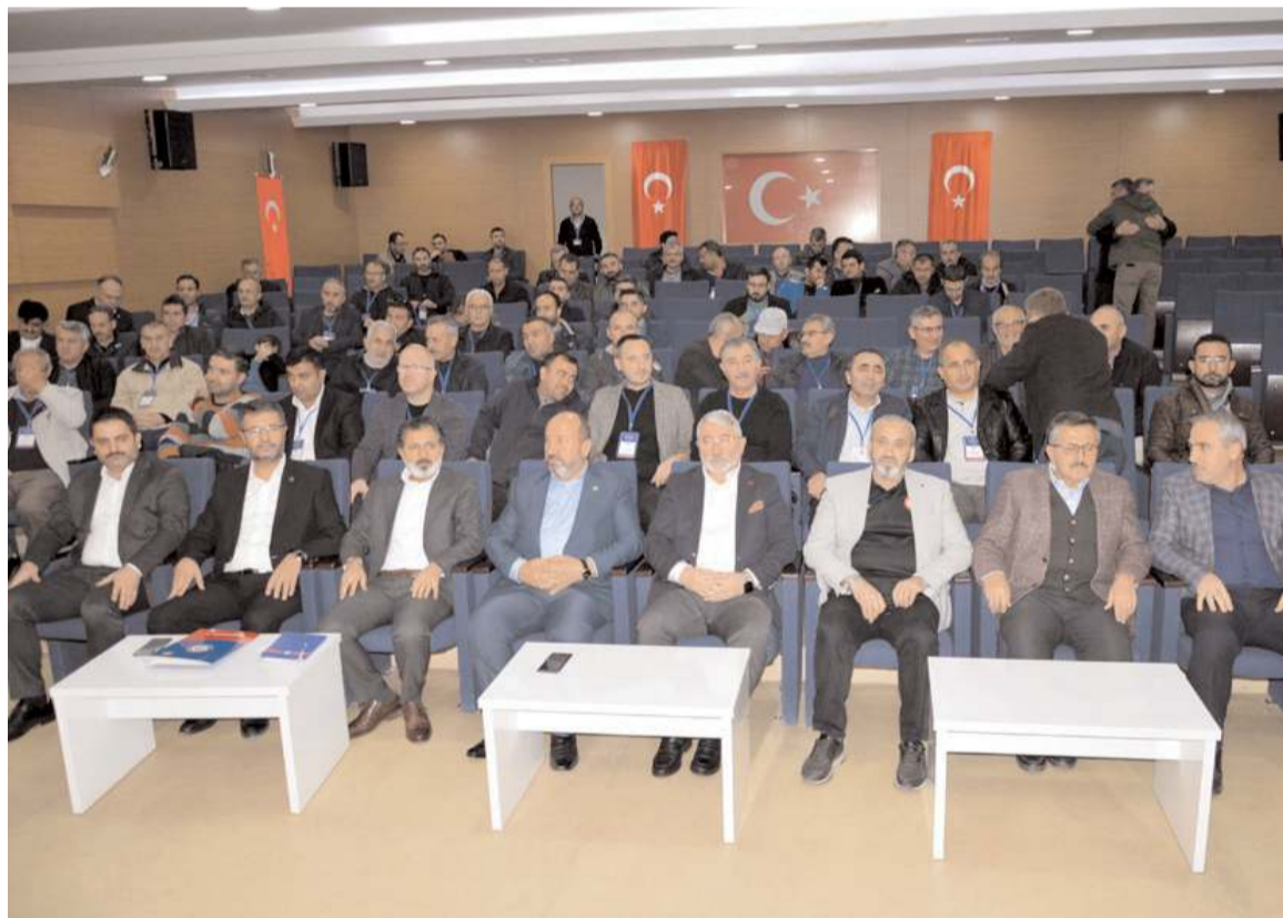
Genel kurulda yeni yönetim kurulu belirlendi.