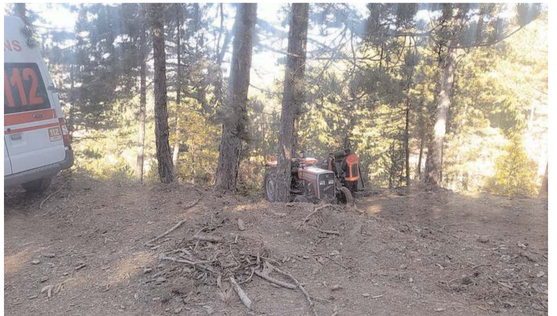
112 acil sağlık ekipleri yaptıkları incelemede Sefer Öztürk'ün hayatını kaybettiğini belirledi.