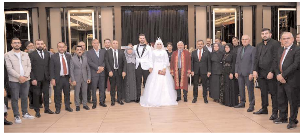
Düğüne çok sayıda davetli katıldı.

Resmi İlanlar: www.ilan.gov.tr'de (Basın: 1714728)