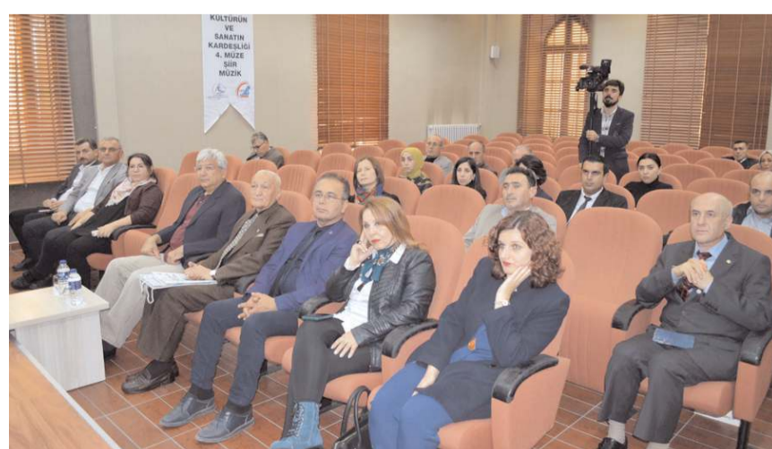
Program Çorum Müzesi konferans salonunda yapıldı.