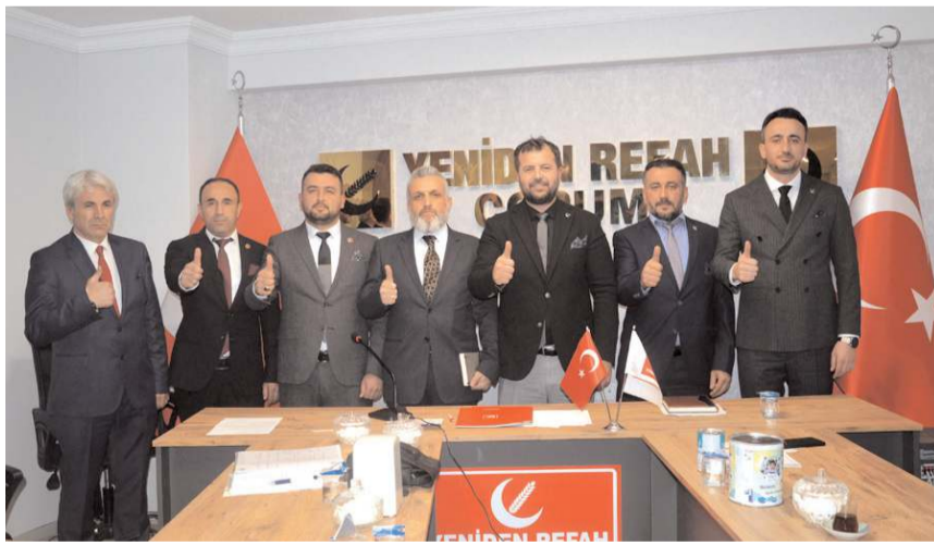
Yeniden Refah Partisi Çorum İl Başkanlığı Milletvekili Aday Adaylarının tanıtımına devam ediyor.

■ Yeniden Refah Partisi Çorum İl Başkanlığı'nda aday adayı bolluğu yaşanıyor. Seçimlerde her hangi bir ittifakta yer almayıp, tek başına seçime gitme kararı alan Yeniden Refah Partisi'nde Çorum'un aday adayları için tanıtım toplantısı düzenlendi.