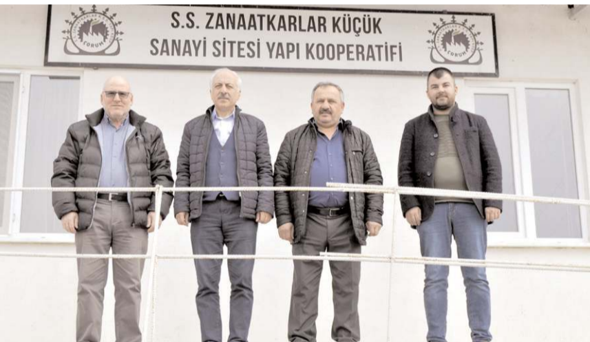
Ziyaretin sonunda hatıra fotoğrafı çekildi.