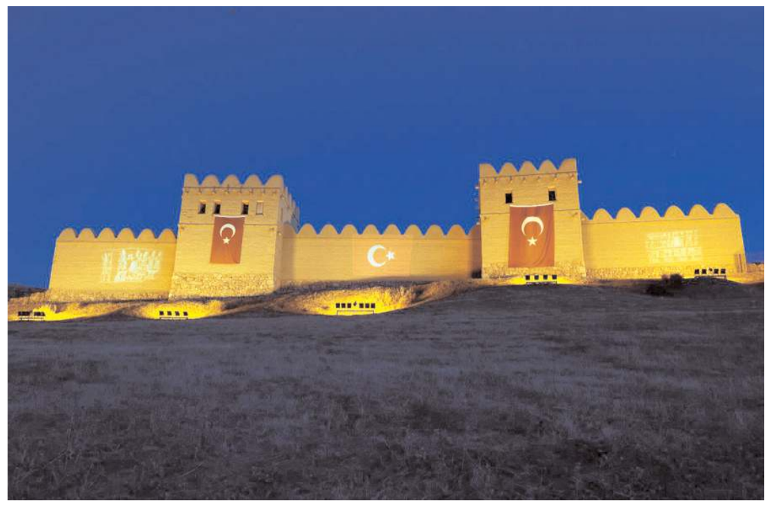
"Kültürler Hattuşa'da Buluşuyor" başlıklı proje, Erasmus+ Gençlik Programı kapsamında desteklenmeye hak kazandı.

"Öğrencilerimiz son 3 yılda proje üretiminde hız kesmiyorlar. Her geçen yıl, öğrenci proje sayımız artıyor. Teknoloji Transfer Ofisimiz her zaman öğrencilerimizin yanında ve çok ciddi çalışmalarımız var. Öğretim elemanlarımız ve öğrencilerimizle birlikte başta ihtisaslaşma alanımız olmak üzere ülkemizin gelişimine katkı sağlayacak projeler geliştirmeye önem veriyoruz. Birlikte yeni başarı hikayeleri yazdığımız öğrencilerimizle gurur duyuyoruz. Önümüzdeki dönemlerde nitelikli proje sayımızın daha da artacağına yürekten inanıyorum. Projeleri kabul gören öğrencilerimizi ve sürece büyük destek veren danışman hocalarımızı tekrar tebrik ediyor, başarılarının devamını diliyorum." (Haber Merkezi)