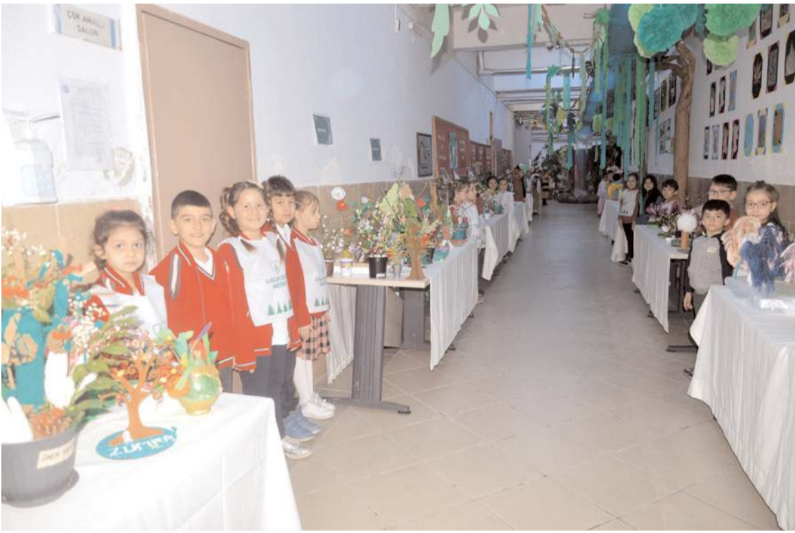
Fatih Sultan Mehmet İlkokulu'nda Orman Sergisi açıldı.

yat ve sevgi veren, geçmişin birikimini, tecrübelerini ve değerlerini yarınlara taşımamızı sağlayan, toplumsal yaşantımızın en önemli parçaları yaşlılarımızı sadece bu haftada değil yılın 365 günü sevgiyle ve ilgiyle hatırlayalım. Dün ile bugün arasında köprü kuran büyüklerimizin 18-24 Mart Yaşlılar Haftasını kutlarız. İyi ki varsınız." (Haber Merkezi)