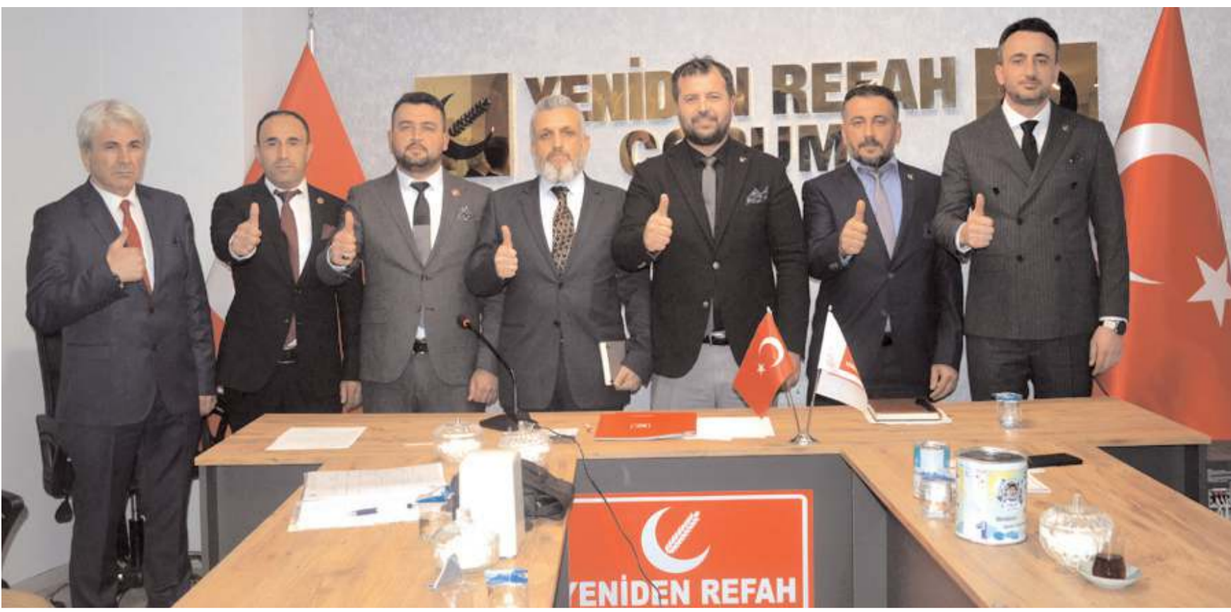
Yeniden Refah Partisi Çorum İl Başkanlığı Milletvekili Aday Adaylarının tanıtımına devam ediyor.