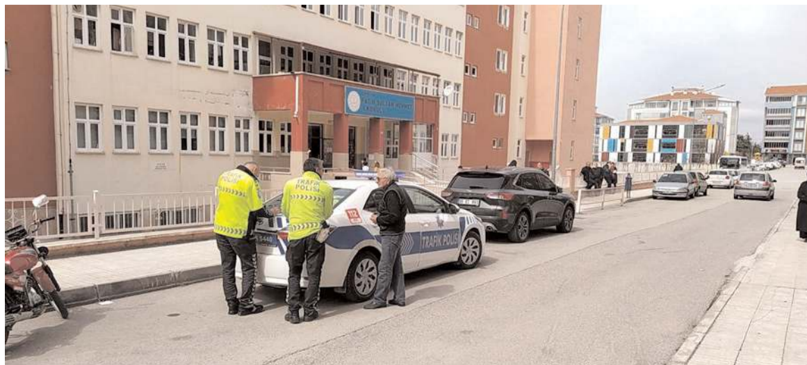
Polis ekipleri olay yerinde incelemede bulundu.

Çorum'da okulun önünde yolun karşısına geçmek isteyen çocuk, otomobilin çarpması neticesinde yaralandı.