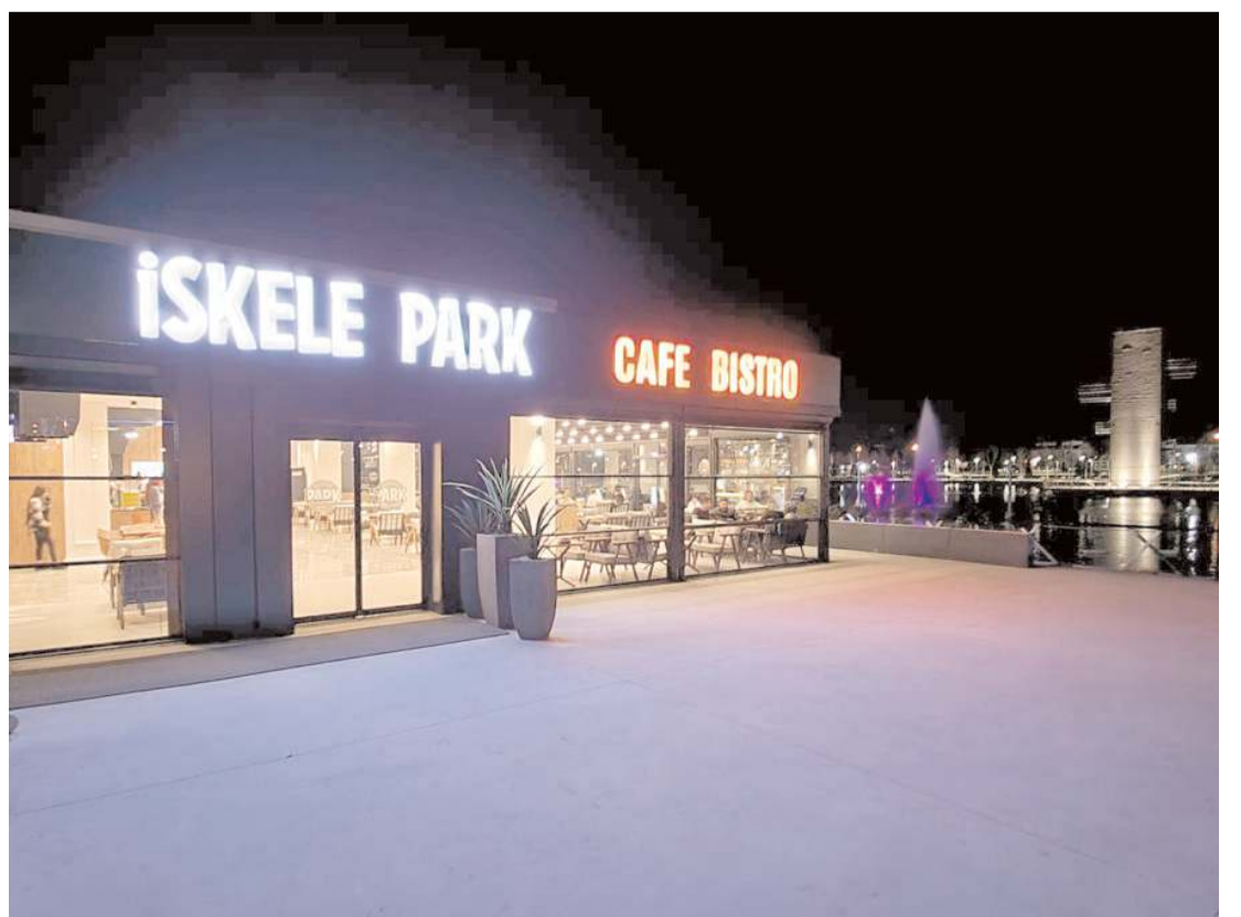
İskele Park Kafe ve Restoran Ramazan ayında iftar ve sonrasında açık olacak.