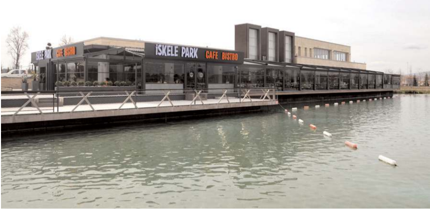
Iskele Park Kafe ve Restoran, Millet Bahçesi'nde faaliyete başladı.