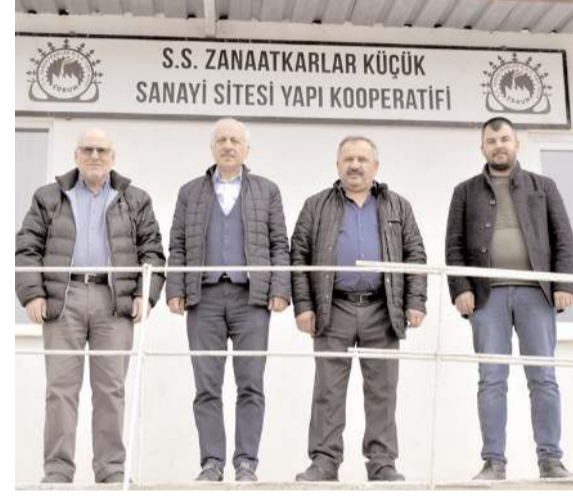
Ziyaretin sonunda hatıra fotoğrafı çekildi.