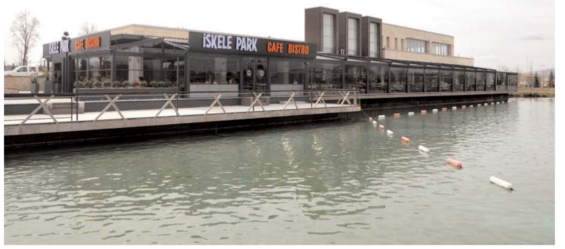
İskele Park Kafe ve Restoran, Millet Bahçesi'nde faaliyete başladı.