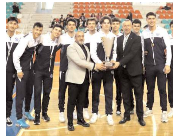
1. lige çıkan Arkasspor'un kupasını Gençlik ve Spor İl Müdürü Cemil Çağlar ile Türkiye Voleybol Federasyonu As Başkanı Ahmet Göksu birlikte verdiler