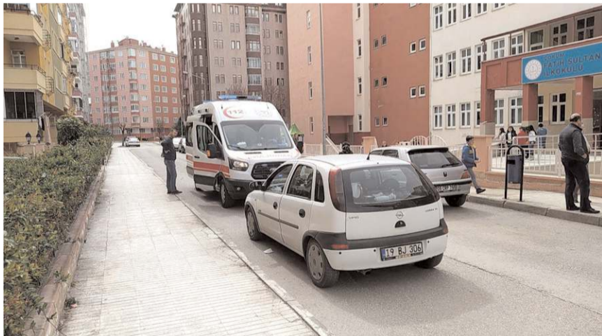
Olay Üçtutlar Mahallesi'nde bir okulun önünde meydana geldi.