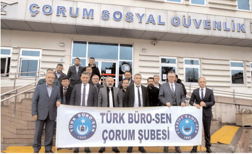
Türk Büro Sen Çorum Şubesi SGK önünde basın açıklaması yaptı.