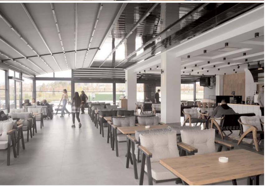
İskele Park Kafe ve Restoran Çorum'un yeni lezzet durağı olmayı hedefliyor.