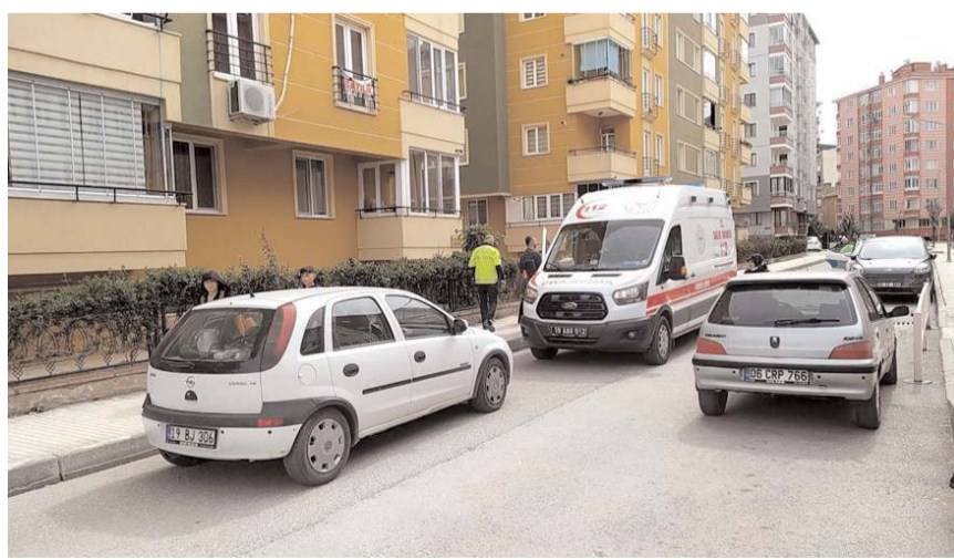
Yaralı öğrenciye ilk müdahaleyi sağlık ekipleri olay yerinde yaptı.