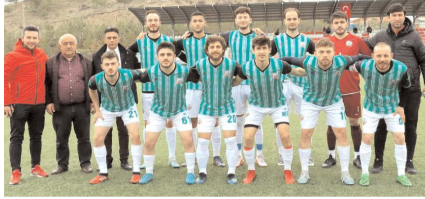
Sungurlu Belediyespor evinde kazanarak şampiyonluk yolunda bir engeli daha aştı

düşme mücadelesi veren Mecitözü Gençlerbirliği ile İskilipspor arasında oynanacak. Bu hafta sonu oynanacak maçların ardından 1. Küme'de üç hafta sonra ligde heyecan sona erecek.