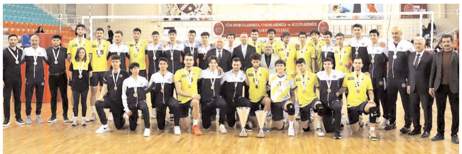
1. lige çıkan Arkasspor ve Fenerbahçe takımları kupa töreni sonrasında toplu halde görülüyor