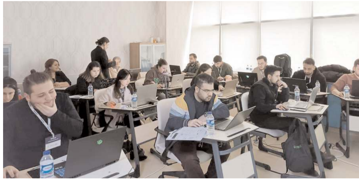
'Dijital Pazarlama Eğitimleri'ne 20 kursiyer katıldı.