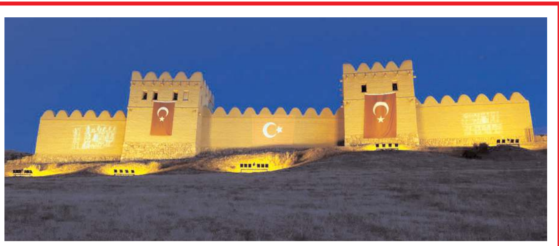
Projede; İspanya, İtalya, Macaristan, Estonya, Yunanistan ve Makedonya olmak üzere 6 farklı ülkeden ortaklar yer alıyor