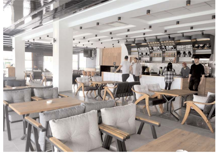
İskele Park Kafe ve Restoran nezih ortamı ile dikkat çekiyor.

İskele Park Kafe ve Restoran'da ayrıca Ramazan ayında iftar ve sonrasında açık olacak. İftar yemeği için rezervasyon işlemleri 0 (506) 273 13 13 numaralı telefondan yapılabilecek.