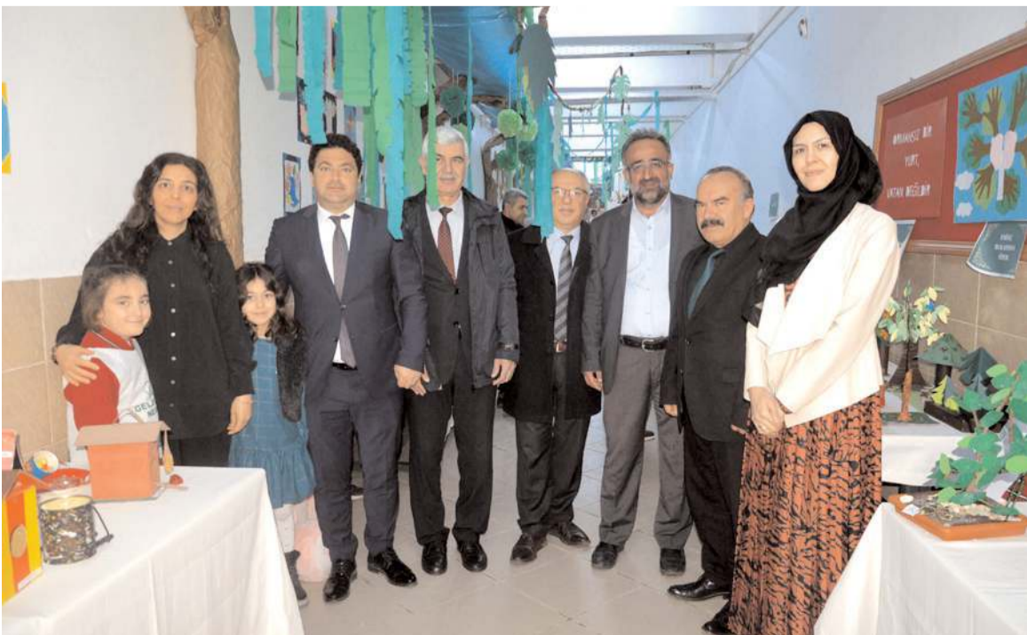
Öğrenciler sergide yer alan projelerinde çevre kirliliğine ve doğanın korunmasına dikkat çektiler.

imza attılar. Gelecek nesillere doğanın ve yeşilin önemini bu tür etkinliklerle anlatmış oluyoruz. Emegi geçen herkese teşekkür ederiz." dedi.