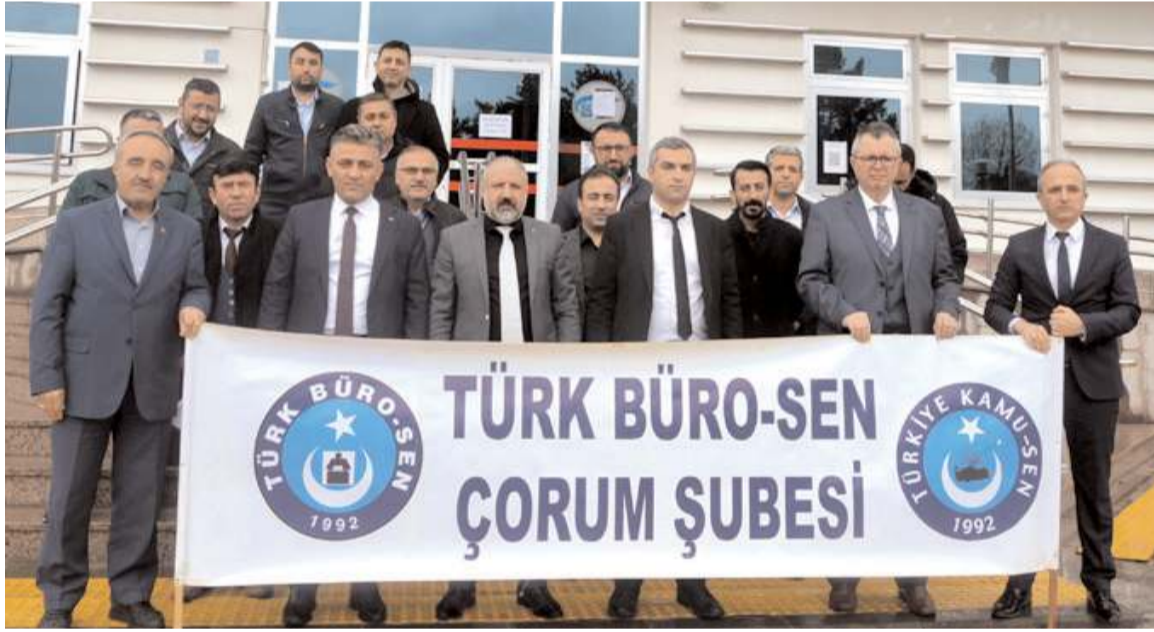
Türk Büro Sen Çorum Şubesi SGK önünde basın açıklaması yaptı.