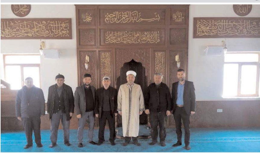
Caminin temeli 25 Mart 2019 yılında atılmıştı.