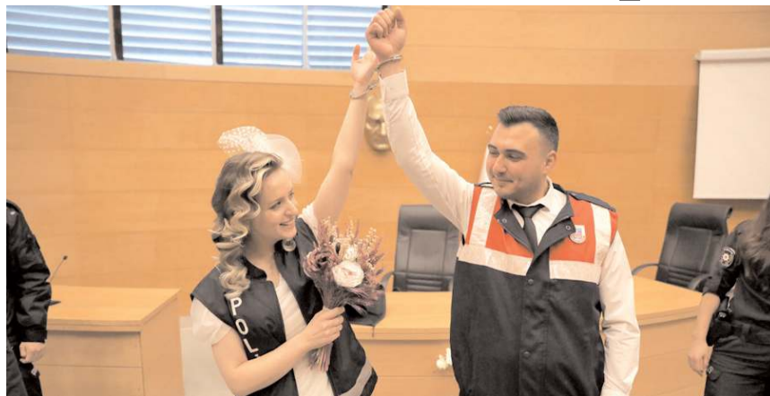
Genç çift nikah merasimi ardından kelepçe ile birlikte poz verdiler.