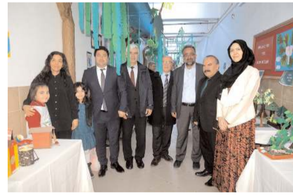
Öğrenciler sergide yer alan projelerinde çevre kirliliğine ve doğanın korunmasına dikkat çektiler.