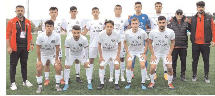
Çorum FK U 19 takımı final grubunda Elit B ligine yükselmek için mücadele edecek

Çorum FK U 19 takımının rakibinin önümüzde hafta içinde Federasyon tarafından açıklanması bekleniyor.