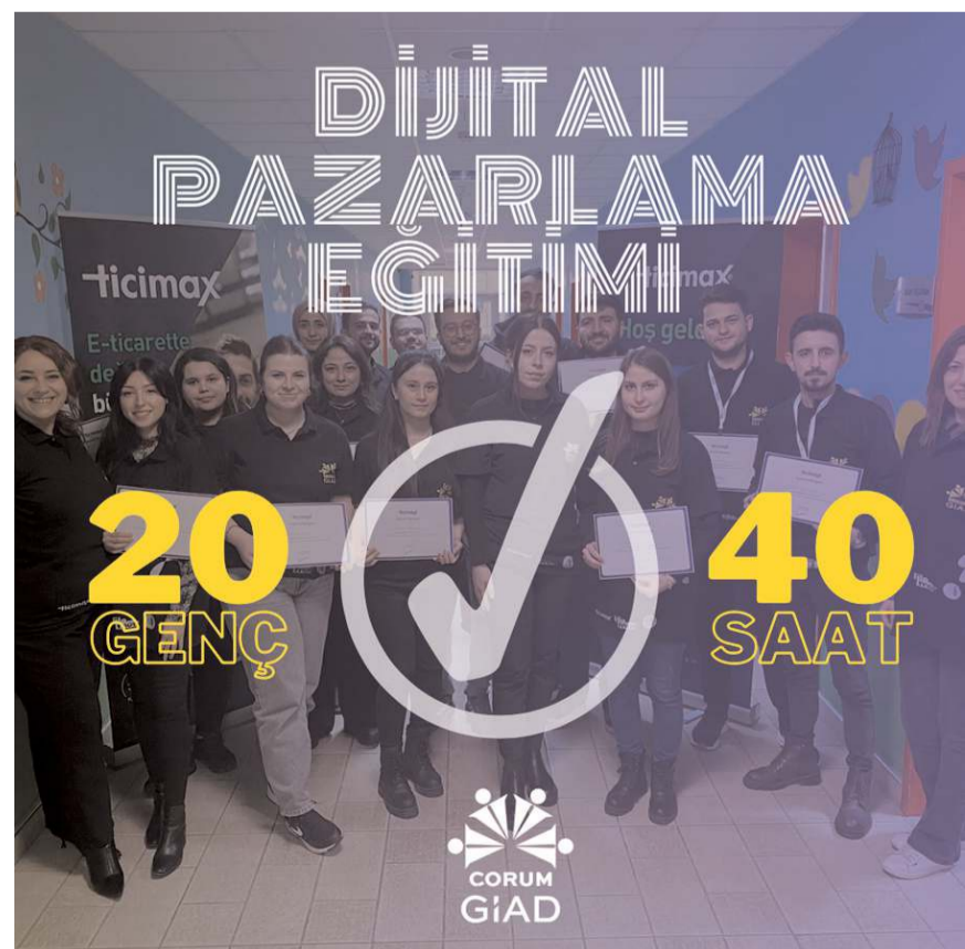
Eğitimleri başarıyla tamamlayanlara sertifikaları verildi.