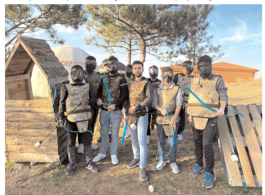
Gençler kampta çeşitli etkinlikler yaptılar.