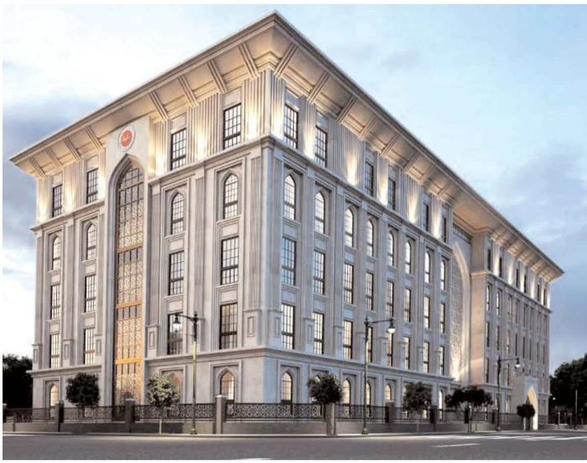
Hıdırlık Yatılı Kur'an Kursu'nun temeli bugün atılacak.