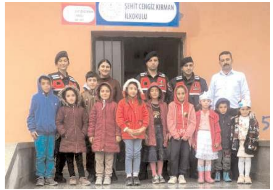
Ziyaretlerde öğrencilere jandarma hakkında bilgiler verildi.

Ziyaretlerde öğrencilere Tim Jandarma Çizgi Filmi izletilirken Jandarma Çocuk Dergisi ve Jandarma Trafik Boyama Kitabı da hediye edildi. (Haber Merkezi)