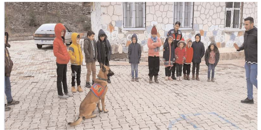
Öğrenciler iz takip köpeği ile yapılan gösteriyi ilgiyle izlediler.