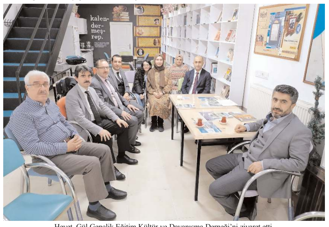
Heyet, Gül Gençlik Eğitim Kültür ve Dayanışma Derneği'ni ziyaret etti.