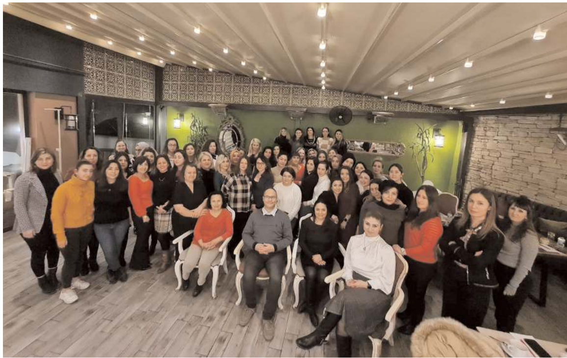
Kadın muhasebeciler Gülümoğlu Yem'in sponsorluğunda Lila'da buluştu.