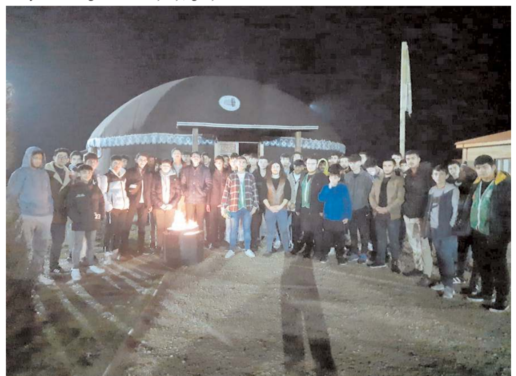
Gençler kamp ateşi başında hatıra fotoğrafı çektiler.