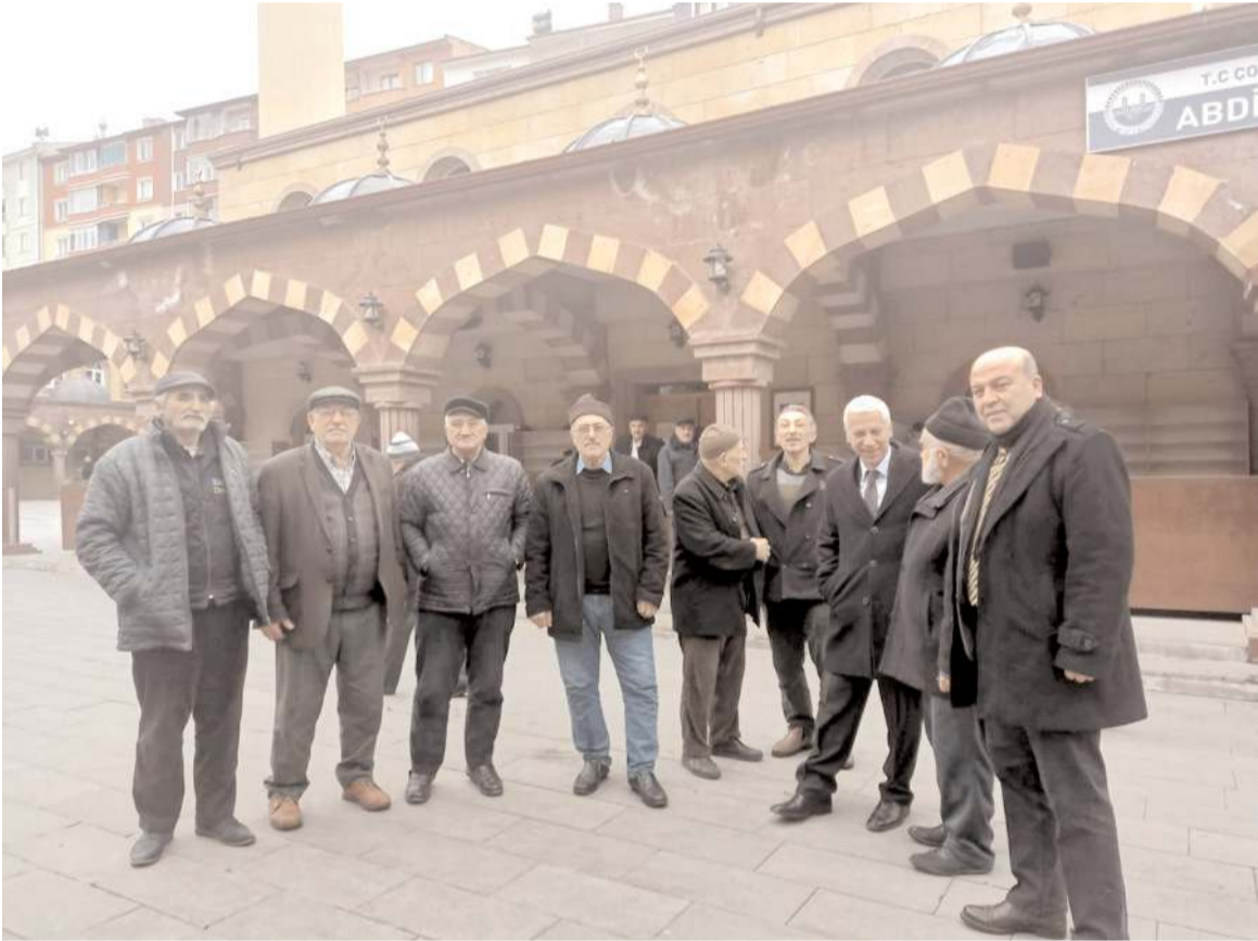
Mevlid programı Abdibey Camiinde yapıldı.