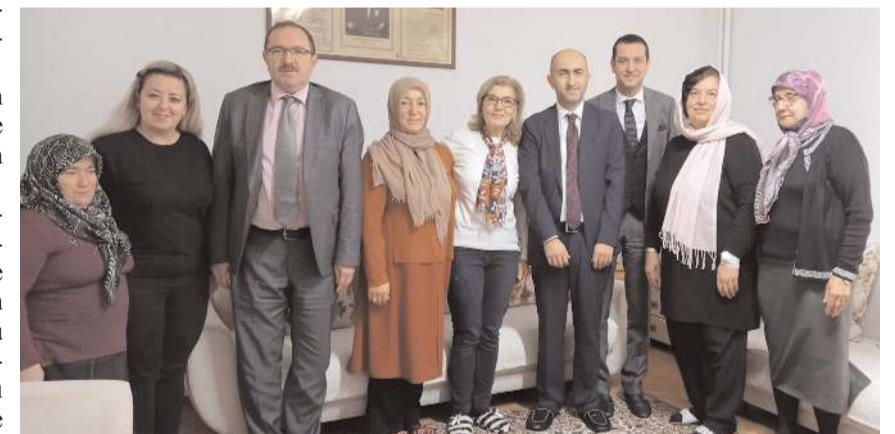
Heyet, Çorum Kanser Hastaları Yardımlaşma ve Dayanışma Derneği'ni ziyaret etti.