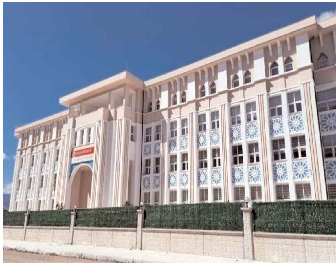
Faaliyete başlayan Lalezar Yatılı Kız Kur'an Kursu'nun açılışı yapılacak.

Müftülüğün icazet töreni, açılış ve temel atma programları bugün