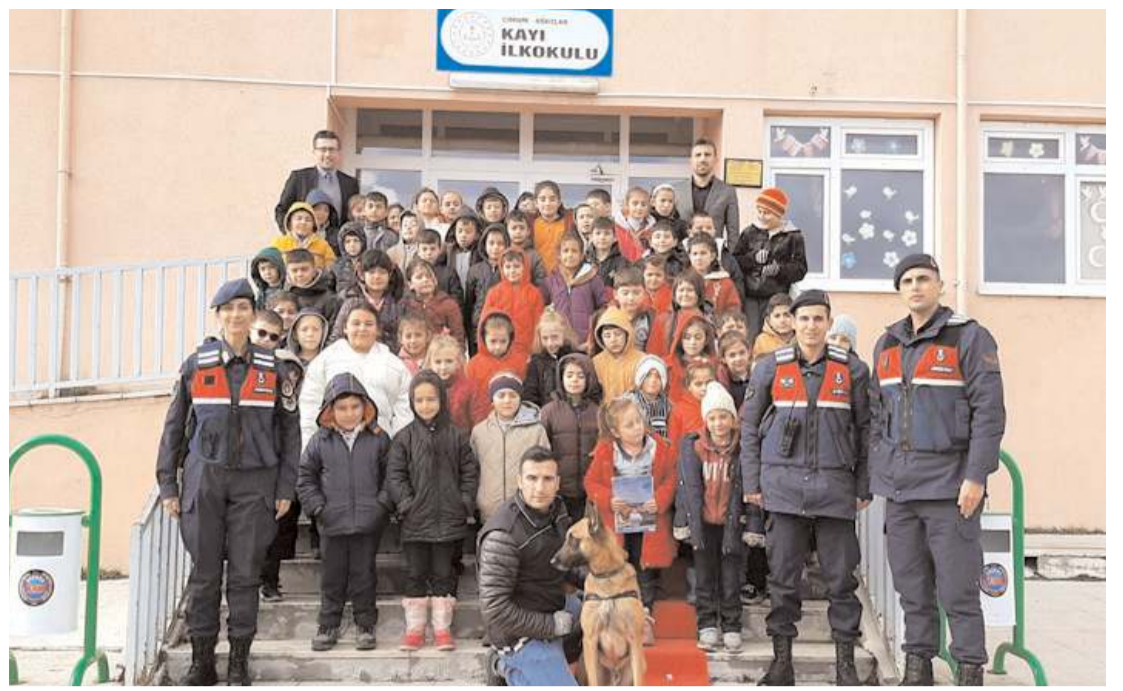
Jandarma Oğuzlar ve Uğurludağ'a bağlı köy okullarını ziyaret etti.