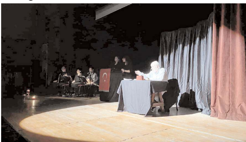
Oyun Devlet Tiyatro Salonunda sahnelendi.