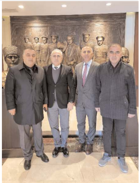
Hitit ve Frig medeniyetlerini anlatan tanıtım projesi için ön değerlendirmelerde bulundu.

"Vakıf 19 olarak başlatmış olduğumuz Hitit Uygarlığı'nı Anadolu'da yaşamış diğer medeniyetlerle bir araya getirerek tanıtma projesinin birincisi 'Hitit Likya' olarak Antalya Patara'da gerçekleştirildi. Bu programın 2.'sini 'Hitit Frig' olarak Polatlı'da yapacağız. Bu programların Çorum ve Hitit uygarlığı tanıtımına büyük katkı vereceğine eminim. Sayın Kadim Koç'a misafirperverliği için teşekkür ediyorum" dedi.