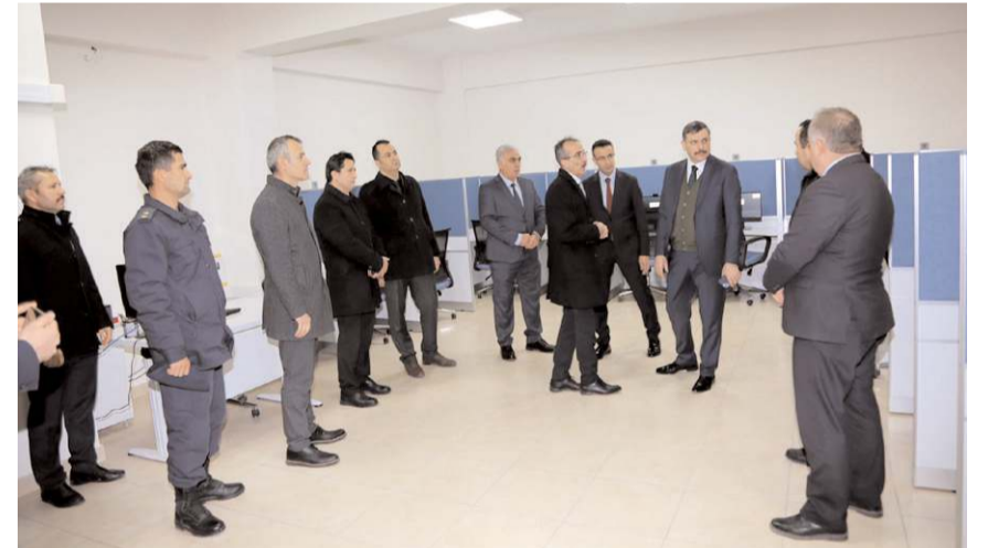
Vali Çiftçi, Osmaniye E-Sınav Merkezini ziyaret etti.