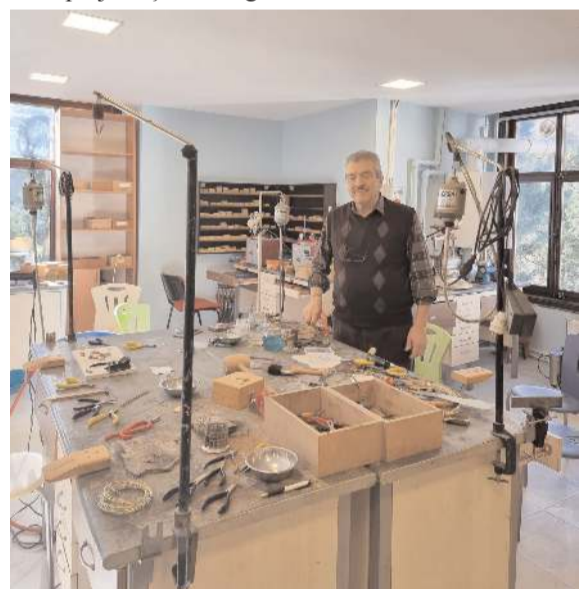
Polatlı Tarihi Alanlar Tanıtım Merkezi'nde bölge bulunan eserler restore ediliyor.