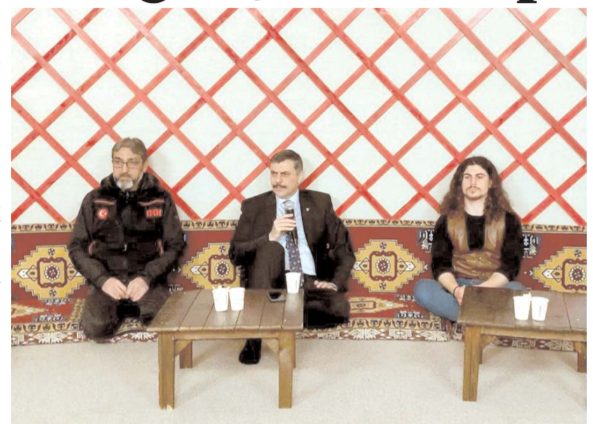
Çorum Genç İHH'nın kampını Vali Mustafa Çiftçi de ziyaret etti.

Geceyi Çorumlu Obası'nda geçiren gençler, sabah kahvaltısının ardından Oba'dan ayrıldılar. (Haber Merkezi)