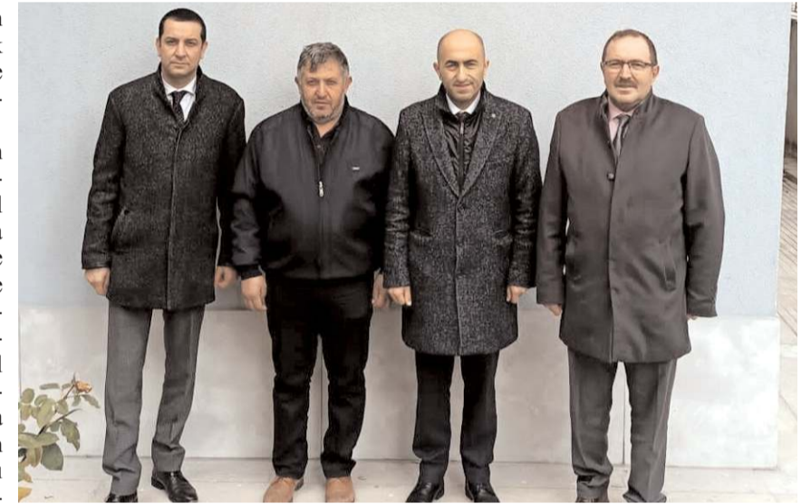
Heyet, Kader Kanserle Sağlıklı Yaşam Derneği'ni ziyaret etti.