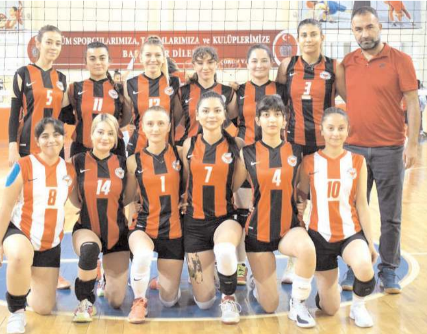
Çorum Voleybol yarın grupta play-off mücadelesi veren İskofyaspor deplasmanında