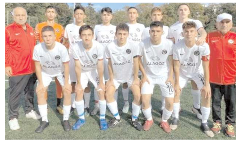
Çorum FK U 17 takımı bugün 52 Orduspor FK deplasmanında galibiyet arayacak

2. Amatör Küme Bayat Belediyespor, Dodurga Gençlikspor, Düvenci Belediyespor, HE Kültürspor Mecitözüspor, Oğuzlar Belediyespor ve Osmançıkgücüspor.