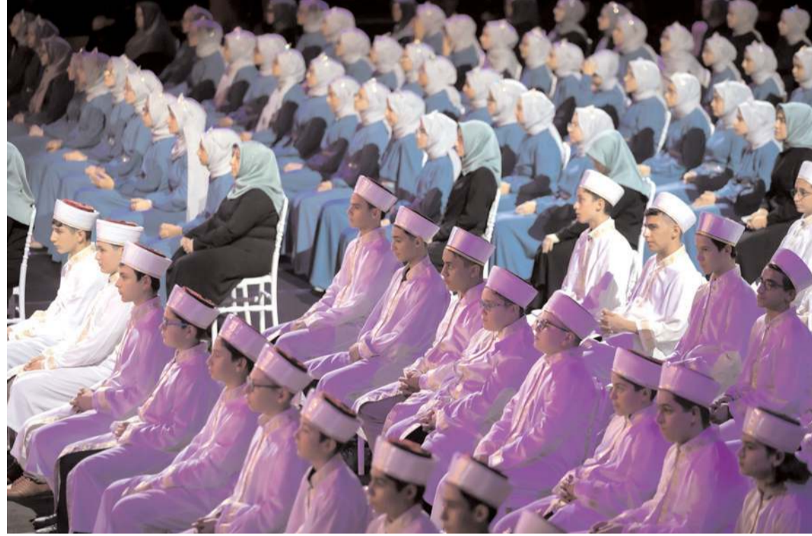
260 hafızın icazet töreni Atatürk Spor Salonu'nda gerçekleştirilecek.

Çorum Müftülüğü'nün dört gözle beklenen programları bugün gerçekleştirilecek. Atatürk Spor Salonu'nda saat 10.00'da 260 hafızın icazet töreniyle başlayan programlar, mimari yapısı ve modernliği ile bu milletin kız evlatlarına ilim irfan yuvası olan Lalezar Yatılı Kız Kur'an Kursu'nun açılış töreni ile devam edecek. Yıllarca köhne binada mahpus kalan Hıdırlık Kur'an Kursu'nun adeta berat töreni haline gelecek olan Hıdırlık Yatılı Kur'an