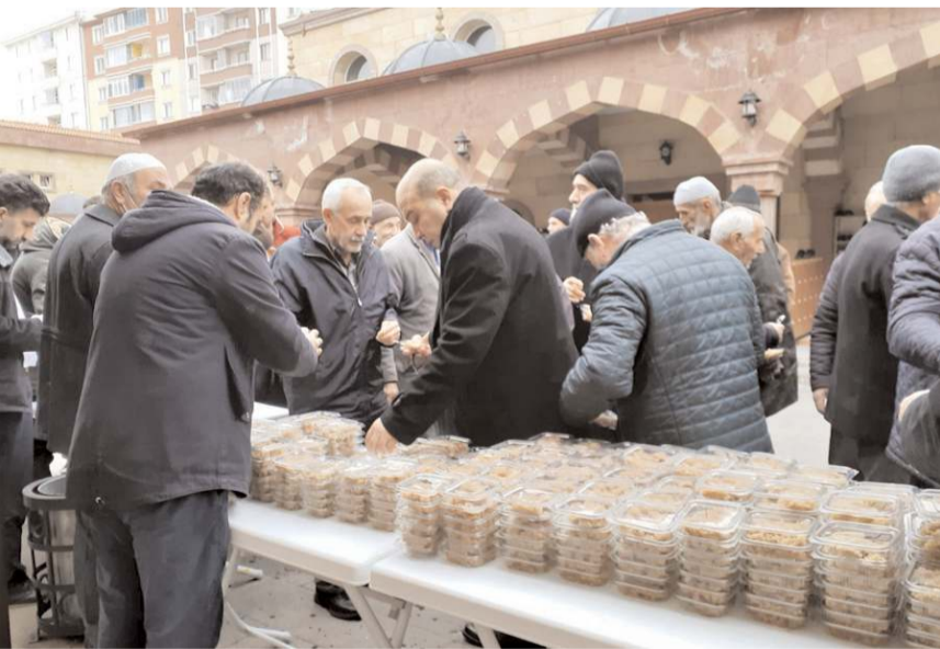
Mevlidin ardından 750 kişilik helva dağıtıldı.