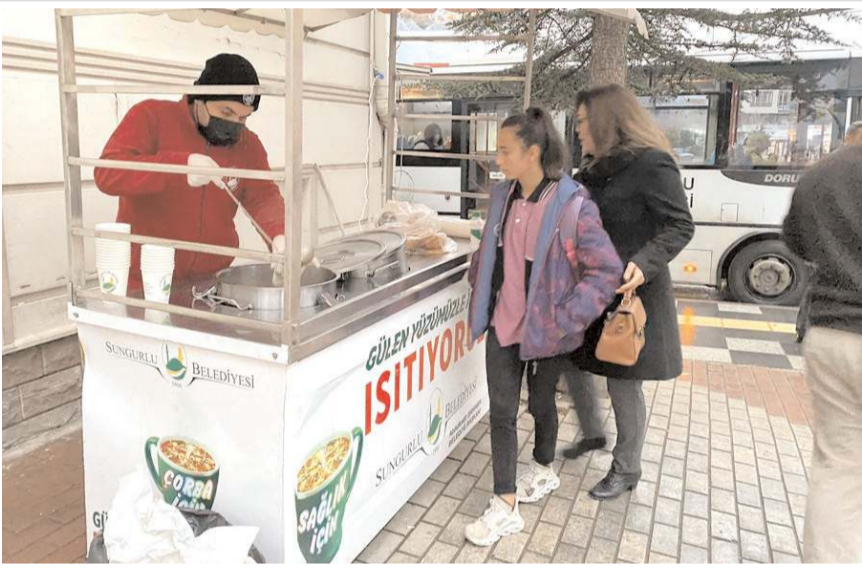
Sabah erken saatlerde işine ya da okula giden vatandaşlar uygulamadan memnun.

Çorba dağıtım hizmetinden memnun olan vatandaşlar, "Belediyemiz tarafından sıcak sıcak sabahları çorba ikram edilmesi bizleri çok duygulandırdı. Be-