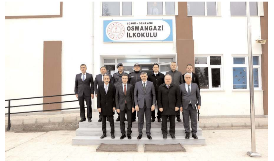
Bina güçlendirme çalışmaları tamamlanan Osmaniye Osmangazi İlkokulu eğitim-öğretime başladı.