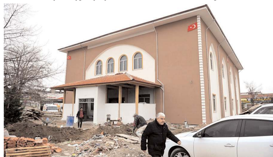
Mescidin dış cephesinde çalışmalar tamamlandı.