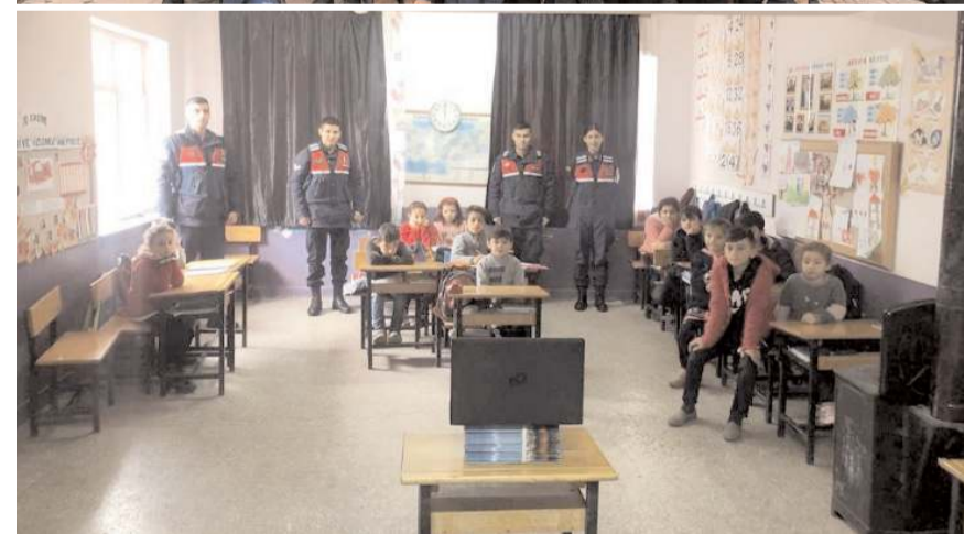
Öğrencilere Tim Jandarma Çizgi Filmi izletildi.