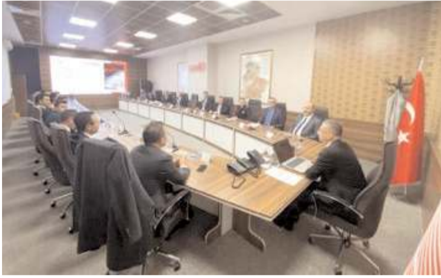
Toplantıya resmi kurumların temsilcileri katıldı.