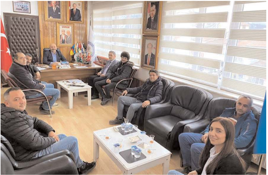
Toplantıda 2023 yılında yapılacak projeler istişare edildi.

Başkan İsbir, konu ile ilgili yaptığı toplantıda, "İlçemizde bir çok hizmet ve projenin gerçekleştirilmesine imza atan Şapınuva Kadeş Derneği'nin yönetim kurulu toplantısını gerçekleştirdik. Önümüzdeki yıllarda gerçekleştirilecek hizmet ve projeler hakkında görüş alışverişinde bulunduk. Yönetim kurulunun hepsi gençlerden oluşmakta. Hepsinin ayrı ayrı çok güzel fikirleri var. İlçemizin gelişip güzelleşmesi için bütün yönetim kurulu arkadaşlarım bir çaba içerisinde. Yönetim kurulu toplantımızın ilçemize hayırlı olmasını diliyorum, üyelerimize ve görevli arkadaşlarımıza başarılar diliyorum" dedi. (Haber Merkezi)