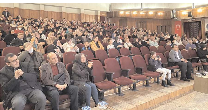
Oyuna ilgi yüksek oldu.

Kültür ve Turizm Bakanlığı Güzel Sanatlar Genel Müdürlüğü tarafından 2021-2022 sanat sezonunda desteklenen 'Bizim Akif' adlı tiyatro oyunu Çorum'da izleyicilerle buluştu.