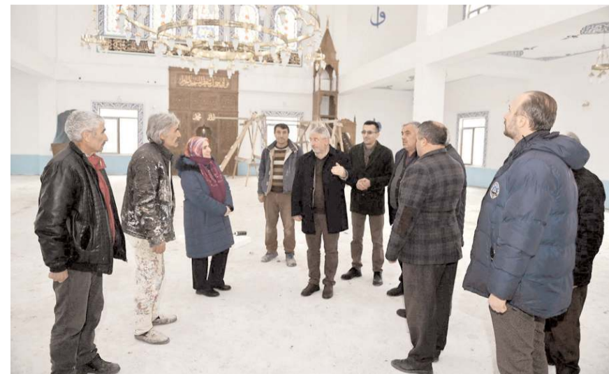
Başkan Aşgın, çalışmaların son durumu hakkında bilgi aldı.