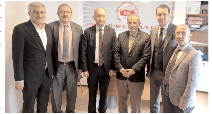
Heyet, İmam Hatipli Kamu Çalışanları Derneği'ni ziyaret etti.