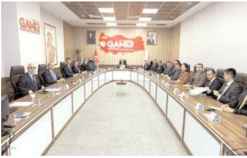
Toplantı Vali Yardımcısı Tamer Orhan'ın başkanlığında yapıldı.