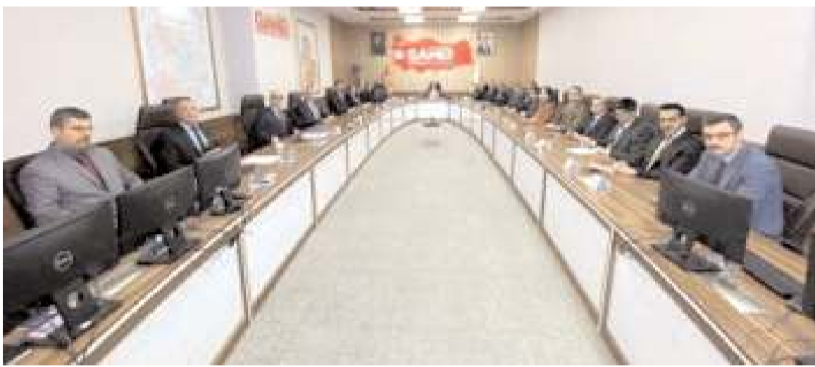
Toplantıda, 2022 yılı değerlendirmesi yapılarak, 2023 yılı için planlanan çalışmalar görüşüldü.

Çorum Valiliği İl Güvenlik ve Acil Durumlar Koordinasyon Merkezi, yaptığı toplantıda 2022 yılını değerlendirdi.