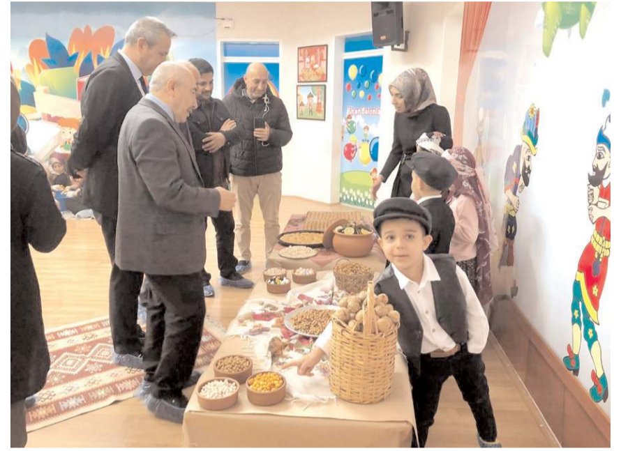
Etkinlikte yerli üretimin önemine dikkat çekildi.

Etkinliğe, Milli Eğitim Şube müdürleri, okul müdürleri, öğretmen ve öğrenciler katıldı. (İHA)