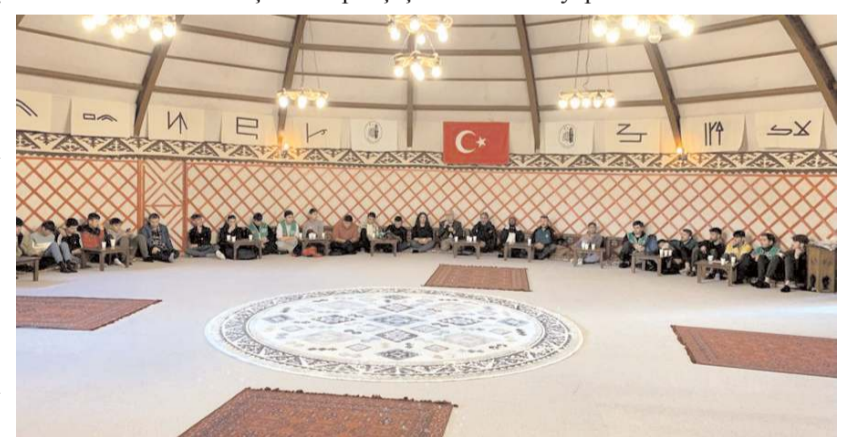
Gençler, arama kurtarma faaliyetleri hakkında bilgilendirildi.