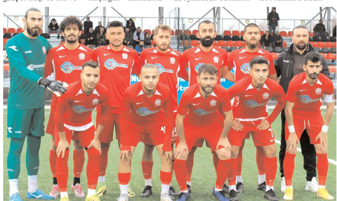
Osmancık Belediyespor iki aylık bir aranın ardından yarın sahasında oynayacağı Yozgatspor maçı kazanmak istiyor