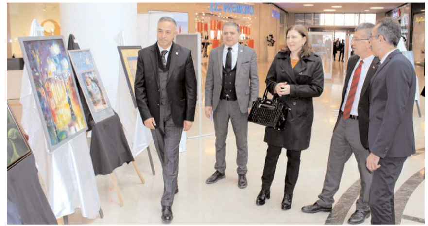
Sergi AHL Park AVM'de açıldı.