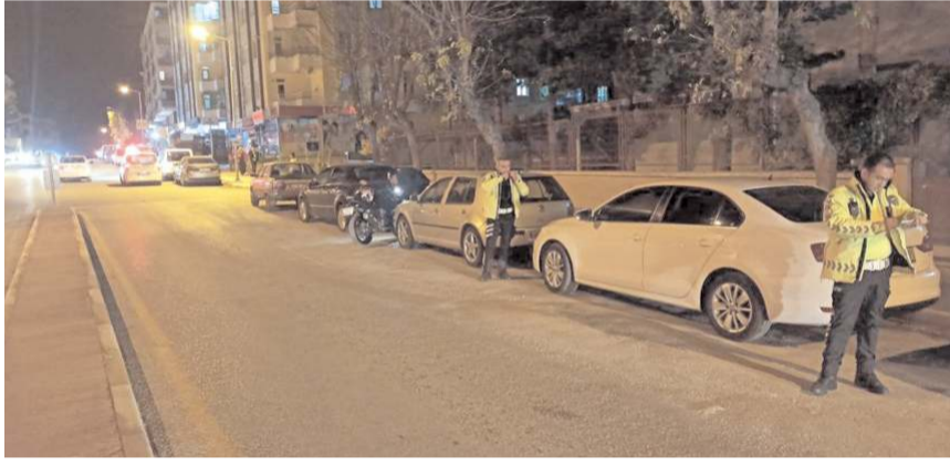
Kaza, Bahçelievler Mahallesi'nde meydana geldi.