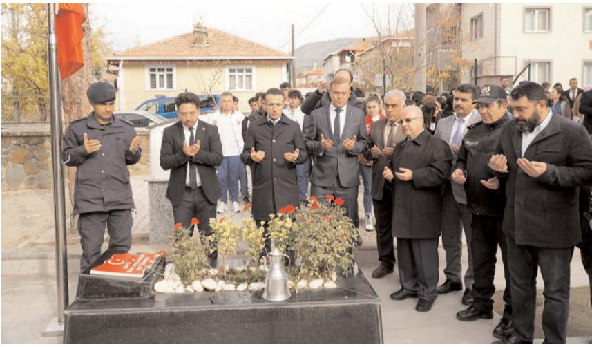
Programda şehitler için dua edildi.