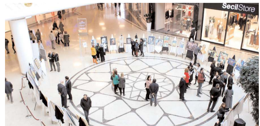
Sergide öğretmenlerin 50'ye yakın eseri yer alıyor.