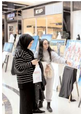
Sergide eseri bulunan öğretmenlere katılım belgesi verildi.

Açılışta sergide eseri bulunan öğretmenlere katılım belgesi verildi.