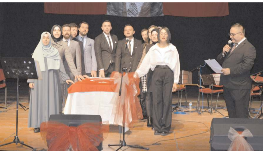
Mesleğe yeni başlayan öğretmenler yemin etti.