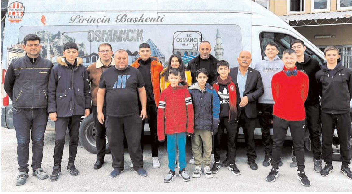
Badminton Türkiye Şampiyonasına hareket öncesinde sporcular ve antrenörleri toplu halde

kırmızı siyahlı takım taraftarlarının neden olduğu çirkin ve kötü tezahüratı bir sezon içinde üçüncü kez gerçekleşmesinden dolayı 14 bin lira ceza verildi. Çorum FK'ya yine taraftarlarının sahaya attığı pet sular nedeni ile de 21 bin lira ceza verildi ve kırmızı siyahlı takımın bu maçtaki hasılatı bu cezaları karşılamaya bile yetmedi. Kulüp bu ödemeler içinde kaynak arama zorunda kaldı.