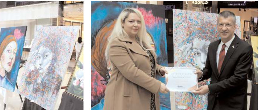
Sergide eseri bulunan öğretmenlere katılım belgesi verildi.