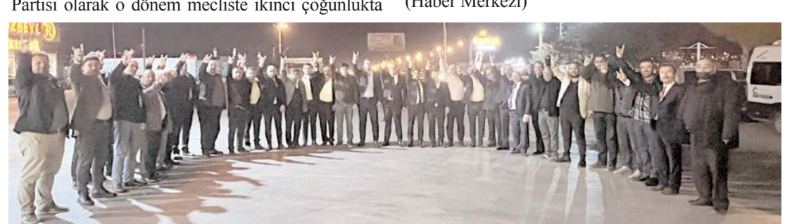
Programın sonunda toplu hatıra fotoğrafı çekildi.