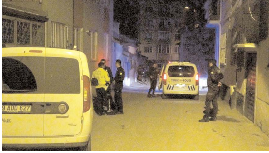
Olay Yeni Yol Mahallesi Yavruturna Sokak'ta meydana geldi.