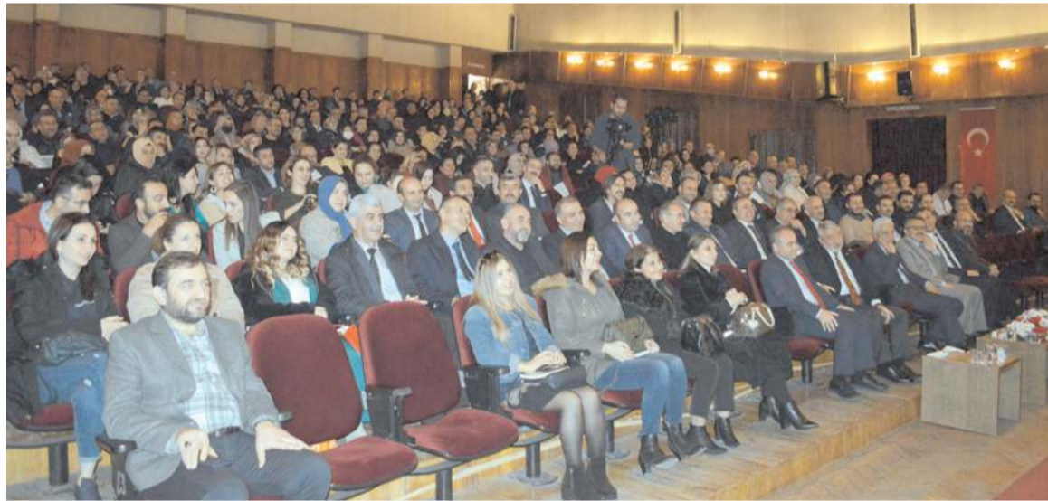
Devlet Tiyatro Salonunda yapılan konferansa ilgi yüksek oldu.