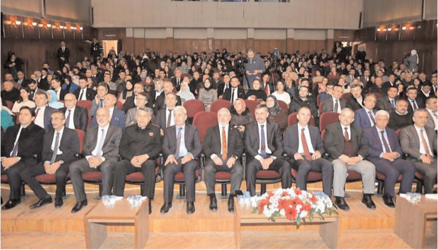
Öğretmenler Günü kutlama programı DTS'de gerçekleştirildi.