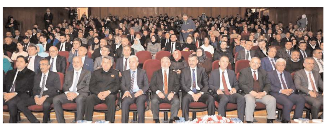
Öğretmenler Günü kutlama programı DTS'de gerçekleştirildi.

AK Parti Çorum Milletvekili Erol Kavuncu, 28 Şubat Mağduru Öğrenci Derneği Genel Başkanı Emine İlyas ve Yönetim Kurulu Üyeleri, Türkiye Büyük Millet Meclisi'nde Cumhurbaşkanı Recep Tayyip Erdoğan ile görüşerek, bir başörtüsü mağdurunun 1999 yılında gönderdiği mektubun orijinali ve Cumhurbaşkanı'nın yazdığı cevabi mektubun orijinalini hediye ettiler. * HABERİ 6'DA