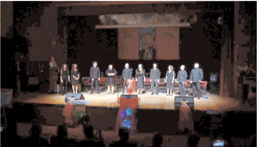
Programda öğretmenlerden oluşan koro müzik dinletisi sundu.