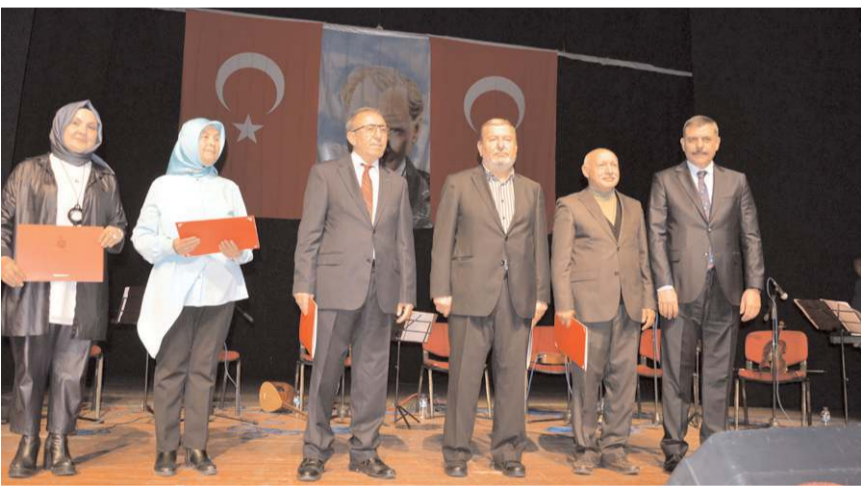
Emekliye ayrılan öğretmenlere Hizmet Şeref Belgesi'ni Vali Mustafa Çiftçi verdi.