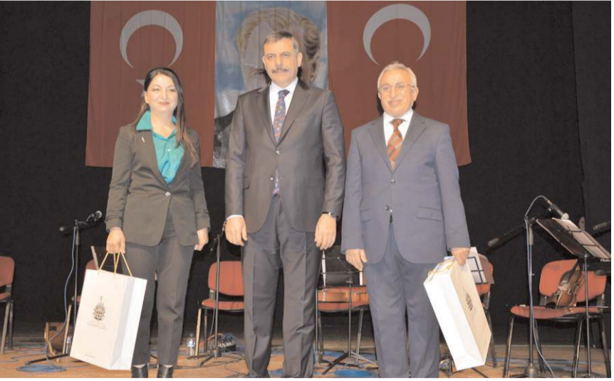
Kompozisyon yarışmasında derece elde eden öğrencilere ödülleri verildi.