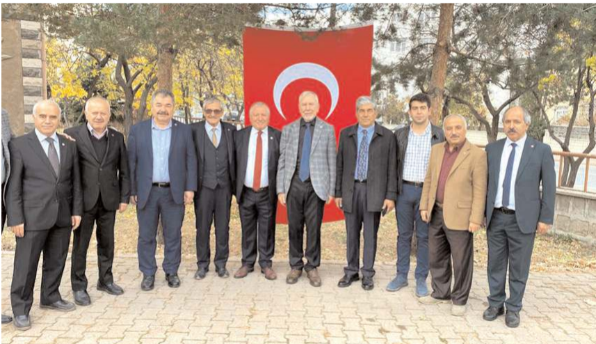
Toplantının sonunda 7 maddelik sonuç bildirgesi yayınlandı.

gelişmelerle ilgili değerlendirme yaptığı toplantıda şube başkanları da söz alarak faaliyetleri hakkında bilgi verdiler.