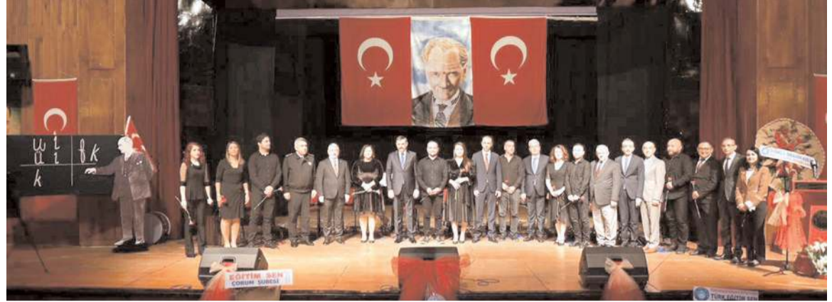
Programın sonunda protokol üyeleri ile öğretmenler hatıra fotoğrafı çekindiler.