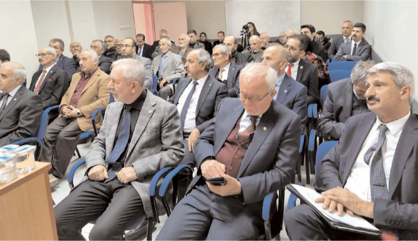
Türk Ocakları Bölge Toplantısı Kayseri'de gerçekleştirildi.