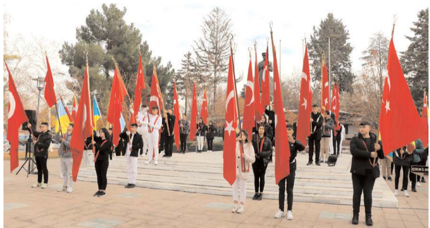
24 Kasım Öğretmenler Günü kutlama programı kapsamında Atatürk Anıtı'nda tören yapıldı.