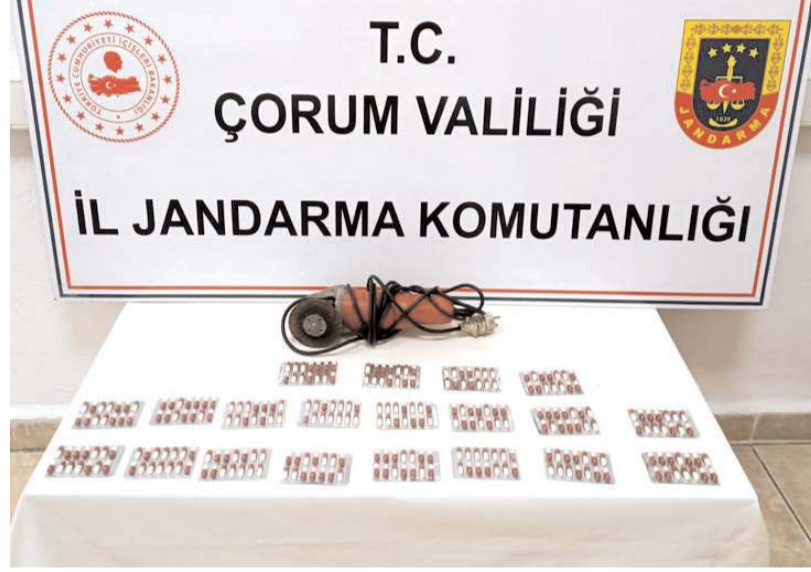
Operasyonda 280 adet sentetik ecza hap ele geçirildi.

Jandarma KOM ekipleri tarafından yürütülen istihbari çalışmalarda kente yolcu otobüsü ile uyuşturucu madde getirileceği bilgisine ulaşıldı. Kimliği belirlenen şüpheli şehirlerarası otobüs terminaline geldiğinde operasyon düzenlendi. Şüpheliye ait kolide yapılan aramada 280 adet sentetik ecza hap ele geçirildi. Uyuşturucu maddelere el konulurken, şüpheli hakkında soruşturma başlatıldı. (İHA)