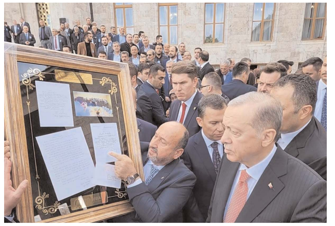
Cumhurbaşkanı Erdoğan'a bir başörtüsü mağdurunun 1999 yılında gönderdiği mektubun orijinali ve Cumhurbaşkanı'nın yazdığı cevabı mektubun orijinali hediye edildi.

2023 yılında Cumhurbaşkanlığı ve milletvekili seçimleri yapılacaktır. Siyaset elbette ülkeye ve millete hizmet için çok önemlidir; ancak Türk milletinin bütünü için kucaklama iddiasıyla "Biz Hep Birlikte Türk Milletiyiz" şiarını yürekten benimseyen ve kuruluşundan beri Tüzük'ünde yer alan "parti siyaseti dışında kalma" ilkesinin gereği olarak Türk Ocaklarının Genel Merkez ve şube yöneticileri bu süreçte siyasi faaliyetlere katılmayacak, partiler arası mücadelede taraf olma şeklinde yorumlanabilecek eylem ve söylemlerde bulunmayacaktır. Seçimlerde aday olmayı veya bir siyasi partinin faaliyetlerine katılmayı tercih eden yöneticilerimiz görevlerinden istifa edecekler, yerlerine yedek listeden arkadaşlarımız görev alacaktır. Bu bağlamda Türk Ocakları ve Türk Ocaklılar için temel mesele, Türk milletinin birliği ve Türk Devleti'nin bekasıdır. Seçimlerin ülkemiz, milletimiz ve Türklük alemi için hayırlara vesile olmasını dileriz."