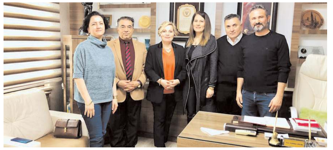
Ziyaret de eczacıların gündemdeki mesleki konuları üzerine sohbet edildi.

Tahtasız, "Başta Başöğretmenimiz Mustafa Kemal Atatürk ve şehit öğretmenlerimiz olmak üzere, ebediyete intikal etmiş tüm öğretmenlerimizi saygı, sevgi ve minnetle anıyor; Atatürk ilke ve devrimleri ışığında, büyük bir gayret ve özveriyle, zorluklara göğüs gererek, yılmadan, usanmadan, kararlılıkla ülkemizi, muasır medeniyetler seviyesine çıkartmak için gecesini gündüzüne katan değerli öğretmenlerimizin bu en güzel gününü kutluyor, sevgi ve saygılarını sunuyorum. Başöğretmenimiz Gazi Mustafa Kemal Atatürk'ün aydınlanmacı eğitim anlayışını benimseyen, ülkemizin çağdaş geleceği için çocuklarımızı ve gençlerimizi büyük bir emek ve gayretle yetiştiren öğretmenlerimizin 24 Kasım Öğretmenler Günü kutlu olsun" ifadesini kullandı. (Haber Merkezi)