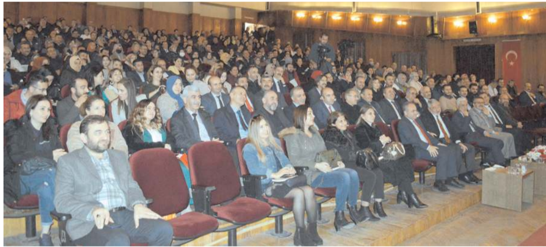
Devlet Tiyatro Salonunda yapılan konferansa ilgi yüksek oldu.

Çorum Milli İrade Platformu'ndan yapılan açıklamada, Vali Mustafa Çiftçi'nin insafsızca hedefe alındığı vurgulanarak, "Entrika, hile ve fitne ile çalışanlar aşkla çalışanların yürüyüşüne hiçbir zaman engel olamayacaklardır" denildi. * HABERİ 5'DE