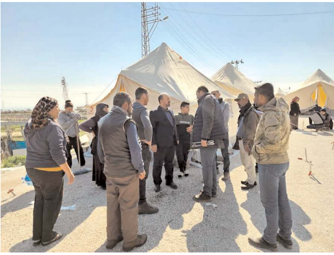
AK Parti Çorum Milletvekili Erol Kavuncu, depremlerin olduğu ilk günden beri bölgede çalışmalarını yürütüyor.