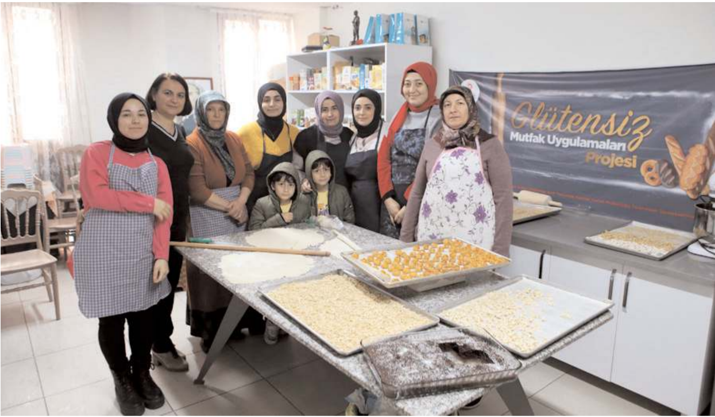
Çorum Çölyak Derneği afet bölgesinden gelen talebe göre glütensiz mantı, erişte, kurabiye ve ekmeği yapıyor.