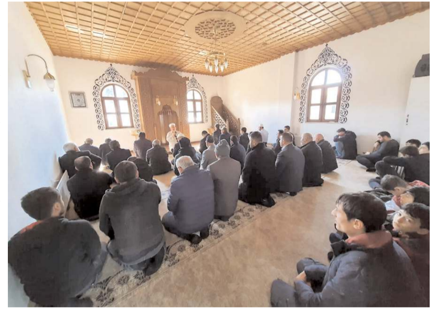
Cuma namazı öncesinde, depremlerde vefat edenler için mevlit okutuldu.

Katılımcılar namazın ardından ise şehit kabirlerini ziyaret ederek dua ettiler. (Haber Merkezi)