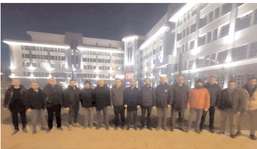
10 kişiden oluşan ekip, çalışmalara katılmak için deprem bölgesine gitti.