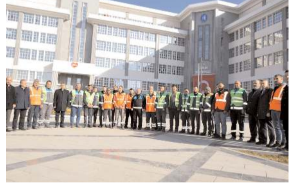
Ekipler yeni belediye binası önünde yapılan törenle uğurlandılar.