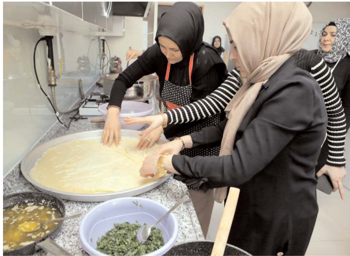
Baklava ve börekler özenle hazırlanıyor.