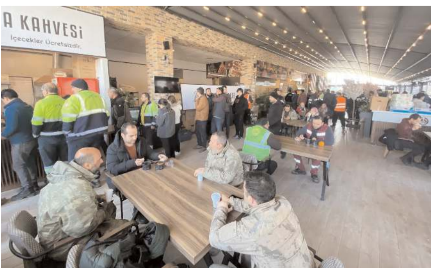
Yeniden Hayat Lokantası ücretsiz olarak hizmet veriyor.