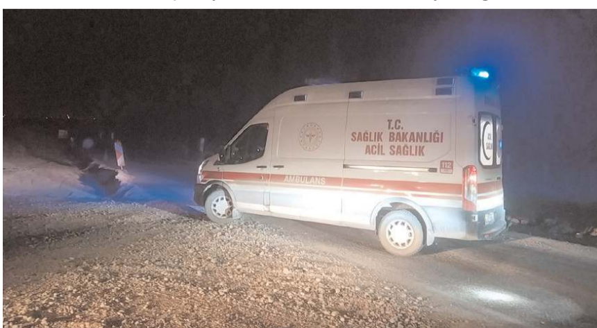
Yaralı sürücüye ilk müdahaleyi olay yerinde 112 acil sağlık ekipleri yaptı.