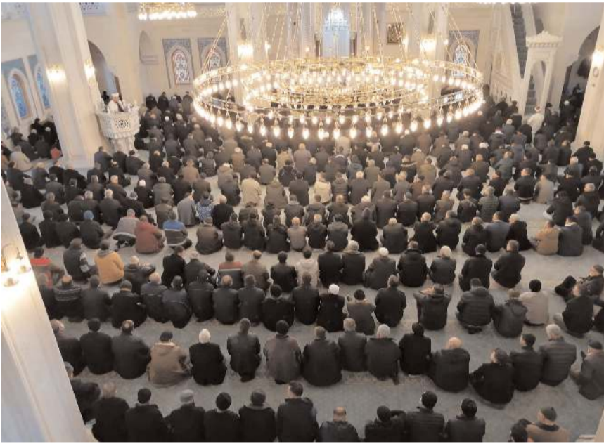
Cuma namazında okunan hutbelerde birlik ve dayanışma çağrısı yapıldı.

'MİLLET OLMANIN GEREĞİ, KARDEŞLİK RUHUMUZU CANLI