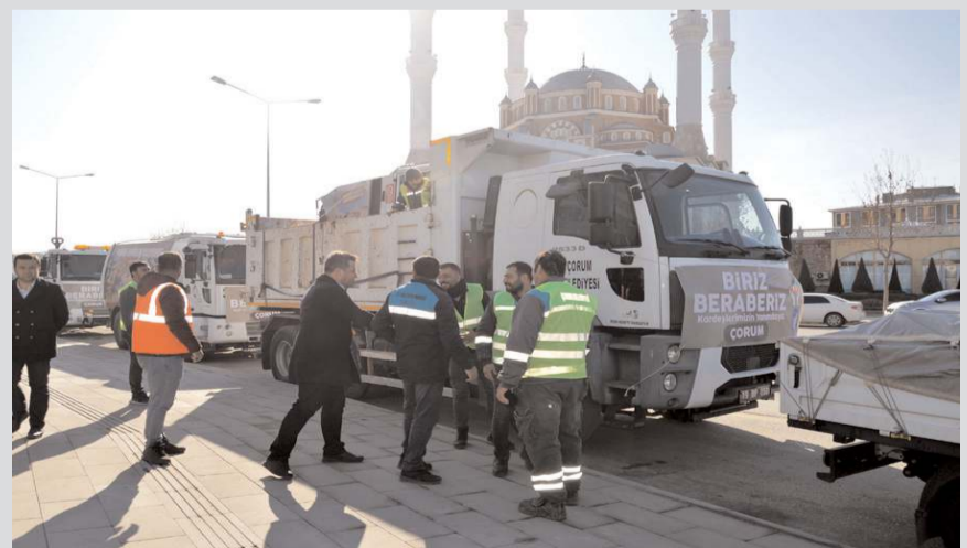
Ekipler yeni belediye binası önünde yapılan törenle uğurlandılar.