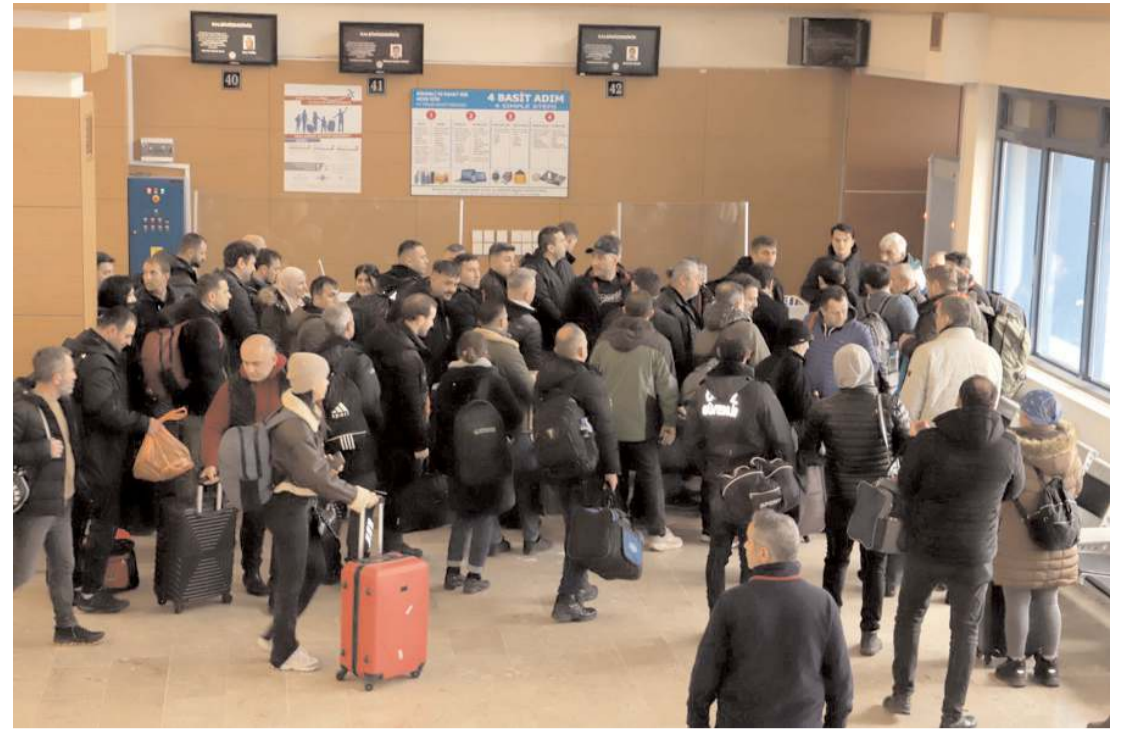
Sağlıkçuların bir kısmı hava yoluyla deprem bölgesine gitti.