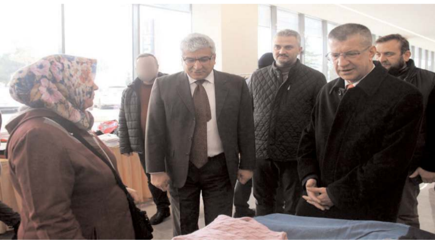
Vali Vekili Tamer Orhan, çalışmalar hakkında bilgi aldı.