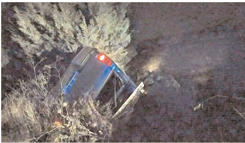
Kaza, Çevreyolu Samsun istikametinde meydana geldi.

Kaza ile ilgili olarak başlatılan soruşturmanın devam ettiği öğrenildi. (İHA)