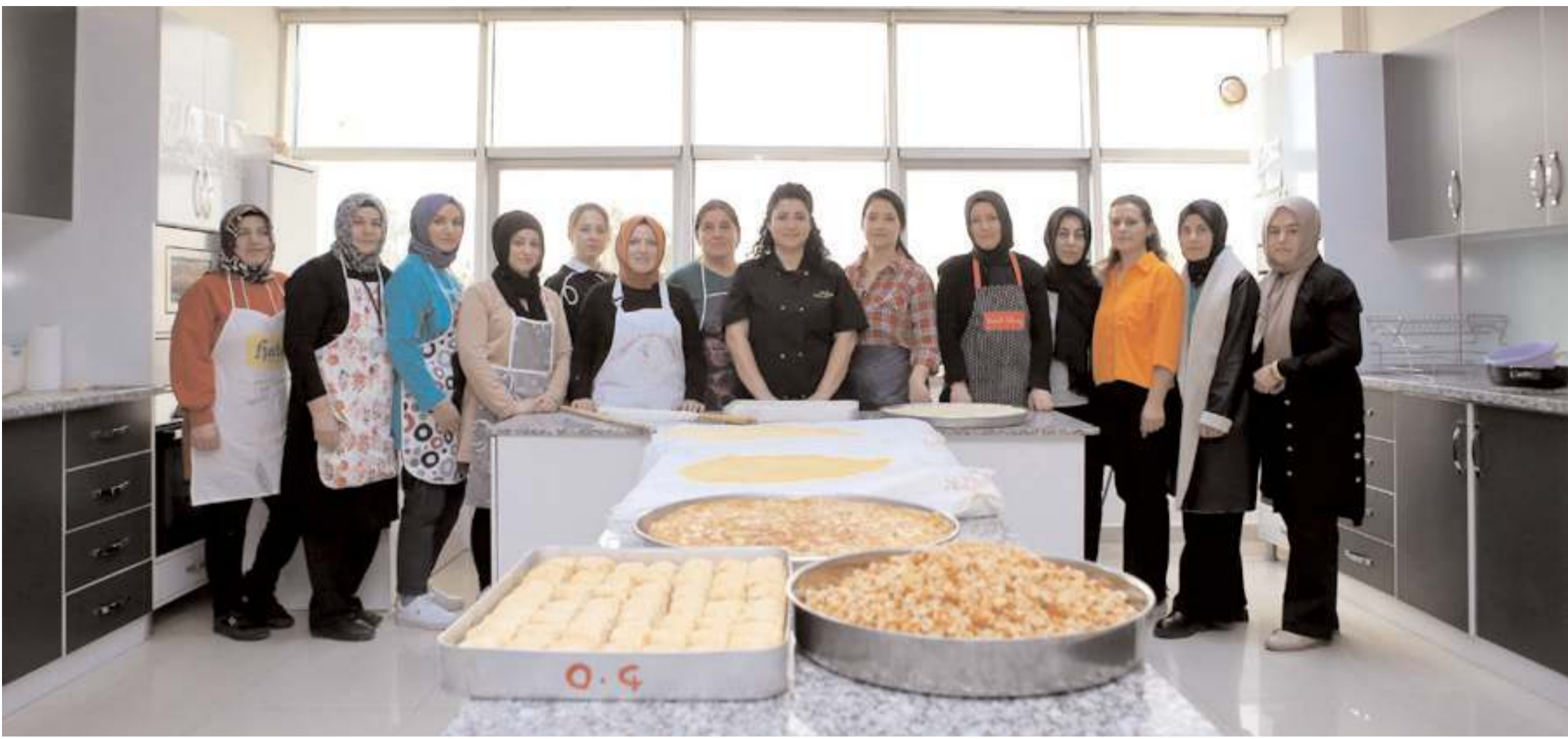
Baklava ve börekler Çorum Belediyesi Buhara Kadın Kültür Merkezi'nde üretiliyor.