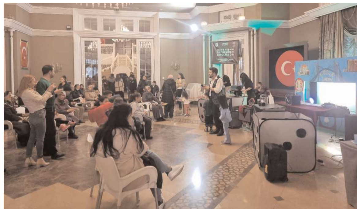
Depremzede çocukların ruh sağlığını rehabilite etmek amacıyla organizasyonlar yapılıyor.