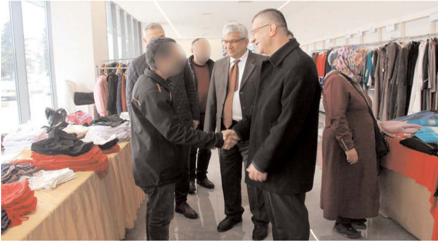
Vali Vekili Tamer Orhan, beraberinde Vali Yardımcısı Hakan Kubalı ve Vali Yardımcısı Erdoğan Kanyılmaz ile birlikte hayır çarşısını gezdi.