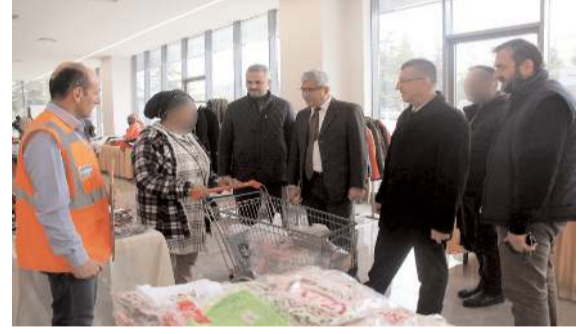
Hayır Çarşısına hayırseverlerin destekleri bekleniyor.