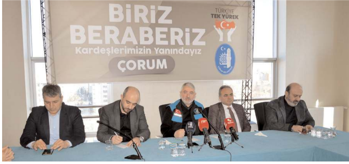
Belediye Başkanı Halil İbrahim Aşgın, basın mensupları ile bir araya geldi.