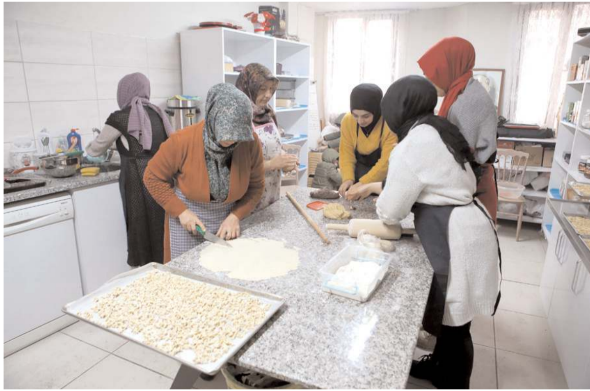
Çorum Çölyak Derneği çölyak hastası depremzedeleri unutmadı.

"Afet bölgesindeki çölyak derneği başkanı arkadaşlarımızdan edindiğimiz ihtiyaçta göre Türkiye genelindeki dernekler olarak birlikte destek oluyoruz. Türkiye çölyak dernekleri olarak bir sosyal ağımız var. Buradan hem iletişim sağlıyoruz hem birbirimizden deprem bölgesi için nasıl hareket etmemiz gerektiğini öğreniyoruz. Deprem bölgesindeki arkadaşlar bize hangi bölgede ekmeğe, makarnaya ihtiyaç olduğunu bildirdiler. Diğer dernek başkanları da her birimiz bir parçaya paydaş olarak o bölgenin ihtiyaçlarını karşıladık. Bütün dernekler özverili şekilde iş içinde yer aldı. Gerek glütensiz ürün üreten firmalardan sipariş edilerek gerekse dernekler glütensiz mutfaklarında üretim yaparak gönderdi. Bu şekilde oradaki ihtiyacı karşılamaya çalışıyoruz."(AA)