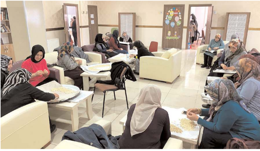
Çorum Belediyesi Kadın Kültür Merkezleri 300'ü aşkın gönüllü kadının desteğiyle depremzedeler için yaklaşık yarım ton mantı büktü.