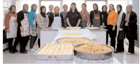
Baklava ve börekler Çorum Belediyesi Buhara Kadın Kültür Merkezi'nde üretiliyor.