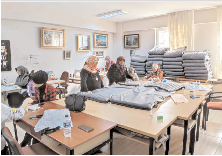
Oğuzlar Halk Eğitimi Merkezi depremezdedeler için uyku tulumu üretmeye başladı.

Çorum'un Oğuzlar Halk Eğitimi Merkezinde (HEM) depremezdedeler uyku tulumu üretiliyor.