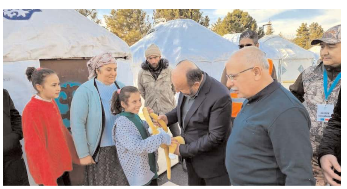
AK Parti Çorum Milletvekili Erol Kavuncu, depremlerin olduğu ilk günden beri bölgede çalışmalarını yürütüyor.