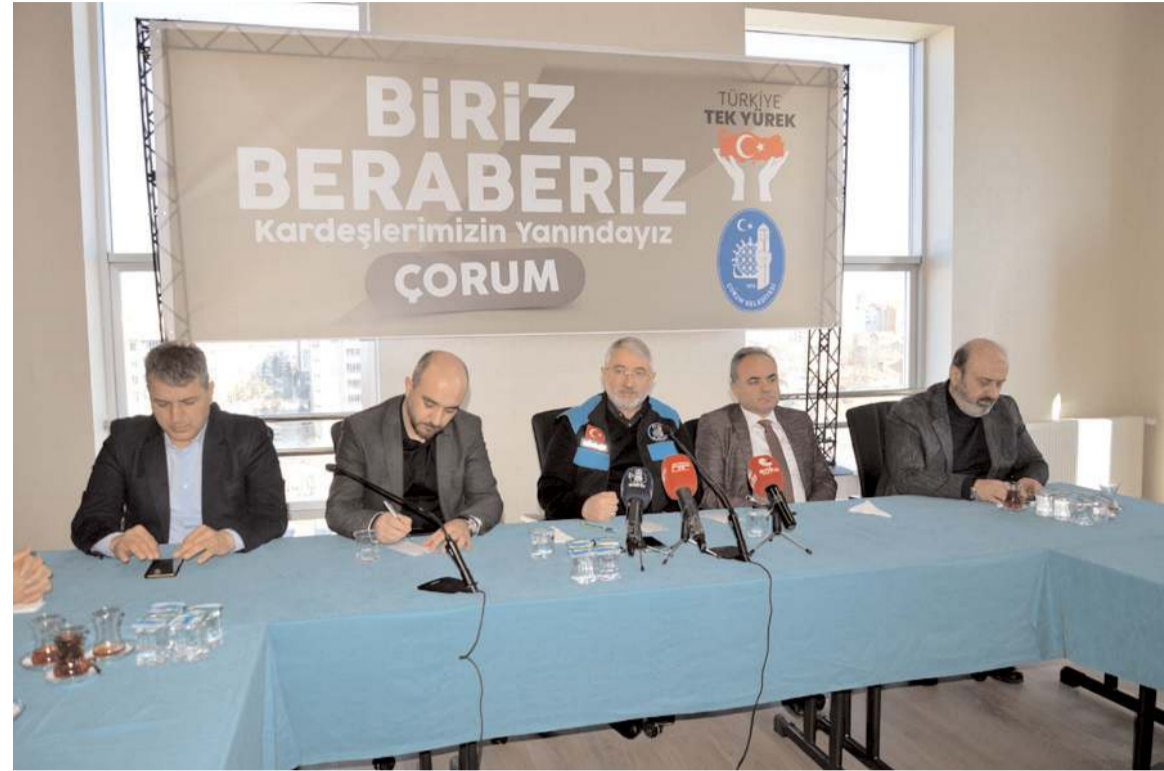
Belediye Başkanı Halil İbrahim Aşgın, basın mensupları ile biraraya geldi.

Mimar Sinan ve Kale Mahallesi dışında diğer mahallelerde de kentsel dönüşüm çalışmalarımız var. 2 yıldır kentsel dönüşümüne