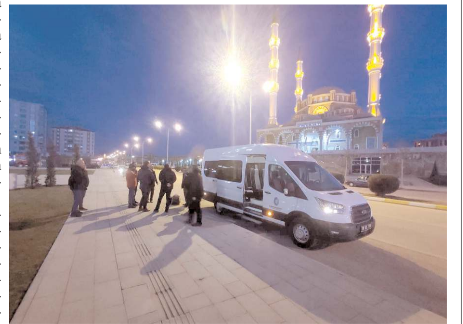
Mühendisler deprem bölgesinde hasar tespit çalışmalarına destek verecekler.