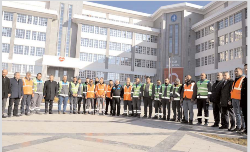
Çorum Belediyesi, altyapı onarımı, temizlik çalışması için 11 araç ve 21 personeli daha deprem bölgesine gönderdi.

Türkiye'yi sarsan yüzyılın felaketinde Çorum Belediyesi olarak tüm imkânlarını deprem bölgesine seferber ettiklerini anlatan Aşgın, "Deprem ilk gününden itibaren 117 noktada, hasar gören içme suyu altyapısındaki arızaların tamamını giderecek su kayıp ve kaçaklarının önüne geçtik. Ayrıca, kurulan konteyner evlere içme suyu hatları çekerek suyu ulaştırma hızlandırdık. Bugün de Afşin halkımıza hizmet etmesi amacıyla 3 kamyon (road mix asfalt yüklü), 1 arazöz, 2 süpürge aracı, 2 kayıp kaçak tespit aracı, 3 pikap ve 21 personelimizi uğurluyoruz. Tüm teknik, maddi-manevi imkanlarımızla kardeşlerimizin yanındayız. Afşin'i el birliği ile ayağa kaldırıyoruz. Afşin bize emanete sahip çıkacağız. Devletimize ve milletimize güvenerek, Allah'ın izniyle orayı yeniden ayağa kaldıracacağız. Afşin halkı bizi kovana kadar da oradan ayrılmayacağız. Çünkü bu bizim kardeşlik görevimiz. Biz biliyoruz ki tüm Çorum halkı bizim yanımızda. Hep beraber bu yaraları saracağız." dedi