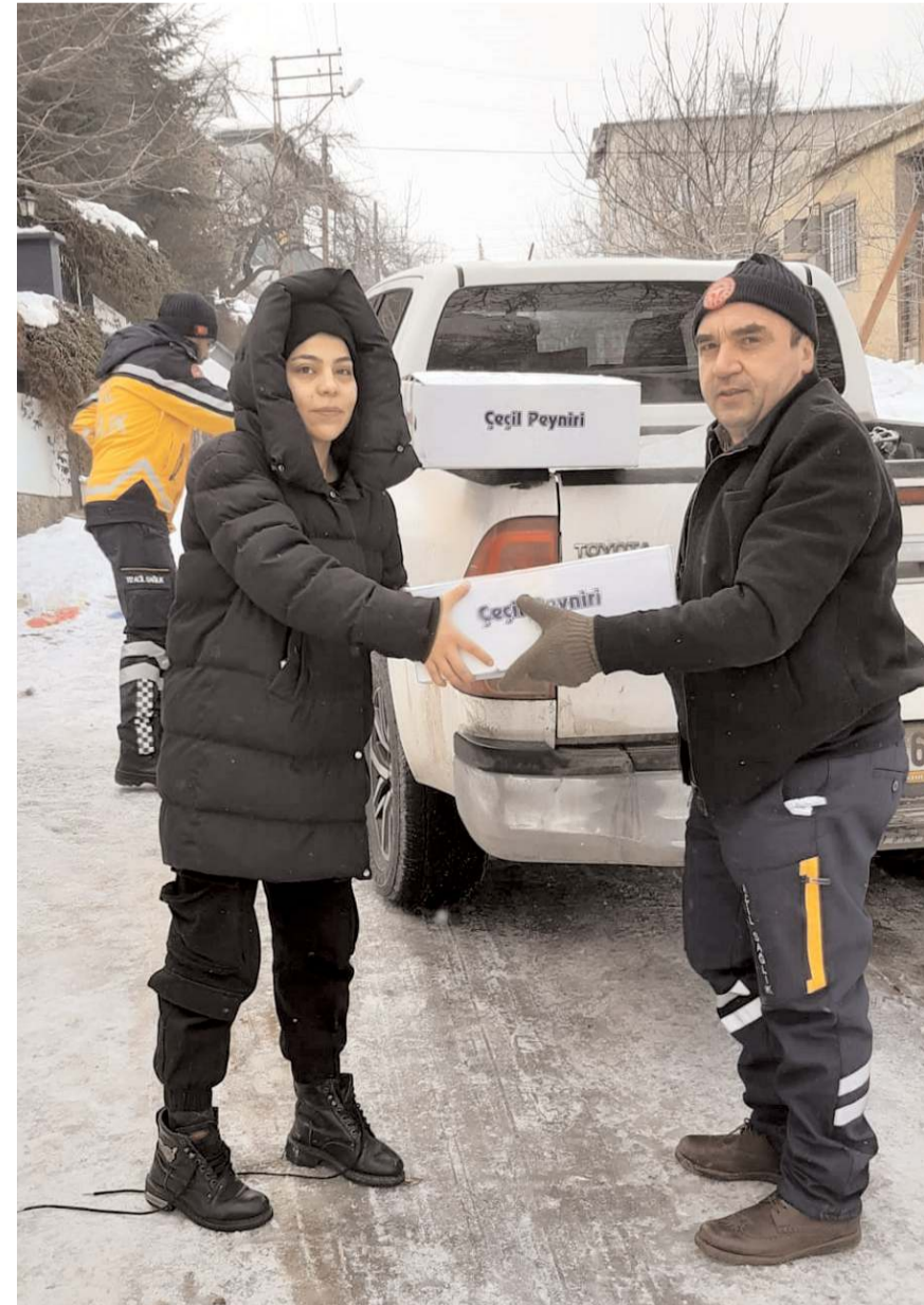
Glütensiz yiyecekler deprem bölgesine gönderiliyor.