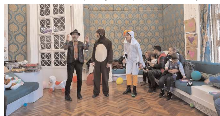
Depremzede çocuklar için çeşitli etkinlikler yapılıyor.