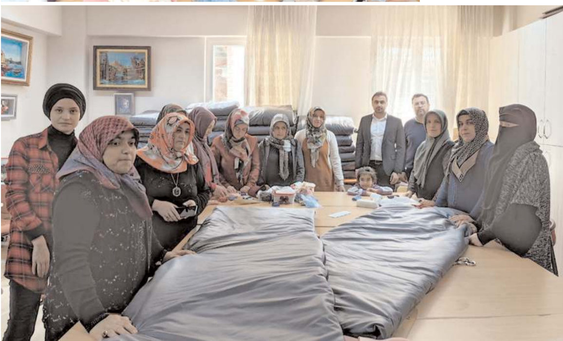
Usta öğretici ve kursiyerler depremezdedeler için bere, eşofman takımı, çocuk takımları ve battaniye dikiyor.