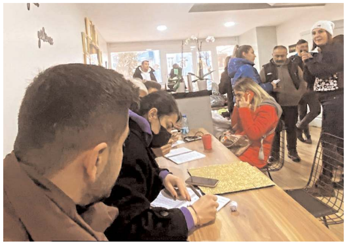
Pilates salonunda organize olan gönüllüler depremzedelere yardım ettiler.