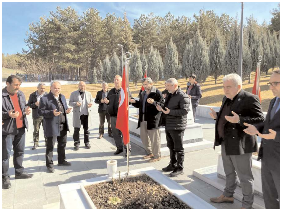
Cuma namazının ardından şehitler için dua edildi.

Peygamberlerinin azmi neticesinde onlara lüt-fettiği çareyi bize de ih-san etmesi için Yüce Rabbimize dua edelim. Üzerimize sükûnet yağdırması, gönüllerimizi onarması, yaralarımıza derman olması için O'na yalvaralım. Yüreklerimizi birbirine kaynaştırması, birlik, beraberlik ve kardeşlik şuurumuzu daim kılması için O'na niyazda bulunalım. Bu vesileyle ahirete irtihal eden kardeşlerimize Cenâb-ı Hak'tan bir kez daha rahmet, yaralı olanlara acil şifalar diliyoruz. Yüce Rabbimiz, aziz milletimize ve bütün insanlığa bir daha böyle acılar göstermesin."