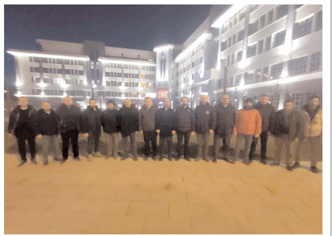
10 kişiden oluşan ekip, çalışmalara katılmak için deprem bölgesine gitti.

TOKİ'nin Nurdağı ve İslahiye ilçelerinde depremzedeler için ilk etapta yapacağı 855 konutun yapımına başladığını da aktaran Mil- letvekili Kavuncu, "Cumhurbaşkanımız Recep Tayyip Erdoğan liderliğindeki güçlü devletimiz, depremin 18. gününde afetin yıkı- ma neden olduğu şehir- lerimizde yeniden inşa ve ihya sürecini bilim- sel, hızlı ve güçlü bir şekilde başlattı. En kısa zamanda vatandaşları- mızı evlerine kavuşturarak yaralarımızı sarıp şehirlerimizi ayağa kal- dıracağız inşallah" ifa- delerini kullandı.