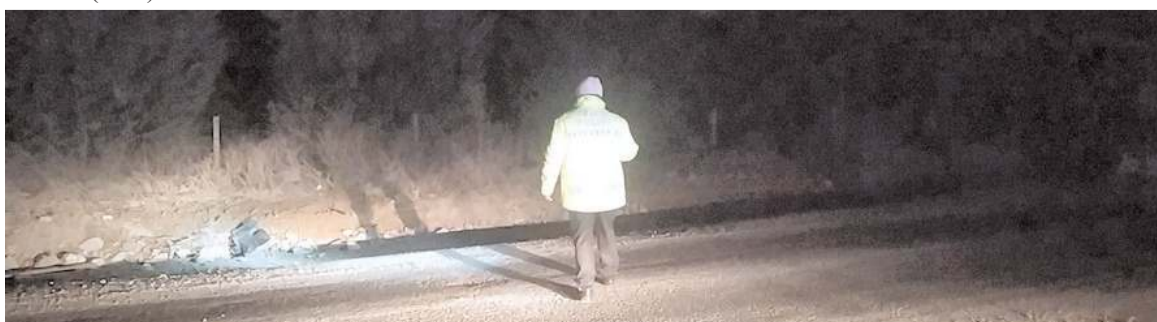
Kaza ile ilgili soruşturma başlatıldı.