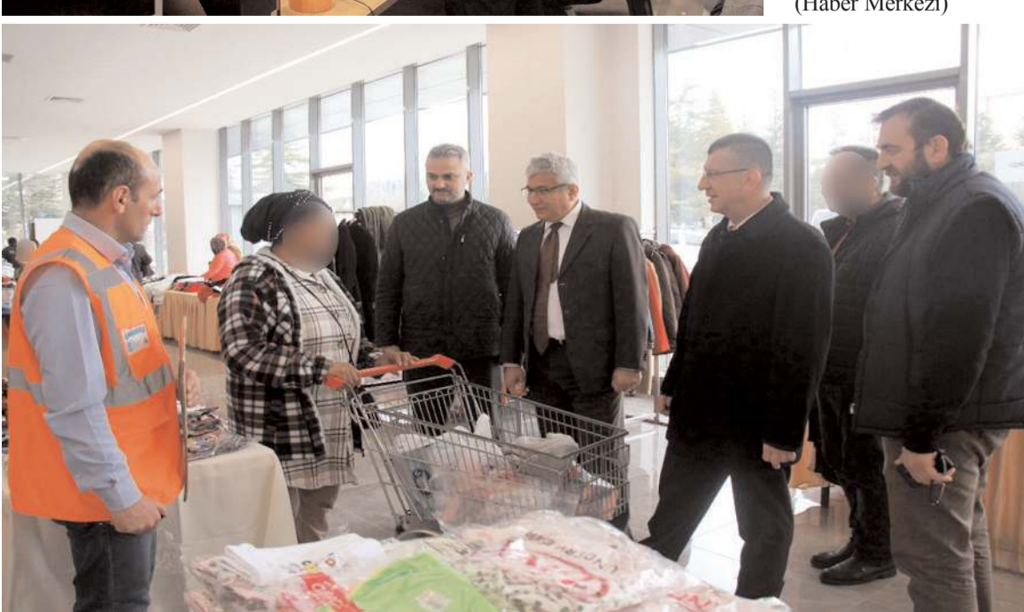
Hayır Çarşısına hayırseverlerin destekleri bekleniyor.

Vali Vekili Tamer Orhan, beraberinde Vali Yardımcısı Hakan Kubalı ve Vali Yardımcısı Erdoğan Kanyılmaz ile Ticaret ve Sanayi Odası'nda oluşturulan hayır çarşısını ziyaret ederek görevlilerden bilgi aldı.