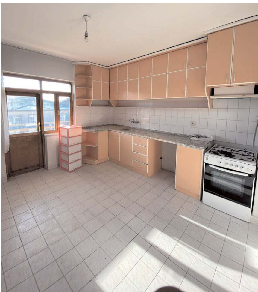
Depremzedeler için 73 eşyalı ev bulundu.

Çorum'da depremde ailenin çocuklarına kıyafet temin etmek için başlayan yardım çağrısı, iki haftada yüzden fazla gönüllünün yer aldığı, eşyalı 73 evin tahsis edildiği iyilik hareketine dönüştü.