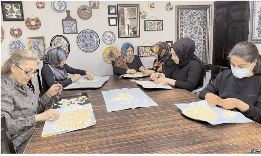
Yaklaşık yarım ton mantı deprem bölgesine gönderilmek üzere bir günde hazırlandı.