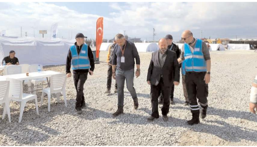
Milletvekili Kavuncu, depremzedeler için yapılan çalışmalarını yakından takip ediyor.