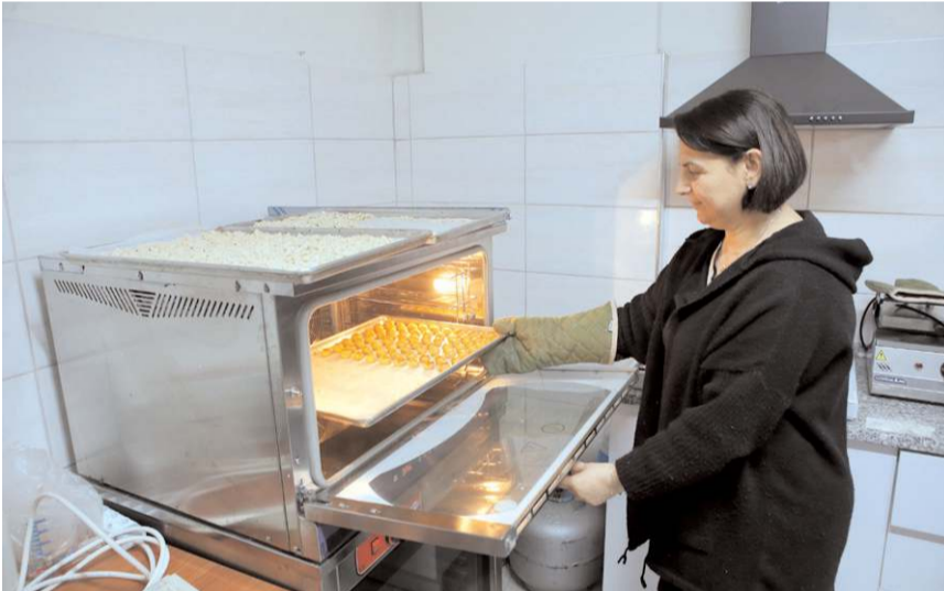
Glütensiz ürünler büyük bir titizlikle hazırlanıyor.