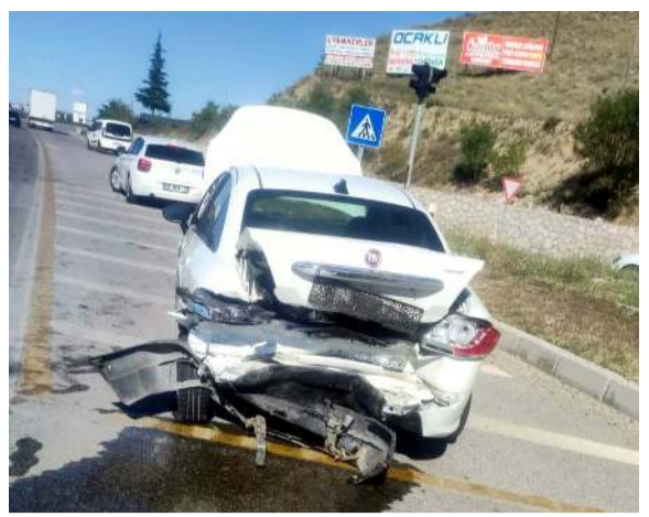
Kaza, Sungurlu-Kırıkkale karayolu Kemal Kavşağı'nda meydana geldi.