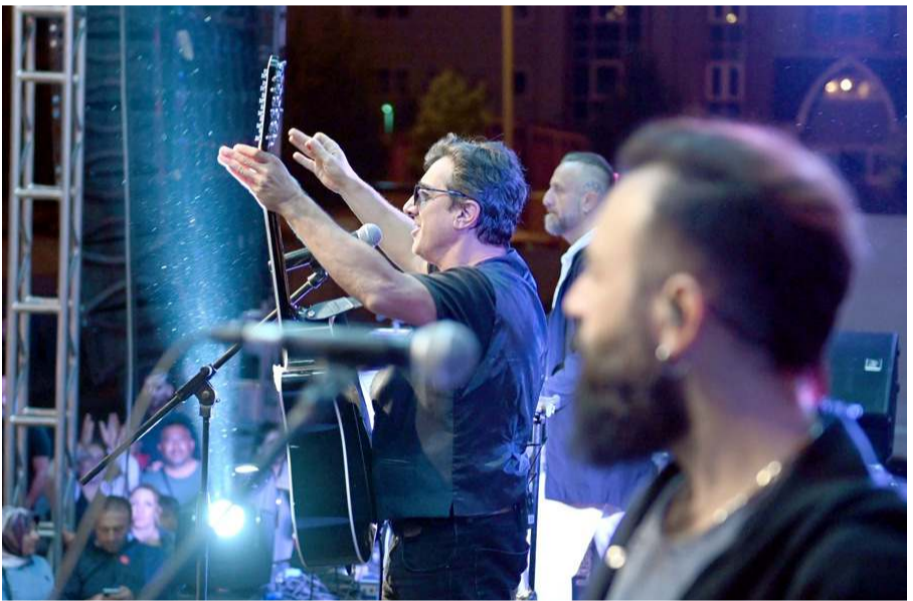
Ayna grubu birbirinden güzel şarkılarını seslendirdi.