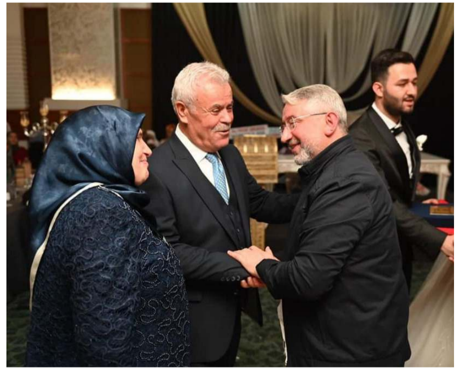
Başkan Aşgın, aileleri tebrik etti.