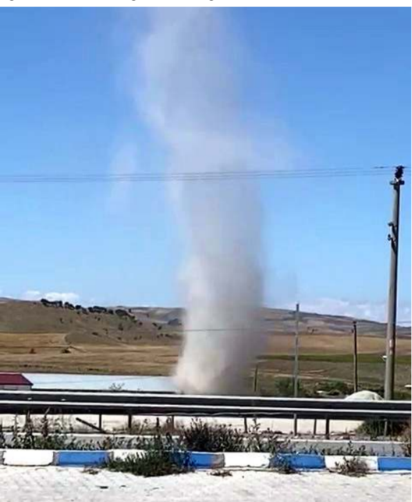
Paniğe sebep olan hortum, bir süre sonra gözden kayboldu.

Edinilen bilgiye göre, Çorum'un Sungurlu ilçesi Ankara-Samsun karayolu üzerinde hortum çıktı. Yol üzerinde bulunan bir dinlenme tesisindeki vatandaşlar, hortumu görünce panik yaşadı. Cep telefonu ile görüntülenen hortum, bir süre etkili olduktan sonra gözden kayboldu. (İHA)