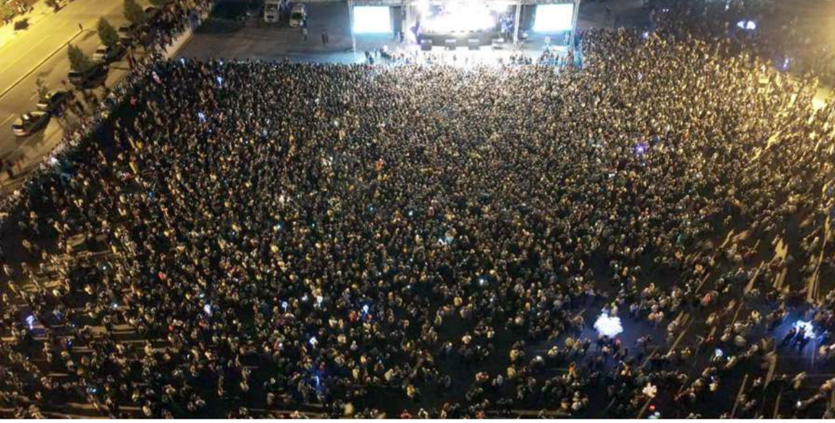
Konsere ilgi yüksek oldu.