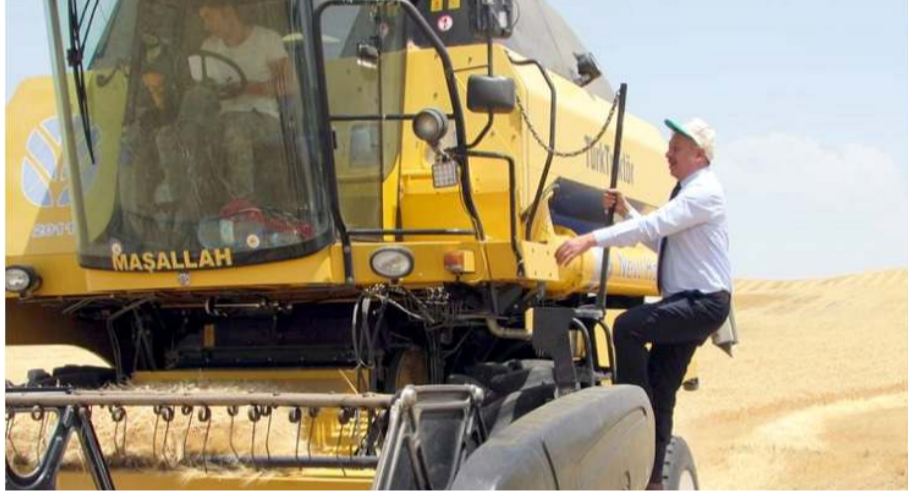
Kontrollerle dane kayıplarının azaltılması hedefleniyor.