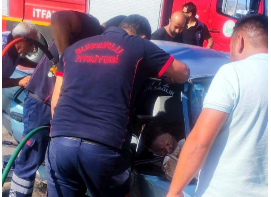
Yaralılar hastanede tedavi altına alındı.