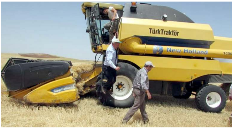
Tarım ve Orman İl Müdürlüğü ekipleri hasat döneminde biçerdöver kontrollerini sürdürüyor.

Dane ve sap kaybının milli bir kayıp olduğunu vurgulayan Orhan Sarı, "Biçerdöver operatörleri dane ve sap kaybını önlemek için tekniğine uygun biçim yapmaları gerekmektedir. Çiftçilerin bir yıllık emeklerinin karşılığını bol bereketli olarak almaya başladığı şu günlerde biçim hataları nedeniyle çiftçinin emeklerinin toprağa gömülmesine müsaade etmeyeceğiz. İlimiz merkezde çiftçilerimiz dane-