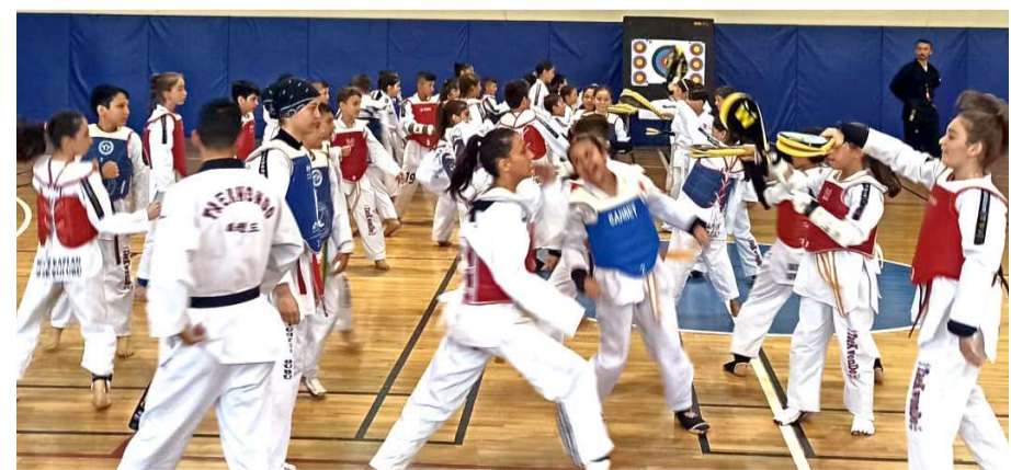
Açılış töreninde tekvandalı kalabalık bir grupta gösteri yaptılar