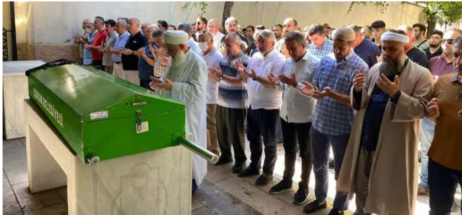
Merhume için Ulu Camide cenaze namazı kılındı.

Hakimiyet, merhumeyle Allah'tan rahmet kederli ailesine ve yakınlarına başsağlığı diler.