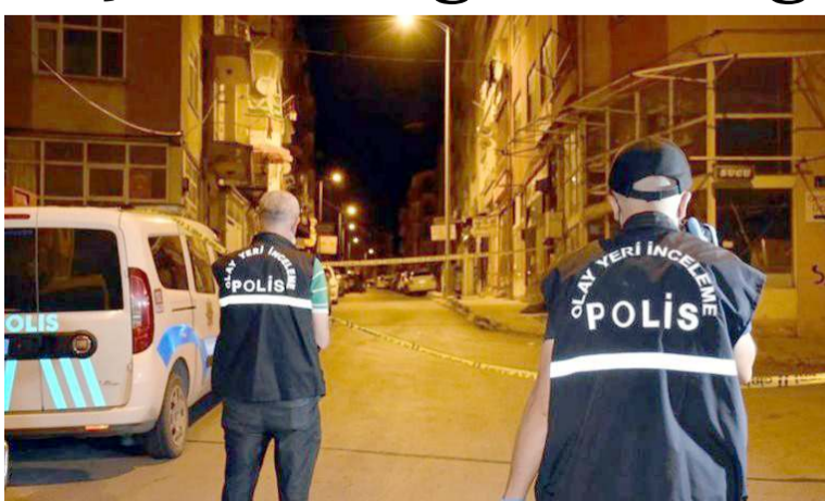
Olay, merkez otobüs durağı arkasında gerçekleşti.