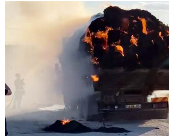
Çevrede bulunanlar yanan kamyonu cep telefonuyla görüntülediler.