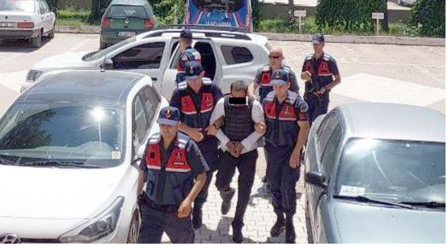
M.D. çıkarıldığı hakimlikçe tutuklandı.

Alaca'da, amcasının oğlunu köpeğini darbettiği iddiasıyla silahla öldürdüğü öne sürülen şüpheli tutuklandı.