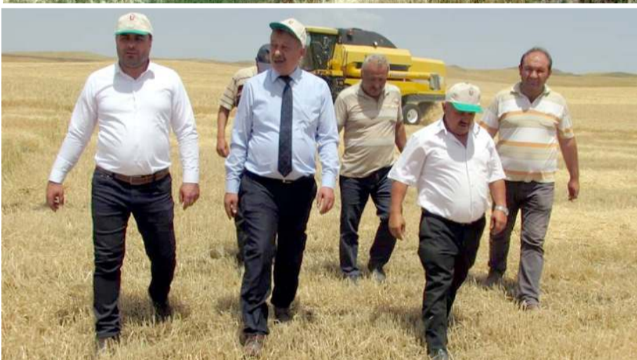
Kontroller esnasında çiftçilere, kendi yapabilecekleri dane kayıp oran kontrolleri hakkında bilgi veriliyor.