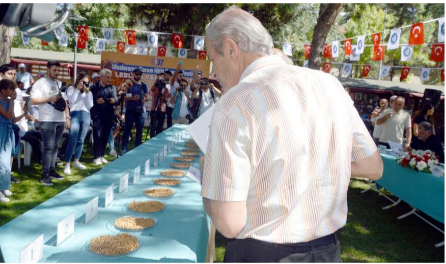
Yapılan değerlendirmenin ardından sonuçlar açıklandı.