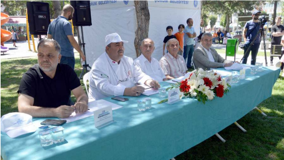
Jüri üyeleri leblebileri değerlendirdi.