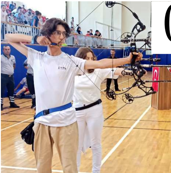
Okçular açılıştaki gösteri yaptılar