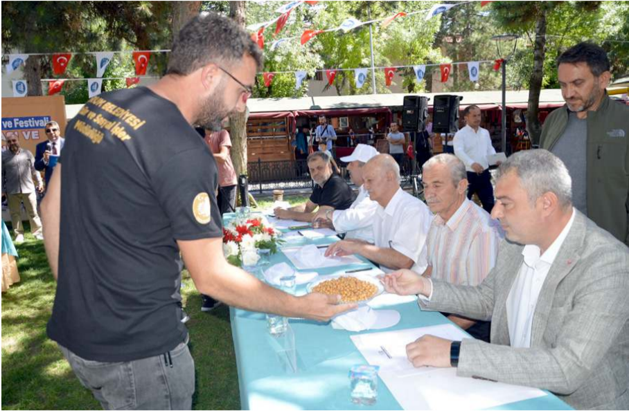
Yarışmada 20 kuruyemişçinin leblebileri yarıştı.

Program sonunda vatandaşlara leblebi ikramı yapıldı.