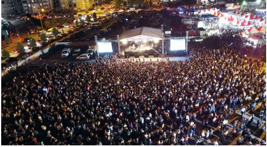
Konsere ilgi yüksek oldu.