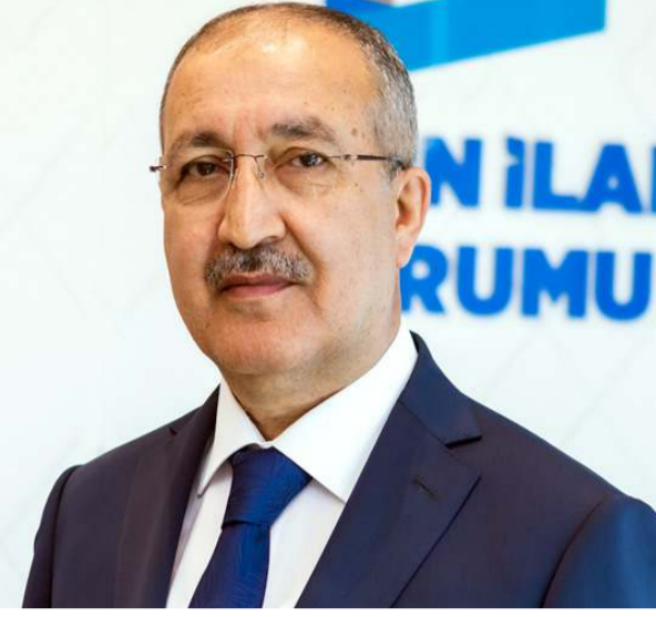
BİK Genel Müdürü Cavit Erkilinç

"Görsel, yazılı ve dijital mecralarla haber alma ve yayma özgürlüğünün en etkili aracı olan basınımızın, kamuoyunun hızlı, doğru ve tarafsız bir şekilde bilgilendirilmesinde üstlendiği vazifeyi devam ettirmesi ülkemiz için hayati önem taşımaktadır. 2000'li yılların başından itibaren ülkemizde ifade özgürlüğünün önündeki engellerin teker teker kaldırılmasıyla birlikte basın camiası, çok sesli, objektif ve bağımsız hü-