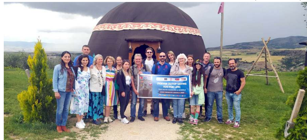
Ekip Çorumlu Obası'nı ziyaret etti.