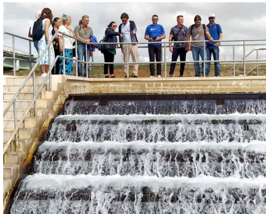
Öğretmen ve öğrenciler Çorum Belediyesi su arıtma tesisini gezdi.