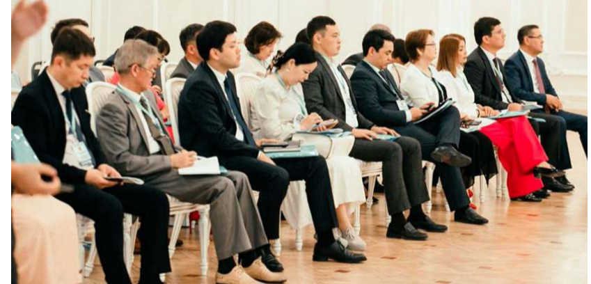
Forumda, Orta Asya'nın tümü ilgilendiren pek çok konu masaya yatırıldı.