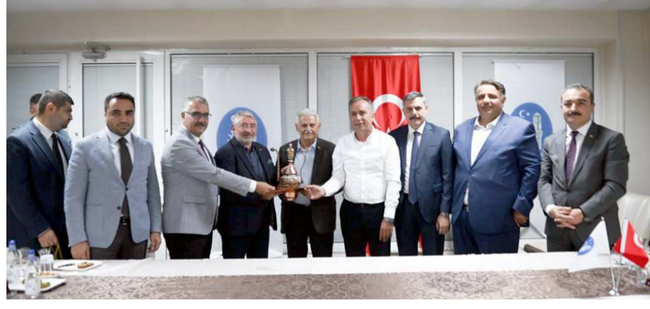
Ziyaretin anısına Binali Yıldırım'a hediye takdim edildi.