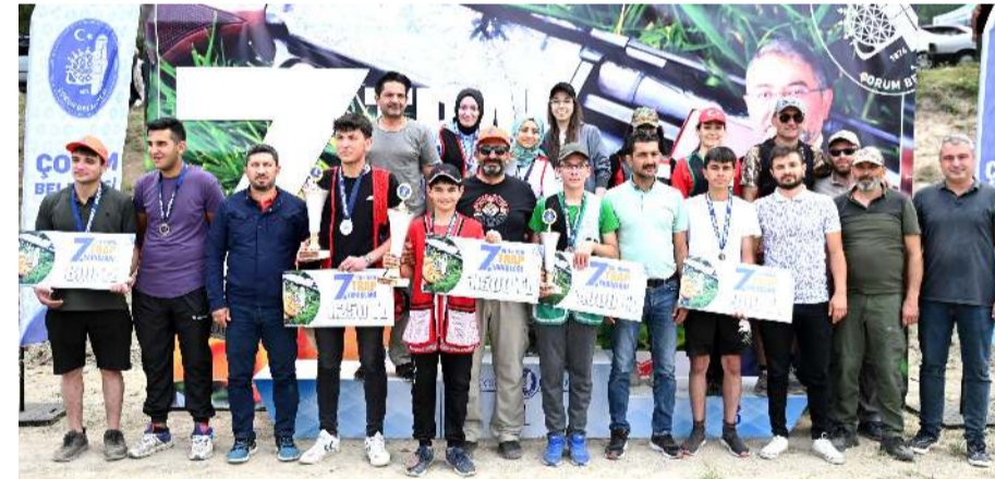
Bayanlar ve erkekler 20 yaş altında dereceye giren sporcular törene katılanlar ile birlikte