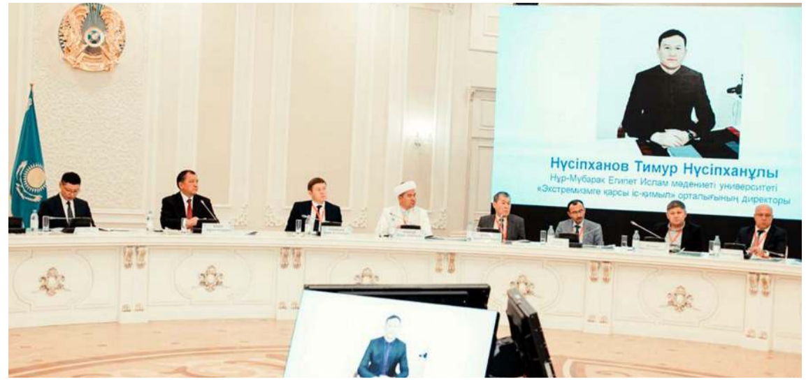
Orta Asya'da Din ve Devlet İlişkileri konulu forumda, çok sayıda akademisyen bir araya geldi.

Çiftlik Çayırı Miraç Sitesi'nde bulunan evlerinde sünnet düğünü gerçekleştirildi. Düğünde ilk olarak çocuk gezdirme yapıldı ve Hıdırlık'a gidilerek dua edildi. Akşam verilen yemeğin ardından ise düğün töreni sona erdi. (Haber Merkezi)