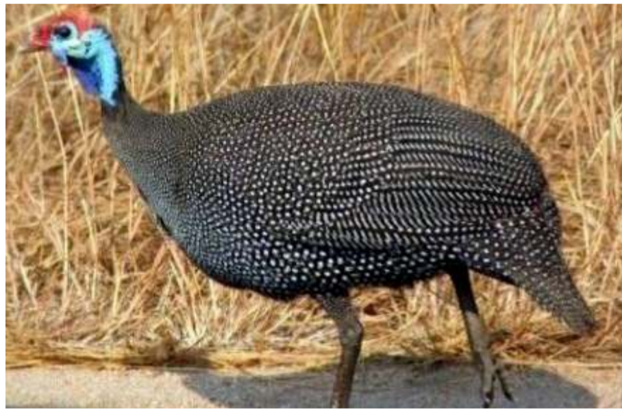
2022 yılında 13 bin 560 adet sülün üretilerek muhtelif illere dağıtılacak.