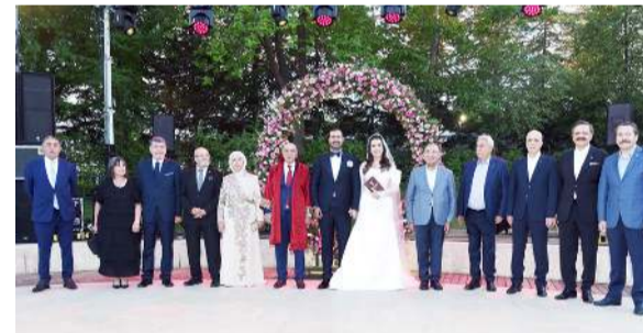
Düğün töreni Bilkent Otel Havuz Başında yapıldı.