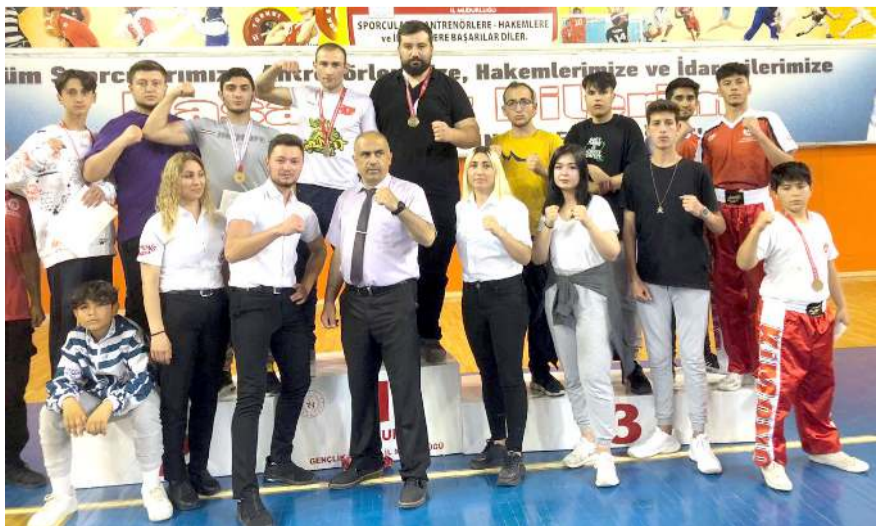
Maçlar sonunda dereceye girenlere madalyaları verildi

Müsabakalar sonunda düzenlenen törenle sıklıkta dereceye giren sporculara madalyaları verildi.