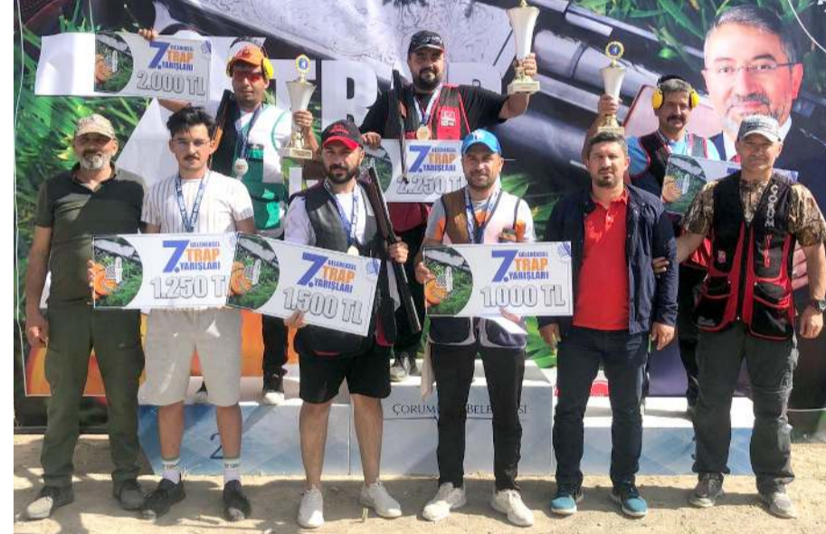
Büyükler kategorisinde dereceye giren sporcular kürsüde toplu halde