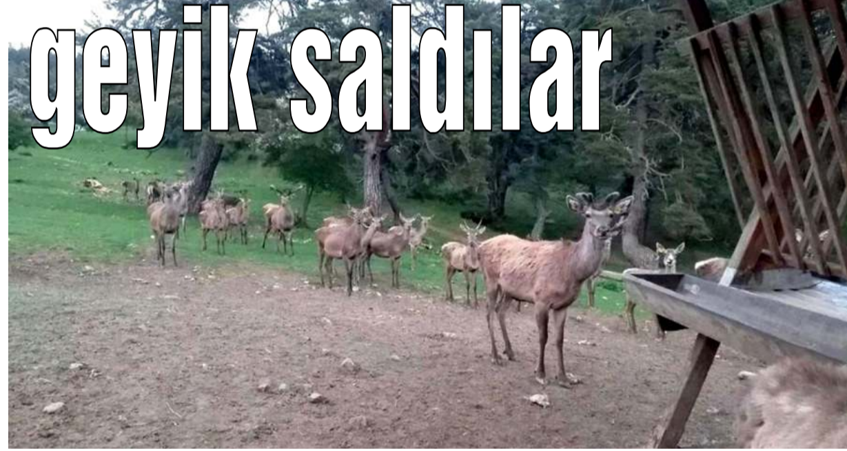
Kunduz Geyik Üretim Tesisi'nde 2022 yılında 8 geyik üretilerek doğaya salındı.

Samsun'un farklı bölgelerine yerleştirilen fotokapanlar ile geyik, çakal, kurt ve karaca gibi yaban hayvanları doğal yaşam alanlarında görüntülendi. Ulusal Biyolojik Çeşitlilik Envanter Projesi çerçevesinde bin 784 damarlı bitki, 51 memeli, 362 kuş, 29 balık, 12 sürüngen, 9 iki yaşamlı, 376 tohumlu bitki, 382 omurgasız hayvan türü tespit edildi. Bunun yanı sıra av koruma ve kontrol çalışmaları kapsamında 113 kişiye ise 236 bin 517 TL ceza yazıldı. (İHA)