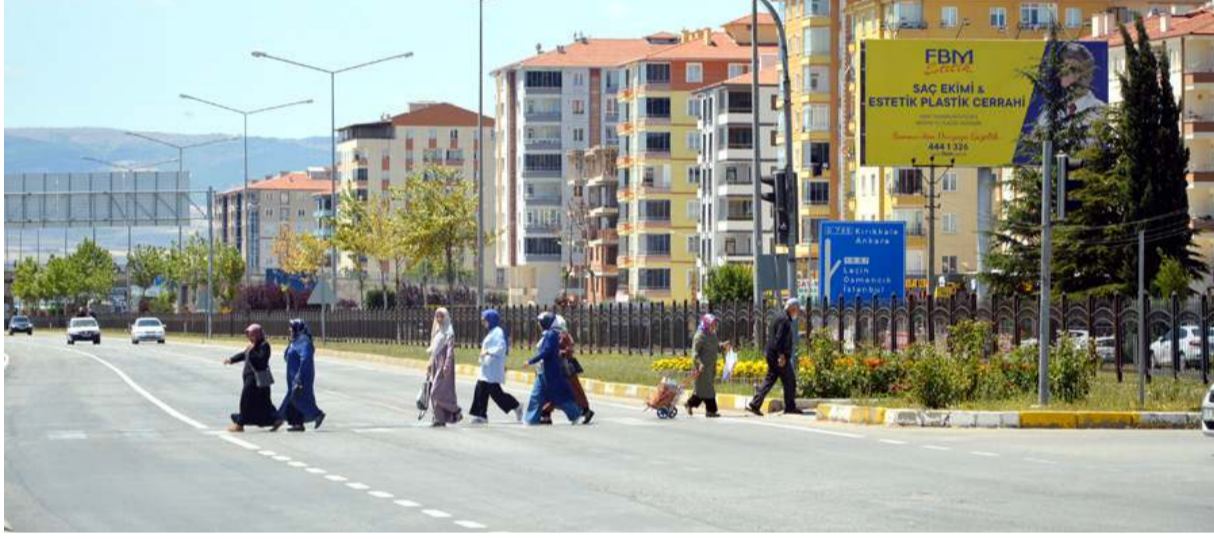
Vatandaşlar kavşağa kalıcı çözüm bulunmasını istiyor.

■ Çorum'da şehir içinde kalan çevre yolu Türkiye'nin en tehlikeli çevre yollarından biri olarak gösteriliyor. Geçtiğimiz gün yaşanan acı kaza ile birlikte tekrar gündeme gelen çevre yolu vatandaşın da birinci gündem maddesi haline geldi. Nihai çözümün yeni bir çevre yolu olduğu görüşünü savunan vatandaşlar etkili ve yetkilileri göreve davet ederken tez zamanda önlemlerin alınmasını istiyor. Çok sayıda ölümlü kazanın adresi olarak hafızalara kazınan çevre yolunda Binevler ve Burun Çiftlik kavşağı modelinde çözüm beklentileri her geçen gün artıyor. * HABERİ 3'DE