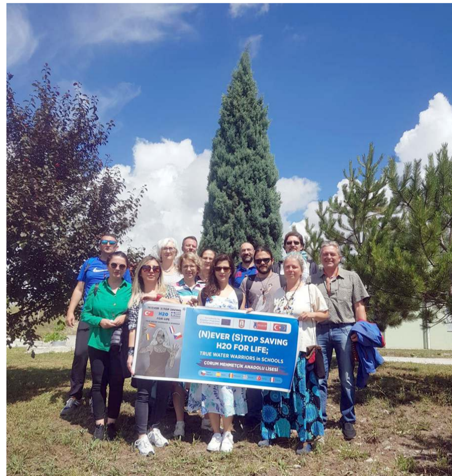
Ekip fidan dikti.