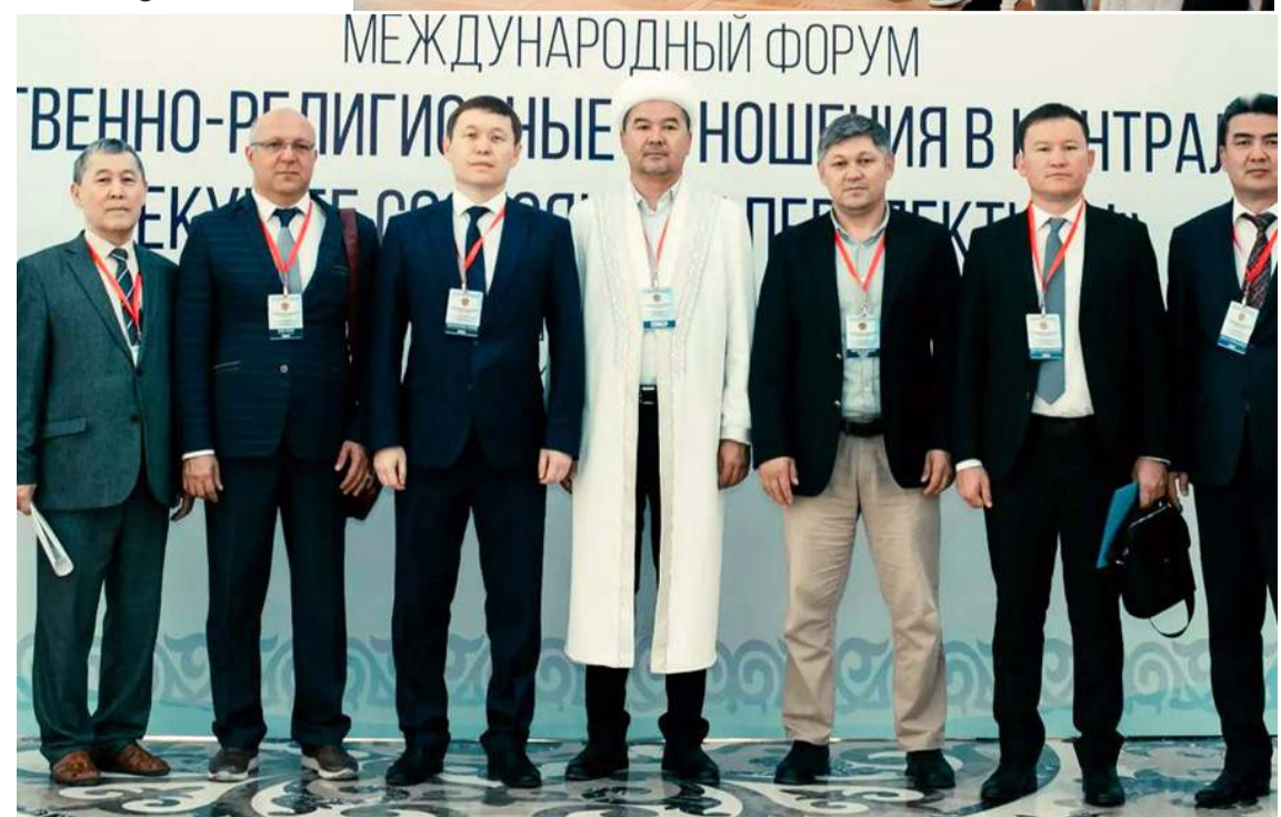
Forum, Orta Asya'nın dini konularına önemli katkılar sağladığını belirtildi.