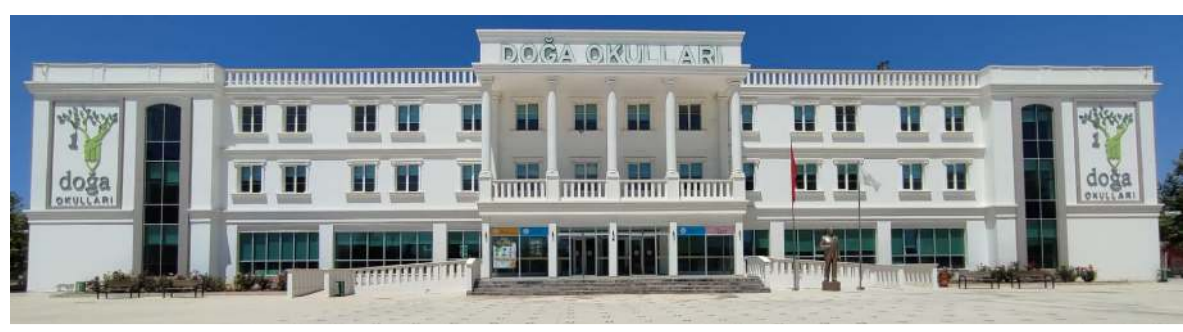
Çorum Doğa Koleji'nde, Anaokulu, İlkokul, Ortaokul, Anadolu ve Fen Lisesi bulunuyor.