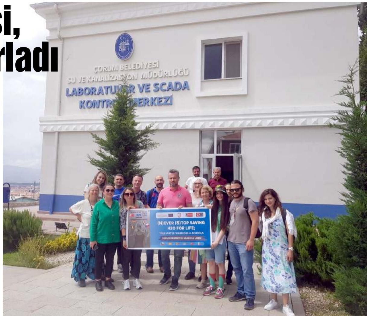
Konuk heyet Su ve Kanalizasyon Müdürlüğü Scada Merkezi'ni gezdi.

Kültürel etkinliklerle misafirlerin Çorum'da eğlenceli vakit geçirmesi sağlandı. Katılımcılar Çorum Obası'nı ziyaret etti. Burada geleneksel Türk kıyafetleri, sanatları ve sporları tanıtıldı. Çorum Obası'nda misafirlere leblebi helvası ve çay ikram edildi. Programda Alacahöyük ve Boğazkale gezisine de yer verildi. Alacahöyük Müzesinde misafirler, Hitit figürleri ile çanta baskısı yaptı. Boğazkale Müzesi'nde Mehmetçik Anadolu Lisesi öğrencileri, Hititlerde bir savaş sahnesi ve zafer kutlamasını canlandırdı. Misafirler, gösteri ve öğrencilerin kıyafetlerine çok ilgi gösterdi. Toplantı katılımcılara sertifikaların verilmesi ile son buldu" denildi. (Haber Merkezi)