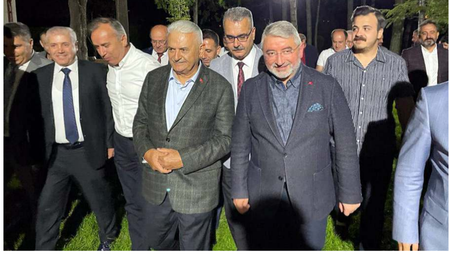
Binali Yıldırım, Park ve Bahçeler Sosyal Tesisleri'nde ağırlandı.