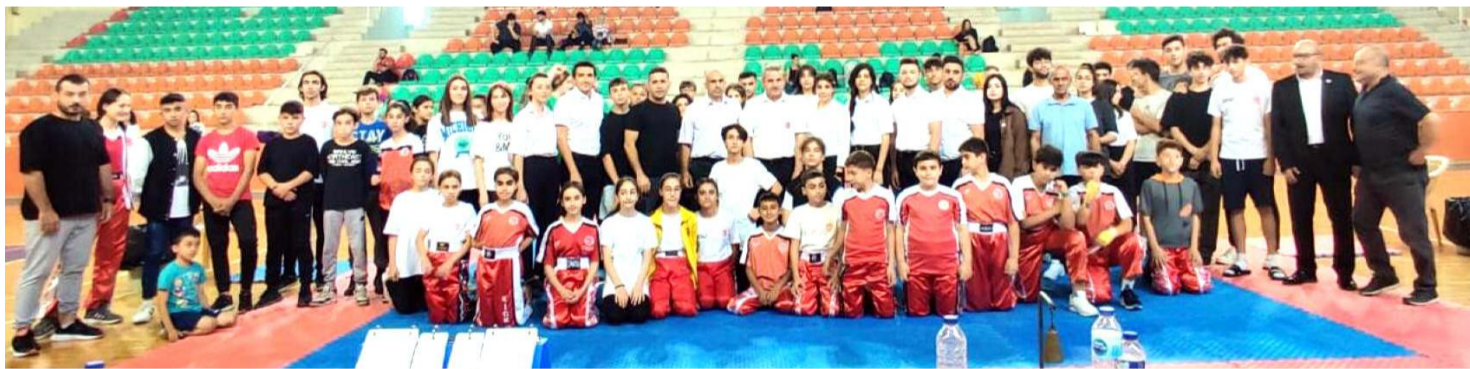
15 Temmuz Kick Boks turnuvasında mücadele eden sporcular hakemler ve antrenörler müsabakalar sonrasında toplu halde görülüyor