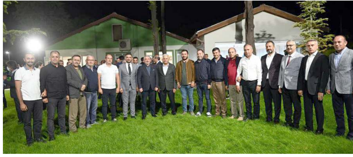
AK Parti Genel Başkanvekili Binali Yıldırım, Samsun programı dönüşünde Çorum'da mola verdi.

Basın meslek ilkelerinden taviz vermeksizin görevlerini yerine getiren tüm basın çalışanlarımızın 24 Temmuz Gazeteciler ve Basın Bayramı'nı kutluyor, çalışmalarında başarılar temenni ediyorum."