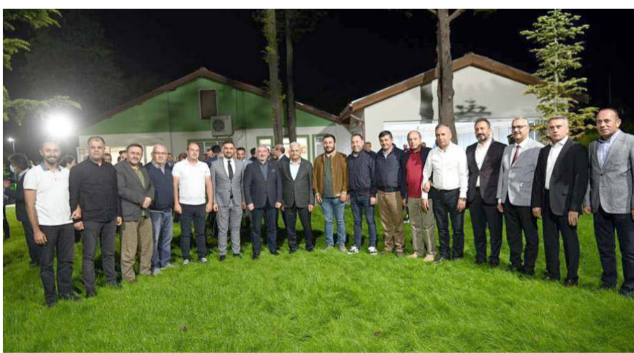
Binali Yıldırım, Park ve Bahçeler Sosyal Tesisleri'nde ağırlandı.

■ AK Parti Genel Başkanvekili Binali Yıldırım, Samsun programının ardından Ankara'ya giderken Çorum'da mola verdi. * HABERİ 6'DA