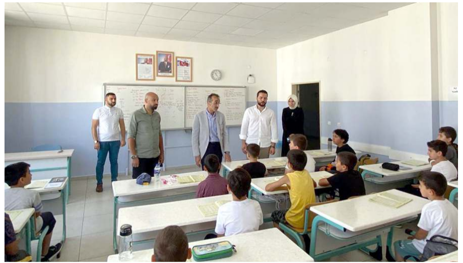
TÜGVA yaz okulu 5 farklı okulda açıldı.