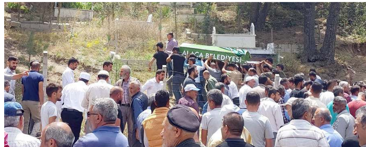
Hacı D, amcasının oğlu M.D. tarafından silahla öldürülmüştü.