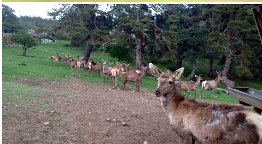
8 adet geyik Osmancık'ta doğaya salındı.

Samsun Milli Parklar 11. Bölge Müdürlüğü Kunduz Geyik Üretim Tesisi'nde 2022 yılında 8 geyik üretilerek doğaya salındı.