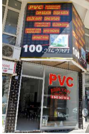
Firma Cengiz Topel Caddesi'nde bulunuyor.