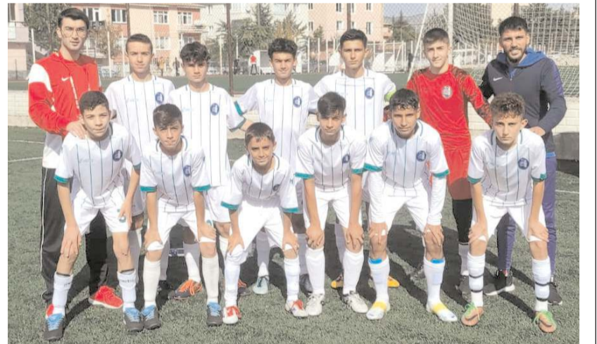
Mimar Sinan U 15 takımı ligdeki dördüncü maçından da galibiyet ile ayrıldı

Çimento Spor- HE Kültürspor. Gençler Birliği- Hattuşa Gençlikspor. Mimar Sinan Gençlik- Çorumspor.