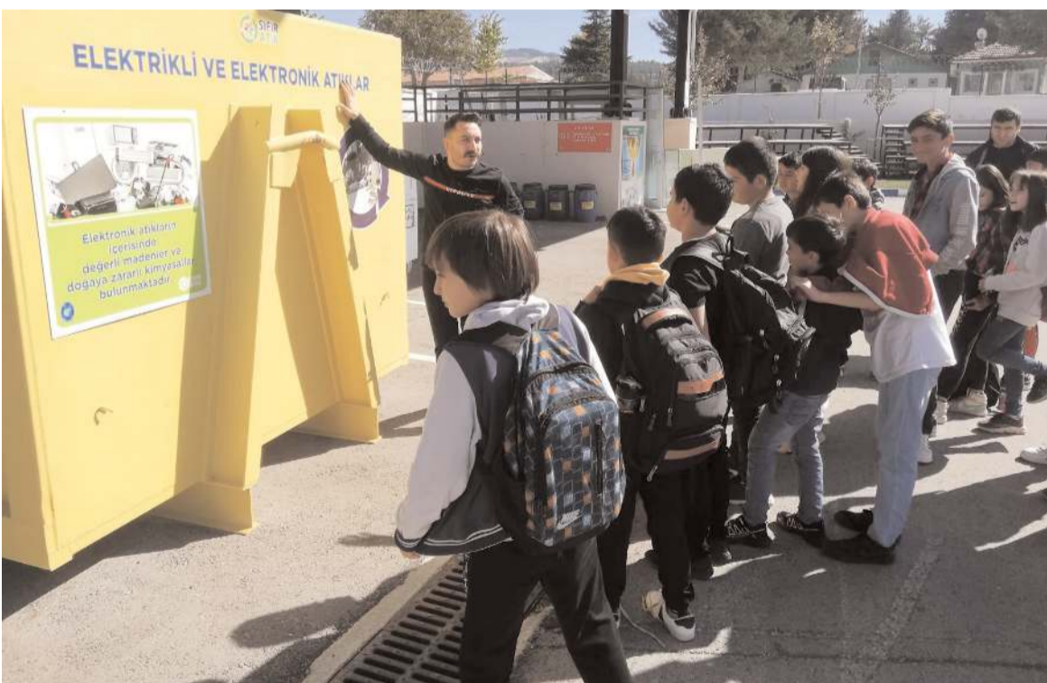
Alaca Ortaokulu öğrenci ve öğretmenleri Çorum Belediyesi 1. Sınıf Atık Getirme Merkezini ziyaret etti.

Program Samsun Devlet Klasik Türk Müziği Korusu'nun mini konseri ile sona erdi.