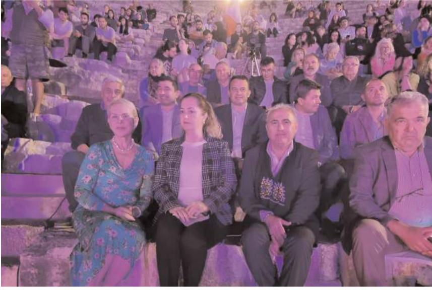
Program Patara Antik Tiyatrosunda yapıldı.