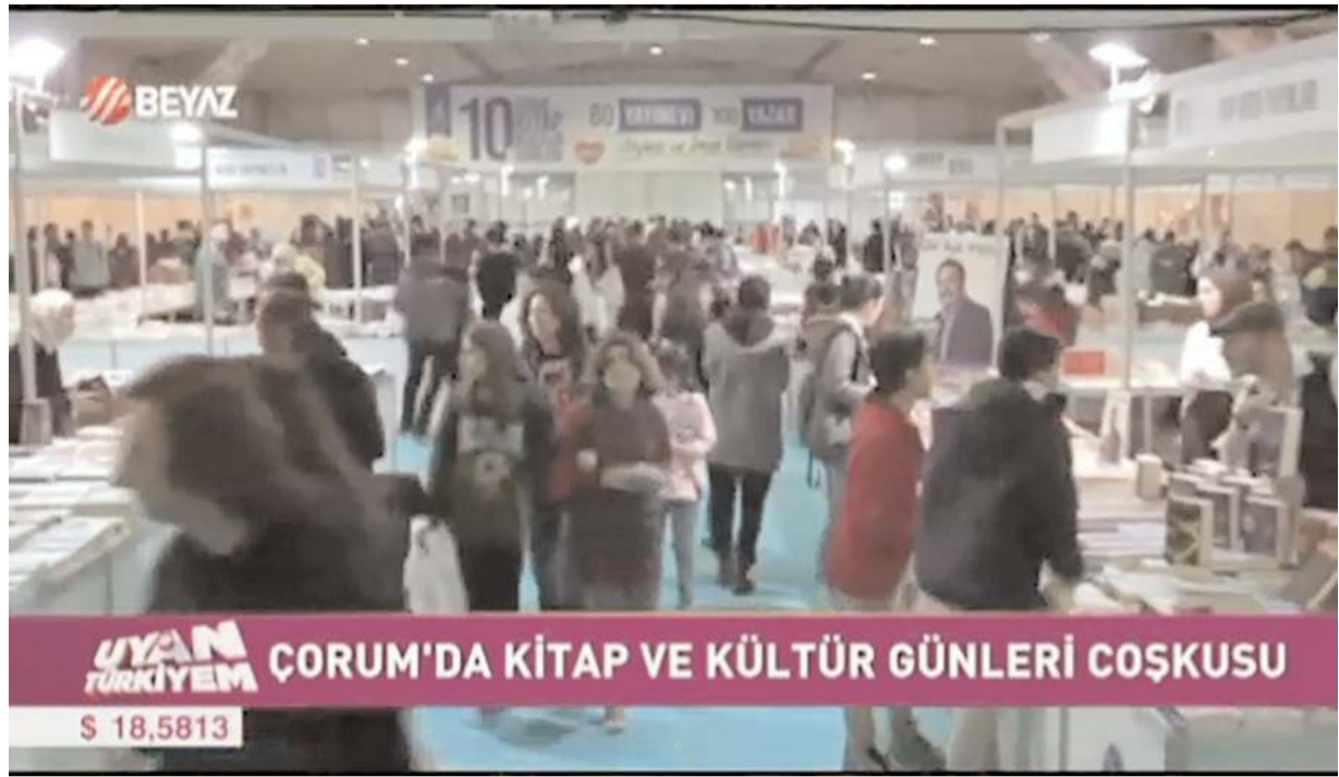
Fuara 166 yayınevi ve 100'ün üzerinde yazar katıldı.