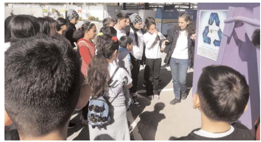
Atık Getirme Merkezi'ni gezen öğrencilere yetkililer bilgi verdiler.