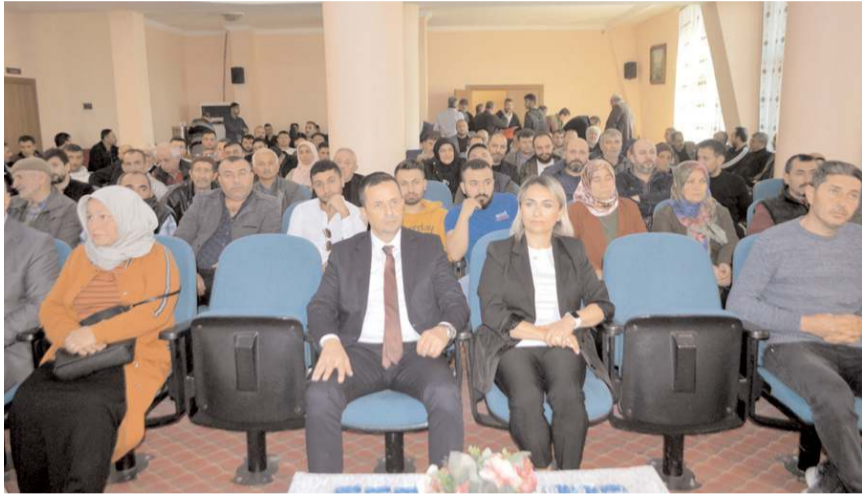
Eğitime katılım yüksek oldu.