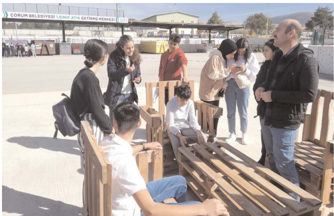
Öğrenciler atık malzemelerden üretilen ürünleri incelediler.