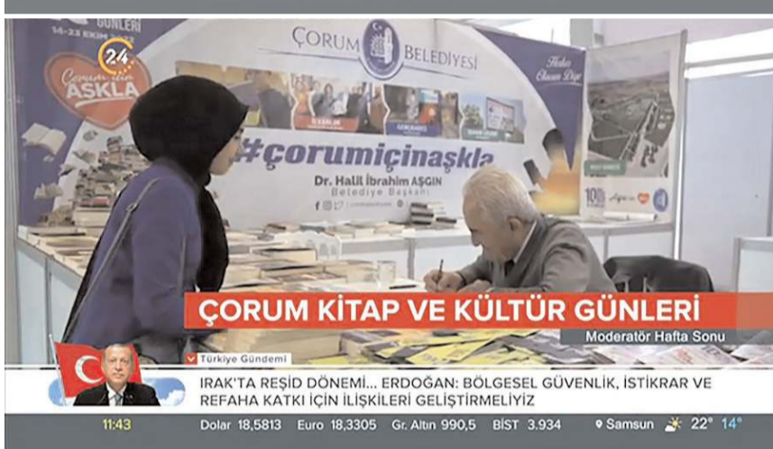
Fuar ulusal basında yer buldu.