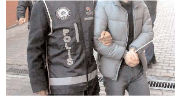
Adliyeve sevk edilen zanlı, Çorum Kapalı Cezaevi'ne gönderildi.