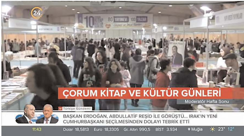
10. Çorum Kitap Kültür Günleri sona erdi.