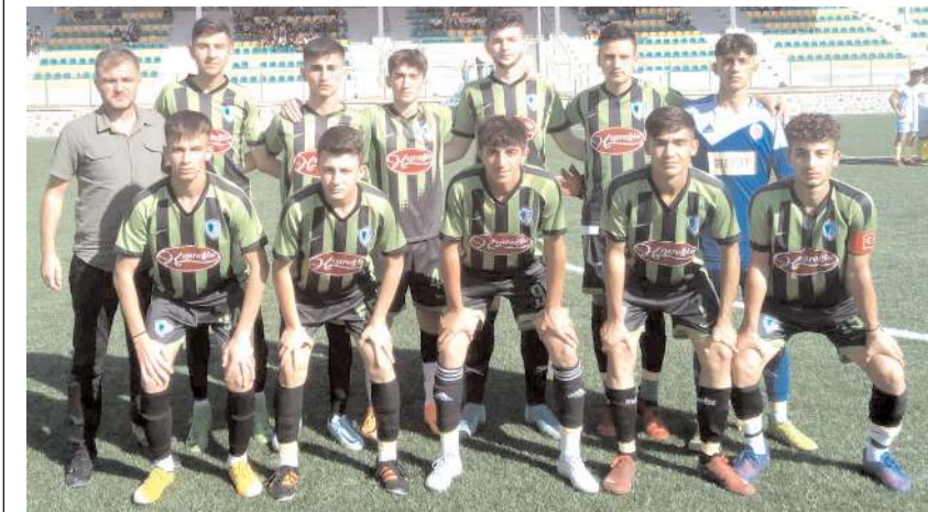
Mimar Sinan Gençlikspor ilk yarıyı tüm maçlarını kazanarak zirvede tamamladı

HE Kültürspor - Mimar Sinan Gençlik. Alaca Belediyespor- Hattuşa Gençlikspor. İskilipspor - Bayat Belediyespor.