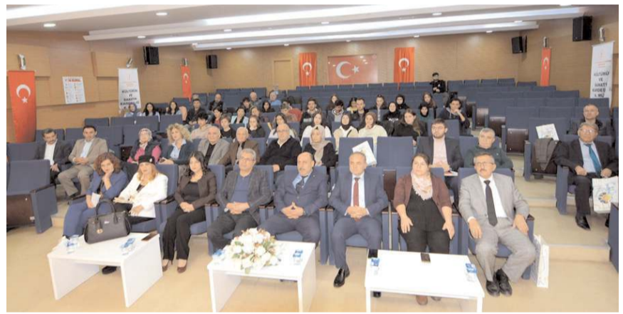
Programda şiir dinletisi yapıldı.

olarak 'Müze ve Kültür' konulu konferans düzenlendi. Çorum Müzesi'nde gerçekleştirilen konferanstan sonra ise Turgut Özal İş Merkezi Belediye Konferans Salonunda 'Şiir Dinletisi ve Türk Sanat Müziği Konseri' programı gerçekleştirildi.