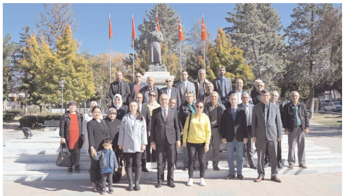
Çelenk sunma töreninin ardından hatıra fotoğrafı çekinildi.