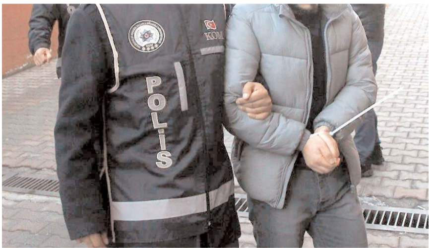
Adliyeye sevk edilen zanlı, Çorum Kapalı Cezaevi'ne gönderildi.

Girdiği evde 150 bin lira değerinde altın ve bir miktar parayı incelemek üzere yapıldığı bahanesiyle alıp kayıplara karışan zanlı, daha sonra aynı taktikle Zonguldak'ta da bir kişinin 70 bin lirasını aldı. Dolandırıcılık ihba-