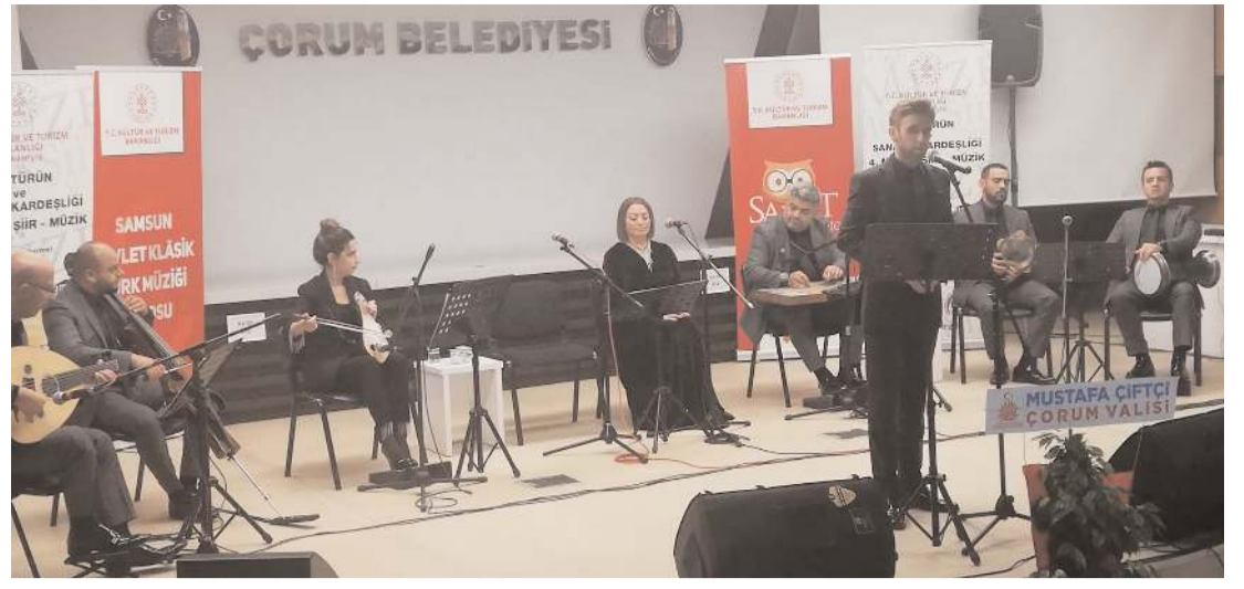
Samsun Devlet Klasik Türk Müziği Korusu mini konser verdi.