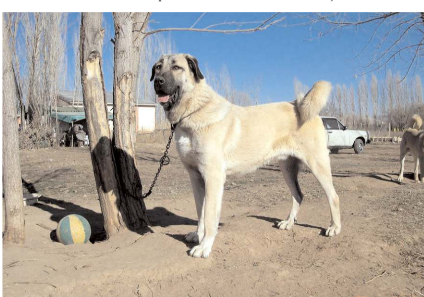
Köpekler 9 kategoride yarışacak.

Çorum Belediyesi'nin katkıları ve Uluslararası Avrasya Köpeklerini Koruma Geliştirme Federasyonu (AVKIF) tarafından Çorum'da WAD Türkiye Şampiyonası yapılacak. Yarışmada köpek ırkları birincilik için yarışacak.