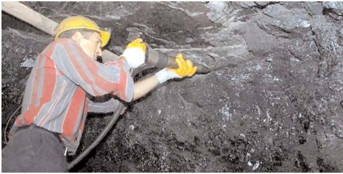
Bugün evlerimizde kullandığımız Doğalgaz'ın %80-90'ı metan içeriyor.