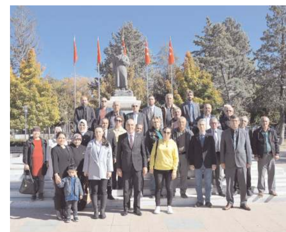
Çelenk sunma töreninin ardından hatıra fotoğrafı çekildi.