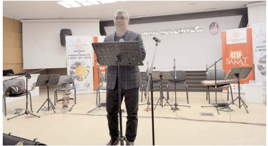
Kültür Varlıkları ve Müzeler Genel Müdür Yardımcısı Seyit Ahmet Arslan

Uluslararası Sanat ve İlim Derneği (USİD) ve Türkiye İlim ve Edebiyat Eseri Sahipleri Meslek Birliği (İLESAM) tarafından hazırlanan ve Kültür ve Turizm Bakanlığınca desteklenen proje kapsamında Çorum'da ilk