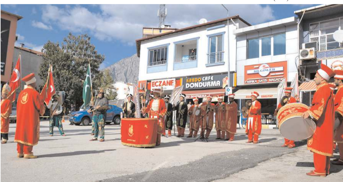
Açılış töreninde mehteran takımı konser verdi.