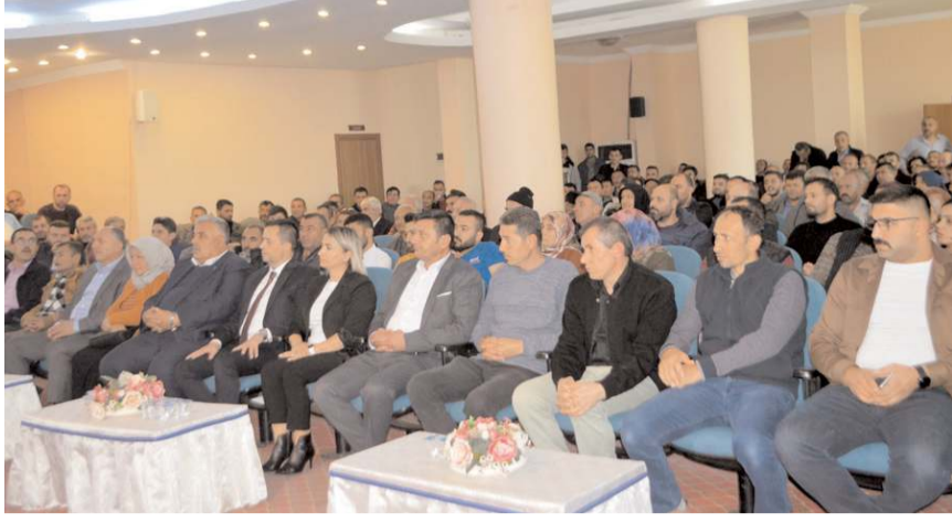
Eğitim ÇESOB konferans salonunda yapıldı.