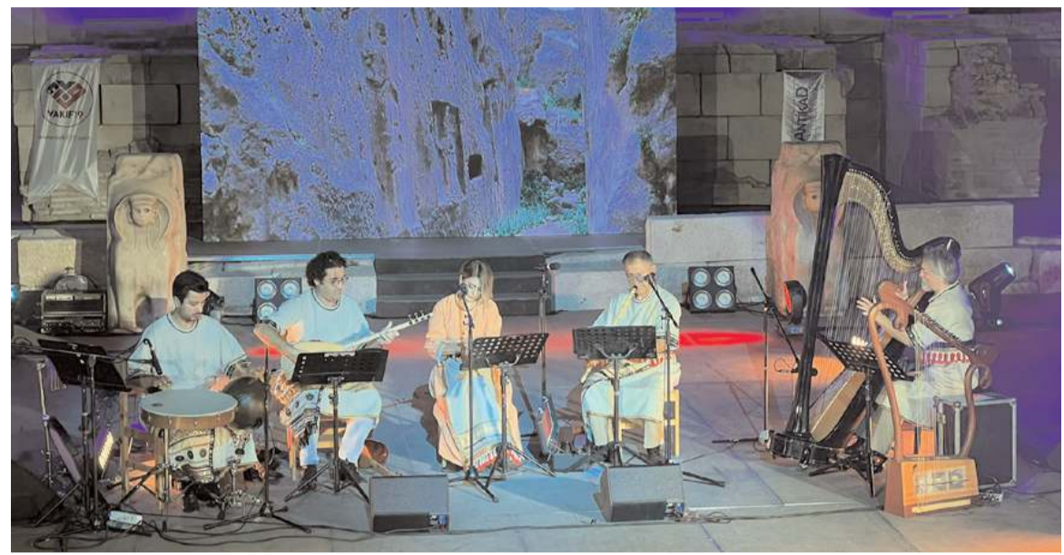
Hititler dönemine ait müzik aletlerinin kullanımı ve sanatçıların kısa sunumlarıyla anlatılan tarihi bir hikaye de Hititler'in yaşadığı bölgelere ait Anadolu Türküleri seslendirildi.