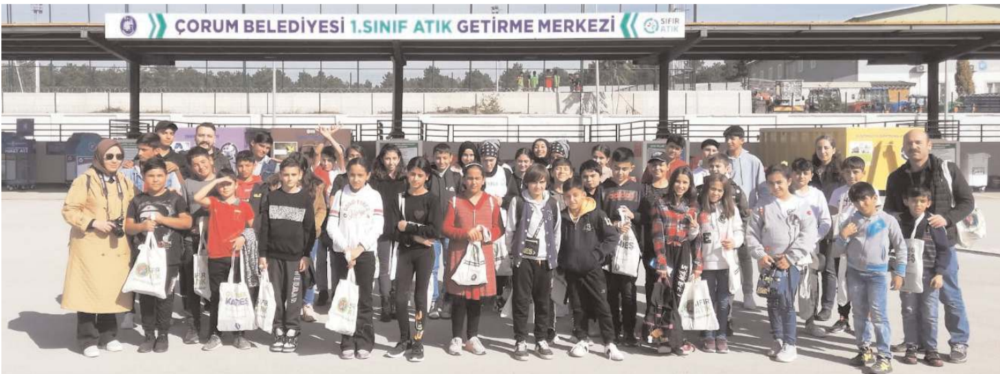
Öğrencilere ziyaretin sonunda hediye verildi.

Ziyaret sonunda merkez içerisinde bulunan atık malzemelerden ürünleri inceleyen öğrenci ve öğretmenlere poşet kullanımını azaltmak için bez çanta, geri dönüşüm not defteri, daha yeşil bir çevre için tohum seti hediye edildi. (Haber Merkezi)