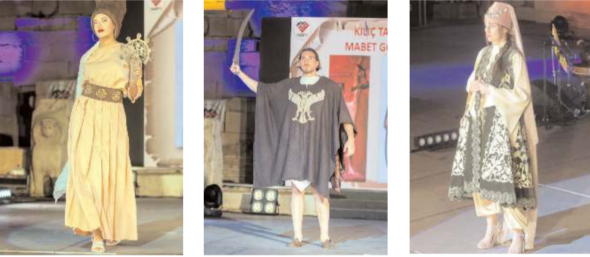
Defilede Hitit, Likya, Selçuklu, Osmanlı, Cumhuriyet dönemi kıyafetleri sergilendi.