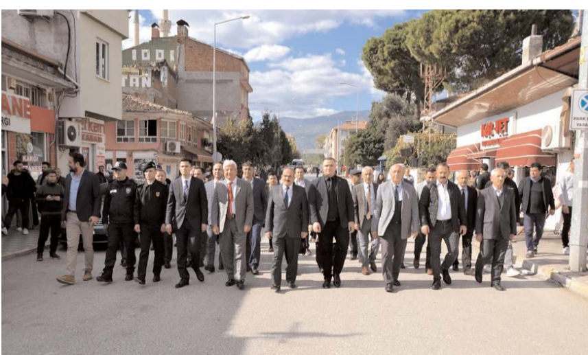
Kargı Belediyesi önünde toplanan vatandaşlar ve protokol üyeleri, Saat Kulesi'ne kadar yürüdü.

Kovid-19 salgını nedeniyle 2 yıl aranın ardından düzenlenen panayır kapsamında konserlerin yanı sıra, yağlı güreş ve trap gibi etkinlikler yapılacak. (AA)