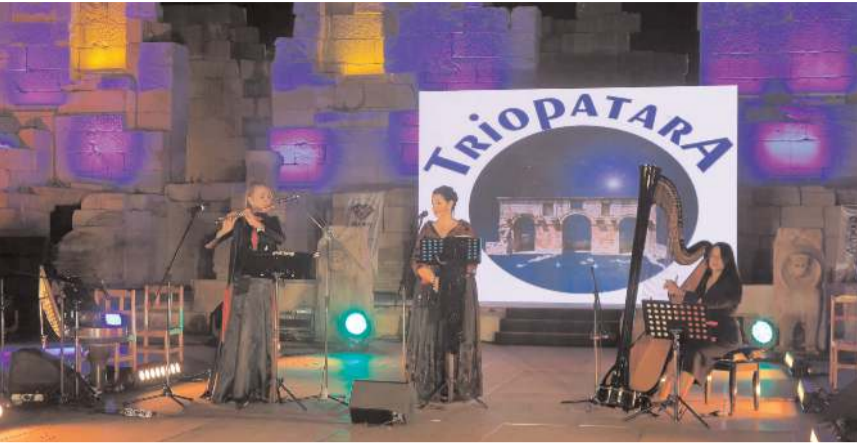
Etkinlikte Triopatara grubu konser verdi.