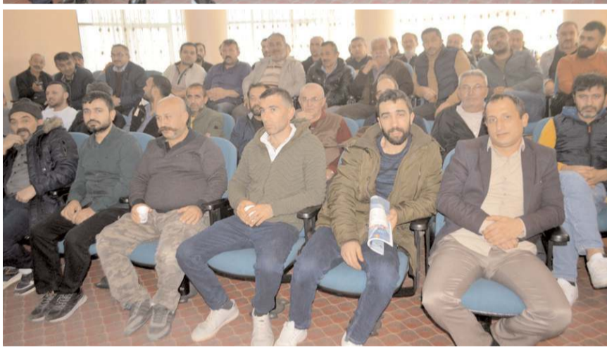
Eğitimin ardından sınavda başarılı olan kursiyerlere "Hijyen Eğitim Belgesi" verildi.