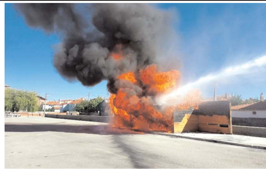
Olayda işyerinin tamamı yandı.

Diğer taraftan, ilçedeki köy pazarında geçen sene 13 Aralık tarihinde yangın çıktı ve çıkan yangın sonrasında maddi hasar gören 8 dükkanın yıkıldığı öğrenildi. (İHA)