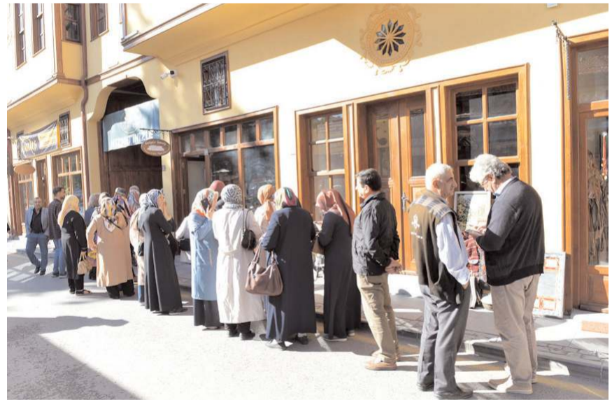
Geziye ilgi yüksek oldu.