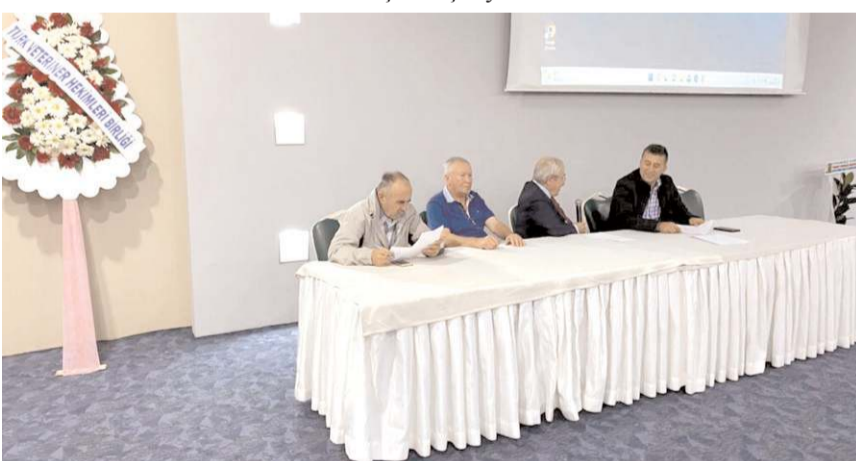
Anitta Otel'de yapılan genel kurulda ilk olarak divan heyeti oluşturuldu.