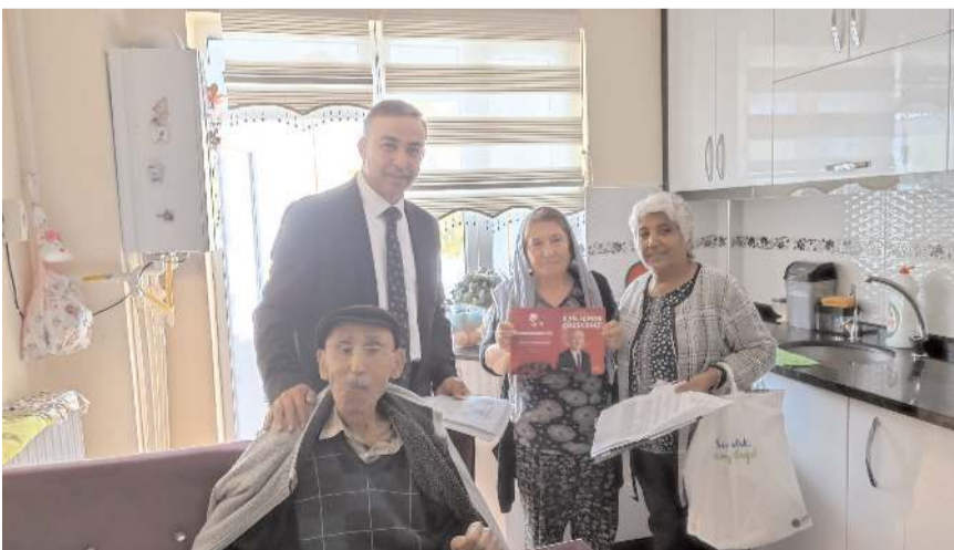
Ziyaretlerde parti politikaları ile ilgili borşüler verildi.