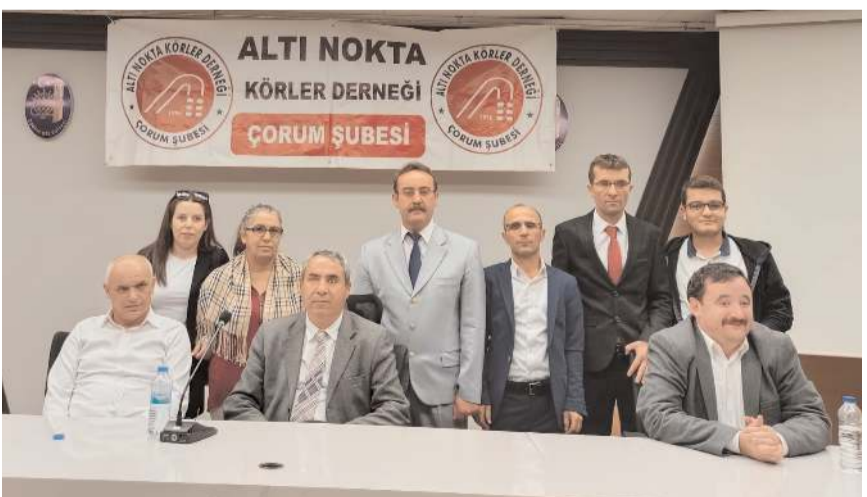
Genel kurulda ilk olarak divan heyeti belirlendi.