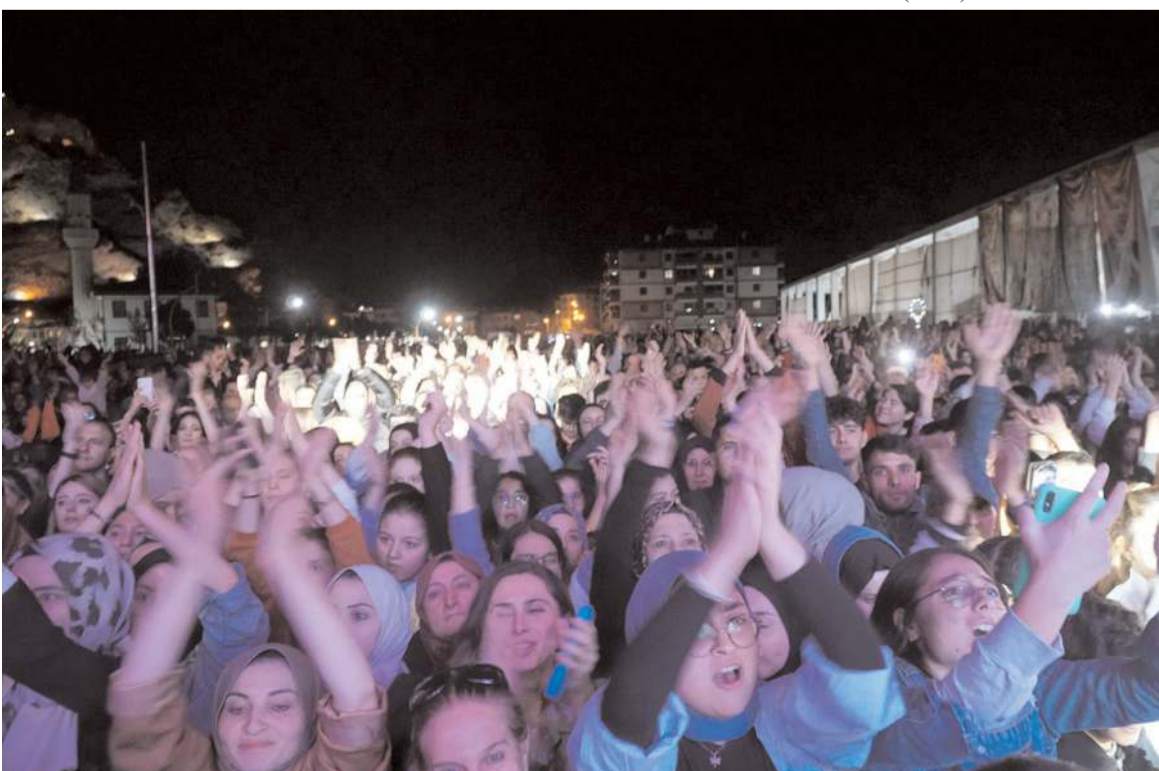
Konsere ilgi yüksek oldu.

Osmancık'ta düzenlenen Pirlanta Kültür Sanat ve Pirinç Festivali'nde muhteşem bir konser veren ünlü sanatçı Kırâç, "Fatih Sultan Mehmet'te bizim, Mustafa Kemal Atatürk'te bizim" dedi.