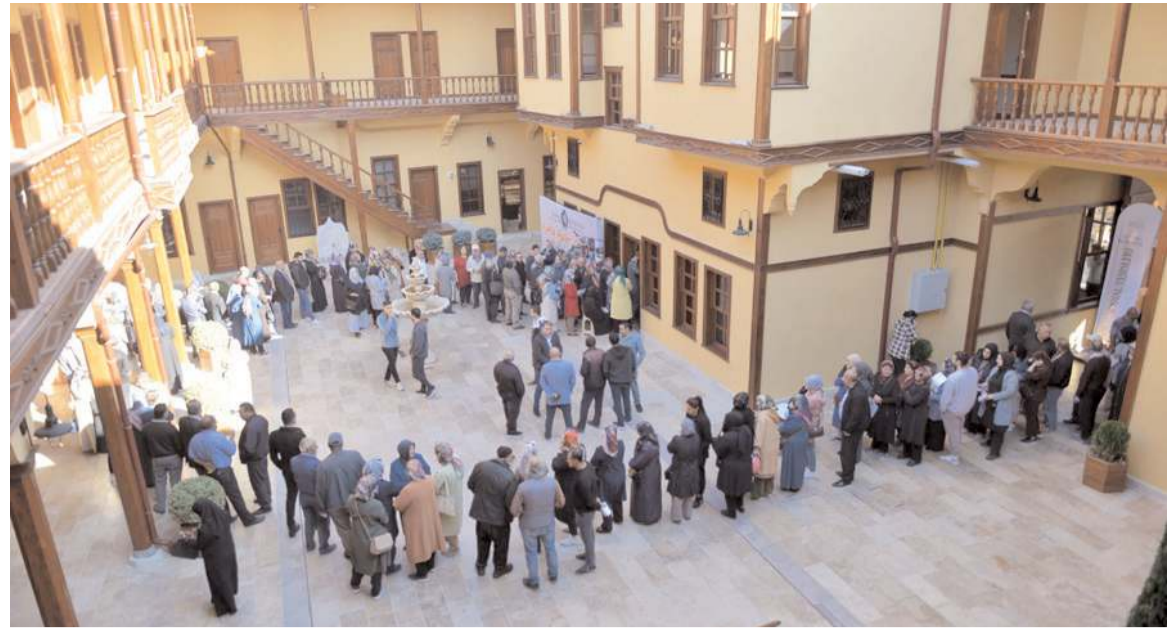
Vatandaşlar Velipaşa Hanı'nda uzun kuyruklar oluşturdular.