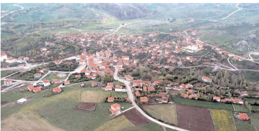
Referandumda 432 kişi katıldı.

Boğazkale'ye bağlı Yekbas köyünde referandum heyecanı yaşandı. Köy sakinleri, Boğazkale'nin mahallesi olması için sandık başına gitti. Yapılan referandumda 432 kişi katıldı, 380 kişi "evet" oyu kullanırken 52 kişi "hayır" oyu kullanıldı. (İHA)