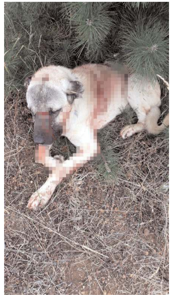
Köpek 19 yerinden yaralanmış.