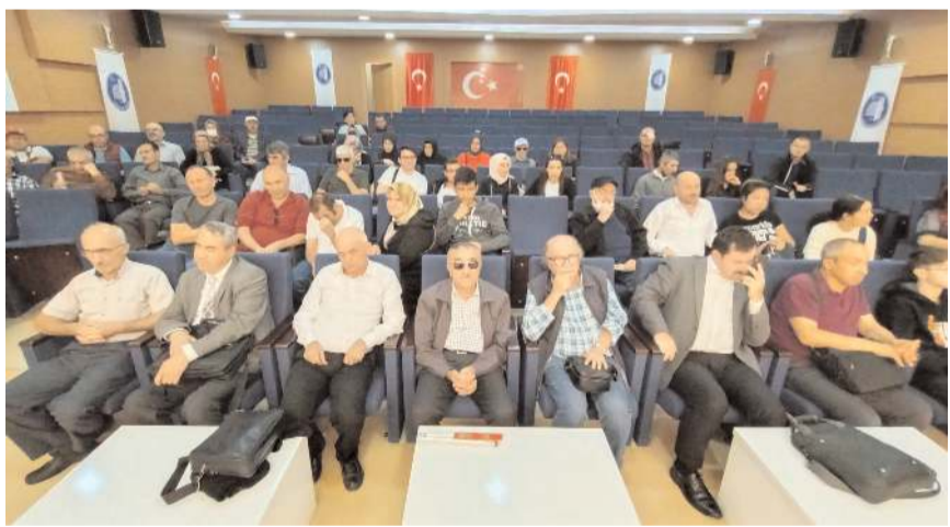
Genel kurul Turgut Özal İş Merkezi Belediye Konferans Salonunda yapıldı.