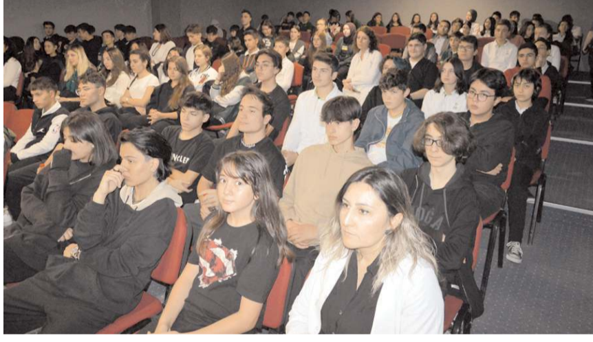
Konferansı çok sayıda öğrenci izledi.