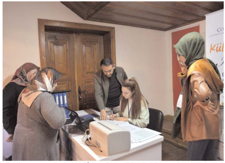
Geziler kapsamında 1500 kişi İstanbul'un tarihi yerlerini gezme imkanı bulacak.