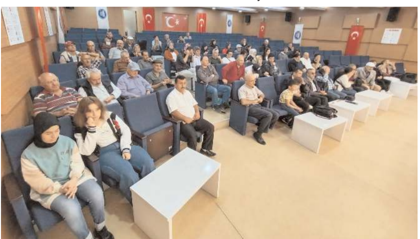
Genel kurulda tek liste yer aldı.