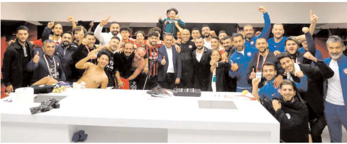
Savunma Bakanı Muhsin Dere soyunma odasında takımla galibiyet sevincini böyle paylaştı