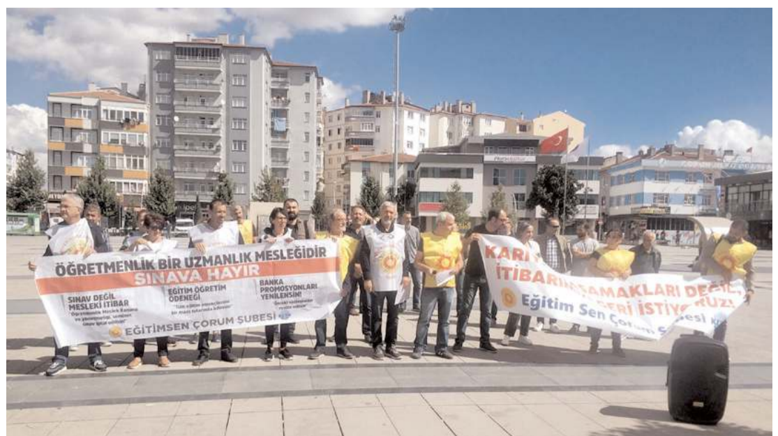
Eğitim-Sen Çorum Şube yönetimi, Kadeş Barış Meydanı'nda açıklamalarda bulundu.