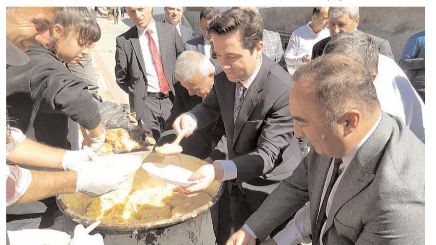
Davetlilere helva ikram edildi.