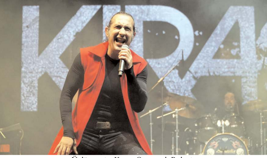
Ünlü sanatçı Kırâç, Osmancık Pirlanta Kültür Sanat ve Pirinç Festivali'nde sahne aldı.

'Z kuşağı, diye bir kuşak yok, Türk gençleri var'