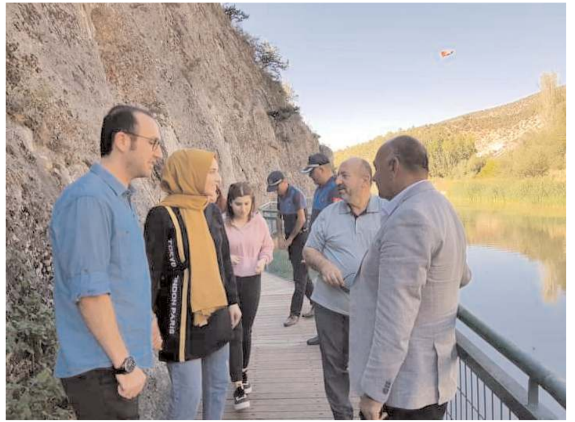
Milletvekili Kavuncu, İncesu Kanyonu'nu ziyaret etti.