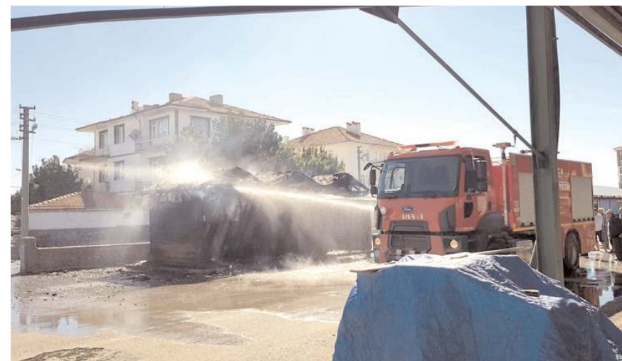
Yangını itfaiye ekipleri söndürdü.