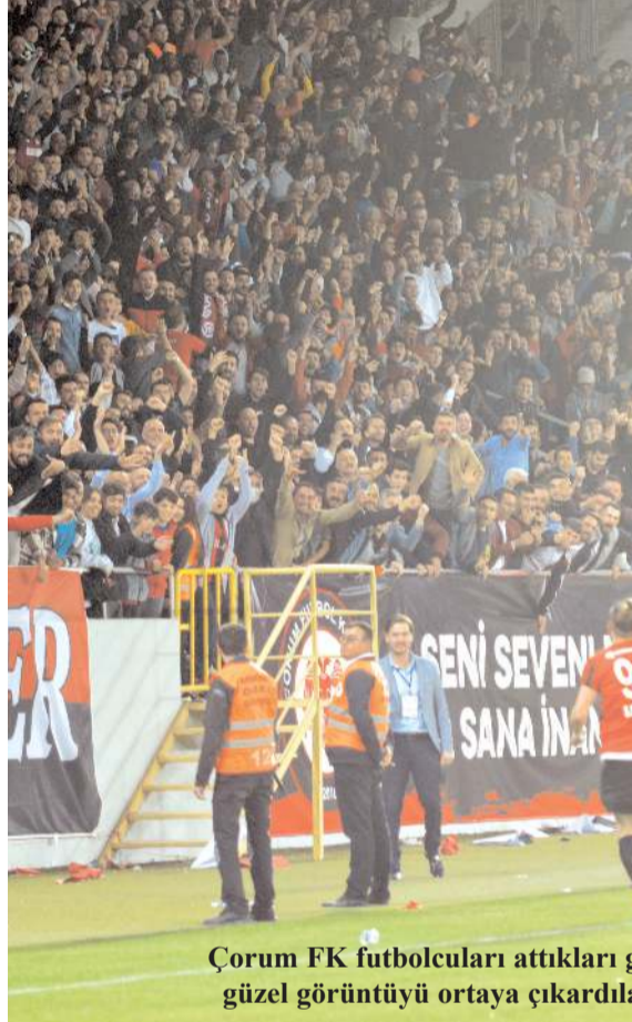
Çorum FK futbolcuları attıkları golden sonra böyle tüm takım olarak tribüne koşarak bu güzel görüntüyü ortaya çıkardılar ve birlikte sevinmenin güzel bir örneğini gösterdiler.

Bu tablo hem takımın inancının artmasına hemde camianın taraftarın ve şehrin takıma olan inancı ve güveninin artmasına neden olacaktır. Galibiyet güzel ancak bi coşku ve birlikte sevinmeyi başarmak hedefe giden yolda çok daha önemli.