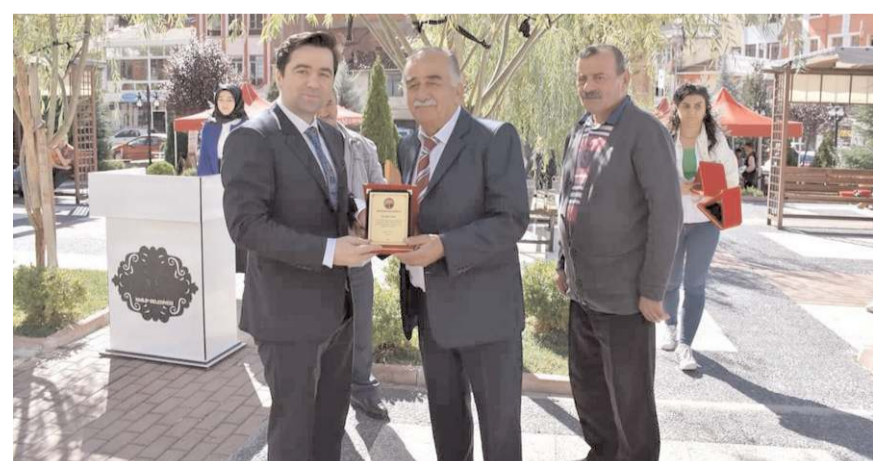
İlçede uzun süre esnafılık yapan zanaatkarlara plaket verildi.