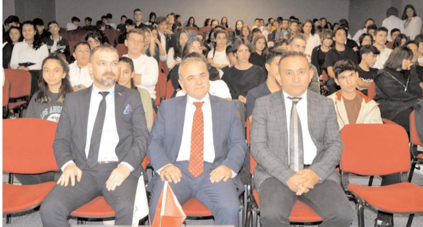
Konferans, Doğa Koleji'nde, Türk Dil Bayramı'nın yıl dönümü nedeniyle yapıldı.