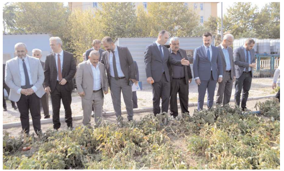
Sebze hasadı programına protokol üyeleri de katıldı.