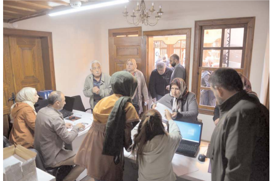
Geziye katılmak için Çorum'da ikamet etme şartı bulunuyor.