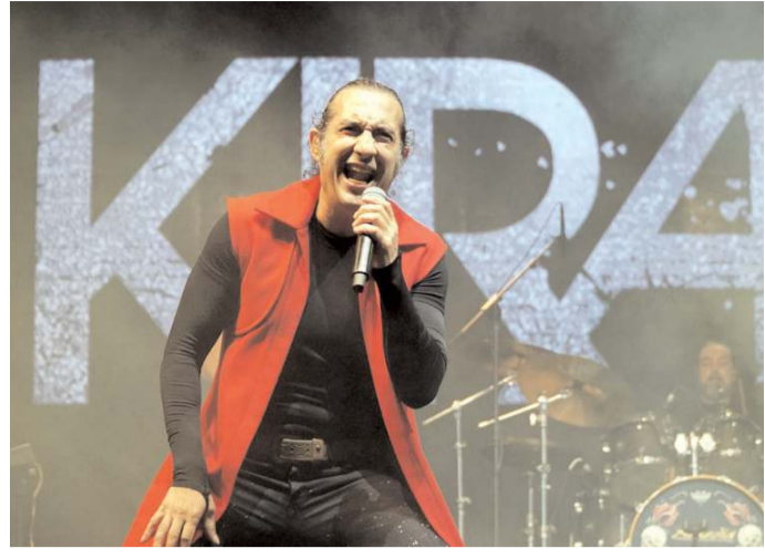
Ünlü sanatçı Kırâç, Osmancık Pırlanta Kültür Sanat ve Pirinç Festivali'nde birbirinden güzel eserleri seslendirdi.

'Z kuşağı, diye bir kuşak yok, Türk gençleri var'