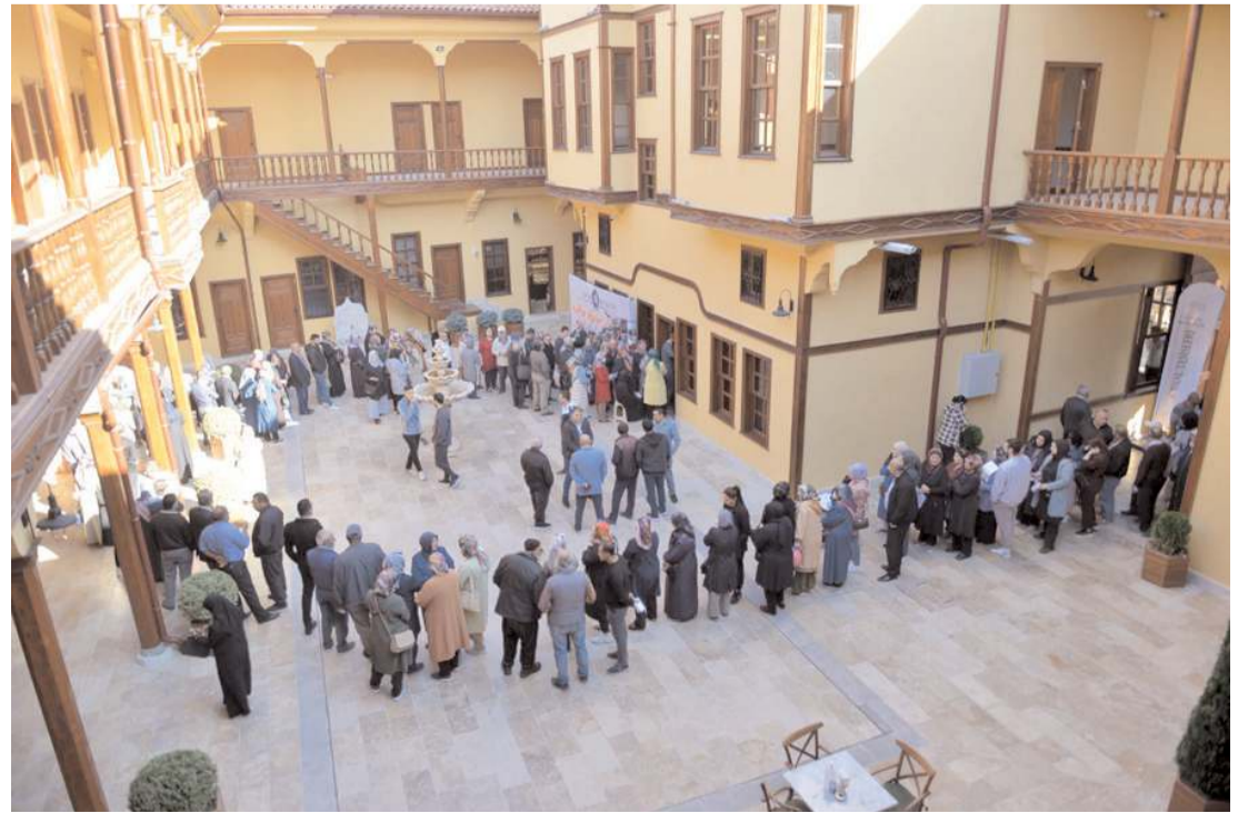
Vatandaşlar Velipaşa Hanı'nda uzun kuyruklar oluşturular.