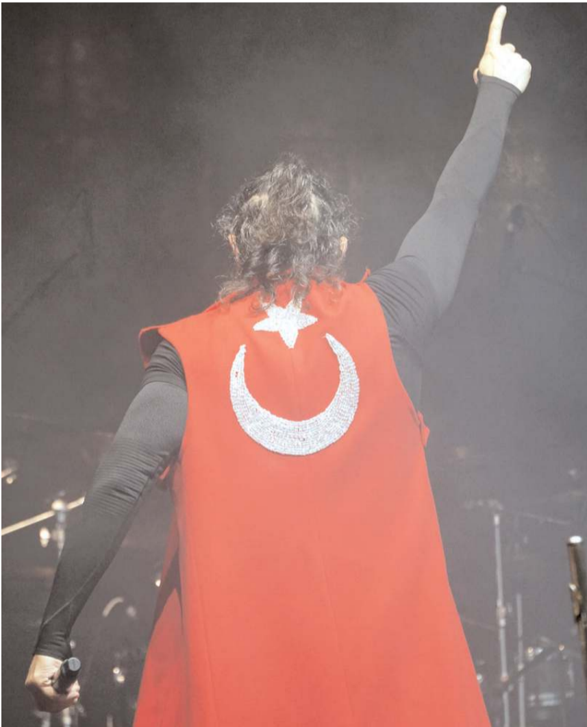
Kırâç, konsere üzerinde Türk bayrağı motifi bulunan elbise ile çıktı.