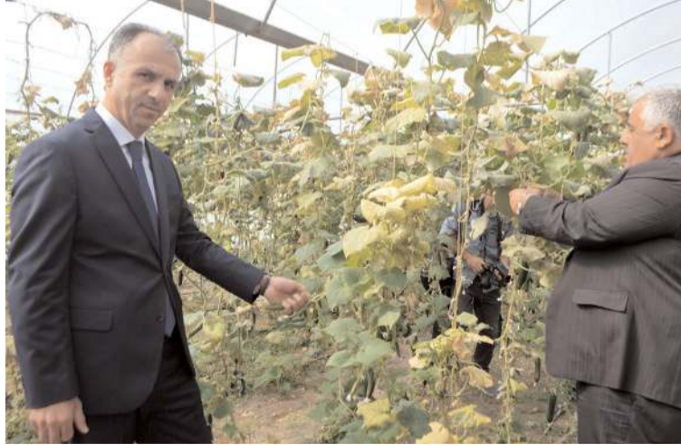
Çorum Cumhuriyet Başsavcısı Ahmet Bektaş, proje hakkında açıklamalarda bulundu.