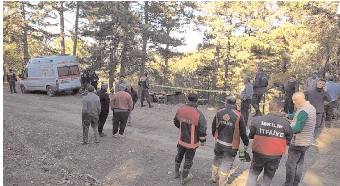
Olay, 22 Ekim tarihinde İskilip'e bağlı Seki köyünde meydana gelmişti.

Olay, 22 Ekim tarihinde İskilip ilçesine bağlı Seki köyünde meydana geldi. Edinilen bilgilere göre, sabah saatlerinde orman kesimi için evin-