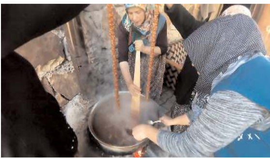
Oğuzlar ilçesinde hasadın ardından vatandaşlar ceviz sucuğu yapımına başladı.