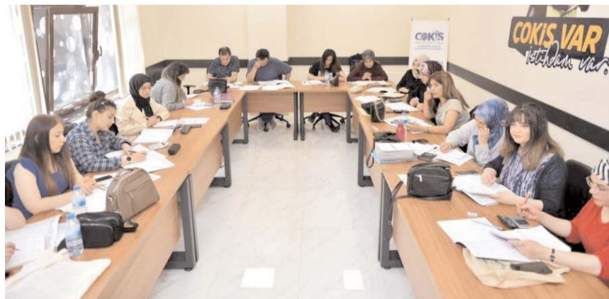
ÇOKİŞ, 2020 yılında Kadeş Barış Meydanı'nda faaliyetlerine başladı.