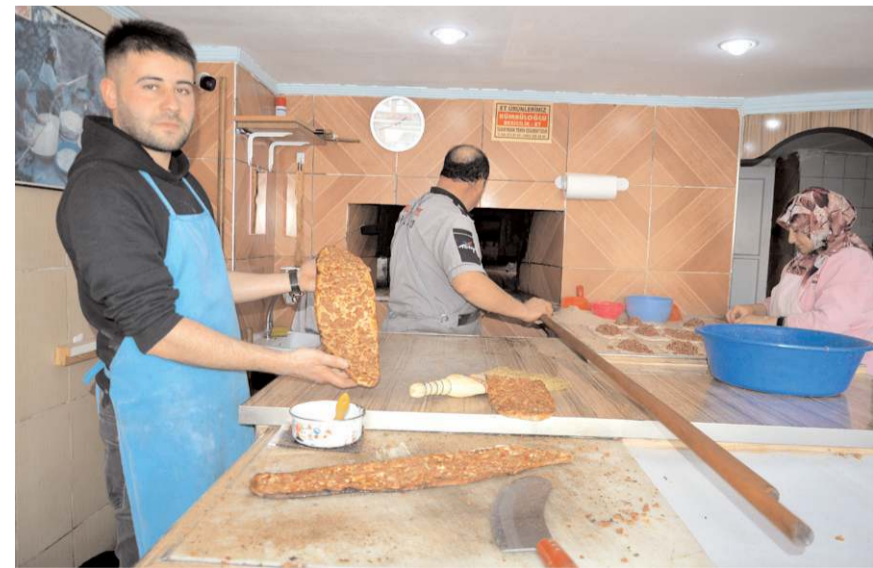
Yarım pideye öğrencilerin ilgisi yüksek.