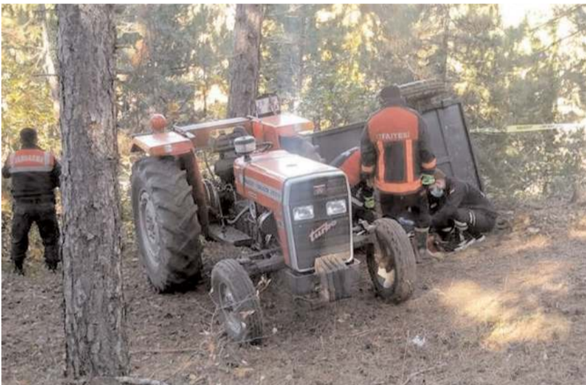
Sefer Öztürk yönetimindeki traktör römorku ormanlık alanda şarmpole devrilmiş halde bulunmuştu.