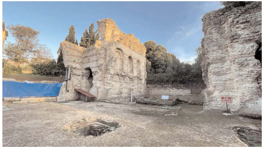
Kazıda 18.yy ile 19.yy din adamlarına ait olduğu öğrenilen çok sayıda iskelet bulundu.

Ocak-Eylül döneminde bir önceki yılın aynı dönemine göre trafiğe kaydı yapılan taşıt sayısı %0,6 azalarak 907 bin 499 adet olurken, trafikten kaydı silinen taşıt sayısı %13,1 azalarak 27 bin 66 adet oldu. Böylece Ocak-Eylül döneminde trafikteki toplam taşıt sayısında 880 bin 433 adet artış gerçekleşti.