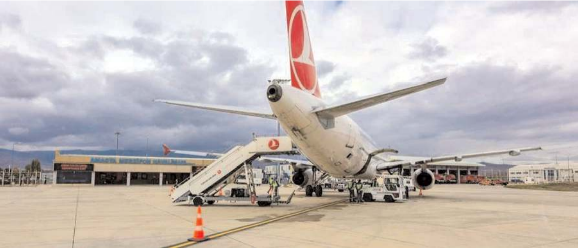
Amasya-Merzifon Havalimanı'ndan bu yılın Ocak-Ağustos döneminde 62 bin 298 yolcu taşındı.