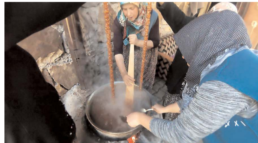
Oğuzlar ilçesinde hasadın ardından vatandaşlar ceviz sucuğu yapımına başladı.

Yaklaşık 50 yıldır ceviz sucuğu yaptığını anlatan Çamdal, ceviz sucuğu yapımını gelinlerine ve torunlarına da öğrettiklerini, gelecekte onların da ceviz sucuğu yapmaya devam etmesini istediğini sözlerine ekledi. (AA)