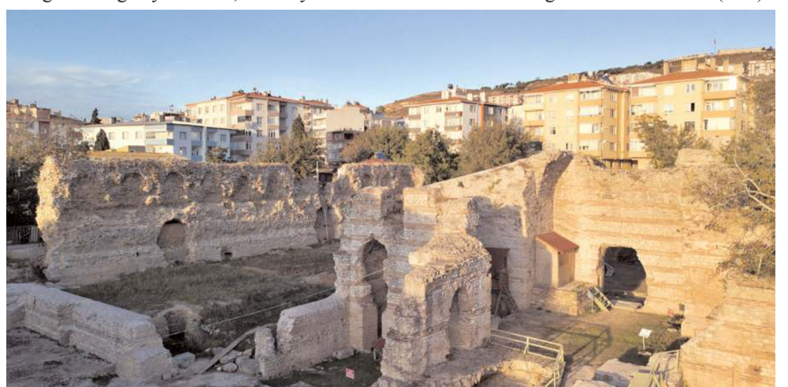
Balatlar Yapı Topluğuna kazısı Sinop'ta yapıyor.

Hetto, kazıda çıkan iskeletlerin, Çorum'da Hitit Üniversitesi Antropoloji Bölümü'nde muhafaza edildiğini ve doktora tez çalışması kapsamında incelendiğini sözlerine ekledi. (A.A.)