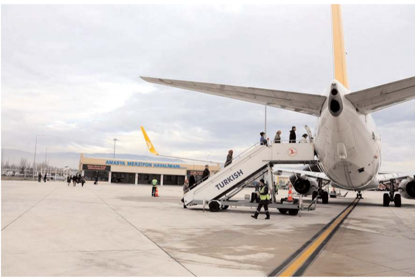
Amasya-Merzifon Havalimanını en çok Çorumlular kullanıyor.

2021 yılında 8 bin 561 yolcuya hizmet veren Amasya Merzifon Havalimanı hizmet binası 450 metrekare yolcu kullanım alanına sahip. 450 metrekare yolcu kullanım alanı bulunan Amasya Merzifon Havalimanı Terminal binasının küçük olması ve ihtiyaçlara cevap verememesi sebebi ile genişletilme adımı atıldı. Toplam 6 milyona mal olacak projenin önümüzdeki aylarda tamamlanarak hizmete açılması bekleniyor.