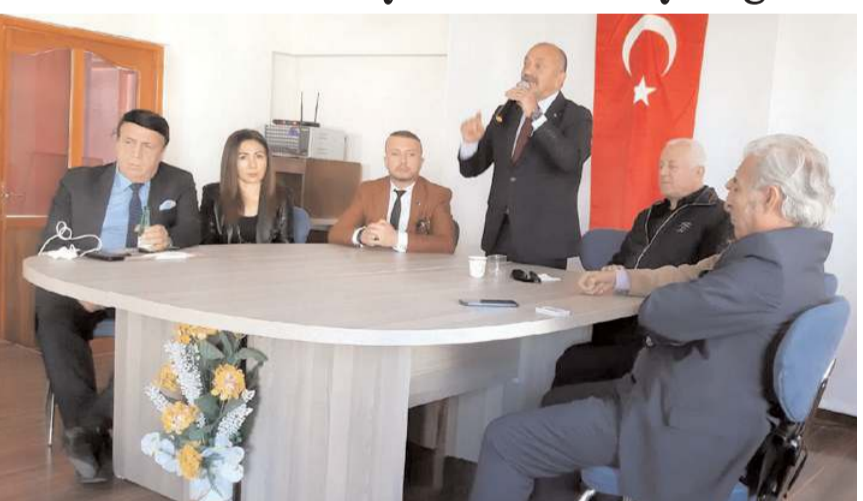
Heyeti Ortaköy Belediye Başkanı Taner İsbir ağırladı.

vererek, memnuniyetlerimizi ifade ettik. Dünya Çorumlular Konfederasyonu Genel Başkanı Metin Akkuş ve beraberindeki heyete gerçekleştirilen ziyaretten dolayı teşekkür ediyorum" dedi. (Haber Merkezi)