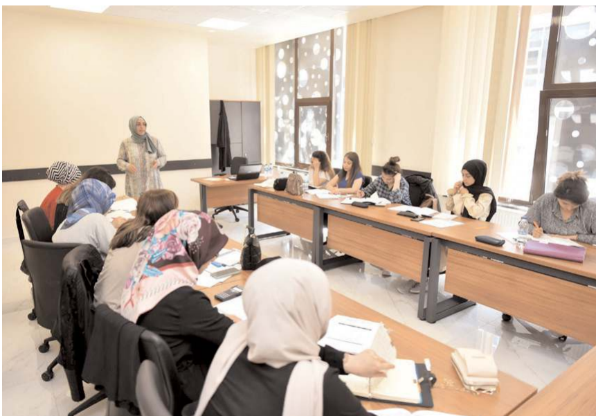
ÇOKİŞ Kadeş Barış Meydanında bulunuyor.