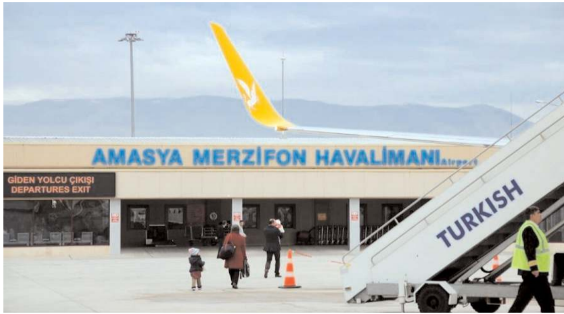
Amasya Merzifon Havalimanı hizmet binası 450 metrekare yolcu kullanım alanına sahip.

Hava Meydanları İşletmesi (DHMİ) Genel Müdürlüğü verilerine göre, Amasya Merzifon Havalimanı'nda geçen ay iç hatlarda 8 bin 87, dış hatlarda bin 577 olmak üzere 9 bin 664 yolcuya hizmet verildi.