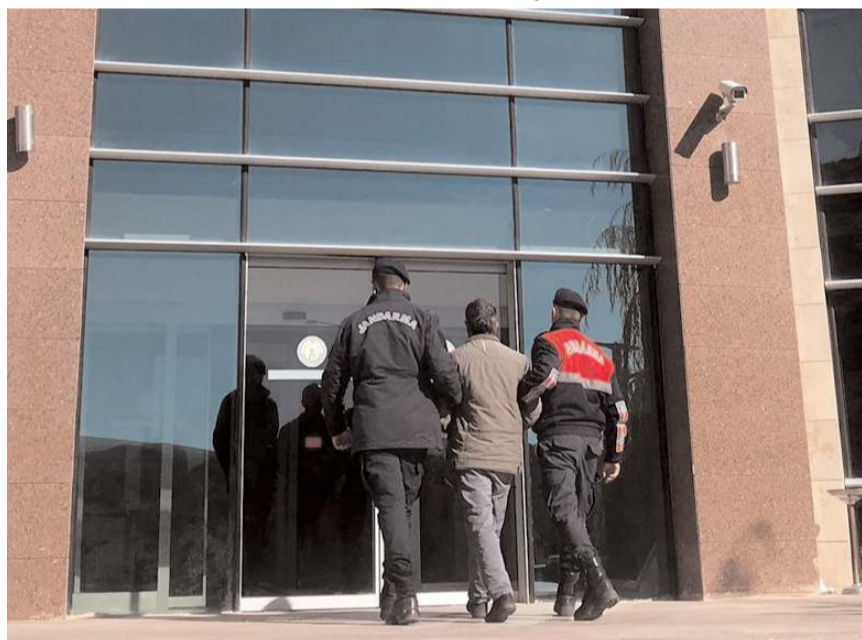
Hakim karşısına çıkartılan M.K tutuklandı.