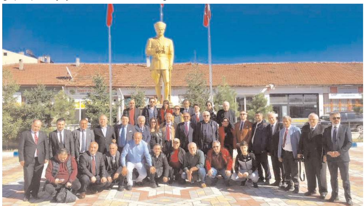
Gezinin sonunda toplu hatıra fotoğrafı çekildi.