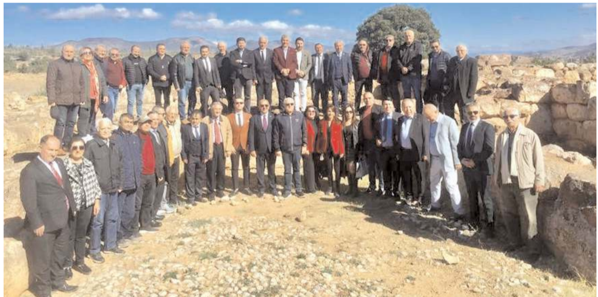
Dünya Çorumlular Konfederasyonu heyeti Şapınuva'yı gezdi.

maaşlarına 1000 TL üzerinde bir katkı sağlayacaktır. Tüm belediye personeline ve ailelerine hayırlı ve uğurlu olsun" dedi. (Haber Merkezi)