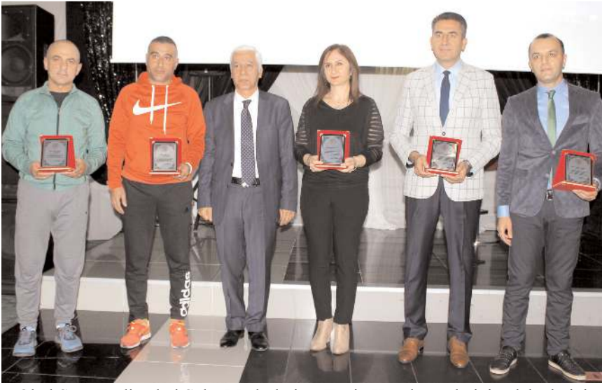
Okul Spor Faaliyetleri Şube Müdürleri ve Tertip Kurulu üyelerinin plaketlerini Vali Yardımcısı Erdoğan Tanyılmaz verdi

Okul Sporlarında geçtiğimiz sezon Türkiye Şampiyonalarının da derece yapan sporcusu bulunan antrenör ve Beden Eğitimi Öğretmenleri ile Tertip Kurulu üyelerine plaket verildi. Törende 8 Beden Eğitimi Öğretmeni ile 17 antrenöre plaket verildi. Derecelerin tamamının ferdi branşlarda olması dikkat çekti.