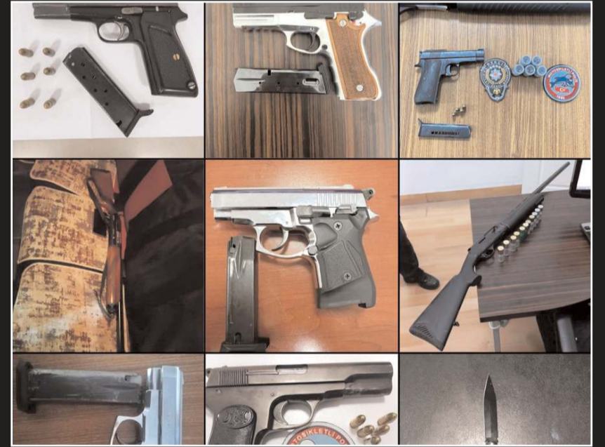
Operasyonlarda çok sayıda ateşli silah ele geçirildi.

9 adet tabanca, 4 adet kurusıkı tabanca, 5 adet tüfek, 2 adet bıçak ve 12 adet sentetik ecza maddesi ele geçirilirken haklarında arama kararı bulunan 34 şahısta yakalandı. (Haber Merkezi)