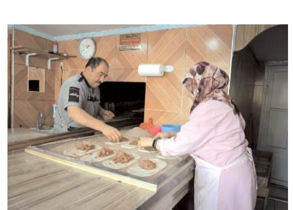
Yarım pideye öğrencilerin ilgisi yüksek.

■ İl Emniyet Müdürlüğü ekipleri aranan şahısların bulunmasına yönelik yaptıkları çalışmalarda arama kararı bulunan 34 şahsı yakaladı.