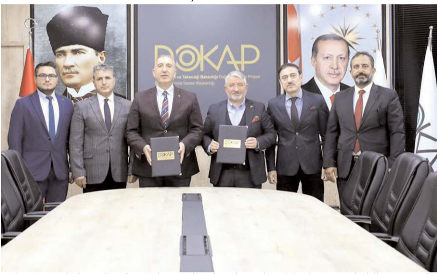
DOKAP Bahabey Çamlığı'nda yapılacak çalışmalara % 70 oranında hibe verecek.