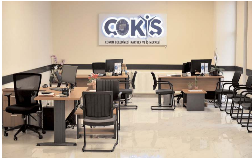
ÇOKİŞ, 2020 yılında faaliyetlerine başladı.