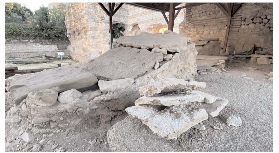
Piskopos mezarları, olarak adlandırılan alan, oturur vaziyetteki defin şekliyle Karadeniz Bölgesi'nde türünün tek örneği olarak gösteriliyor.

Karadeniz özelinde bu tür bir mezarın tek olduğunu vurgulayan Hetto, "Hristiyan inan-