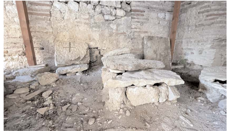
Balatlar Yapı Topluğuna kazısı Sinop'ta yapıyor.

cında kıyamet günü Hz. İsa'nın doğudan geleceği, dünyaya geri döndüğü zaman inanan insanlara önderlik eden bu din adamlarının daha hızlı ayağa kalkması, İsa'yı selamlaması ve bu mezarlıkta defnedilen diğer inanan kimselere öncülük etmesi için bu şekilde defin tercih edilmiş ama Karadeniz Bölgesi'nde çok ünik bir özellik." ifadesini kullandı.