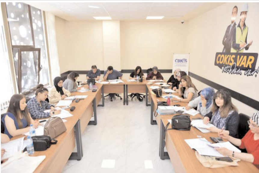
ÇOKİŞ, kurulduğu günden beri 1870 kişiyi işe yerleştirdi.

ÇOKİŞ'in hizmetlerimizden yararlanmak isteyen vatandaşlar, internet sitesinden açık olan ilanlara başvuru yapabilir ya da Kadeş Barış Meydanında ki ofisi ziyaret ederek iş başvurusunda bulunabilir.