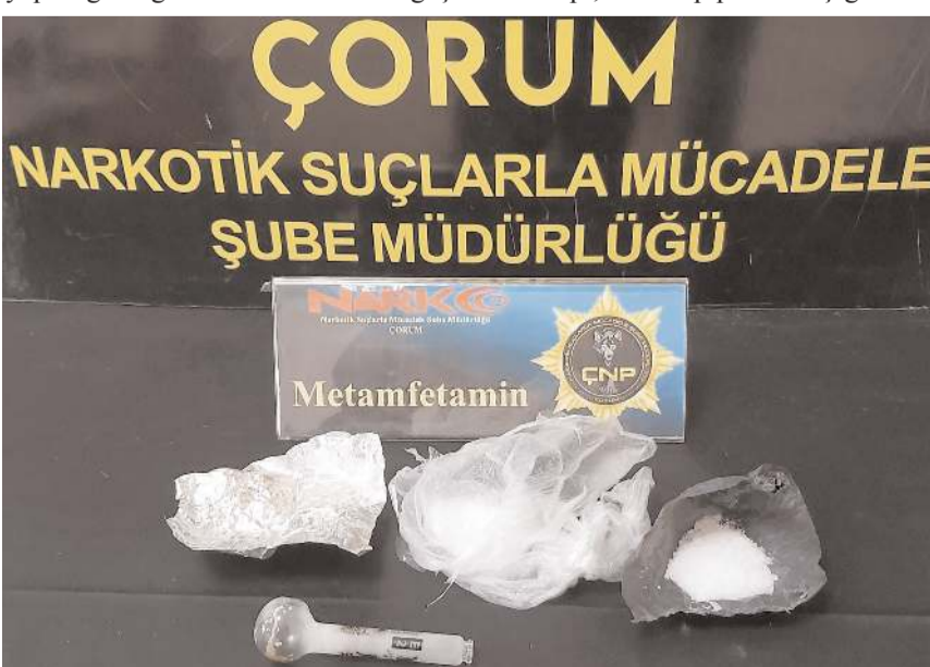
Araçta yapılan aramada 33 gram metamfetamin maddesi ve 4 tablet sentetik ecza hapi ele geçirildi.

Gözaltına alınan 2 zanlı, emniyetteki işlemlerinin ardından sevk edildikleri adliyeye çıkarıldıkları hakimlikçe tutuklandı. (AA)