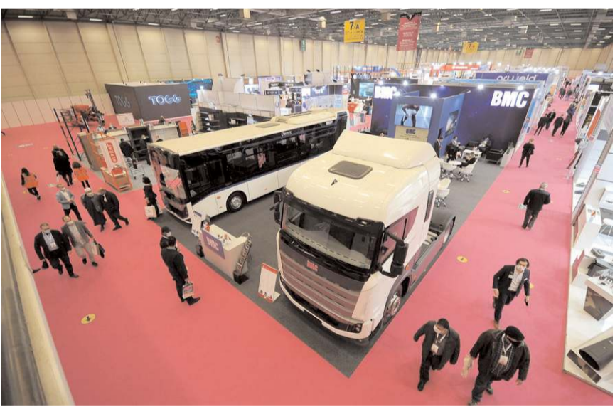
MÜSİAD EXPO, 2-5 Kasım tarihlerinde 19'uncu kez kapılarını açacak.

Üretim ve Yatırım Hareketine atıfta bulunarak, MÜSİAD EXPO ile ülke genelinde devam eden girişimlere maksimum fayda sağlayacaklarını söyledi.