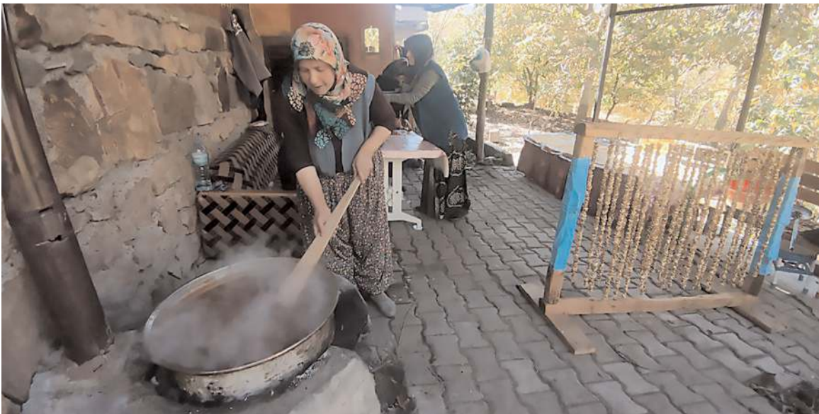
Çevizler kadınların hamarat ellerinde kışın tüketilmek üzere ceviz sucuğuna dönüştürülüyor.