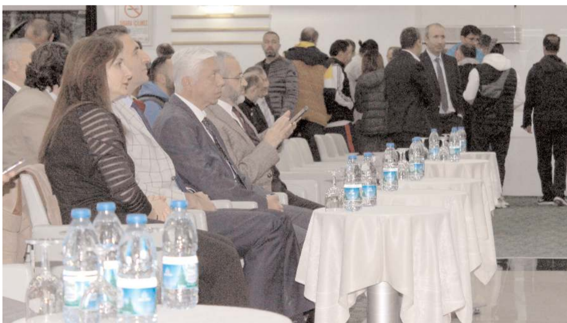
Toplantı için Vali, İl Müdürü ve diğer Müdürler salonda yerini almış toplantı başlamış arka planda kokteyl masalarında sohbet eden Beden Eğitimi Öğretmenlerinin bu görüntüsü hiç yakışmadı