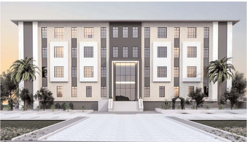
Bina 1829 m2'si kapalı olmak üzere 7 bin 79 m2 alana inşa edilecek.

Ceylan, bu ve benzeri yatırımların kazandırılmasından dolayı başta Cumhurbaşkanı Recep Tayyip Erdoğan olmak üzere emeği geçen herkese teşekkür etti. (Haber Merkezi)