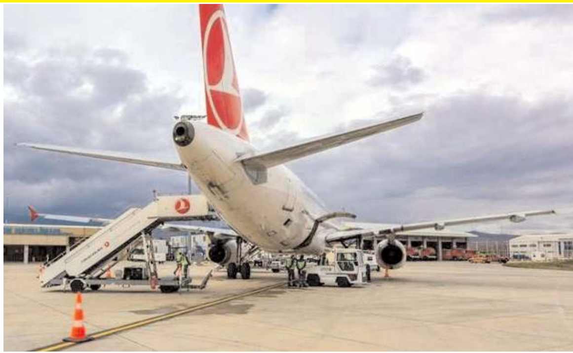
Amasya-Merzifon Havalimanı'ndan bu yılın Ocak-Ağustos döneminde 62 bin 298 yolcu taşındı.

Merzifon Havalimanı beklentilerin gerisinde kaldı