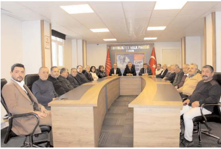
CHP İl Başkanlığında gerçekleştirilen basın toplantısına partililerde katıldı.