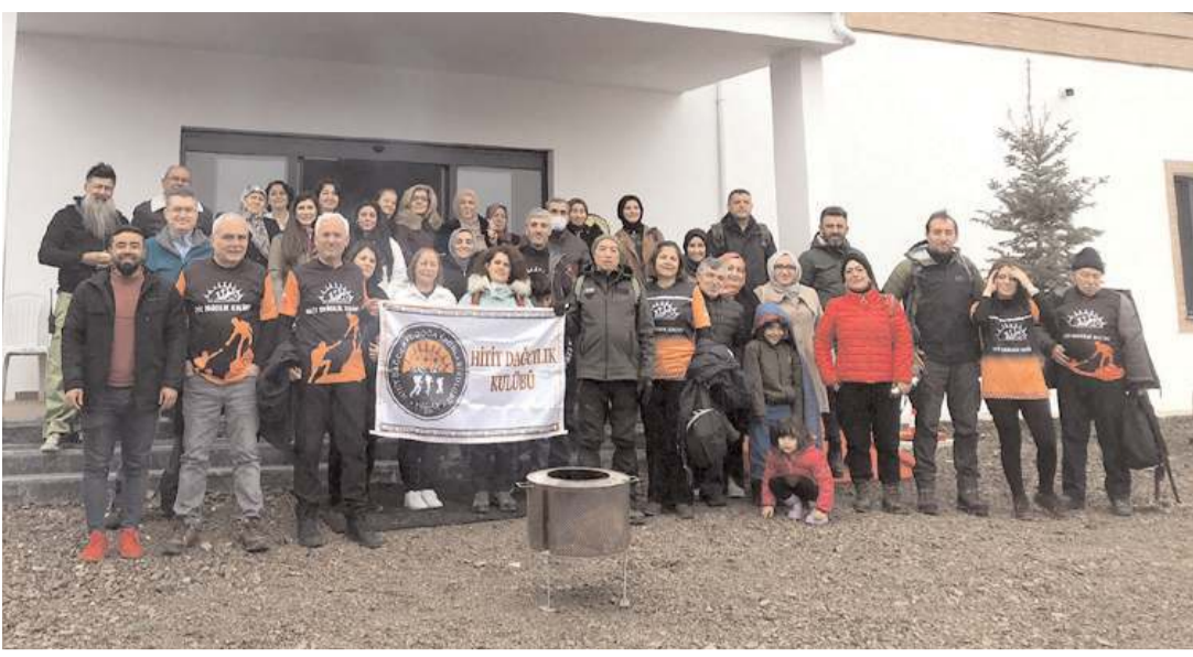
HİDAK üyeleri İklim Orman Otel de buluştu.