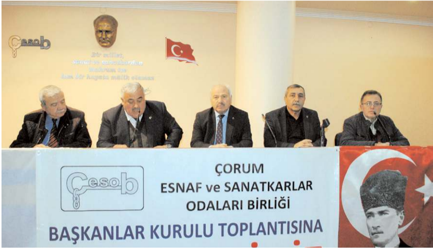
Toplantı ÇESOB'ta yapılmıştı.

"Ağustos ayında icra kararına imza atan yönetim kurulu üyesi olan oda başkanlarının da tamamının odalarının birliğe olan borçları var ne olacak şimdi" diye soran Çıtak açıklamasında şu ifadeler yer verdi: "Kendi kendinizin odalarına icra işlemi başlatacağınız. Bu ne yaman çelişkidir. Ben bunca yıl bu işin içindeyim böyle bir içi boş başkanlar kurulu toplantısına şahit olmadım. Odalarımızın ve esnafımızın bir çok sorunları var ama bu sorunları ileteceğimiz ne vekillerimiz ne belediye başkanımız ne defterdarımız ne İŞKUR müdürümüz ne Tarım İl Müdürümüz ne SSK Müdürümüz ne bir tane basınımız davet edilmemiş. Ha kenî basın danışmanı oradaydı. O da neyi yazar neyi yazmaz onu da bilemem. Tek gelen KOSGEB'ten bir görevli ve Ticaret İl Müdür Yardımcımız. Kendimiz yazdık kendimiz oynadık tiyatromuzu."