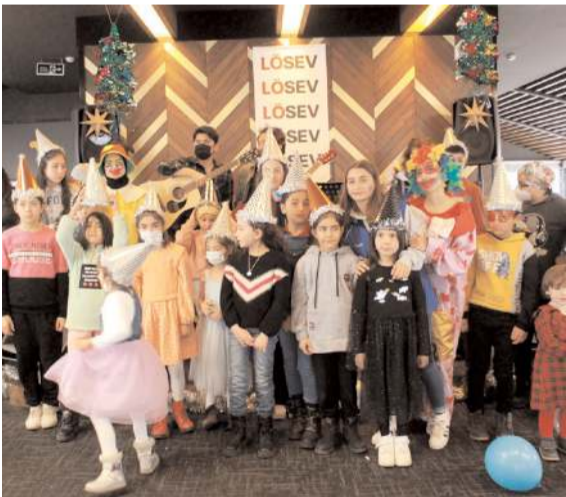
LÖSEV, çocuklar için kutlama programı düzenlendi.