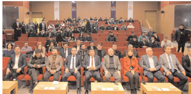
Çalıştay Meslek Yüksekokulları Kampüsü Ethem Erkoç Konferans Salonu'nda yapıldı.