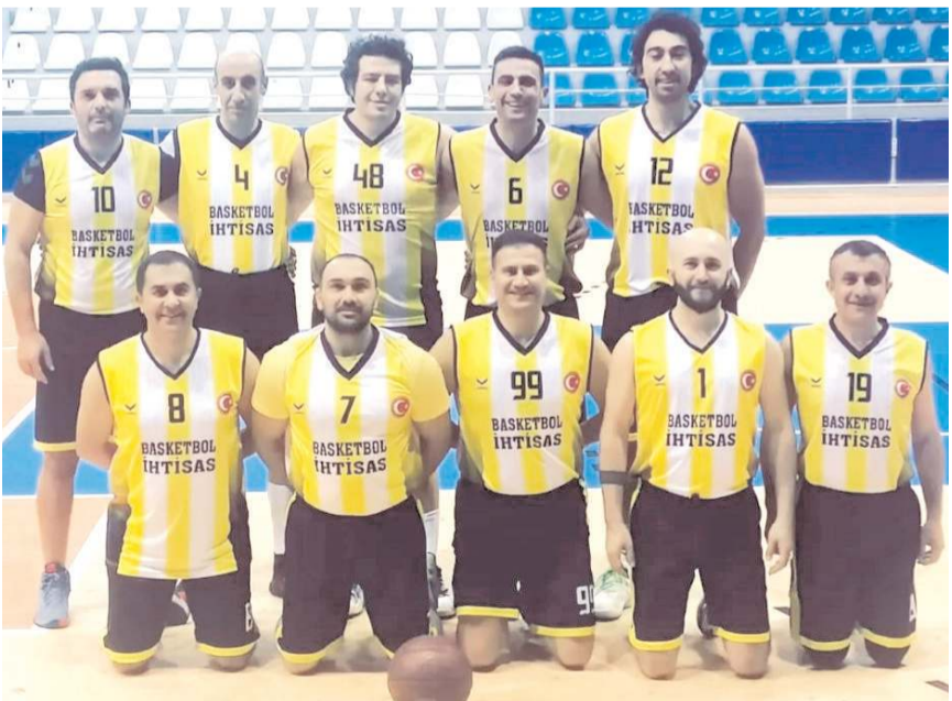
Çorum Basketbol İhtisas Tokat grubunda üç maçta iki galibiyet ile tamamladı

Grup birinciliği yarın akşam saat 18.30'da Karşıyaka ile Tokat Akademi takımları arasında oynanacak maçla sona erecek. Bu maçın sonucuna göre Çorum Basketbol İhtisas takımının grup birinciliği şansı bulunuyor.