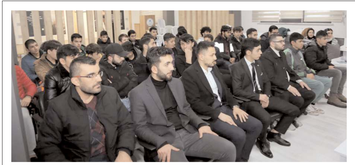
Ziyarette çok sayıda TÜGVA üyesi gençte hazır bulundu.