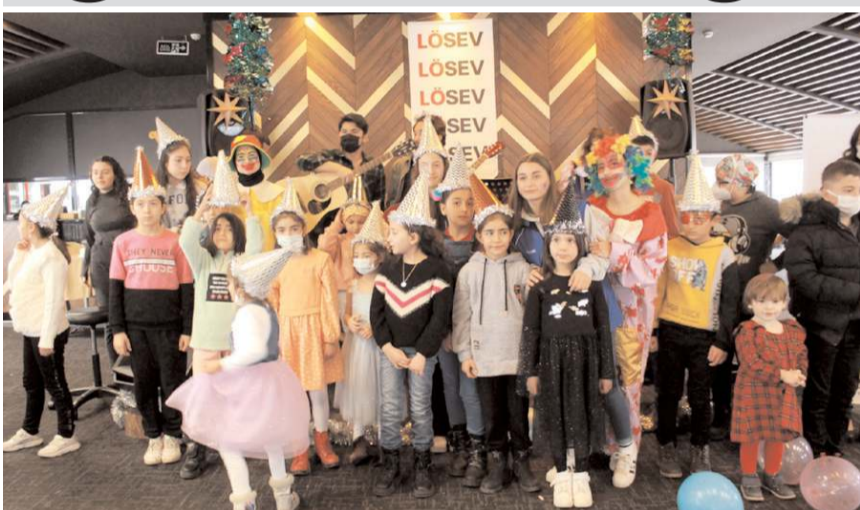
LÖSEV, çocuklar için kutlama programı düzenlendi.