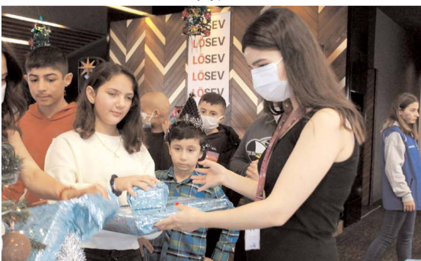
Programda çocuklara çeşitli hediyeler verildi.