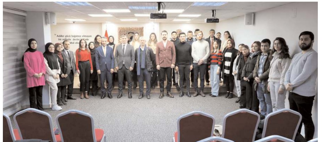
Eğitimin sonunda toplu hatıra fotoğrafı çekinildi.