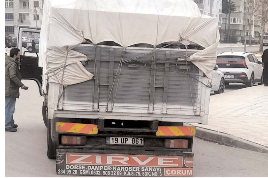
Kaza, Çevreyolu İlim Yayma Kavşağı'nda meydana geldi.

Kaza ile ilgili olarak başlatılan soruşturmanın devam ettiği öğrenildi. (İHA)