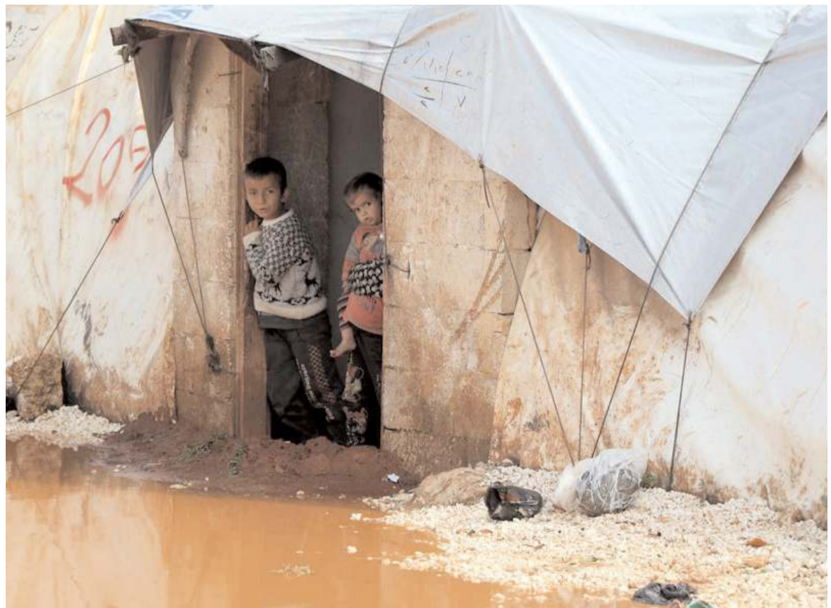
Suriyeliler kamplarda zor şartlarda yaşam mücadelesi veriyor.