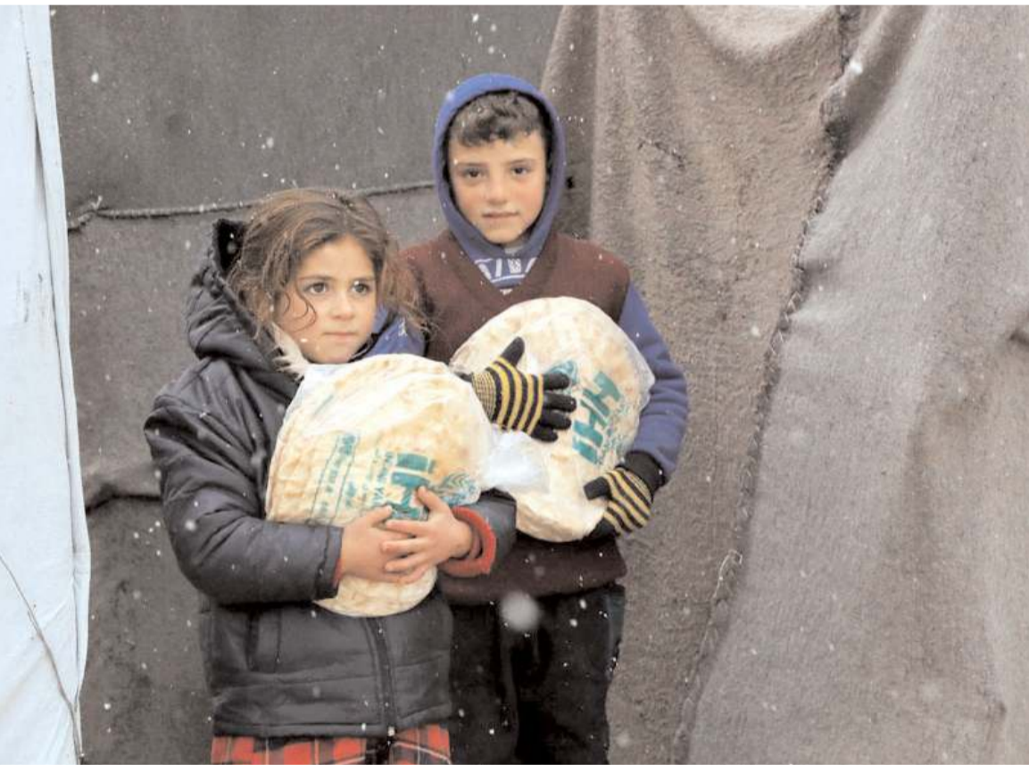
Uluslararası raporlara göre Suriye'de 7 milyon kişi evsiz kaldı.

İlimizde, makine imalat sektöründe un ve yem makineleri ihracatında dünyada ikinci sırada yer almaktadır. İlimiz ise bu ihracatta ilk sırada bulunmaktadır. Sektörde yer alan firmalarımız dört kıtaya ihracat yapıyor. Sektörde önemli firmalarımız dünyada marka olmuş ve tercih edilen firmalar haline gelmişlerdir. Un ve yem makineleri sektöründe gelinen bu noktayı daha ileri götürmek ve ilimizin bu sektörde marka kent olarak anılması için 2013 yılından beri Ur-Ge projeleri yürütmekteyiz. Sektör temsilcilerinin Hindistan, Arjantin, Brezilya, Amerika, Kanada, Hollanda, İtalya gibi ülkelerde fuarlara tek bir stant ve tek bir isim altında katılmalarını sağlayarak ilimiz ihracatına, üretimine, istihdamına değer katmaktayız."