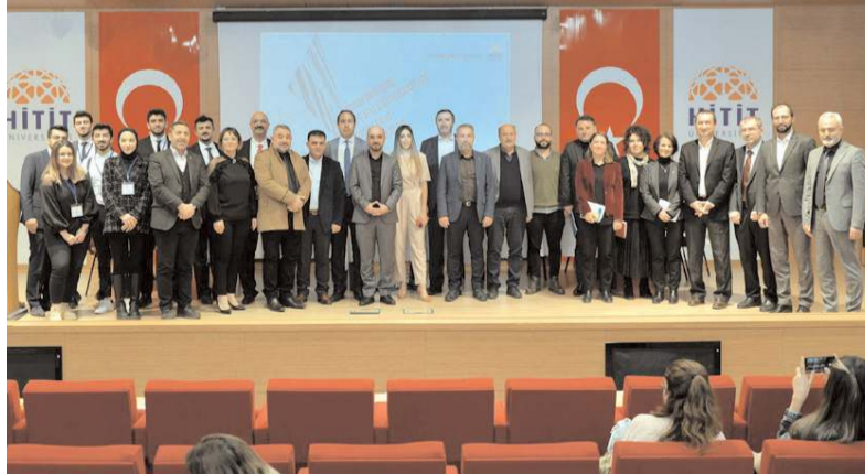
Programın sonunda toplu hatıra fotoğrafı çekildi.