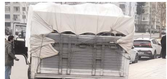
Kaza, Çevreyolu İlim Yayma Kavşağı'nda meydana geldi.