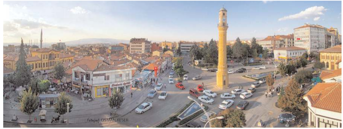
Çorum'un ihracatı her geçen yıl artıyor.

başta yük taşımacılığı olmak üzere, bu yatırımlardan ve hizmetlerden sürekli uzak kalmış, hatta mahrum bırakılmıştır. Ulaşımı olmadığı özellikle entegre ulaşım sağlanamadığı iller ve bölgeler maalesef gelişim ve kalkınma gösterememiştir. Çorum'un belki de en eski ve en elzem talebi olan demiryolu, odamızın bir numaralı gündem maddesi olmuştur ve olmaya da devam etmektedir. Yatırımcılarımızın: demiryolu ulaşımı olmaksızın kara taşımacılığı ile dünyanın farklı bir bölgesine ürün satması ya da fabrika kurması gerektiğinde navlun anlamında ne kadar dezavantajlı olduğu görülmektedir. Demiryolu Çorum'un sanayi altyapısının güçlenmesinde, yeni yatırım fırsatlarının oluşmasında buna bağlı olarak ihracatın artmasında önemli bir katkı sağlayacaktır.