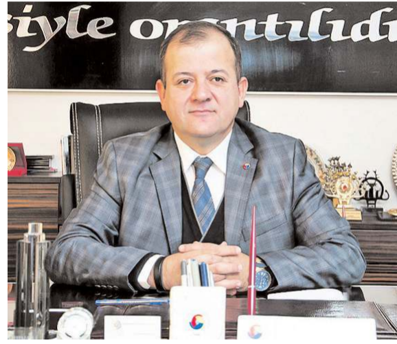
TSO Başkanı Çetin Başaranhıncal

Çorum'un Anadolu'nun önemli üretim merkezlerinden biri haline geldiğini anlatan Başaranhıncal, Çorum ekonomisi ile ilgili şu bilgileri aktardı: