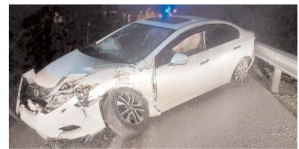
Kaza Çorum-Yozgat kara yolu Sincan köyü yakınlarında meydana geldi.