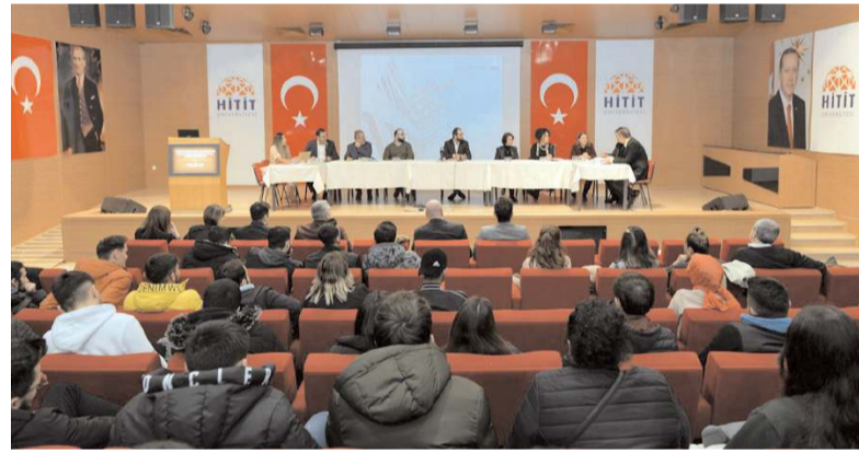
Çalıştayda sektör temsilcileri sorunlarını ve çözüm yollarını konuştu.