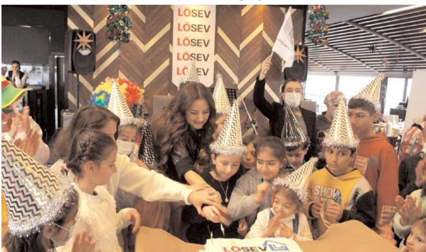
Kutlamada yaş pasta kesildi.