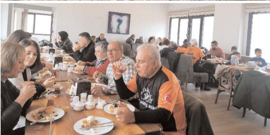
HİDAK üyeleri yürüyüş öncesinde kahvaltıda buluştular.