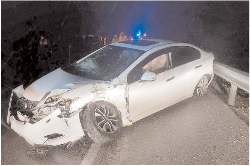
Kaza Çorum-Yozgat kara yolu Sincan köyü yakınlarında meydana geldi.