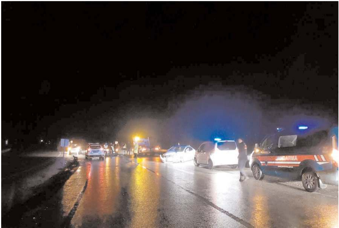
Kaza nedeniyle trafik bir süre durdu.