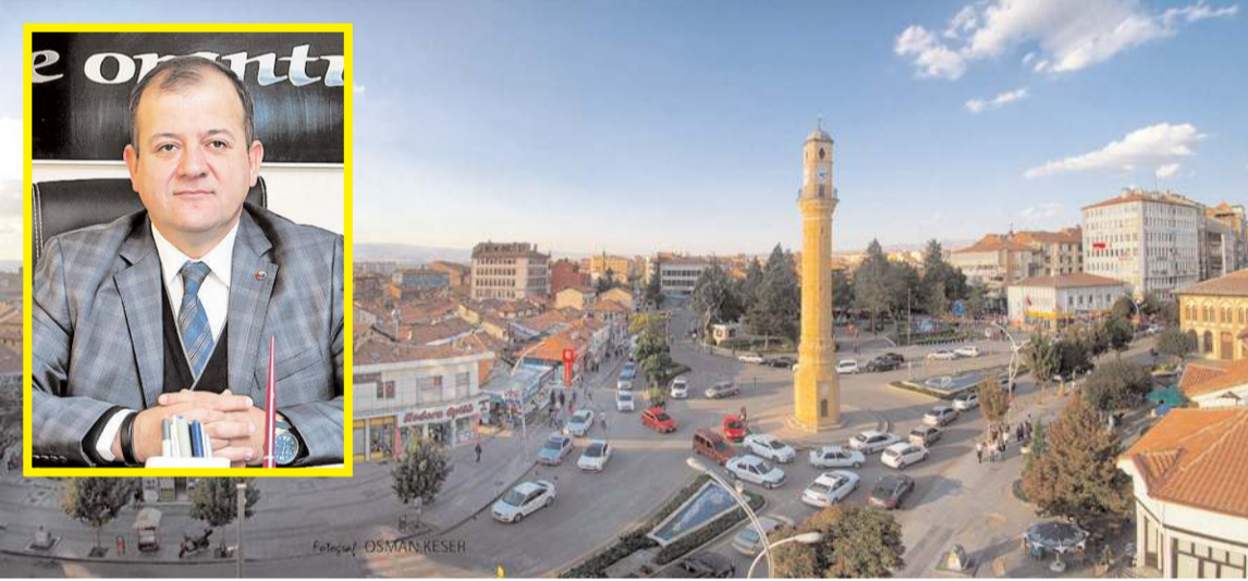
Çorum'un ihracatı her geçen yıl artıyor.