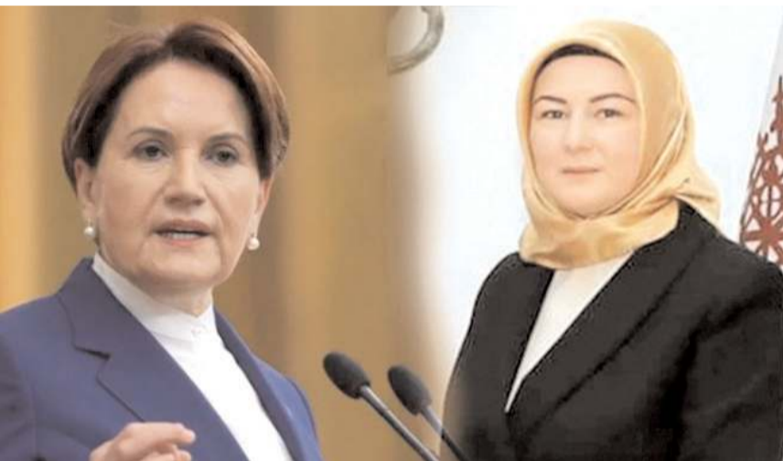
İYİ Parti Genel Başkanı Meral Akşener'e, 28 Şubat Öğrenci Derneği Çorum Temsilcisi Gülhan Cevher'den cevap geldi.

28 Şubat Öğrenci Derneği Genel Başkanı Emine İlyas ise, şunları dile getirdi:"28 Şubat Post Modern Darbesinde alınan kararlar hayata geçiren ilk bakanlardan birisi o dönemde İçişleri Bakanı olan Meral Akşener'dir. Bugün her ne kadar 28 Şubat Dönemi'nde mağdurların yanındaydım dese de, hem yaşadıklarımız hem de dö-