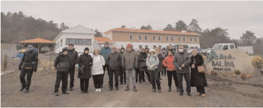
Yürüyüşün ardından toplu hatıra fotoğrafı çekildi.