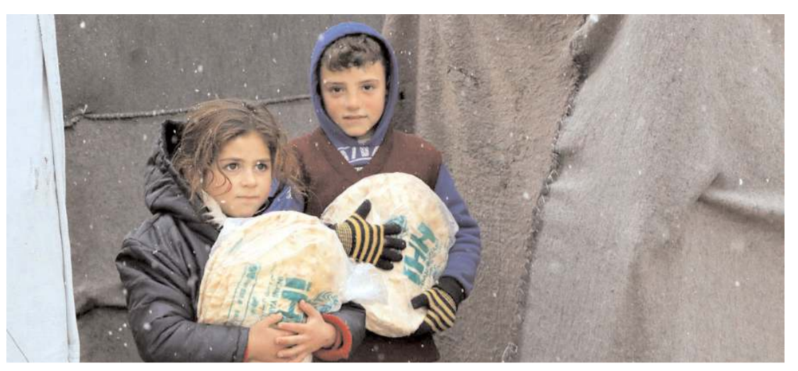
Uluslararası raporlara göre Suriye'de 7 milyon kişi evsiz kaldı.