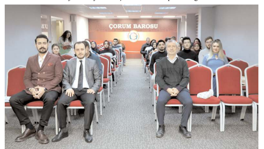
Eğitim Baro konferans salonunda yapıyor.