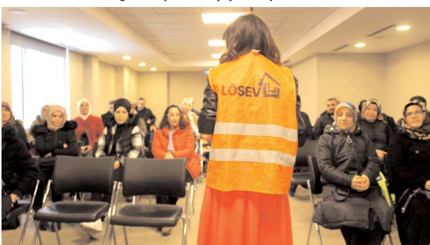
LÖSEV proje eğitimleri gerçekleştirildi.

Lösemili çocukların 24 yıldır yanında olan LÖSEV 13 yıldır çocukluk çağı kanseri mücadelelerine ve 11 yıldır da ihtiyaç sahibi yetişkin kanser hastalarına maddi ve manevi yardımlarıyla beraber sosyal destekler de ulaştırıyor.