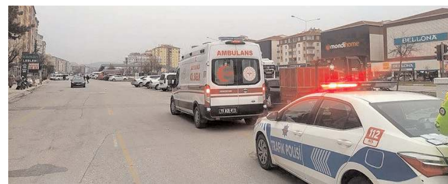
Yaralıları ilk müdahaleyi olay yerinde 112 ekipleri yaptı.