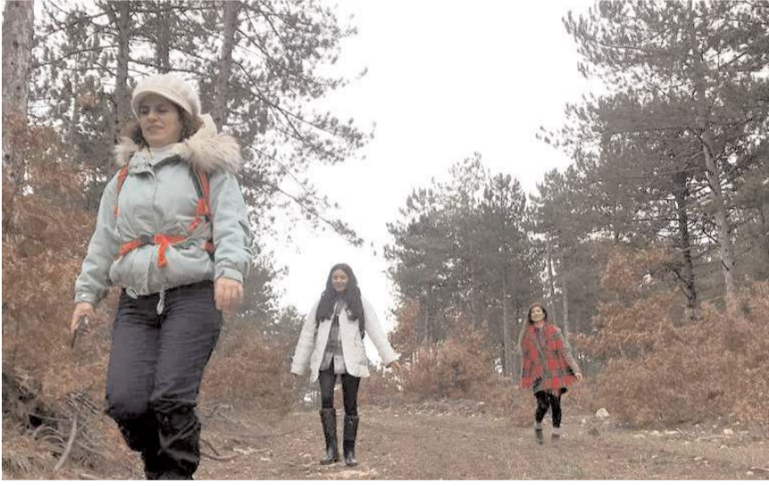
HİDAK üyeleri geleneksel doğa yürüyüşlerini yaptılar.