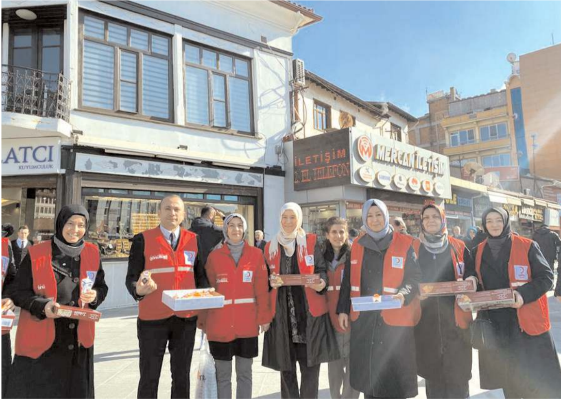
Etkinliği Türk Kızılayı Çorum Şubesi Kadın Kolları düzenledi.