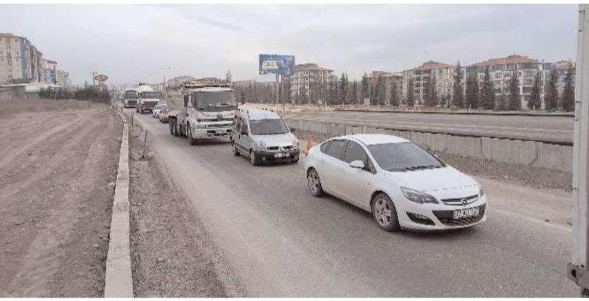
Çalışma nedeniyle trafik kontrollü olarak verildi.