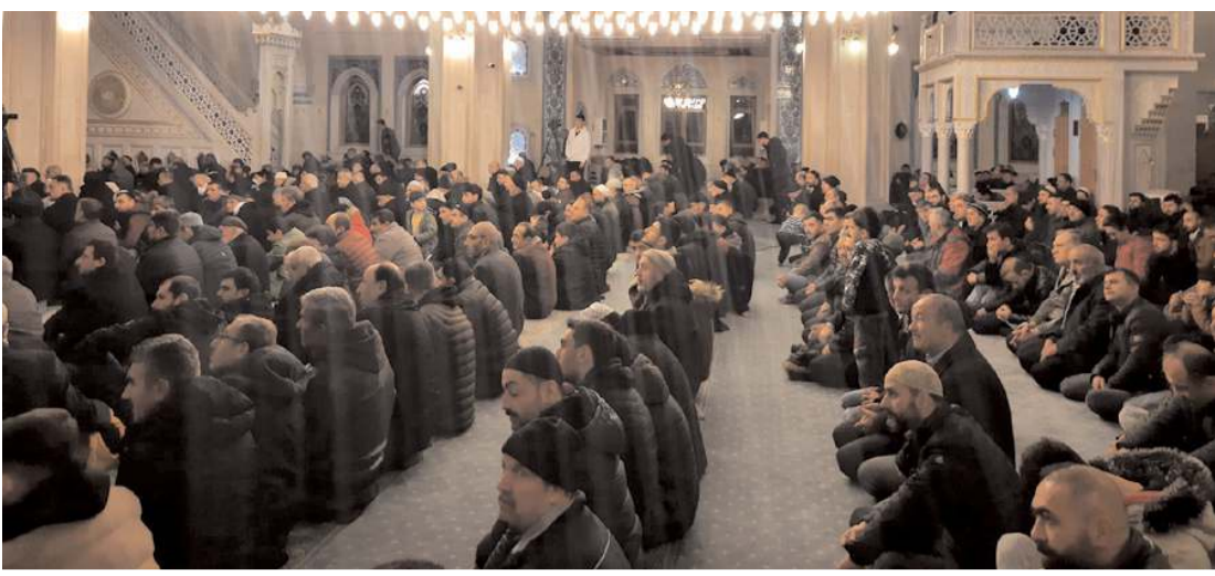
Regaip Kandili'nde vatandaşlar camilere akın etti.