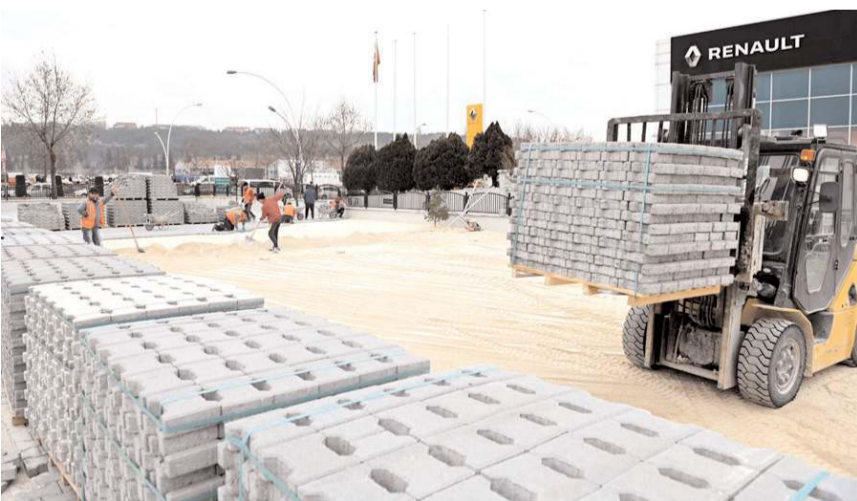
Otoparkta çalışmalar devam ediyor.