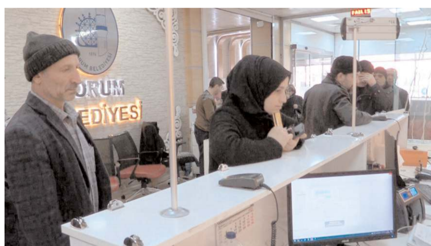
Vatandaşlar eski belediye binasında bulunan vezneleri kullanmaya devam edecek.

2023 yılı itibarıyla Farabi Caddesi'ndeki yeni binasına taşınan Çorum Belediyesi, yeni binaya ek olarak eski hizmet binası giriş katında bulunan