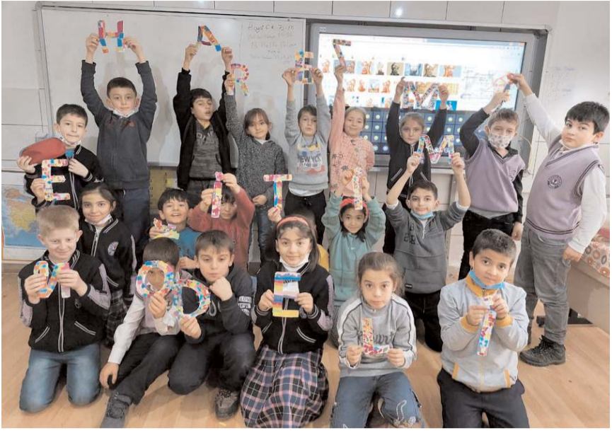
Harezmi Eğitim Modeli Uygulaması 20 hafta sürecek.

Sakarya İlkokulu'ndan yapılan açıklamada, "Harezmi Eğitim Modeli atölye çalışmalarında velilerimizden aldığımız olumlu dönüşler ve öğrencilerin heyecanlı çalışmalarını projenin etkinliğini bir kat daha artırmaktadır. Bu sayede okul, veli, öğrenci iş birliğinin en üst seviyede uygulanarak güçlü bağların oluşmasıyla öğrencinin başarılı bir geleceğe adım atmasını sağlamak en büyük hedeflerimizdendir. Her alanda çağdaş eğitim anlayışını benimseyen, geleceğimizin teminatı çocuklarımız için gece gündüz mesai harcayan İskilip Sakarya İlkokulu'nun yenilikleri artarak devam edecektir" ifadelerine yer verildi. (İHA)