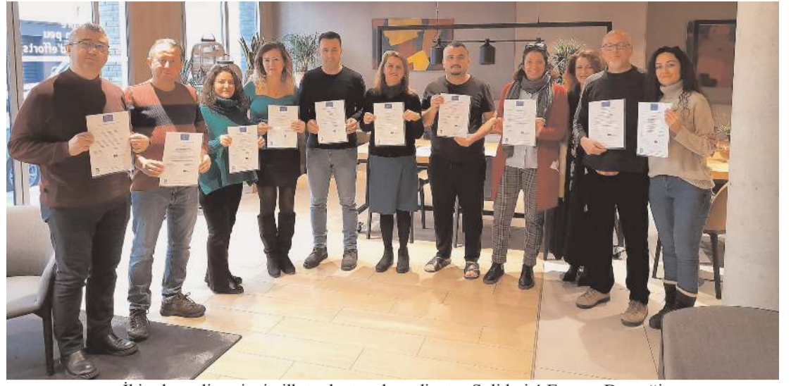
İki yıl süreli projenin ilk toplantısı, koordinatör Solidarité Europe Derneği başkanlığında 14-19 Ocak tarihlerinde Paris'te gerçekleştirildi.