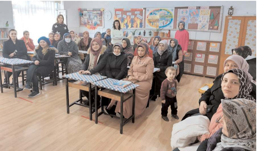
Proje ile ilgili velilerden de olumlu dönüşler alındı.