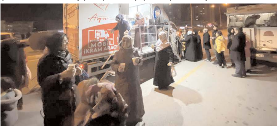
Çorum Belediyesi vatandaşlara çorba ikram etti.