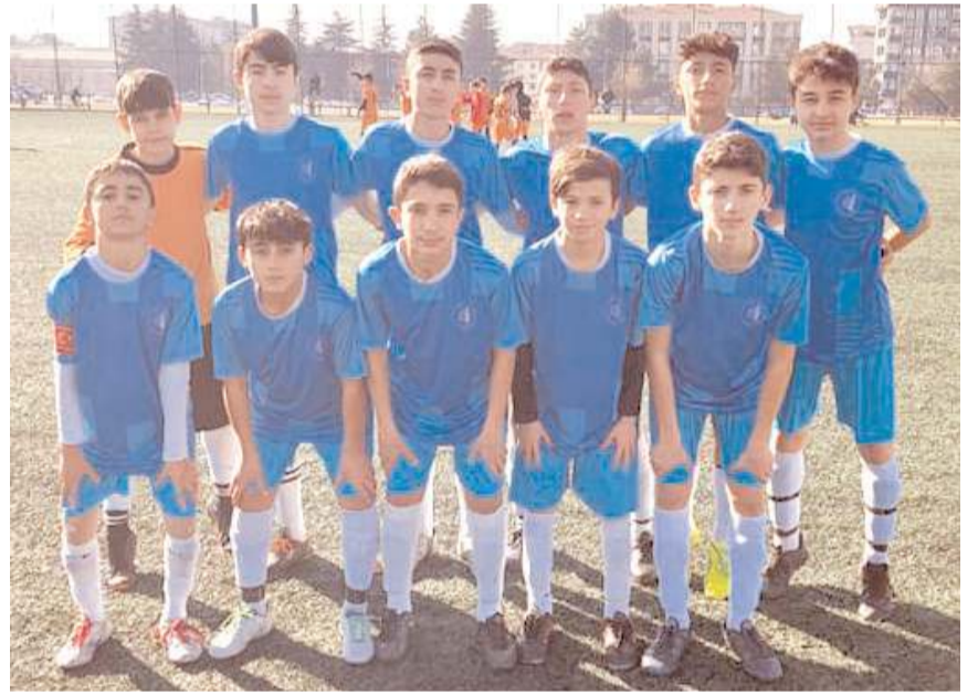
Mimar Sinan Gençlikspor final grubu ilk maçında Çimentospor ile karşılaşacak