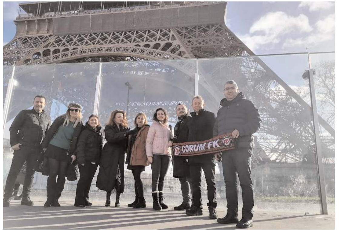
Çorum Yetişkinler Eğitimi ve Kültür Derneği üyeleri Paris'i gezdi.

Yüce, derneğin yürütmüş olduğu ve yeni hazırlanacak AB projelerinde görev almak ve bu alanda kendini geliştirmek isteyen İngilizce dil becerisi olan gençleri, yetiştirmek üzere derneğe davet etti. (Haber Merkezi)