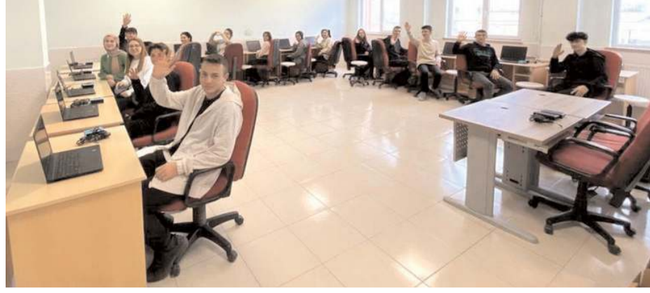
TÜPRAŞ tarafından Sungurlu Fen Lisesi'ne 15 adet dizüstü bilgisayar hibe edildi.