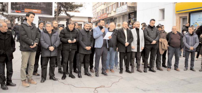
Basın açıklaması PTT önünde gerçekleştirildi.