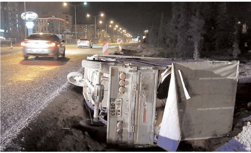
Kaza Çevre Yolu Bulvarı'nda inşaatı devam eden köprülülük kavşağının yakınında meydana geldi.

Yaralı çocuk, sağlık ekiplerince yapılan ilk müdahalenin ardından ambulansla Hitit Üniversitesi Erol Olçok Eğitim ve Araştırma Hastanesi'ne kaldırıldı.(AA)