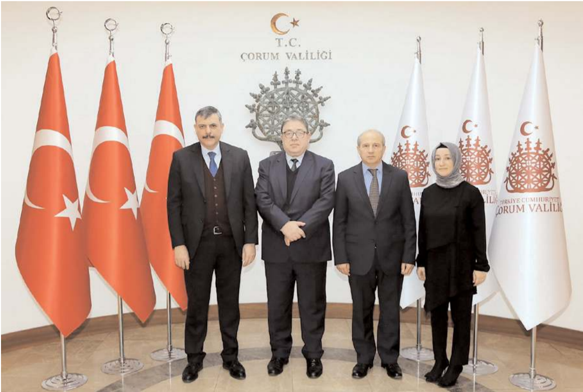
Ziyaretin anısına fotoğraf çekildi.

Vali Çiftçi ise tüm Gümrük çalışanlarının gününü tebrik etti. (Haber Merkezi)