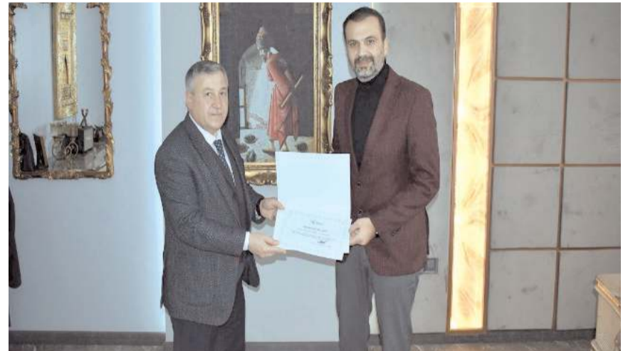
İŞKUR Şube Müdürleri ve İl Müdürü tarafından özel sektör işyeri ziyaretleri yapıldı.