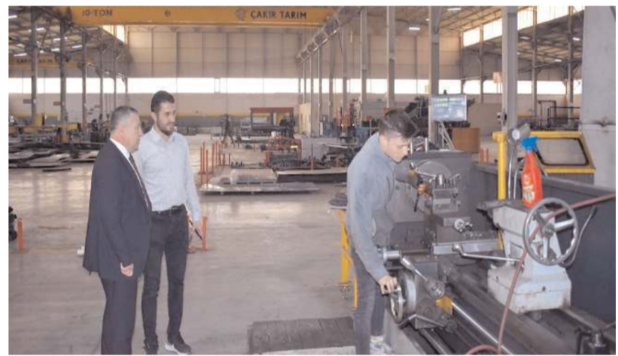
İŞKUR İl Müdürlüğü, 2022 yılı içerisinde 14 toplum yararına programı için toplamda 16.361.651,63 TL ödeme yaptı.

2022 yılında 2 bin 713 katılımcı İşbaşı Eğitim Programından faydalandırılmış olup toplamda 40.000.000 TL ödeme yapıldı. Ayrıca 29 kursiyer Meslek Edindirme Kurslarından faydalanırken, 509 kişi de Toplum Yararına Çalışma Programlarından faydalandı. Bu kapsamda 2022 yılı içerisinde 14 programa toplamda 16.361.651,63 TL ödeme yapıldı.