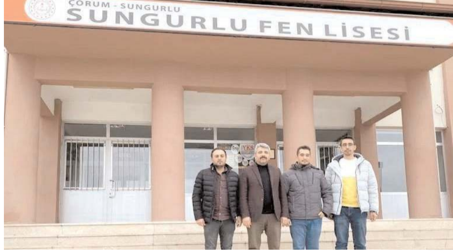
Okul idarecileri TÜPRAŞ yöneticilerine teşekkür etti.