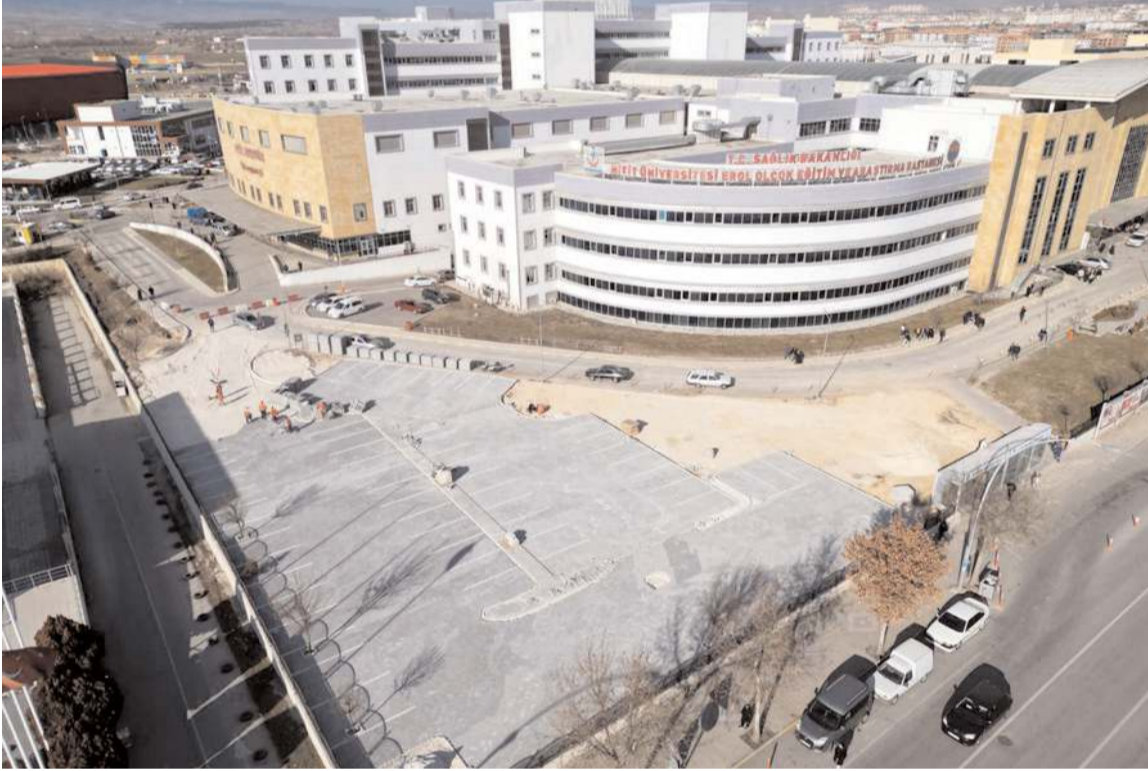
Hastane bahçesinde 2 bin metrekareselik otopark alanı oluşturuluyor.