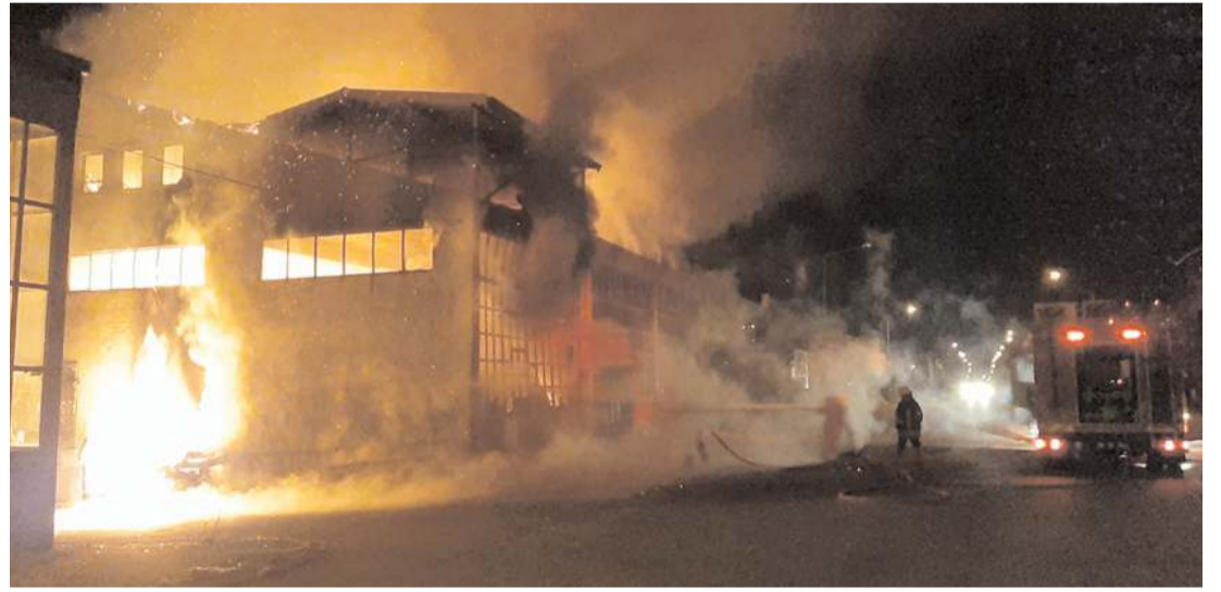
Yangın yan tarafta ki dükkana da sıçradı.

Çorum Sanayi Sitesi'ndeki mobilya imalathanesinde çıkan ve bitişindeki dükkana sıçrayan yangın, yaklaşık 4 saat süren müdahaleyle söndürüldü.