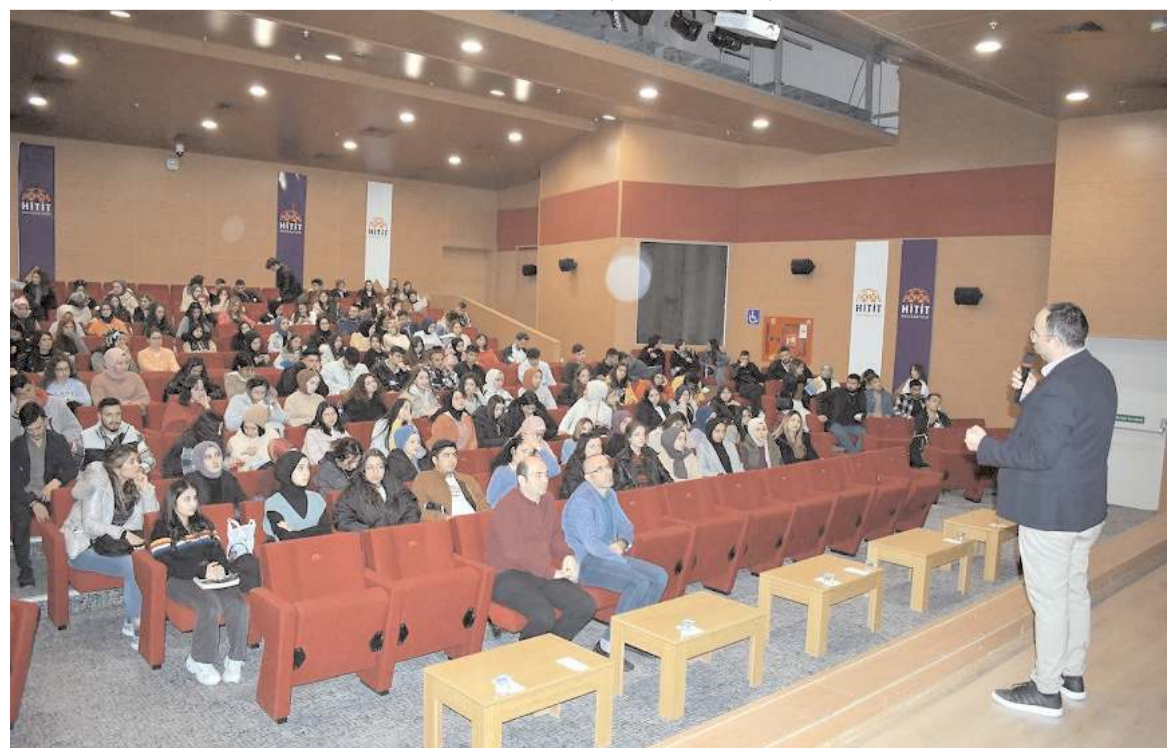
436'sı Hitit Üniversitesi öğrencisine İş ve Meslek Danışmanları tarafından seminerler verildi.

İşgücü piyasası ihtiyaçlarını, işverenlerin sorunlarını yakından görüp izlemek amacıyla, İŞKUR iş ve işlemleri hakkında bilgi paylaşımında bulunmak için İl Müdürlüğü İMD işveren danışmanları, Şube Müdürleri ve İl Müdürü tarafından işverenlerle doğrudan temas sağlanarak özel sektör işyeri ziyaretleri yapıldı. (Haber Merkezi)