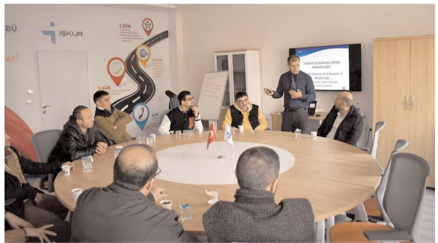
İş ve Meslek Danışmanları tarafından toplamda 11 bin 921 kişiye danışmanlık hizmeti verildi.

2022 yılında bin 85 engelli vatandaşla bireysel görüşme sağlanarak, engelli statüsünde 164 kişi özel sektörde istihdam edildi.