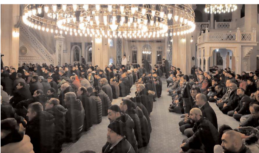
Regaip Kandili'nde vatandaşlar camilere akın etti.

■ Ramazan ayının habercisi ve üç ayların müjdecisi olarak kabul edilen Regaip Kandili, Çorum'daki camilerde manevi coşku içinde eda edildi.