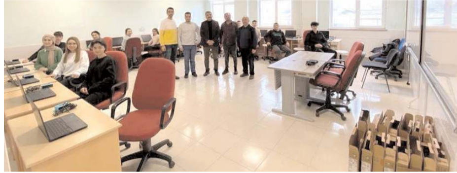
Bilgisayarlar, TÜPRAŞ Kırıkkale Bilgi Teknolojileri Müdürlüğünde görevli Bilgisayar Teknikerleri tarafından okulda TÜPRAŞ bilişim sınıfına kuruldu.

Sungurlu Fen Lisesi öğrencileri tarafından bilgisayar başına talebi için atılan e-postaya Türkiye Petrol Rafinerileri A.Ş. (TÜPRAŞ) kayıtsız kalmadı.