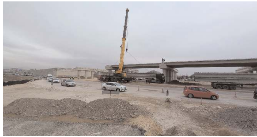
Kavşağın Nisan ayında bitirilmesi hedefleniyor.

Proje kapsamında farklı seviyeli kavşak ile birlikte 4,2 km uzunluğunda bağlantı yolları da yapılacak.