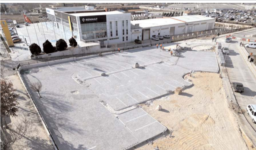
Hastane bahçesinde 2 bin metrekairelik otopark alanı oluşturuluyor.