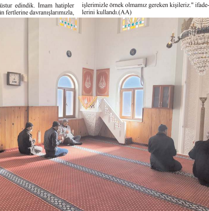
Vatandaşlar caminin bakımlı olmasından duydukları memnuniyeti dile getirdiler.