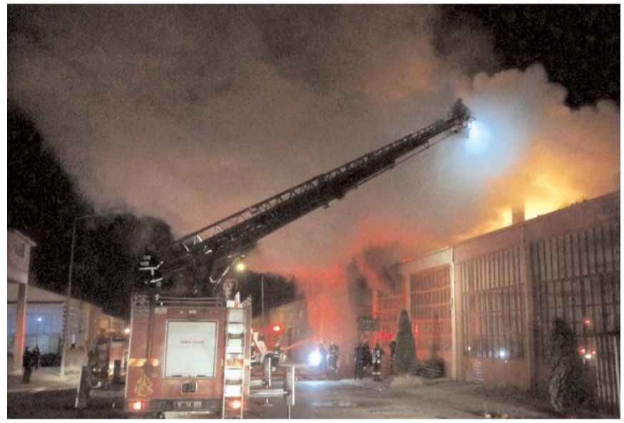
İtfaiye ekipleri yaklaşık 4 saat süren müdahalenin ardından yangını söndürdü.