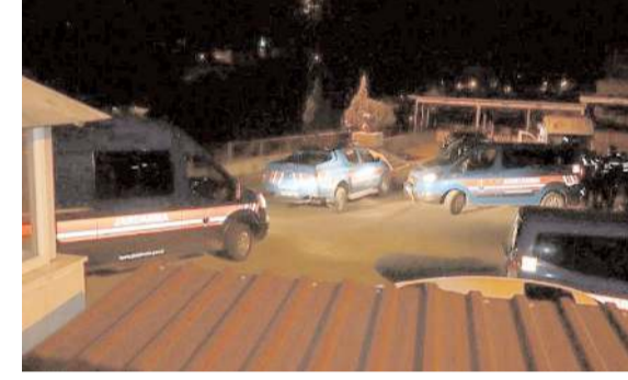
Olay Bekişler Köyü'nde meydana geldi.