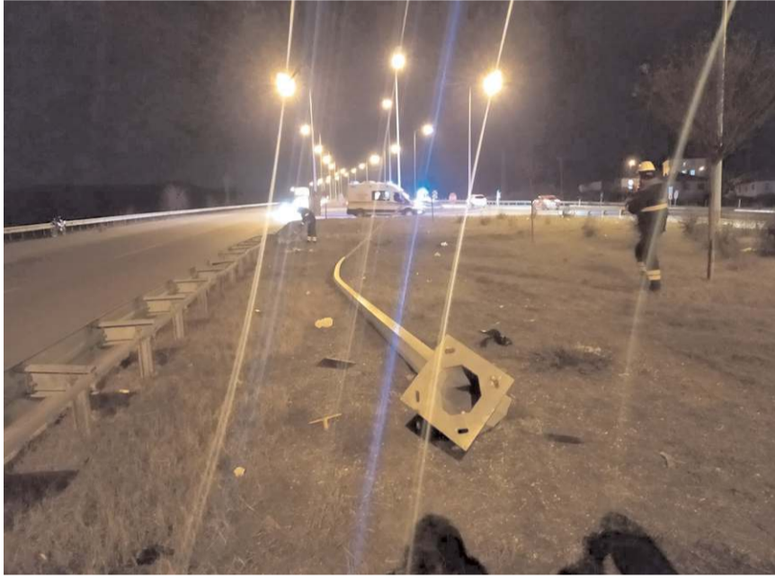
Otomobil yol kenarında bulunan aydınlatma direğini devirerek takla attı.