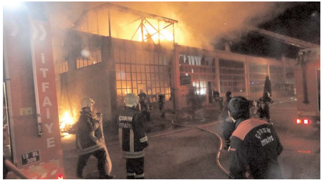
Olay Çorum Sanayi Sitesi'nde meydana geldi.