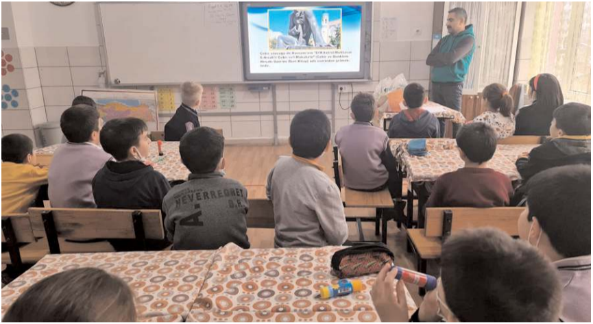
Harezmi Eğitim Modeli Çorum'da ilk kez İskilip Sakarya İlkokulu'nda uygulanacak.