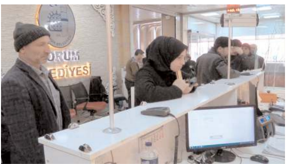
Vatandaşlar eski belediye binasında bulunan vezneleri kullanmaya devam edecek.