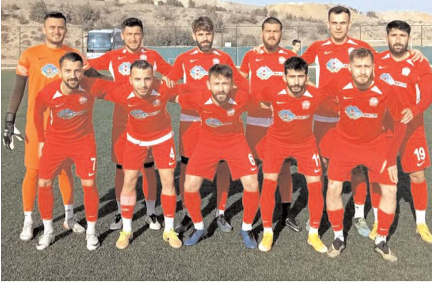
Osmancık Belediyespor ikinci yarının ilk maçında evinde kazanarak başlamak istiyor

Ligin ilk yarısını 18 puanla yedinci sırada tamamlayan Osmancık Belediyespor puan sıralamasında kendisine üst sıralardan en yakın rakibi konumunda 23puanlı Hacılar Erciyesspor ile karşılaşacak. Ligin ilk maçında rakibi önünde ilk yarıyı 2-0 geride tamamlayan ikinci yarıda ise rakip kalede bulunduğu sayısız pozisyonları değerlendiremeyen ve 2-1 mağlup ayrılan Osmancık Belediyespor