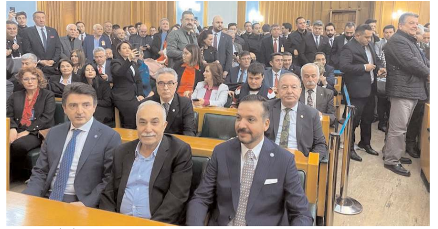
İYİ Parti Çorum Teşkilatı, TBMM'de grup toplantısına katıldı.

Grup toplantısına katılarak Meral Akşener'in konuşmasını dinleyen Çorum heyeti, salonda çok sa-