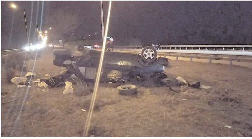
Kaza, Çorum - Samsun Kara Yolu'nda meydana geldi