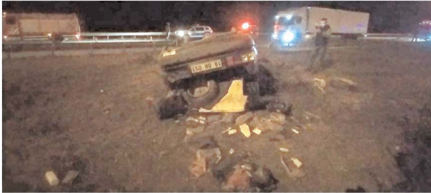
Kazada otomobil hurdaya döndü.