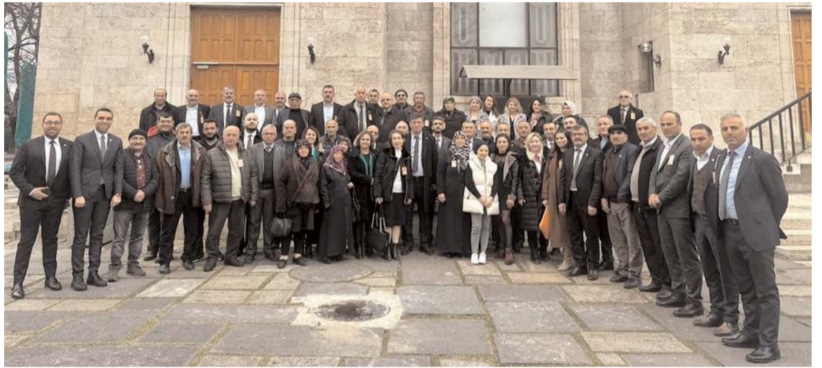
İYİ Parti Çorum Teşkilatı, ziyaretin anısına hatıra fotoğrafı çekindi.

Partililer genel başkan yardımcılarını da tek tek ziyaret ederek hem Çorum'daki parti çalışmalarını ve seçim hazırlıklarını değerlendirdi, hem de temel sorun ve talepler hakkında bilgilendirmede bulundu. (Haber Merkezi)