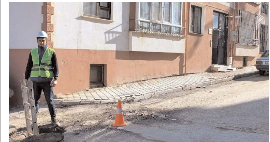
İskilip Fiber Dönüşüm Projesi'nde pilot bölge seçildi.