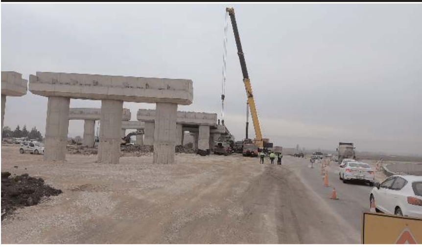
Beton kirişler dev vinç tarafından köprüye yerleştiriliyor.

■ Çevre Yolu Bulvarı'nda yapımına başlanan farklı seviyeli kavşak projesinde çalışmalar hızla devam ediyor. Üst geçidin ayaklarının tamamlanmasının ardından köprü kirişlerinin yerleştirilmesine başlandı.