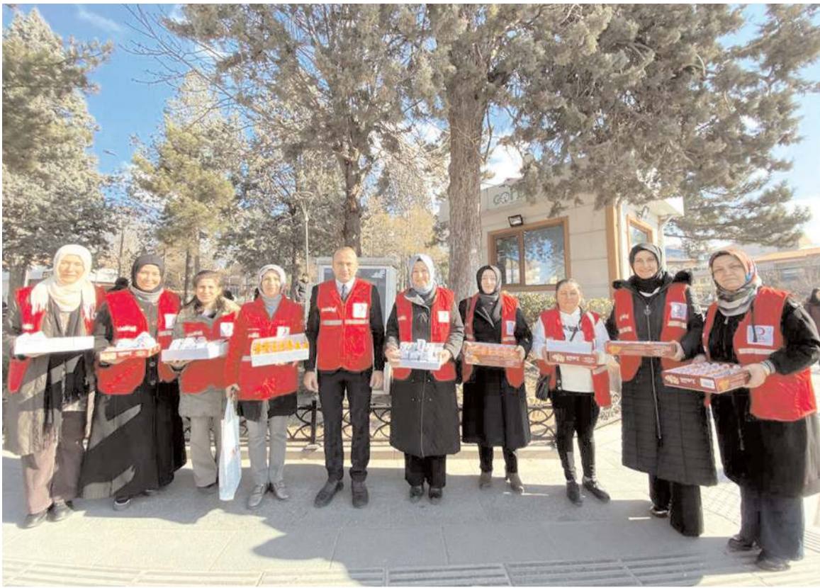
Türk Kızılayı Çorum Şubesi, Regaip Kandili dolayısıyla Çorum esnafına ve vatandaşlara ikramda bulundu.