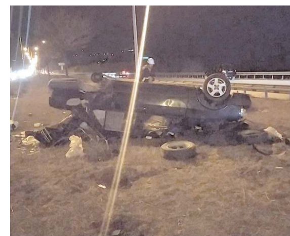
Kaza, Çorum - Samsun Kara Yolu'nda meydana geldi