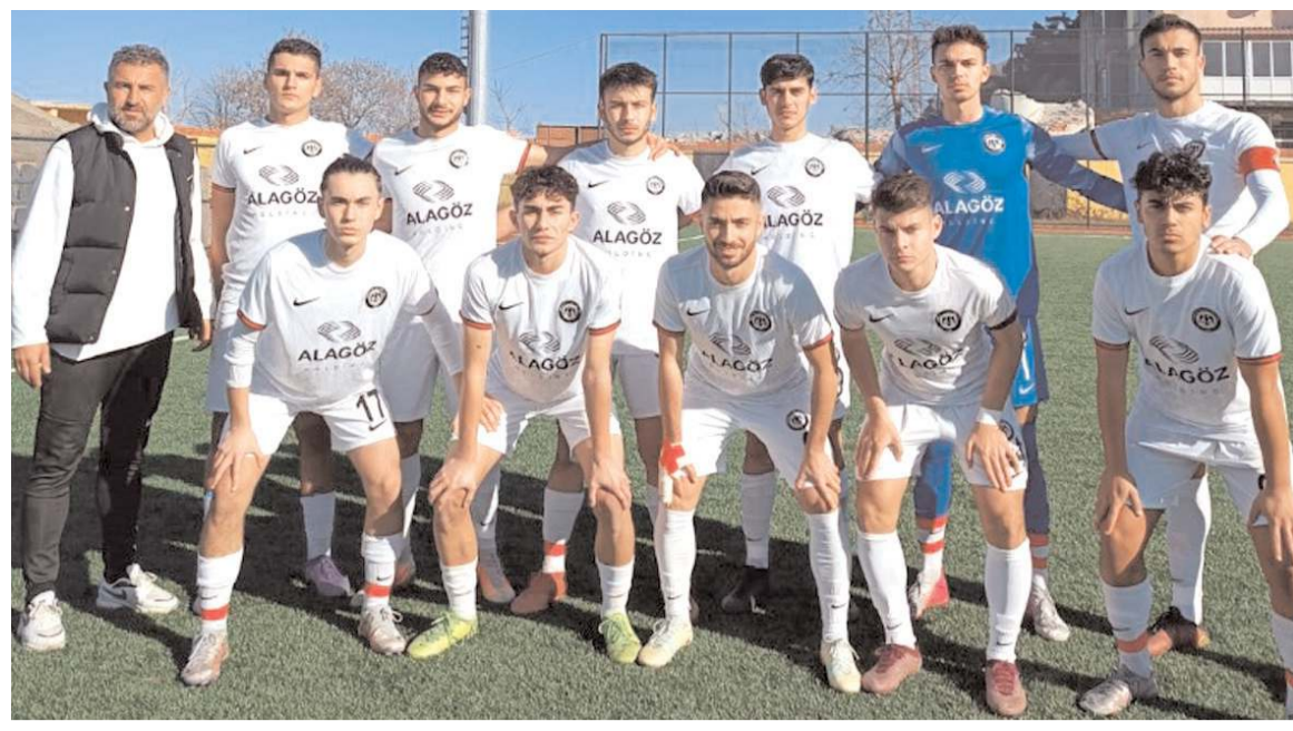
Çorum FK U 19 takımı bugün Kırşehirspor önünde liderliğini devam ettirmek için kazanmak istiyor