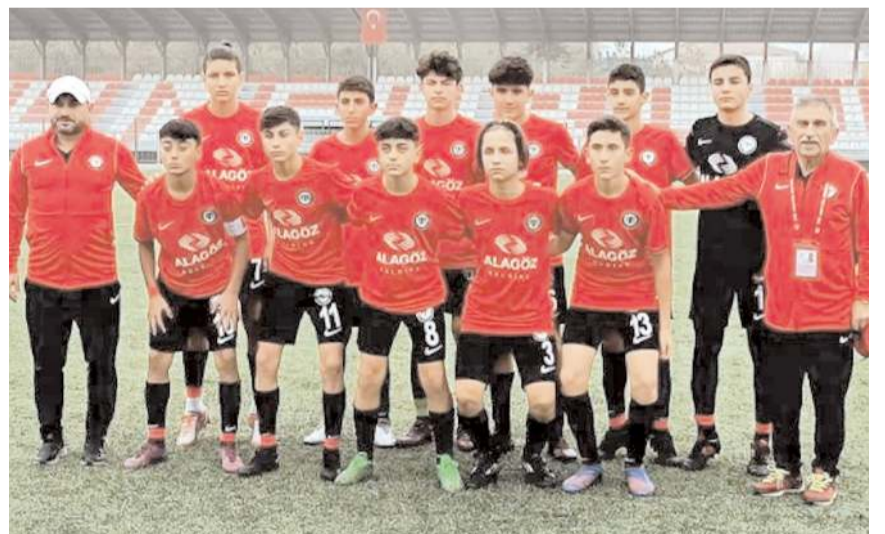
Çorum FK U 14 takımı final grubu ilk maçında Hattuşa Gençlikspor ile karşılaşacak