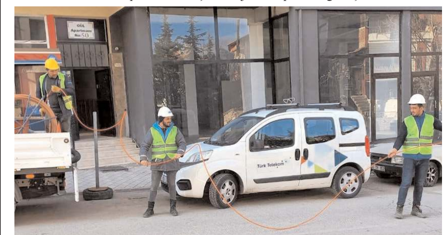
İlçede 100 binada fiber dönüşüm yapılacak.

İskilip'te 100 binada fiber dönüşüm uygulaması başlatıldığı bildirildi.