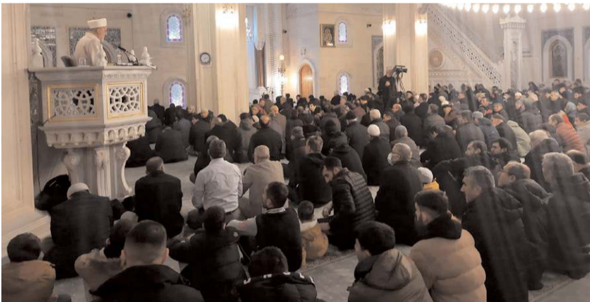
Akşemseddin Camii'nde kandil programı düzenlendi.