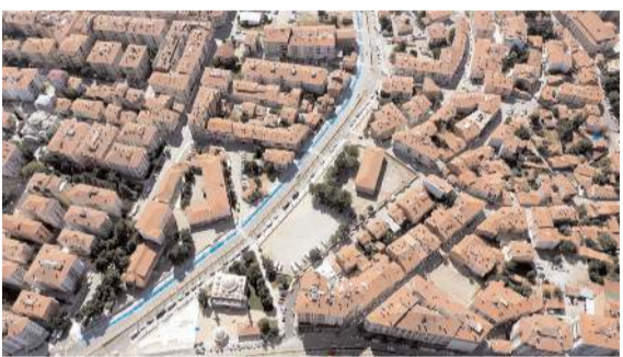
Recep Tayyip Erdoğan Caddesi 27 Ocak - 4 Şubat tarihlerinde belirli saatler arasında trafiğe kapatılacak.