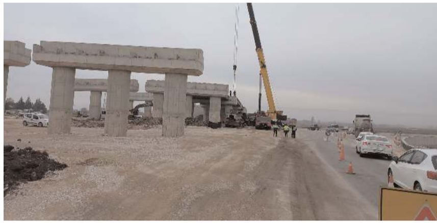
Beton kirişler dev vinç tarafından köprüye yerleştiriliyor.