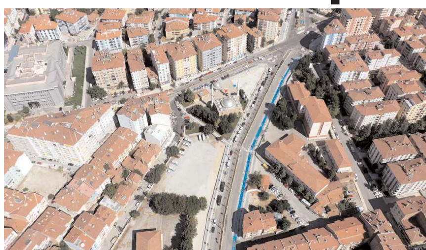
Recep Tayyip Erdoğan Caddesi 27 Ocak - 4 Şubat tarihlerinde belirli saatler arasında trafiğe kapatılacak.

Recep Tayyip Erdoğan Caddesine komşu Gazi Caddesi'nden Fatih Caddesi'ne geçiş yolu hafriyat çalışmaları kullanılmak üzere 27 Ocak - 4 Şubat tarihlerinde öğleden önce 9.00-10.30, öğleden sonra 15.00-16.30 saatleri arasında araç ve yaya trafiğine kapatılacak.