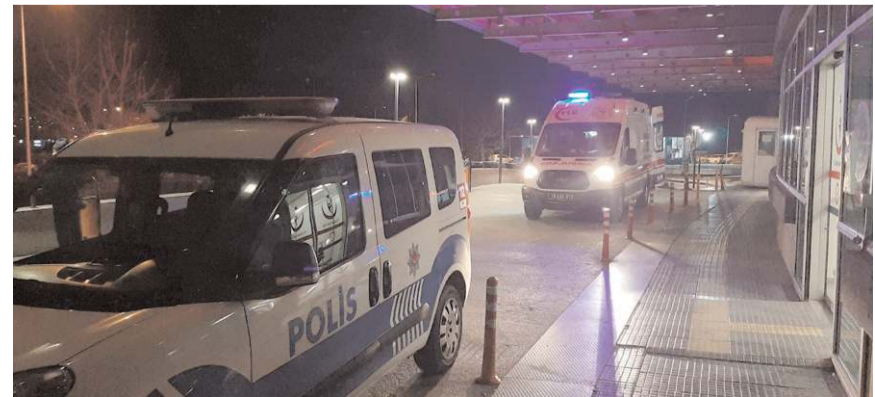
Bıçakla yaralanan çocuk hastanede tedavi altına alındı.

Kavgada darp nedeniyle yaralanan B.G. ise kentteki bir özel hastaneye kaldırıldı.(AA)