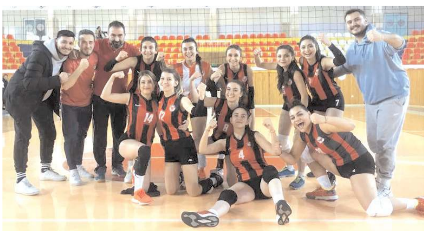
Çorum Voleybol ligde kalma umutlarını sürdürmek için Osmancık'ta kazanmak istiyor