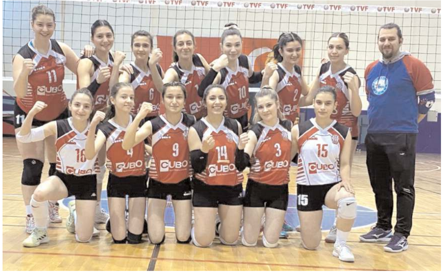
Osmancık Belediyespor Çorum derbisini kazanarak moralenmeyi hedefliyor

Kadınlar 2. Voleybol liginde iki temsilcimiz Osmancık Belediyespor ve Çorum Voleybol takımları yarın saat 12'de Osmancık'da karşılaşacak. Maç Çorum Voleybol'un ligde kalması için mutlak galibiyet gerekiyor.