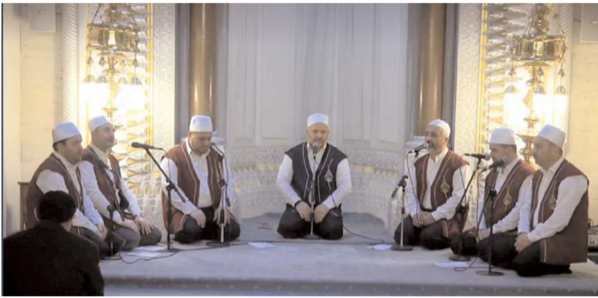
İl Müftülüğü ilahi korusu ilahiler seslendirdi.