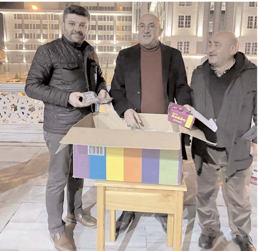
Şehit Aileleri ve Gaziler Derneği Çorum Şubesi cami çıkışı vatandaşlara helva dağıttı.