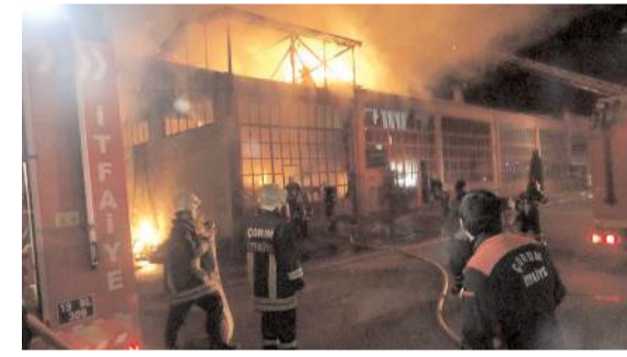
Olay Çorum Sanayi Sitesi'nde meydana geldi.