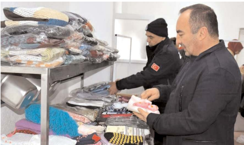
Depremzedeler için hayır çarşısı açıldı.