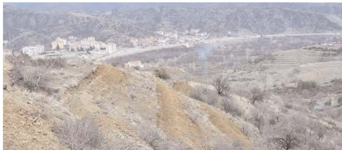
Ormana bin adet ceviz fidanı dikilecek.