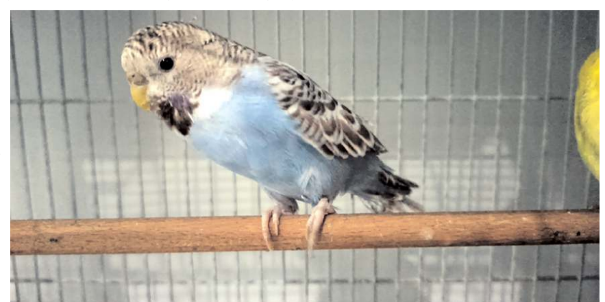
Depremlerin ardından muhabbet kuşu satışlarında ciddi oranda artış oldu.

Diğer hayvanlardan da kedilerin deprem öncesi aşırı tedirgin oldukları, miyavladıkları, kendilerini hırpaladıklarını bazı müşterilerin anlattıklarını kaydeden Üstündağ, "Hayvanların ne kadar kıymetli olduklarını anladık. İnsanlarla iç içe olduklarını, onları koruduklarını görüyoruz. Deprem bölgesinden de bu tür haberler alıyoruz. Deprem sonrası bazı hayvanların yerini gösterdiğine dair haberler geliyor" ifadelerini kullandı. (İHA)