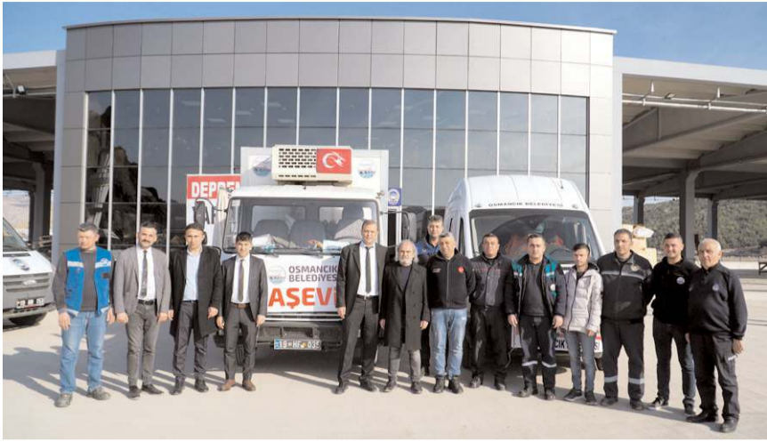
Seyyar aşevi ile birlikte 10 personel bölgeye gitti.