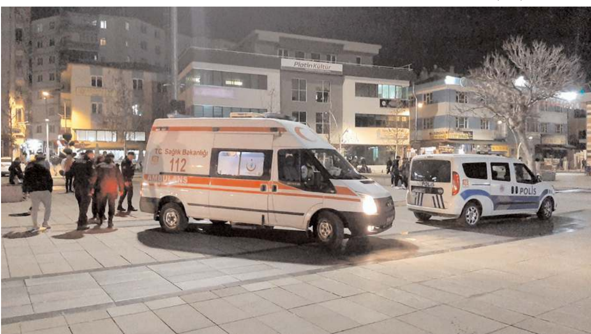
Yaralılara ilk müdahaleyi olay yerinde 112 acil sağlık ekipleri yaptı.