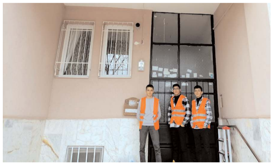
Proje uygulama aşamasında öğrencilerin de içinde olduğu 25 gönüllü katıldı.