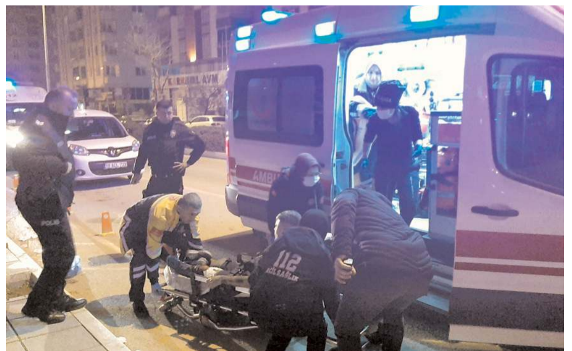
Olay Bahabey Caddesi'nde meydana geldi.