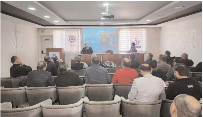
Ensar Vakfı'nda yapılan toplantıya çok sayıda STK temsilcisi katıldı.

Geçtiğimiz hafta açıklanan TCMB faiz kararının ardından bu hafta yurtiçinde geçtiğimiz yılın 4. çeyrek büyüme verisi ve Şubat ayı enflasyon verisi takip edilecek. Diğer taraftan, Perşembe günü öncesinde TCMB PPK özeti açıklanırken, Borsa İstanbul'da konsolide olmayan 4 çeyrek bilançoların son açıklanma tarihi 1 Mart. Yurt dışında ise geçtiğimiz haftanın son işlem gününde açıklanan ABD kişisel tüketim harcamalarının beklentilerin üzerinde gerçekleşmesi sonrası bozulan risk iştahının açıklanacak PMI verileri ile ne kadar değişebileceği takip edilecek.