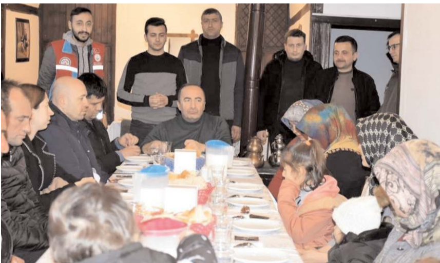
İlçe protokolü depremzedeler ile yakından ilgileniyor.