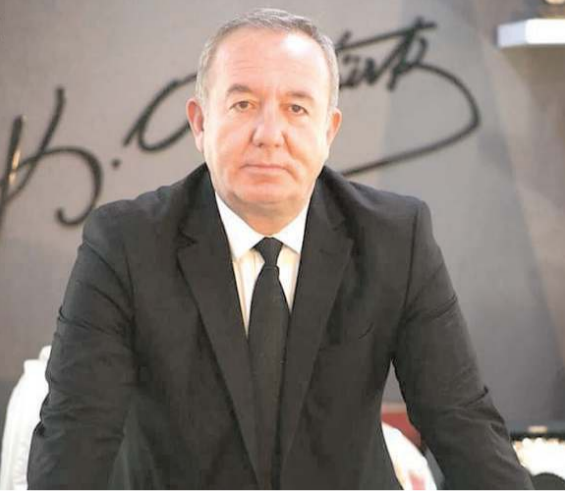
Sungurlu Belediye Başkanı Abdulkadir Şahiner

"Bu zor günleri tüm Türkiye, birlik içerisinde atlatacağız" diyen Başkan Şahiner, "Allah'tan bir da-