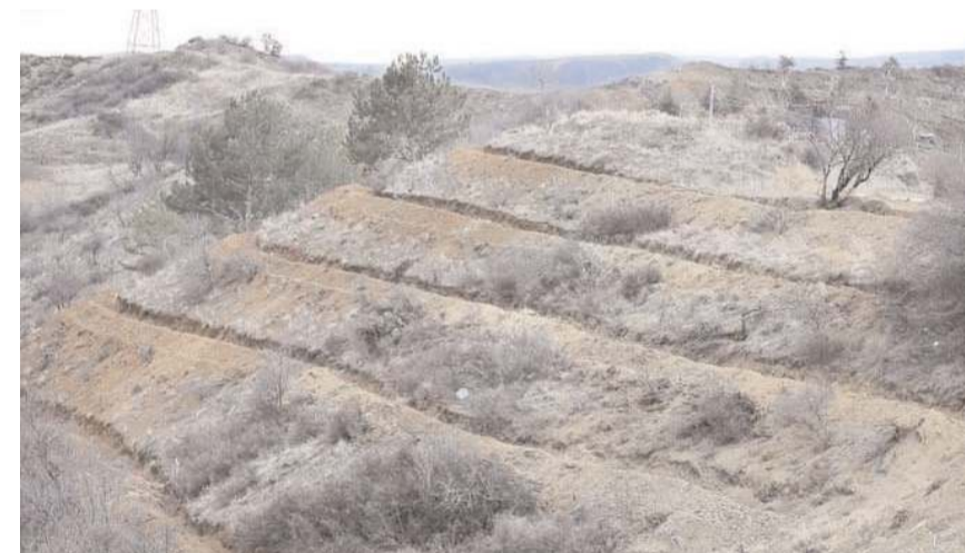
Ceviz ormanı Erenler Mahallesi'ndeki atıl araziye yapılacak.

Ceviz Ormanı Projesi ile ilçe ekonomisine katkı sağlamayı hedeflediklerinin altını çizen Sülük, "Cumhuriyetimizin kuruluşunun 100. yılına ithafen atıl durumdaki arazimize ilk etapta bin fidanlık Ceviz Ormanı Projesini hayata geçiriyoruz. İlçemizin hem bugününe hem geleceğine katkı olacağını düşündüğümüz projemiz hayırlı ve uğurlu olsun." ifadelerini kullandı. (AA)