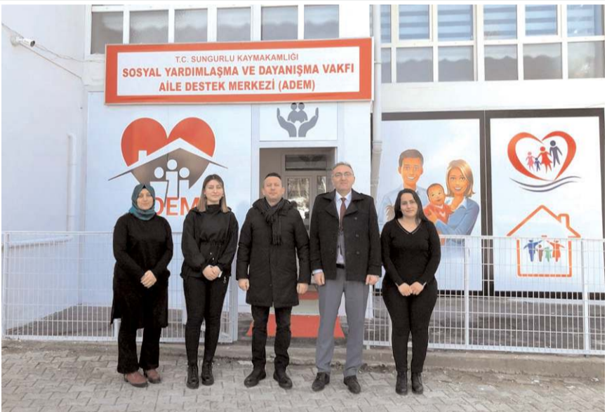
Aile Destek Merkezinde açılacak kurslarda haftada 5 gün eğitim verilecek.

Konuya ilişkin olarak yapılan açıklamada, "Bu eğitimler, mesleki ve beceri geliştirme eğitimleri ile vatandaşlarımızın toplumsal hayata entegrasyonu, devlet-millet kaynaşmasının sağlanması, ailenin korunması ve desteklenmesi amacıyla yapılacak eğitimlerdir. Ayrıca bu konularda seminer ve toplantılar düzenlenecektir. Açılan kursların sonunda kursiyerlere sertifika verilecek, sertifika hayır panayırı üç ayda bir düzenlenecek ve hayır panayırındaki ürünler kursiyerlere hibe edilecektir. Ayrıca kursiyerlere aylık 600 lira teşvik ödemesi yapılacaktır. Aile Destek Merkezinde kursiyerlerin çocuklarının (0-6 yaş