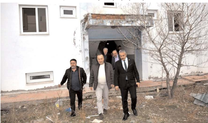
Afet konutları depremzedeler için kullanılacak.