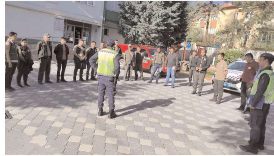
Eğitime 35 kamu personeli katıldı.