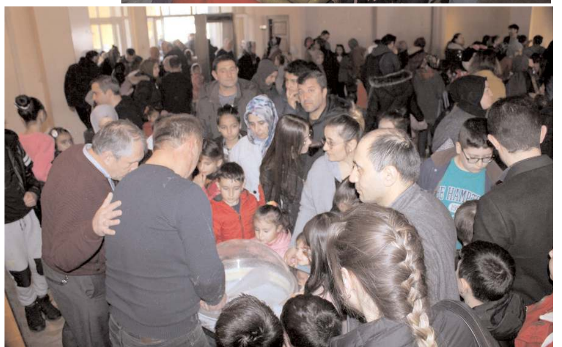
Program sonunda Çorum Belediyesi tarafından çocuklara pamuk şeker ve çikolata ikram edildi.