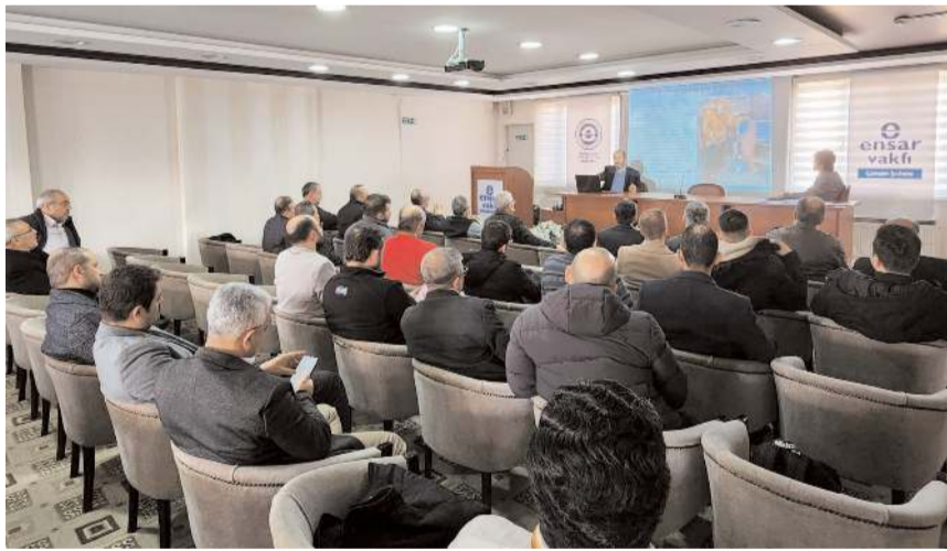
Ensar Vakfı'nda yapılan toplantıya çok sayıda STK temsilcisi katıldı.

AK Parti Çorum Milletvekili Erol Kavuncu, sivil toplum kuruluşu temsilcileri ile görüşerek afet bölgesinde yapılanları ve bundan sonra yapılacakları istişare etti.