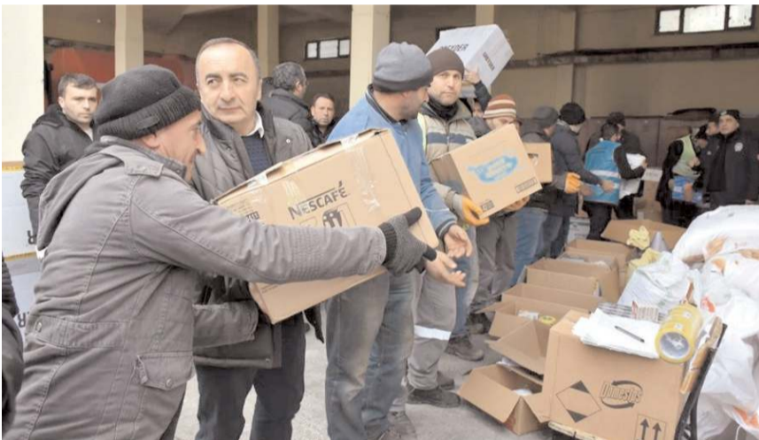
İskilip'ten çok sayıda yardım afet bölgesine gönderildi.

Eğitimde, ayrıca kazaların oluş şekli ve önlenmesi için alınması gereken tedbirler hakkında da katılımcılar bilgilendirildi. (AA)