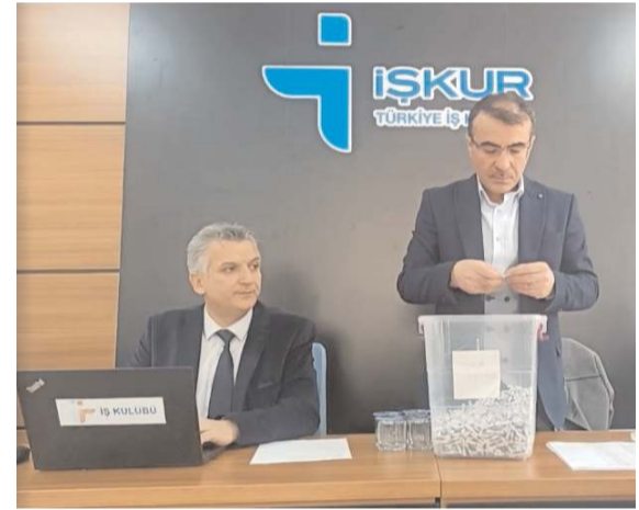
Kuralar noter huzurunda çekildi.