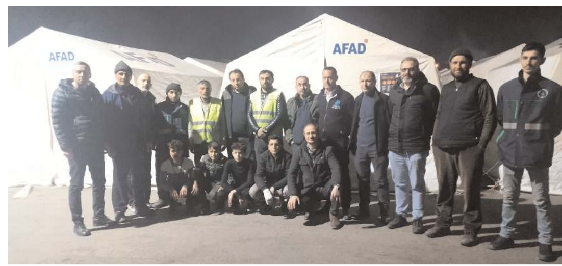
Akıncılar Derneği afet bölgesinde yardım faaliyetlerine katılıyor.

İthalatta Rusya Federasyonu ilk sırayı aldı. Ocak ayında Rusya Federasyonu'ndan yapılan ithalat 5 milyar 1 milyon dolar olurken, bu ülkeyi sırasıyla; 4 milyar 337 milyon dolar ile İsviçre, 3 milyar 557 milyon dolar ile Çin, 1 milyar 807 milyon dolar ile Almanya, 1 milyar 229 milyon dolar ile ABD izledi. İlk 5 ülkeden yapılan ithalat, toplam ithalatın %47,4'ünü oluşturdu.