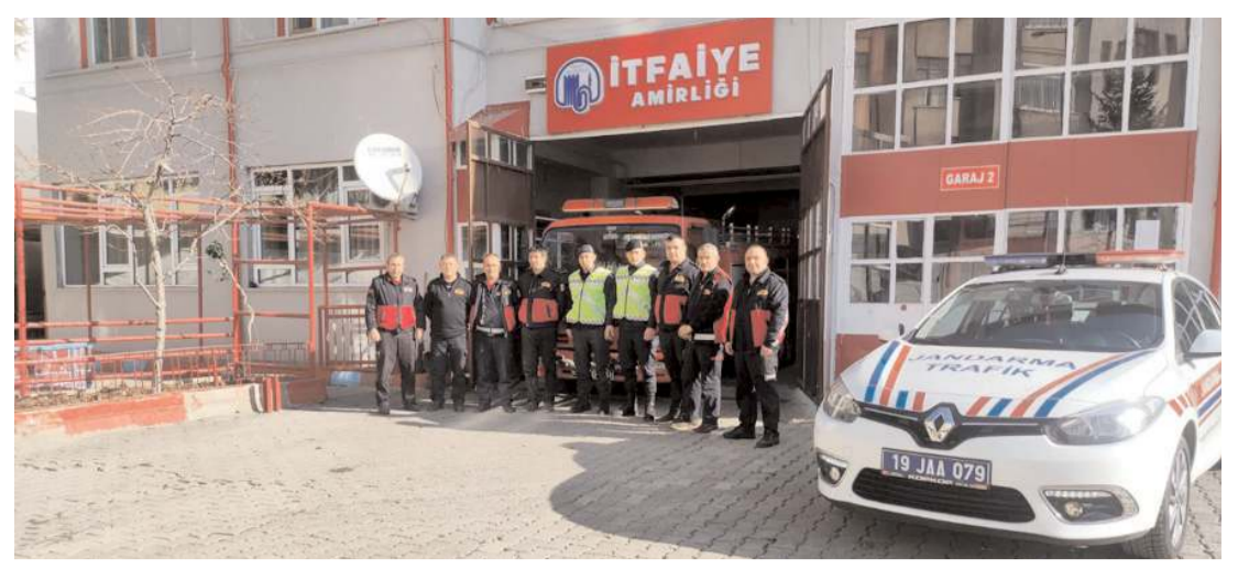
Eğitim İskilip Belediyesi İtfaiye Amirliğinde yapıldı.

"Depremzede misafirlerimiz ve bundan sonra gelecek misafirlerimiz için İskilip Belediyesine ait daha önce lojman olarak kullanılan sosyal konutlar var. Atıl vaziyette olan bu konutlar Fen İşleri Müdürlüğümüz tarafından hızlı bir şekilde boya ve tamiri yapıp, afetzede kardeşlerimize açılacak. 8 ailemiz burada barınabilecek. İlçemizde yıllardır atıl durumda olan afet konutları var. Buranın mülkiyeti AFAD'a ait. Buraların rantabl hale getirilmesi için belediye olarak üzerimize düşen her şeyi yapacağımızı belirttik. Ufak tefek tamirat işleri var. 48 dairemiz de orada var. Toplamda 56 dairemizi misafirlerimize hazırlayabilecek durumdayız. Yaşadığımız bu felaketin yaralarını hep birlikte saracağız." (İHA)