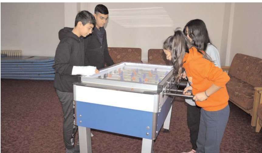
Çocuklar gönüllüleriyle vakit geçiriyorlar.