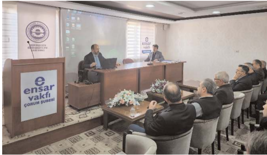
Toplantıda depremzedeler için bundan sonra neler yapılabileceği istişare edildi.