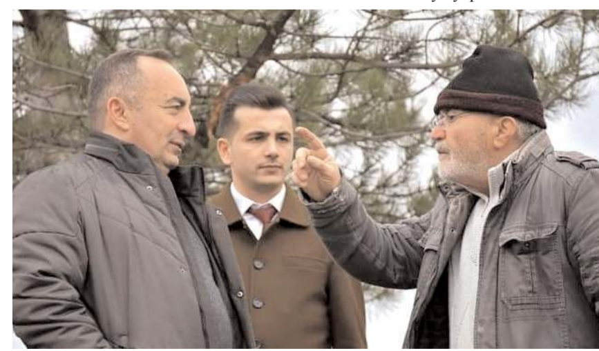
Belediye Başkanı Ali Sülük, bölgede incelemede bulundu.