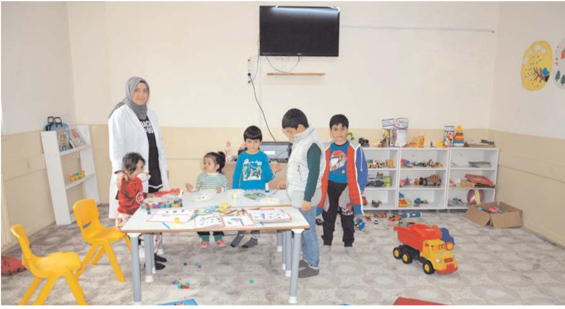
Pansiyonda kalan çocukların yaşadıkları felaketin izlerini silmek için etkinlikler düzenleniyor.

Deprem sürecinde giden yardım araçlarının hemşerilerin gönülünden geçtiği gibi hakkıyla yerine ulaştırıldığına da dikkat çeken Başkan Şahiner, "Gönlünün zenginliğini depremzedeler için paylaşanlara, emektar kadınlarımıza, kocaman yürekli çocuklara, tırlarıyla sevkiyat için bedelsiz çeken, hiç bir maddiyat gözetmeden, hatta mazot parasını bile istemeyen hemşerilerime, 'az çok demeden bu da benden olsun' deyip seferber olan herkese maddi ve manevi desteklerinden dolayı teşekkür ediyorum. El ele bu süreci birlikte atlatacağız, yaraları birlikte saracağız" diye konuştu. (Haber Merkezi)