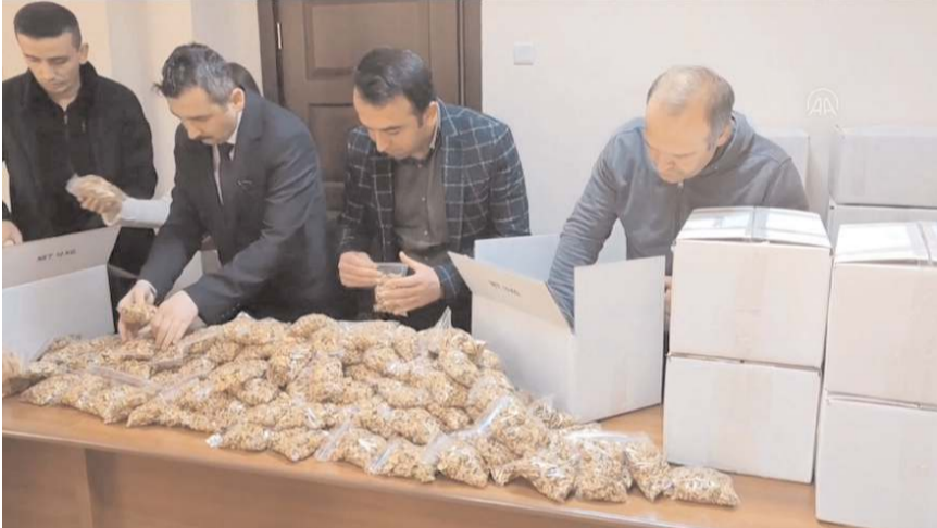
Cevizler paketlenerek deprem bölgesine gönderildi.