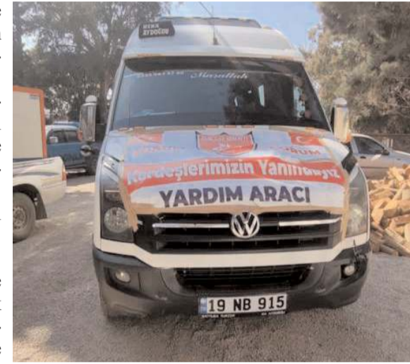
Çorum Akıncılar Derneği' de deprem bölgesine yardıma bulundu.

Bölgede boş olan çadır kentler var, kapasitesi yarı olanlar var, ful olarak hizmet veren çadır kentler de var. Çadır feryadı yapan kardeşlerimizin bir çoğu çadır kentler yerine mevcut evinin yanında çadır isteyen, AFAD ve Kızılay'ın kurduğu çadır kentlere yerleşmek istemeyen insanlar. Bunun ne kadar haklı bir istek