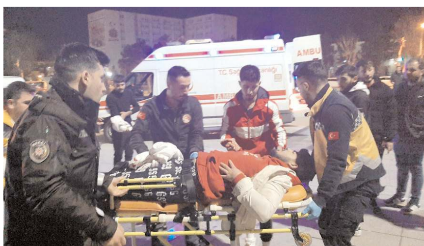
Yaralılar Hitit Üniversitesi Erol Olçok Eğitim ve Araştırma Hastanesi'nde tedavi altına alındı.