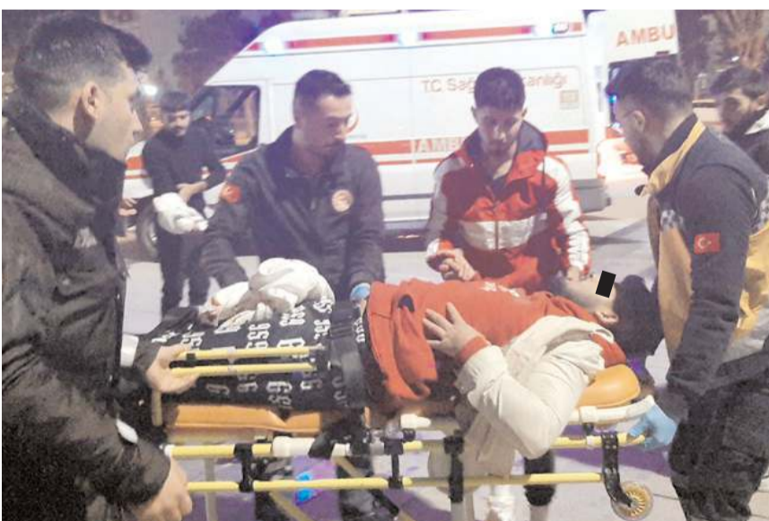
Yaralılar Hitit Üniversitesi Erol Olçok Eğitim ve Araştırma Hastanesi'nde tedavi altına alındı.

Kavganın ardından olay yerinden kaçan zanlıların yakalanması için çalışma başlatıldı.(AA)