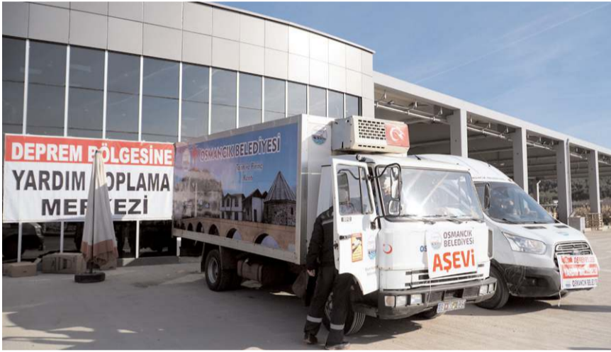
Seyyar aşevi ile personeli yola çıldı.

Osmancık Belediyesi depremde etkilenen Kahramanmaraş'ın Afşin ilçesine seyyar aşevi ile 10 personel gönderdi.