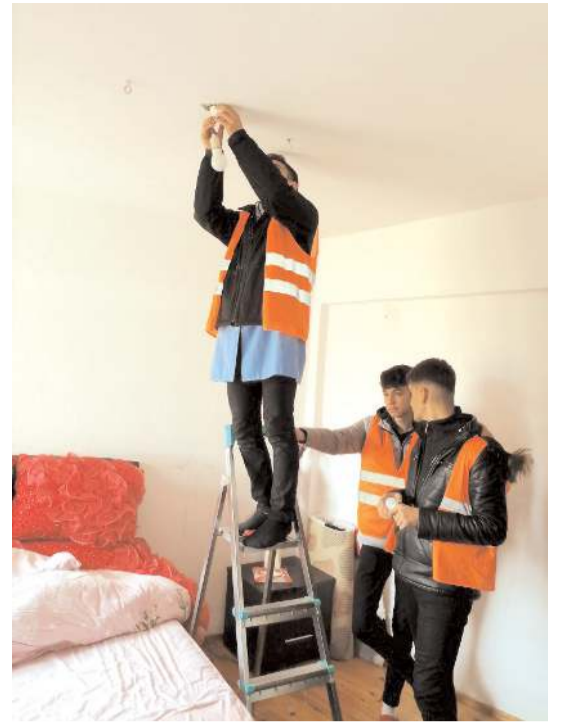
GÜL-DER, 'Gönülleri Onarıyoruz' projesinin birinci dönemini tamamladı.