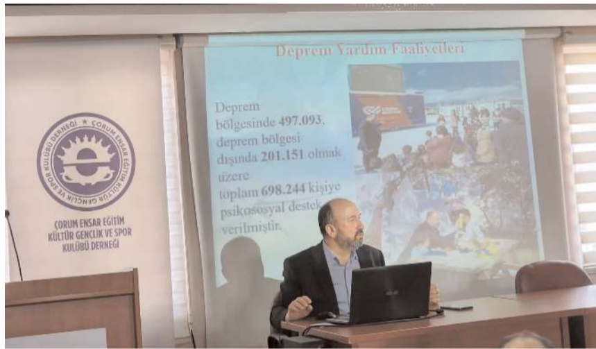
Toplantı AK Parti Çorum Milletvekili Erol Kavuncu'nun başkanlığında yapıldı.