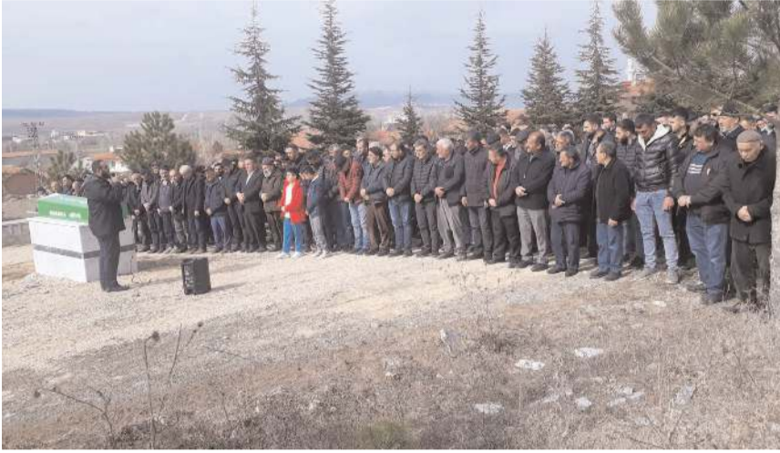
Merhumun cenazesi cenaze namazının ardından köy mezarlığında toprağa verildi.