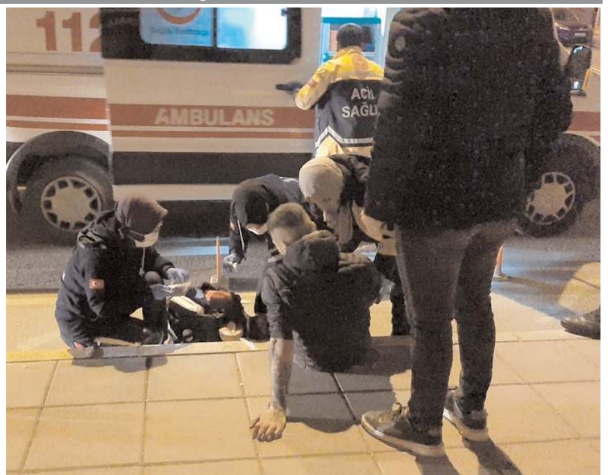
Yaralılara ilk müdahaleyi olay yerinde 112 acil sağlık ekipleri yaptı.

Polis ekiplerince başlatılan soruşturmada, Yiğit K. ve Uğur K'nin, Kale Mahallesi Mürsel Sokak'ta 06 DGB 813 plakalı otomobilde, tartıştıkları Umur Ş'nin silahla ateş etmesi sonucu yaralandıkları ve araçtan