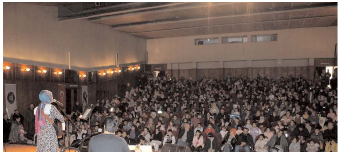
Devlet Tiyatro Salonunda yapılan programa katılım yüksek oldu.