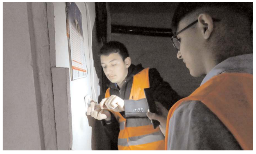
Belirlenen ihtiyaç sahibi 68 ev ziyaret edilerek bakım ve onarımları yapıldı.

Projenin uygulanması aşamasında öğrencilerimiz nezaket ve efendiliklerini muhafaza ederek ön-