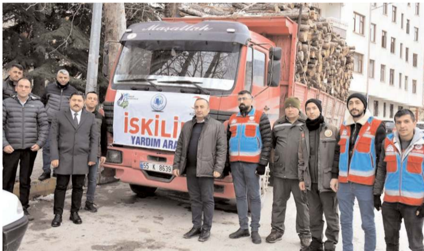
İlçe protokolü depremzedeler ile yakından ilgileniyor.