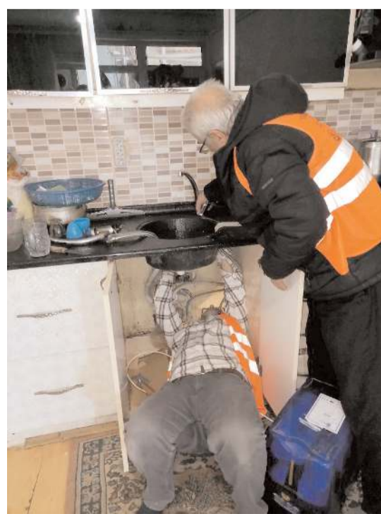
Bozuk duş, priz, düğme, musluk, kapı camı, kapı kolları, kapı iç mekanizmaları, yanmayan ampul gibi aparatlar değiştirildi.