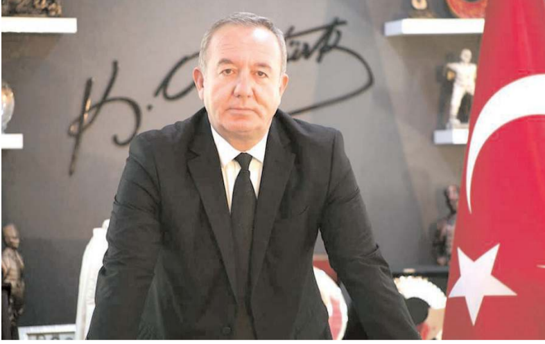
Sungurlu Belediye Başkanı Abdulkadir Şahiner

Depremin olduğu ilk günden itibaren tüm imkanlarını seferber eden Sungurlu Belediye Başkanı Abdulkadir Şahiner, "Depremzedelere kapımız sonuna kadar açık. Bu süreci birlikte atlatacağız, yaraları birlikte saracağız" dedi.