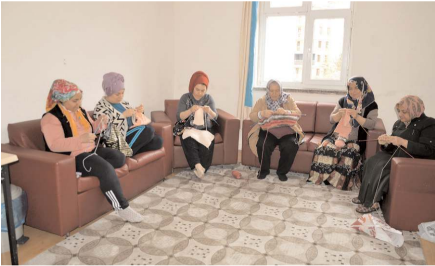
Çorum'a getirilen depremzedelerin bir bölümü Şehit Erol Olçok İmam Hatip Lisesi'nin pansiyonuna yerleştirildi.