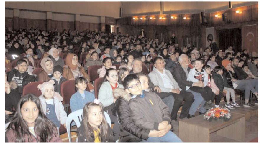
Depremzede çocuklar güzel bir gün geçirdiler.