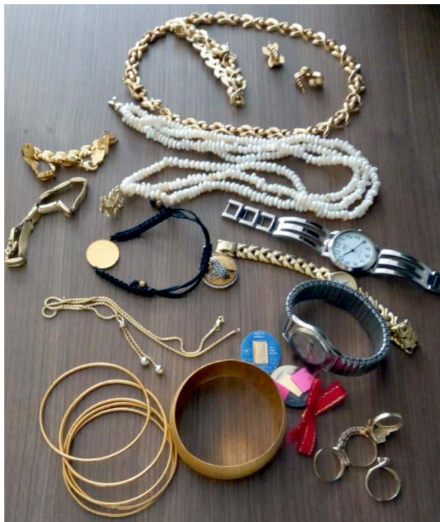
Şahıs, para ve ziynet eşyalarını dolandırıcılara vermekten vazgeçerek 112 Acil Çağrı hattını arayarak yardım istedi.

Gözaltına alınan iki zanlı Emniyet Müdürlüğü'nde ifadeleri alındıktan sonra Türk ceza kanununun 158. mad-