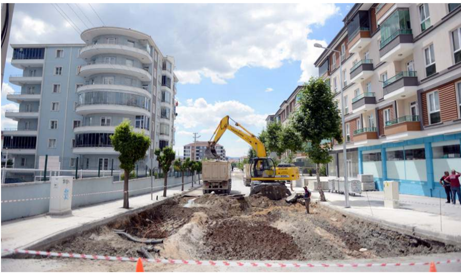
Alt yapısı yenilenen caddenin şimdi de asfaltı değiştiriliyor.