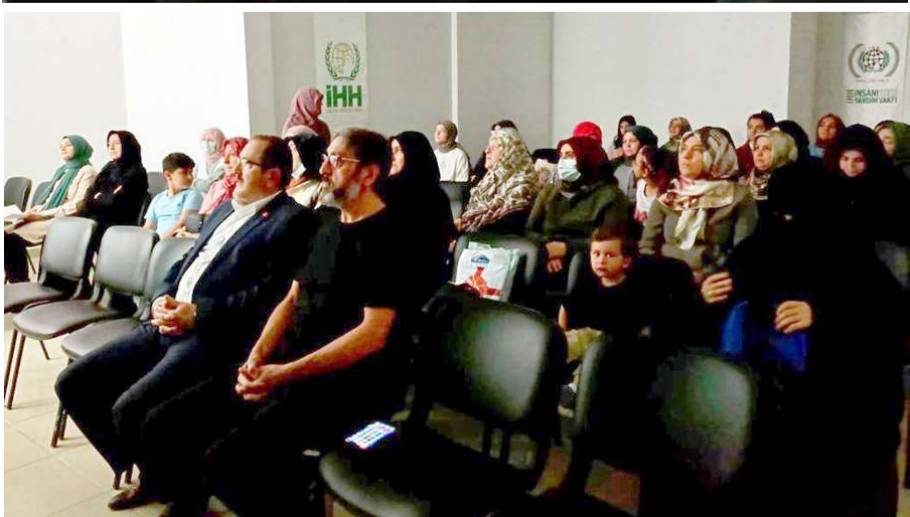
'Medeniyet Işığında Farkındalık Seferi' projesi yapılan programla sona erdi.