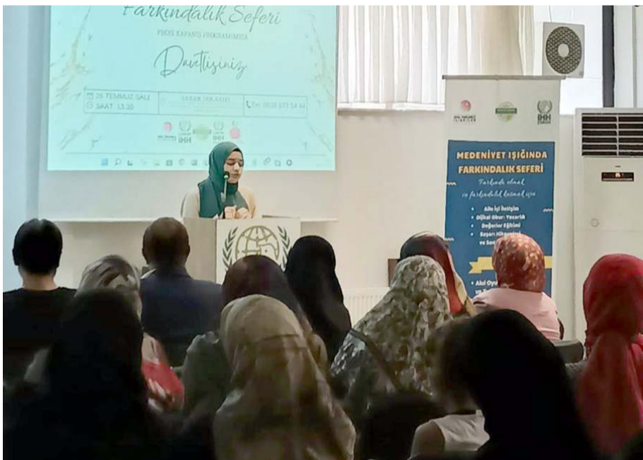
Programda proje hakkında bilgi verildi.