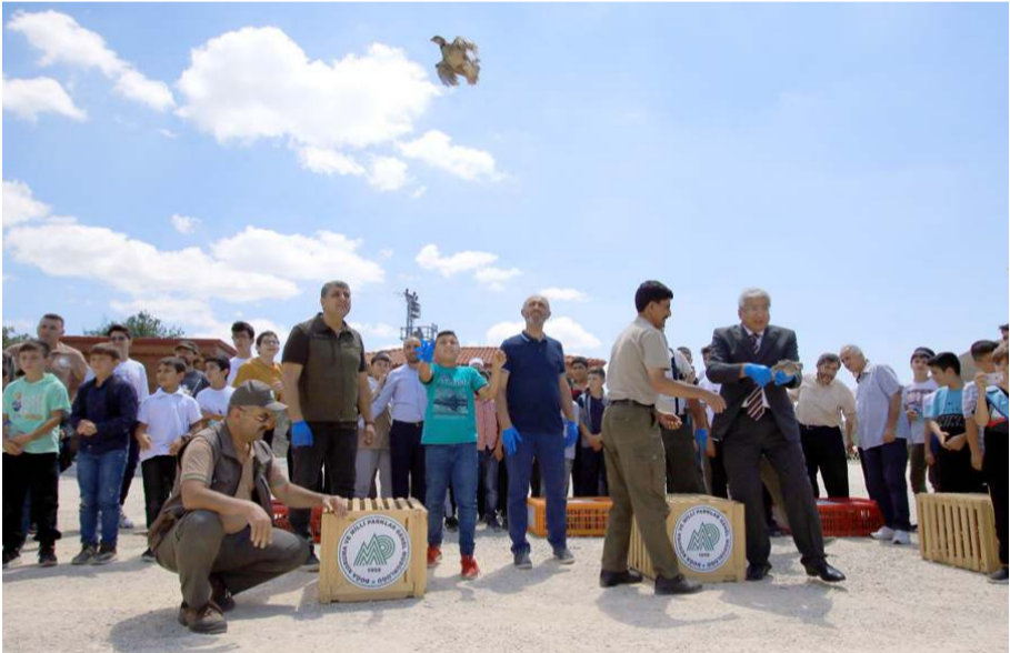
Keklikler "Doğaya Kanatlı Yaban Hayvanı Yerleştirme Programı" çerçevesinde doğaya bırakıldı.