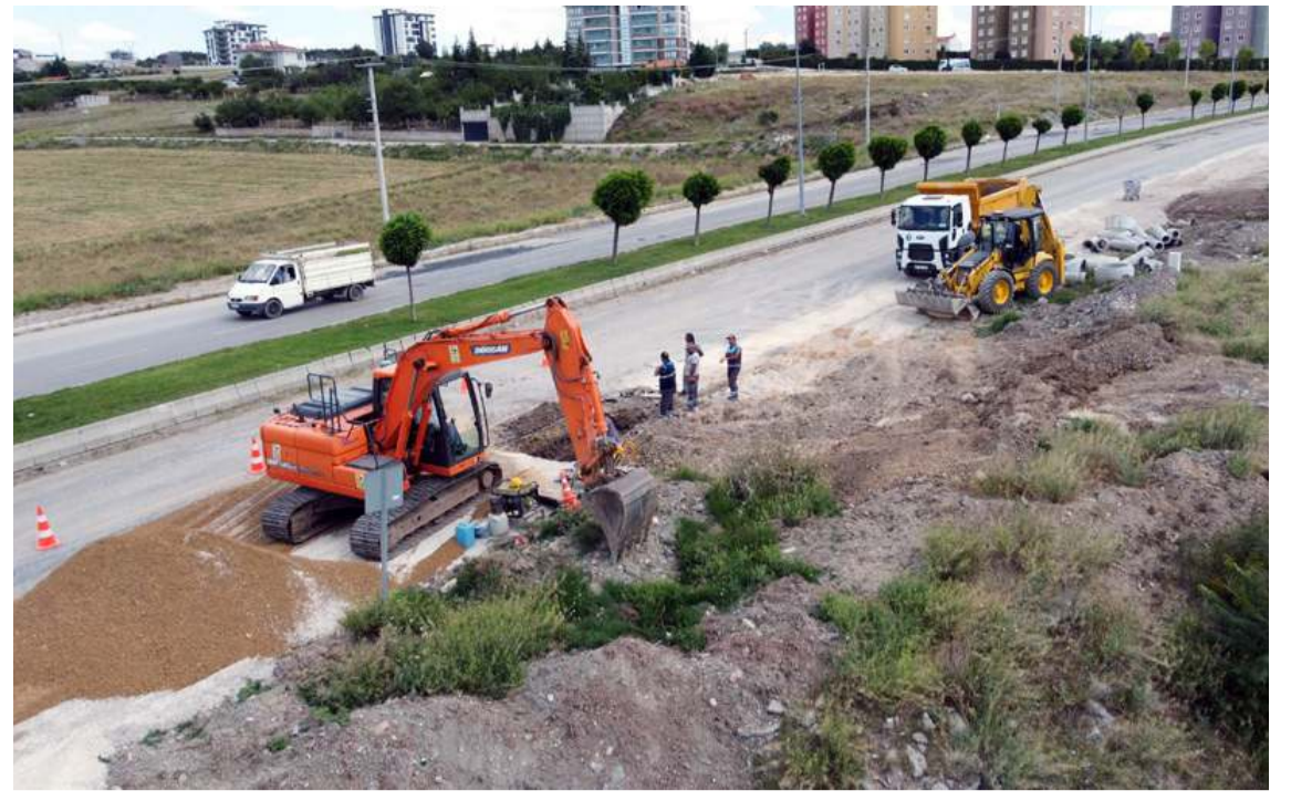
Silmkent 2., 4., 5. ve 20. Sokak'ta içme suyu hatları yenileniyor.

Aşgın, "Ekiplerimiz önce, Buharaevler Mahallemizde bulunan Mahmutedevler Caddemizde zamanla ömrünü tamamlamış boruları yeniledi. Şimdi de yol yenileme çalışmaları kapsamında kazı çalışmalarına başladı. 500 metre uzunluğa, 10 metre genişliğe sahip yolumuzun kazı ve dolgu çalışmaları tamamlandıktan sonra asfalt serimini gerçekleştireceğiz. Mahalle sakinlerimize hayırlı olsun" şeklinde kaydetti. (Haber Merkezi)