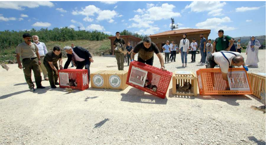
Keklikler tarım zararlılarıyla mücadelede önemli bir rol oynuyorlar.