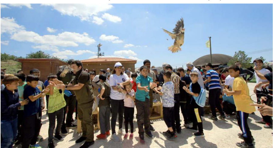
Etkinliğe çocuklarda katılarak elleriyle keklik bırakmanın mutluluğunu yaşadılar.