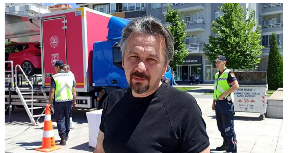
Vatandaşlar etkinliğe ilgi gösterdiler.