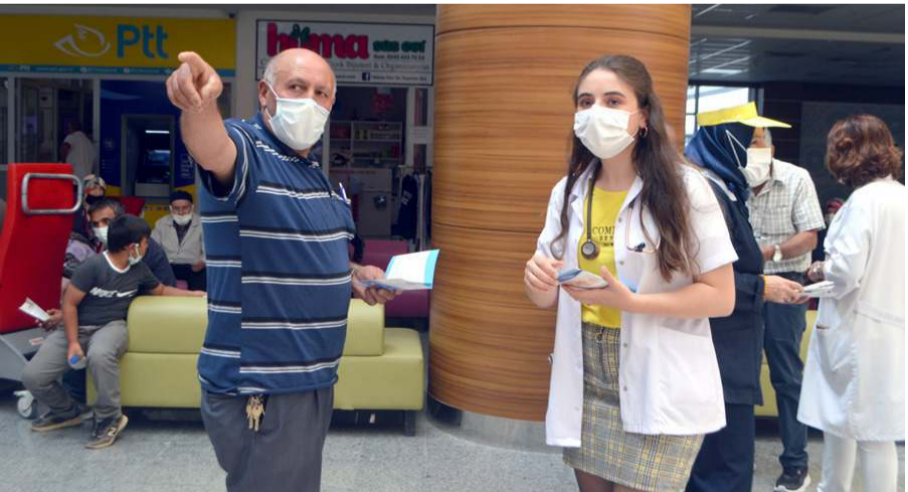
Hepatit'e karşı bilinçlendirmek için vatandaşlara broşür dağıtıldı.