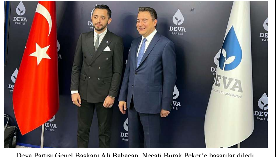
Deva Partisi Genel Başkanı Ali Babacan, Necati Burak Peker'e başarılar diledi.

1987 doğumlu olan Necati Burak Peker Çorum'un eski esnaflarından Necati Peker'in torunudur. Eski bir radyocu, grafik tasarımcısı ve Çorum'un tanınmış fotoğraf sanatçılarından biri olan Peker, mesleki eğitimini Hollanda'da tamamladıktan sonra 2013'te Çorum'a dönerek hala başında olduğu Fotoğraf Ajansında çalışmalarını yürütüyor. (Haber Merkezi)