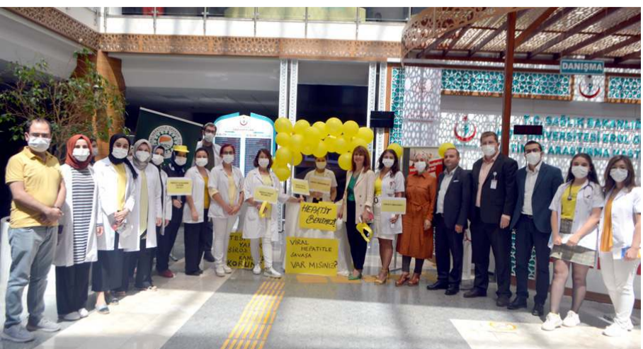
Etkinlikte Hepatit'in erken teşhisinin önemine dikkat çekildi.