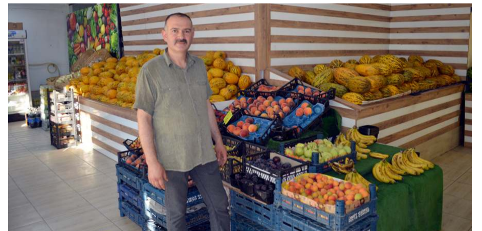
Kardeşler Manavı, kaliteli ürünü uygun fiyata satma anlayışından taviz vermiyor.