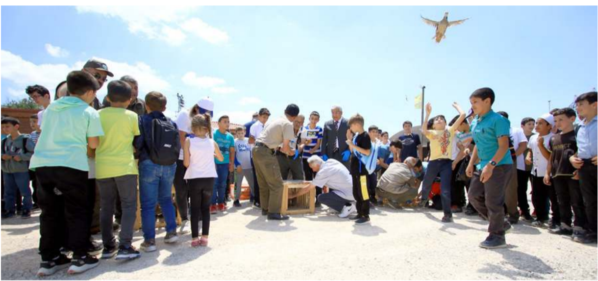
Keklikler Çorumlu Obası'nda doğaya salındı.

Şanal açıklamasını şu ifadelerle tamamladı: "Türlü bahanelerle güzel dinimize, Diyanet İşleri Başkanlığımıza, din görevlilerimize ve dindar insanlarımıza yönelik karalama ve itibarsızlaştırma kampanyasını görüyor, yapılan saldırılar karşısında dinimizin bize öğrettiği güzel üsluptan taviz vermeden ve haksızlık karşısında susmadan dinimizi ve dini değerlerimizi savunmaya devam edeceğimizin bilmesini istiyoruz."