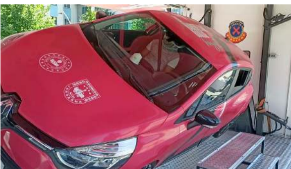
Jandarma Genel Komutanlığı etkinlikleri Kadeş Barış Meydanı'nda gerçekleştirildi.