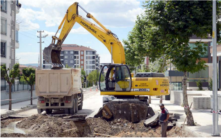
500 metre uzunluğa, 10 metre genişliğe sahip caddede ilk olarak kazı ve dolgu çalışmaları yapılacak.