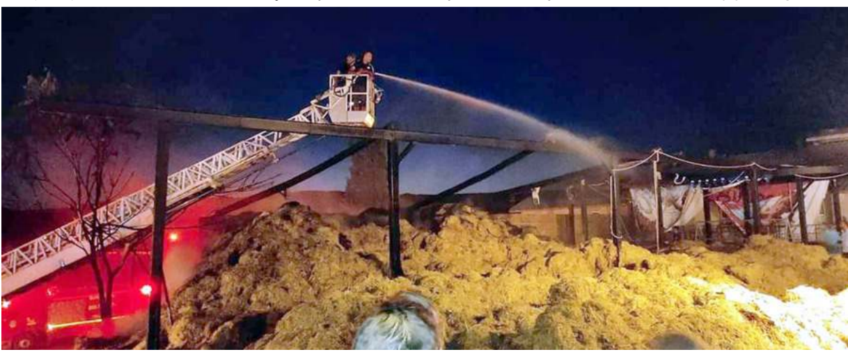
Sungurlu Belediyesi İtfaiye ekipleri alevlere müdahale ederek söndürdü.