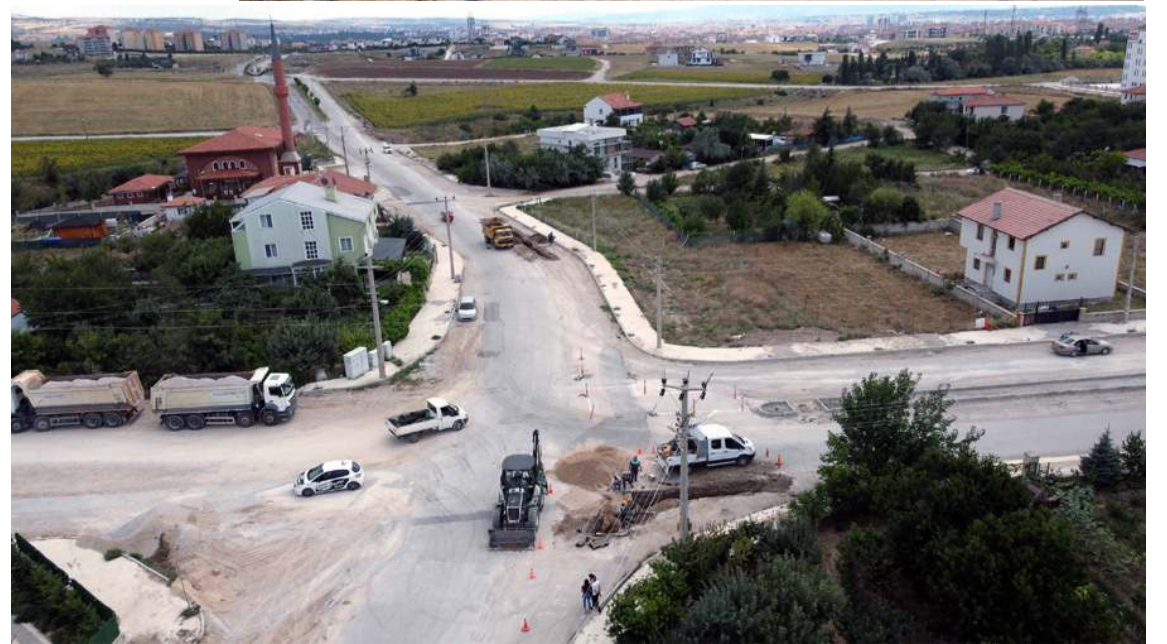
Bölgede toplam 3 bin 353 metre uzunluğunda içme suyu hattı yenilenecek.