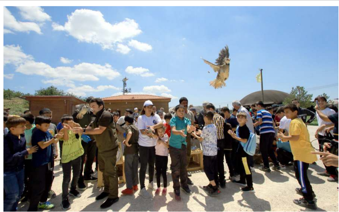
Etkinliğe çocuklarda katılarak elleriyle keklik bırakmanın mutluluğunu yaşadılar.

■ Samsun'da bir inşaatın 9. katından düşen 22 yaşındaki Çorumlu işçi Özcan Demir kaldırıldığı hastanede hayatını kaybetti. * HABERİ 3'DE