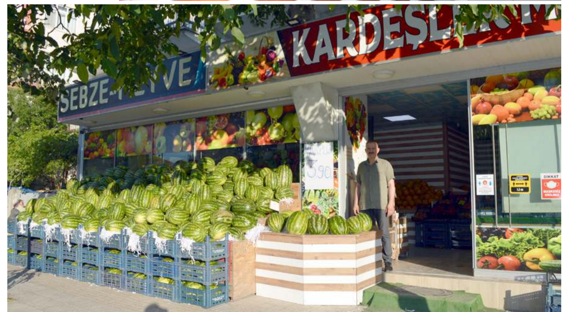
Kardeşler Manavı-2 Alaeddin Cami yanında köşede faaliyetlerini yürütüyor.