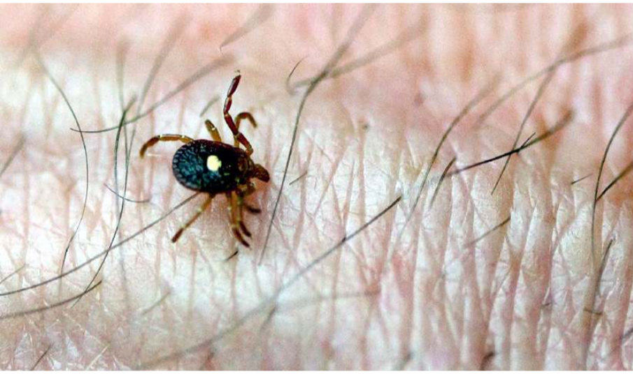
KKKA kaynaklı ölümler artmaya başladı.

Mesire alanlarına gildiğinde mutlaka açık renk giysiler giyin. Vücutta açık alan bırakmayın. Mümkünse pantolon giyip çorabınızı üzerine çekin. Piknik sonrası eve gittiğinizde mutlaka aile bireyleri birbirine vücut muayenesi yapın. Bir ben gibi görünüyorlar. Eğer keneyi evde kendileri çıkaracaklarsa gövdesinden bir cımbızla tutup vida gibi çevirerek yumuşak bir şekilde çıkarılsınlar. Kişiler bu konuda kendini ehil hissetmiyorsa bir sağlık merkezine başvursunlar.