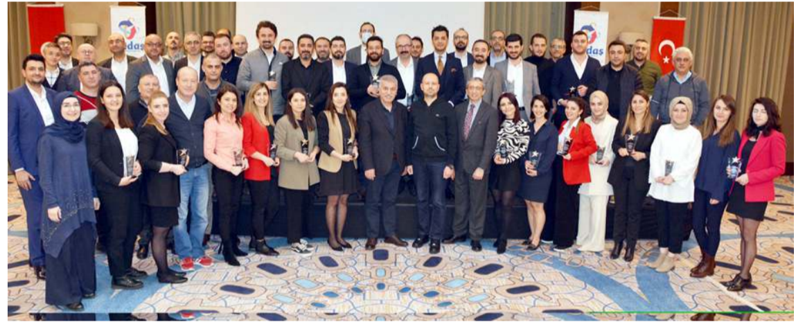
Çalışmaların sonunda Mükemmellikte Yetkinlik Belgesi" alınması hedefleniyor.

3 yıldız sahibi ilk elektrik dağıtım şirketi olduk. Bu başarımızı 2022 yılında da geliştirmek için çalışıyoruz. Modeli sürecimize entegre ederken şirket kültürümüzde önemli yere sahip olan 'aidiyet duygusu' ve 'yön birliliğini ortaya koyarak modeli içselleştirdik ve çalışanlarımız başta olmak üzere tüm paydaşlarımıza yayılımını sağlayarak bütünsel bir yaklaşım ortaya koyduk. Enerji sektörünün öncü, deneyimli ve kaliteye önem veren bir ekibine sahibiz. Çevik ve yenilikçi yapımız sektör de başarı gösteren elektrik dağıtım şirketi olarak öne çıkmamızı sağlıyor. KalDer ile üyeligimizi yenilememiz EFQM 2020 Mükemmellik Modelini esas alarak öz değerlendirmeyi sürekli bir gelişim aracı olarak kullanmamıza destekleyecek. "Kalite, Liderlik ve Sürdürülebilirlik" anlayışı çerçevesinde toplam kalite ve mükemmelliğe giden yolda tüm çalışanlarımızla birlikte yeterli bilgi ve birikime sahip olmamız gerektiği gibi elektrik dağıtım şirketleri için vazgeçilmez kalite standartlarını da eksiksiz uyguluyoruz. "Mükemmellikte Yetkinlik Belgesi" için son aşamaya gelmemizde emeği geçen tüm çalışma arkadaşlarımıza teşekkür ediyorum" diye konuştu. (Haber Merkezi)