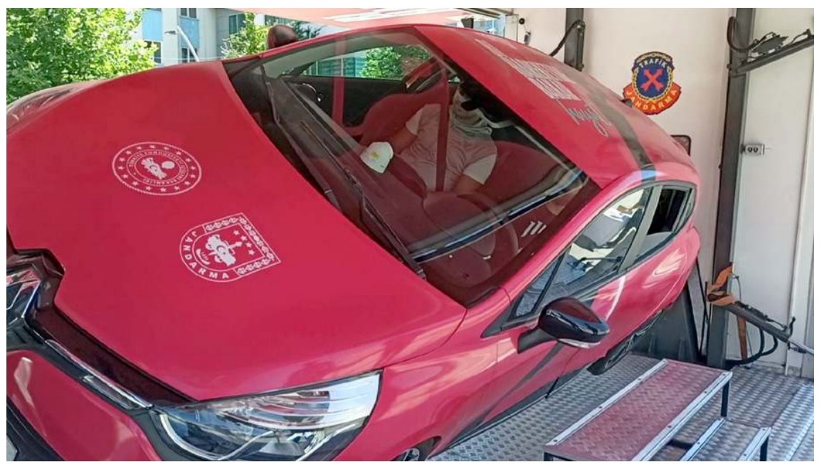
Jandarma Genel Komutanlığı etkinlikleri Kadeş Barış Meydanı'nda gerçekleştirdi.