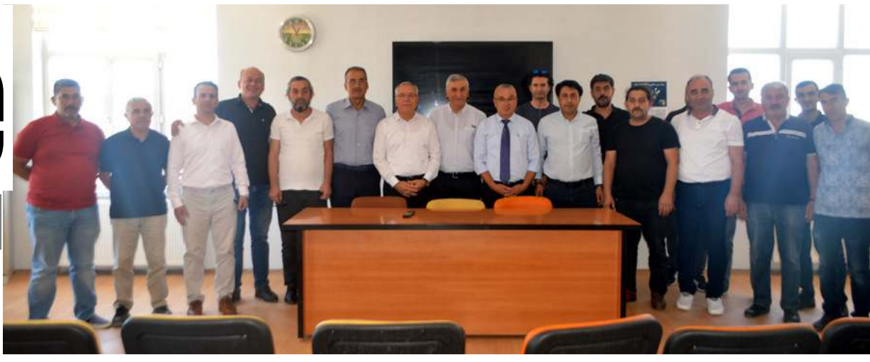
Basın açıklamasının ardından ardından hatıra fotoğrafı çekildi.

Türk İş'in yol gösteren ve bir nevi kar küreyici görevini üstlenen sendika olduğunu söyleyen Türk İş Üçtepe, "Yurdumuzun en eski ve en büyük emek örgütü Türkiye İşçi Sendikaları Konfederasyonu (TÜRK-İ-Ş) önümüzdeki pazar günü 70'inci yaşını kutlayacak. Türk-İş, 31 Temmuz 1952'de kurulduğu günden bugüne ülkemiz emekçilerine umut, adeta onlara kara deryalarda yol gösteren bir fener oldu. Olmaya da devam ediyor. Türk-İş'in tarihi Türkiye emek mücadelesinin, Türkiye işçi sınıfı mücadelesinin tarihi haline geldi. Yurdumuzun tüm çalışanları, emekçileri; yaşamını alın teri dökerek kazananları, hakları söz konusu olunca yüzünü Türk-İş'e döner. İşçisi, köylüsü, esnafı "Türk-İ-Ş ne diyor, Türk-İ-Ş ne yapıyor?" diye sorar. Türk-İ-Ş emek mücadelesine öncülük eder, yol gösterir. Ülkemizde, işçi hak ve özgürlükleri adına elde edilen her kazanımında Türk-İ-Ş