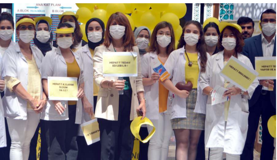
Erol Olçok Eğitim ve Araştırma Hastanesi'nde yapılan etkinlikte Hepatit'e dikkat çekildi.