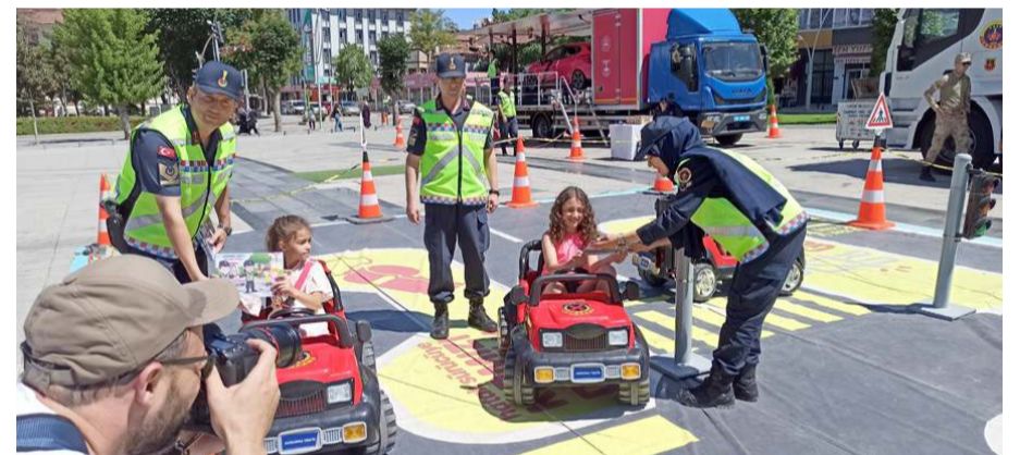
Ankara'dan gelen trafik timleri Kadeş Meydanı'nda kurulan parkurlarda vatandaşlara trafik kuralları hakkında uygulamalı olarak bilgi verdi.