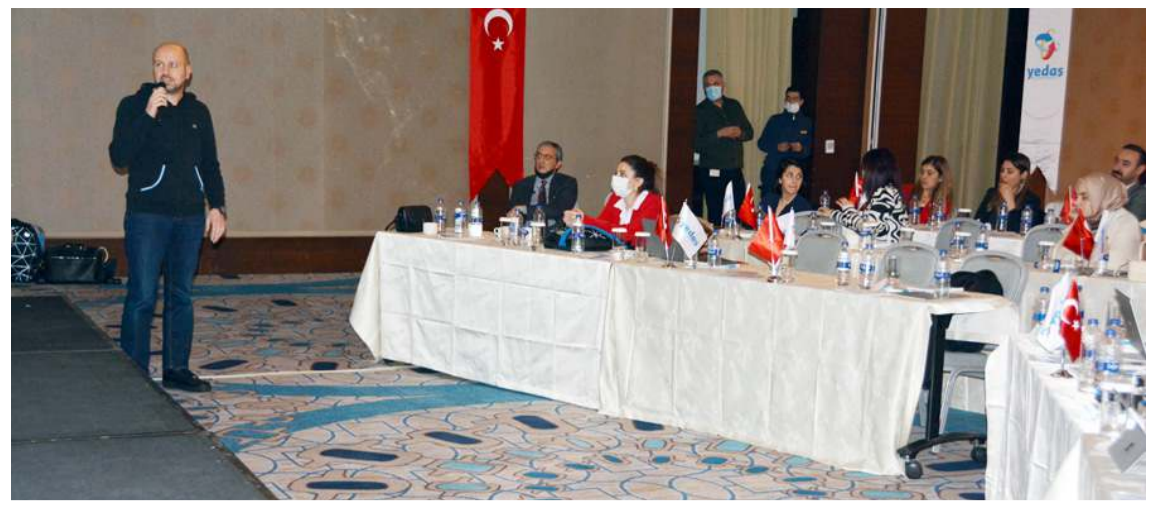
YEDAŞ EFQM Mükemmellik Modeline geçmek için çalışmalarını sürdürüyor.