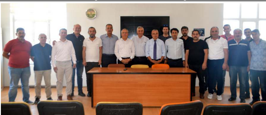
Basın açıklamasının ardından ardından hatıra fotoğrafı çekildi.

■ Daha önce Gazi Caddesi'nde hizmet veren Türk İş Çorum İl Temsilciliği, İl Özel İdaresi'ndeki yeni yerine taşındı. * HABERİ 10'DA