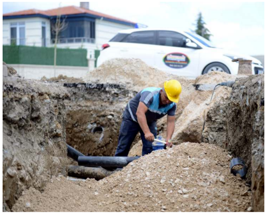
Ekonomik ömrünü doldurmuş boruları yeni sistem borularla değiştiriliyor.

Bu kapsamda ekiplerin Silmkent 2., 4., 5 ve 20. Sokakta içme suyu hattında yenileme çalışması yaptıklarını açıklayan Başkan Aşgın, "Toplam 3 bin 353 metre uzunluğa sahip olan çalışmamız tamamlandığında bölge sakinlerimiz uzun yıllar içme suyu problemi yaşamayacak" ifadesini kullandı. (Haber Merkezi)