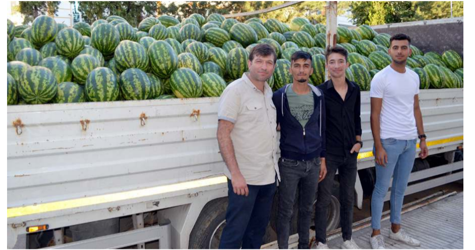
Kardeşler Manavı'nda Erbaa'nın karpuzunu ve Adana'nın kavunu direk olarak tarladan halka sunuluyor.

Kardeşler Manavı-1 Cemilbey Caddesi'nde Hasan Paşa Göğüs Hastalıkları Hastanesi'ni (Eski SSK Hastanesi) geçince, Kardeşler Manavı-2 ise Alaeddin Cami yanında köşede faaliyetlerini yürütüyor.