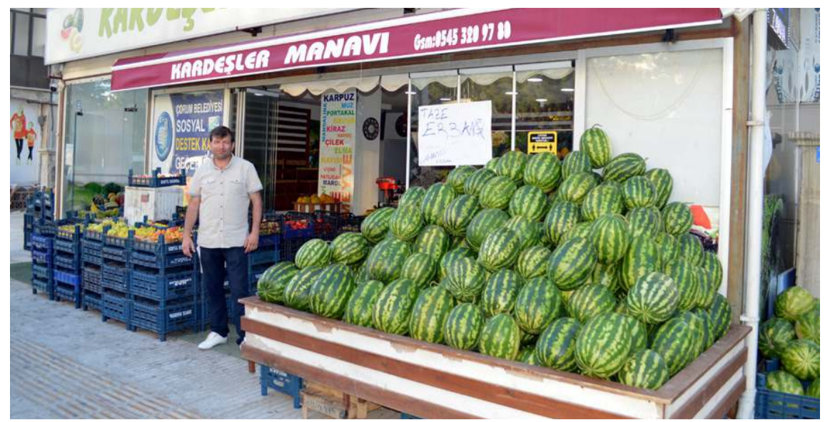
Kardeşler Manavı-1 Cemilbey Caddesi'nde Hasan Paşa Göğüs Hastalıkları Hastanesi (Eski SSK Hastanesi) ilerisinde faaliyetlerini sürdürüyor.