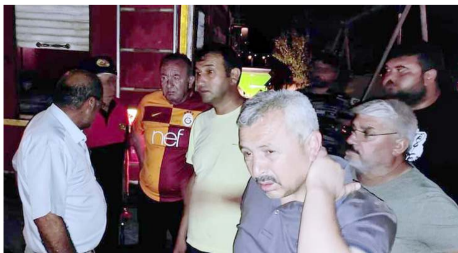
Belediye Başkanı Abdulkadir Şahiner ve Başkan Yardımcıları da olay yerine geldiler.