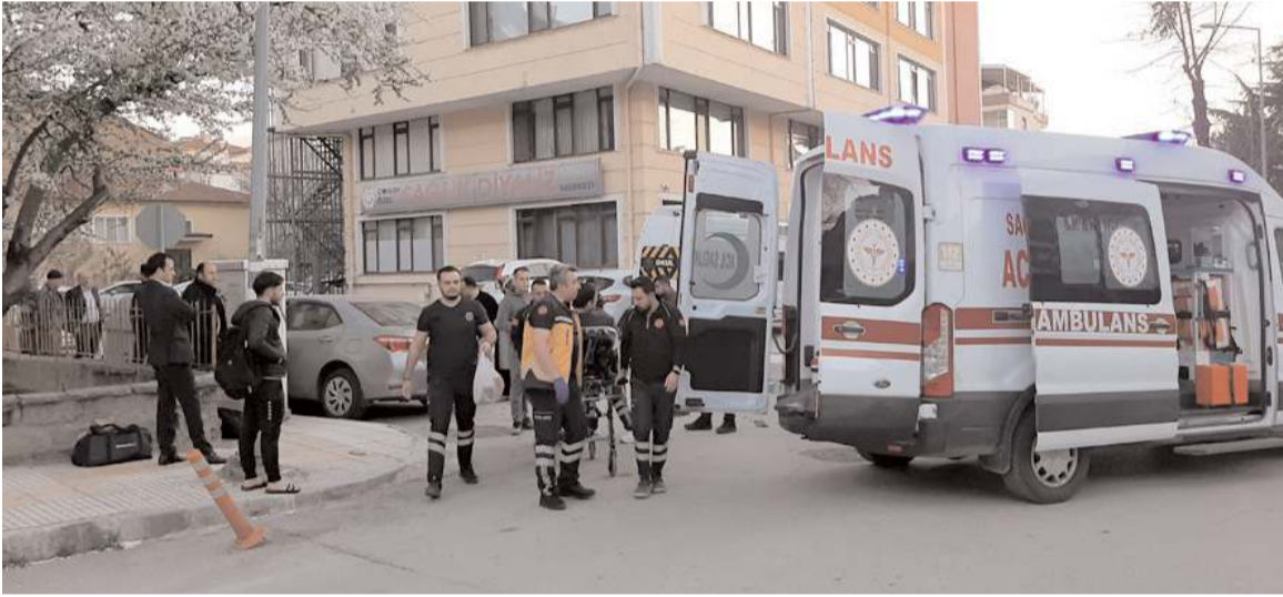
Yaralı ilk müdahalenin ardından hastaneye kaldırıldı.