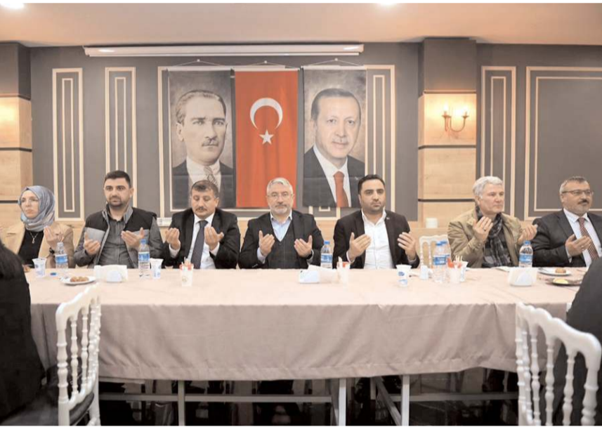
İftarın ardından dua edildi.