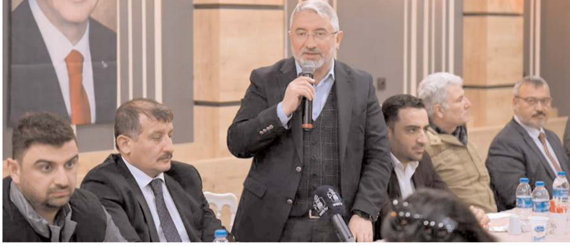
Başkan Aşgın, iftar programında konuşma yaptı.