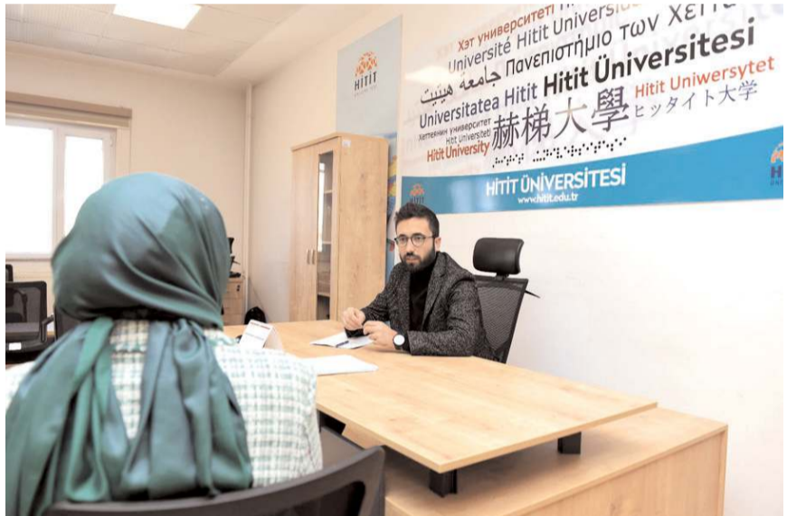
Hitit Üniversitesi öğretim elemanları, normal yaşama dönme ya da yeni yaşama uyum sağlama sürecinde destek talebinde bulunan öğrencilerle online ya da yüzyüze görüşüyorlar.