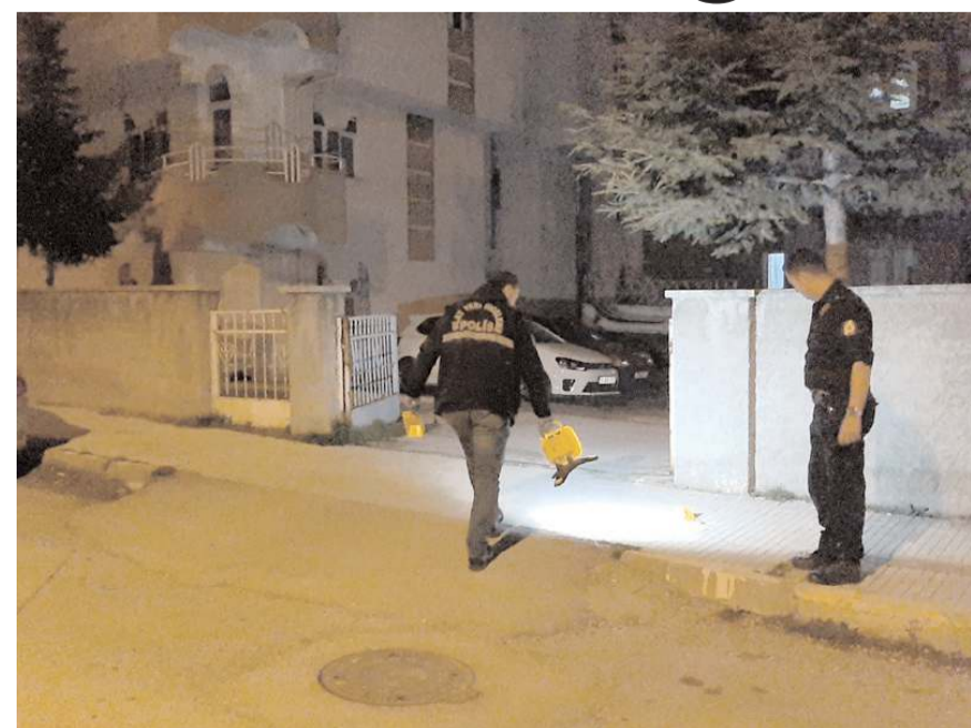
Polis ekipleri olay yerinde incelemede bulundu.