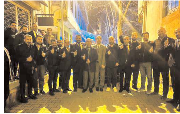
Yeniden Refah Partisi'nin Çorum Milletvekili Aday Adayları, ziyaretler gerçekleştiriyor.

28. Dönem Milletvekili Seçimleri öncesinde AK Parti'den Çorum'u 1. ve 2. sırada tercih eden milletvekili aday adaylarının isimleri kamuoyu ile paylaşıldı. Toplam 54 aday adayının bulunduğu liste yer alan isimlerin 36'sının birinci tercihleri Çorum oldu. * HABERİ 2'DE