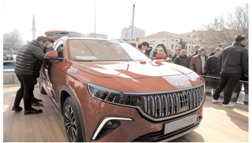
Çorumlu vatandaşlarda TOGG'u bekliyor.

T10X uzun menzili: 1 milyon 215 bin lira 523 kilometrelik menzillere sahip T10X'de, 160 kW / 218 beygir güç ve 350 Nm tork üreten T10X RWD (arkadan itiş) motor bulunuyor. Uzun menzilli bu araçta, 88,5 kWh kapasiteye sahip batarya seçeneğinin tüketim değeri ise 16,9 kWh/100 km.