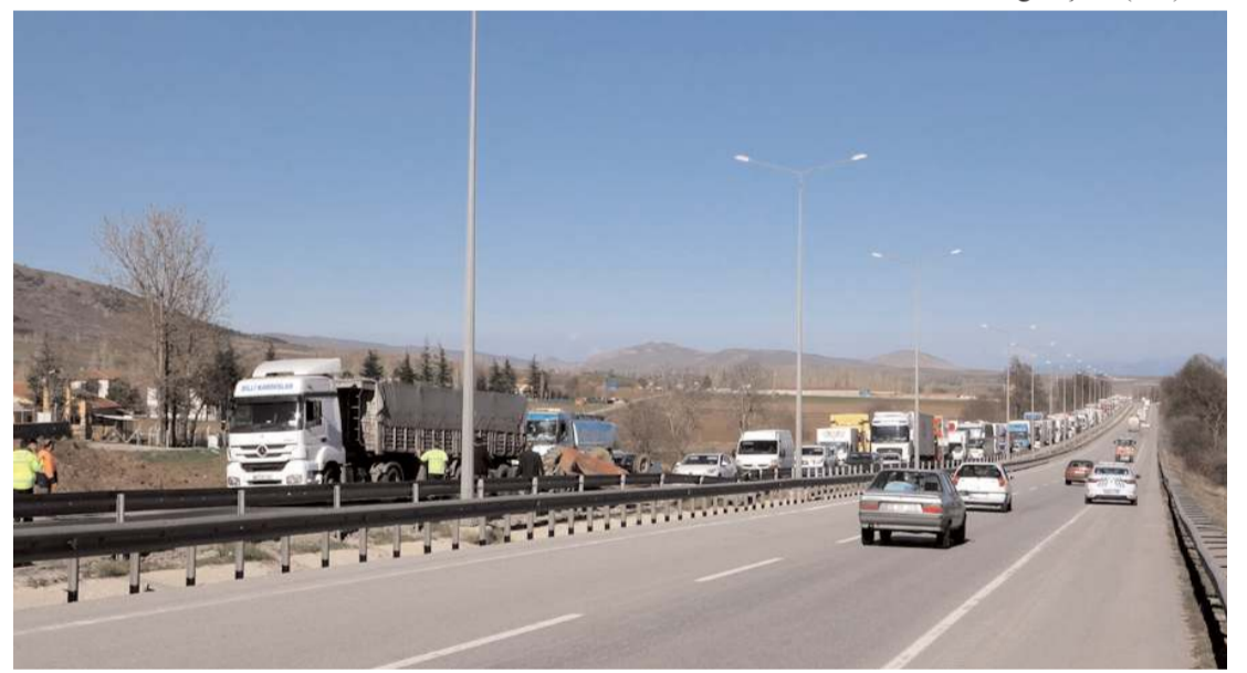
Kaza nedeniyle trafik uzun sürede aksadı.