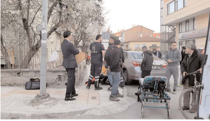
Yaralıya ilk müdahaleyi 112 acil sağlık ekipleri yaptı.