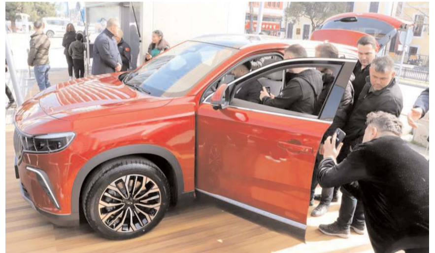
TOGG, şehir şehir tanıtılmaya başlandı.