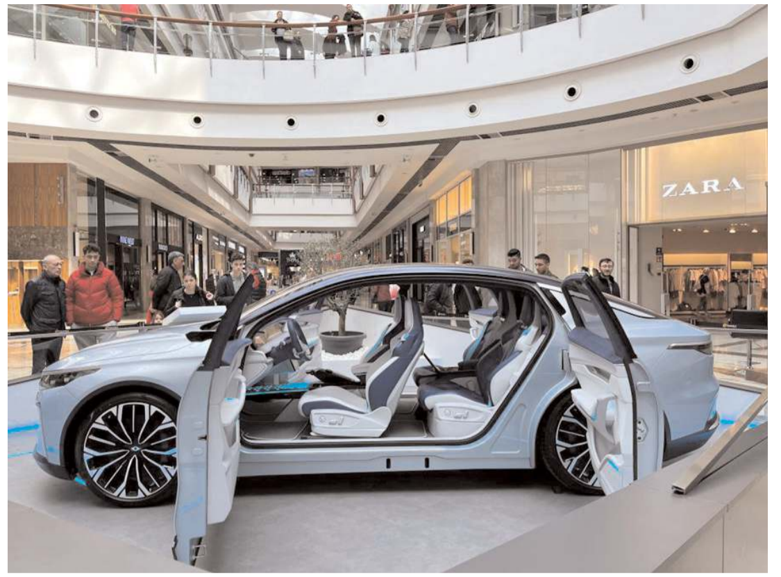
Otomobili Girişim Grubu (TOGG) 'Konsept Akıllı Cihaz'da tanıttı.