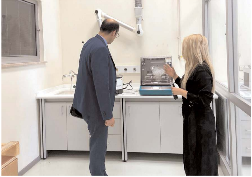
Gıda Takviyesi ve Beslenme Derneği yönetimi HİTÜ laboratuvarlarını gezdi.

Hitit Üniversitesi Teknoloji Transfer Ofisi tarafından düzenlenen program, gerçekleştirilen söyleşi ile sona erdi. (Haber Merkezi)