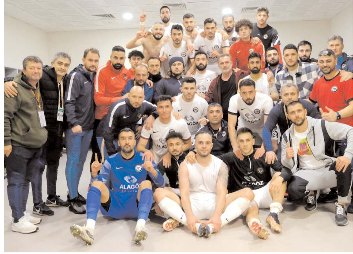
Çorum FK Amedspor maçından sonraki bu birlik görüntüsü kırmızı siyahlı takımın bu maçta en büyük gücü