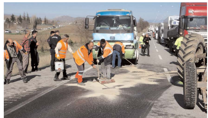
Karayolları ekipleri yola dökülen yakıtı temizledi.