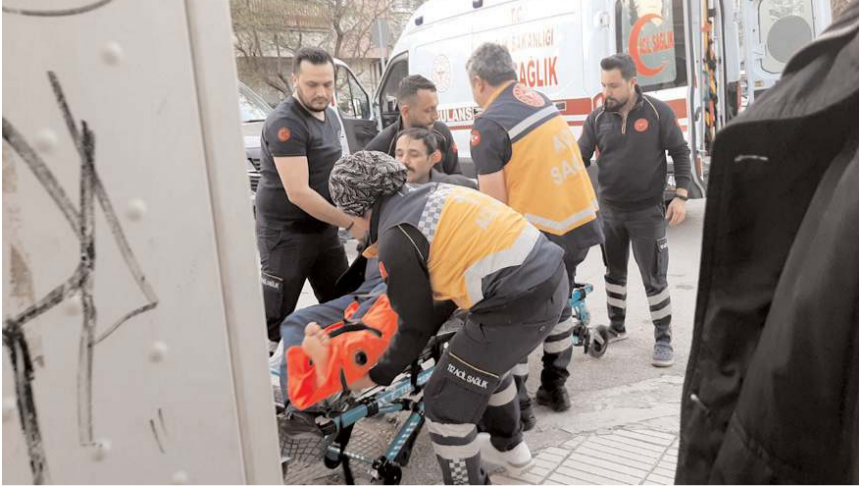
Kaza Yavruturna Mahallesi Esnafevleri 4. Sokak'ta meydana geldi.

Kazayla ilgili soruşturma başlatıldı.(AA)