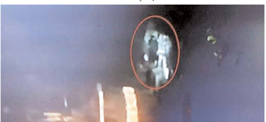
5 yıl önce Ulu Mezarlık'ta meydana gelen olay ülke gündeminde uzun süre yer almıştı.