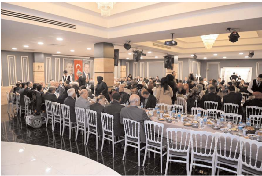
İftara AK Parti İl, Merkez İlçe, Gençlik Kolları ve Kadın Kolları yönetimleri katıldı.