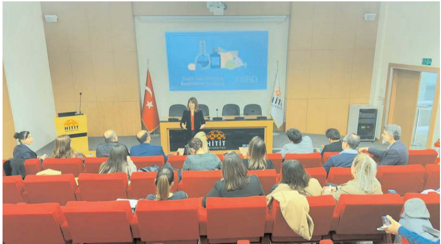
HİTÜ, Gıda Takviyesi ve Beslenme Derneği (GTBD) ve girişimcilerle bir araya geldi.