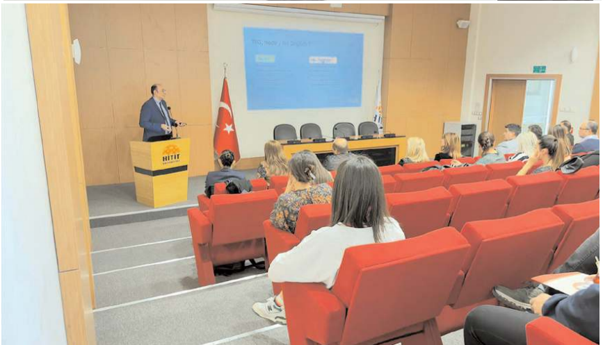
Hitit Üniversitesi Teknoloji Transfer Ofisi tarafından söyleşi yapıldı.