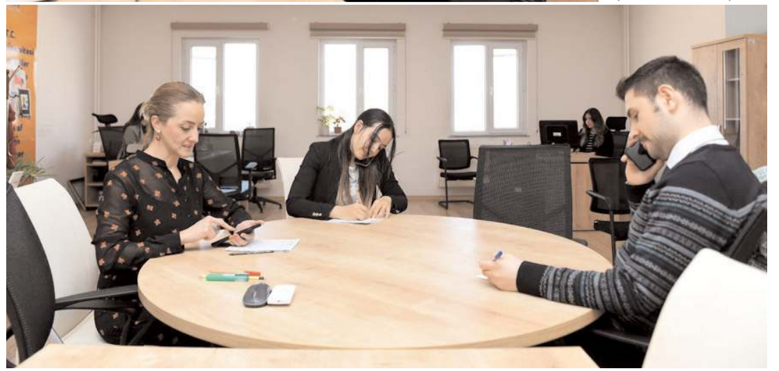
Sosyal Destek ve Dayanışma Birimi çalışmalarına devam ediyor.

Hitit Üniversitesi, deprem bölgesindeki öğrencileri için sosyal destek ve dayanışma faaliyetlerini sürdürüyor.