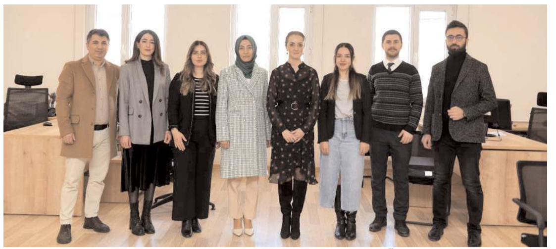
Depremler sonrasında bölgede ikamet eden ya da Çorum'a dönen Hitit Üniversitesi öğrencileri için, öğretim elemanları tarafından sosyal destek ve dayanışma faaliyetleri sürdürülüyor.