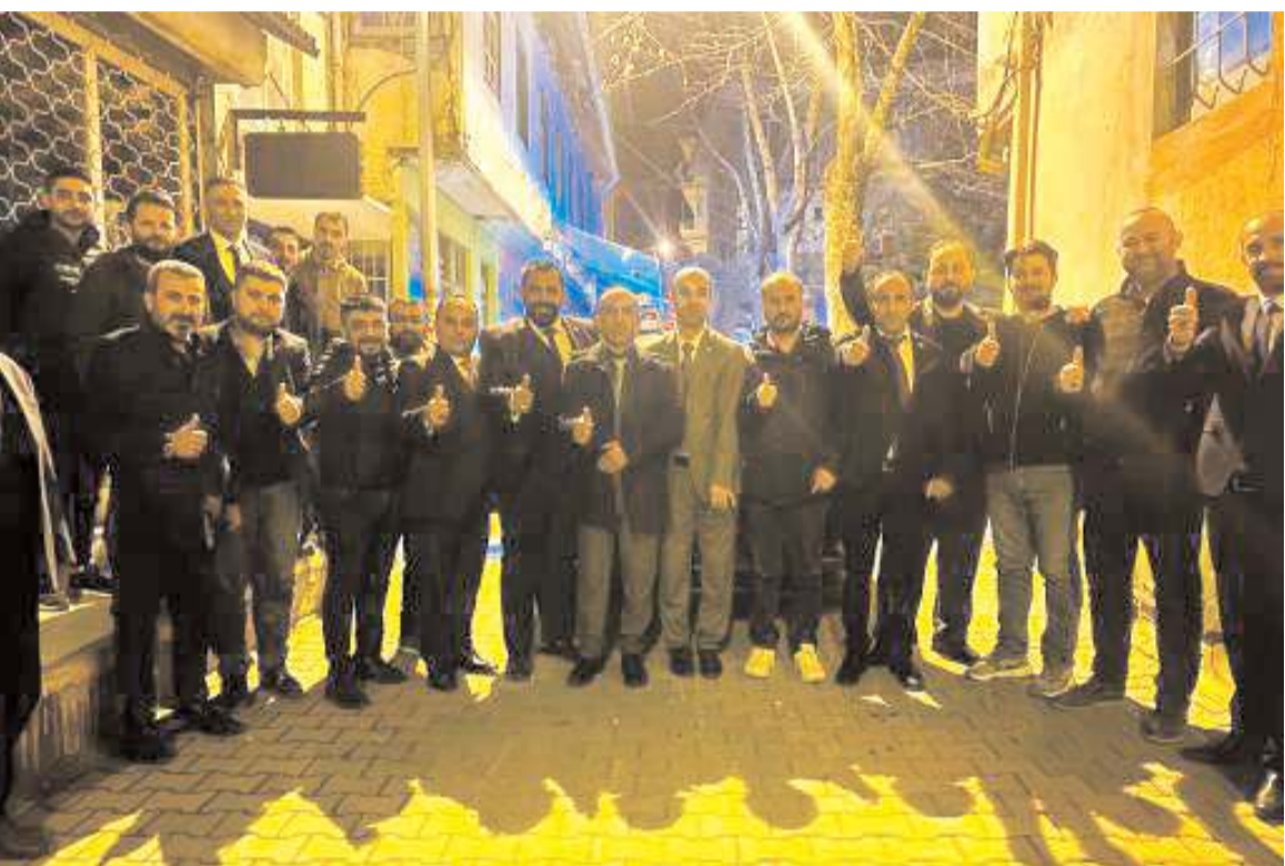
Yeniden Refah Partisi'nin Çorum Milletvekili Aday Adayları, Cumhur İttifakı'na katılım sürecini değerlendirdiler.