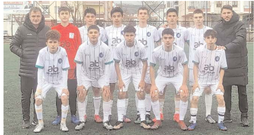
Mimar Sinan beşinci maçında kazanarak şampiyonluğa çok yaklaştı