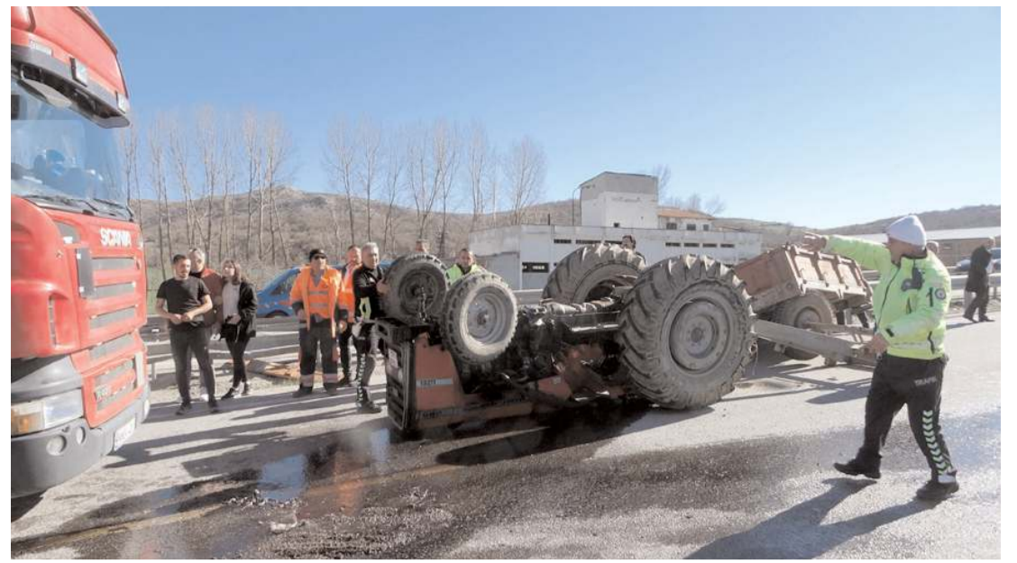
Kaza Samsun-Çorum Karayolu Kaymakçı mevkiinde meydana geldi.