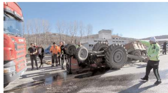
Kaza Samsun-Çorum Karayolu Kaymakçı mevkiinde meydana geldi.

Yeniden Refah Partisi'nin Çorum Milletvekili Aday Adayları, partilerinin ani bir kararla Cumhuriyet İttifakı'na katılması ve Fatih Erbakan'ın cumhurbaşkanlığı adaylığından çekilmesini yorumladı. * HABERİ 8'DE