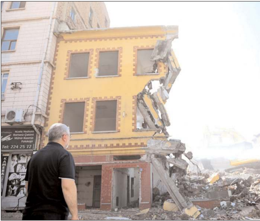
Belediye Başkanı Halil İbrahim Aşgın, yıkım çalışmalarını izlerken...