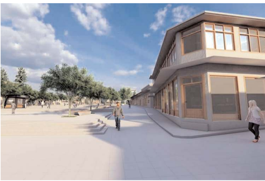
Tarihi meydan böyle olacak...