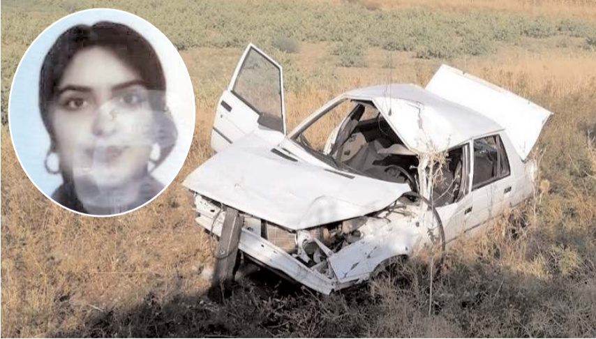
Kontrolden çıkan otomobil tarlaya uçtu.

■ Sungurlu'da kontrolden çıkan otomobilin tarlaya uçması sonucu meydana gelen trafik kazasında 1 kişi hayatını kaybederken, 2 kişi yaralandı. * HABERİ 3'DE