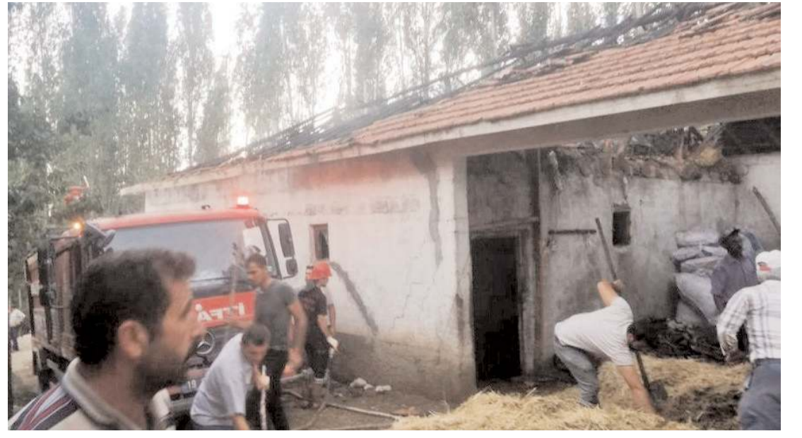
İtfaiye ekipleri çıkan yangını söndürmek için büyük çaba harcadı.

İl Jandarma Komutanlığı etkinlikle ilgili yapmış olduğu açıklamada, amaçlarının Çorum'da meydana gelen trafik kazalarının önemli bir kısmını oluşturan traktör kazalarını en aza indirerek kazalardan kaynaklı ölüm ve yaralanmaların önüne geçmek olduğunu belirterek, trafik denetimleri ile birlikte çiftçilere farkındalık oluşturacak bilgilendirme ve bilinçlendirme faaliyetlerine devam edeceklerini ifade ettiler. (Haber Merkezi)