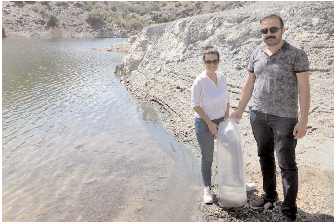
8 bin adet sazan balığı yavrusu gölete bırakıldı.