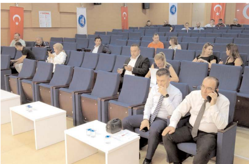
İhaleye 5 banka katıldı.