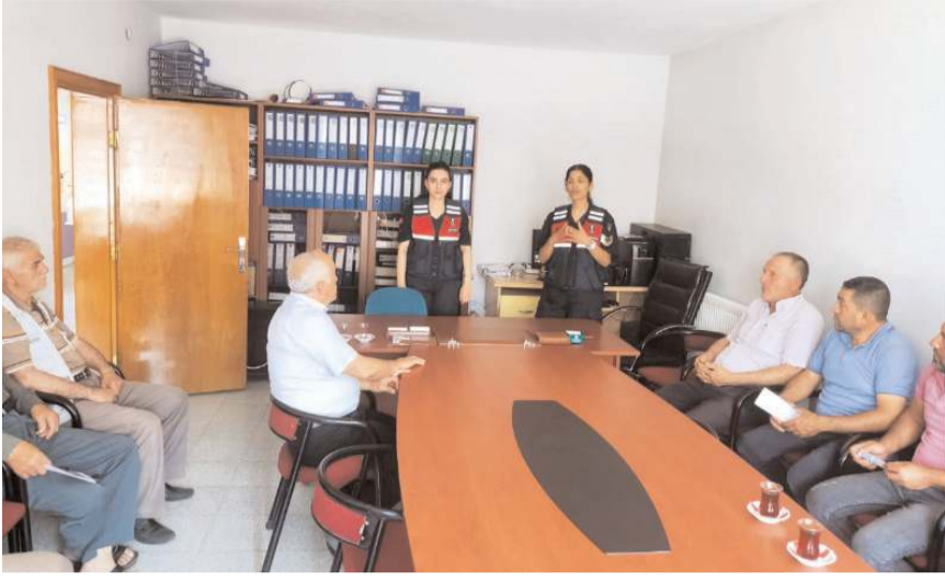
Jandarma ekipleri kadına şiddete yönelik bilgilendirme yaptı.