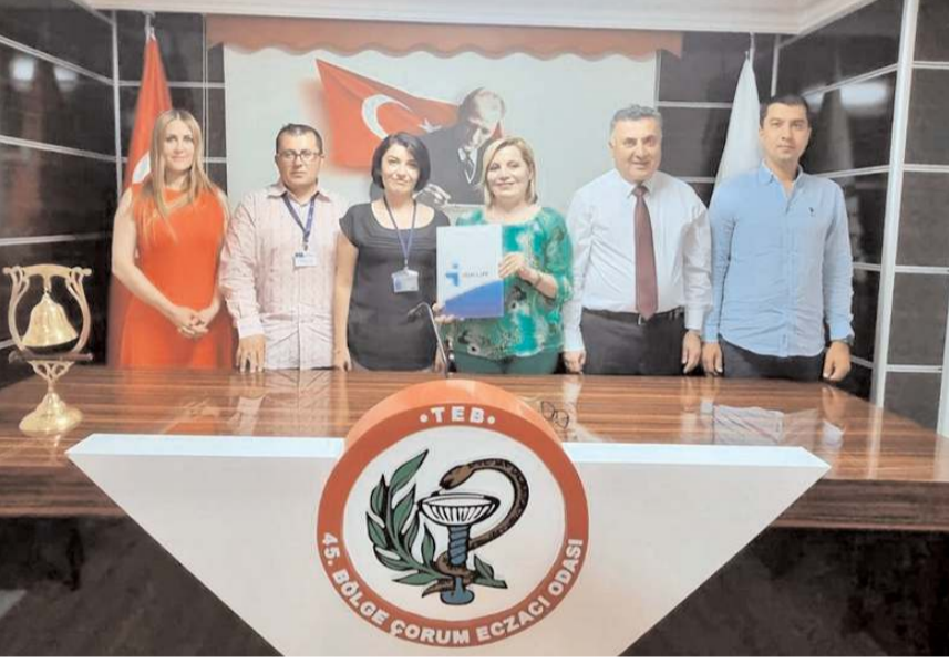
Eczacı Odası yönetimi eczacıların ekonomik olarak güçlendirilmesi için taleplerini iletti.