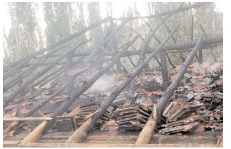
Yangında, ahır tamamen kül oldu.