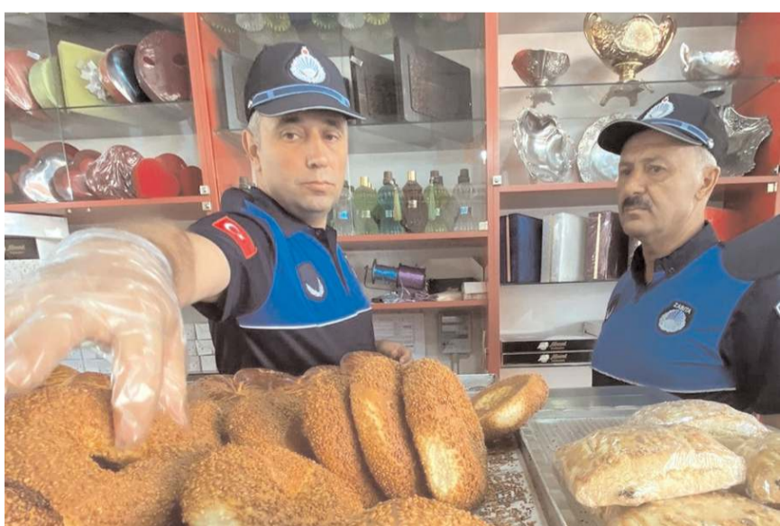
Zabıta ekipleri unlu mamüllerin gramajlarını kontrol etti.

Denetim esnasında esnafa gereken uyarılar yapılırken, vatandaşlara da herhangi bir problemle karşılaşmaları durumunda 153 numaralı hatan şikayetlerini bildirebilecekleri konusunda hatırlatma yapıldı. (İHA)