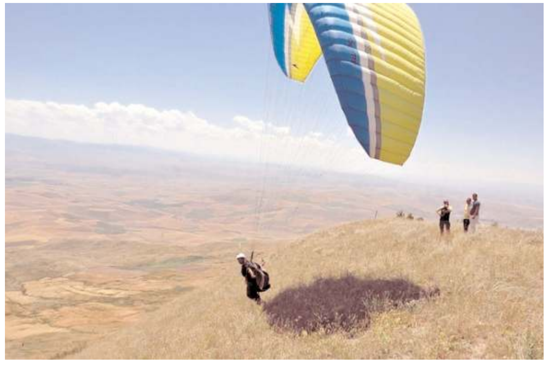
30 Ağustos Zafer Bayramı etkinlikleri kapsamında yamaç paraşütü etkinliği düzenlenecek.

"Kadına Şiddet İnanlık Suçudur" adlı afiş asılarak şiddet veya şiddet tehdidinin önlenmesi amacıyla Jandarma'nın 7/24 görevde olduğu vatandaşlara hatırlatıldı. (Haber Merkezi)