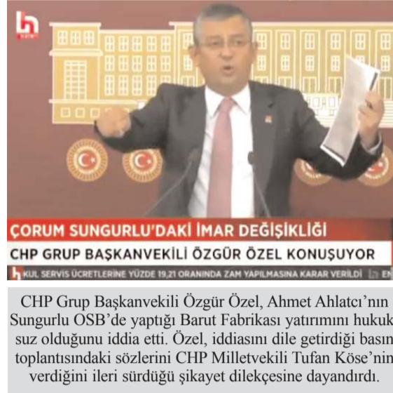
ÇORUM SUNGURLU'DAKİ İMAR DEĞİŞİKLİĞİ CHP GRUP BAŞKANVEKİLİ ÖZGÜR ÖZEL KONUSUYOR

Başvuru süreci Haziran'da doluyordu, ilana çıkmayınca ihtar çekiyor. Bunu nasıl işleme almazsınız. Bu sefer işleme alıyorlar. Ama cevabı 1 Temmuz'dan 11 Ağustos'a kadar bekletip, 11 Ağustos'ta diyorlar ki