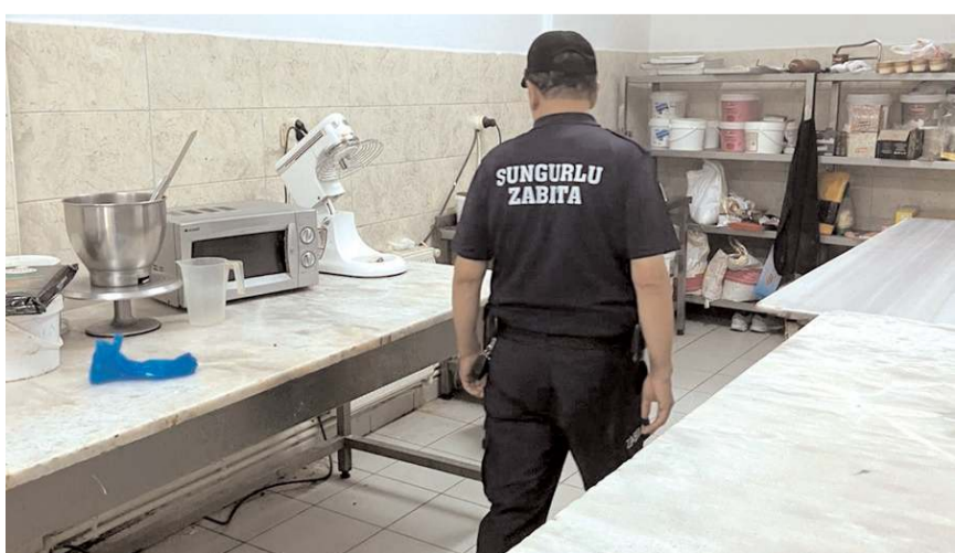
Ekipler, imalathaneden incelemede bulunurken...