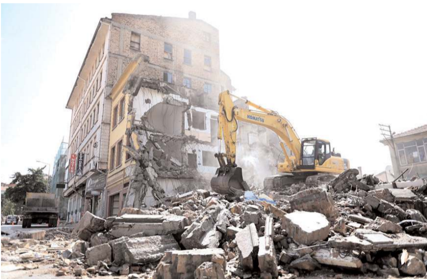
Yıkım çalışmalarından bir görüntü...