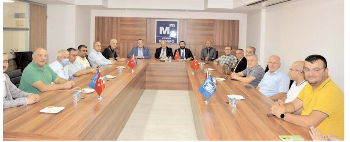
Ziyarette mesleki sorunların ve çözüm önerilerinin de konuşuldu