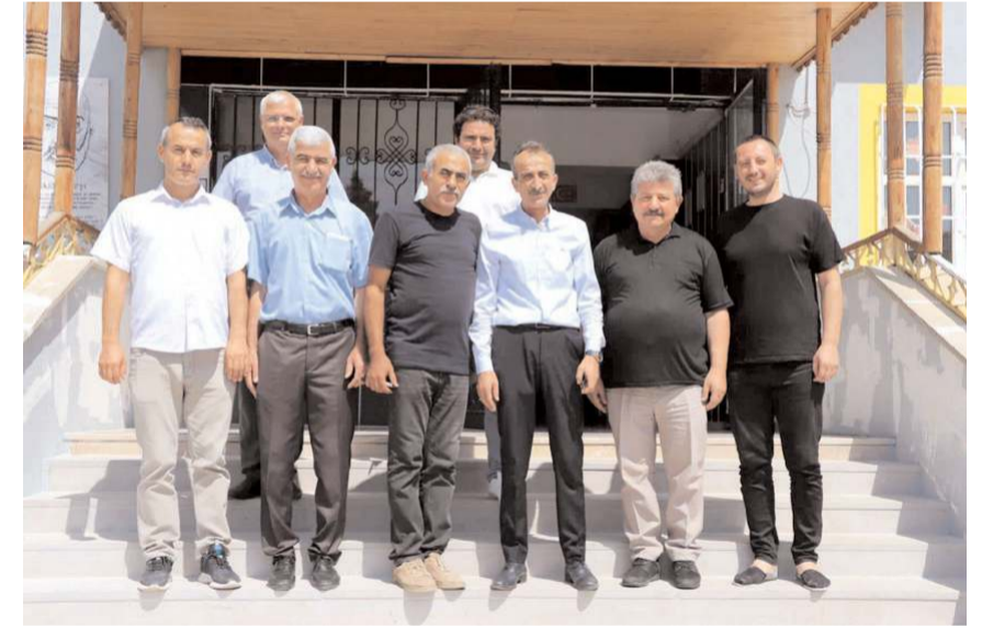
Kodek, okul idareci öğretmenleri ile birlikte...