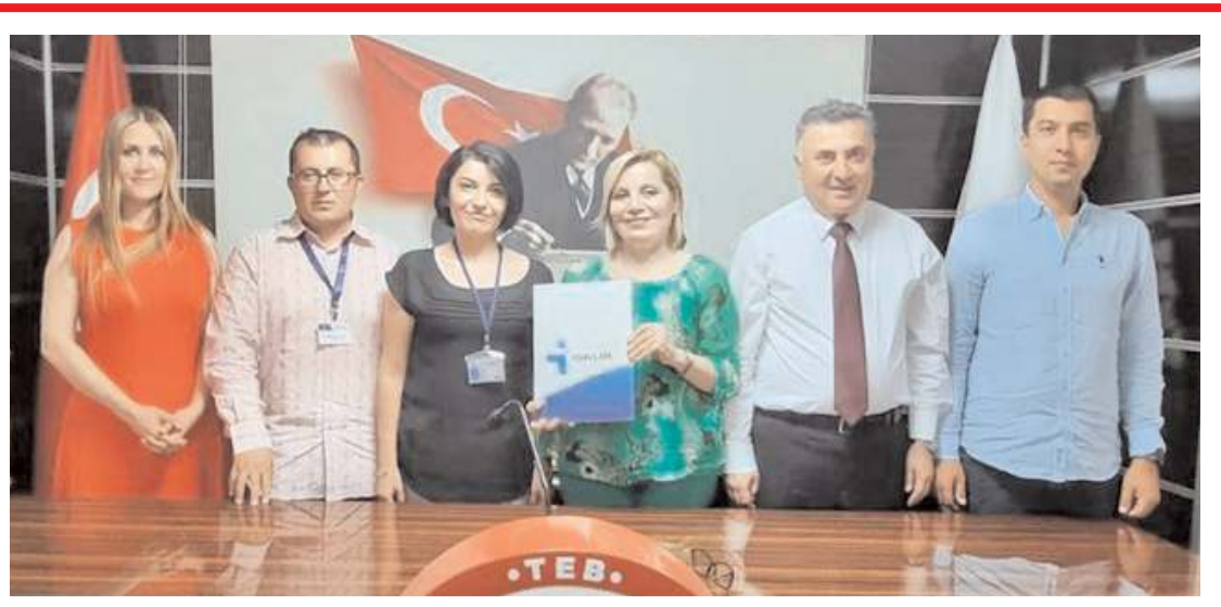
Eczacı Odası yönetimi eczacıların ekonomik olarak güçlendirilmesi için taleplerini ilettiler.