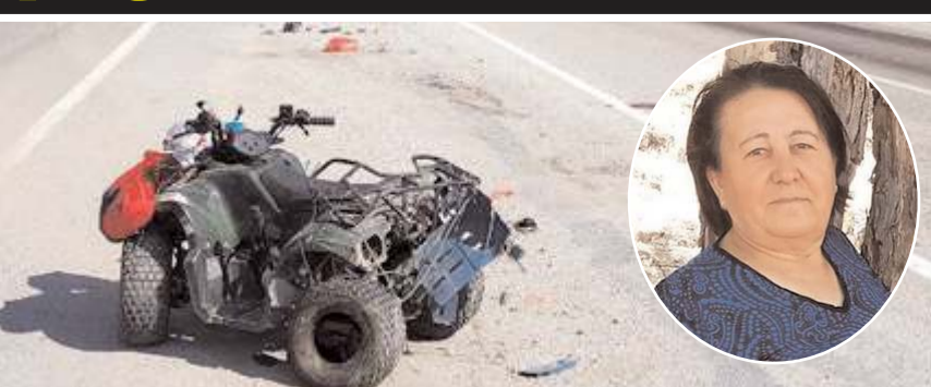
Kaza yerinden bir görüntü...

■ Çorum'un Alaca ilçesinde tırın çarptığı ATV sürücüsü yaşamını yitirdi. * HABERİ 3'DE