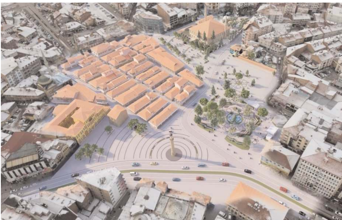
Çorum, 14 bin m2'lik yeni bir meydana kavuşacak

Çorum Belediyesi, Ulu Camii etrafında kamulaştırdığı binaların yıkımına başladı.