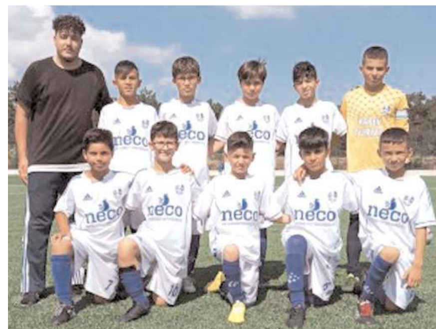
Çeyrek final maçını kazanarak yarı finale yükselen Mimar Sinan Gençlikspor

Turnuvada yarın saat 16'da Mimar Sinan ile Mavi Ay Gençlikspor üçüncülük dördüncülük maçında karşılaşacak. Bu maçın ardından ise saat 17'de Çorum İdman Ocağı ile Akkent takımları şampiyonluk için karşılaşacaklar.