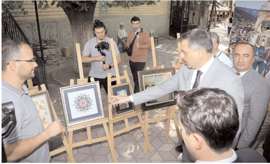
El sanatları sergisi büyük ilgi gördü.