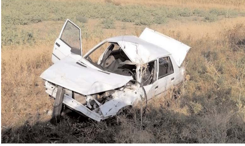
Kontrolden çıkan otomobil tarlaya uçtu.