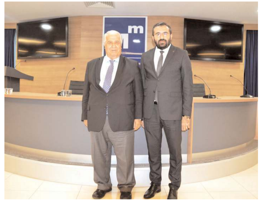
Eski Devlet Bakanı Masum Türker, Çorum SMMMO Başkanı Ceyhan Baran'ı ziyaret etti.

SMMMO Başkanı Ceyhan Baran da Masum Türker ve beraberindeki heyete ziyaretlerinden dolayı teşekkür etti.