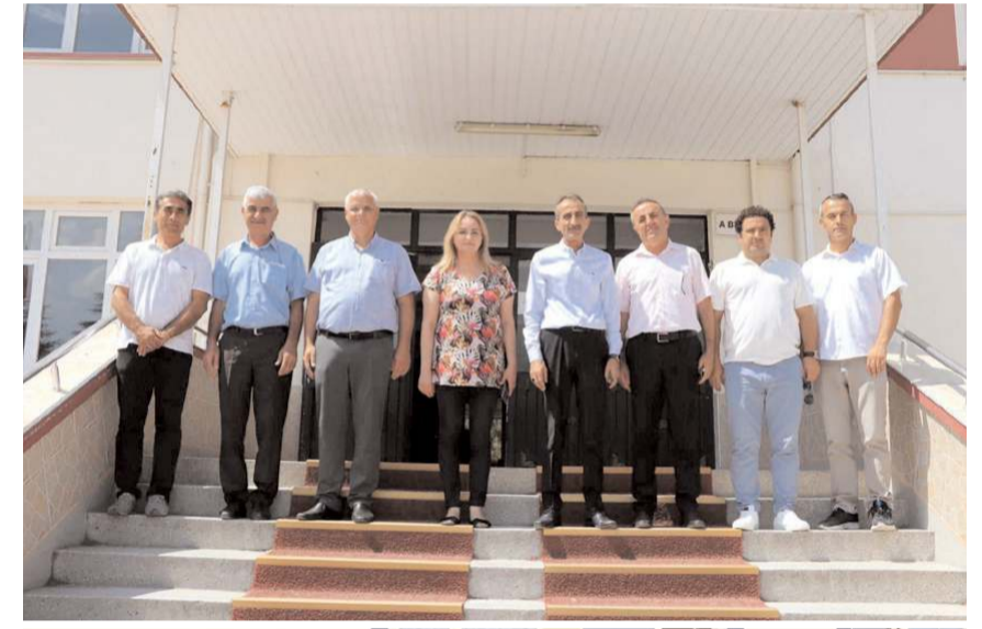
Yunus Emre İlkokulu yeni eğitim-öğretim yılına hazır.

Öğrencilerin okullarında kendilerini mutlu ve güvende hissetmelerinin ana hedefleri olduğunu ifade eden Kodek, "5 Eylül'de başlayacak uyum haftasının ardından 12 Eylül tarihinde tüm öğrencilerimizi okullarına kavuşturacağız. Bu tarihe kadar okullarımızın tüm fiziki hazırlıklarının tamamlanması ile öğretmen ve öğrencilerimiz yeni eğitim öğretim yılına rahat ve konforlu bir şekilde başlamış olacaklar" dedi. (Haber Merkezi)