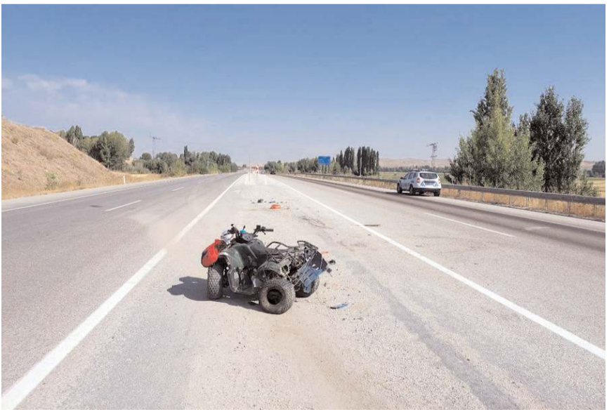
Kaza yerinden bir görüntü...