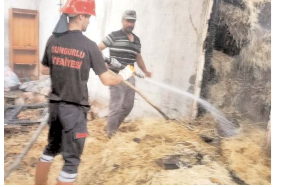
Yangını çevrede bulunan evlere sıçramadan söndürüldü.

Olayla ilgili olarak başlatılan tahkikatın devam ettiği öğrenildi. (İHA)