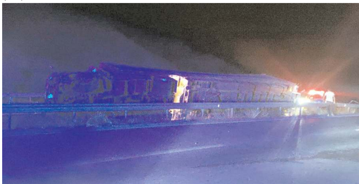
Bariyerlere çarpan tır böyle devrildi.