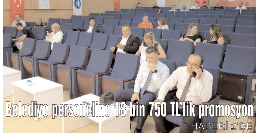
Belediye personeline 18 bin 750 TL'lik promosyon