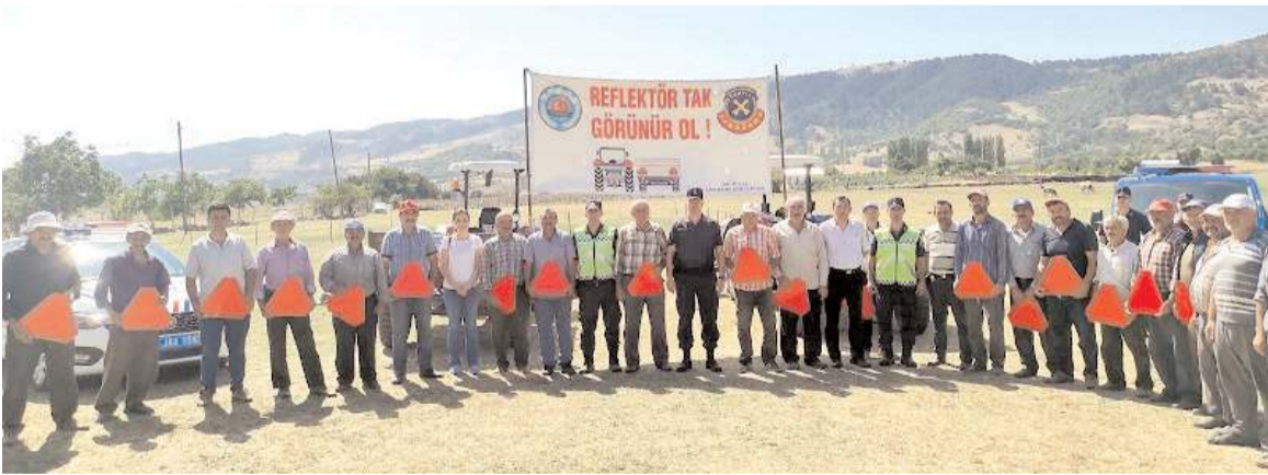
Jandarma ekipleri traktör sahiplerine reflektör dağıttı.