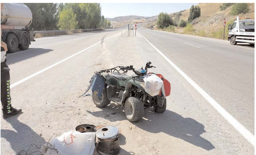
ATV sürücüsünün ölümüne neden olan tır sürücüsü gözaltına alındı.

DEFTER ÇEŞİTLERİ ÇANTA ÇEŞİTLERİ KIRTASIYE ÇEŞİTLERİ A'DAN Z'YE SORU BANKALARI TÜM KİTAP ÇEŞİTLERİ NE ALIRSAN AL YARISINI ÖDE