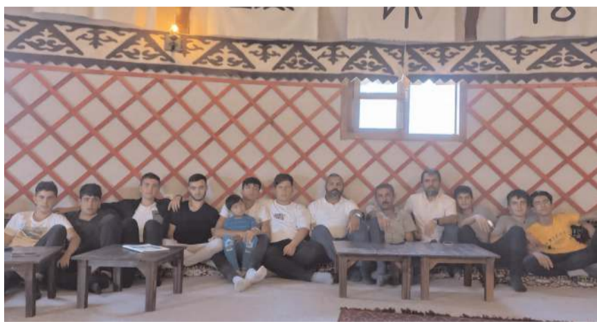
Öğrenciler Oba'da hoşça vakit geçirdi.