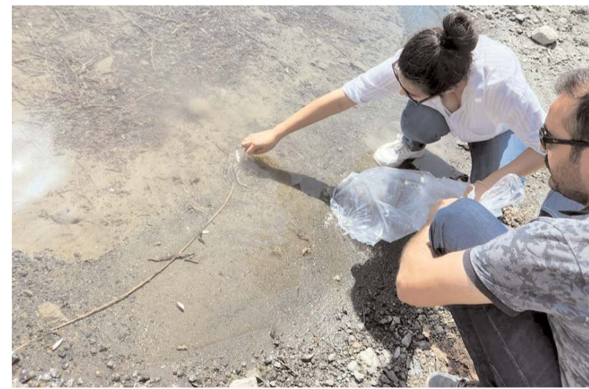
Tarım Müdürlüğü ekipleri sazan balığı yavrularını gölte bırakırken görülüyor.

Yavru balıkların anaç hale gelmesi için yaklaşık 3 yıllık bir süre gerektiğinden özellikle balıklandırma yapılan göletlerin korunması ve sürdürülebilir avcılık yapılması gerektiği vurgulandı. (İHA)