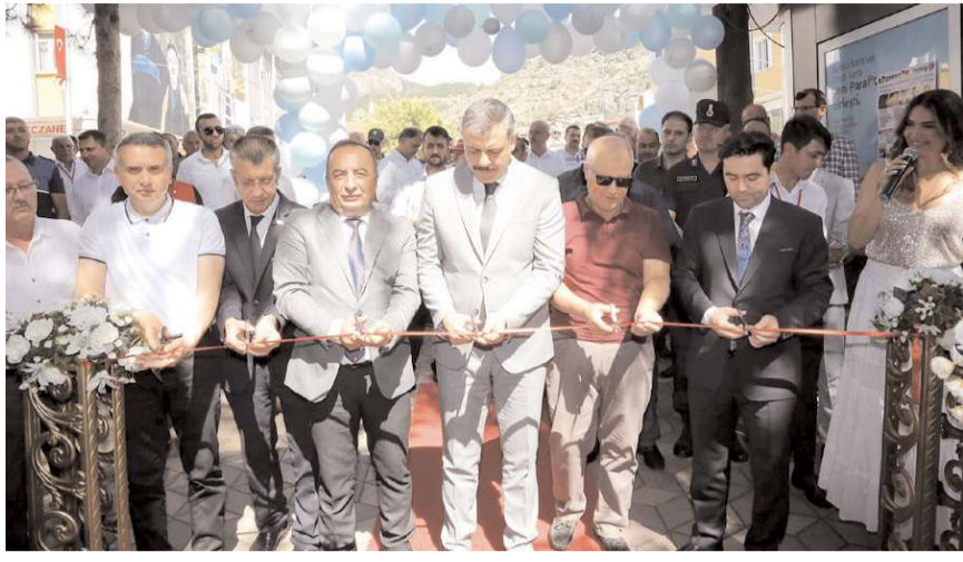
Festiavalin açılış kurdelesini kesirken...