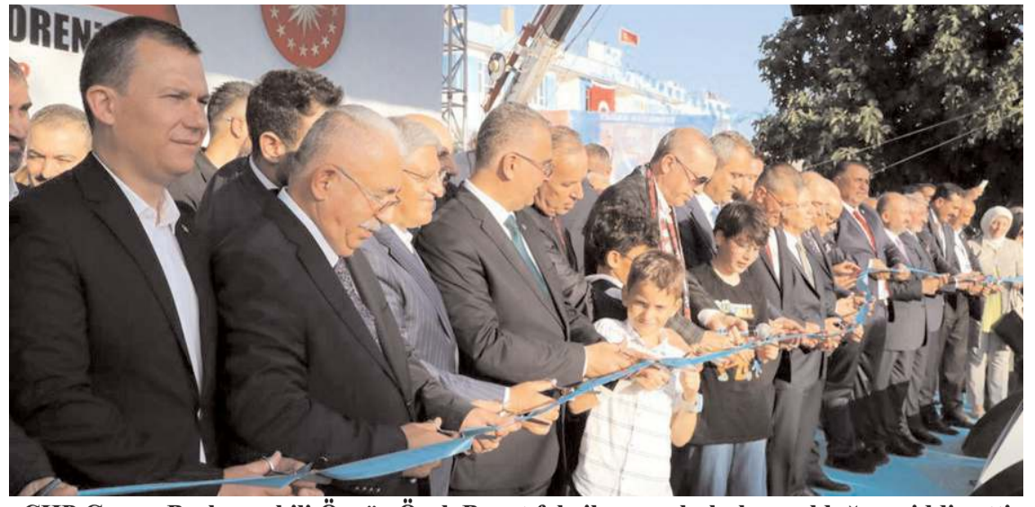
CHP Gurup Başkanvekili Özgür Özel, Barut fabrikasının hukuksuz olduğunu iddia etti

Hakimiyet, yaralı askerimiz başta olmak üzere tedavi gören bütün askerlerimize Allah'tan şifa diler.