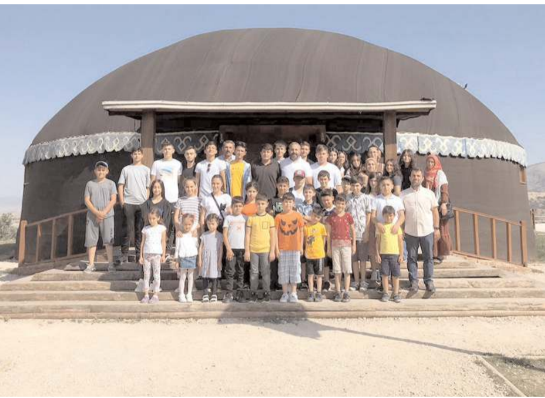
Laçın Fatih Camii yaz Kur'an Kursu öğrencileri Çorumlu Obası'nı gezdi.