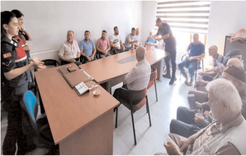
Eğitime katılanlara KADES uygulaması anlatıldı.

İl Jandarma Komutanlığı ve Aile ve Sosyal Hizmetler İl Müdürlüğü ekipleri tarafından "Kadına Yönelik Şiddetle Mücadelede 5 Milyon Erkeğe Farkındalık Eğitimi" kapsamında Düvenci Beldesi'nde yaşayan erkek vatandaşlara bilgilendirme yapıldı.