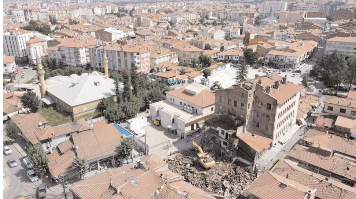
Çorum Belediyesi tarihi meydan için yıkım çalışmalarına devam ediyor.