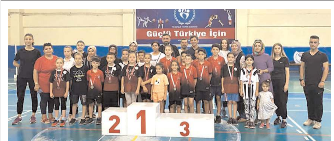
Turnuva sonunda dereceye giren sporculara ve misafirler ödül töreni sonrasında toplu halde