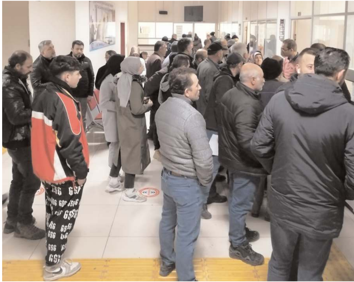
EYT düzenlemesinin açıklanmasının ardından SGK İl Müdürlüğü'nde yoğunluk yaşandı.