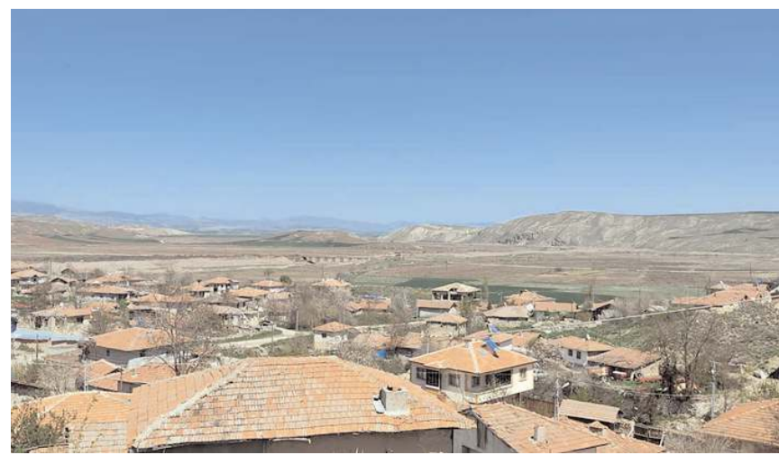
Türkiye Petrolleri Anonim Ortaklığı, 1992 yılında köyde iki adet kuyu açmış.

■ Türkiye Petrolleri Anonim Ortaklığı (TPAO) Bayat'a bağlı Sağpazar köyünde 1992 yılında Sağpazar-1 ve Sağpazar-2 adında iki adet petrol kuyusu açmış ve kuyular yeterli rezerv bulunmadığı gerekçesiyle kapatılmış. Vatandaşlar kapatılan petrol kuyularının yeniden araştırılmasını istiyorlar. * HABERİ 6'DA