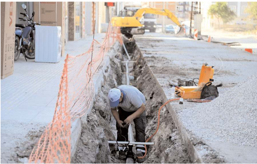
Belediye 2022 yılında 29 bin metre içmesuyu hattı çalışması yaptı.