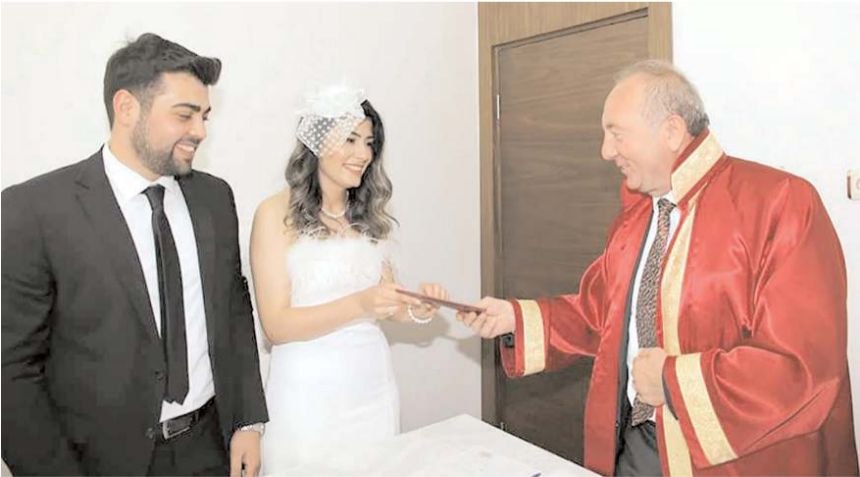
2022 yılında şuana kadar 275 çift nikah kıydırdı.

Başkan Şahiner, Sungurlu Belediyesi olarak nikahları kıyılan çiftlerin tamamına yakına o günün anısı olan fotoğraflarını hediye ettiklerini ifade etti. (İHA)