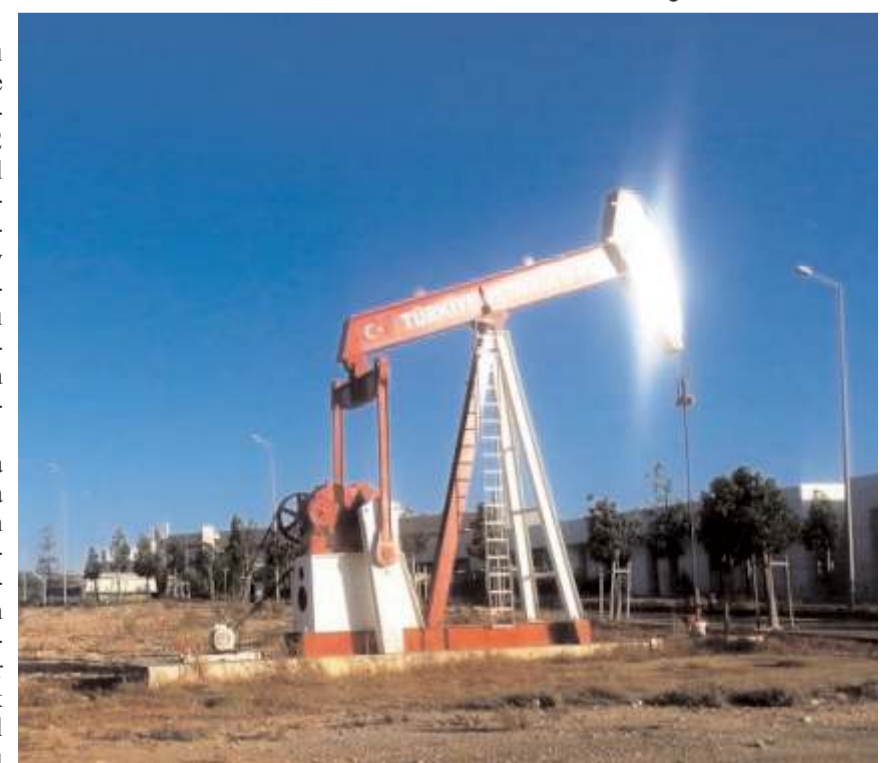
Köyde Sağpazar-1 ve Sağpazar-2 adında iki adet petrol kuyusu açılmış.

Bu konuda Çorum'da siyasilere girişimde bulunması gerektiğini ifade eden vatandaşlar, "İlçe ve il ekonomisine vereceği katkının yanında ülke ekonomisine de vereceği büyük katkıyı da düşünürsek