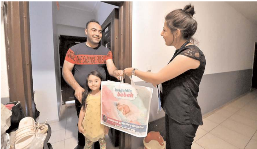
Çorum Belediyesi, 'Hoş Geldin Bebek' projesi kapsamında bebeği olan ailelere hediye veriyor.