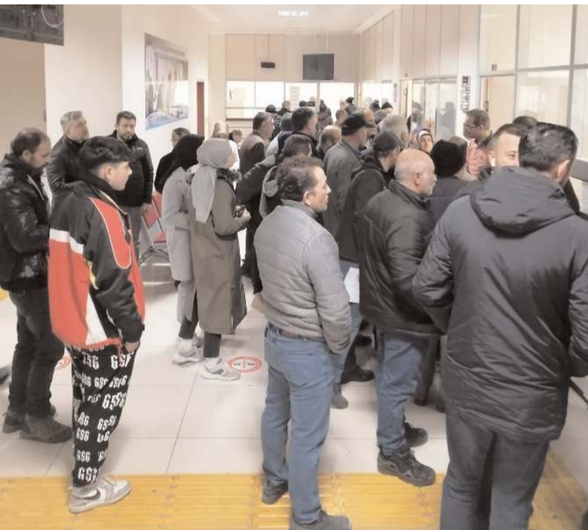
EYT düzenlemesinin açıklanmasının ardından SGK İl Müdürlüğü'nde yoğunluk yaşandı.