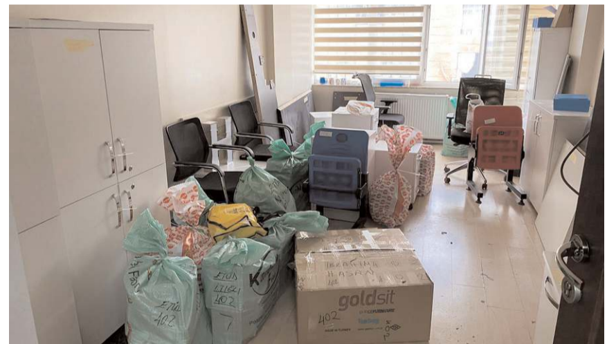
Belediyede yeni binaya taşınma işlemleri dün sabah başladı.

Taşınma işlemi hafta sonu ve yılbaşından sonra da devam edecek. Taşınma işlemi sırasında belediyede işi olan vatandaşların mağdur edilmemesi için her türlü önlemin alındığı belirtildi. (Haber Merkezi)