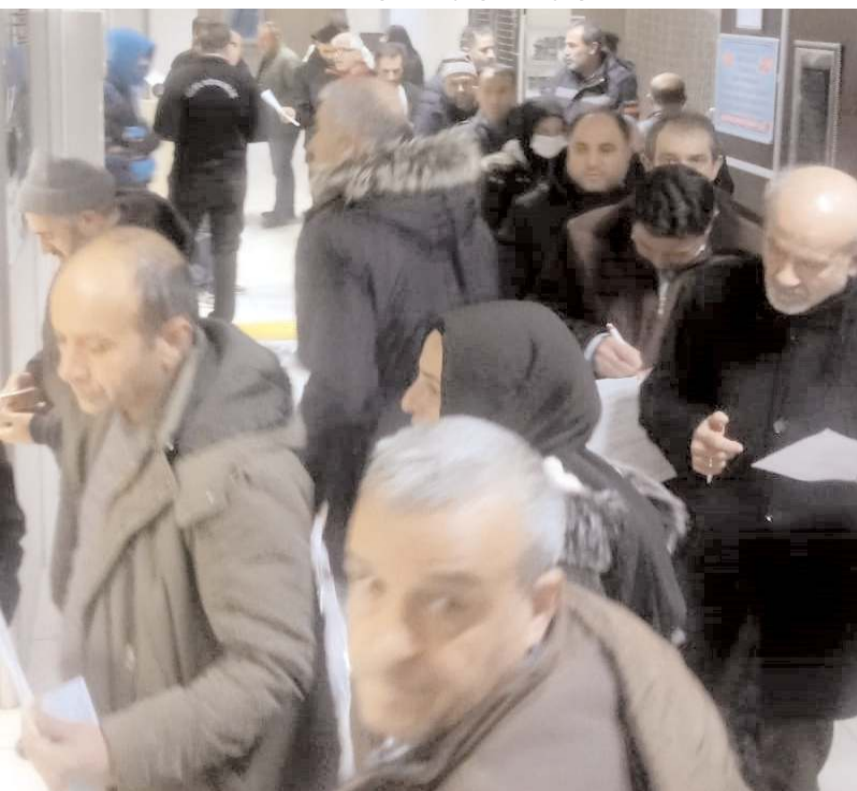
Askerlik borçlanmalarının hesap edilmesi ve oluşacak haklardan yararlanmak isteyen vatandaşlar, SGK'nın koridorlarını doldurdu.