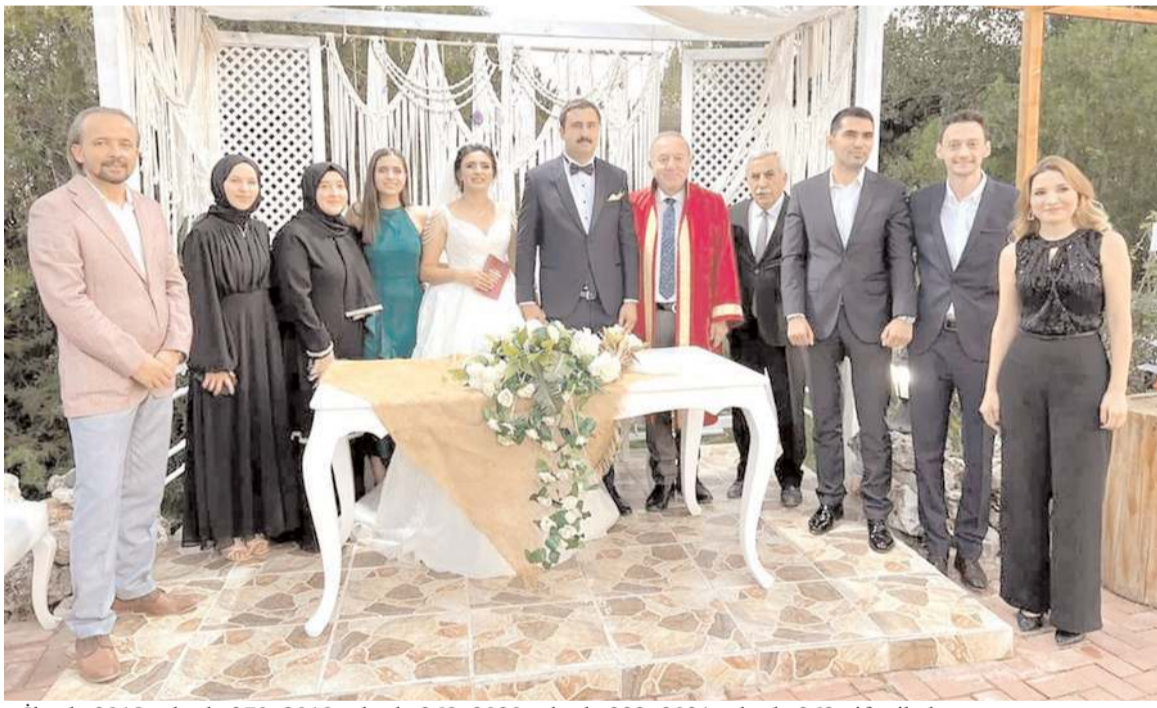
İlçede 2018 yılında 270, 2019 yılında 268, 2020 yılında 223, 2021 yılında 262 çift nikah masasına oturmuş.

Almanya'daki çalışmayan işçi Ahmet. Türkiye'deki çalışan işçi Ahmet'ten aylık geliri itibarıyla çocuk paralarını katmıyorum dikkat edin. 1280 kez daha fazla huzur ve refah içinde yaşıyor. Ama benim saf kardeşim diyor ki doğru ya... 1 mark 1200 lira bizde benzin 1100 lira. E... bizde benzin daha ucuz. Saf olma. Kendine gel. Çünkü ekonomide kaide alım gücüyle ölçülür." (Haber Merkezi)