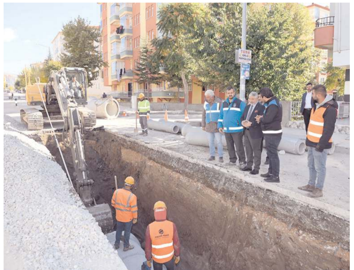
Belediye 2022 yılında 8 bin metre yağmursuyu şebekesi döşedi.