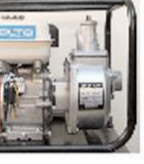
2'lik Su Motoru