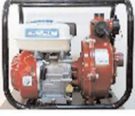
2'lik Yüksek İrtifa