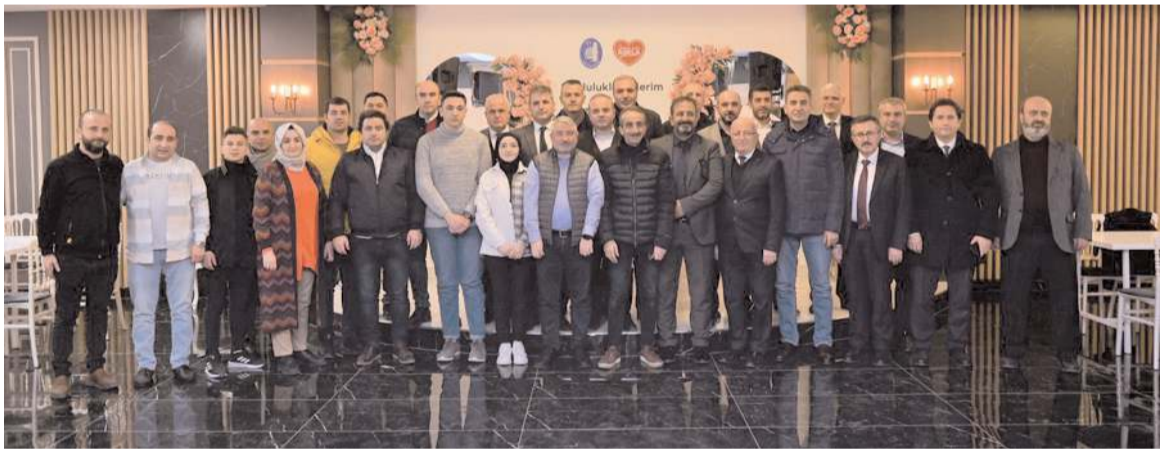
İmza töreninin ardından toplu hatıra fotoğrafı çekildi.