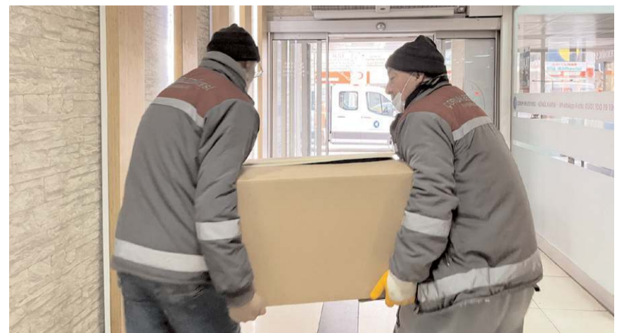
Taşınma işlemi yıl başından sonra da devam edecek.