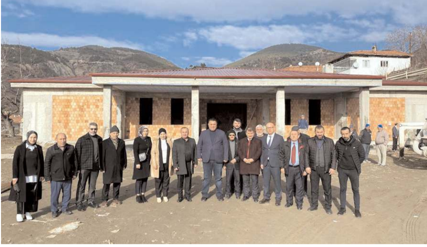
Milletvekili Oğuzhan Kaya, ilçede yürütülen projeleri inceledi.

■ AK Parti Çorum Milletvekili Av. Oğuzhan Kaya, İskilip'in AK Parti hükümeti ile birlikte gelişme yaşadığını belirterek, millete hizmet yolunda büyük bir gayretle eser siyaseti yapmaya devam ettiklerini söyledi. * HABERİ 8'DE