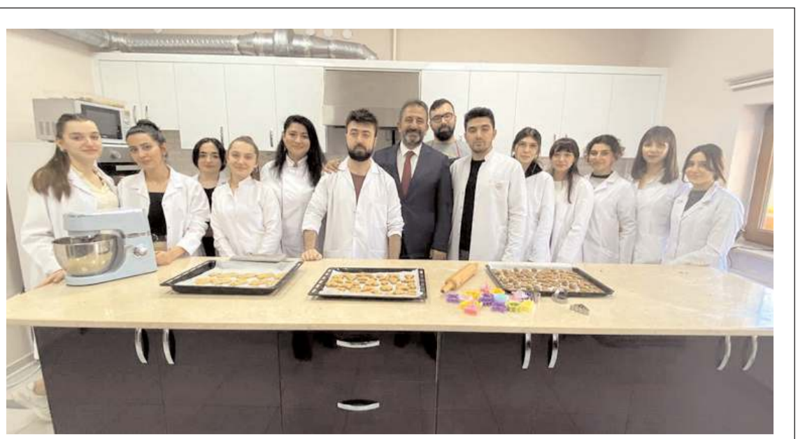
Hitit Üniversitesi Beslenme ve Diyetik kulübü öğrencileri Çorum Belediyesi Melikgazi Kültür Merkezinde kurabiye yaptı.