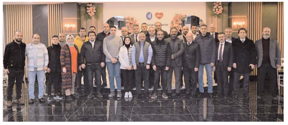
İmza töreninin ardından toplu hatıra fotoğrafı çekildi.