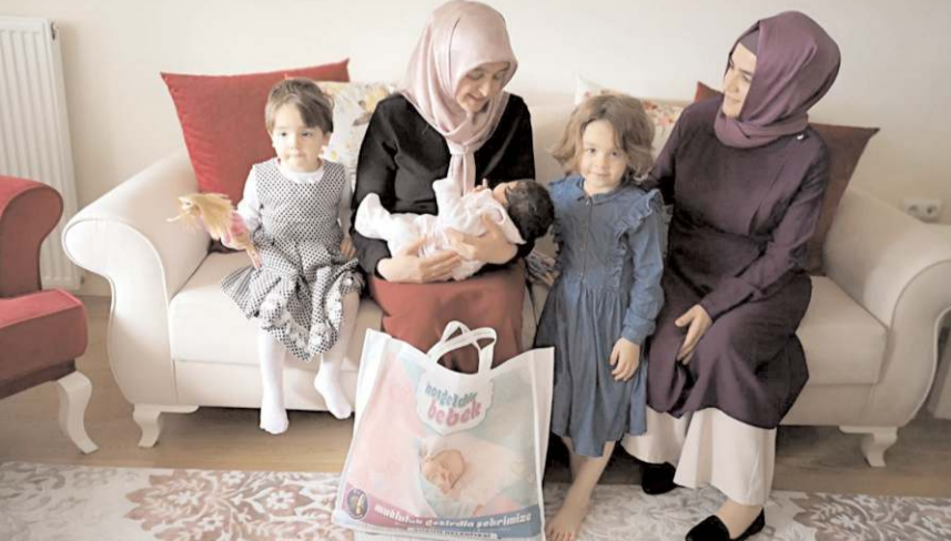
'Hoş Geldin Bebek' uygulaması kapsamında 2019 yılından bu yana 10 bin 308 aile ziyaret edildi.