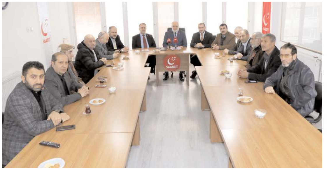
Saadet Partisi Genel İdare Kurulu Üyeleri bir dizi ziyaretlerde bulunmak üzere Çorum'a geldiler.