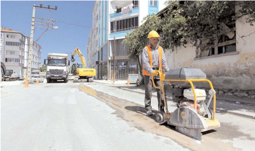
Belediye bu yıl 19 bin metre kanalizasyon çalışması yaptı.