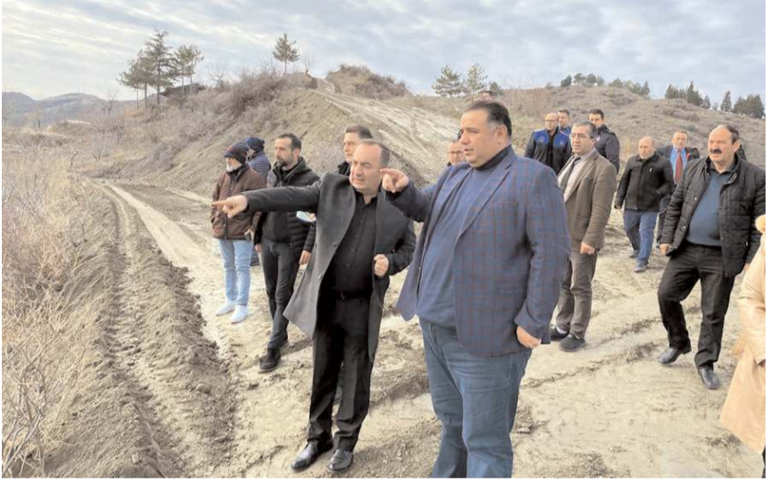
Milletvekili Oğuzhan Kaya, ilçede yürütülen projeleri inceledi.

Bilsen ve E-Sınav Merkezi'nin açıldığını, İskilip Kalesi'nin restorasyon çalışmasının devam ettiğini, İskilip Belediyesine Enerji Bakanlığından 100 ton asfalt bütüm yardımı yapıldığını kaydeden Milletvekili Kaya, millete hizmet yolunda büyük bir gayretle eser siyaseti yapmaya devam ettiklerini belirtti. (Haber Merkezi)