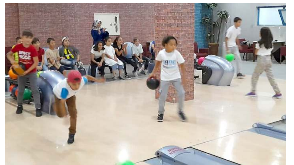
Judocular Buhara Kültür Merkezinde Bowling oynayarak stres attılar