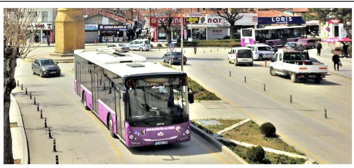
Çorum Belediyesi toplu ulaşımda kullandığı araç sayısını 53'e yükseltti.