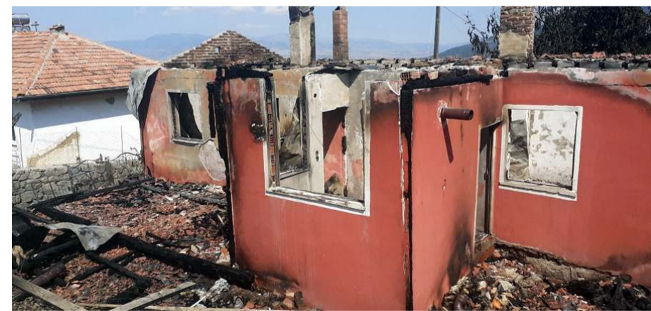
Jandarma yangınla ilgili inceleme başlattı.