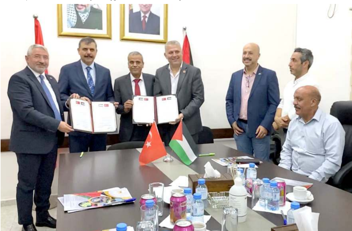
Kardeş şehir protokolünün imzalanmasının ardından günün anısına toplu fotoğraf çekildi.