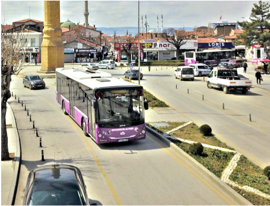
Çorum Belediyesi toplu ulaşımda kullandığı araç sayısını 53'e yükseltti.

Toplu ulaşımda belediyenin payının artmasının vatandaşlara hizmet kalitesi olarak döneceğinin altını çizen Yağbat, "Aldığımız 23 otobüsle birlikte belediyemizin toplu ulaşımda 48 otobüs ve 4 adet minibüsü olmak üzere toplamda 52 aracı oldu. Özellikle sistemi satın aldığımız günden sonra toplu ulaşımda yaşanan rahatlama ve kalite artışını hemşehrilerimiz bu 23 aracın daha belediyemiz tarafından satın alınmasından sonra daha da fazla hissedecekler. Toplu ulaşımda geldiğimiz son noktada toplamda hatlarda çalışan 72 otobüs ve 4 minibüsün 53 tanesi belediyemizin 23 tanesi de Hitit Ulaş A.Ş.'nin. Hemşehrilerimiz daha iyi hizmet vermek için gece gündüz demeden aşıkla çalışıyoruz" şeklinde kaydetti. (Haber Merkezi)