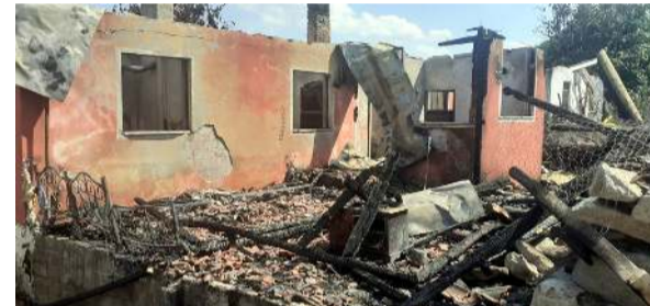
Olay, gece saatlerinde Dodurga'ya bağlı Tekke köyde meydana geldi.