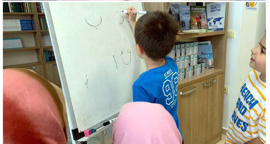
Çocuklar hafta içinde pazartesi, salı, çarşamba ve perşembe günleri, 09.00-11.45 saatleri arasında Çorum İHH Ofisinde eğitim görüyor.