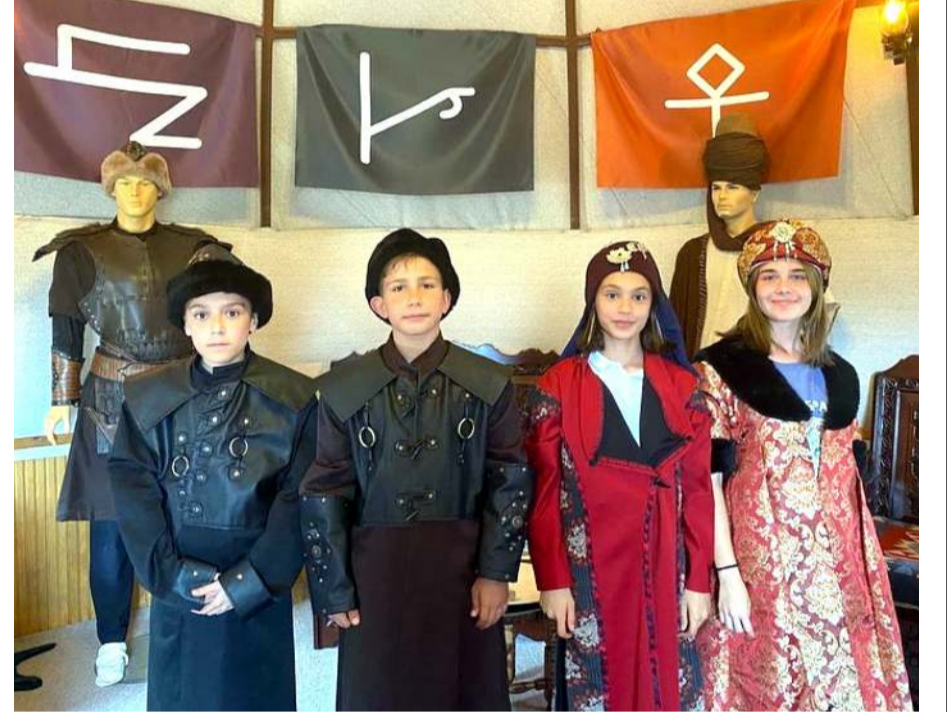
Judocular Çorum Obasında geleneksel kıyafetler giyerek poz verdiler