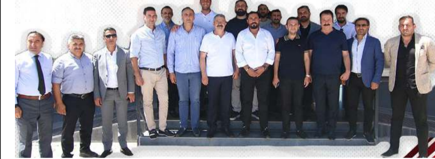
Van Ticaret ve Sanayi Odası'ndan Vanspor'a 500 bin lira destek haberinin açıklaması

VANTSO Başkanı ve Yöneticilerine desteklerinden ve saygılarından dolayı teşekkür eder, saygılarımızı sunarız.