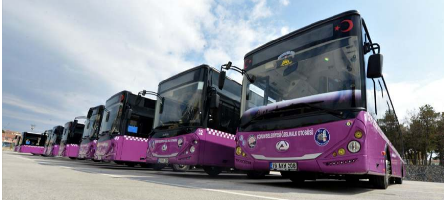
Belediye, Hitit Ulaş A.Ş.'nin 23 adet 12 metrelik AKIA marka otobüsünü satın aldı.