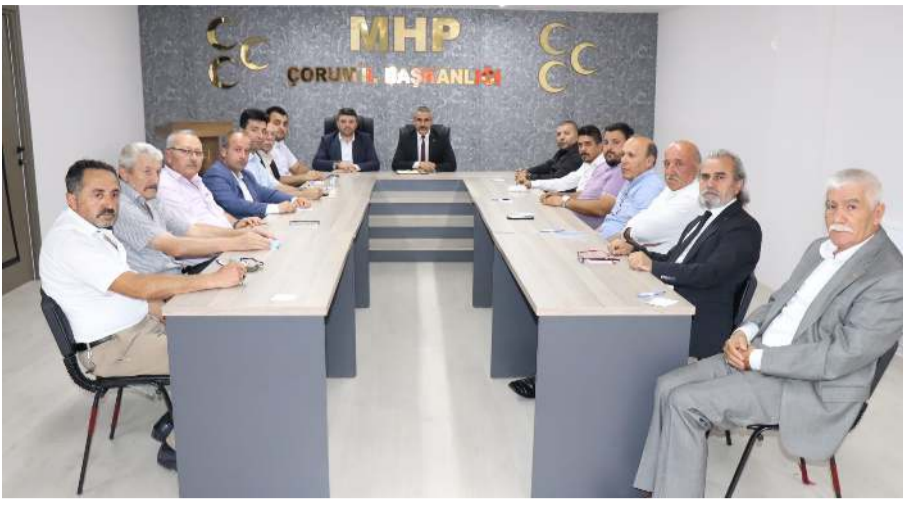
Milliyetçi Hareket Partisi İlçe Başkanları ortak açıklama yaptılar.