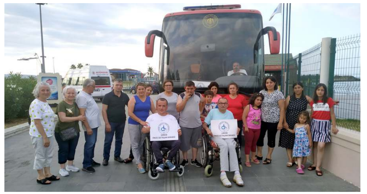
Çorum Engelsiz Yaşam Derneği'nin Samsun gezisine 25 kişi katıldı.