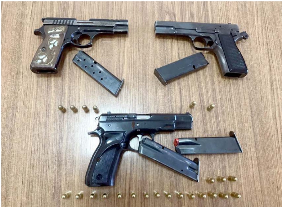
3 şüpheli üzerlerinde çeşitli çap ve markalarda 3 adet ruhsatsız tabanca ele geçirildi.

ruhsatsız tabanca, 120 ruhsatsız av tüfeği, 52 adet kurusıkı tabanca, 128 kesici alet olmak üzere toplam; 438 suç aleti ele geçirilmiş olup, ilgili şahıslar hakkında gerekli adli ve idari işlemlerin ardından Türk ceza kanununun 6136 sayılı maddesine muhalefet etmek suçunu adliye sevk edildiler. (İHA)