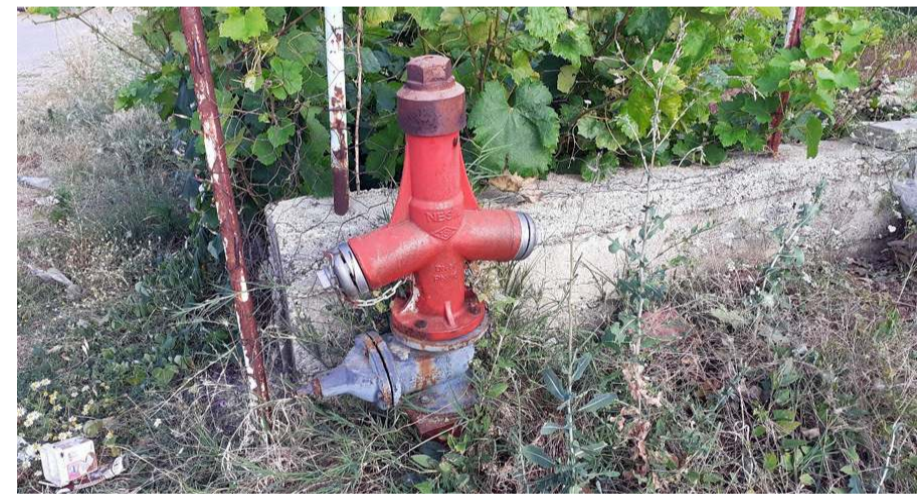
Yangın hidrant sisteminin çalışmadığı iddia edildi.