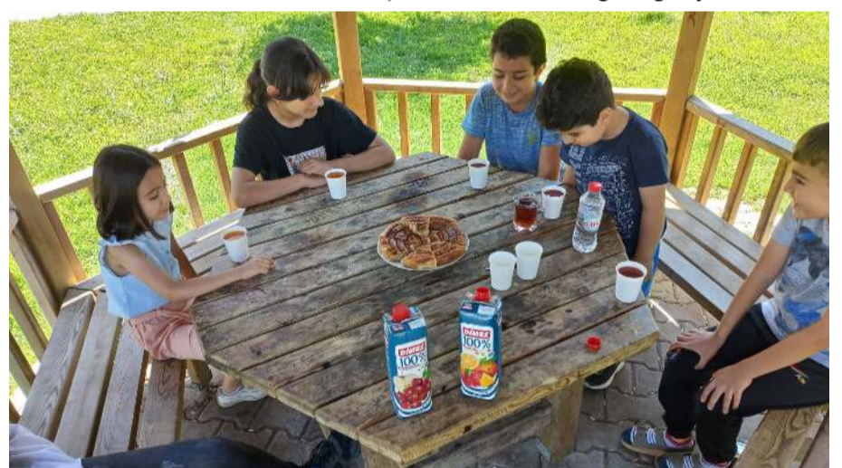
Çocuklara yönelik piknikler yapılıyor.