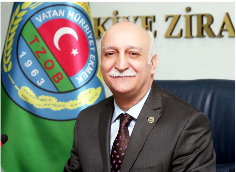
Türkiye Ziraat Odaları Birliği Genel Başkanı Şemsi Bayraktar

Temmuz ayında, haziran ayına göre gübre fiyatları amonyum sülfatta yüzde 5,2 ve kalsiyum amonyum nitratla yüzde 2,7 azaldığını bildiren Şemsi Bayraktar, "DAP gübresinde yüzde 6,8, 20.20.0 kompoz gübresinde yüzde 3,2, üre gübresinde yüzde 2,3 artış gösterdi. Geçen yılın Temmuz ayına göre ise son bir yılda üre gübresi yüzde 229, kalsiyum amonyum nitrat gübresi yüzde 217, DAP gübresi yüzde 194, amonyum sülfat ve 20.20.0 kompoz gübresi yüzde 190 oranında arttı. Mazot fiyatı aylık olarak yüzde 10,8 azalırken, son bir yıla göre ise yüzde 235 oranında arttı. Besi yemi Temmuz ayında haziran ayına göre yüzde 4,3, süt yemi ise yüzde 2,4 azalırken, aynı yıla göre ise bir yüzde 116,6, 2,4 yemi ise yüzde 125,2 oranında arttı. Elektrik fiyatları son bir yılda yüzde 129,4 oranında arttı. Ziraî ilaç fiyatları ise yüzde 300'e varan oranlarda artış gösterdi. Girdi fiyatları üretim sezonu boyunca var olan yüksek seviyesini sürdürüyor. Yüksek fiyatlar yeni üretim sezonuna hazırlanacak çiftçilerimizi düşündürüyor. Üreticilerimizin geleceği görmelerini, üretimde kalmalarını sağlamak için girdiler makul fiyatlardan üreticilere ulaştırılmalı, girdi destekleri artırılmalı, ekimden önce destekler açıklanmalı ve en kısa sürede üreticilerimize verilmelidir" ifadelerini kullandı.