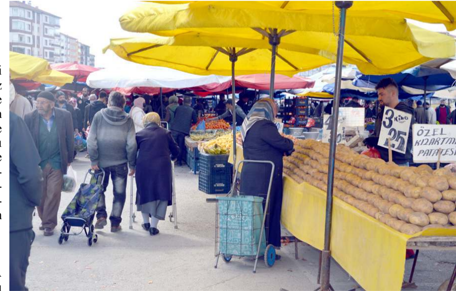
Yıllık enflasyon son 20 yılın zirvesine çıktı.

Ana harcama grupları itibarıyla 2022 yılı Temmuz ayında bir önceki aya göre en az artış gösteren ana grup yüzde -0,85 ile ulaştırma oldu. Buna karşılık, 2022 yılı Temmuz ayında bir önceki aya göre artışın en yüksek olduğu ana grup ise yüzde 6,98 ile sağlık oldu.