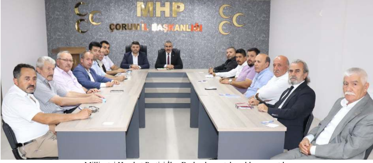
Milliyetçi Hareket Partisi İlçe Başkanları ortak açıklama yaptılar.

"Ülkücüyüm ama, teşkilatımın emrindeyim ama, liderimin çizgisindeyim ama, diye başlayan süslü cümlelerle sözde istifa ettiklerini açıklayan