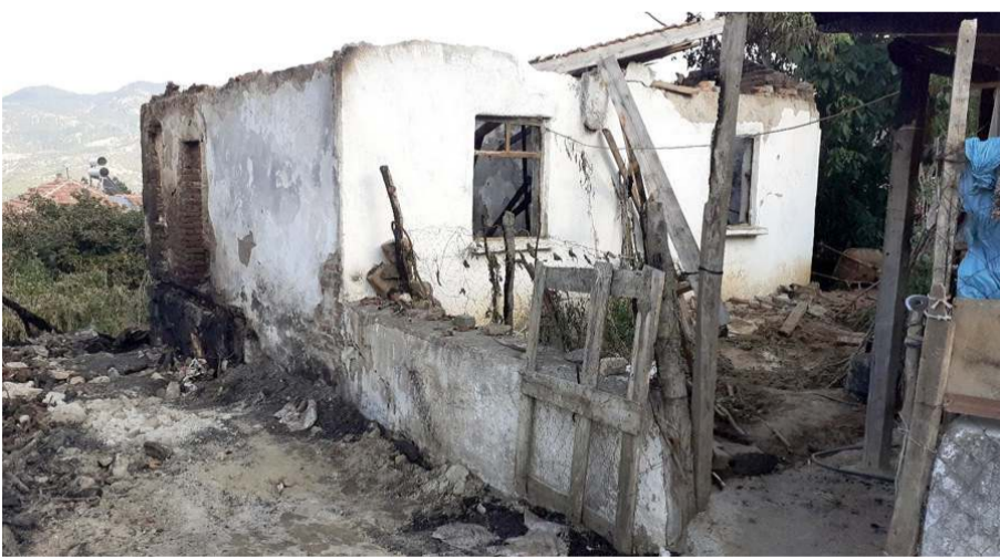
Yangından iki evde kül oldu.