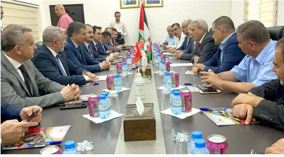
Ziyarete heyetler arası görüşmeler yapıldı.