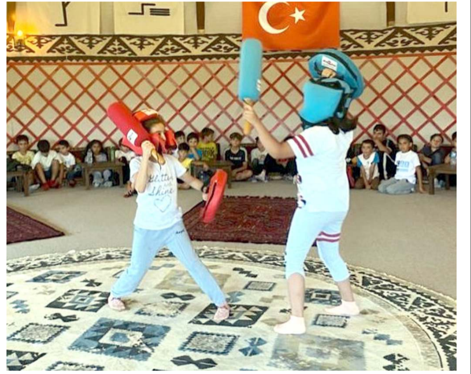
Oba çadırında minik judocular oyunlar oynadılar ve eğlenceli bir gün geçirdiler

Öğleden sonra ise Buhara Kültür Merkezinden Çorumlu Obasına geçen Judocular burda öğle yemeğinin ardından yürüyüş yolunda toplu olarak sporlarını yaptılar. Daha sonra obayı gezen Judocular burda Ok atıldılar, ebru sanatı öğrendiler ve oba içinde değişik oyunlar oynayarak güzel bir gün geçirdiler.