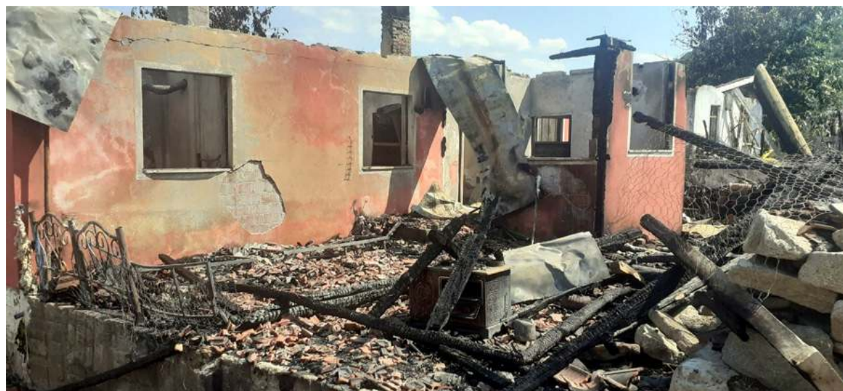
Olay, gece saatlerinde Dodurga'ya bağlı Tekke köyde meydana geldi.