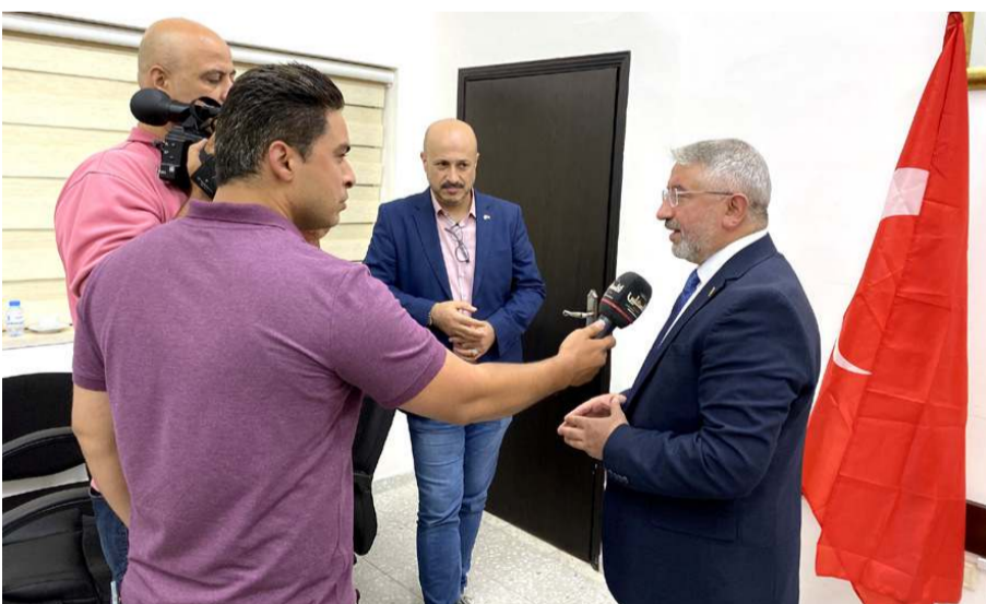
Toplantının sonunda Başkan Aşgın, Filistin basınına açıklamalarda bulundu.