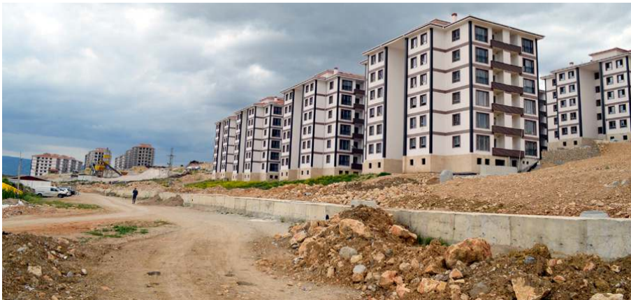
TOKİ'nin proje kapsamında 81 ilde en az 150 bin konut inşa etmesi bekleniyor.

TOKİ'nin proje kapsamında 81 ilde en az 150 bin konut inşa etmesi bekleniyor. Hali hazırda ev sahibi olmayan, herhangi bir mal veya mülk için hissedar olmayan dar gelirli vatandaşlar, uygun taksitlerle ev sahibi olacak. Kuraya katıldıktan sonra ev almaya hak kazanan vatandaşlar, 15 yıla varan vade seçenekleriyle kira öder gibi ev taksiti ödeyecek. Bu arada, satış yakınları ve gazileri için şahitlik özel kontenjan açılacak. Evler için belirlenmesi beklenen peşinat tutarı ise evin fiyatının yüzde 10'u civarında. 2+1 ve 3+1 şeklinde tasarlanması beklenen dairelerin fiyatları ise henüz netleşmedi.