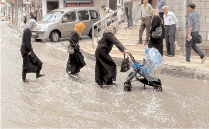
Yağışların sağanak ve gökgürültülü sağanak yağış şeklinde olması bekleniyor.

Genel Müdürlükten yapılan açıklamaya göre, yarın, rüzgarın, İç Ege, İç Anadolu Bölgesi, Batı ve Orta Akdeniz ile Karadeniz'in iç kesimlerinde güney ve güneybatı (lodos) yönlerden yer yer fırtına, Burdur, Isparta, Antalya'nın iç kesimleri, Af-