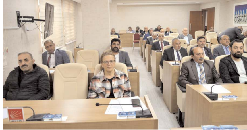
Toplantı gündem maddelerinin görüşülmesinin ardından sona erdi.