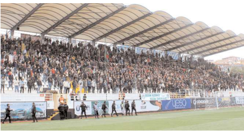
Kapılar açıldıktan sonra tribünü dolduran Çorum FK taraftarları