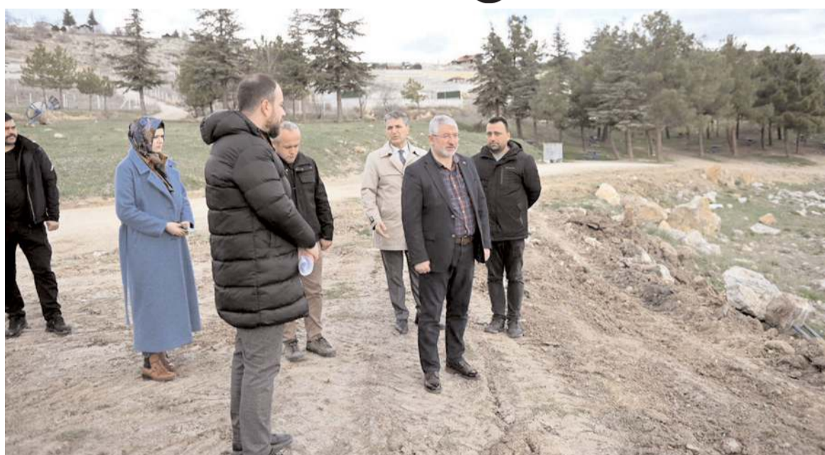
Proje kapsamında Çomar Barajı etrafına bisiklet ve yürüyüş yolları, otopark alanları, barbeküler ve yeni kameriyeler yapılacak.