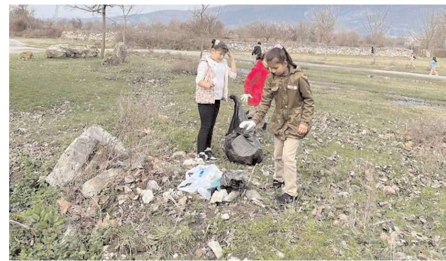
Öğrenciler yaptıkları çalışmayla çevre temizliğinin öneminde dikkat çektiler.