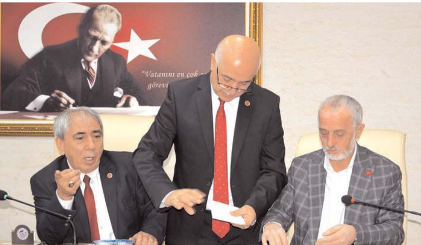
Toplantıda encümen ve komisyon üyelerinin seçimi yapıldı.

İl Genel Meclisi'nin Nisan ayı ilk toplantısında encümen ve komisyon üyeleri yeniden belirlendi.