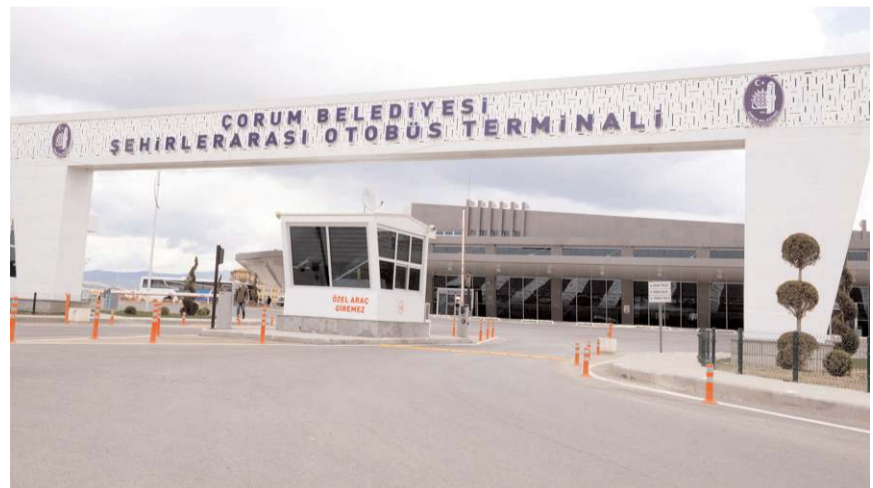
Geçen ay en fazla fiyat düşüşü yüzde 6,25 ile kara yolu ile şehirler arası yolcu taşımacılığında gerçekleşti.

Geçen ay en fazla fiyat düşüşü ise yüzde 6,25 ile kara yolu ile şehirler arası yolcu taşımacılığında gerçekleşti. Bunu yüzde 5,01 ile sebzeler, yüzde 3,79 ile kadın giyimi, yüzde 2,15 ile erkek giyimi, yüzde 1,91 ile diğer katı ve sıvı yağlar, yüzde 1,29 ile ta-