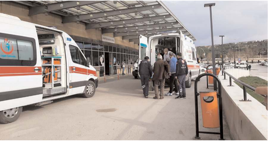
Kazalarda yaralananlar hastanede tedavi altına alındı.

Kazalarda yaralanan 3'ü ağır 9 kişi, sağlık ekiplerince Hitit Üniversitesi Erol Olçok Eğitim ve Araştırma Hastanesi ile kentte bulunan özel hastanelere kaldırıldı.(AA)