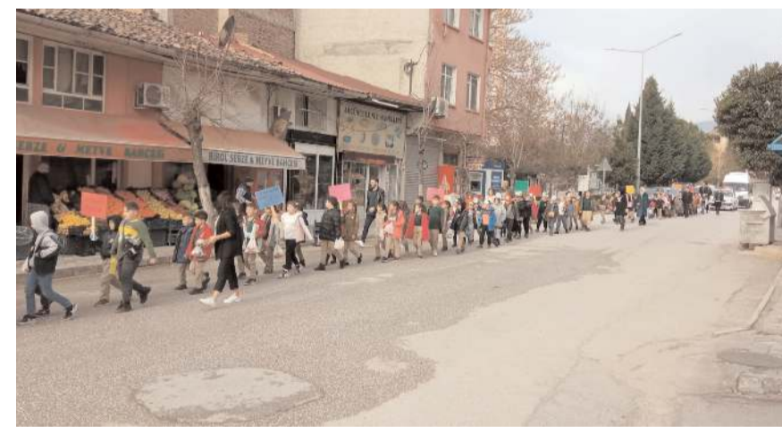
Saat Kulesi Meydanı'na kadar yürüyen öğrenciler, burada alkışlarla farkındalık oluşturdu.

Daha sonra Çayır mevkiine giden öğrenciler, burada çevre temizliği yapıp 32 poşet çöp topladılar.(AA)