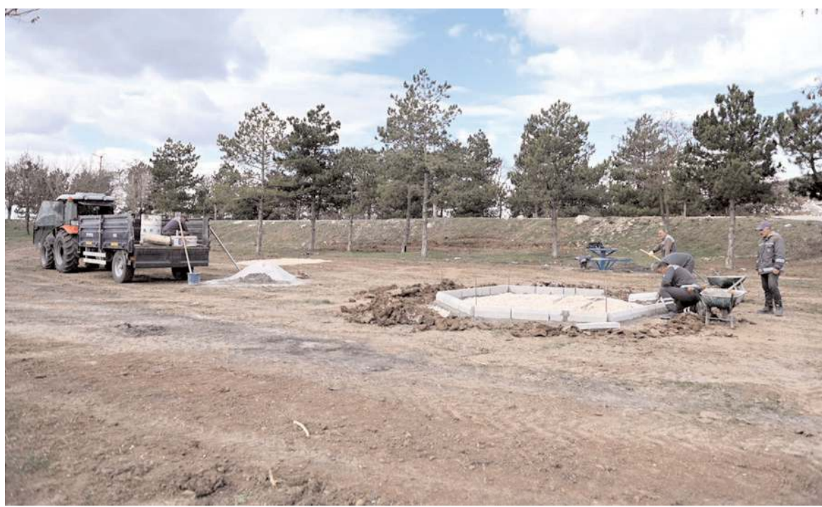
Çomar Barajı'nın etrafı yapılacak çalışmalarla kente yakışır bir hale getirilecek.