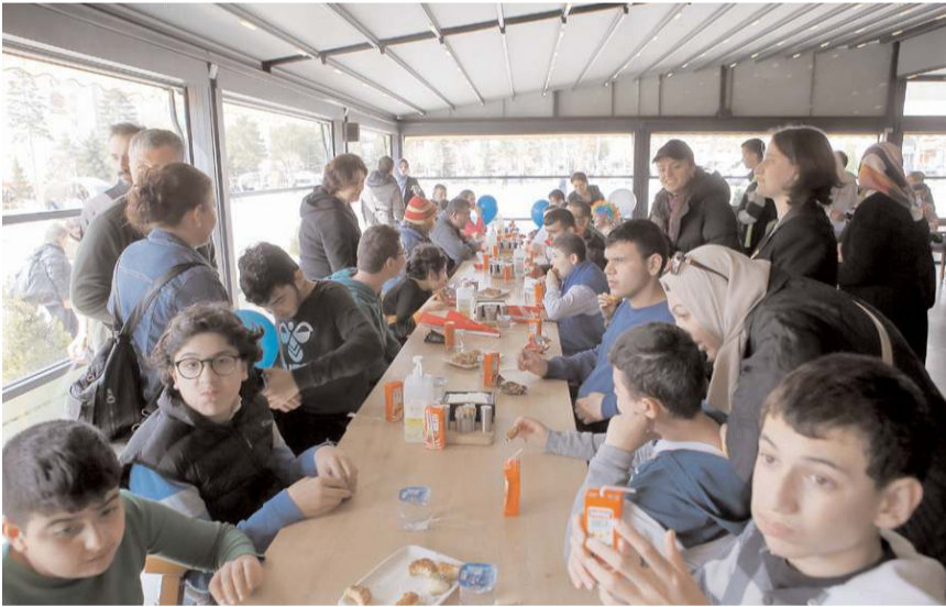
Yürüyüşün ardından Çorum Belediyesi Sosyal Tesisleri'nde otizmlilere ikramlarda bulunuldu.

Yürüyüşün ardından Çorum Belediyesi Sosyal Tesisleri'nde otizmlilere ikramlarda bulunuldu.