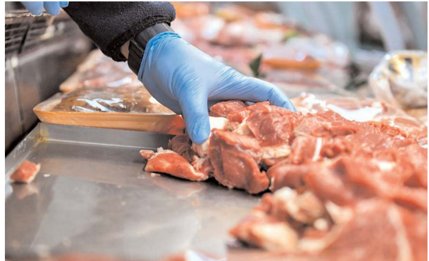
En fazla fiyat artışı yüzde 19,90 ile "dana eti"nde meydana geldi.

ze süt, yüzde 1,19 ile margarin, yüzde 0,96 ile katı yağlar, 0,89 ile kadın ayakkabısı izledi. En az fiyat düşüşü ise 0,42 ile şekerde görüldü. (Haber Merkezi)