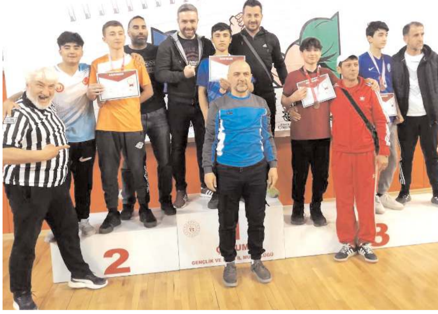
Sıkletlerinde dereceye giren sporculara düzenlenen törenle madalya ve belgeleri verildi