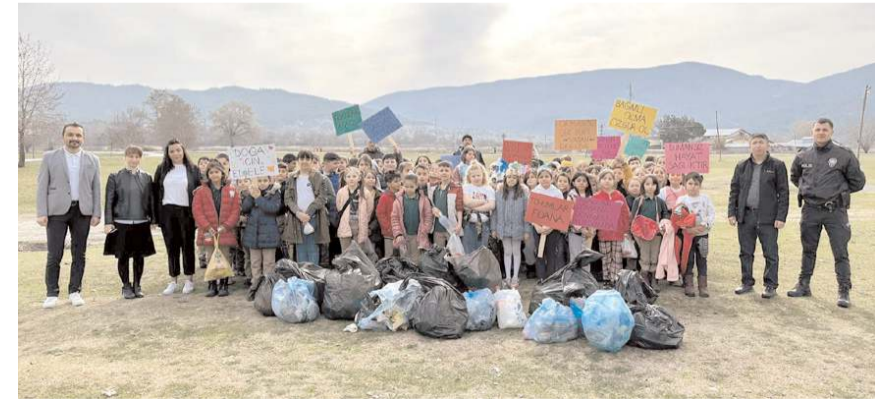
Öğrenciler Çayır mevkiinde çevre temizliği yaptılar.