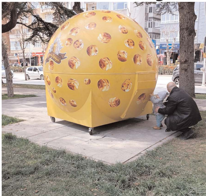
Çorum Belediyesi'nin Pir Baba Parkı'na yerleştirdiği stant dikkat çekiyor.