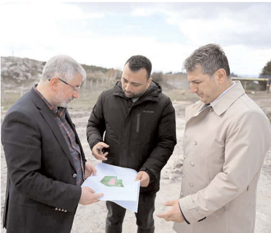
Başkan Aşgın, proje hakkında yetkililerden bilgi aldı.