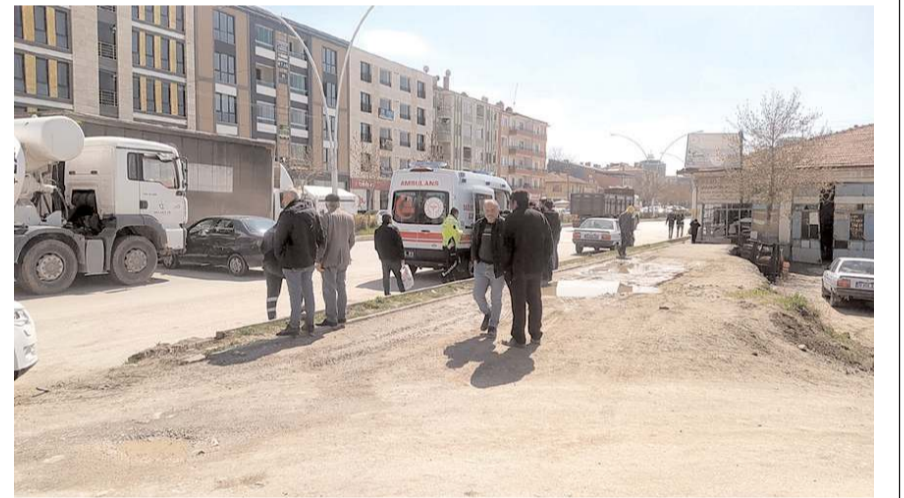
Yaralanan sürücüyü ilk müdahaleyi olay yerinde 112 acil sağlık ekipleri yaptı.