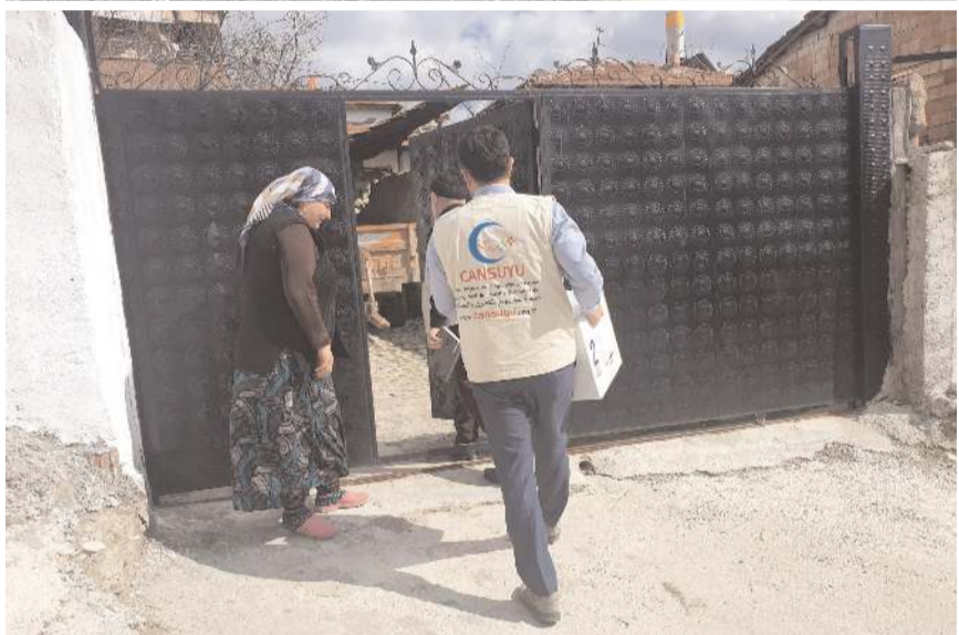
Dernek hayirseverlere yardım çağrısında bulundu.