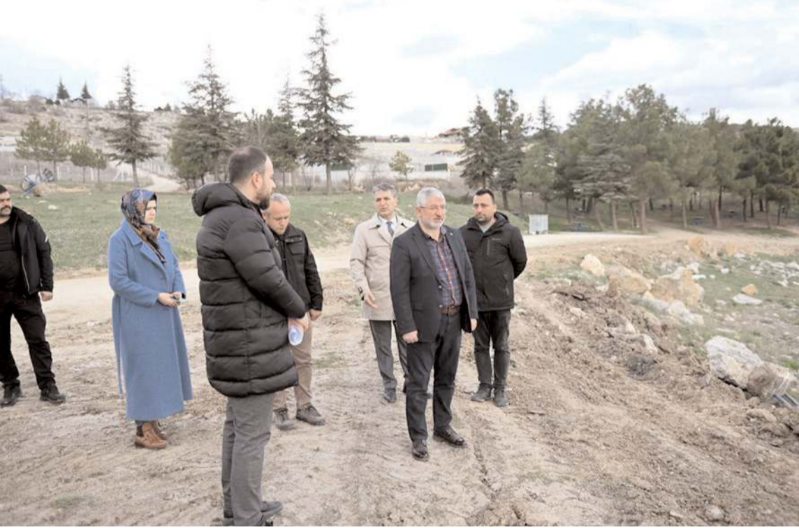
Proje kapsamında Çomar Barajı etrafına bisiklet ve yürüyüş yolları, otopark alanları, barbeküler ve yeni kameryeler yapılacak.

Dışişleri Bakanlığı Avrupa Birliği (AB) Başkanlığının ulusal otoritesi olduğu Karadeniz Havzası'nda Sınır Ötesi İşbirliği (SÖİ) Programı'nın 2021-2027 dönemi birinci teklif çağrısı yayımlandı. Türkiye'den içinde Çorum'un da yer aldığı 25 ilin bulunduğu programın bütçesi ise 72 milyon avro. * HABERİ 7'DE