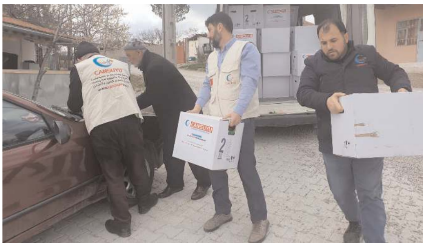
Cansuyu Derneği Ramazan ayında ihtiyaç sahiplerine yardımda bulunuyor.

Kıymetli hayirseverlerimizi bu vesile ile selamlar, Ramazan ayında gerçekleştireceğimiz çalışmalarımızda sizleri de yanımızda görmek isteriz" dedi.