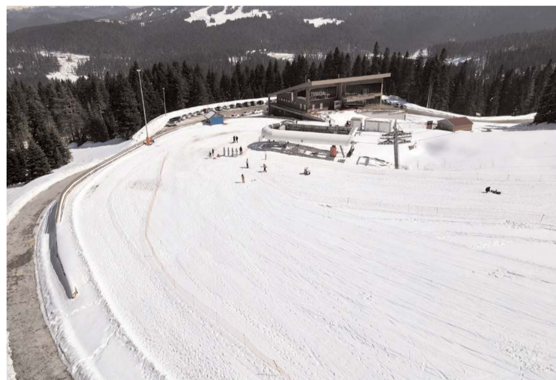
Kayak merkezinde 28-30 Mart arasında etkili olan yağış sonrası kar kalınlığı yaklaşık 40 santimetreye ulaştı.

Nisan ayında kayak yapmanın da keyifli olduğunu kaydeden Hancı, "Bu güzel doğada misafirlerimizi ağırlıyoruz. Muhteşem bir hava, muhteşem bir kar var. Bu doğanın içinde, insan kelimelere sığdıramıyor, harika bir ortam. Çok güzel bir havada çok güzel pistte kayak yapıyoruz." ifadelerini kullandı.(AA)