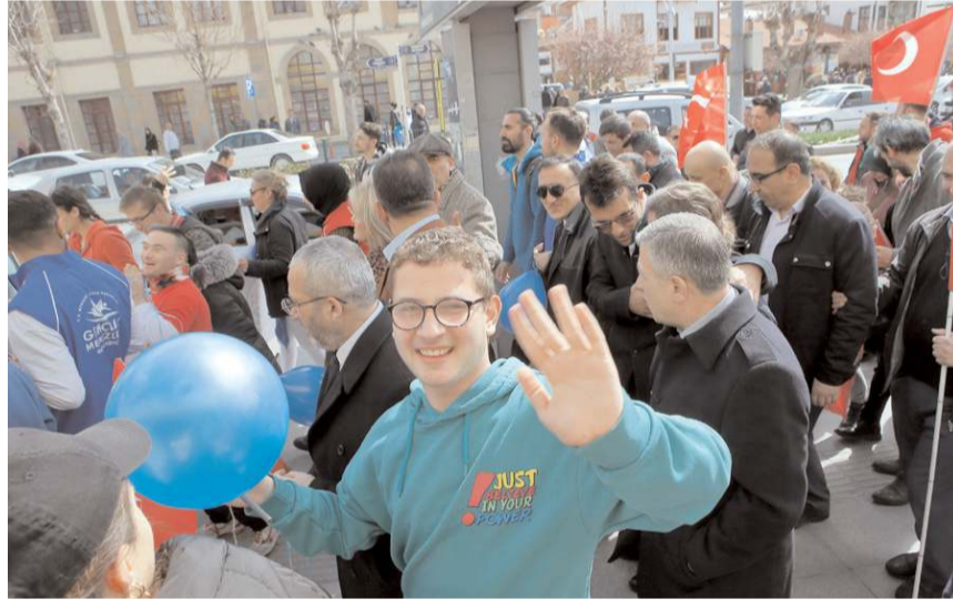
Yürüyüşe katılım yüksek oldu.