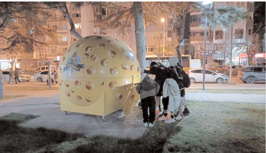
Vatandaşlar standı meraklı gözlerle inceliyor.

Yetkililerden aldığımız bilgiye göre, Çorum Belediyesi bu stant içerisinde çeşitli ikramlıklar hazırlayıp vatandaşa sunabiliyor fakat stant şu an faaliyette değil.