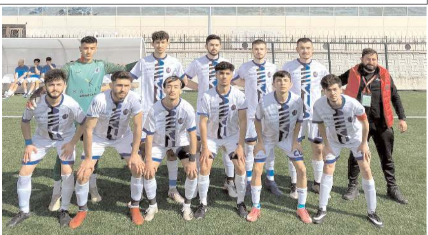
HE Kültürspor, Düvenci'yi 3-0 yenerek şampiyonluk yarışına ortak oldu.

HE Kültürspor, Düvenci Belediyespor'u 3-0 yenerek zirveye ortak oldu. Rakibi önünde ilk yarıyı tek golle önde kapatan Kültürspor ikinci yarıda bulduğu gollerle maçtan 3-0 galip ayrıldı. Maçta atılan üç gole karşın üç kırmızı kart çıktı. Bu galibiyet ile Kültürspor 10 puanla ikinci sıraya yükselirken Düvenci dördüncü maçından da puansız ayrıldı.