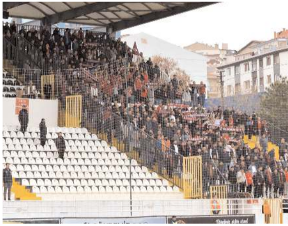
Kapılar açılmadan önce kendilerine ayrılan bölümde

Bunun üzerine açılan kapılardan Çorum FK taraftarları kale arka-