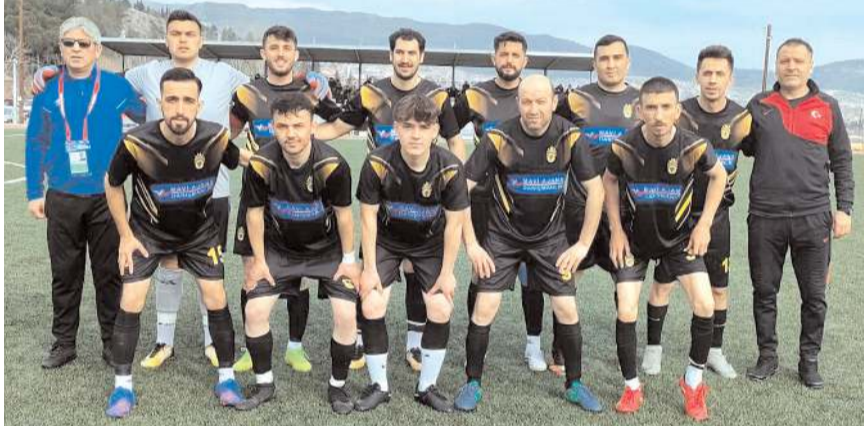
Kargiserispor en yakın rakibi Osmancıkücü'ü 3-0 yenerek liderliğe yükseldi