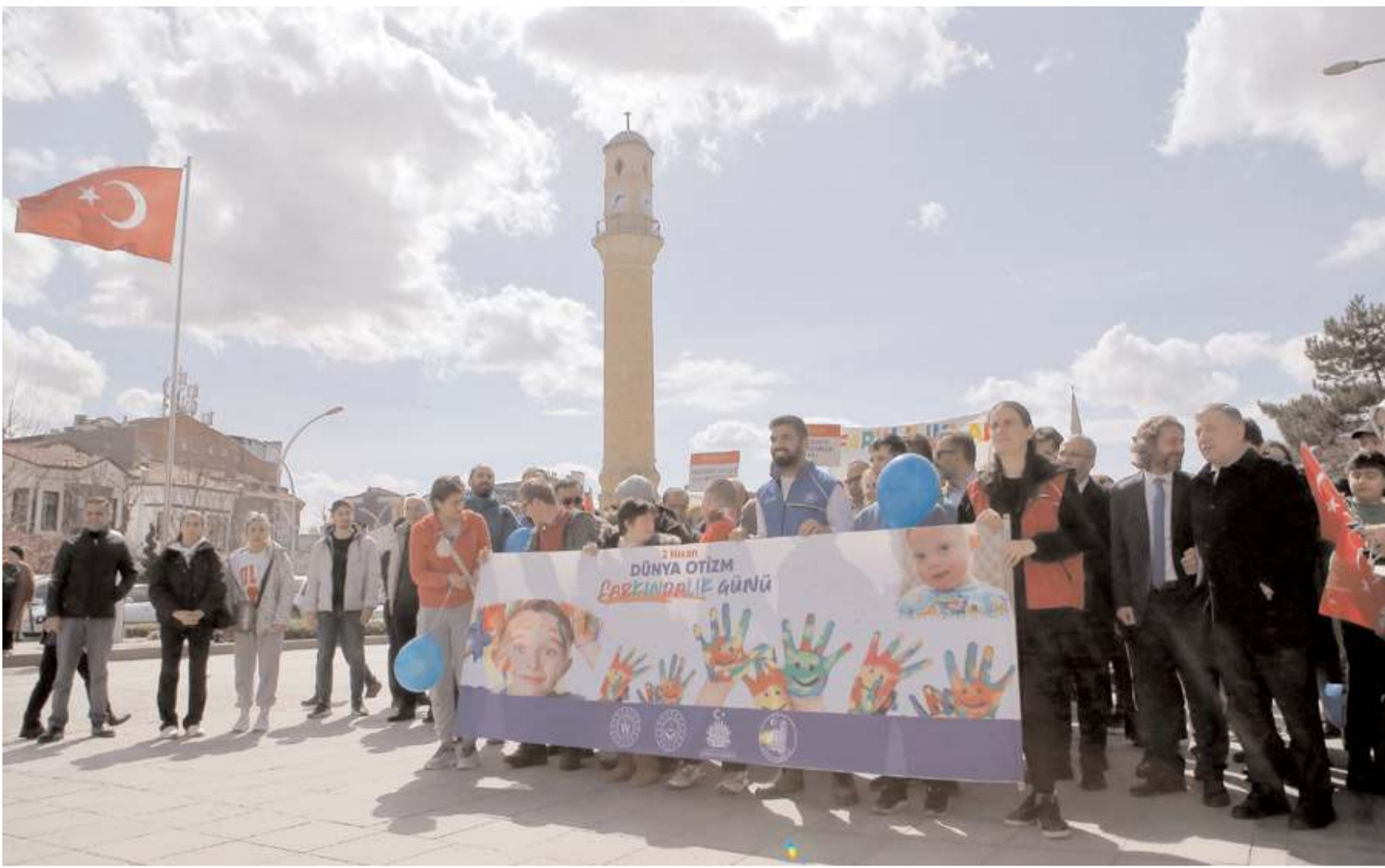
Dünya Otizm Farkındalık Günü nedeniyle yapılan yürüyüş Saat Kulesi'nde başlayıp Kadeş Barış Meydanı'nda sona erdi.