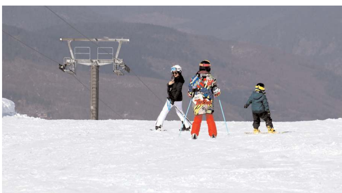
Ilgaz-2 Yurduntepe'de ilkbaharda yağan karla sezonun uzaması kayakseverleri mutlu etti.