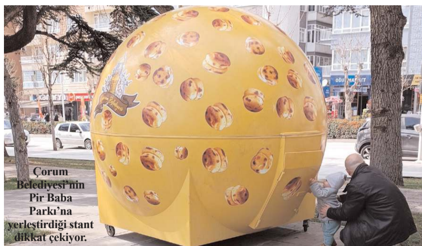
Çorum Belediyesi'nin Pir Baba Parkı'na yerleştirdiği stant dikkat çekiyor.