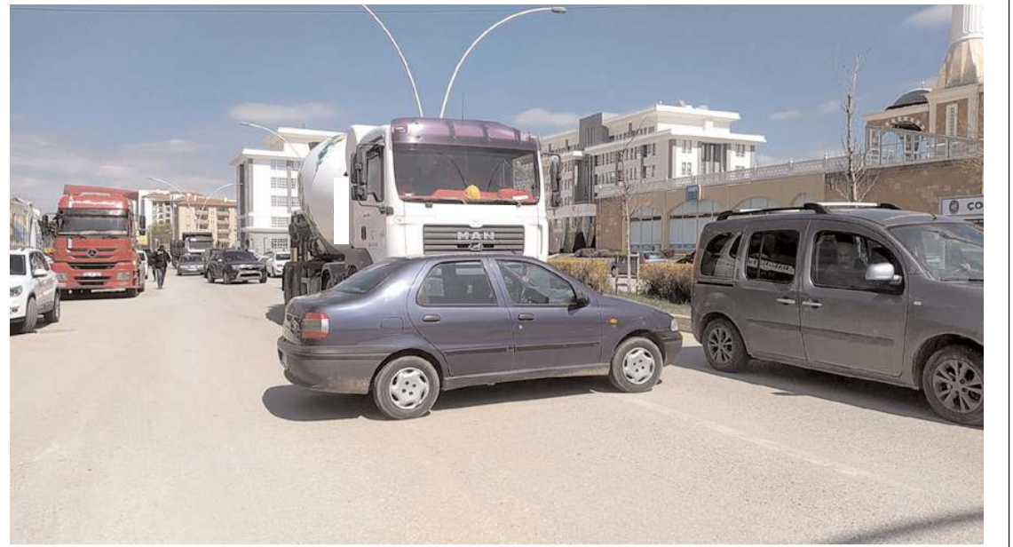
Kaza, Akşemseddin Caddesi üzerinde meydana geldi.