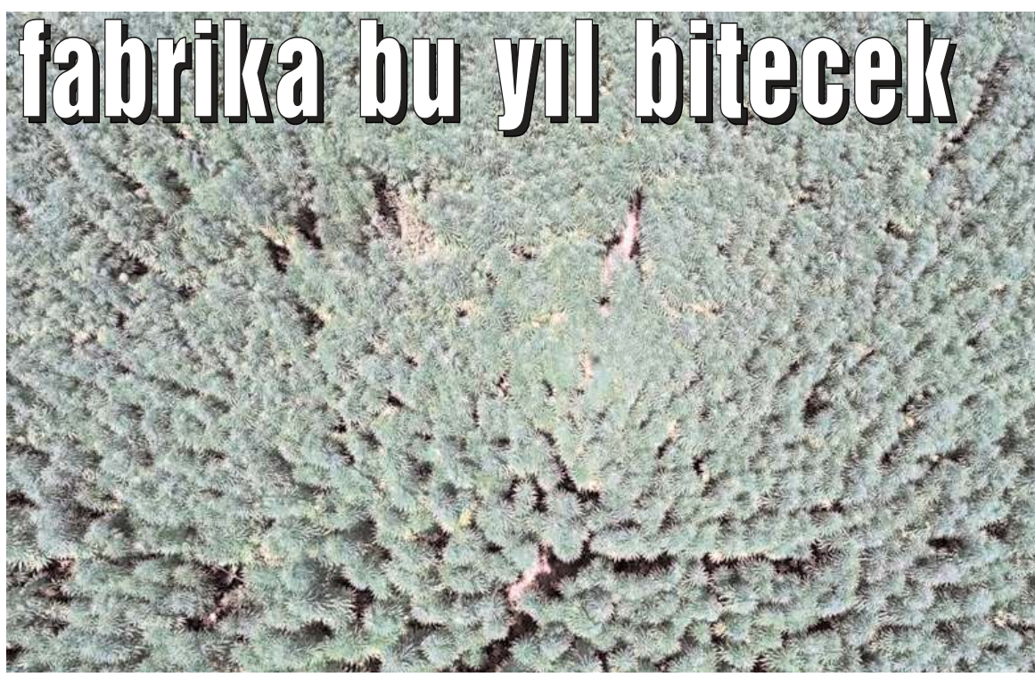
Türkiye'nin 2023 yılı kenevir ekim alanının 6 bin 500 dekar civarında olması bekleniyor.