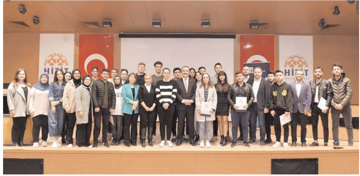
Eğitimin sonunda toplu hatıra fotoğrafı çekildi.