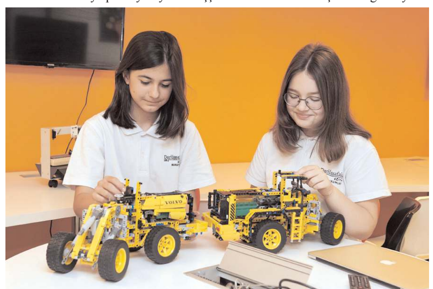
Depremden etkilenen 11 il için kontenjan artırım kararı alan Darüşşafaka Cemiyeti, misyonu doğrultusunda 70 il için 120, afetten etkilenen 11 il için ise ek 100 kontenjan oluşturdu.

vımız uygulanırken okul psikolog ve psikolojik danışmanlarımız öğrencilere eşlik edecek ve 'oyunla başlangıç' şeklinde bir organizasyon yapacaklar." ifadesini kullandı.