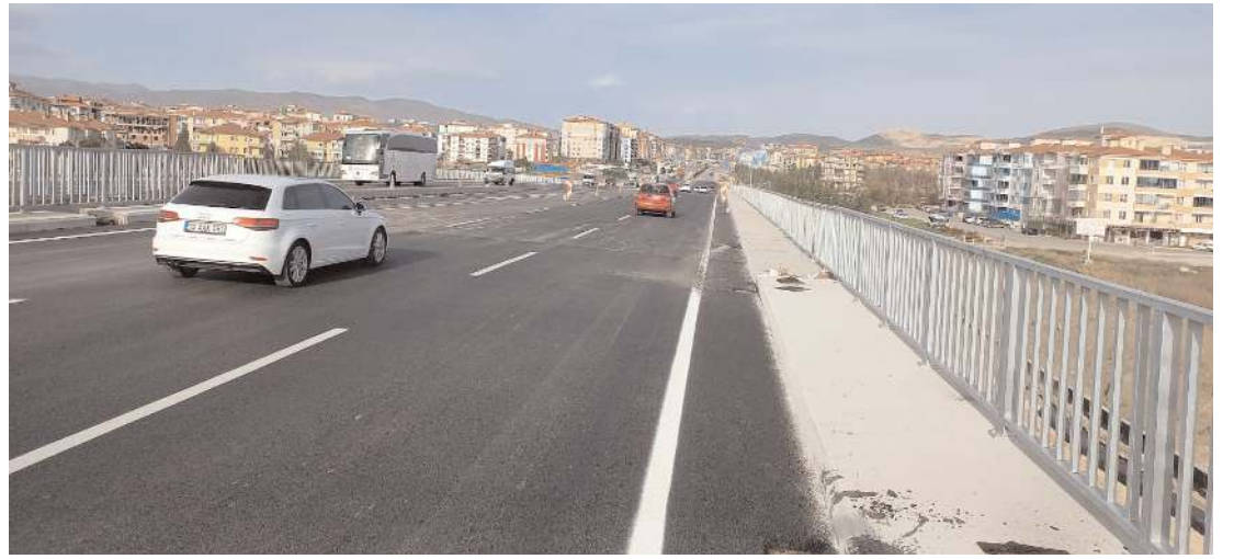
Proje ile Osmancık ve İskilip yolları tek kavşakta buluşuyor.

Ayrıca Ankara ve Samsun'dan gelen trafiğin, İskilip-Osmancık trafiğine takılmadan akmasını sağlayacak proje ile Çevre Yolu'nda yaşanan kazaların önüne geçilmesi hedefleniyor.