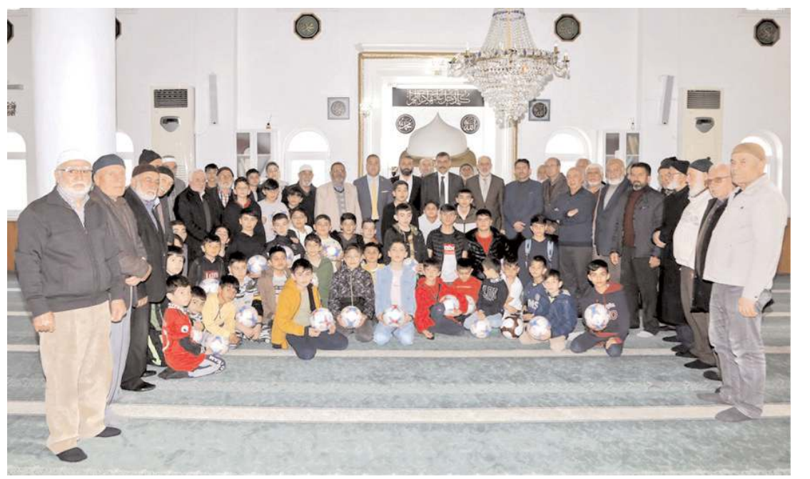
Camiye devamlı namaza gelen çocuklara hediye verildi.