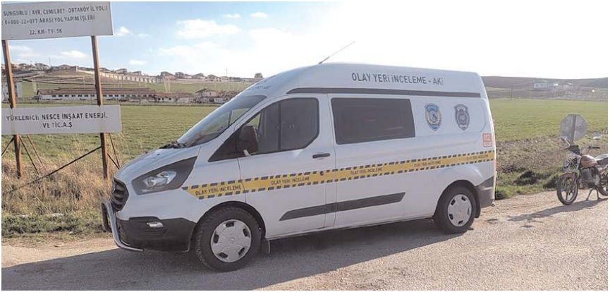
Polis ekipleri olay yerinde inceleme yaptı.