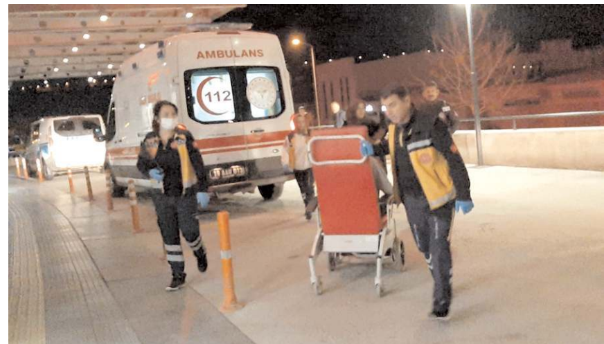
Kavgada yaralanan çocuklar hastanede tedavi altına alındı.

Yaralı çocuklar, sağ- lık ekiplerince ambulansla Hitit Üniversitesi Erol Ol- çok Eğitim ve Araştırma Hastanesine kaldırıldı.