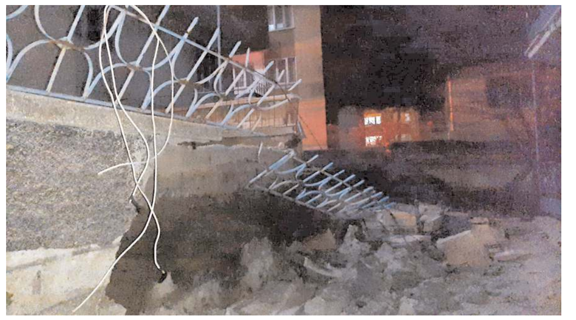
Olay Kale Mahallesi 102 Evler 3. Sokak'ta meydana geldi.

Vatandaşlar tarafından yapılan ihbarı değerlendiren polis ekipleri olay yerinde inceleme başlattı. Emniyet Müdürlüğü olay yeri inceleme ekiplerinin bölgede yaptığı çalışmasının ardından, yol kenarında bulunan tabanca ve şarjör muhafaza altına alındı. (İHA)