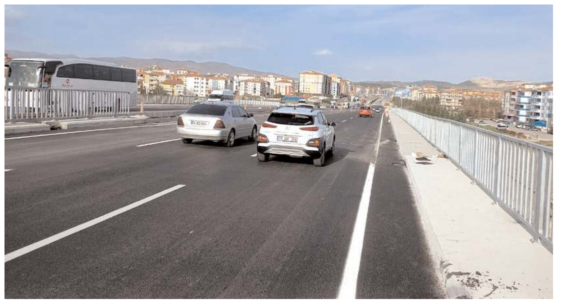
Akşemseddin Caddesi ile Çevre Yolunu birleştiren köprülü kavşak trafiğe açıldı.

"Poz vermesi yetmemiş gibi özrü kabahatinden büyük olur derler ya, işte o minvalde bir açıklama yapıyor. Açıklamasında özür de edilemiyor, sadece üzgünüm beyanatında bulunuyor. Ve diyor ki fark etmedik. Bay Kemal, sen fark etmedin. Yanındaki üç kişi de mi fark etmedi? Hadi onlar da fark etmedi. Bu fotoğrafı çekende mi fark etmedi. Fotoğrafi çeken de fark etmedi. Bunu servis yapanlar da mı fark etmedi? Bu yapmış olduğunuz milletimizin değerlerine karşı göstermiş ol-