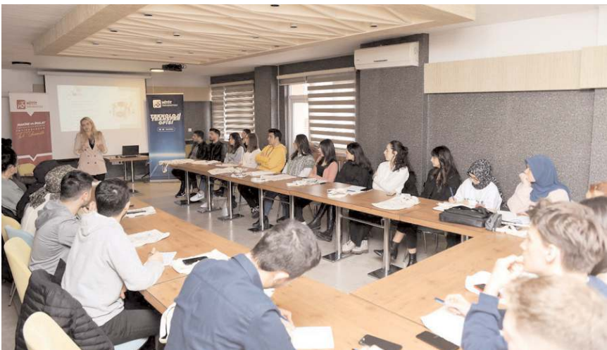
Eğitimde proje yazma eğitimindeki temel kavramlar, makine ve imalat teknolojileri odağında hazırlanmış örnek projeler hakkında bilgi verildi.