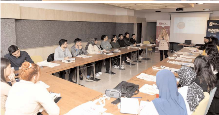
Eğitim üç gün sürdü.

Hitit Üniversitesi Teknoloji Transfer Ofisi koordinatörlüğünde 'Üniversite Öğrencileri için Makine ve İmalat Teknolojileri Odağında TÜBİTAK 2209 ve TEKNOFEST Projeleri Hazırlama Eğitimi' verildi.