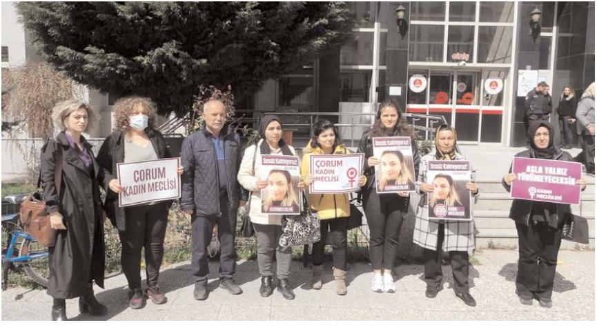
Kadın Cinayetlerini Durduracağız Platformu üyeleri de karara tepki gösterdi.