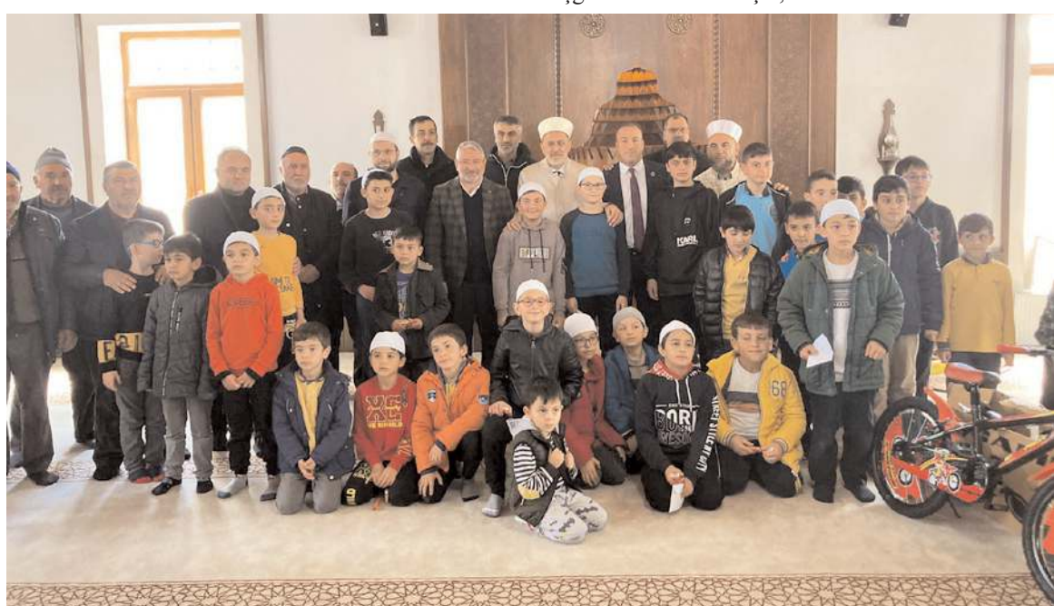
Törenin ardından toplu hatıra fotoğrafı çekildi.

Cuma namazının ardından yapılan programda Kur'an-ı Kerim okumayı öğrenen çocuklara hediyelerini takdim ederek başarı dileklerini ilettiler.