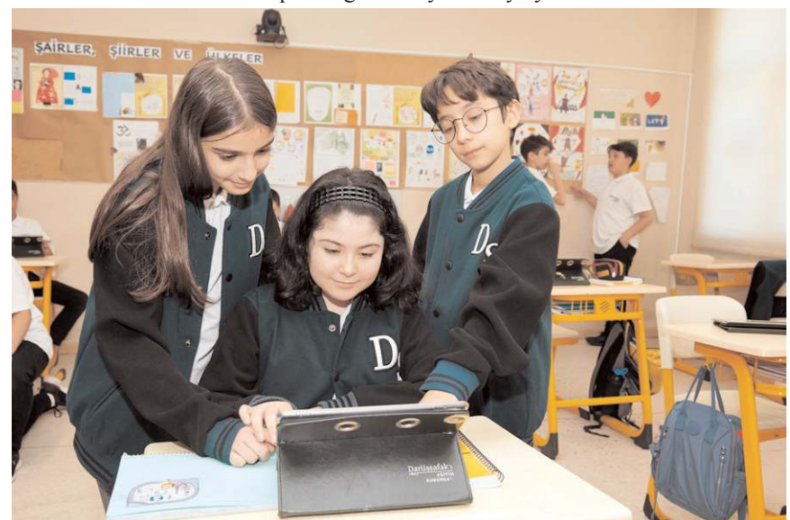
Sınava katılmak isteyen adayların başvuru evraklarını 15 Mayıs Pazartesi gününe kadar elden veya posta yoluyla Darüşşafaka Ortaokuluna ulaştırması gerekiyor.