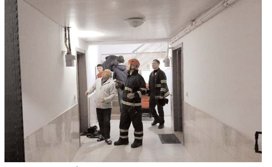
İtfaiye ekipleri binada inceleme yaptı.

Binada, Çevre, Şehircilik ve İklim Değişikliği İl Müdürlüğü ekiplerince detaylı inceleme yapılacağı öğrenildi.(AA)