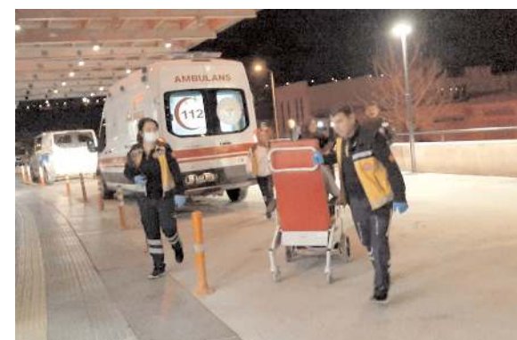
Kavgada yaralanan çocuklar hastanede tedavi altına alındı.