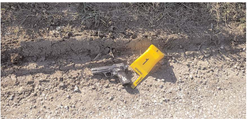
Yol kenarında, bir adet tabanca ile dolu şarjör bulundu.