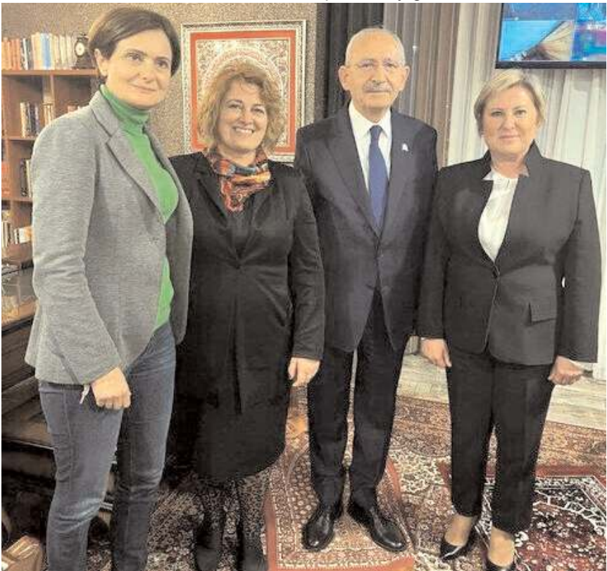
CHP Genel Başkanı ve Cumhurbaşkanı Adayı Kemal Kılıçdaroğlu'nun ayakkabı ile seccadeye basarak fotoğraf çektiği an.

Kemal Kılıçdaroğlu'nun ayakkabı ile seccadeye basarak fotoğraf çektiğinin ardından yaptığı açıklamayı 'özrü kabahatinden büyük' olarak niteleyen Atıf-Der Başkanı ve Çorum Milli İrade Platformu Sözcüsü Mustafa Lek, açıklamasında şu ifadeleri kullandı: