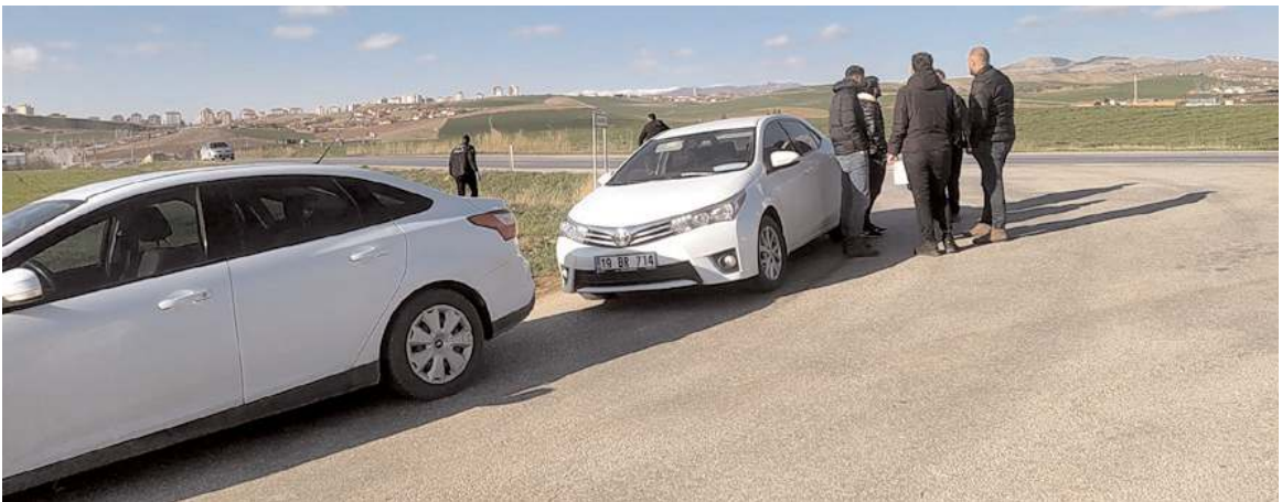
Olay, Çorum-Ortaköy karayolu üzerindeki Karaca Köyü Kavşağı'nda meydana geldi.

Çorum'da yol kenarına atılmış halde tabanca ile bu tabanca ait dolu şarjör bulundu.