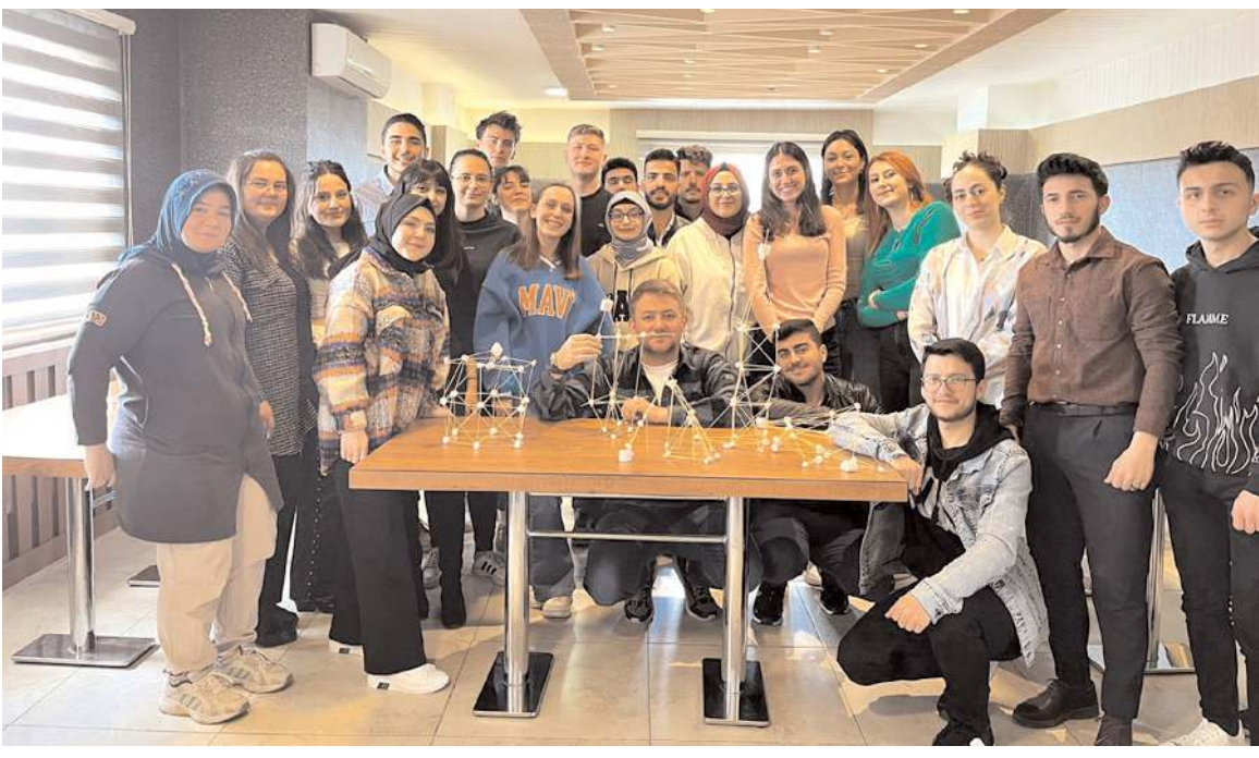
Eğitim programına Hitit Üniversitesi, Samsun Üniversitesi, Tokat Gaziosmanpaşa Üniversitesi, Bursa Teknik Üniversitesi, Ondokuz Mayıs Üniversitesi ve Bayburt Üniversitesi'nden 30 öğrenci katıldı.