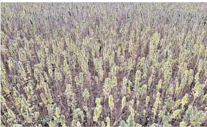
Çorum'da kenevir üretilen iller arasında bulunuyor.