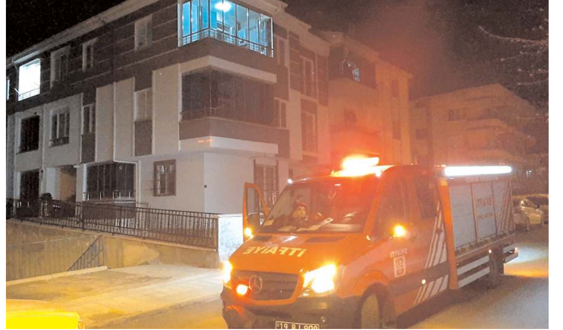
Binada, Çevre, Şehircilik ve İklim Değişikliği İl Müdürlüğü detaylı inceleme yapacak.