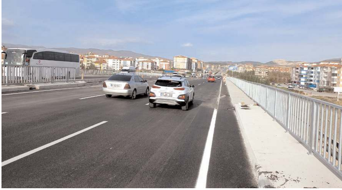
Farklı seviyeli köprülülük kavşak Akşemseddin Caddesi, İskilip ve Osmaniye yollarını Çevre Yoluyla birleştiriyor.