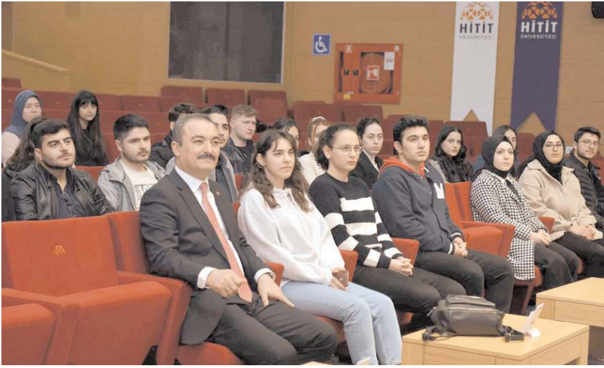
Eğitilerde TEKNOFEST yarışmalarına proje hazırlık ve başvuru süreçleri anlatıldı.