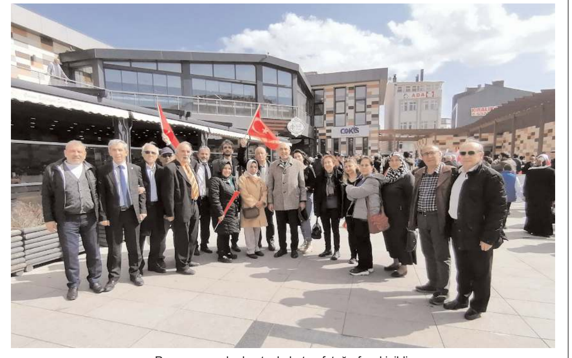
Programın ardından toplu hatıra fotoğrafı çekildi.

kerek, onları değiştirmeye çalışmaktan ziyade farklılıkların kabul edilmesi gerektiğinin altını çizdi. Odabaş, "Otizm eksiklik değil, farklılıktır. Otizmin farkındayız ve onların yanındayız. Unutmayalım ki, engel diye bir şey yoktur. En büyük engel sevgisizliktir. Farkındalık demek, bilmek, olduğu gibi görmek, anlayışlı bir tutum geliştirmek demektir. Hepimiz otizmi fark etmeli, görmezden gelmeliyiz. Farklılıkları birlikte fark edelim ve onların sevgi dolu enerjilerini hissedelim. Hadi hep birlikte otizme mavi ışık yakalım" ifadelerini kullandı. (Haber Merkezi)