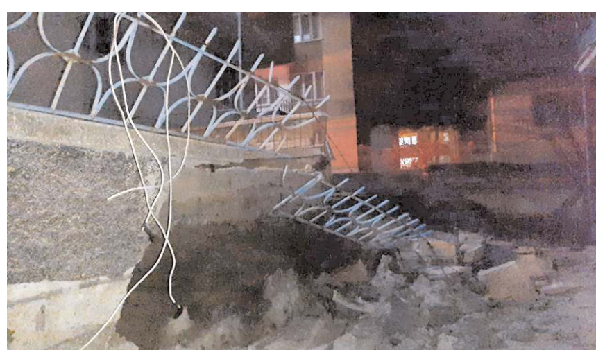
Olay Kale Mahallesi 102 Evler 3. Sokak'ta meydana geldi.