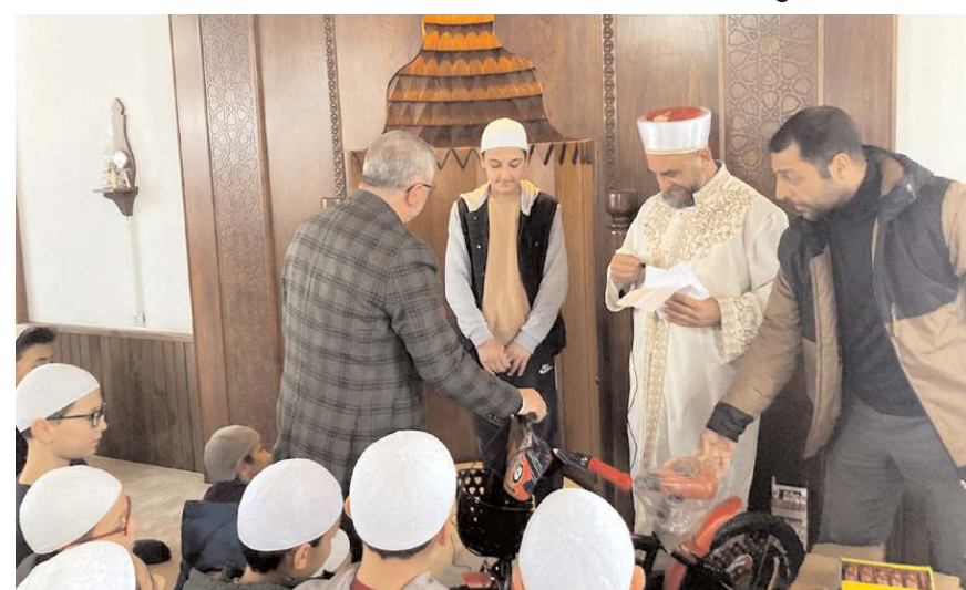
Çocuklara hediye verildi.