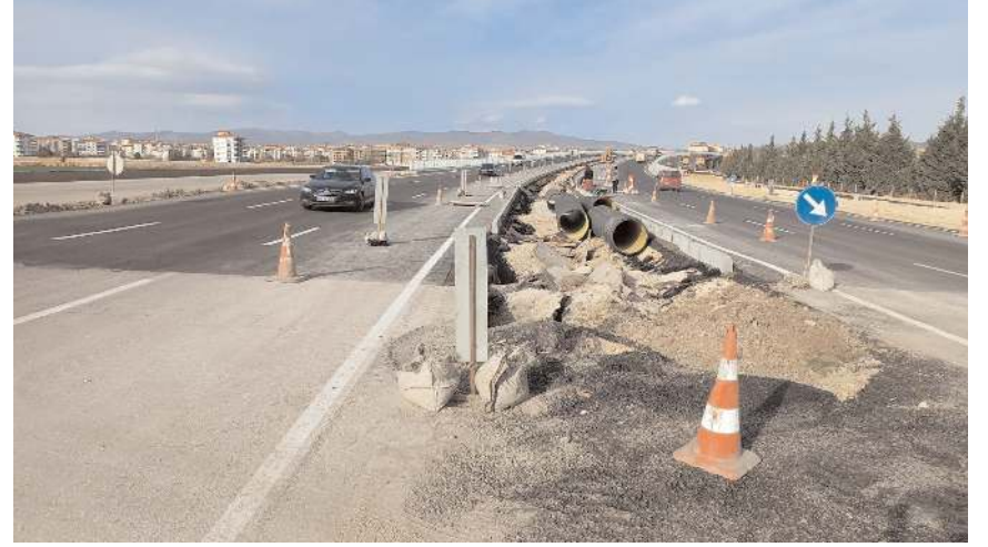
Köprüde çalışmalar devam ediyor.

Proje ile Osmancık ve İskilip yolları tek kavşakta buluşurken, farklı seviyeli köprülü kavşak ile