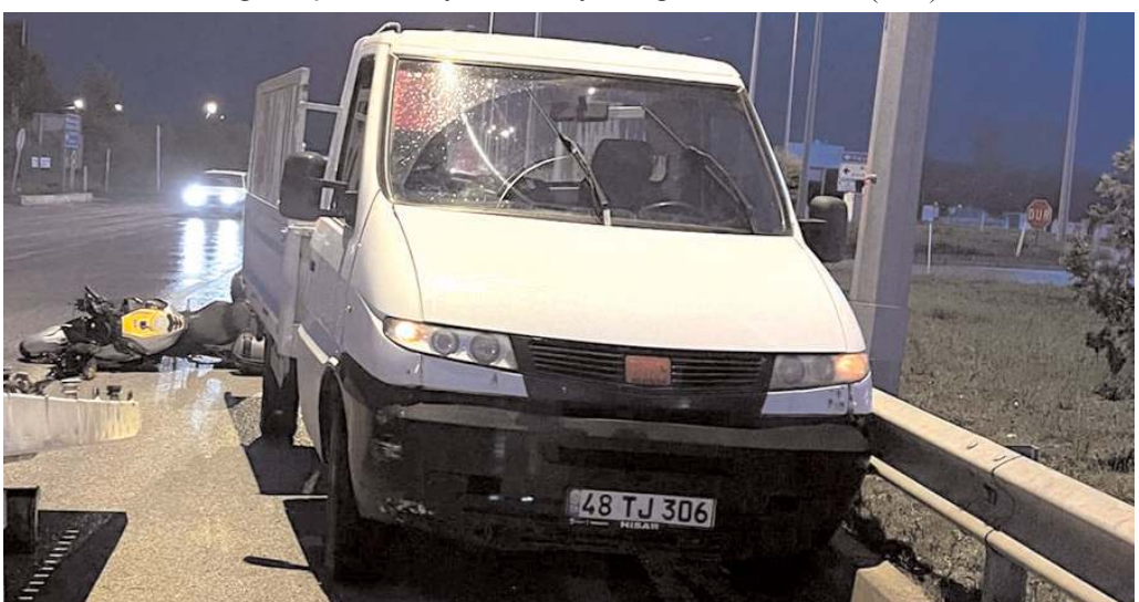
Kazada kamyonette maddi hasar meydana geldi.

Kazayla ilgili soruşturma başlatıldı. (İHA)