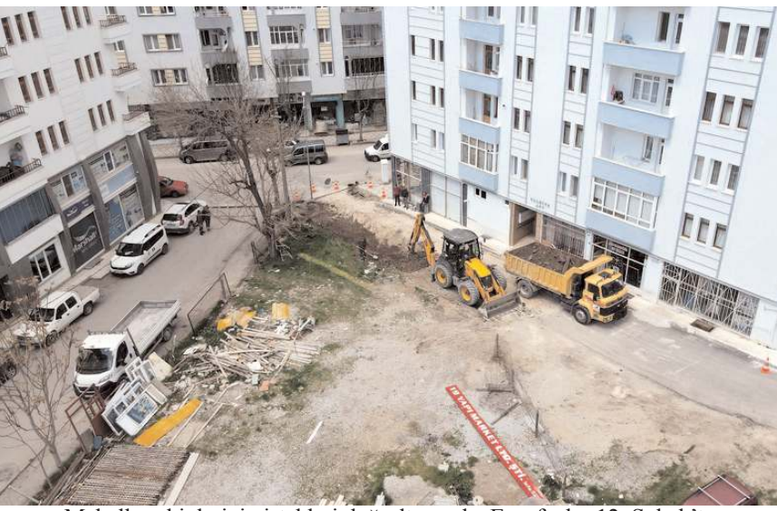
Mahalle sakinlerinin istekleri doğrultusunda, Esnafevler 12. Sokak'ta kamulaştırma gerçekleştirildi ve yol genişletme çalışmaları başladı.