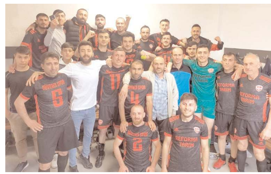
Düvenci Belediyespor ilk galibiyeti sonrasında soyunma odasında üç puan pozunu verdi.