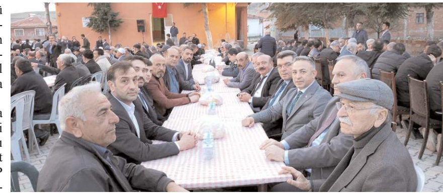
CHP heyeti Arifegazili Köyü'nde iftara katıldı.

İftar yemeğinde sorun ve taleplerini dile getiren köy halkı, eskiden olduğu gibi tekrar 'belde' statüsü kazanmak istediklerini söyledi.