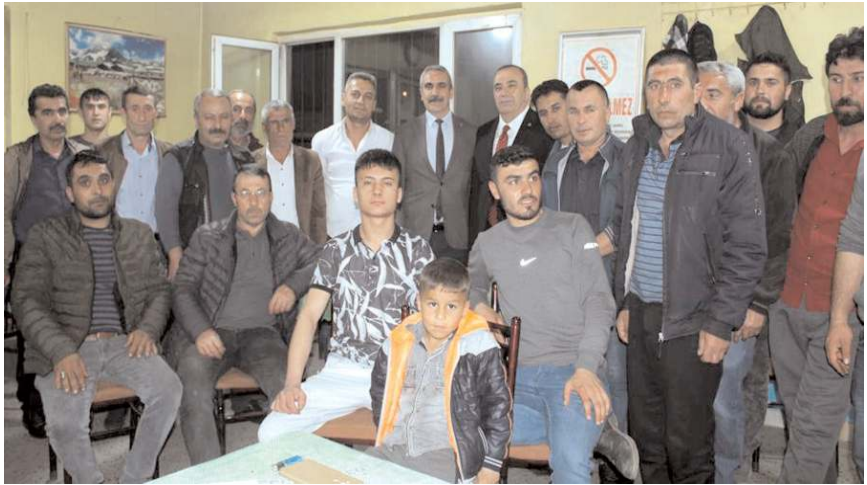
Kayırcı, Sungurlu'da vatandaşlarla sohbet etti.

anlatırken, Çorum'un geleceği için çalışacağını söyledi.