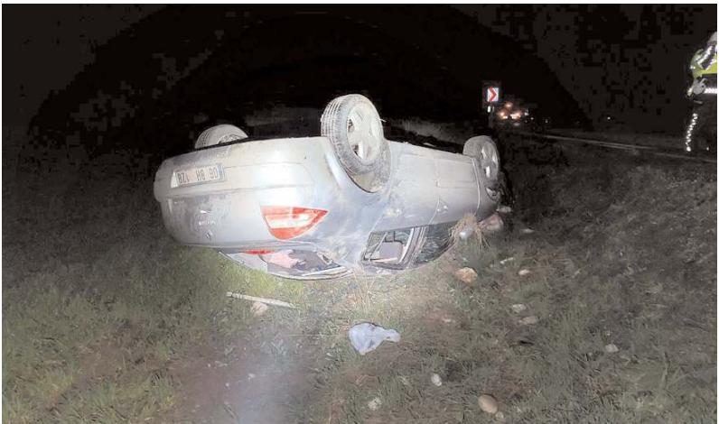
Kaza Çopraşık köyü yakınlarında meydana geldi.

Yaralıları, sağlık ekiplerince yapılan ilk müdahalenin ardından ambulanslarla Alaca Devlet Hastanesine kaldırıldı.(AA)