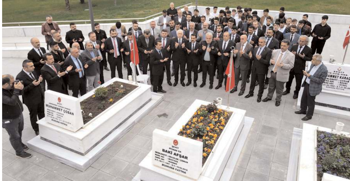
Ziyaretin sonunda şehitler için dua edildi.

peygamberlikten sonra gelen en yüce mertebeye olduğuna dikkat çekerek, "Bizim milletimizde bu mertebeye ulaşmak, vatani ve milli için canını vermek şereflerinin en büyüğüdür" dedi.