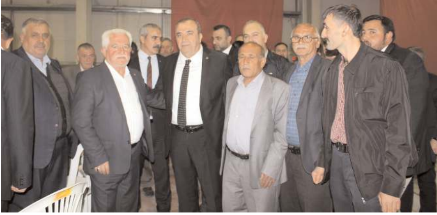
İftara katılım yüksek oldu.