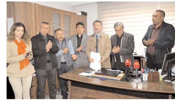
Bir grup muhtar PTT önünde toplanarak tutuklu muhtarlara desteklerini dile getirdiler.