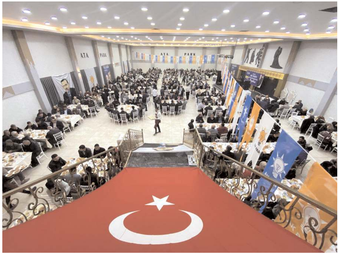
İftar programına katılım yüksek oldu.

Cumhurbaşkanımız dünya 5'ten büyüktür dediği için rahatsız oldular. 40 yıllık PKK belasını bitirdiği için rahatsız oldular. Kıbrıs'ta açılmayan Maraş'ı açtığı için rahatsız oldular. Ka-