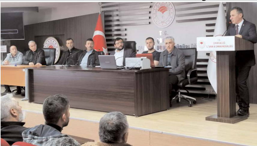
Çorum İli Damızlık Sığır Yetiştiricileri Birliği Olağan Mali Genel Kurul Toplantısı yapıldı.

2023 yılında DOKAP'a sunulan proje ile 50 adet hibe alınacak süt soğutma tankını birlik bünyesine kazandıracaklarını söyleyerek alınan tanklarla süt toplama ağının daha da artarak süreceğini ifade eden Başkan