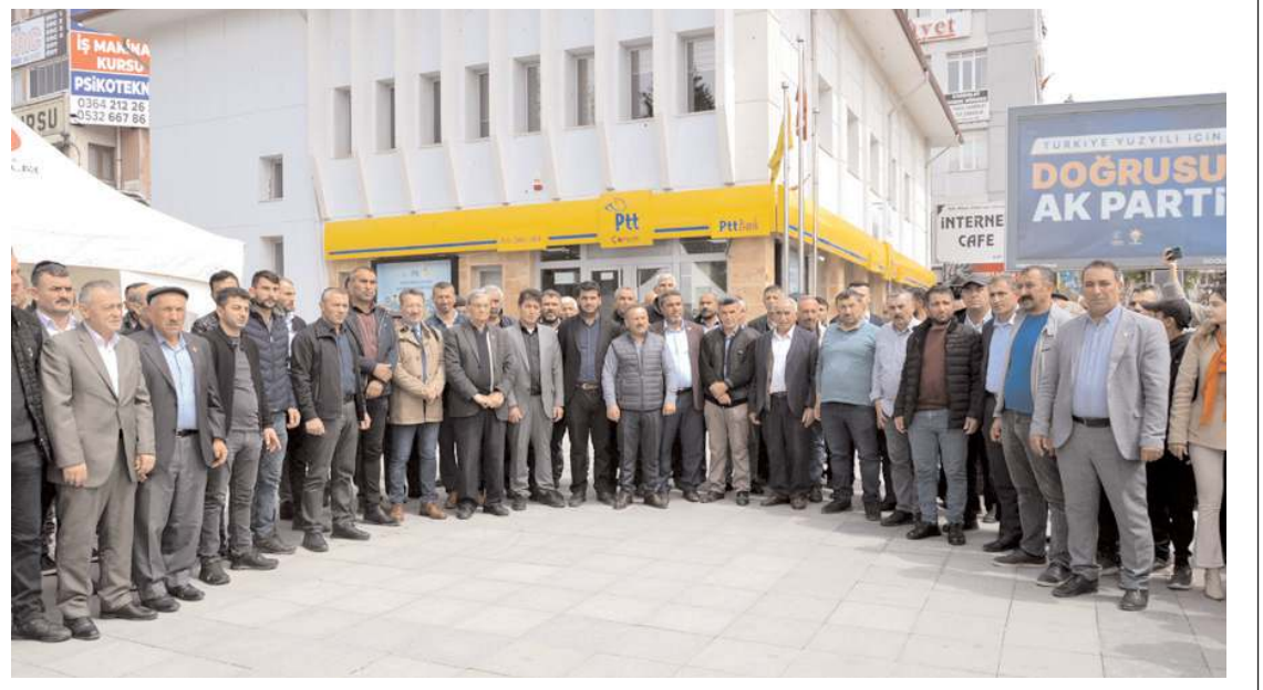
Bir grup muhtar PTT önünde toplanarak tutuklu muhtarlara desteklerini dile getirdiler.

Kaya'nın konuşmasının ardından gündem maddeleri genel kurulda görüşülerek karara bağlandı. (Haber Merkezi)