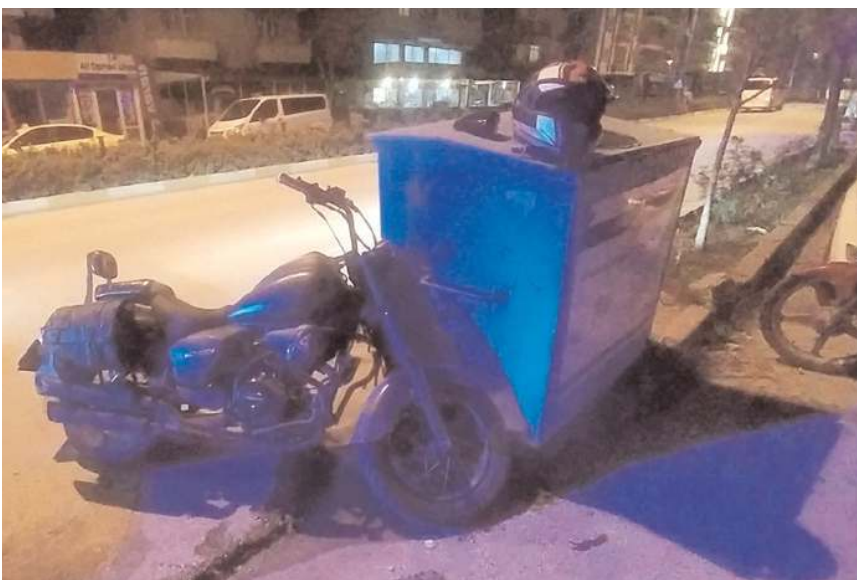
Kaza, Bahabey Caddesi'nde meydana geldi.

Çorum'da motosiklete çarpan otomobil sürücüsü olay yerinden kaçarak uzaklaştı. Yaralı motosiklet sürücüsü hastaneye kaldırılarak tedavi altına alındı.