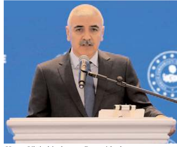
Hasan Yiğit, bir dönem Çorum'da da görev yaptı.

Emniyet Genel Müdürlüğü Yardımcılıklarına Cüneyt Ünal ve Hasan Yiğit vekaleten atandı. AA muhabirinin aldığı bilgiye göre, Emniyet Genel Müdürlüğündeki 2 genel müdür yardımcılığı Erhan Gülveren'in emekliye ayrılması, İbrahim Kullar'ın ise yurt dışında işleri müşaviri olarak görevlendirilmesi üzerine boşalmıştı. Geçtiğimiz yıllarda Çorum'da da görev yapan Terörle Mücadele Daire Başkanı Hasan Yiğit ile Güvenlik Daire Başkanı Ünal, boşalan genel müdür yardımcılıklarına vekaleten getirildi. Yiğit, terör örgütü ele başı Abdullah Öcalan'ın yakalanarak Türkiye'ye getirilmesinden sonra İmralı'da yapılan sorgulama ekibinde yer almıştı. Yiğit'in ayrıca terörle mücadele kapsamında 6 kitabı bulunuyor. Ünal ise Katar'da bu yıl yapılan Dünya Kupası'nda görev aldı. (Haber Merkezi)