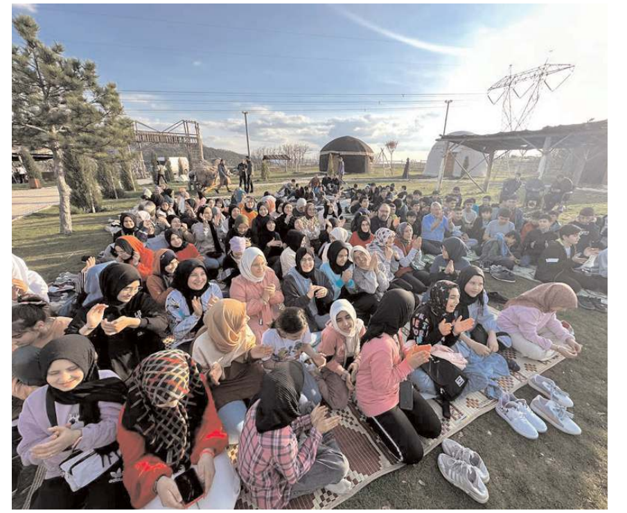
Program renkli görüntülere sahne oldu.

Etkinlik, Hacivat-Karagöz oyunları ve iftar yemeği ikramıyla son buldu. (Haber Merkezi)