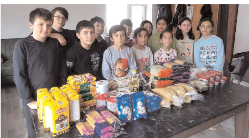
Öğrenciler, ailelerinden temel gıda maddeleri toplayıp ihtiyaç sahiplerine ulaştırdılar.

Dodurga Şehit Murat Alıcı Ortaokulunda yürütülen, "Çevreme Duyarlıyım, Değerlerime Sahip Çıkıyorum Projesi" kapsamında öğrenciler, ailelerinden temel gıda maddeleri topladı.