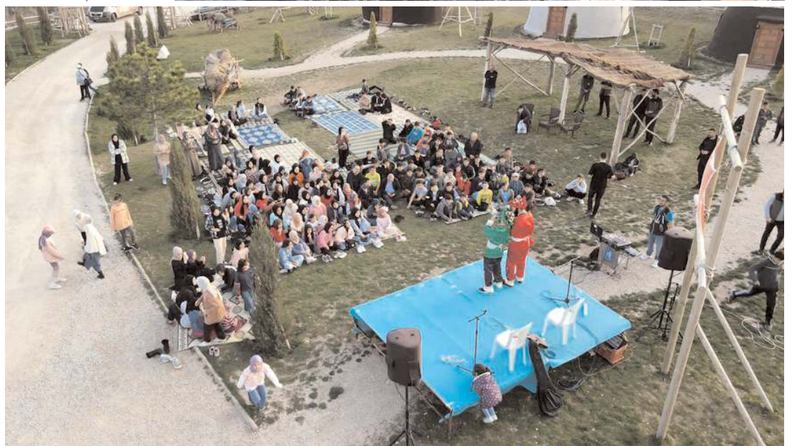
Çocuk şarkılarının da seslendirildiği programda ezgi ve ilahi dinletisi gerçekleştirildi.