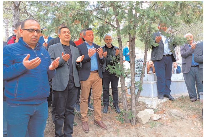
Merhumenin cenazesi Karşıyaka Mezarlığı'nda toprağa verildi.