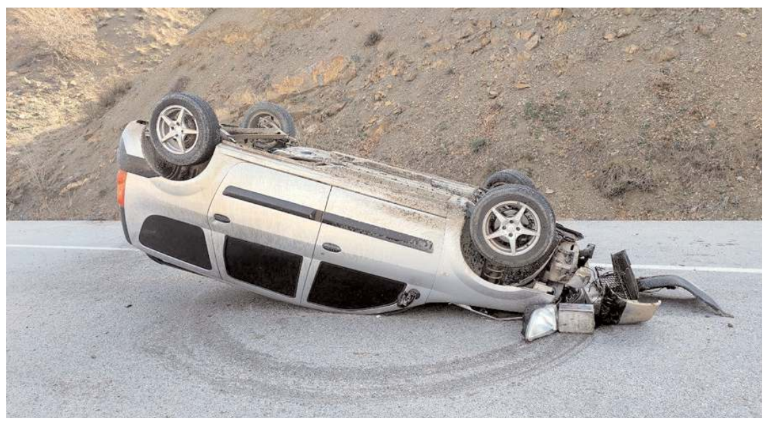
Kaza Çorum-Alaca kara yolu Küre köyü yakınlarında meydana geldi.