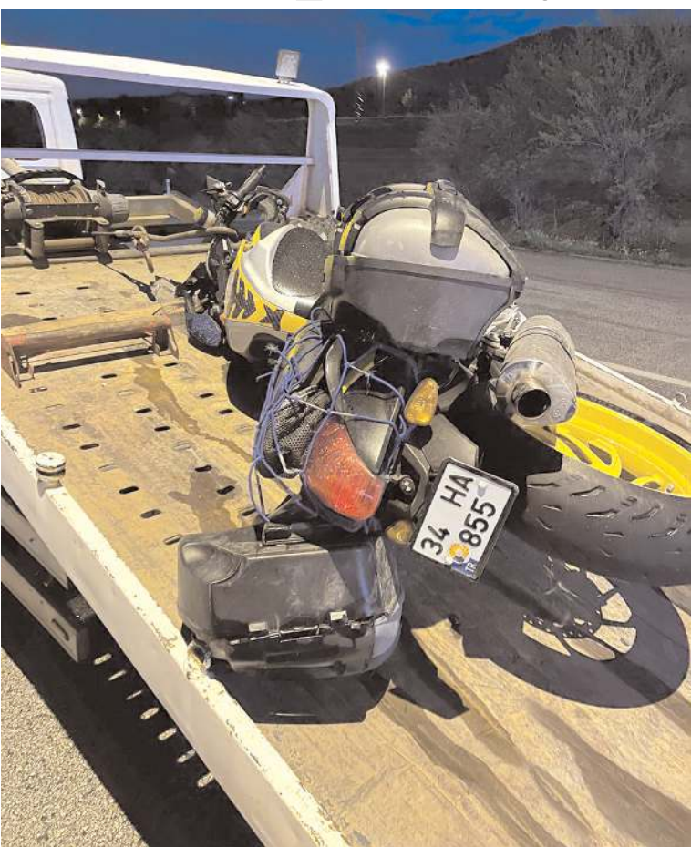
Kaza, Sungurlu-Çorum karayolunda meydana geldi.

Sungurlu'da motosikletin kamyonete çarpması sonucu meydana gelen kazada 1 kişi yaralandı.