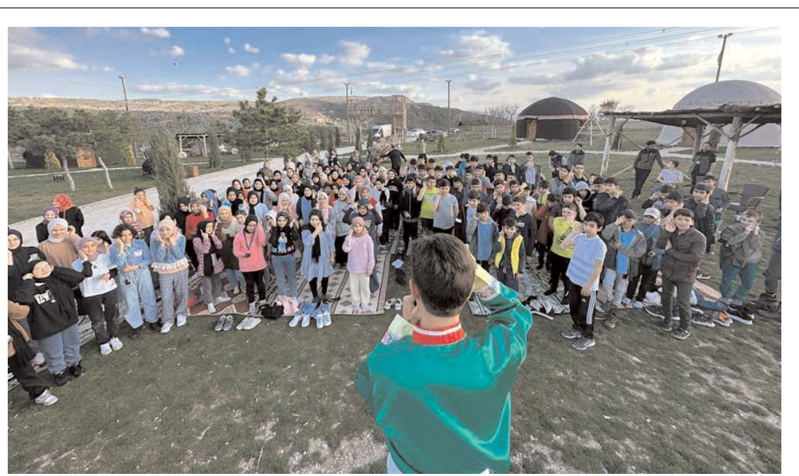
Çorumlu Obası'nda gerçekleştirilen etkinlikte, 174 hafız ve hafize bir araya geldi.

O gün Köy Enstitülerini kapatmak ne kadar vahim bir hata ise bugün eğitim sistemimizi yeniden çok kutuplu hale getirecek uygulamalar ve yasal düzenlemeler de o kadar büyük hatadır. Kurucusu olan Başöğretmen'in, "Eğitimde feda edilecek fert yoktur" dediği Türkiye Cumhuriyeti'nde, gerici, piyasacı ve kamusalılıktan uzak eğitim yönetimi nedeniyle yoksul öğrencilerin nasıl feda ve heba edildiği bugün çok net ortadadır. Eğitimde yaşanan ticarileşme, özelleştirme ve dinselleştirme uygulamaları hız kesmeden devam etmektedir. Daha önce defalarca söylediğimiz gibi eğitim sisteminde yıllardır yaşanan sorunların aşılmasının, çocukların nitelikli bir eğitime ulaşabilmesini sağlamak için bugüne kadar yapılan bilimsel olmayan eğitim politikaları tamamen değiştirilmekten geçmektedir. Yaşanan karanlık tablodan çıkışın tek yolu ise eğitimin eşit, parasız, bilimsel, laik, ulusal ve kamusal niteliğinin artırılmasıdır. Eğitim-İş olarak yaşanan tüm bu karanlık tabloya rağmen, parasız, bilimsel, laik, çağdaş, kamusal eğitim için, işimiz, ekmeğimiz ve çocuklarımızın geleceği için kararlılıkla mücadeleye devam ediyoruz. Amacımız, Köy Enstitülerinin felsefesi, heyecan ve ruhunu okullarımızda yaşatmak, tüm yurttaki Cumhuriyetçi aydınlanmanın ateşini yeniden yakmak, ülkemizin geleceğine umut ve ışık olabilmektir." (Haber Merkezi)