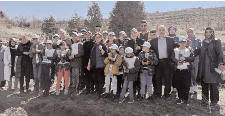
Etkinliğe Kale Özel Eğitim Uygulama Okulu öğrencileri de katıldı.