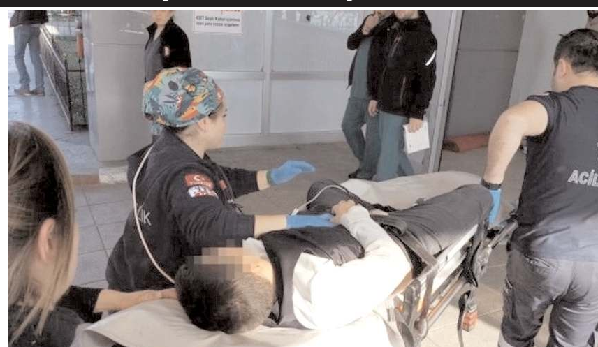
Olay, İzmir'in Torbalı ilçesinde meydana geldi.