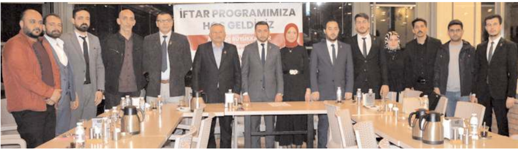
Zafer Partisi Çorum milletvekili adayları ile partililer iftar programında basın mensuplarıyla buluştu.