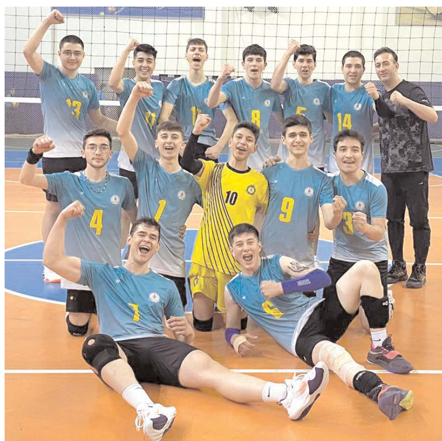
Sungurlu Eğitimspor yıldız erkek takımı yarı final grubuna yükseldi

nida finale yükselmek için mücadele edecek. Yarı final grup maçları 7-9 Mayıs tarihlerinde yapılacak.