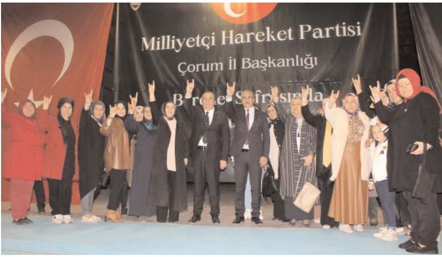
İftar sonunda davetliler ile milletvekili adayları hatıra fotoğrafı çekindiler.