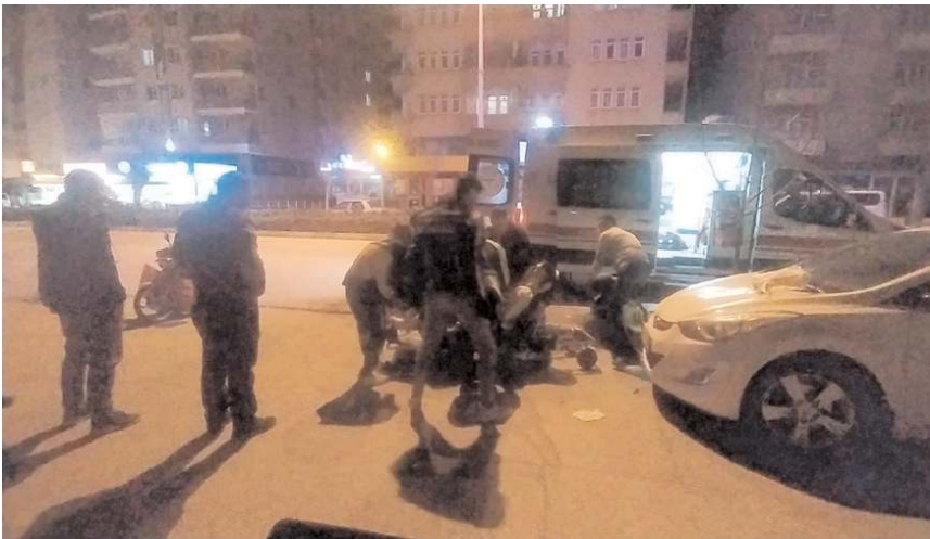
Yaralıya 112 acil sağlık ekipleri müdahale etti.