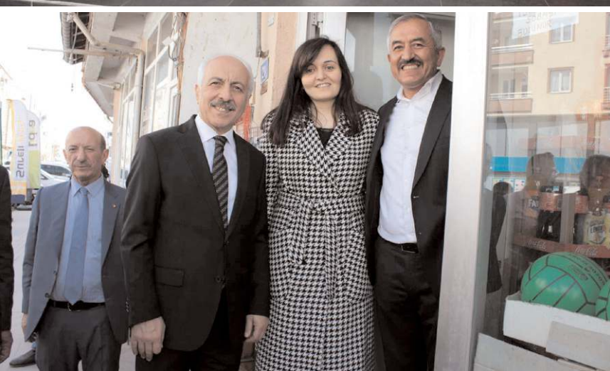
Esnafı ziyaret eden Gül, 14 Mayıs seçimleri için destek istedi.