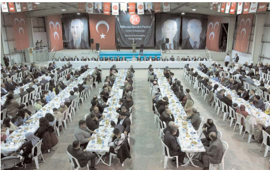
İftar programı TSO Fuar Kompleksinde gerçekleştirildi.