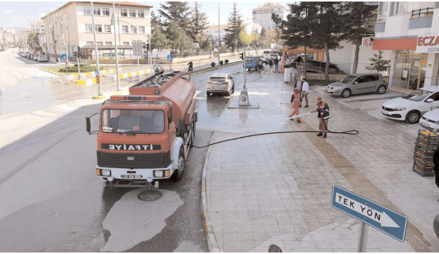
Belediye şehrin işlek caddeleri ve kaldırımlarını yıkanarak temizleniyor.

Çorum'un temiz şehir imajını bir adım daha