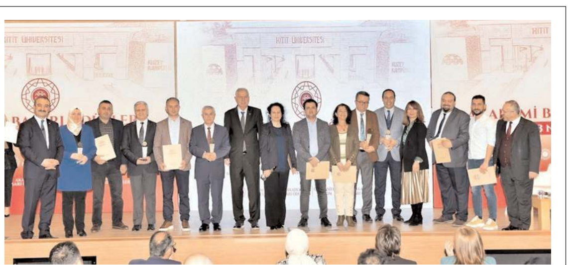
Törende başarılı projelere imza atan akademisyenlere ödül verildi.