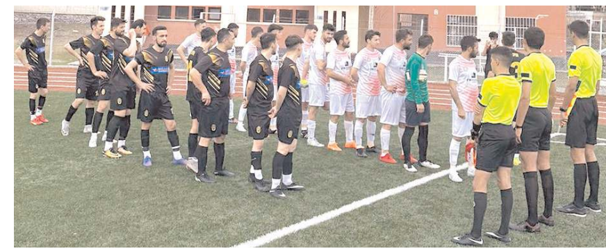
Kargıserispor, Oğuzlar önünde ikinci yarıda farka giderek ilk yarıyı lider tamamladı.