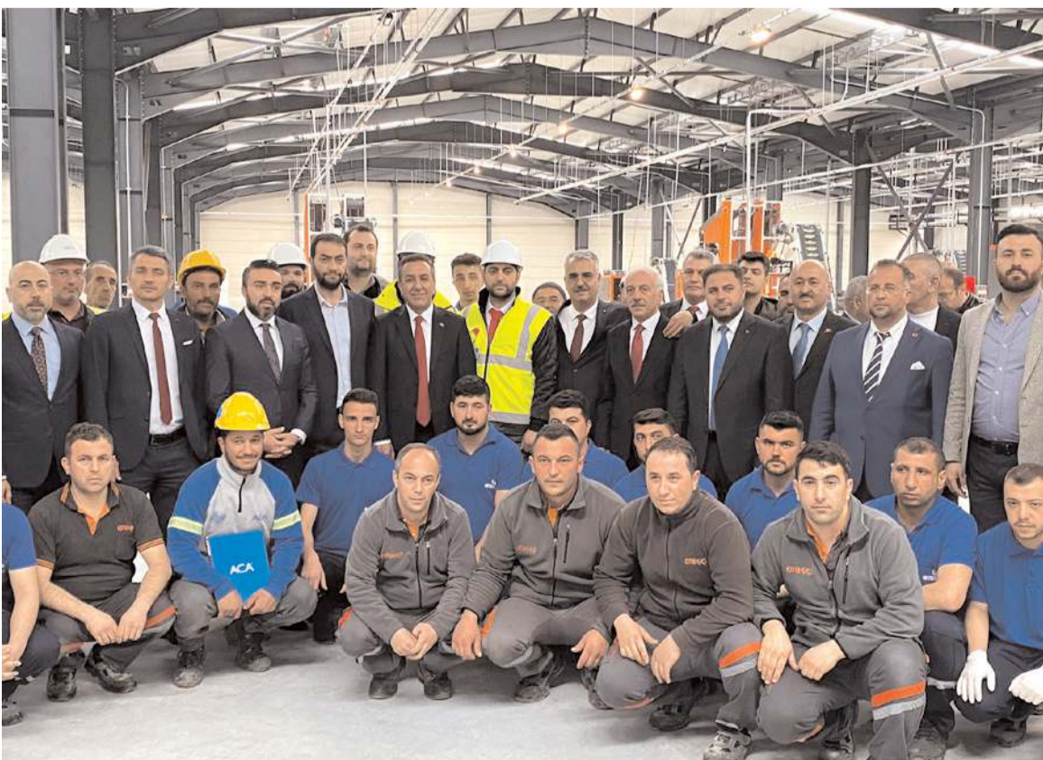
Milli Savunma Bakan Yardımcısı hemşhremiz Muhsin Dere ve diğer davetliler, işçilerle hatıra fotoğrafı çekti.

Sungurlu Organize Sanayi Bölgesi'nde (OSB) inşası devam eden barut, fişek ve kapsül üretim tesislerinde deneme üretimi başladı.