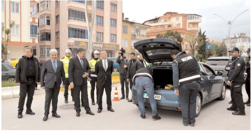
Eşref Hoca Caddesi ve Dr. İlhan Gürel Caddesi'nde asayiş ve güvenlik uygulamaları yapıldı.

Köylere Hizmet Götürme Birliği'nin 337 bin Euro'luk projesi %100 hibe almaya hak kazandı