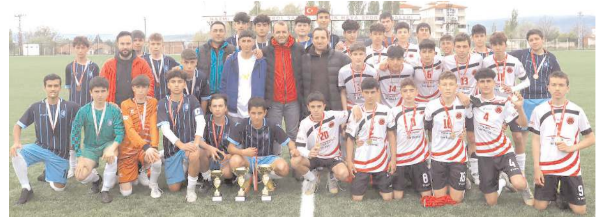
B Gençler futbolda dereceye giren okullar kupa töreni sonrasında toplu halde görüntü