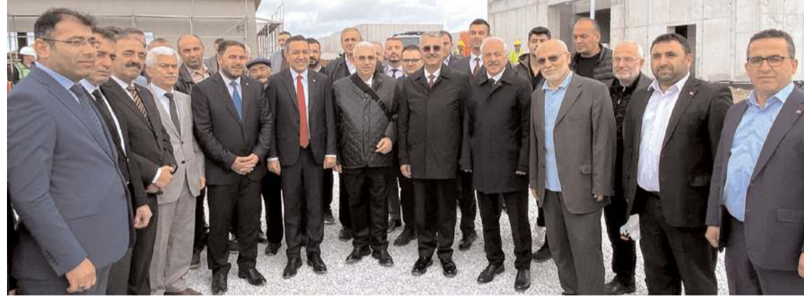
Tesislerde deneme üretiminin başlaması nedeniyle tören yapıldı.