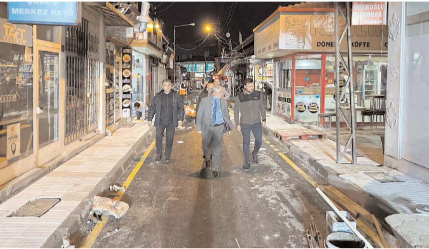
Tarihi Arastada alt yapı çalışmaları tamamlandı.