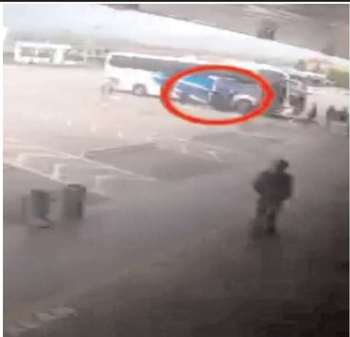
Operasyon güvenlik kameralarına yansdı.

Zanlının Çorum Şehirlerarası Otobüs Terminali'nde otobüsünden indiği ve yakalandığı anlar güvenlik kamerasına yansdı.(AA)