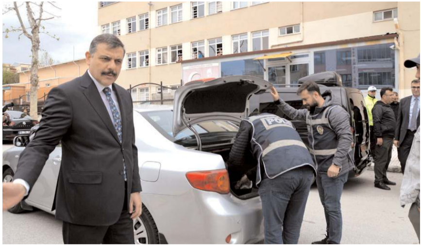
Vali Mustafa Çiftçi, açıklamalarda bulundu.

Son olarak narkotik suçlarla mücadele konusunda Çorum'un iyi bir noktada olduğunu anlatan Vali Çiftçi; "Türkiye sıralamasında ilimiz narkotikte 56.sırada. Bizden daha iyi durumda 25 il var. Zehir tacirlerine Çorum'da geçit vermeyeceğiz." şeklinde konuştu.