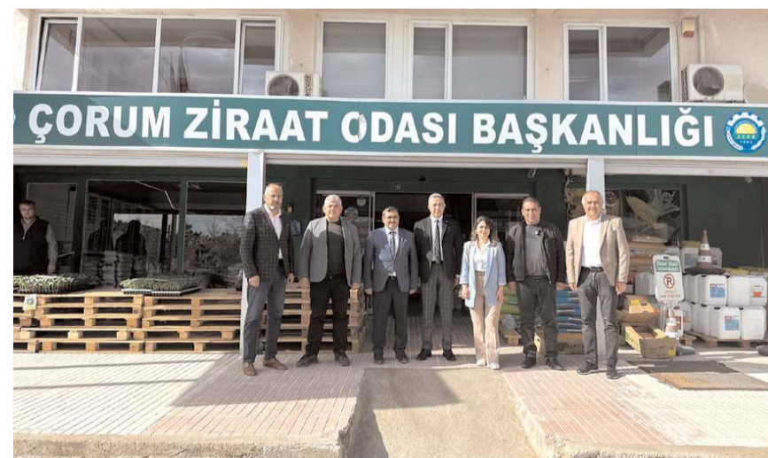
Ziyaretin sonunda toplu hatıra fotoğrafı çekildi.

az yüzde 1'i kadar destek alacak. Çiftçilerimizin borç yükünü hafifleteceğiz. Kredi, su ve elektrik borçlarının faizini silerek gelirine göre yeniden yapılandıracağız. Tarımsal üretimde kullanılan mazotun vergi almayaacağız. Çiftçi, ürün fiyatını ekmeden önce bilecek. Ürün taban fiyatını bir yıl önceden açıklayacağız. Hububat, yağlı tohum, baklagiller gibi ürünlerde alım garantisi vereceğiz. Sulama faturası hasattan sonra ödenecek. Tarım destekleri ve araçları haczedilmeyecek, desteklerden kesinti yapılmayacak. Hasat döneminde ithalatı yasaklayacağız. Mera alanlarını koruyacak, besicilere açacağız. Ürün paritelerini sürdürülebilir seviyeye çıkaracağız. Tarım sektöründe gençler ve kadınlar için teşvik getireceğiz." diye konuştu.