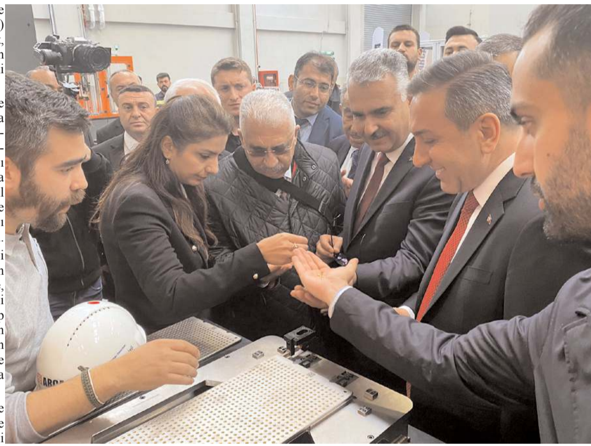
Milli Savunma Bakan Yardımcısı hemşhremiz Muhsin Dere, tesislerde üretilen ürünleri inceledi.

Sungurlu OSB'ye de önemli savunma sanayi yatırımlarının başladığını vurgulayan Dere, "Savunma sanayi yatırımları özellikli