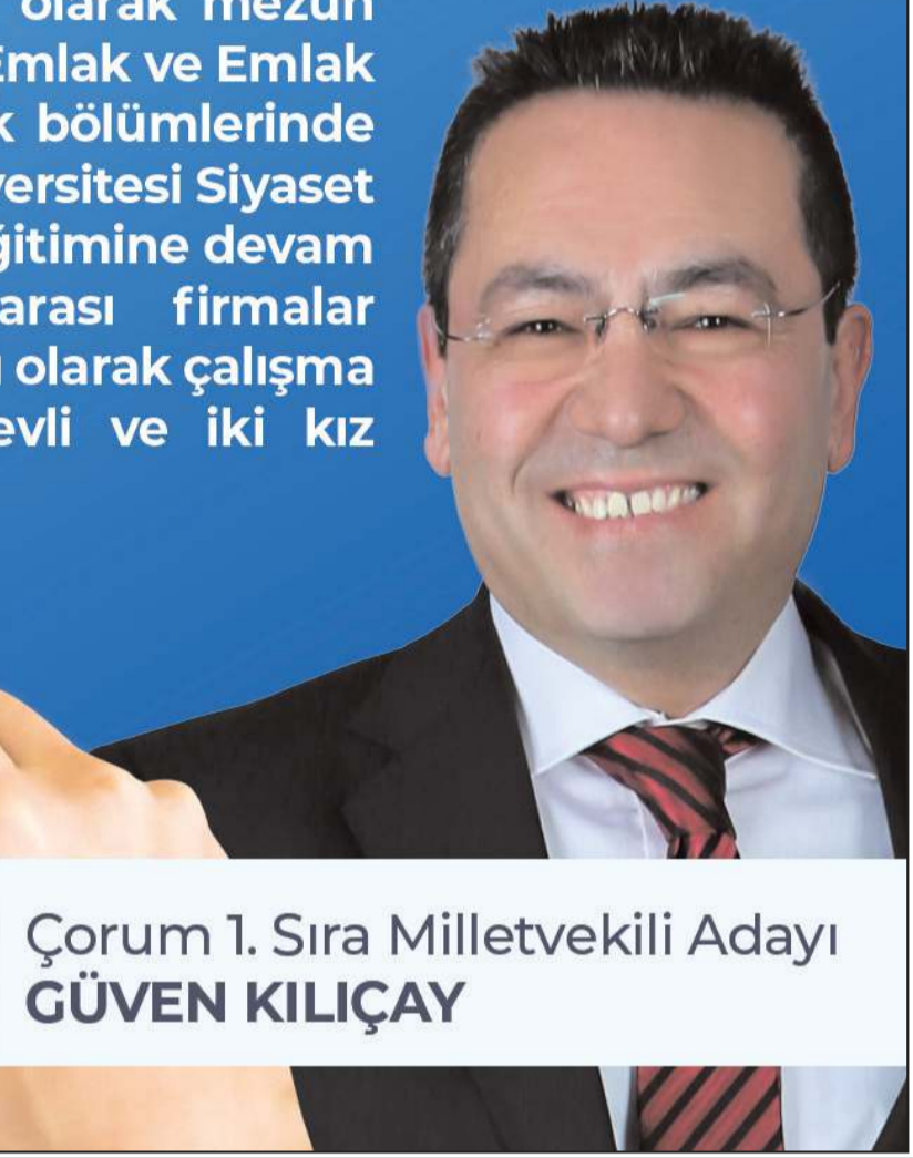
Çorum 1. Sıra Milletvekili Adayı GÜVEN KILIÇAY