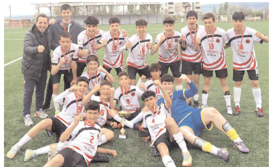
Spor Lisesi B gençler futbolda şampiyonluk kupası ile birlikte

ren okullara kupa ve maddiyaları verildi.