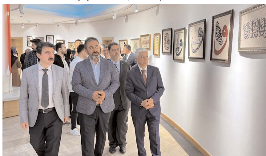
Protokol üyeleri sergiyi gezerek eserler hakkında bilgi aldı.