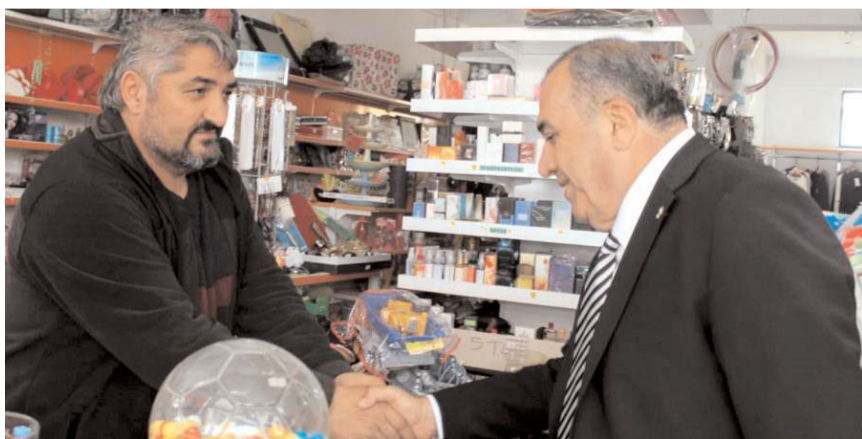
Milletvekili Adayı Vahit Kayırcı, Ortaköy'de esnafları ziyaret etti.

Milliyetçi Hareket Partisi Çorum Milletvekili Adayı Vahit Kayırcı, seçim çalışmaları kapsamında Ortaköy'ü ziyaret etti.