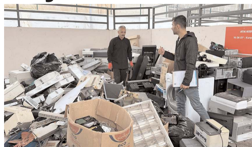
Çorum Belediyesi tarafından kurulan "1. Sınıf Atık Getirme Merkezi"nde toplanan 3.480 kg elektronik atık, MKE'ye teslim edildi.

Elektronik atıkların doğayı tehdit etmeden bertaraf edilmesi gerektiğini, ayrıca bu atıkların içerisindeki değerli maddelerin de ekonomiye kazandırılması gerektiğini ifade eden Yağbat, "Bu bilinçle, atıkları mobil atık getirme merkezlerinde ve 1. Sınıf Atık Getirme Merkezlerinde topluyoruz. Elektronik atıkların uygun şekilde geri dönüşümünün sağlanması için Çevre, Şehircilik ve İklim Değişikliği Bakanlığınca yayımlanan mevzuat gereği lisans ve izin belgelerine sahip devletin yetkili kuruluşu Makine ve Kimya Endüstrisi A.Ş. Geri Dönüşüm İşletme Müdürlüğü'ne 3.480 kg elektronik atığı teslim ettik. Yapılan çalışmayla çevre ve insan sağlığı korunurken atıkların içerdiği maddelerin ayrıştırılması sayesinde ekonomiye de önemli katkılar sağlanmış oluyoruz." diye konuştu. (Haber Merkezi)