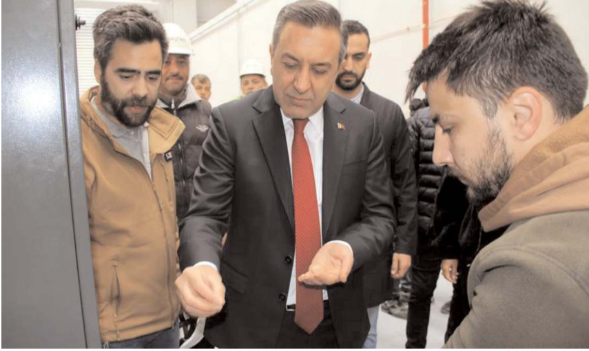
Tesiste 9 ayda kapsül üretimi başladı.