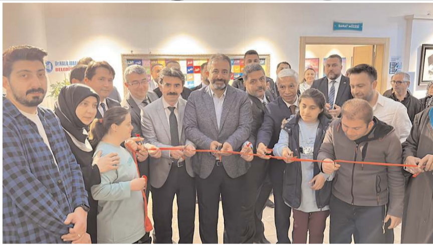
Açılış kurdelesini protokol üyeleri kesti.

Çorum Belediyesi Engelli Eğitim Merkezi öğrencileri ve Halk Eğitim Merkezi kursiyerleri tarafından hazırlanan "Geleneksel Keçe Sanatı" sergisi, 10-16 Mayıs Engelliler Haftası etkinlikleri kapsamında Çorum Belediyesi Sanat Galerisi ve Müzesi'nde sergilenmeye devam edecek. (Haber Merkezi)