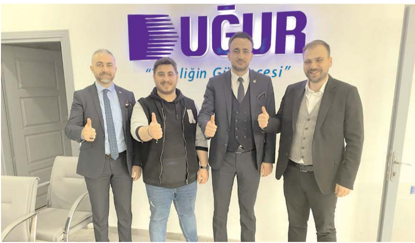
Milletvekili Adayı Ferhat Yeğen, esnafı ziyaret etti.