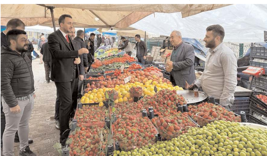
Ferhat Yeğen, pazarcı esnafını ziyaret etti.

Yeniden Refah Partisi Milletvekili Adayı Ferhat Yeğen, sahada çalışmalarını sürdürüyor.