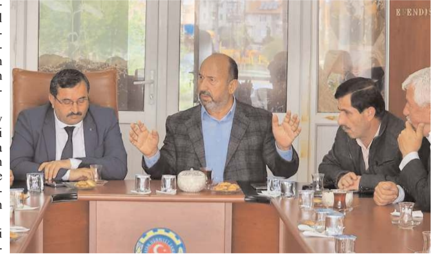
AK Parti Çorum Milletvekili Erol Kavuncu, ziyarette açıklamalarda bulundu.

Devletimiz ile çiftçilerimiz arasındaki iletişimi kuvvetlendiren, doğru desteklerle çiftçilerimizin