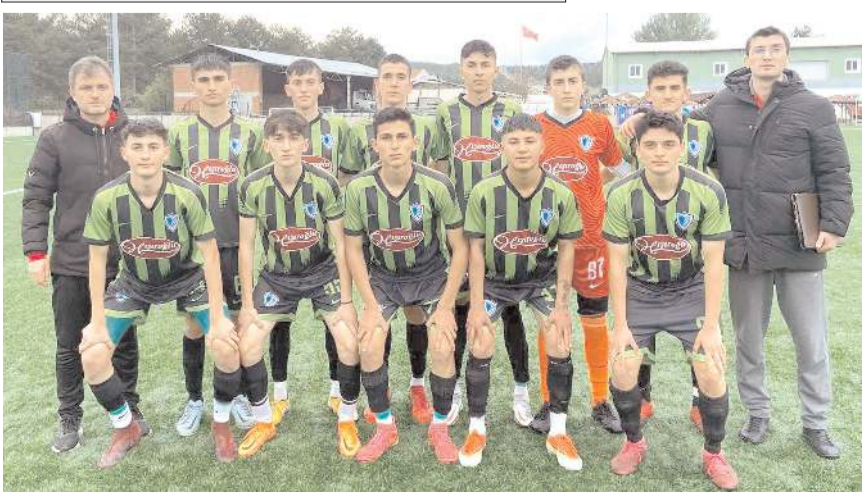
Mimar Sinan ikinci yarıya da galibiyet ile başlayarak şampiyonluğa bir adım daha yaklaştı