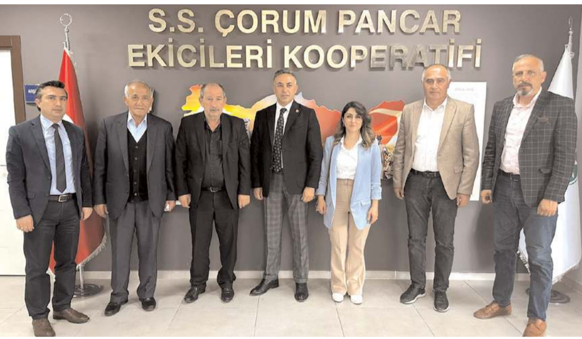
Millet İttifakı Milletvekili Adayları, Çorum Pancar Ekicileri Kooperatifini ziyaret ettiler.