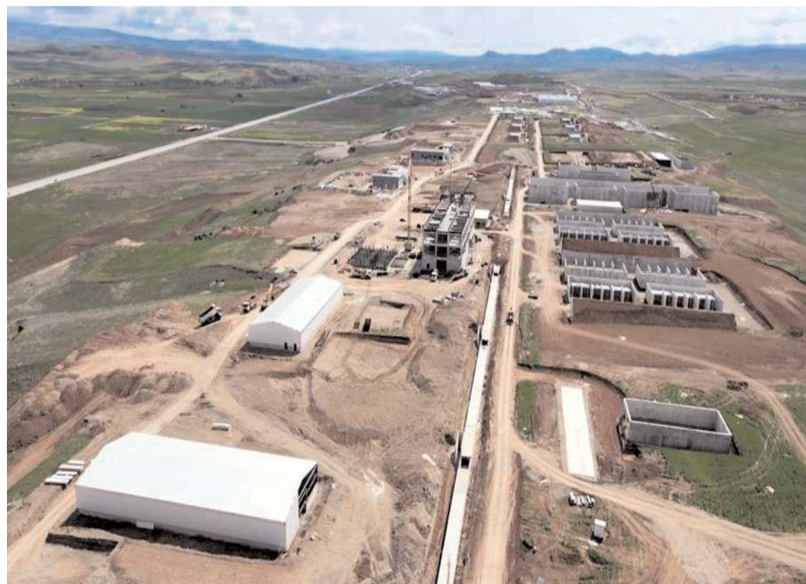
Tesislerin temeli Cumhurbaşkanı Recep Tayyip Erdoğan tarafından 13 Ağustos 2022'de atılmıştı.