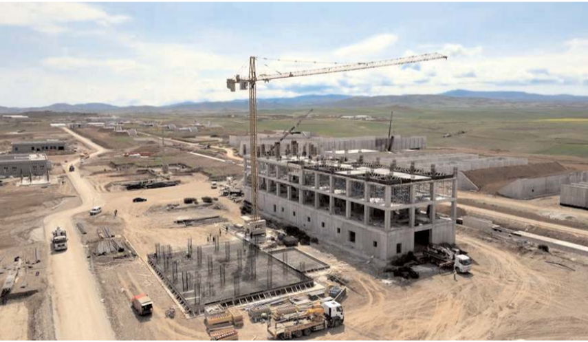
Fabrikaların inşaatları hızla devam ediyor.