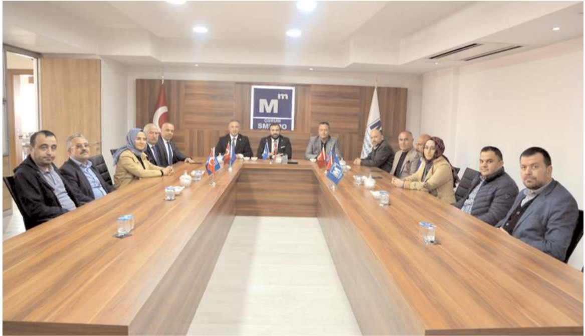
Ziyarette muhasebecilerin sorunları dile getirildi.