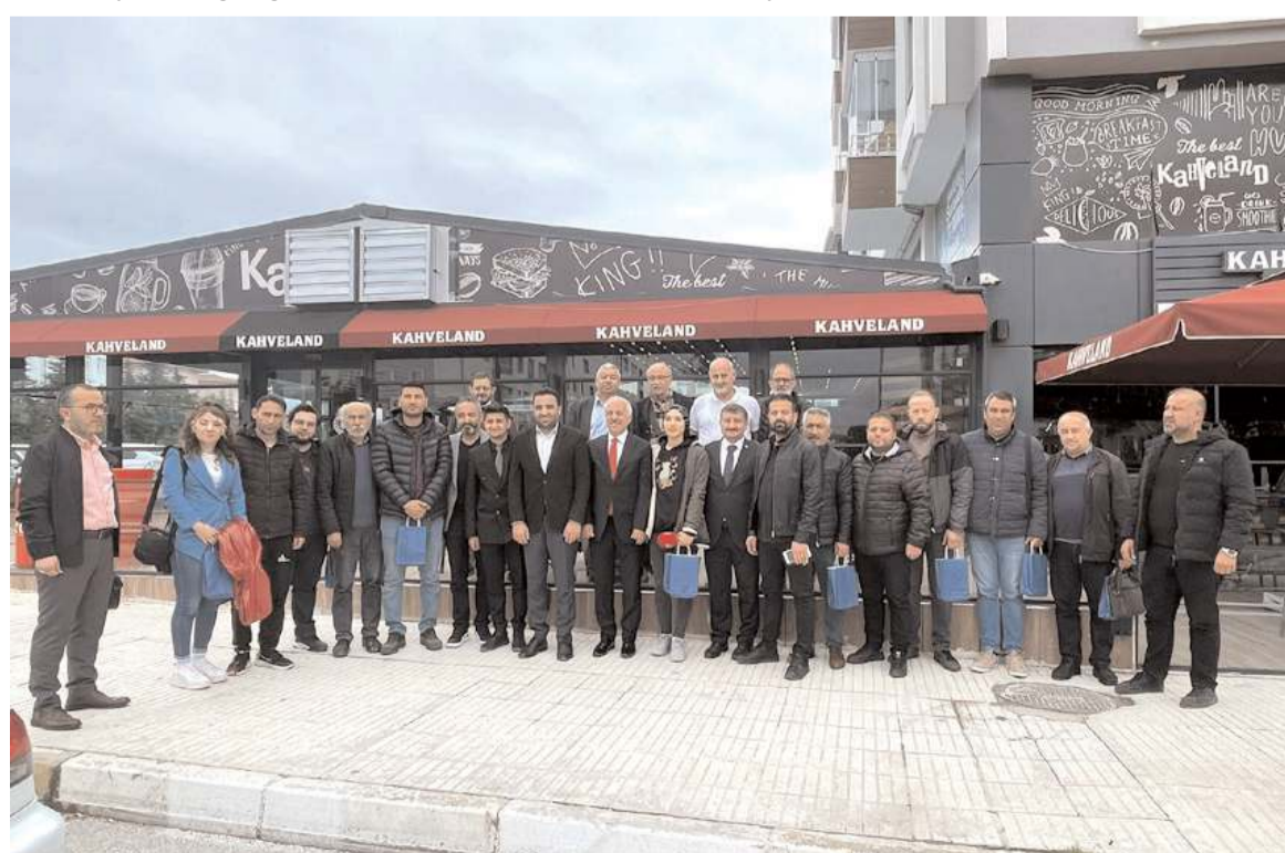
Basın toplantısının ardından hatıra fotoğrafı çekildi.