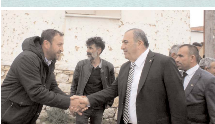
Kayırcı, Kışlaşık, İbek, Doğa, Emirbağ, Çayköy, Söğütözü, Sırçalı, Kargı, Çitli ve Tanrıvermiş köylerini ziyaret etti.