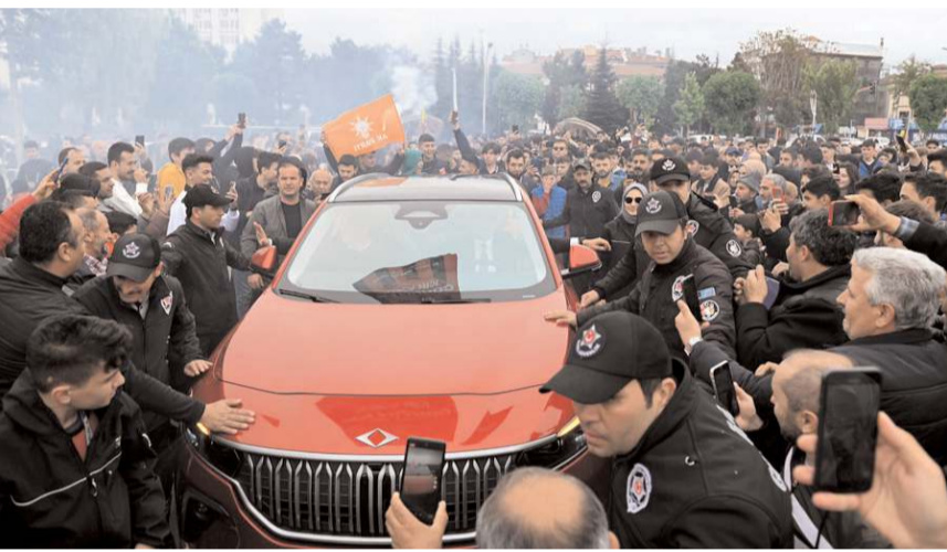
TOGG'un tanıtımı büyük bir coşkuya sahne oldu.