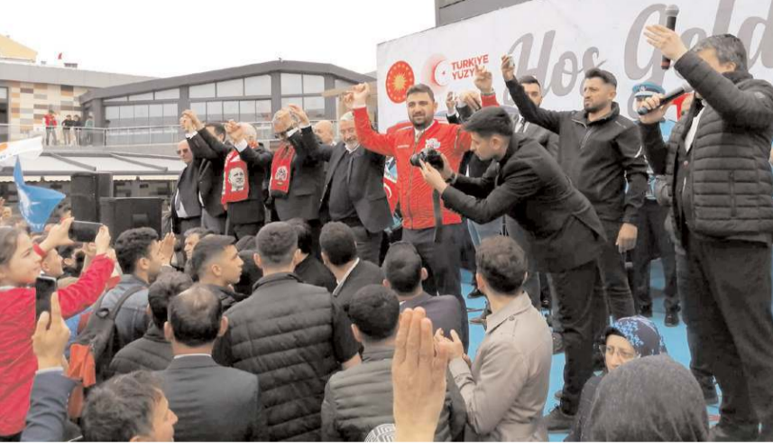
Kadeş Barış Meydanı'nda gerçekleştirilen törende konuşmalar yapıldı.

Büyük bir coşkuya neden olan ve TOGG T10X'un görücüye çıktığı tanıtım etkinliğinde vatandaşlar bol bol hatıra fotoğrafı çekindiler.