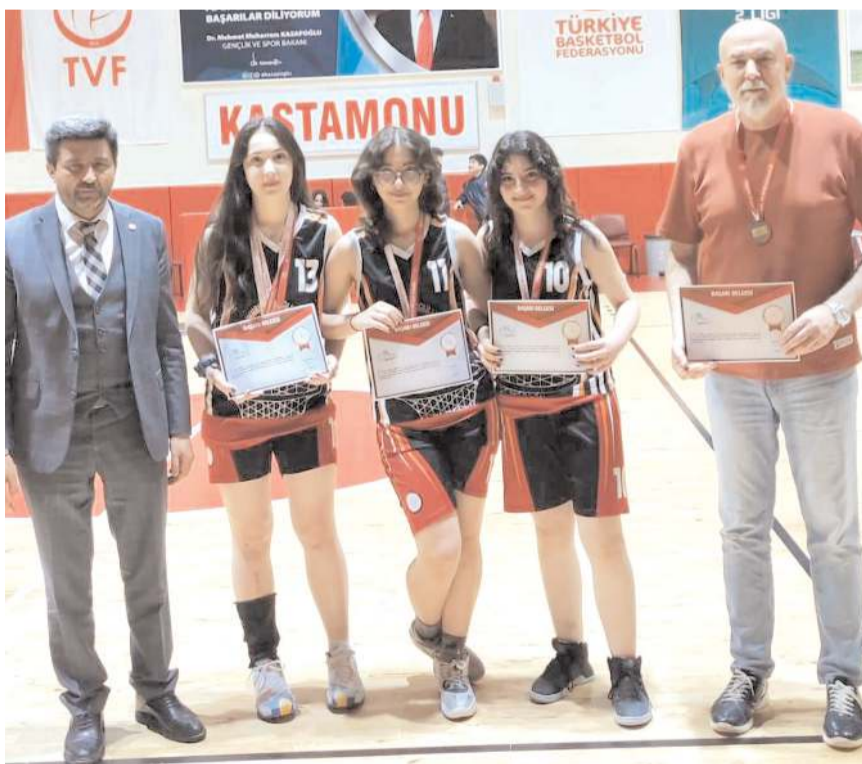
Atatürk Anadolu Lisesi Kastamonudan final vizesini alarak döndü

Atatürk Anadolu kız ve Ada Koleji Erkek takımları 9-13 Haziran tarihlerinde Konya'da yapılacak Türkiye finallerinde ilimisi temsil edecekler.