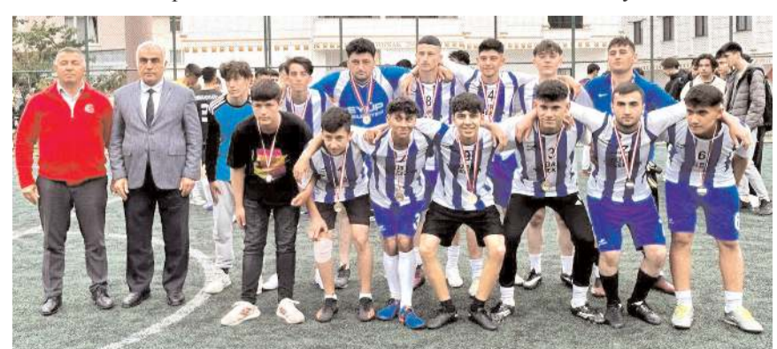
Birinci olan Borsa İstanbul Mesleki ve Teknik Anadolu Lisesi

Turnuva sonunda düzenlenen törenle birincilik kupaları sporcularına madalya verildi.