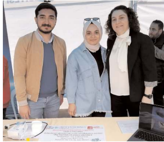
TEKNOFEST yarışmalarında derece elde eden projeler tanıtıldı.