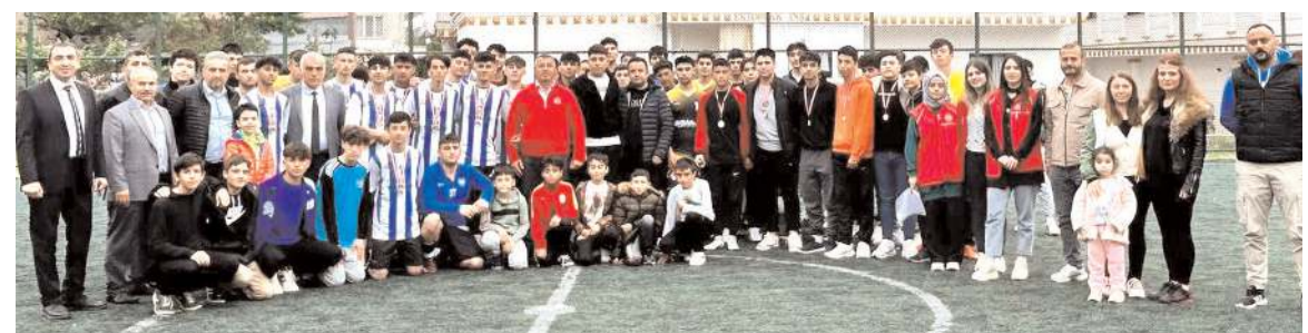
Turnuvada mücadele eden ve ödül törenine katılan idareciler toplu halde