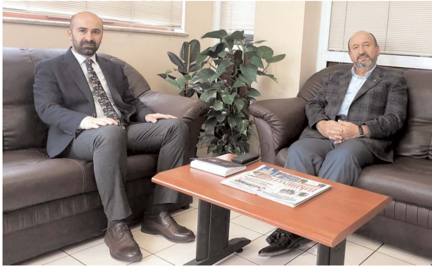
AK Parti Çorum Milletvekili Erol Kavuncu, gazetemize veda ziyaretinde bulundu

Görev süresi dolan AK Parti Çorum Milletvekili Erol Kavuncu, gazetemize veda ziyaretinde bulundu. Ziyarete açıklamalarda bulunan Kavuncu, "Olayları siyaset üstü bir bakış açısıyla değerlendirmeliyiz. Artık mesele şu aday bu parti meselesi değil mesele kazanımlara sahip çıkarak Türkiye Yüzyılı'nı inşa etme meselesidir" dedi.