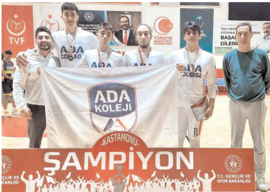
Ada Koleji erkek takımı grup ikincisi olarak finallere gitme hakkı kazandı