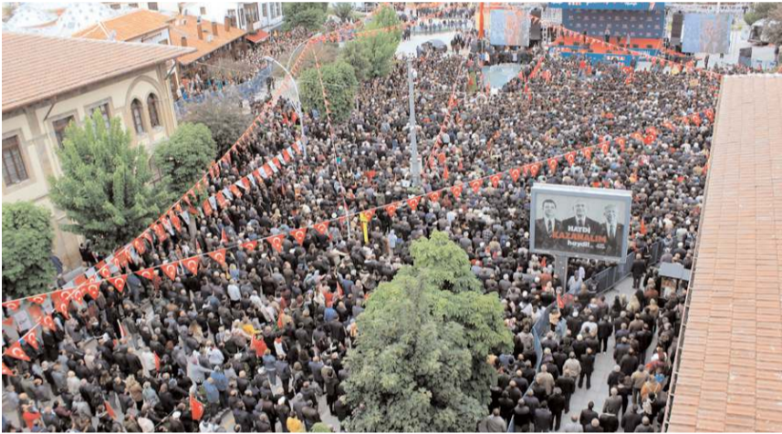
Mitinge katılanlar havadan böyle görüntülendi.