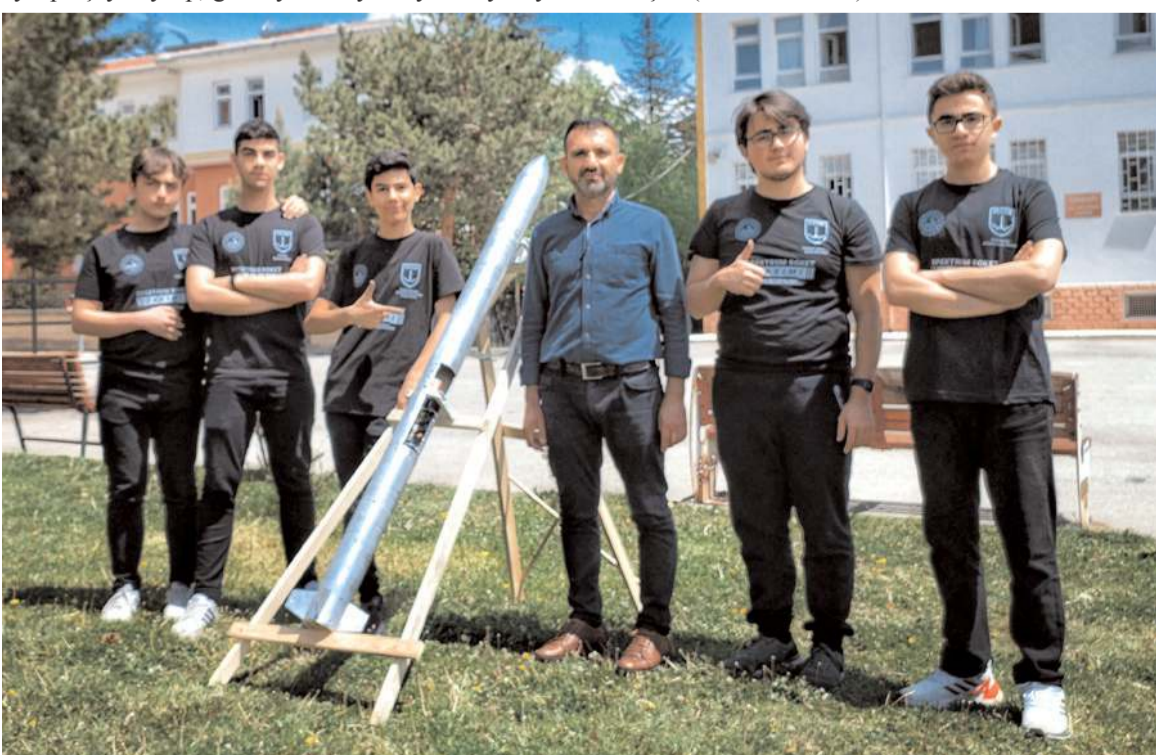
Çorum Şehit Abdullah Tayyip Olçok Anadolu Lisesi öğrencileri, Türkiye birincisi olarak finale kaldı.

Bu zorlu safhada bize her türlü desteği veren okul idaremize, öğretmenlerimize, personelimize ve sponsorlarımıza teşekkür ederiz. Finallerde de güzel bir derece ile gelecek Çorum halkımıza haklı bir gurur yaşatmak için elimizden geleni yapacağız inşallah." diye konuştu. (Haber Merkezi)