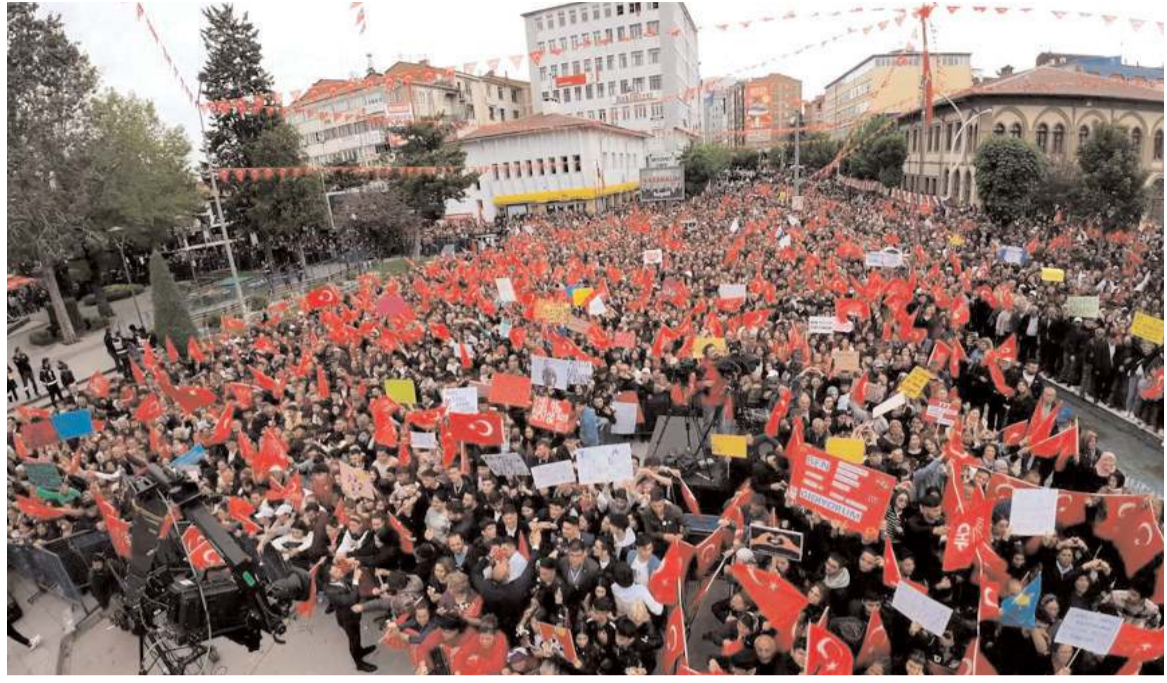
Mitinge katılım yoğun oldu.

Hükümet değişince yapılan yatırımlar boş gidecekmis gibi bir algı oluşturulmaya çalışıldığını aktaran Yavaş; "Yapılan İHA'lar, SIHA'lar ve gemiler gerçekten göğsümüzü kabartıyor. Neden dersiniz. 90'lı yıllarda başlandı İHA'ların yapımı. Geminin yapıldığı tersane 1972 yılında yapıldı. O günden bugüne hiçkimse bunların reklamını yapmadı. Bir sonraki hükümete devretti onlar da geliştire geliştire bu hale getirdiler. Elbette bu hükümetten sonra gelenler de çok daha iyisini yapacak. Çünkü sınırlamıza Amerikan ve Rus askerleri cirit atarken, PKK'ya ve YPG'ye silahlı eğitim verilirken hatta helikopter temin ederken, o İHA'lara, SIHA'lara ihtiyacımız çok. Silahları bırakmadıkça, sınırlarımızı tehdit ettikçe İHA ve SIHA'lar neden hangara çekilsin. Bunları sanki babalarının parasıyla yapmış gibi hareket ediyorlar. Şunu yaptık bunu yaptık diyorlar. Bunların yapımında herkesin vergisi var. Kendileri gidince sanki partilerinin müzesine koyacaklar. Biz çok daha iyilerini yapacağız. Nereye giderlerse gitsin, uçak yaptık, helikopter yaptık, füzemiz var diyorlar. Allah razı olsun iyi ki yaptınız ama