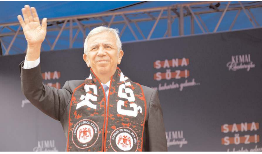
Ankara Büyükşehir Belediye Başkanı Mansur Yavaş