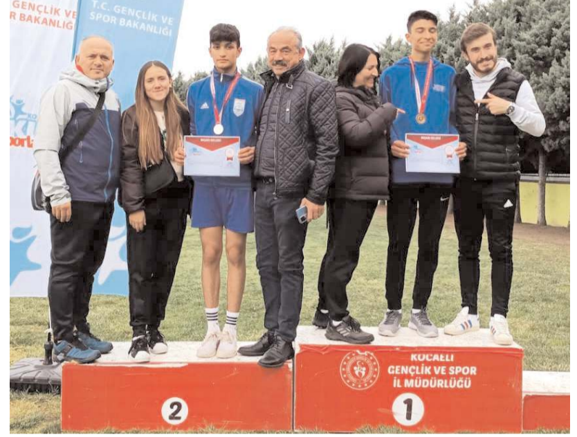
Kocaeli'nde yapılan yıldızlar atletizm grup birinciliğinde kürsüye çıkan ilimiz sporcuları idareci ve antrenörler ödül töreni sonrasında toplu halde