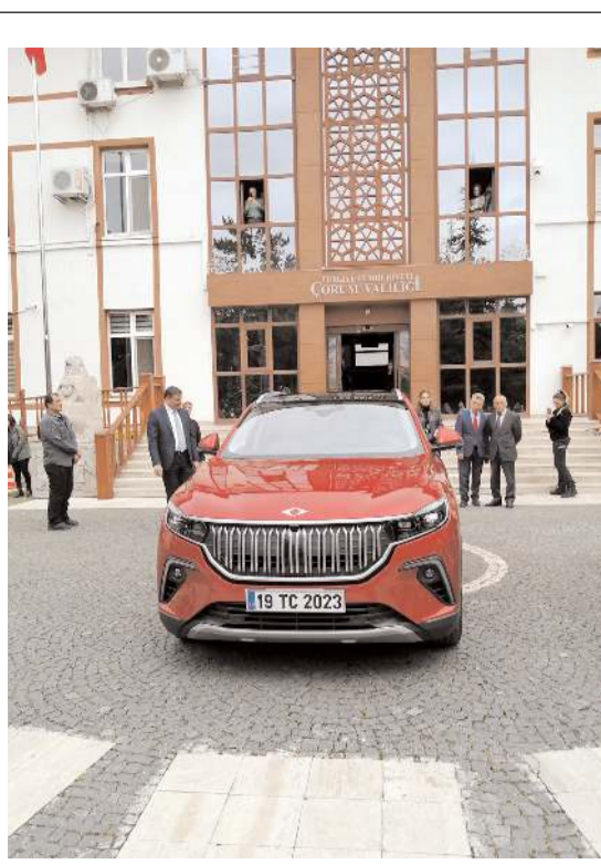
Yerli ve milli otomobil TOGG, Çorum Valiliği önünde sergilendi.