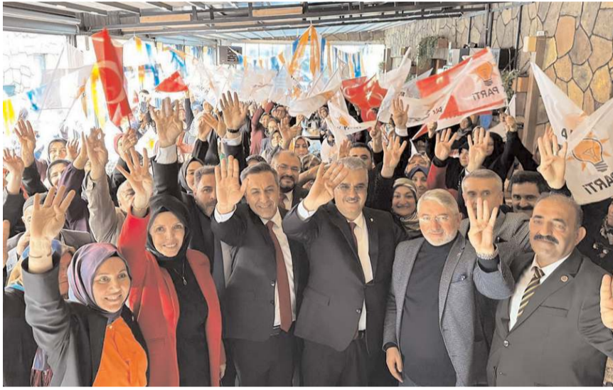
Av. Yusuf Ahlatcı, AK Parti Sungurlu Kadın Kolları toplantısına katıldı.