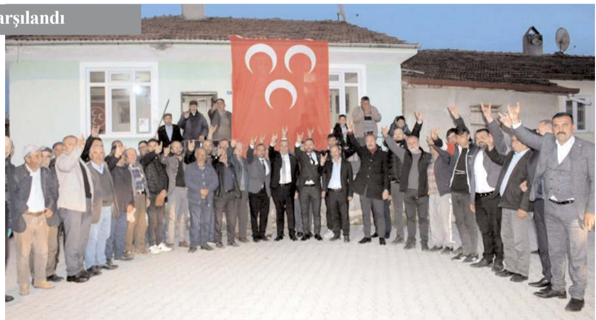
Ziyaretlerin sonunda toplu hatıra fotoğrafı çekildi.

Geçmişte de milletvekilliği yaptığını hatırlatan Kayırcı, "O za-