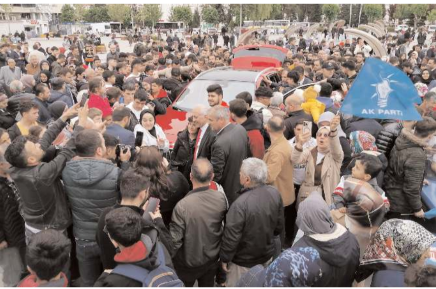
Vatandaşlar bol bol fotoğraf çekti.