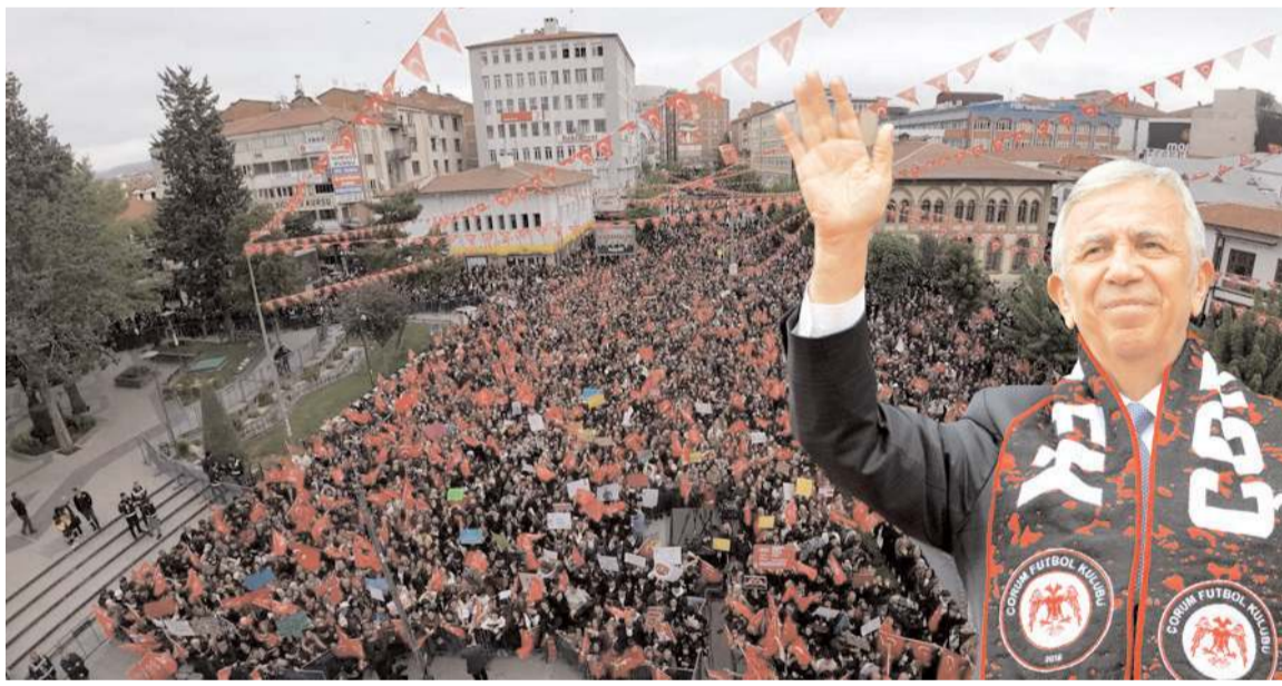
Mansur Yavaş Çorum'da vatandaşlara seslendi.