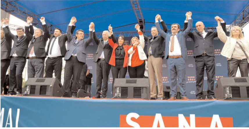
Millet İttifakı miting sonrası böyle poz verdi.