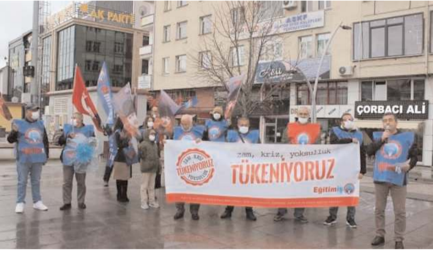
Eğitim İş Sendikası Çorum Şube Yönetim Kurulu açıklama yaptı.

"Türkiye için kritik bir seçim olan 14 Mayıs tarihi yaklaşip ittifaklar arası rekabet kızıştıkça iktidar, devletin kadim ilkelerini bir rafa kaldırmaya devam etmektedir. Bunun son örneği, kamu işçisinin en doğal hakkı olan zammın, seçime malzeme yapılmasıdır. Bilişildiği üzere; AKP'li Cumhurbaşkanı Recep Tayyip Erdoğan, 700 bin kamu işçisini ilgilendiren zam oranını yüzde 45 olarak açıklamış ve böylece en düşük kamu işçisi maaşının -refah payı dahil- 15 bin TL'ye yükseldiğini 'müjdelemiştir.' Bu açıklamasının kuyruğuna seçim öncesi asgari ücret mesajını da ekleyen Erdoğan, temmuz ayını işaret ederek 'Asgari ücret artışından memur ve emekli maaş zammına yılbaşında gerçekleştireceğimiz çalışmaların devamını getireceğiz' demiş ve yine umut ticareti yapmıştır. Oysa bu açık-