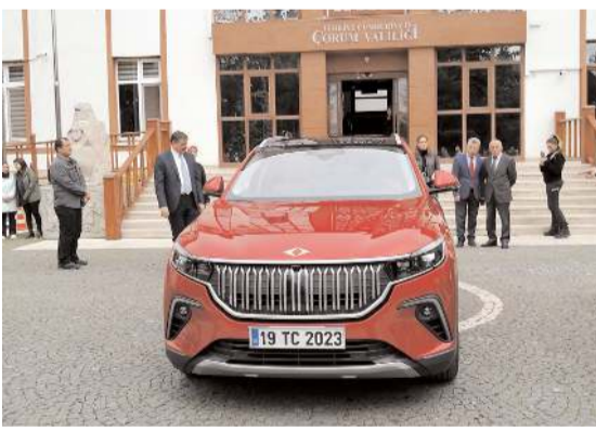
Yerli ve milli otomobil TOGG, Çorum Valiliği önünde sergilendi.