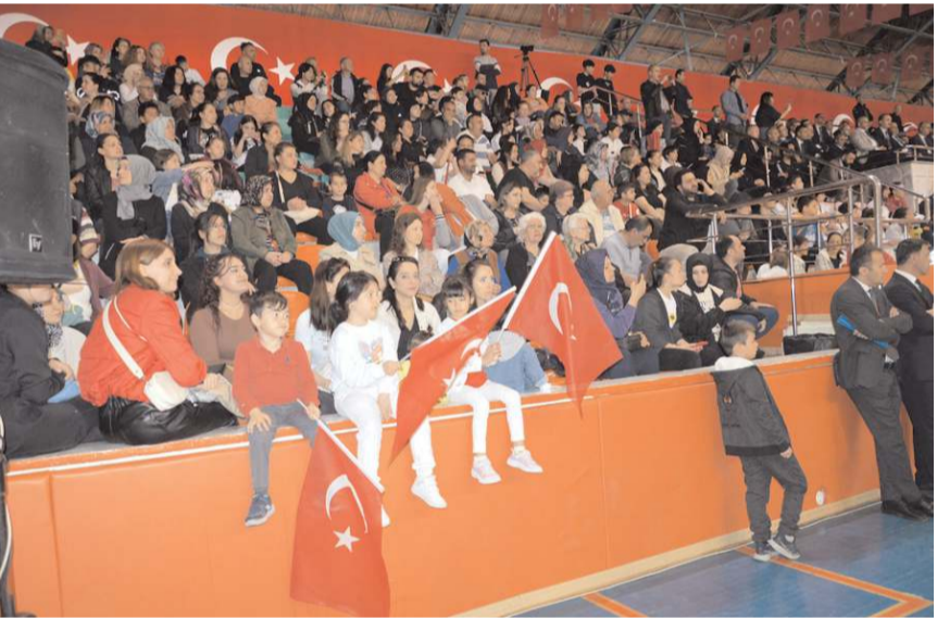
Kutlama vatandaşların ilgisi yüksek oldu.