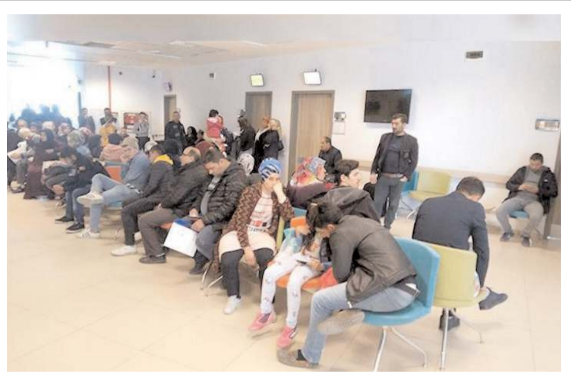
Bazı ilçelerde doktor sayısının yetersiz olması yoğunluğa neden oluyor.