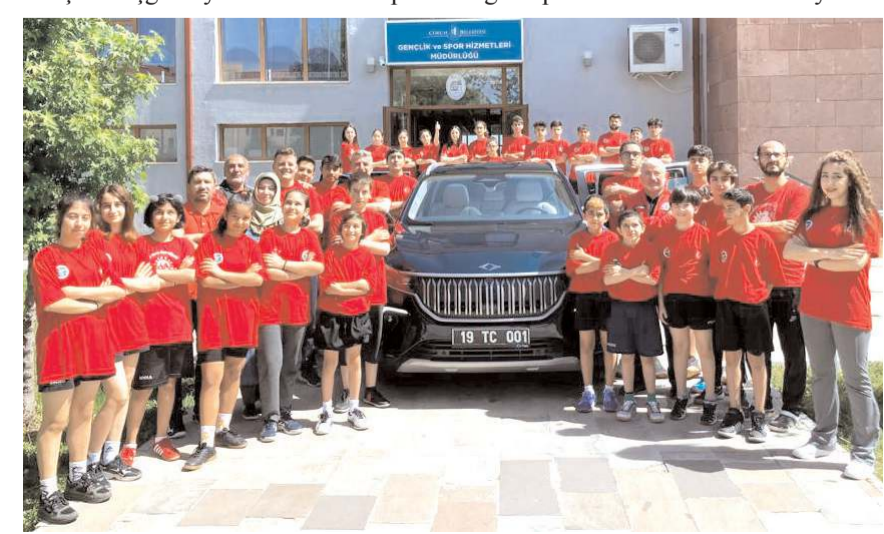
Masa tenisi sporcu ve antrenörleri TOGG ile birlikte toplu halde görülüyor