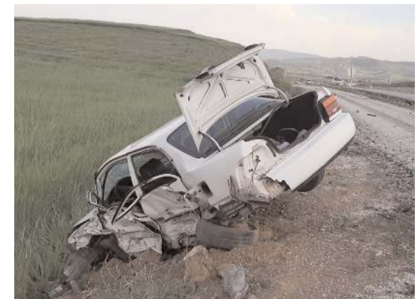
Kaza Çorum-Ortaköy kara yolunun 10. kilometresinde meydana geldi.