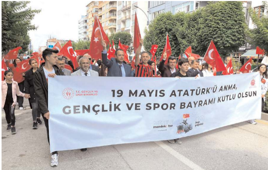
Yürüyüş Saat Kulesi Meydanı'nda başlayıp Atatürk Anıtı'nda sona erdi.