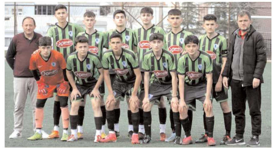
Mimar Sinan U 17 takımı bugün kazanması halinde şampiyonluğu garantileyecek

İskilip ilçe sahasında oynanacak günün ilk maçında ise İskilipgücüspor ile He Kültürspor karşılaşacak. İskilipgücüspor'un bir iddiası bulunmuyor. Kültürspor ise hafta içinde Mimar Sinan önünde aldığı galibiyet ile devam ettirdiği şampiyonluk şansını bu maçı kazanarak rakibinin kaybetmesini bekleyecek. Haftanın diğer maçında ise Hattuşa Gençlikspor ile Gençlerbirliği takımları İtfaiye sahasında saat 16'da karşılaşacak.