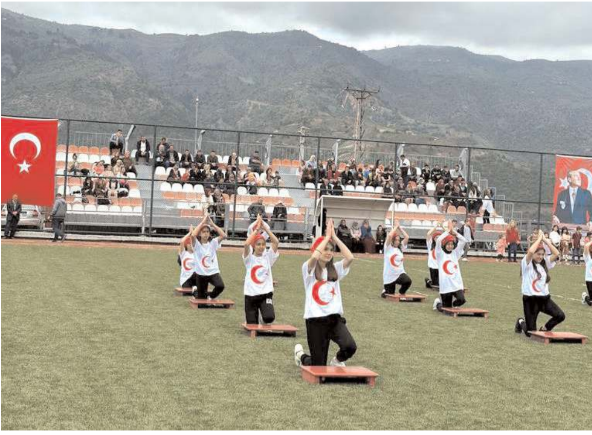
Öğrencilerin yaptıkları gösteriler bol bol alkış aldı.