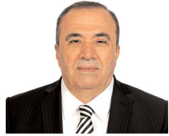
MHP Çorum Milletvekili Vahit Kayırcı