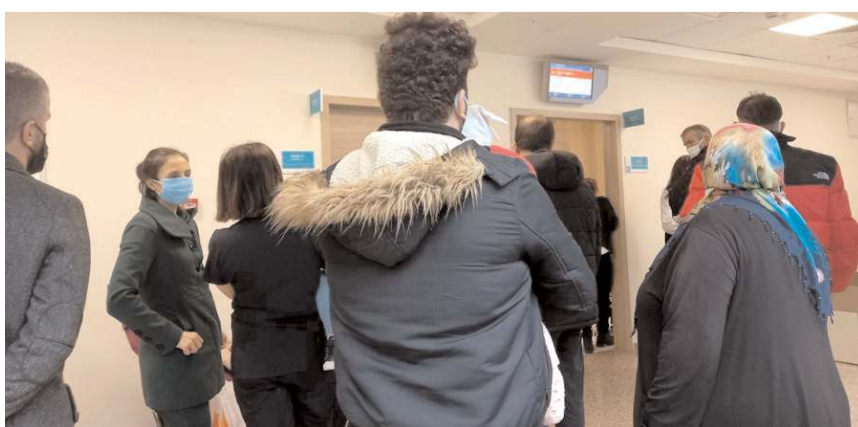
Vatandaşlar doktor eksikliğinin giderilmesini istedi.

Sungurlu başta olmak üzere, Osmancık ve İskilip'te hastanelerde bazı branşlarda doktor sıkıntısı yaşandığı öğrenildi.