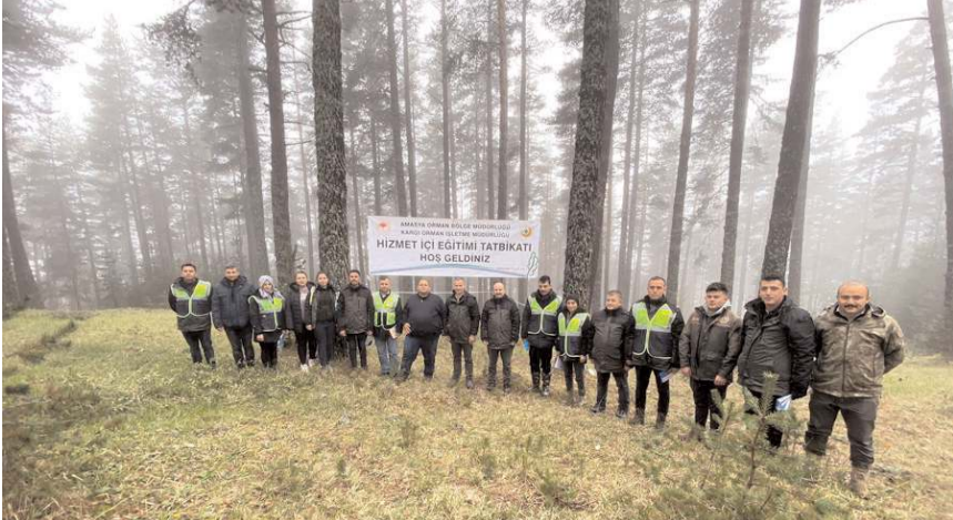
Personele boşaltma kesimi, gençlik bakımı, meşcere altı bakımı, hazırlama kesimi, tohumlama kesimi hakkında uygulamalı eğitim verildi.

Açıklamada, "Amasya Orman Bölge Müdürlüğümüz orman servetini geliştirmek ve ormanların ihtiyaç duyduğu silvikültür bakımları gerçekleştirerek orman varlığını sağlıklı olarak büyümesini sağlamak için teknik gelişimleri takip etmeye ve çalışmalarında uygulamaya devam ediyor. Ormanlarımızın sürekliliğini sağlamak ve gelecek kuşakların yararlanabileceği çok fonksiyonel ormanlar kurmak için, ağaçların ihtiyaçları-