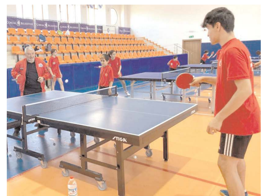
Başkan Aşgın ziyareti sırasında deprem bölgesi sporcularla masa tenisi oynadı

larla birlikte TOGG'u inceledi ve onlarla birlikte poz verdiler.