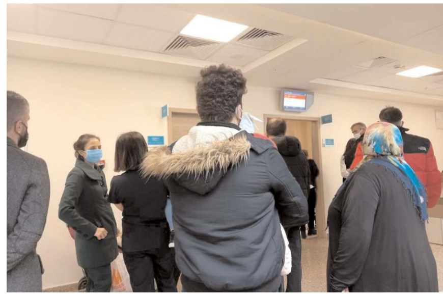
Vatandaşlar doktor eksikliğinin giderilmesini istedi.

Sungurlu dışında Çorum'un diğer iki büyük ilçesinde de durum aynı olduğu öğrenilirken, İlçelerde Sağlık Bakanlığı'nın MHSR sisteminden randevu almak isteyen hastalar iki hafta sonrasına randevu alabildiklerini belirterek, yaşanan sıkıntının bir an önce çözülmesini belediklerini dile getirdiler.