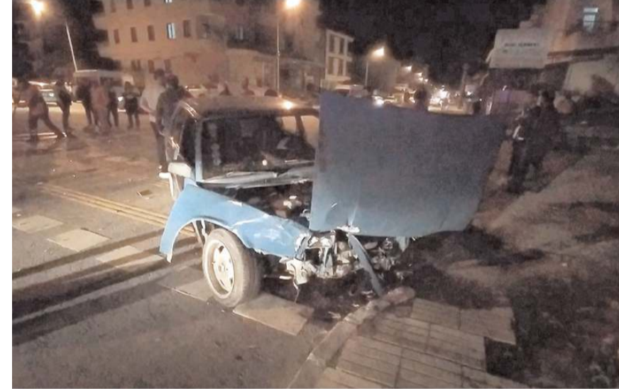
Kazada her araçta da maddi hasar meydana geldi.