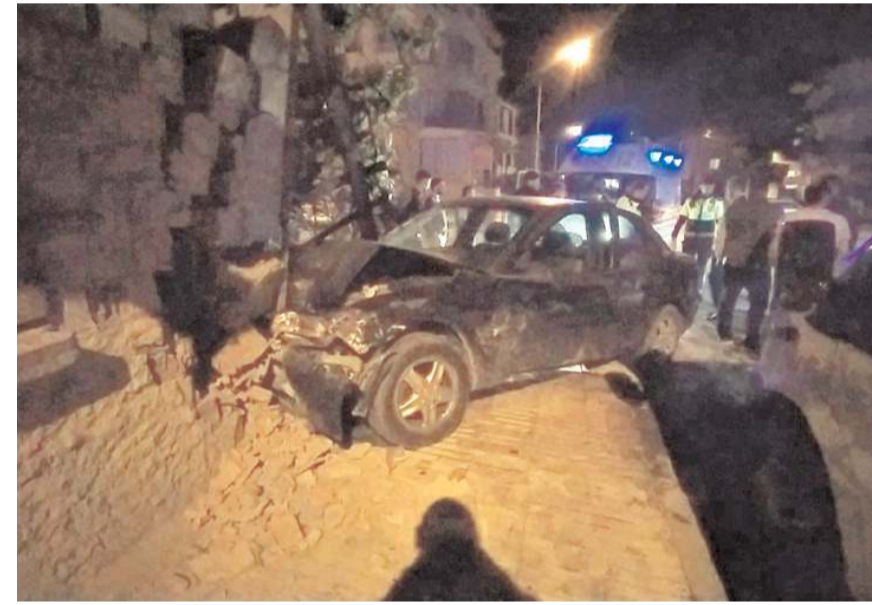
Kaza, Gülabibey Mahallesi'nde meydana geldi.

Kazayla ilgili başlatılan soruşturma sürüyor. (İHA)