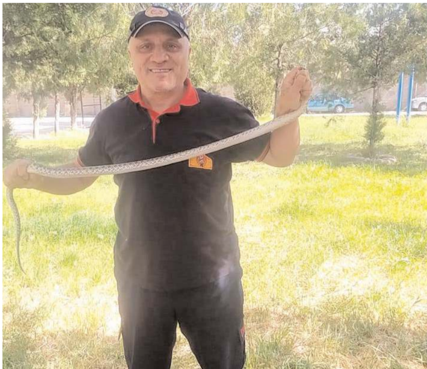
İtfaiye ekipleri yılanı yakaladı.

Sungurlu'da site bahçesinde ağaca çıkan yılan itfaiye ekipleri tarafından yakalandı.