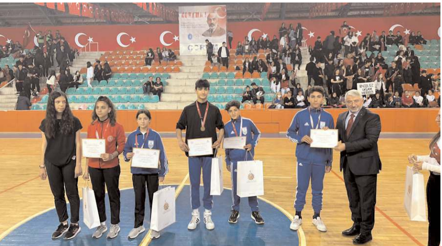
Yarışmalarda derece elde eden öğrencilere ödülleri protokol üyeleri tarafından verildi.