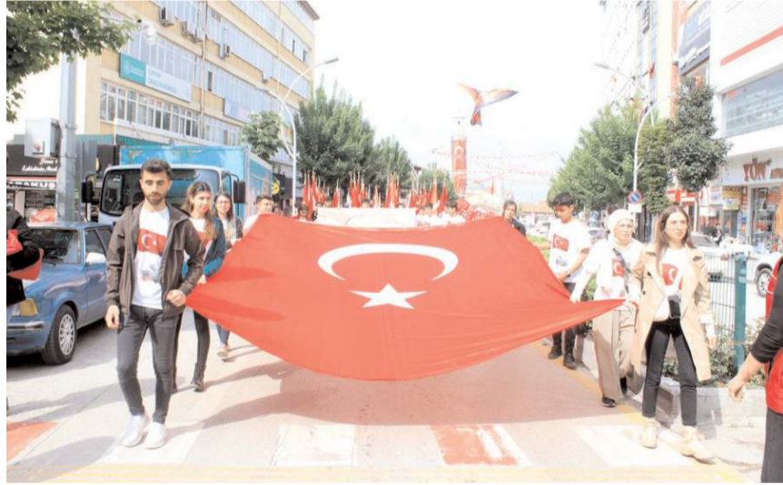
Gençler ellerinde Türk Bayrakları ile yürüdüler.