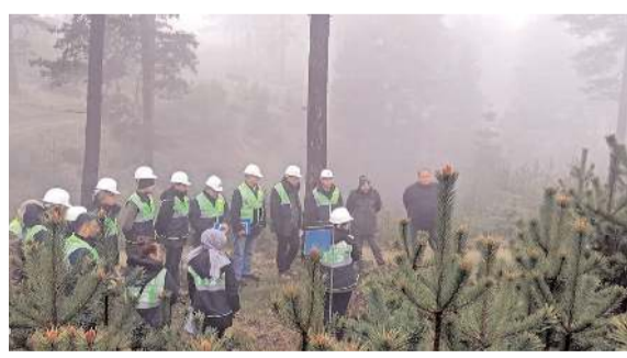
Eğitim Kargı'da yapıldı.

na, biyolojik özelliklerine, yetişme şartlarına göre, genç meşcere bakımlarını yapıyor, ormanlarını gençleştirmeye ve güzelleştirmeye devam ediyor." ifadelerine yer verildi.(AA)