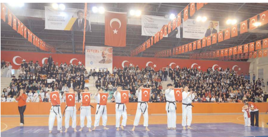
Spor gösterileri ilgi çekti.