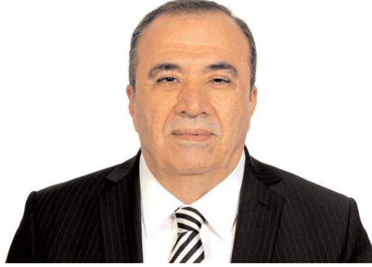
MHP Çorum Milletvekili Vahit Kayrıcı

Vahit Kayrıcı, mesajında şu ifadelerle yer verdi: "14 Mayıs genel seçimlerinde; yüce Allah'ın izni, siz değerli hemşehrilerimizin teveccühleri ile milletvekili seçilmek bizlere tekrar nasip oldu. Ön-