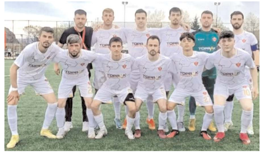
Osmançıkgücü yarın kazanarak umutlarını son haftalara taşımak istiyor

yarıda büyük düşüş gösteren Osmançıkgücüspor yarın saat 16'da Düvenci Belediyespor deplasmanında mücadele edecek. Kırmızı Beyazlılar bu maçı kazanarak ilk iki iddiasını devam ettirmek istiyor. Haftanın diğer maçında ise Bayat ilçe sahasında Bayat Belediyespor ile Oğuzlar belediyespor takımları Oğuzlar ilçe sahasında karşılaşacaklar.