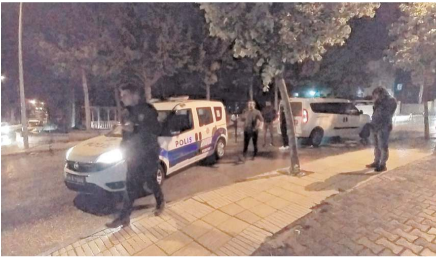
Olay Bahçelievler Mahallesi'nde meydana geldi.