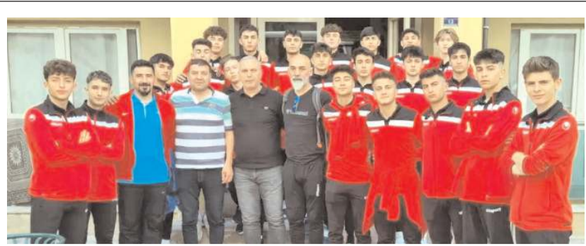
Niğde Belediyespor grup birinciliği için sahaya çıkacak