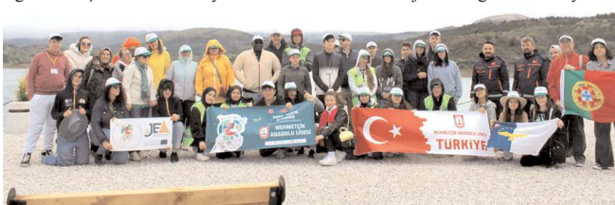
Proje kapsamında öğrenci ve öğretmenler Çorum'da çeşitli etkinliklere katıldılar.

Erasmus projesi kapsamında grup, Kapadokya'yı ziyaret etti. Bölgenin benzersiz coğrafi özellik ve güzelliklerini keşfeden grup, doğal çevrenin korunmasının önemine dikkat çekti. Ayrıca grup, atık kağıtlardan geri dönüşüm yapmayı öğrendikleri bir atık geri dönüşüm etkinliği de yaptı. (Haber Merkezi)