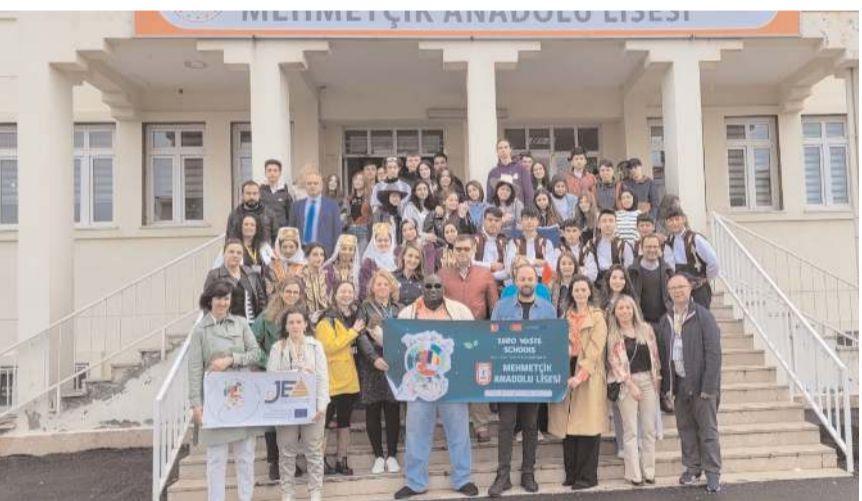
Polonya, Portekiz ve Romanyalı öğretmen ve öğrencileri, proje ortağı Çorum Mehmetçik Anadolu Lisesi ağırladı.