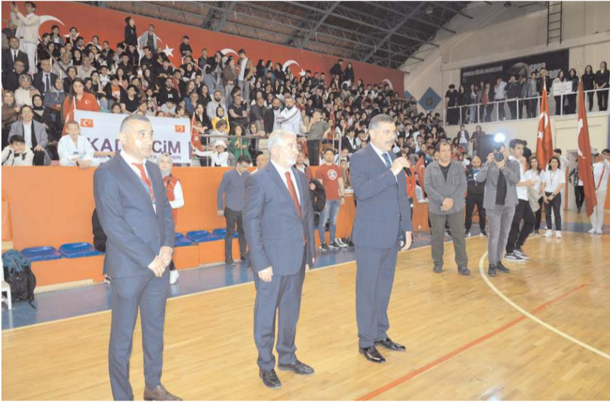
Protokol üyeleri vatandaşları selamladı.