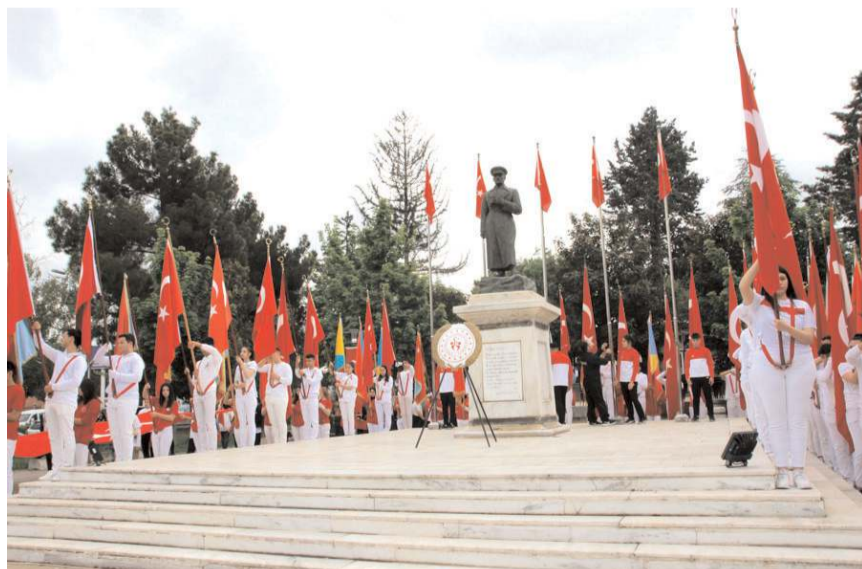
Resmi kurum ve kuruluşlar ile siyasi partilerin temsilcileri Anıta çelenk sundular.