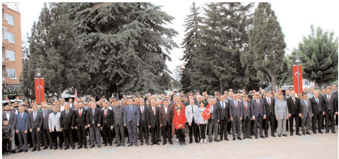
19 Mayıs Atatürk'ü Anma, Gençlik ve Spor Bayramı programı kapsamında ilk tören Atatürk Anıtı'nda yapıldı.