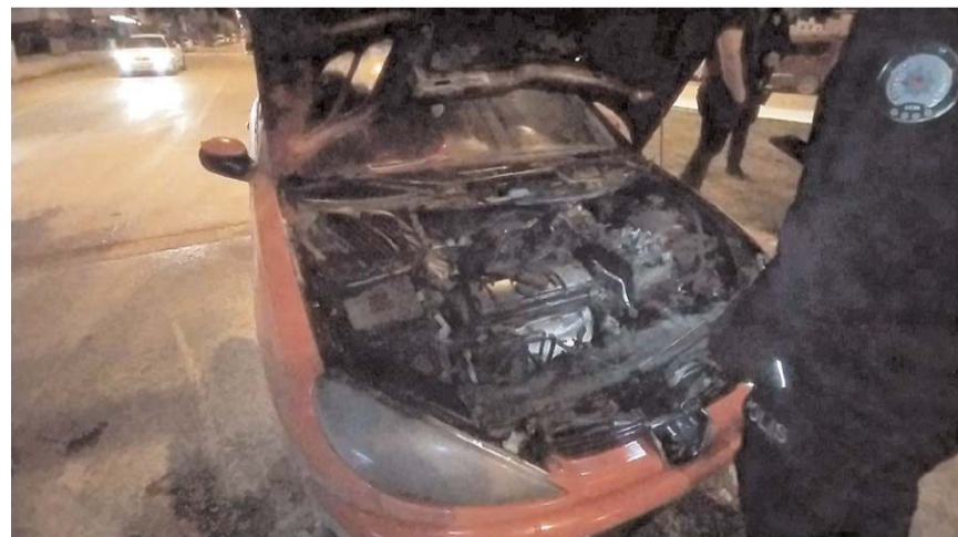
Olay, Ulukavak Mahallesi'nde meydana geldi.