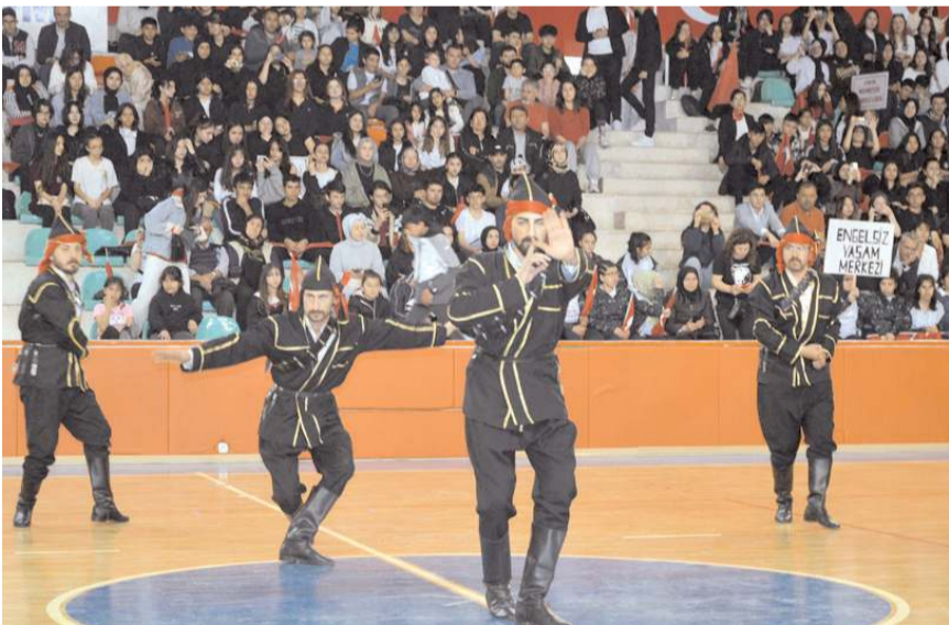
Programda halk oyunları gösterileri yapıldı.