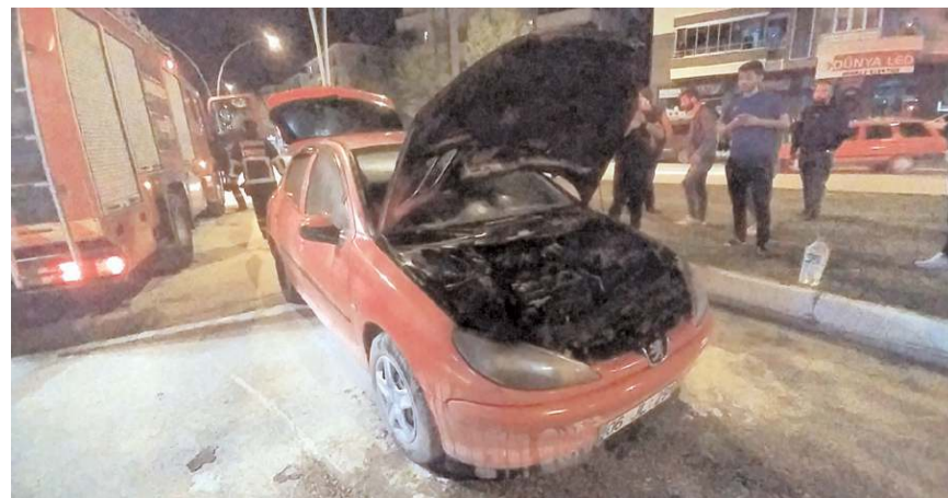
Otomobilde maddi hasar meydana geldi.

Çorum'da seyir halindeki bir otomobilin motor kısmında yangın çıktı. Yangın itfaiye ekipleri tarafından söndürüldü.