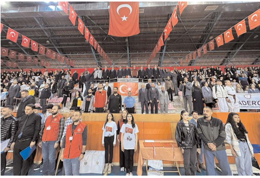
Kutlama programı Atatürk Spor Salonu'nda yapıldı.