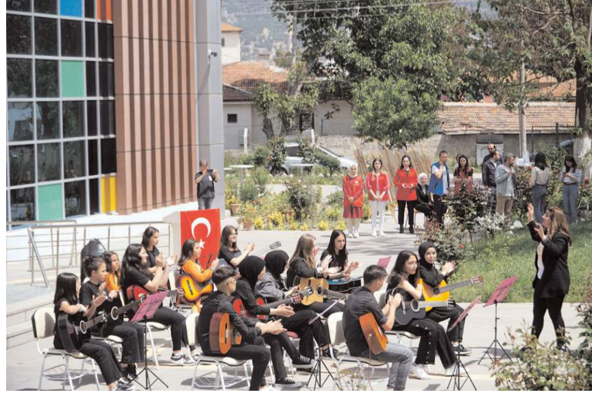
Öğrenciler müzik dinletisi sundu.

Program sonunda ilçe genelinde düzenlenen yarışmalarda derece elde eden öğrencilere ödülleri protokol üyeleri tarafından takdim edildi. (Haber Merkezi)