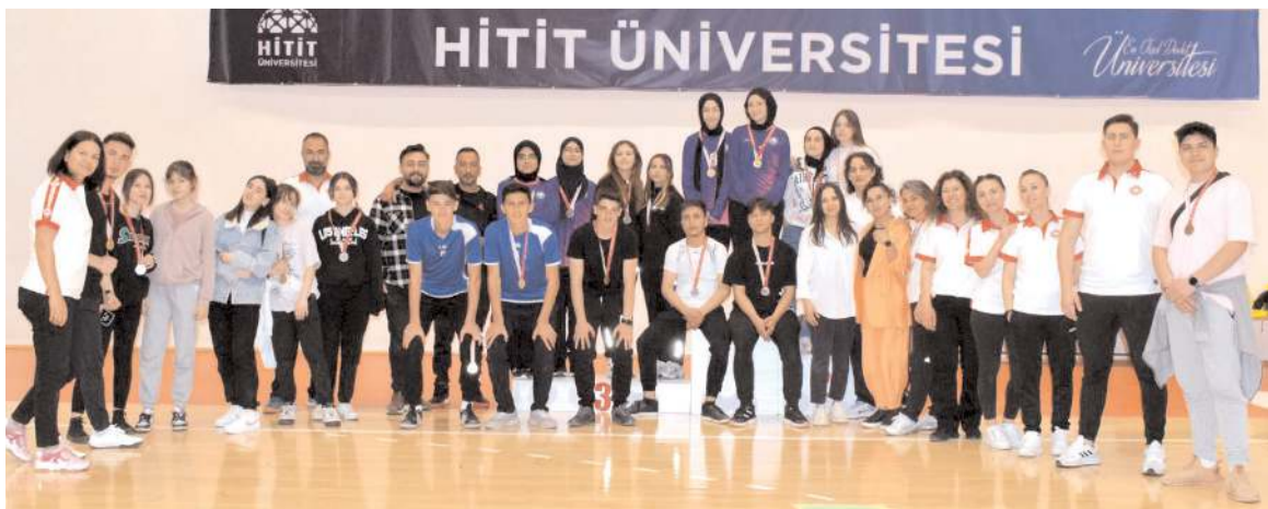
Floor Curling turnuvasında dereceye giren sporcular ödül töreni sonrasında toplu halde kürsüde görülüyor