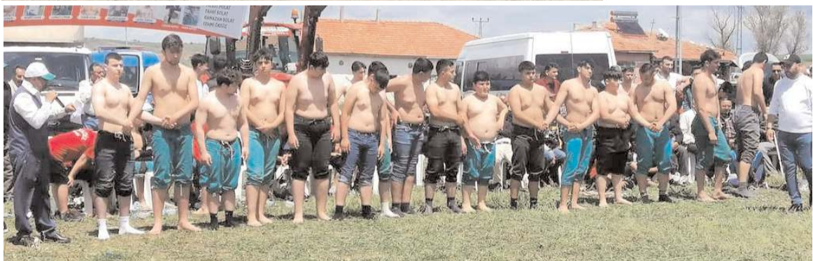
Elmalı Güreşlerinde değişik boylarda yaklaşık 200 pehlivan mücadele etti