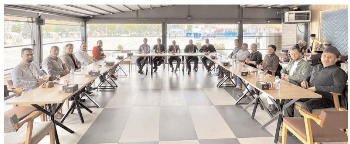
Dernek ilk toplantısını gerçekleştirdi.

Siyaset realite işidir. Türk milletinin ve içinde bulunduğu sosyal, kültürel, ekonomik değerler çerçevesinde yapılması gerektiğini düşünüyorum."