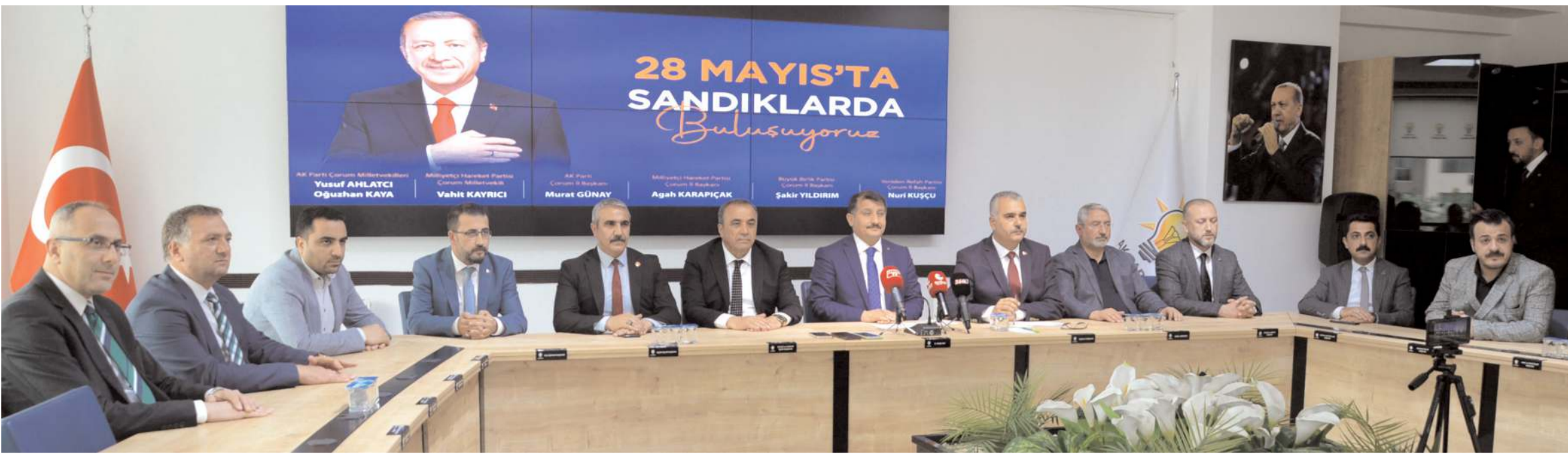
Cumhur İttifakı milletvekili ve il başkanları dün AK Parti binasında ortak bir basın toplantısı düzenleyerek 28 Mayıs Pazar günü yapılacak Cumhurbaşkanlığı seçimine ilişkin açıklamalarda bulundu.