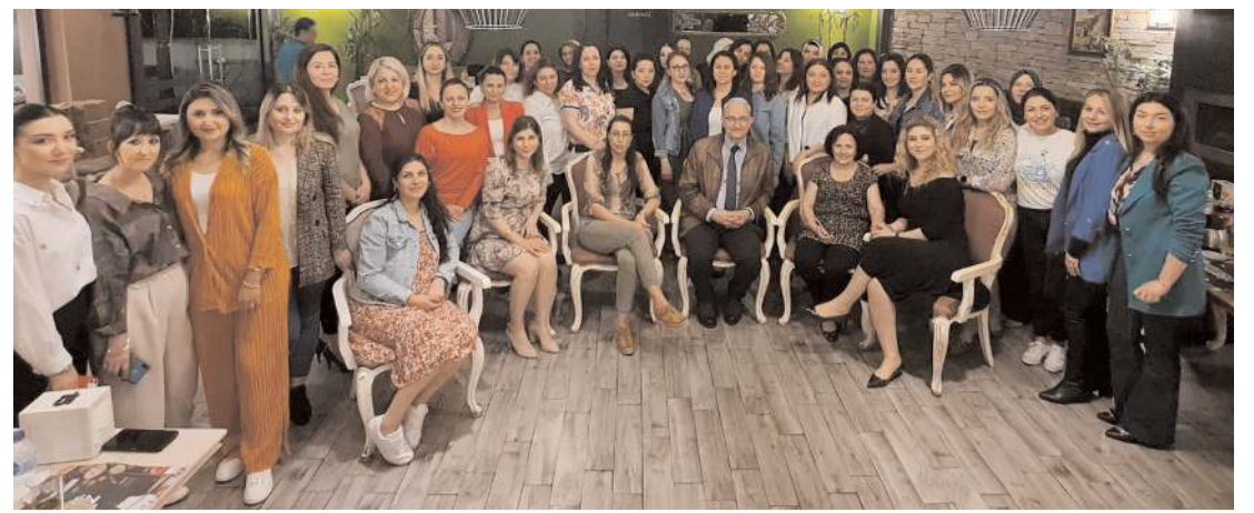
Çorum'da görev yapan kadın muhasebeciler 16.toplantısını gerçekleştirdi.

Plakasız araçlara yönelik denetimlerin devam edeceği bildirildi. (AA)