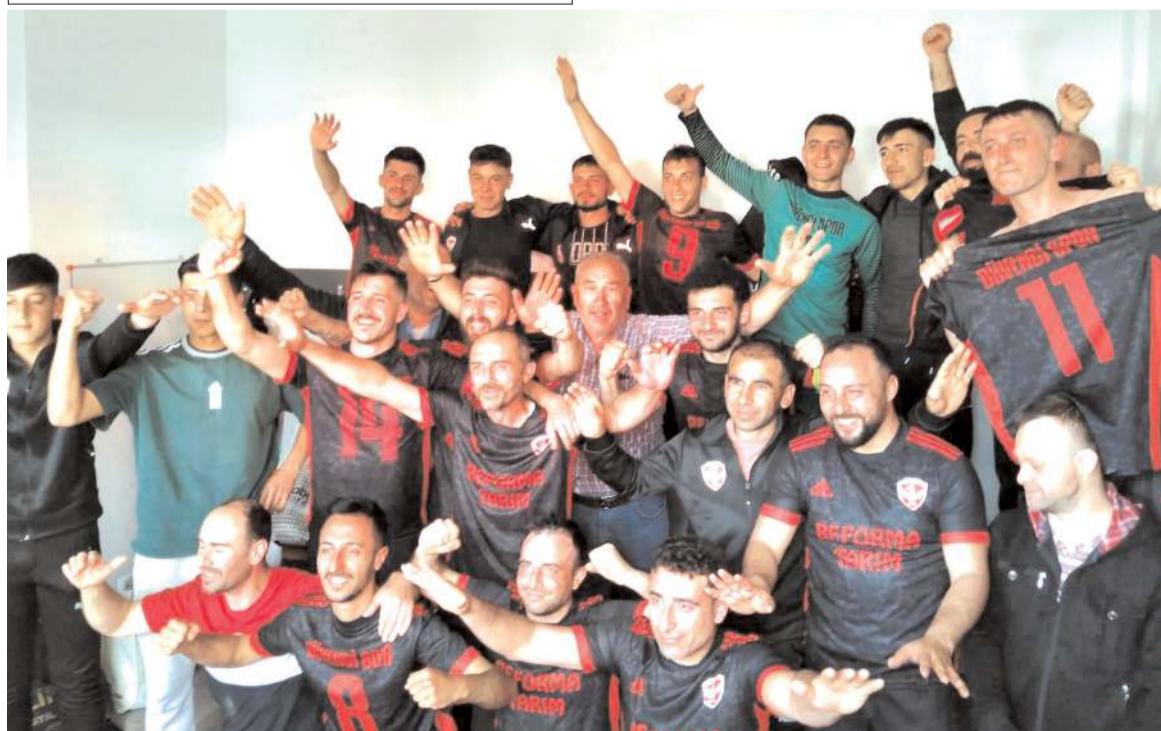
Düvenci Belediyespor son haftalardaki çıkışını Osmancıkgücü'nü yenerek sürdürdü soyunma odasında galibiyet pozunu

Kalan üç haftada Kargiserispor ve He Kültürspor takımlarının mücadelesi sezon sonunda birincilik ve ikincilik kupası için olacak. Bunu belirleyecek maç ise iki takımın kendi aralarında oynayacağı maçta olacak gibi görülmüyor.