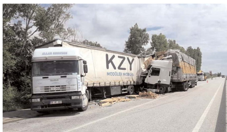
Kaza sonrası tır'lar bu hale geldi.

■ Sungurlu-Çorum karayolunda seyir halindeki Tır, Arifegazili köyü yakınlarında park halindeki Tır'a arkadan çarptı. Kazada yaralanan olmadı. * HABERİ 6'DA