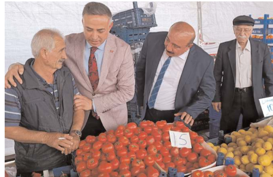
Tahtasız, pazar esnafıyla sohbet etti.

Vatandaşlarla sohbet eden, sorun ve talepleri hakkında bilgi alan Milletvekili Mehmet Tahtasız, sorunların çözümü noktasında çaba göstereceğini ve Çorum'un, üreticilerin, halkın beklentilerine kavuşması, hakkını alması için Meclis'te mücadele edeceğini bildirdi.