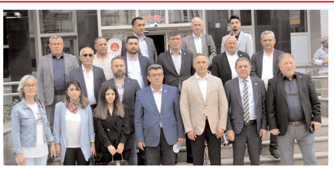
CHP Adliye önünde seçimle ilgili basın açıklaması yaptı.