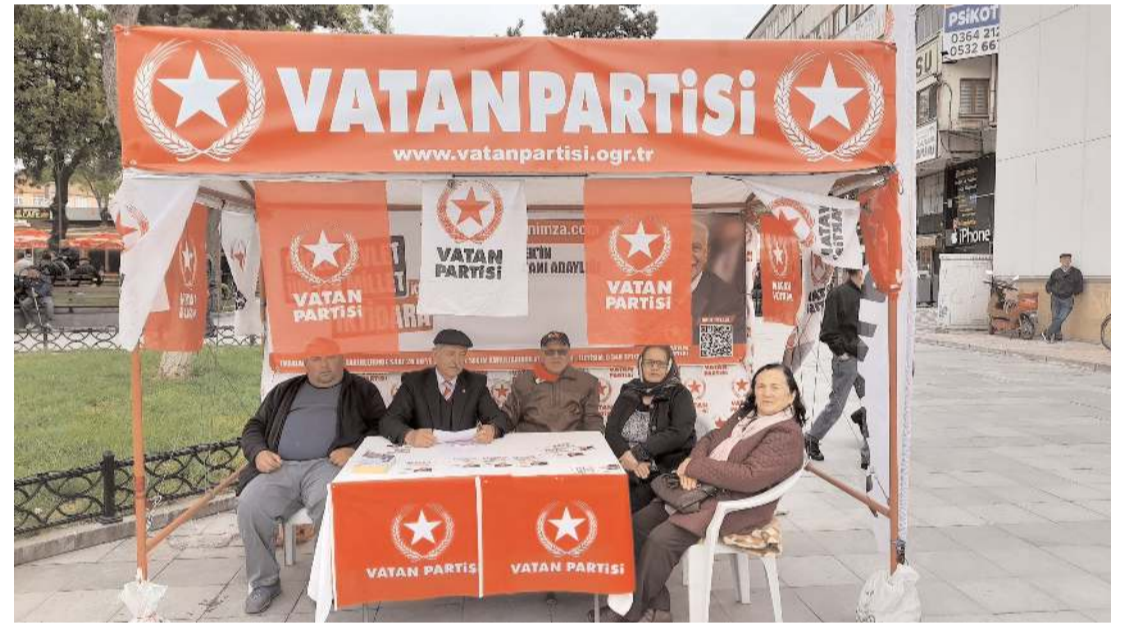
Vatan Partisi Hürriyet Meydanı'nda stant kurdu.