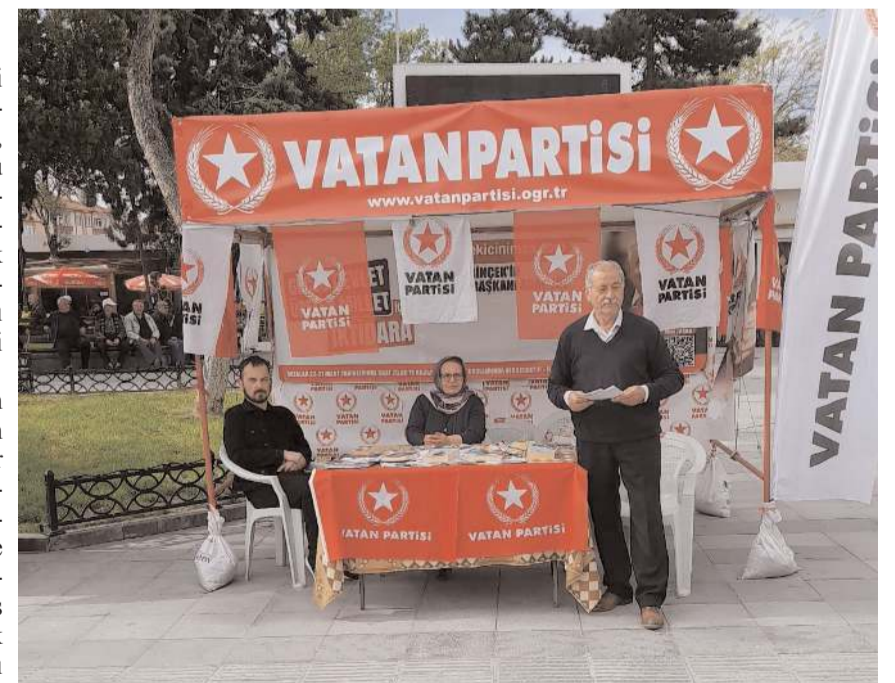
Vatan Partililer 28 Mayıs seçimlerinde Cumhurbaşkanını Erdoğan'a destek istedi.

"28 Mayıs 2023 günü yapılacak ikinci tur seçiminde, Cumhurbaşkanımızı iki adayın kaldığı koşullarda seçmek durumdayız. Vatan Partisi, Cumhurbaşkanlığı seçimindeki siyasetini, her zaman olduğu gibi emperyalizme karşı bağımsızlık ve üretim devrimi mevzuusundan belirliyor. Bugün Türkiye, ekonomide, güvenlikte ve kültürel alanda Batılı emperyalistlerin dayatmalarına karşı direnme ve özellikle ABD-İsrail eksenli tehditlere karşı hem içeride hem sınır ötesinde silahlı mücadele sürecindedir. Cumhurbaşkanlığı adaylarından Sayın Kemal Kılıçdaroğlu, ABD'nin ve İsrail'in Türkiye'yi hedef alan projesinde alet rolünü üstlenmiştir. Bu kapsamda PKK ve FETÖ terör örgütleriyle açıkça işbirliği yapmaktadır. Küresel merkezlerden yönetilen, bölücü ve yobaz örgütleri CHP listelerinden meclise taşımıştır. Kılıçdaroğlu, milli devleti ve Türk Ordusunu tasfiye, küresel finans merkezlerine kölelik, kültürel çürümeye, 15-6 Temmuz'un intikamını alma