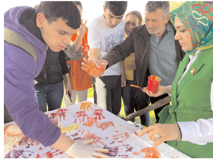
Engellilere yönelik düzenlenen etkinlikten bir kare fotoğraf...

öğrencilerine yüz boyama, el baskısı, müzikli oyunlar, okçuluk, ebru sanatı, halı dokumacılık etkinlikleri ile keyifli vakit geçirmelerini sağladılar. (Haber Merkezi)