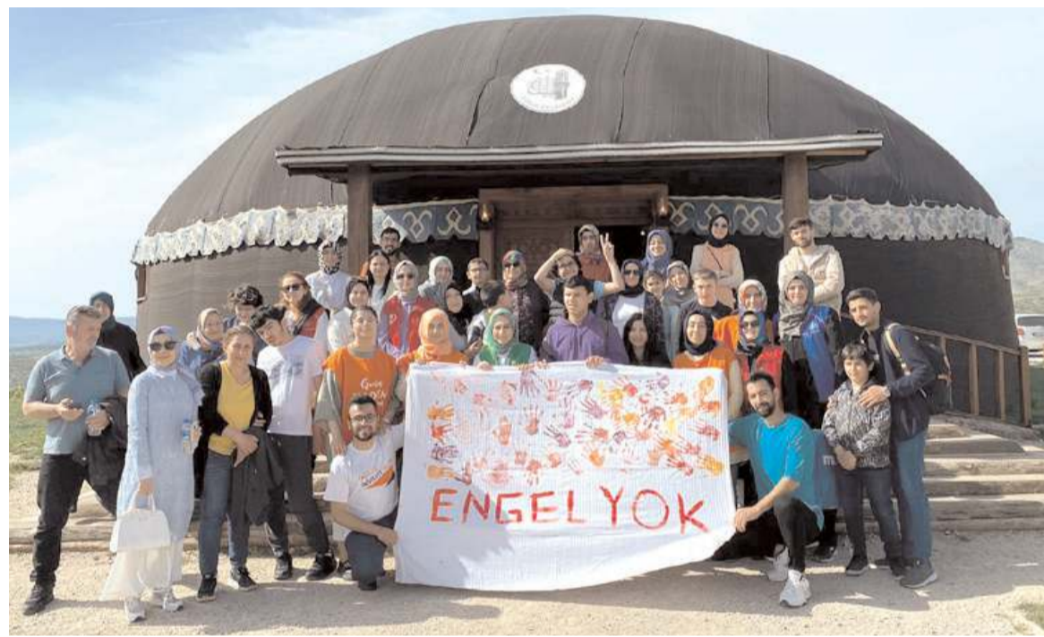
Engelli gençler Çorum Obası'nda doyasıya eğlendi.