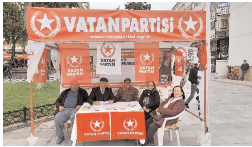
Vatan Partisi Hürriyet Meydanı'nda stant kurdu.