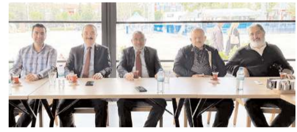
Dernek ilk toplantısını gerçekleştirdi.

■ Sungurlu-Çorum karayolunda seyir halindeki Tır, Arifegazili köyü yakınlarında park halindeki Tır'a arkadan çarptı. Kazada yaralanan olmadı. * HABERİ 6'DA