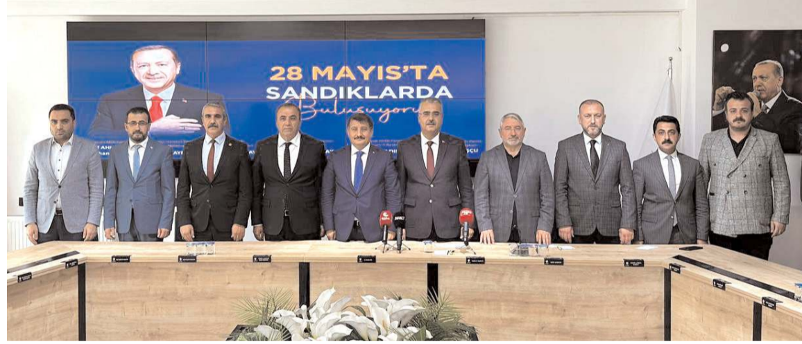
Cumhur İttifakı milletvekili ve il başkanları dün AK Parti binasında ortak bir basın toplantısı düzenleyerek 28 Mayıs Pazar günü yapılacak Cumhurbaşkanlığı seçimine ilişkin açıklamalarda bulundu.