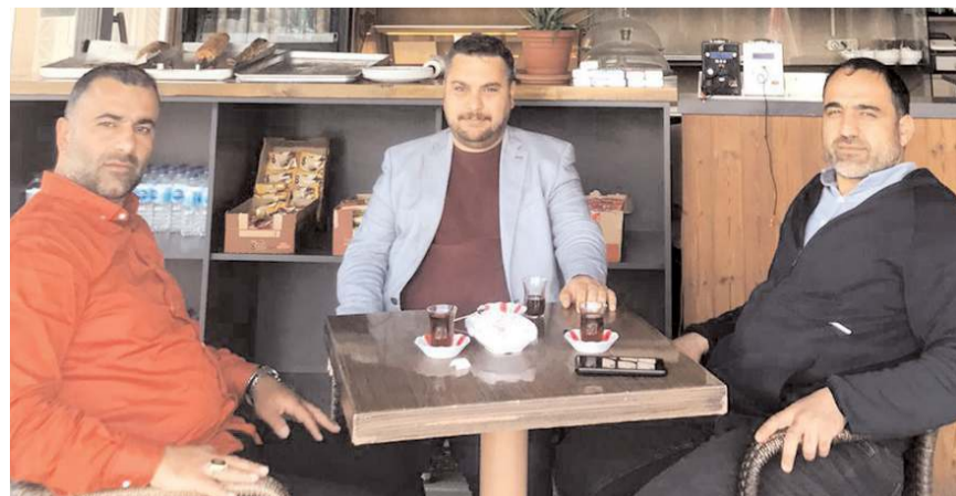
Ziyarette çekilen bir kare fotoğraf...