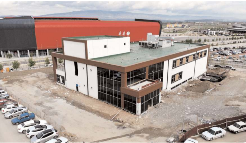
Onkoloji Hastanesi açılış için gün sayıyor.