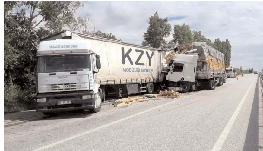
Kaza sonrası Tır'lar bu hale geldi.

Edinilen bilgilere göre kaza, Sungurlu-Çorum karayolu Arifegazili köyü yakınlarında meydana geldi. Çorum'dan Ankara istikametine seyir halinde olan plastik yüklü 58 AF 807 plakalı tır arıza yaptı. Yoğun sağ tarafına park eden tıra arkadan gelen 10 AHA 58 plakalı tahta palet yüklü başka bir tır çarptı. Meydana gelen trafik kazasında ölen ya da yaralanan olmazken, her iki araçta