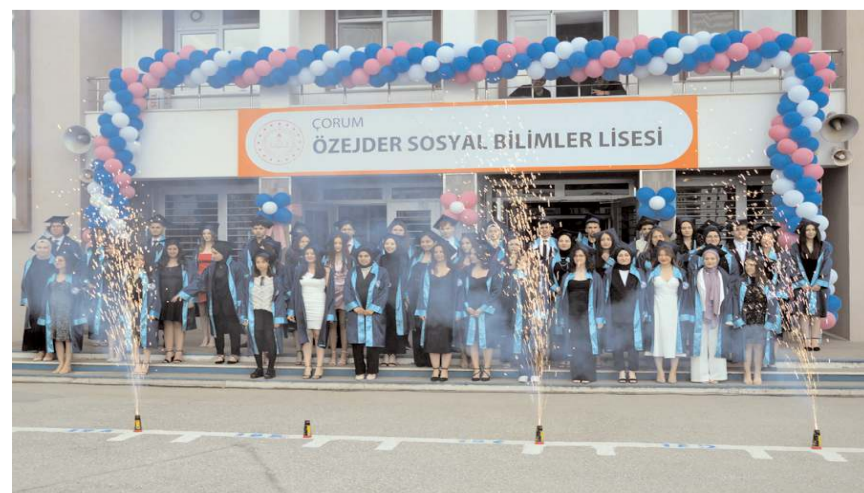
Özejder Sosyal Bilimler Lisesi 5. dönem öğrencilerini mezun etti.