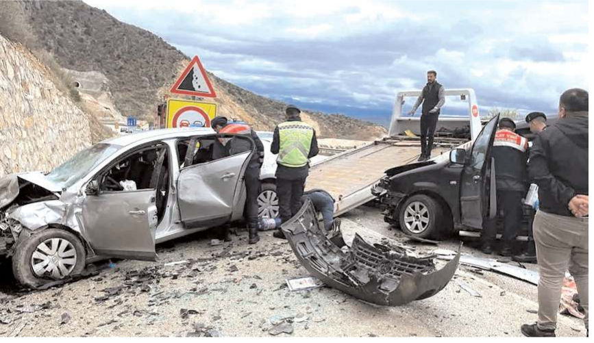
Çorum'da geçtiğimiz yıl 7 bin 159 trafik kazası meydana geldi.

Trafik kazalarında 5 bin 229 kişi hayatını kaybederken 288 bin 696 kişi yaralandı. Türkiye'de 2022 yılında meydana gelen 197 bin 261 adet ölümlü yaralanmalı trafik kazası sonucunda 2 bin 282 kişi kaza yerinde, 2 bin 947 kişi ise yaralanıp sağlık kuruluşlarına sevk edildikten sonra kazanın sebep ve tesiriyle 30 gün içinde hayatını kaybetti.