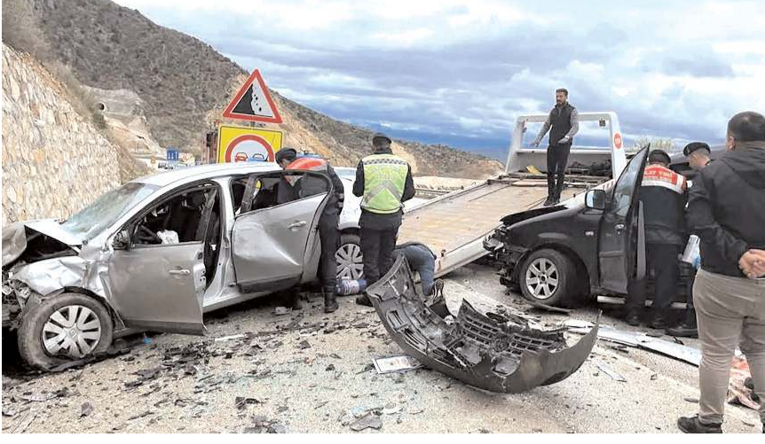
Çorum'da geçtiğimiz yıl 7 bin 159 trafik kazası meydana geldi.

Geçtiğimiz yıl 7 bin 159 trafik kazasının yaşandığı Çorum'da 1644 ölümlü kaza meydana geldi. Kazalarda 57 kişi hayatını kaybederken, 2 bin 656 kişi yaralandı.