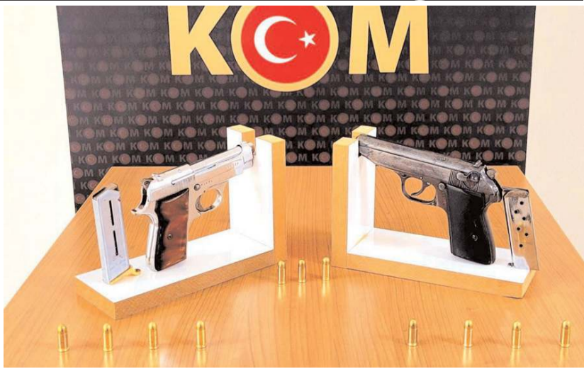
Operasyonda ele geçirilen silahlara el konuldu.

Şüpheli şahıs hakkında adli işlemlere başlandı. (Haber Merkezi)