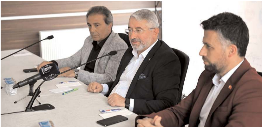
Belediye Başkanı Halil İbrahim Aşgın, ziyarette açıklama yaptı.

Çorum Belediyesi'nin dürüstlük, ahlakla ve erdemle anıldığını söyleyen Başkan Aşgın, "Bu bizim için son derece kıymetlidir. Bu ay mecliste görüşülen kesin hesap raporumuzda CHP grubu da dahil olmak üzere meclisimizin tamamının kabul oyu vermesi bizim için önemlidir. Bu bize olan güveni gösterir. Bunu tüm ekibimizle birlikte başarıyoruz. Devletini ve şehri düşünün, gayretli personelimizle yol yürütüyoruz. Ahlakla ve erdemle çalışmada Türkiye'de örnek gösterilen bir belediyeyiz." dedi. (Haber Merkezi)