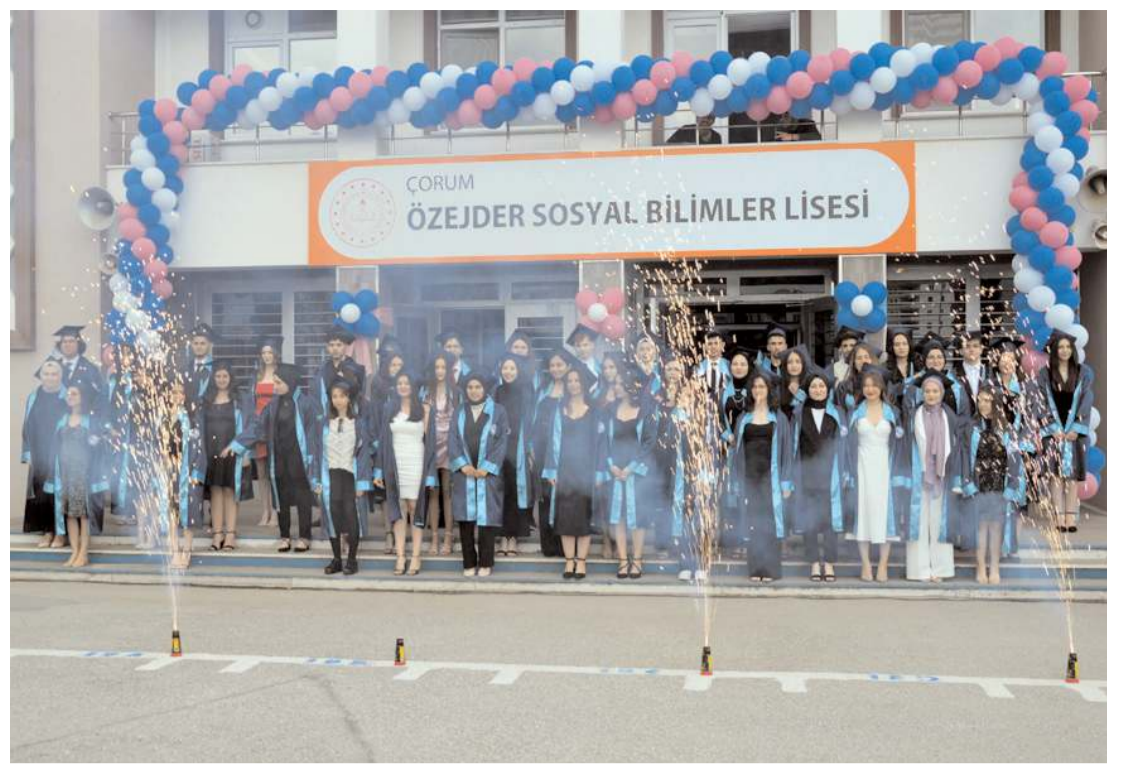
Özejder Sosyal Bilimler Lisesi 5. dönem öğrencilerini mezun etti.