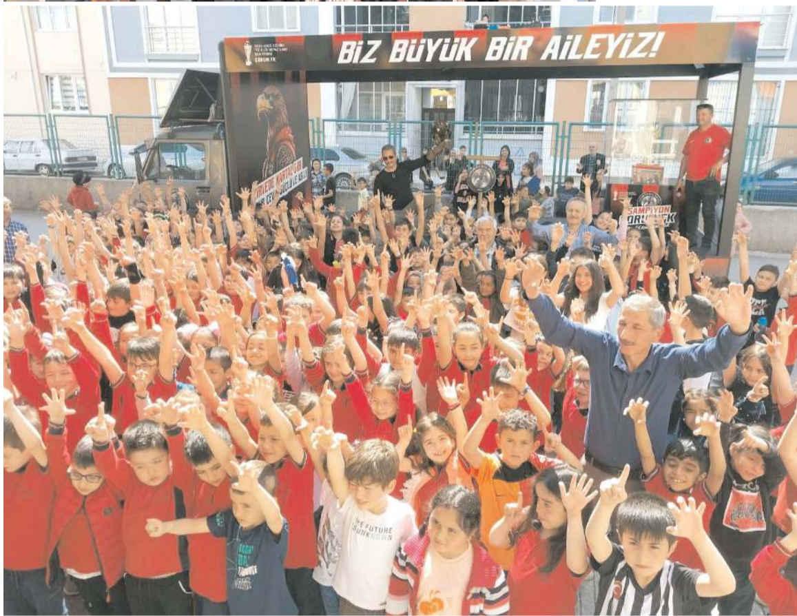
Çorum FK şampiyonluk kupasını ziyaret eden çocuklar yaptıkları kartal hareketi ile objektiflere böyle poz verdiler