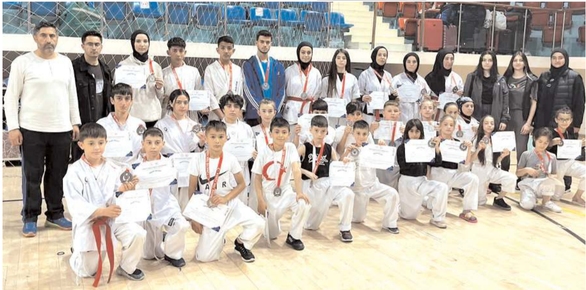
Düzce'de yapılan Türkiye Budokaido Şampiyonasında madalya kazanan Çorumlu sporcular antrenörleri ile birlikte toplu halde