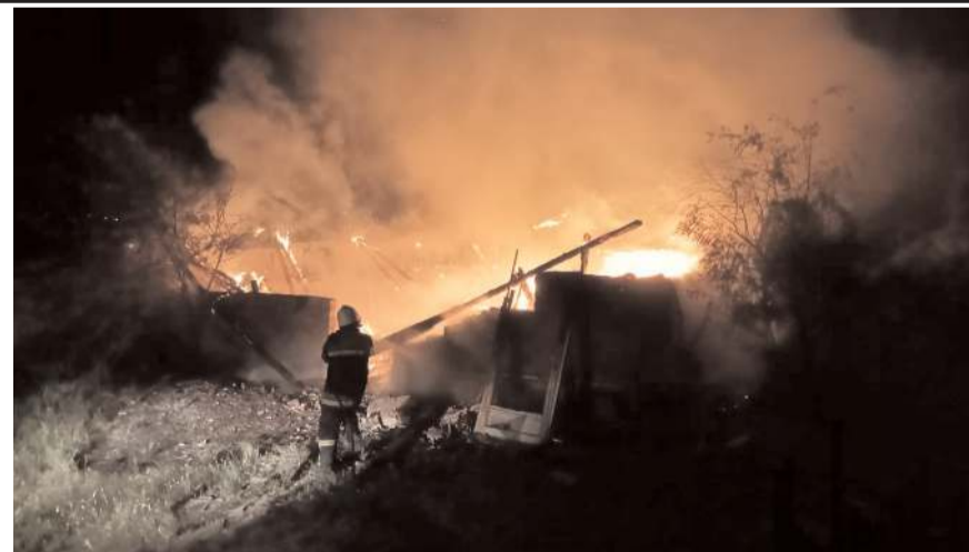
Olay Şenyurt Mahallesi Sarıalan köyü yolunda bulunan bir işyerinde meydana geldi.

Yangın nedeniyle depoda hasar oluştu.