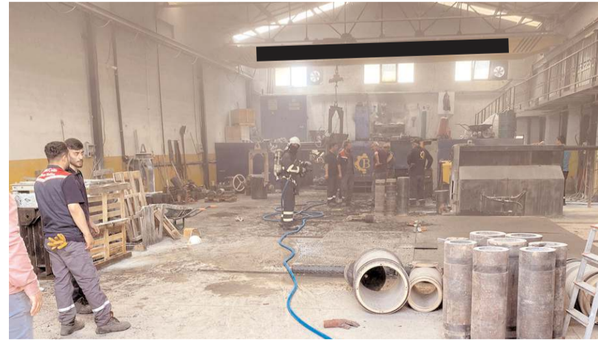
Yangını itfaiye ekipleri söndürdü.