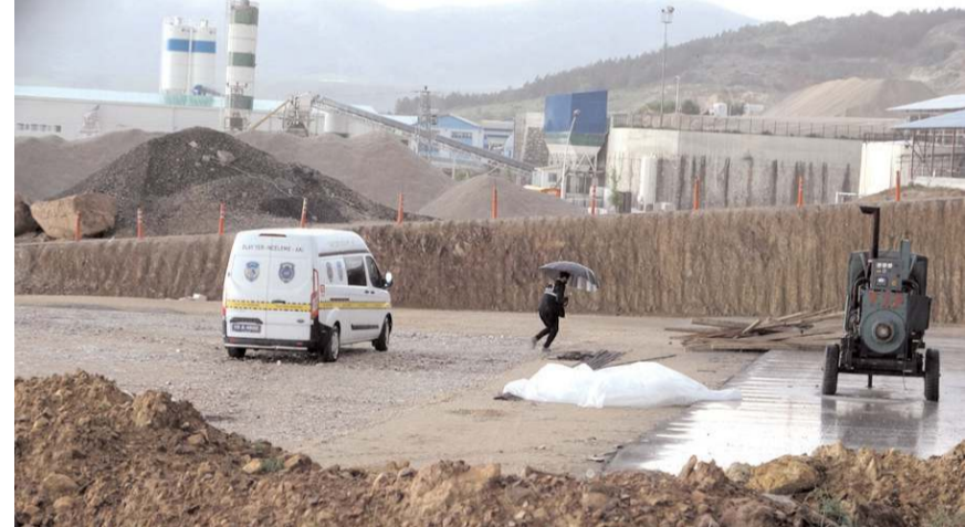
Olay taş ocağında meydana geldi.

F.A.A'nın düştüğünü gören işçiler hemen yardıma gitti. Olay yerine gelen polis ve sağlık ekipleri genci düştüğü yerden çıkarttı. Ambulansla hastaneye kaldırılan genç, bütün müdahalelere