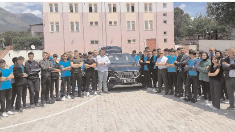
Öğrenciler TOGG ile hatıra fotoğrafı çekindiler.

Türkiye'nin yerli ve milli otomobili TOGG, Kargı'da vatandaşlara tanıtıldı.