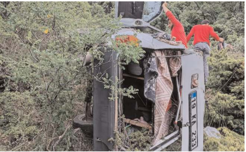
Kaza Dodurga-Oğuzlar kara yolu Gümecei Yokuşu mevkinde meydana geldi.

Çorum'da şarampole devrilen otomobildeki 2 kişi yaralandı.