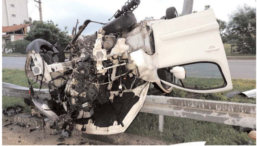
Kazada araçta büyük maddi hasar meydana geldi.

Kazayla ilgili soruşturma başlatıldı. (İHA)