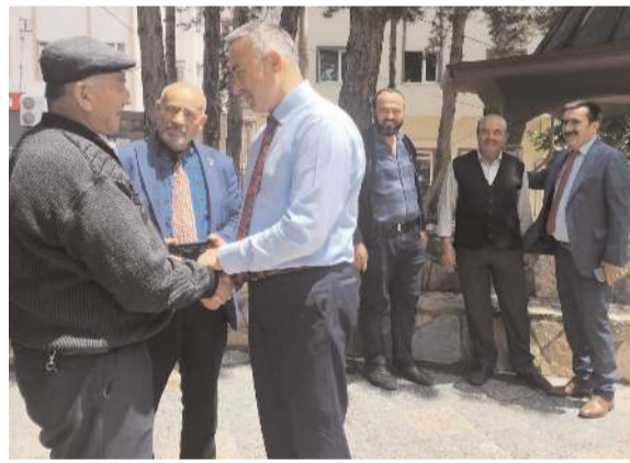
CHP Çorum Milletvekili Mehmet Tahtasız, Mecitözü'nde ziyaretlerde bulundu.

28 Mayıs'ta yapılacak Cumhurbaşkanlığı seçimlerinin ülkenin geleceği açısından tarihi bir öneme sahip olduğunu anlatan Tahtasız, Cumhurbaşkanlığı Adayı Kemal Kılıçdaroğlu'nun görevi seçilmesinin büyük bir önem arz ettiğini dile getirerek, "Vatanımı seven ayağa kalksın, vatanımı seven sandık başına gitsin" diye ko-