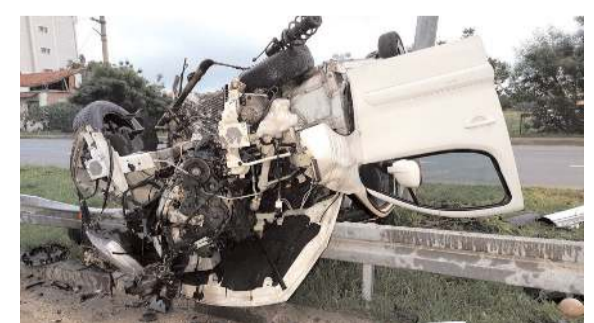
Kazada araçta büyük maddi hasar meydana geldi.