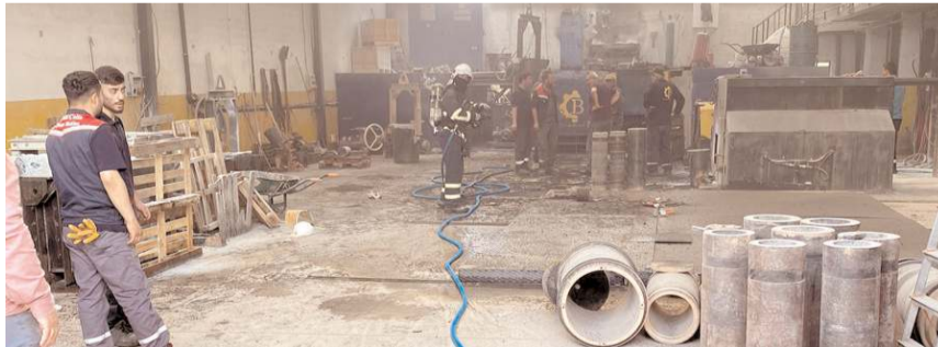
Yangını itfaiye ekipleri söndürdü.

Çorum'da bir döküm fabrikasında meydana gelen patlamada 6 işçi yaralandı.