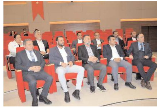
Program TSO meclis salonunda yapıldı.

Günümüzde kaç Türk milliyetçisi ve ülkücü Veli ve Üniversite rektörü vardır? Soruları çoğaltmak mümkündür? Örnekler üzerinden devam etmek ve yaşanan durumları hatırlamak mümkündür. Zafer Partisi, Türkiye gerçekleri duyuran ve politika ortamına taşıyan partidir. Sürecin garantisi Ümit Özdağ'dır. Türk milleti, Zafer Partisi ve Ümit Özdağ ismine güvenmeye devam etmelidir."