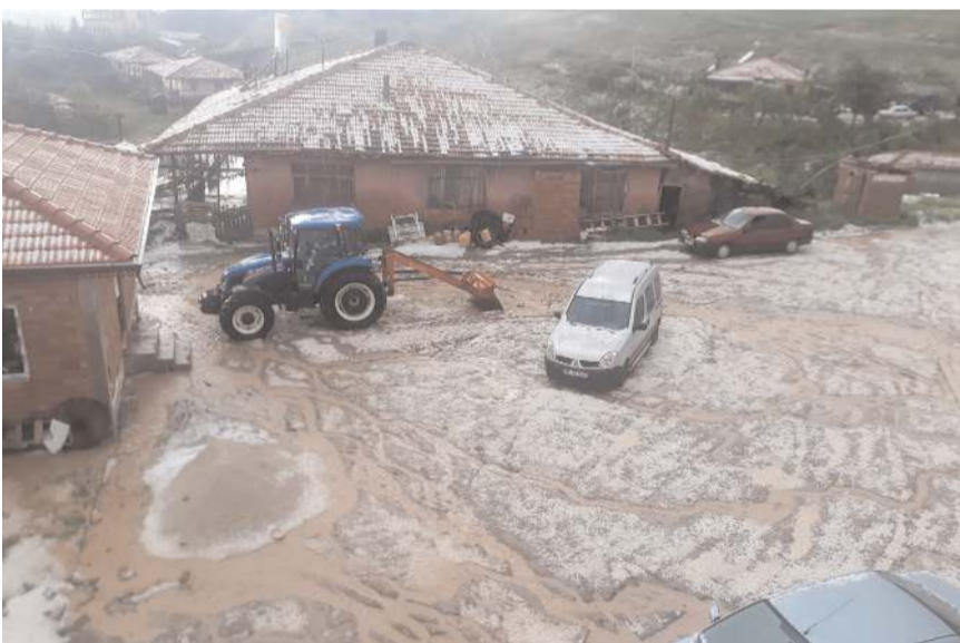
Yanicak köyünde sağanak yağış evlerde su baskınına neden oldu.

Boğazkale'de sağanak ve dolu etkili oldu.