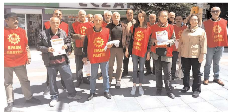
EMEP, ikinci turunda Kemal Kılıçdaroğlu'na destek açıklaması yaptı.

Emek Partisi olarak, demokratik bir halk iktidarının inşasını değerli bulduklarını aktaran Gökmen, "Öncelikle bu 'Ben her şeyi bilirim, sizin adınıza en