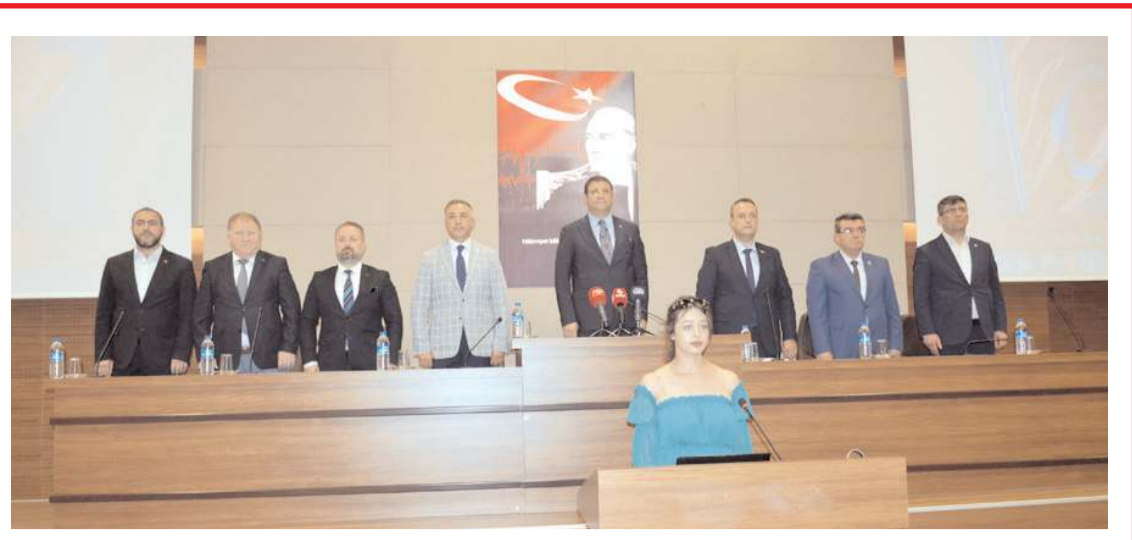
Program TSO meclis salonunda yapıldı.