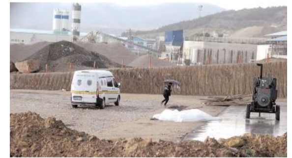
Olay taş ocağında meydana geldi.