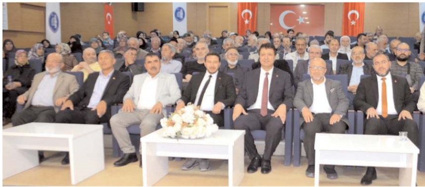
Saadet Partisi Çorum İl Divan Toplantısı yapıldı.