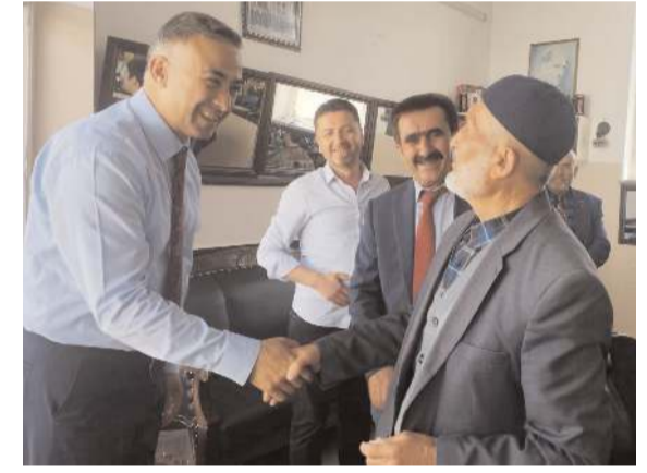
CHP Çorum Milletvekili Mehmet Tahtasız, Mecitözü'nde ziyaretlerde bulundu.