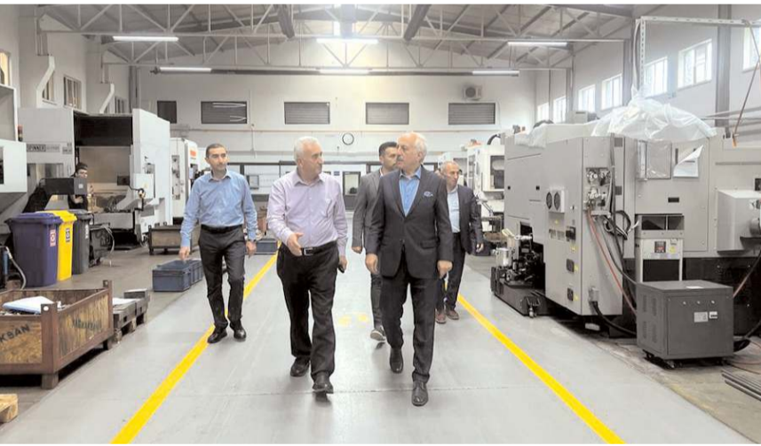
Zeki Gül, Mustafa ve Fatih Mustafa Yağlı'yı ziyaret etti.

Gül, ziyaretlerini seçim gününe kadar sürdüreceğini söyledi.