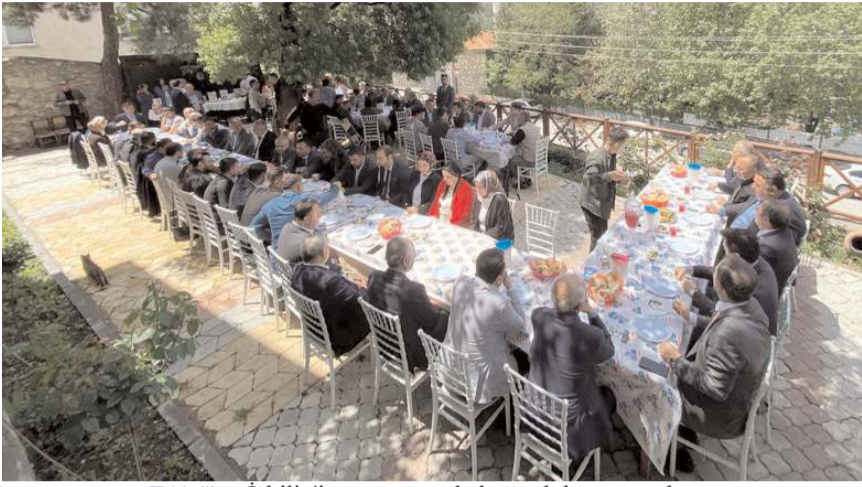
Etkinlikte İskilip'in yırtma, su kabağı, dolma ve tarhana gibi lezzetleri katılımcıların beğenisine sunuldu.