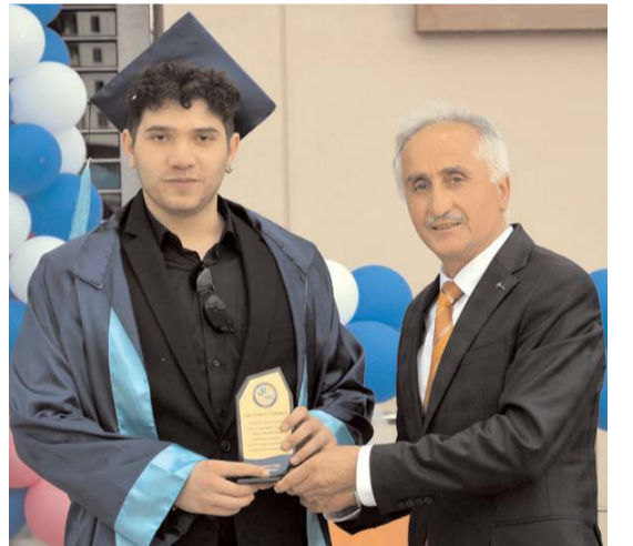
Derece elde eden öğrencilere plaket verildi.