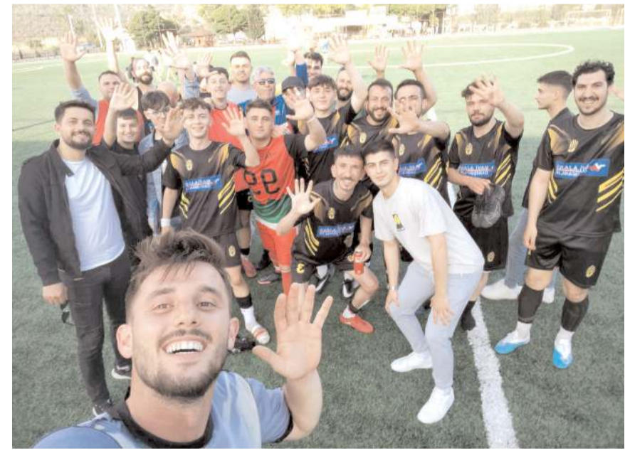
2. Kümede lider Kargiserispor Osmancık'ta deplasmanında galibiyet selfisi