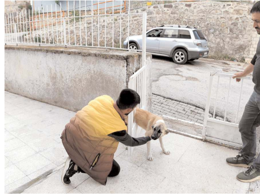
Oğuzlar Belediyesi ekipleri köpeği sıkıştığı yerden kurtardı.

Köpeğin sağlık durumunun iyi olduğu bildirildi. (AA)