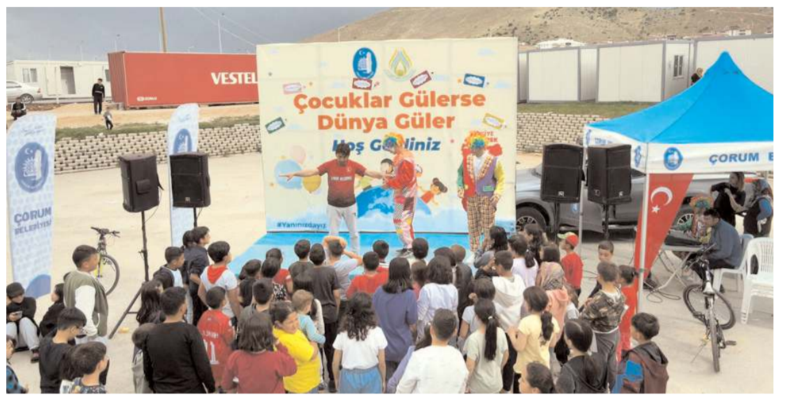
Çorum Belediyesi, Afşin'de depremzede çocuklar için etkinlik düzenledi.

liler UNESCO Dünya Kültür Mirası listesinde bulunan Hattuşa Ören Yeri ve Yazılıkaya Açık hava Tapınağı'nı gezdi.(AA)