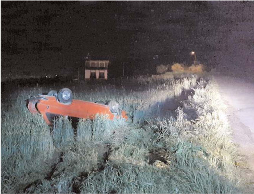
Polisler çevrede yaptıkları araştırmada sürücüyü bulamadı.

Çevrede yaptıkları araştırmada sürücüyü bulamayan ekipler, olay yerindeki çalışmalarını tamamladıktan sonra bölgeden ayrıldı. (AA)