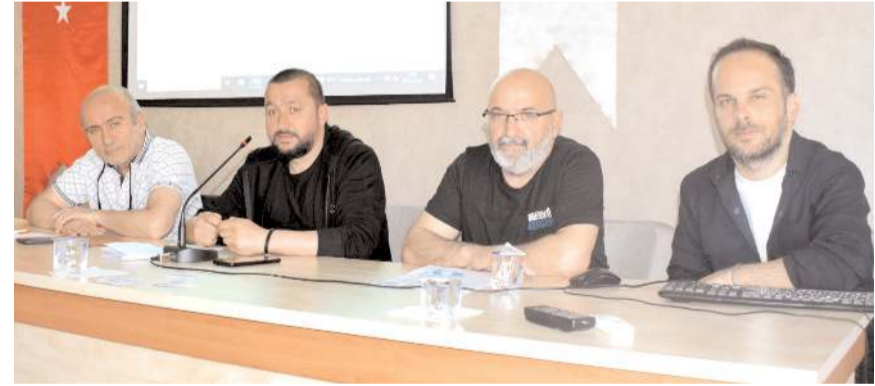
Turnuva Teknik Toplantısı Tertip Kurulu üyelerinin katılımı ile yapıldı

sı.Siyah Grup: Atik Sürücü Kursu, Manchester Dil Okulu, Doğa Gıda, Paşa İnşaat, Radyo Double, İntegral Mühendislik.Beyaz Grup: Cezaevi, Namsan, Kurt Elektrik, Uğur Orman Ürünleri, Sağlıkçılar FK, Gözde Yapı.