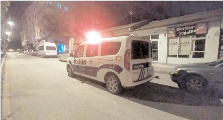
Cengiz Topel Caddesi üzerinde faaliyet gösteren bir dernekte meydana geldi.

Çorum'da faaliyet gösteren bir dernek gece saatlerinde kurşunlandı.