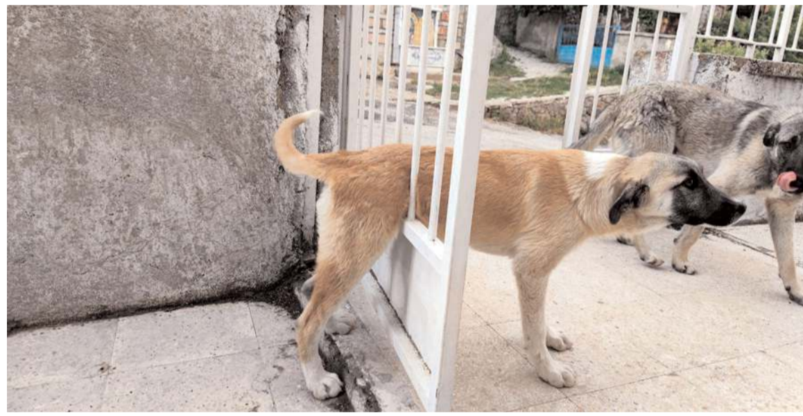
Sahipsiz bir köpek Oğuzlar İlkokulu'nun bahçe kapısındaki demir parmaklıklara sıkıştı.

Olayla ilgili başlatılan soruşturma sürüyor. (İHA)