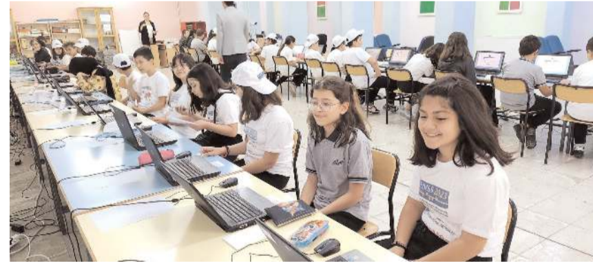
Sınav online olarak yapıldı.

Eğitim Başarılarını Değerlendirme Kuruluşu (IEA)'nın Uluslararası Matematik ve Fen Eğilimleri Araştırması kapsamında önceki gün gerçekleştirilen TİMSS-2023 sınavında Türkiye'den Çorum Mustafa Kemal Ortaokulu 5. sınıf öğrencileri ter döktü. Milli Eğitim Ba-