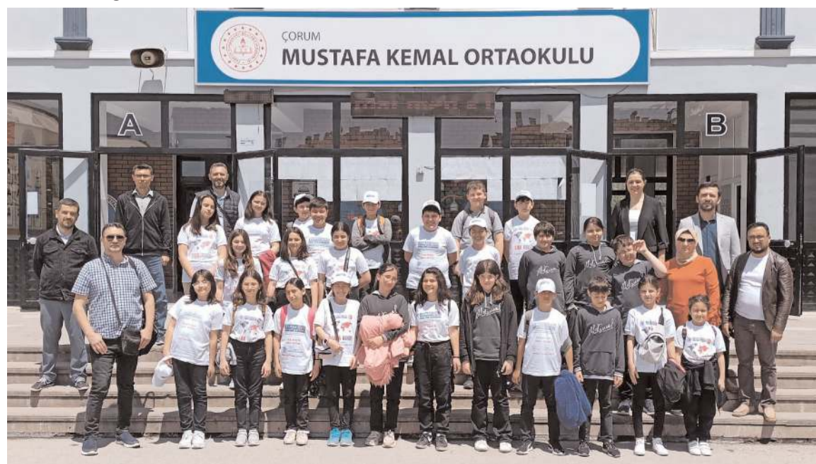
Sınavın ardından öğrenciler ve öğretmenler hatıra fotoğrafı çektiler.

okulu'nda yapılan sınav iki oturum halinde yapıldı.