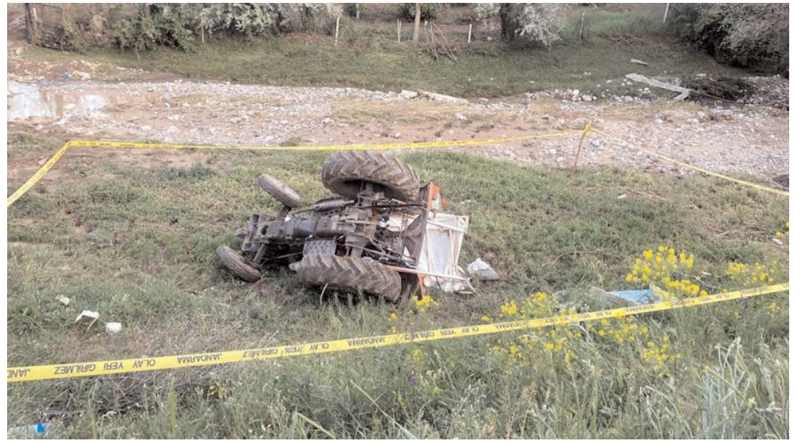
Olay Sungurlu'ya bağlı Demirşeyh köyünde meydana geldi.

Yargılama devam ederken jandarma ekiplerince sanıklara ait köydeki bakkal dükkanından alınan güvenlik kamerası görüntüleri, mahkeme heyetine delil olarak sunulmuştu. (AA)