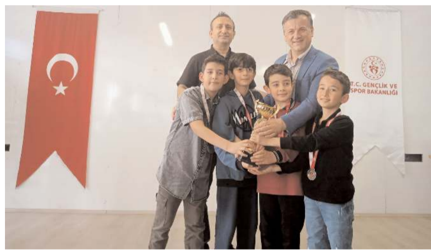
Derece elde eden öğrencilere kupa ve madalya verildi.