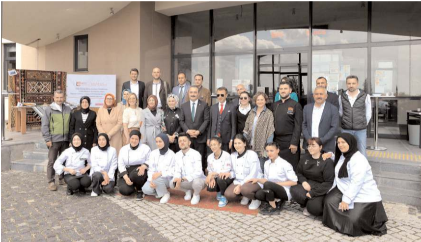
Günün anısına toplu hatıra fotoğrafı çekildi.