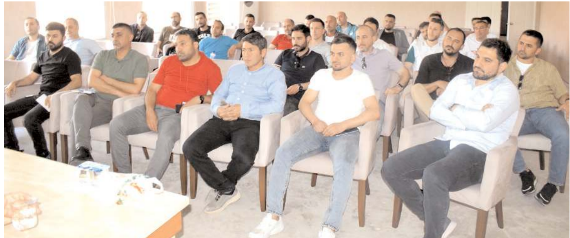
Teknik toplantıya turnuvada mücadele edecek takımların temsilcileri büyük ilgi gösterdiler