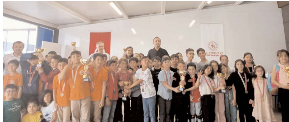
Şampiyonanın sonunda toplu hatıra fotoğrafı çekildi.