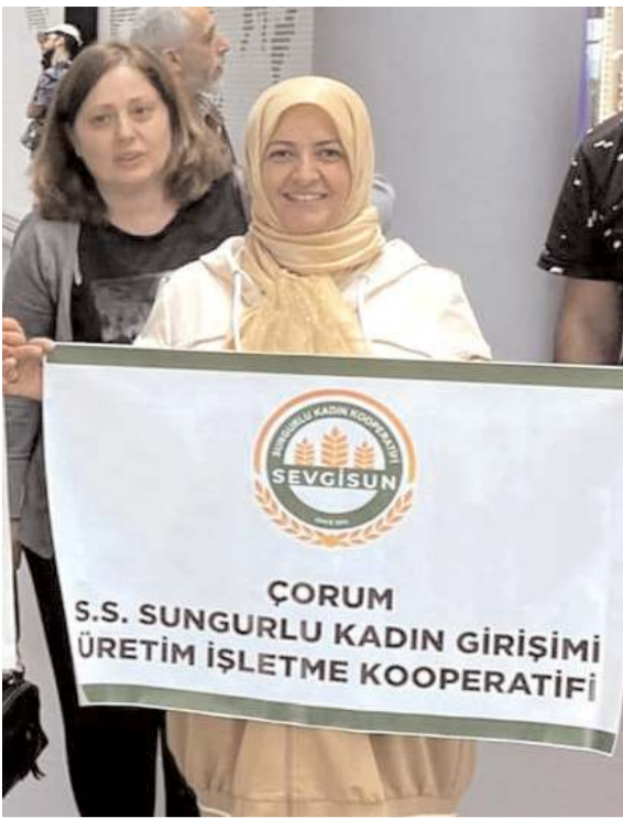
Gezi "Kadınların Kooperatifler Yoluyla Güçlendirilmesi Projesi" kapsamında yapıldı.