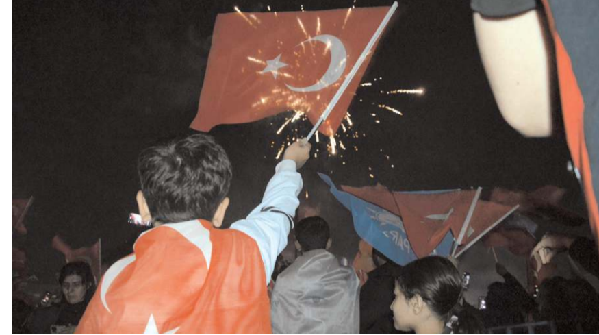
Kutlamalar gece geç saatlere kadar sürdü. Vatandaşlar araçlarıyla 'zafer konvoyu' düzenledi.