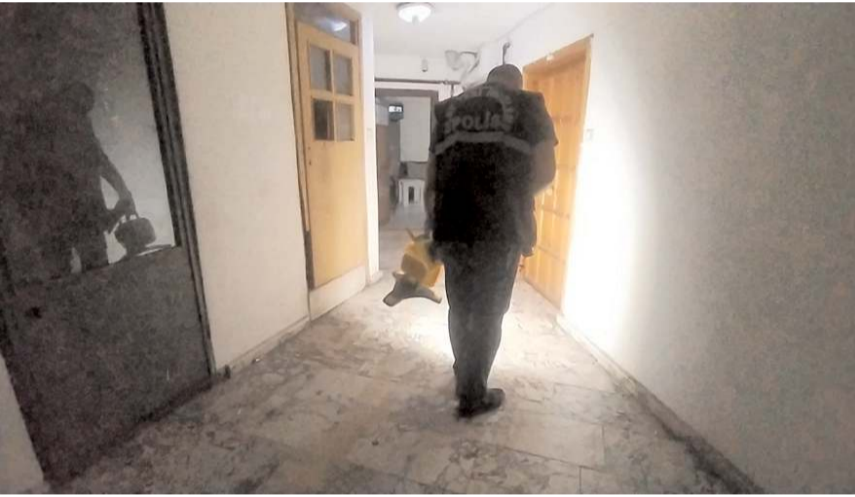
Polis ekipleri olay yerinde inceleme yaptı.