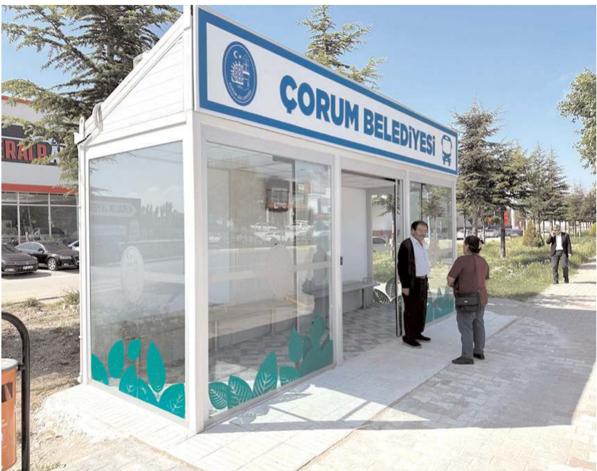
Çorum Belediyesi, kendi imkânlarıyla yaptığı klimalı otobüs duraklarını kullanmaya başladı.