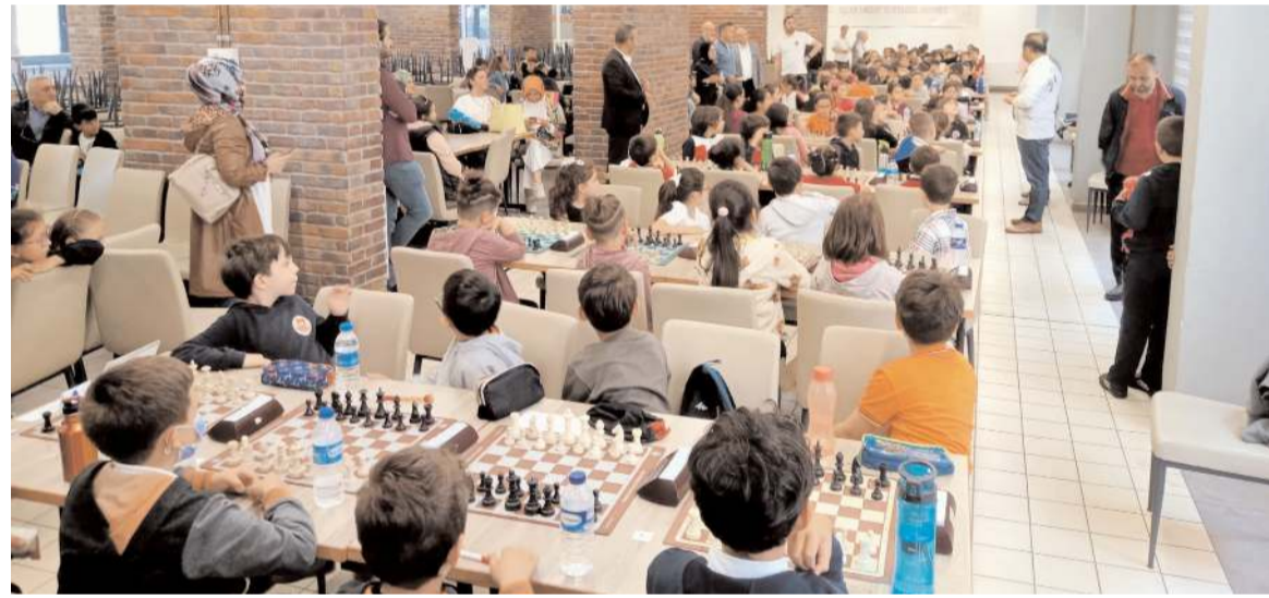
Şampiyona Gençlik ve Spor Bakanlığı Kerebi Gazi Yurt binasında yapıldı.

Eğitimin ardından çeşitli seviyelerde arama kurtarma için akreditasyon çalışmalarına başlayacaklarını belirten Balaban, ekip olarak doğal afetlere karşı hazır olduklarını kaydetti. (AA)