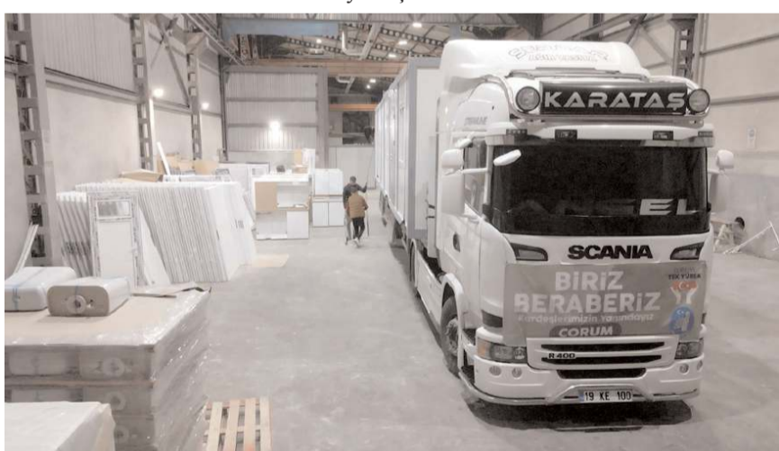
Konteynerler Afşin'e gönderildi.

Çorum Belediyesi, kardeş şehir Afşin'e 14 adet konteyner daha gönderdi. Konteynerler, ihtiyaç duyulan bölgelerde kullanılmak üzere afetzedelere geçici barınak olacak.