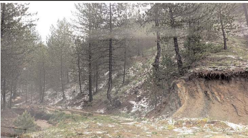
Yağan dolu nedeniyle araziler beyaza büründü.

İskilip'te, sağanak yağmur ve dolu etkili oldu.