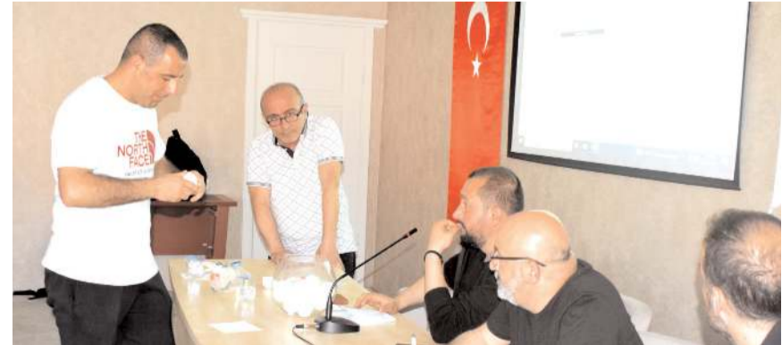
Takımlar mücadele edecekleri grupları kura ile belirlediler