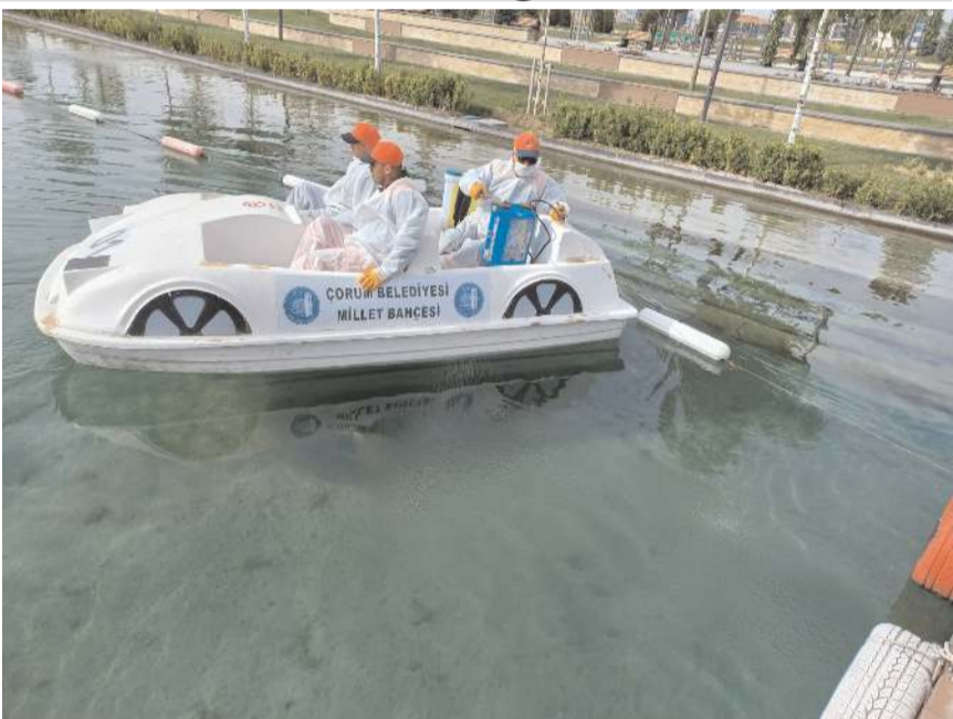
Belediye ekipleri ilaçlama faaliyetlerine devam ediyor.

Yağbat, vatandaşlara çağırarak bulunarak, "Evsel kati atıklarınızı çöp poşetine koyarak ağzı kapalı bir şekilde çöp konteynırına bırakınız ve konteynır kapaklarını kapalı tutunuz. Evlerinizde ve bahçelerinizde uzun süre çöp bulundurmayınız. Hayvan gübrelere açıkta bırakmayınız, yığın haline getirip