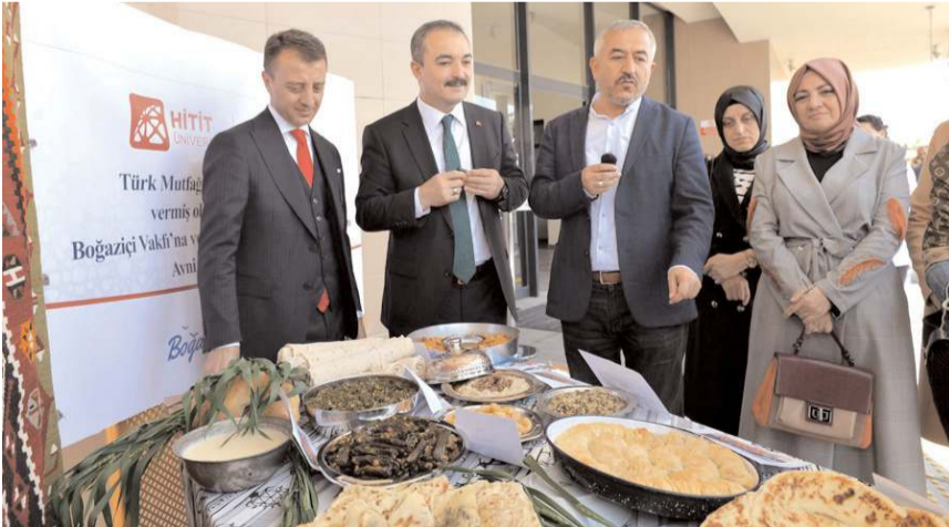
Alaca Avni Çelik MYO Aşçılık Programı öğretim elemanları, öğrencileri ve Alaca HEM eğitmenleri yöresel lezzetleri konukların beğenisine sundu.