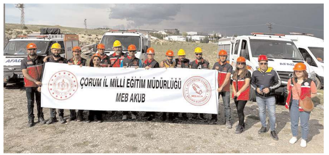
AKUB, 25 gönüllünün katılımıyla kuruldu.