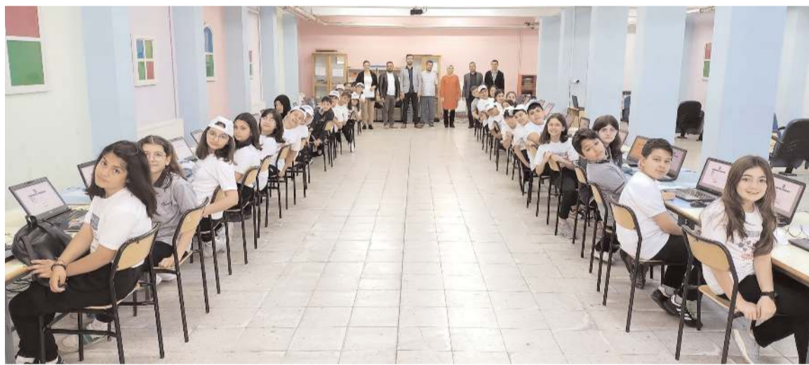
TİMSS-2023'te Mustafa Kemal Ortaokulu 5. sınıf öğrencileri ter döktü.