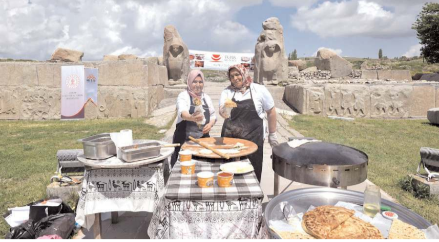
Alacahöyük'te, Çorum'a özgü hamur işlerinden olan yanıç ve katmer hazırlandı.