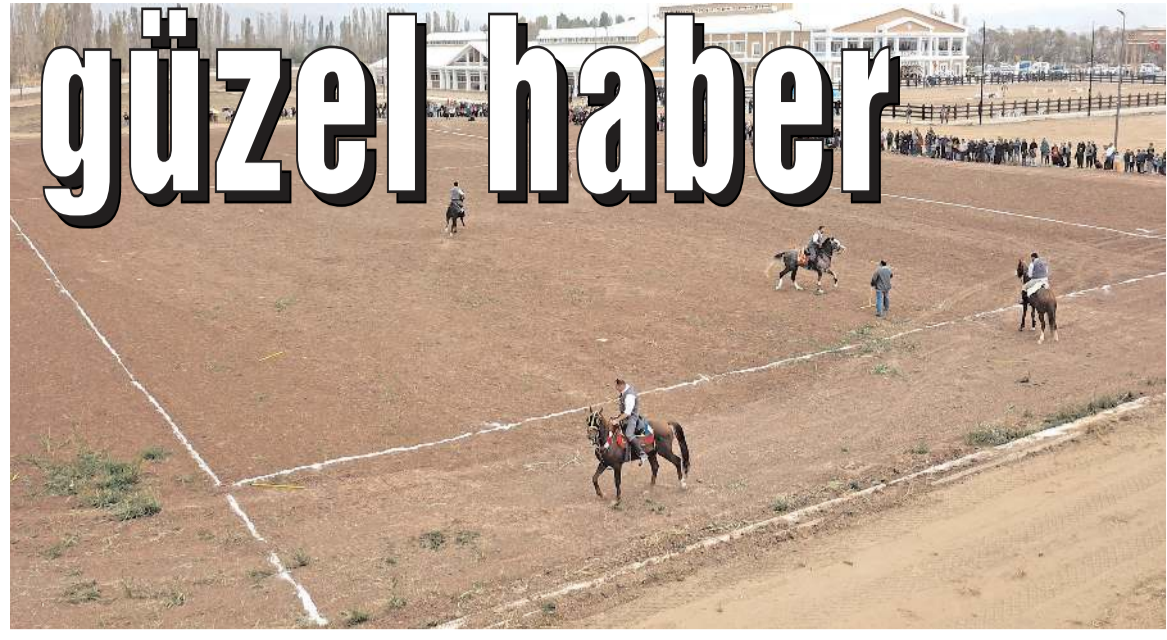
Geçtiğimiz aylarda boşalan Atlı Spor Kulübünün bulunduğu alana Çorum FK alt yapı için tesis planlanıyor