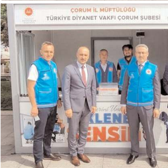
Stant Saat Kulesi yanı Hürriyet Parkı önünde açıldı.