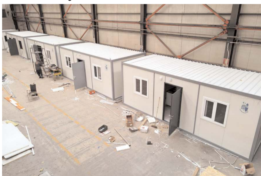
14 adet konteyner Çorum'da üretildi.