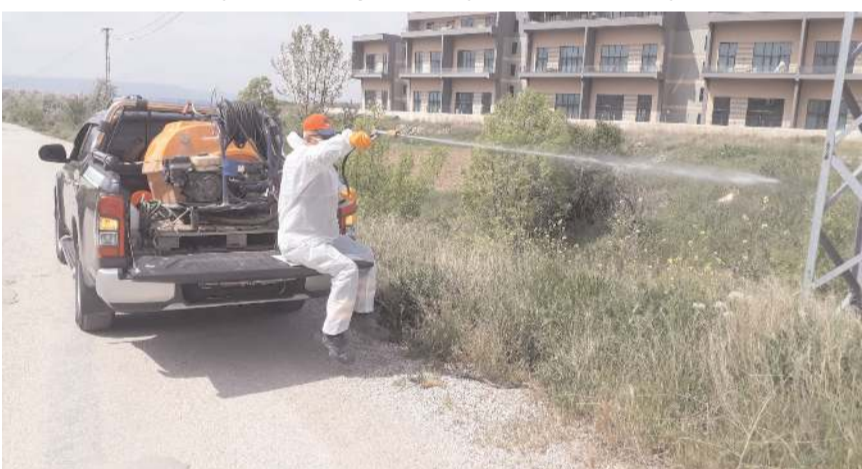
üzerine toprak veya kireçle örtünüz." dedi. (Haber Merkezi)