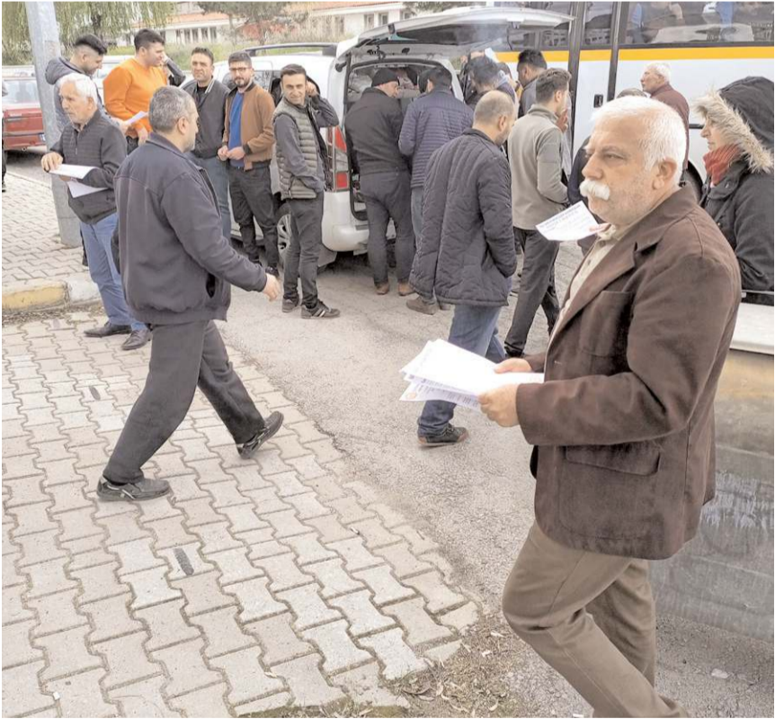
EMEP üyeleri vatandaşlara 1 Mayıs bildirisi dağıttı.

TÜRK-İŞ, DİSK ve KESK tarafından yapılacak olan miting için 1 Mayıs Pazartesi günü günü saat 12.00'de Pırlaba Parkı'nda toplanılıp Saat Kulesi'ne yürüneceğini kaydeden Gökmen, Emek Partisi'nin ise saat 11.00'de Hacı Bektaş Veli Parkı'nda toplanacağını açıkladı. (Haber Merkezi)