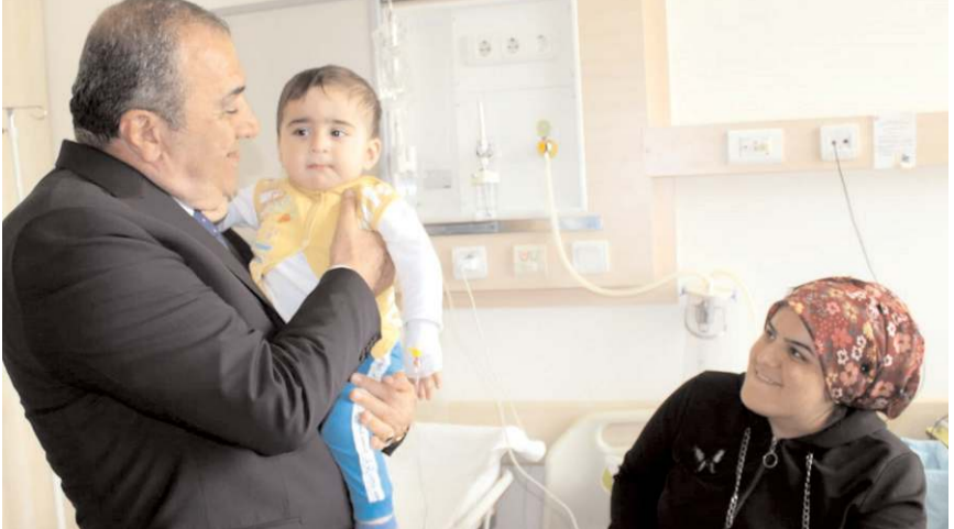
Kayırcı, hastalara "geçmiş olsun" dilekelerini ilettili.