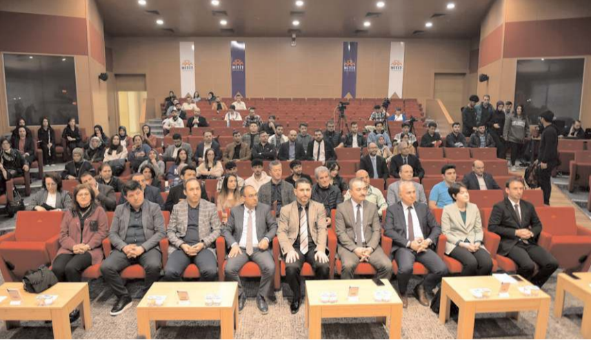
Kongrenin 3 gün süreceği belirtildi.