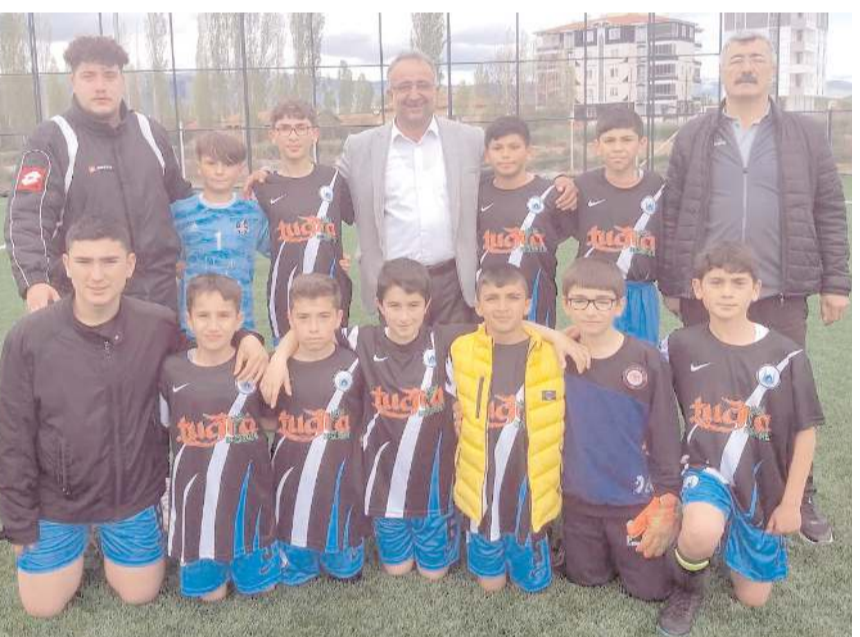
Yıldırım Beyazıt ikinci maçında farklı kazanarak yoluna kayıpsız devam etti

gün saat 11.30'da Ankara İbni Sina Ortaokulu ile karşılaşacak. Bu maçta beraberlik temsilcimize yetiyor. Galibiyet ve be-