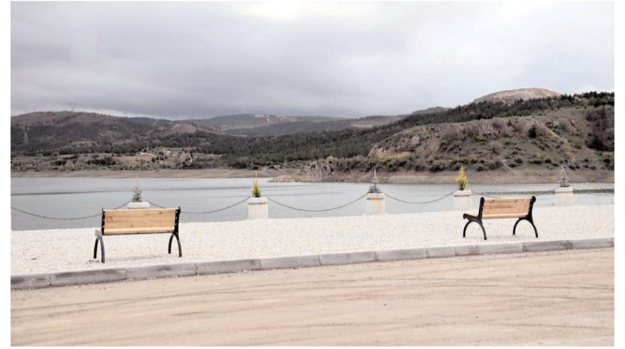
Çevre düzenlemesi ile Çomar Barajı daha hoş bir görünüme kavuşuyor.