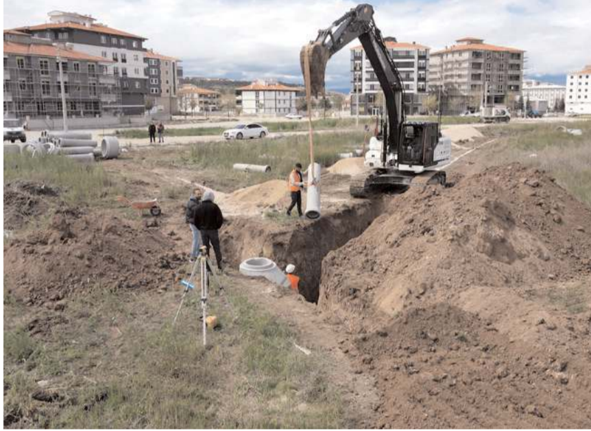
Fen Lisesi 17. Sokak'ta yeni açılan yolda asfalt çalışması öncesinde altyapı çalışmaları başladı

Çorum Belediyesi, Fen Lisesi bölgesinde yeni yapılaşmanın olduğu alanlarda çalışmalarını sürdürüyor.