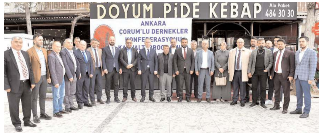
Toplantı sonrası dernek üyeleri birlikte poz verdi.

Toprak sanayicilerimize bir kez daha hayırlı bir üretim sezonu temenni ediyor; çalışın, tedirlikçi ve hizmet sağlayıcılarımızı kolaylıklar diliyorum." (Haber Merkezi)