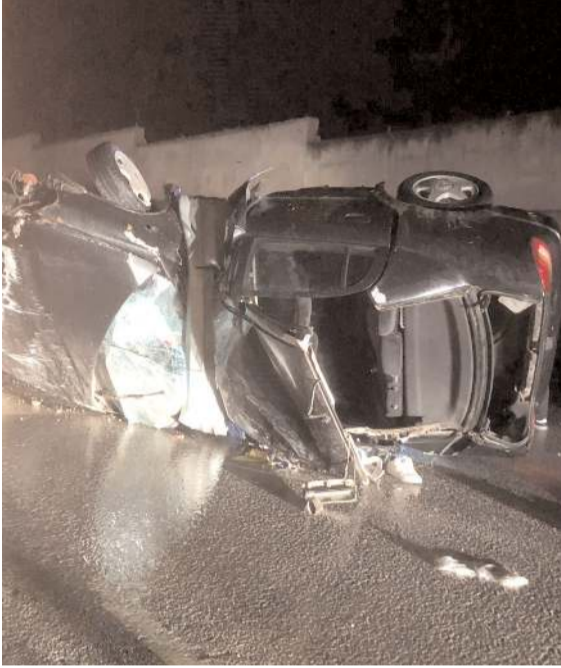
Havanın yağışlı olması sebebiyle sürücü direksiyon hakimiyetini kaybetti.