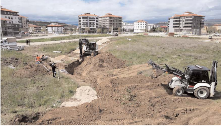
Fen Lisesi bölgesinde yapılan çalışmalardan bir görüntü...