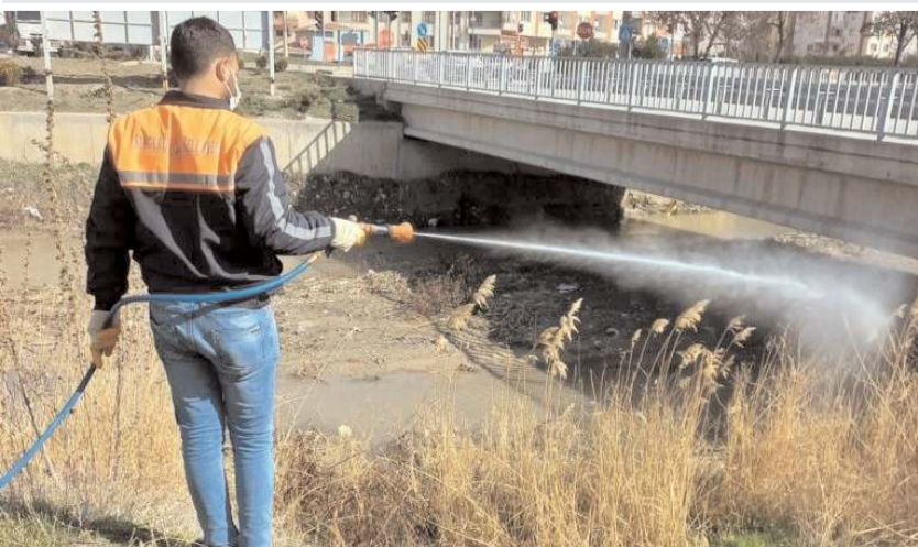
İlçe genelinde lavra ve haşere ilaçlama çalışması yapılıyor.

Hitit Üniversitesi İktisadi ve İdari Bilimler Fakültesi tarafından düzenlenen 9. Hitit Öğrenci Kongresi başladı.