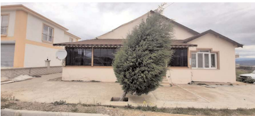
Kuvvetli rüzgar ilçe halkına zor anlar yaşattı.

Kuvvetli rüzgar nedeniyle Esentepe Mahallesi Doktor Sadık Ahmet Caddesi'ndeki tek katlı evin çatısı ile ilçe merkezindeki bir metruk ev zarar gördü.