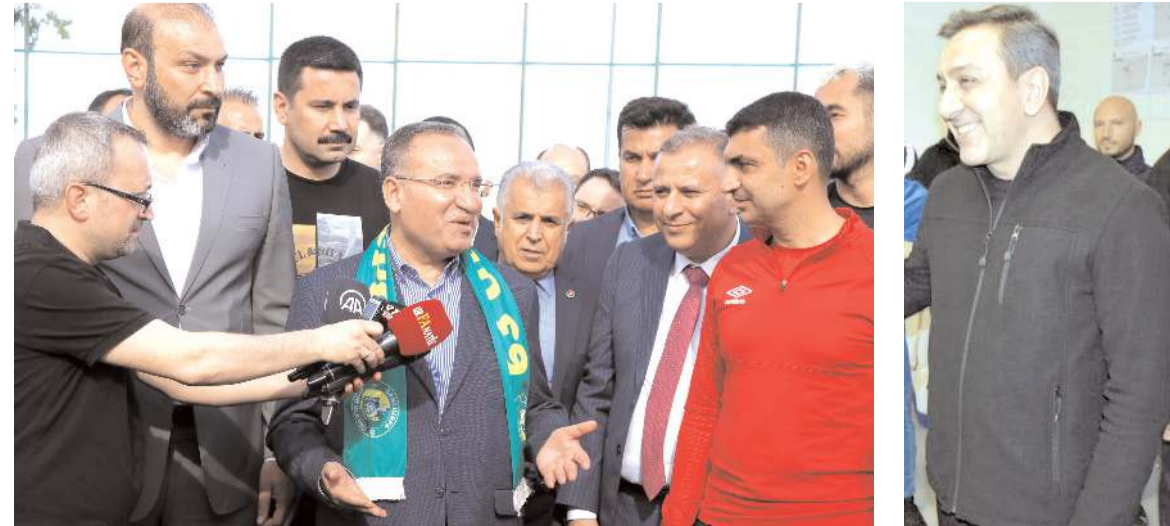
Bekir Bozdağ Şanlıurfa Urfaspor tesislerini ziyaretinde iddialı açıklamalarda bulundu

Bekir Bozdağ'ın bu açıklama haberinin altına yorum yapan Savunma Bakanı Yardımcısı ve Çorum FK'nın en büyük destekçisi Muhsin Dere 'Sayın bakanımız üzülecek sanırım ama futbol böyle takli rekabetle güzel. Bu gruptan bir şampiyon çıkacak oda Çorum FK'mız' dedi.