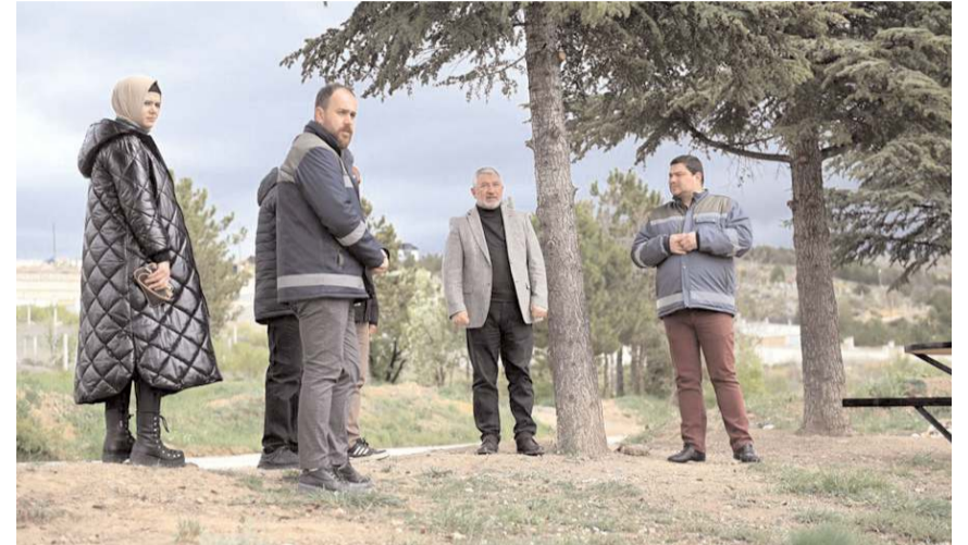
Belediye Başkanı Halil İbrahim Aşgın, Çomar Barajı etrafında yapılan çalışmalarını yerinde inceledi.