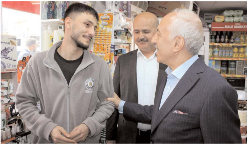
Esnafın sorunlarını dinleyen Gül, vatandaşların isteklerini tek tek not aldı.