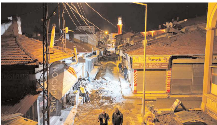
İki hafta içinde altyapı çalışmalarının tamamlanması bekleniyor.