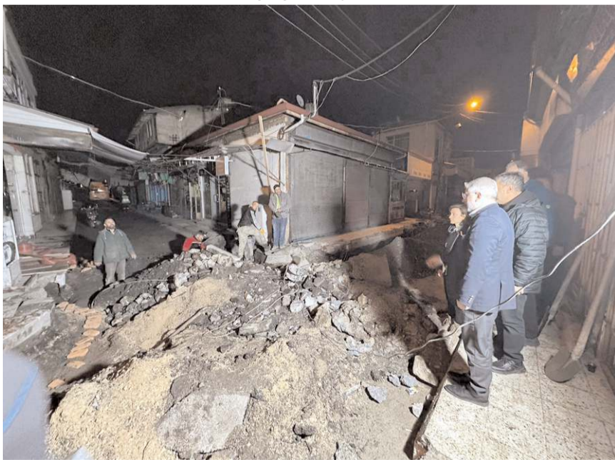
Arasta'nın altyapısını yeniliyor.