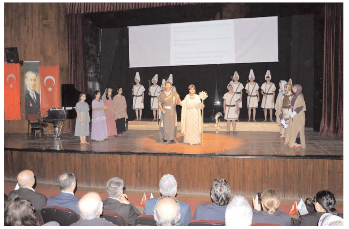
Doğa Koleji bir ilke imza atarak İngilizce Tiyatro gösterisi sundu.

Konuşmaların ardından MAKFED Genel Sekreteri Zühtü Bakır, makine sektörüne ilişkin sunum yaptı. (İHA)