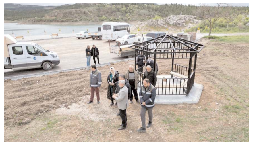
Çomar Barajı Çorum'a yakışır hale getiriliyor.