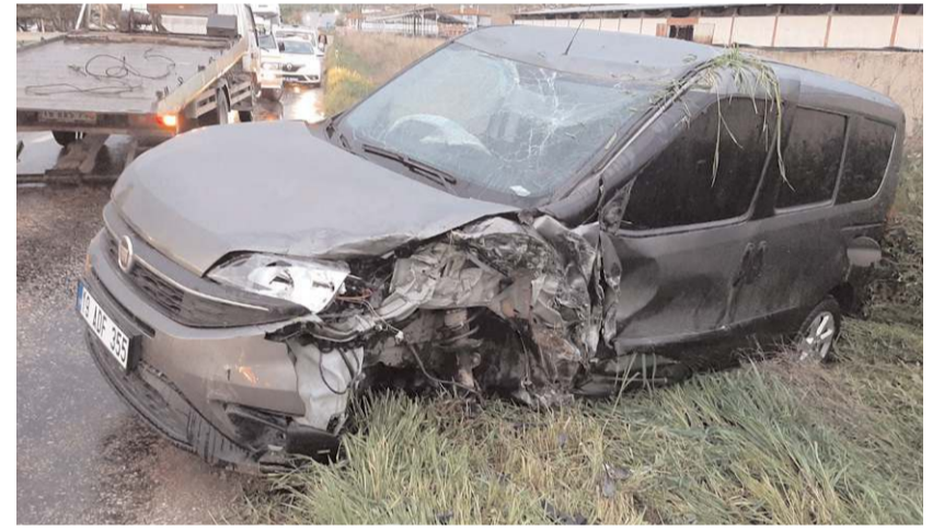
Yaralılar hastanede tedavi altına alındı.