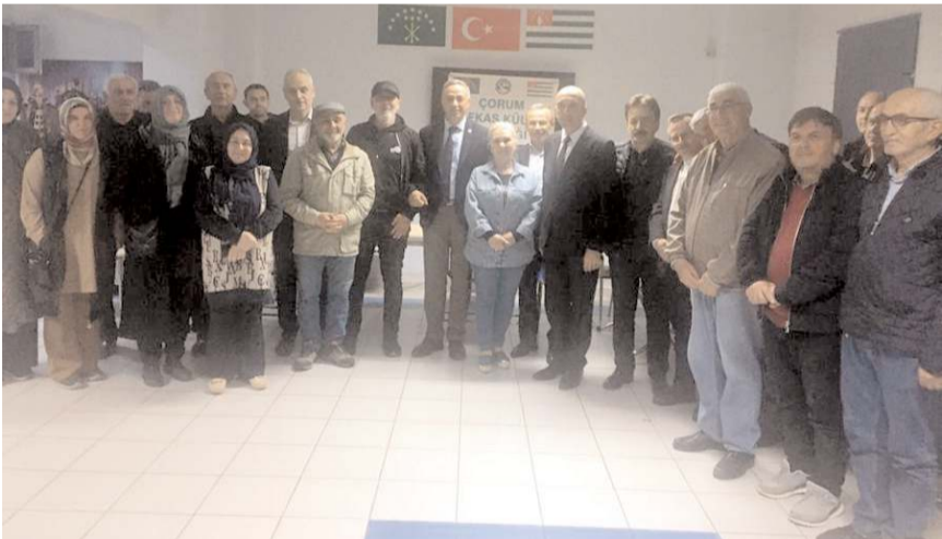
Millet İttifakı adayları, Çorum Kafkas Kültür Derneği'nin konuğu oldu.