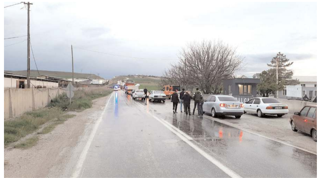
Kaza nedeniyle yol yaklaşık 1 saat ulaşıma kapandı.