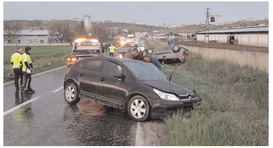
Kaza Yaydığın köyü yakınlarında meydana geldi.

Eğitim seminerlerinde alanında uzman isimler tecrübelerini aktaracak.