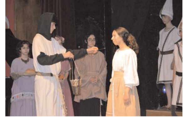
Doğa Koleji bir ilke imza atarak İngilizce Tiyatro gösterisi sundu.

Çorum Belediyesi, Çomar Barajı etrafında yaptığı düzenlemeyle bölgeyi vatandaşların rahatlıkla piknik yapabileceği bir cazibe alanı haline getiriyor. * HABERİ 6'DA