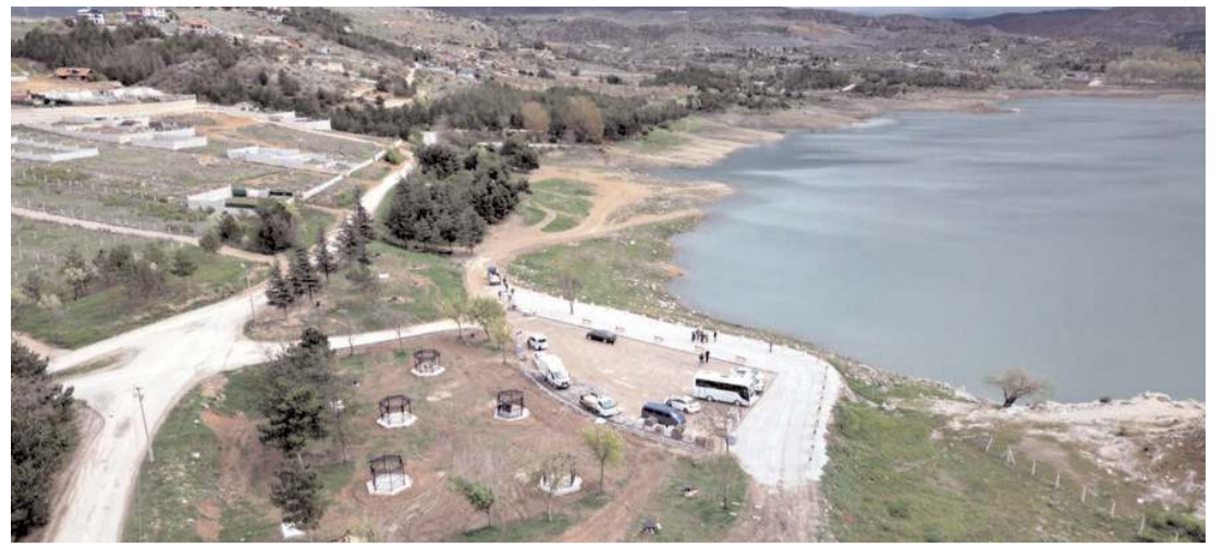
Çomar Barajı etrafında düzenleme çalışmaları devam ediyor.