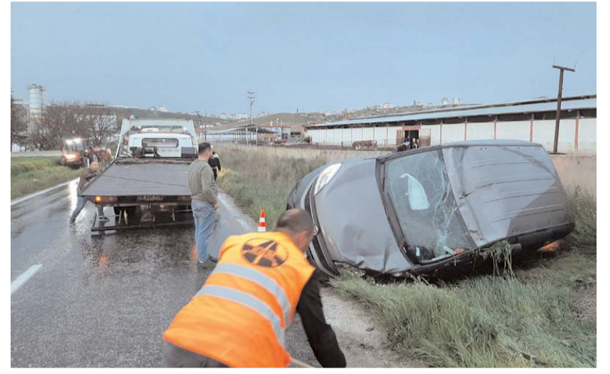
İhbar üzerine bölgeye polis ve sağlık ekipleri sevk edildi.

Kaza nedeniyle yol yaklaşık 1 saat ulaşıma kapandı.(AA)