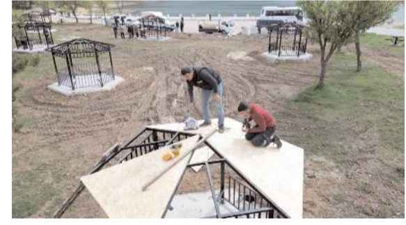
Çomar Barajı etrafında düzenleme çalışmaları devam ediyor.