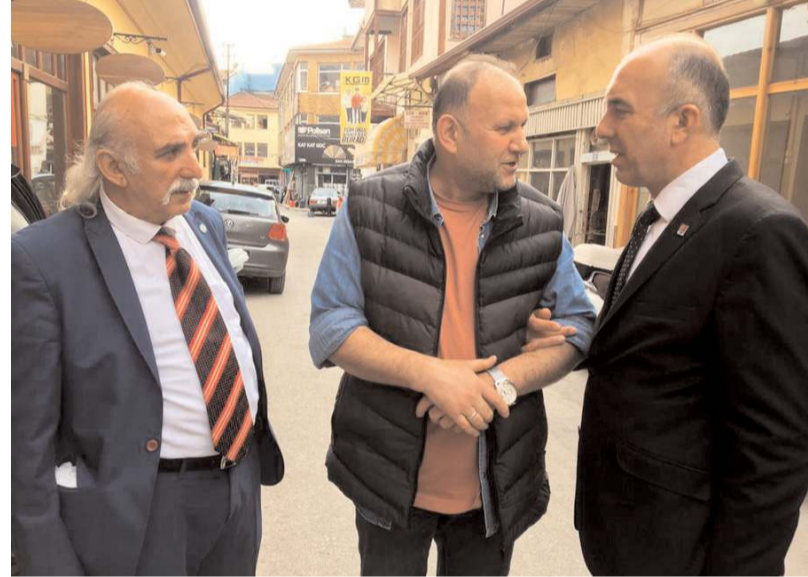
Özsaçmacı, esnafın, ülkenin belkemiği olduğunu söyledi.