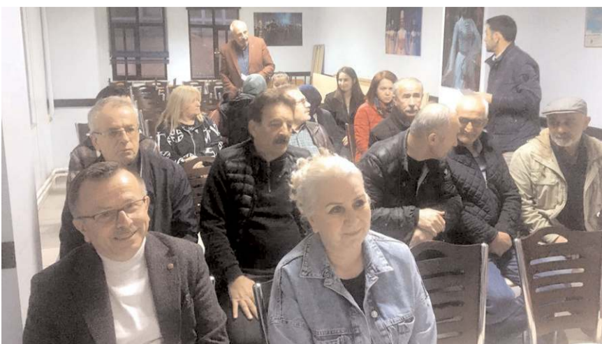
Adaylar, Çerkes vatandaşların sorun ve talepleri hakkında bilgi aldı.

Millet İttifakı milletvekili adayları ve parti yöneticileri, Sanayi Sitesi esnafını ziyaret ederek sorunları sahada tespit etti.