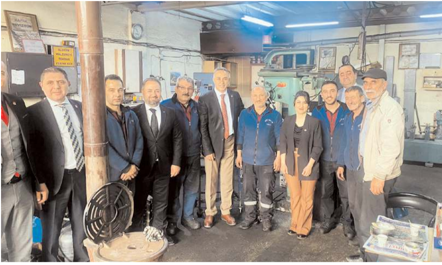
CHP heyeti, Sanayi Sitesi esnafını ziyaret etti.