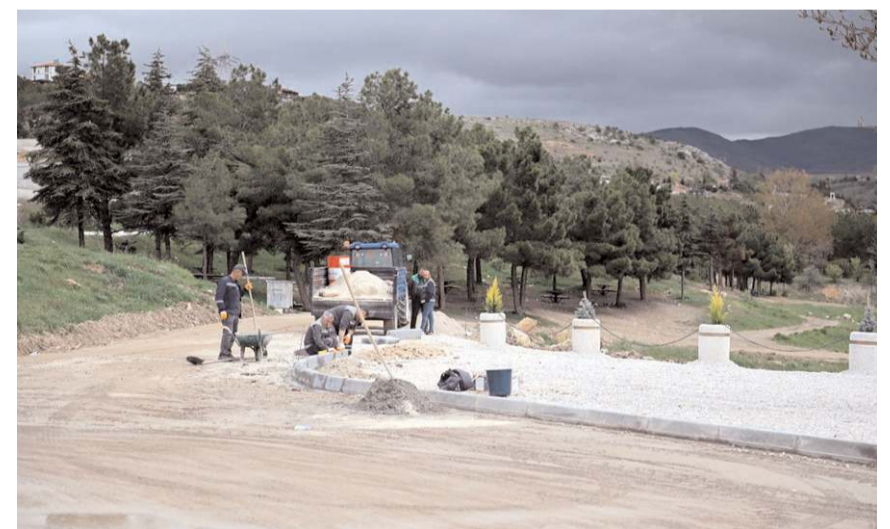
Çevre düzenleme çalışmalarından bir görüntü...