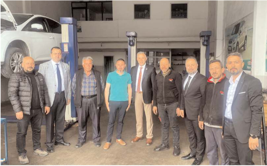
Millet İttifakı adayları, esnaftan hem destek istedi hem de sorun ve talepleri dinledi.