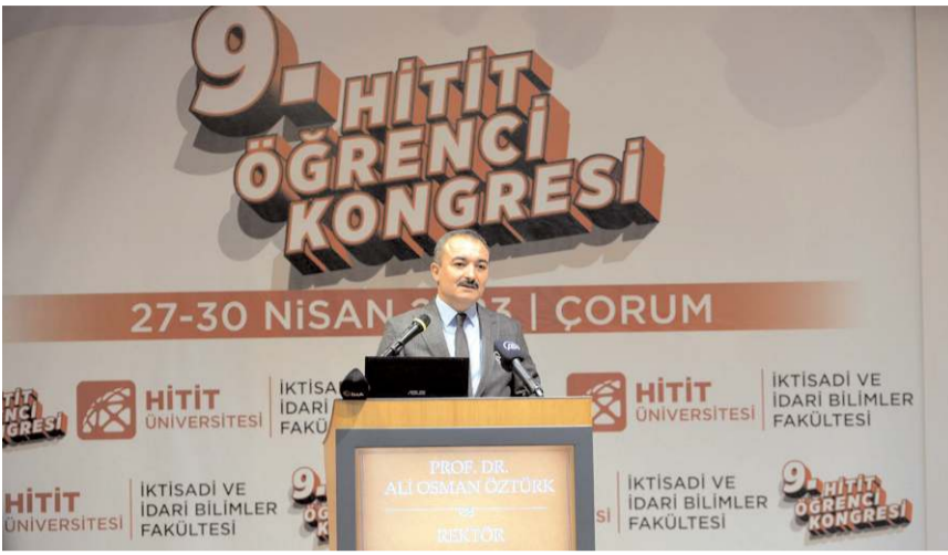
Kongrenin açılışında Rektör Öztürk konuştu.