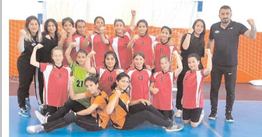
Dr. Sadık Ahmet grubundaki ikinci maçında kazanarak final grubu iddiasını sürdürdü

son maçında dün akşam seansında Amasya Ziyapaşa Ortaokulu ile karşılaştı. Temsilcimiz bu maçı kazanması halinde grupta ikinci olarak diğer grubun birincisi ile Türkiye finallerine gitmek için yarışmaya hak kazanacak.