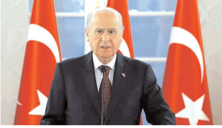
Dr. Devlet Bahçeli

■ Milliyetçi Hareket Partisi Genel Başkanı Dr. Devlet Bahçeli, seçim çalışmaları kapsamında bugün Çorum'da miting düzenleyecek.