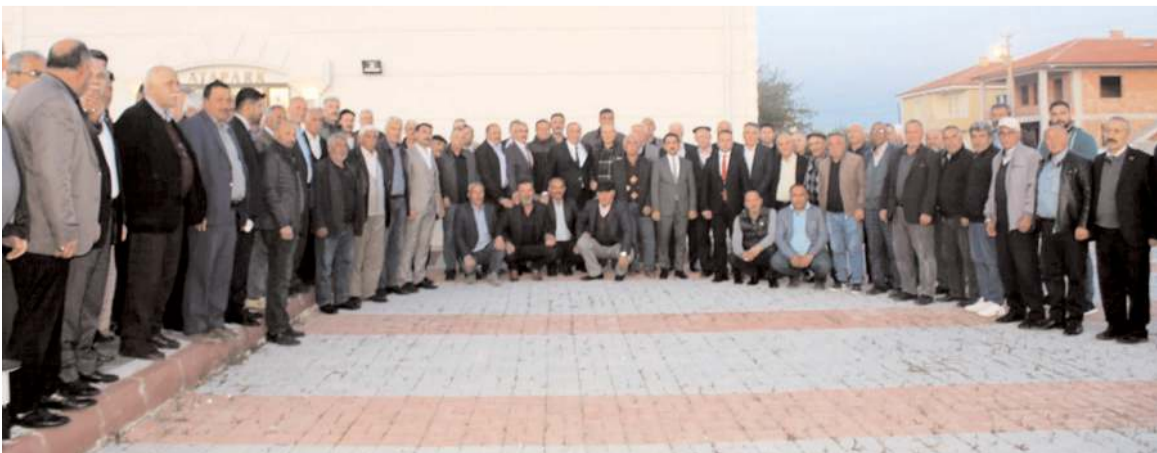
Toplantının sonunda hatıra fotoğrafı çekildi.

Muhtarlar da Kayırcı'ya seçim bölgelerinin ve özellikle çiftçilerin yaşadığı sorunlarını aktarırken, çeşitli konularda taleplerini de iletiler.