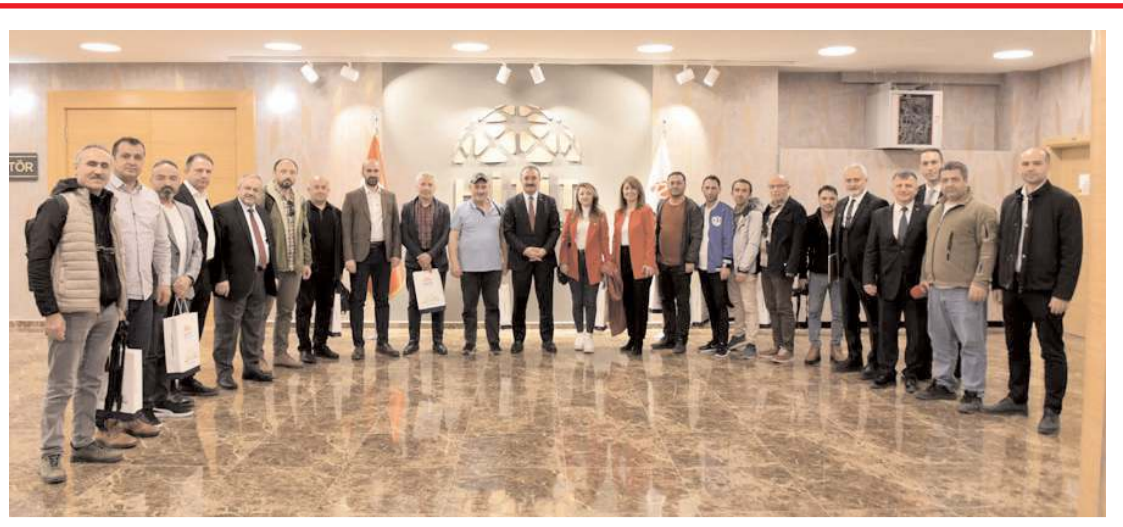
Basın toplantısının sonunda toplu hatıra fotoğrafı çekildi.