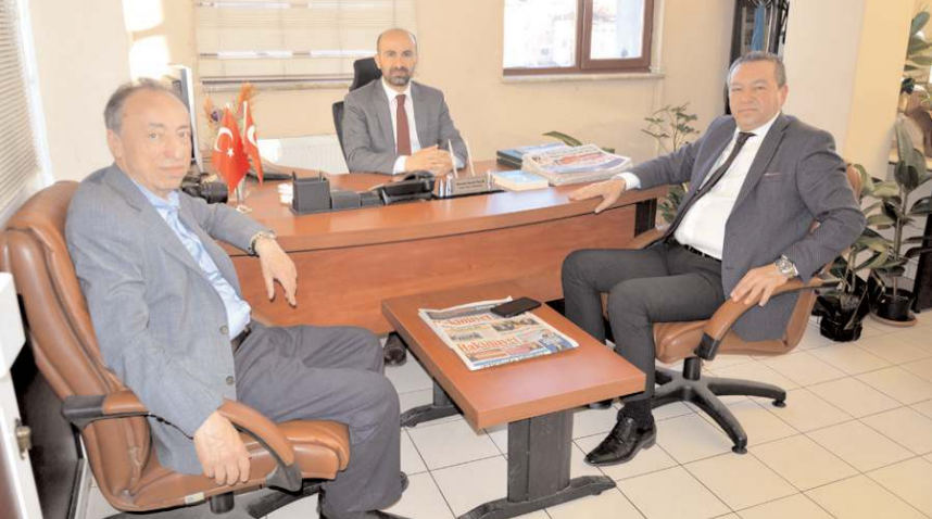
Memleket Partisi 1. Sıra Milletvekili Adayı Güven Kılıçay, gazetemizi ziyaret etti.

■ Gazetemize nezaket ziyaretinde bulunan Memleket Partisi 1. Sıra Milletvekili Adayı Güven Kılıçay, Cumhurbaşkanı adayları Muharrem İnce'nin Cumhurbaşkanı'nda adaletine inanılacak bir Türkiye kuracaklarını söyledi. * HABERİ 5'TE