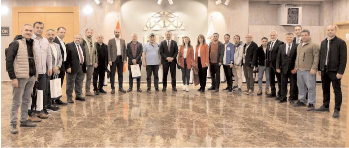
Basın toplantısının sonunda toplu hatıra fotoğrafı çekildi.

Son olarak yıllardır tamamlanmayı beklenen İskilip Meslek Yüksekokulu okulu hakkında bilgi veren Öztürk; "Toplam kapalı alanı 5 bin 692 metrekare olan İskilip Meslek Yüksekokulu kaba inşaatı hayırseverler tarafından yapılmıştır. İskilip Meslek Yüksekokulu binası projisinin bütçe çalışmaları yapılmış Spor Toto Teşkilat Başkanlığıyla 20 milyon+KDV karşılığında reklam sözleşmesi imzalanmıştır. İskilip Kaymakamlığı tarafından 5 milyon lira tahsis edilmiştir. 2023 yılı yatırım programı revizyon cetvelinde toplam proje tutarı 34 milyon 511 bin lira olarak açıklanmıştır. İnşaatın tamamlanabilmesi için gerekli olan 7 milyon 950 bin TL ek ödenek ihtiyacı Cumhurbaşkanlığı Strateji Bütçe Başkanlığı tarafından onaylanmıştır." ifadelerini kullandı.