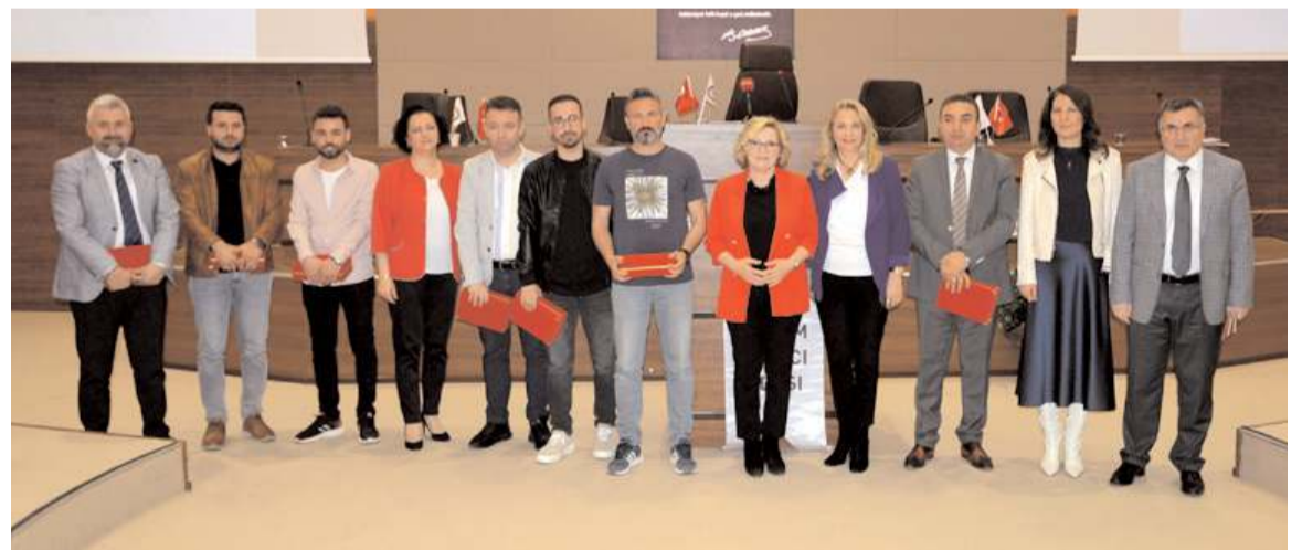
Eğitim TSO Konferans Salonu'nda düzenlendi.

İl merkezinde yıl başından bu yana meydana gelen cinayet ve yaralama olaylarının tamamının aydınlatıldığı, faili meçhul olay bulunmadığı, zanlılarla ilgili yargılama süreçlerinin devam ettiği öğrenildi.(AA)