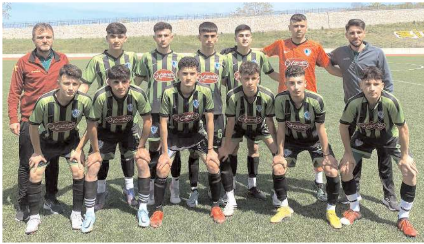
Mimar Sinan Gençlikspor gruba farklı galibiyet ile başlayarak moral buldu

Maçın son bölümünde kontrollü oyun oynayan temsilcimiz 80. dakikada penaltudan Enes'in golü ile maçtan 5-1 galip ayrılarak gruba galibiyet ile başladı. Mimar Sinan bugünü bay geçecek. Bugün grupta Karasamsunspor ile Zonguldak Ereğlispor takımları karşılaşacak. Temsilcimiz yarın grup birinciliği için Karasamsunspor ile karşılaşacak.