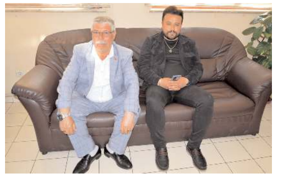
Ziyarete Memleket Partisi İl Yönetim Kurulu üyeleride katıldı.