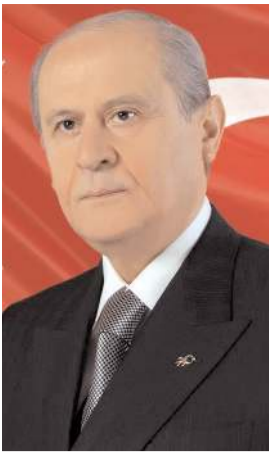
Dr. Devlet Bahçeli