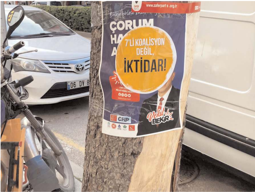
Bekir Özsaçmacı'nın afişlerinin üzerine başka afişler yapıştırıldı.

Seçimler, adayların ve partilerin kendini seç-