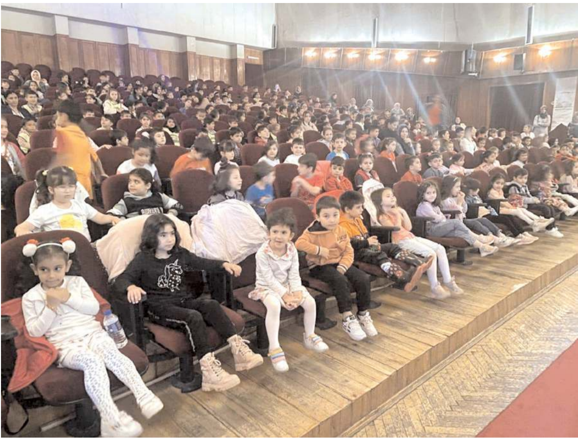
Tiyatro oyununa ilgi yüksek oldu.