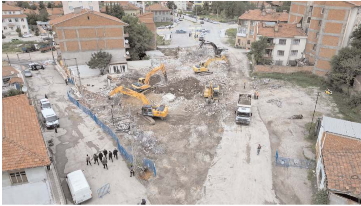
Yapının yıkımı dün itibarıyla sona erdi.

■ Müftülüğü'nün kendilerine kayıtlı böyle bir cami olmadığı şeklindeki cevabı.