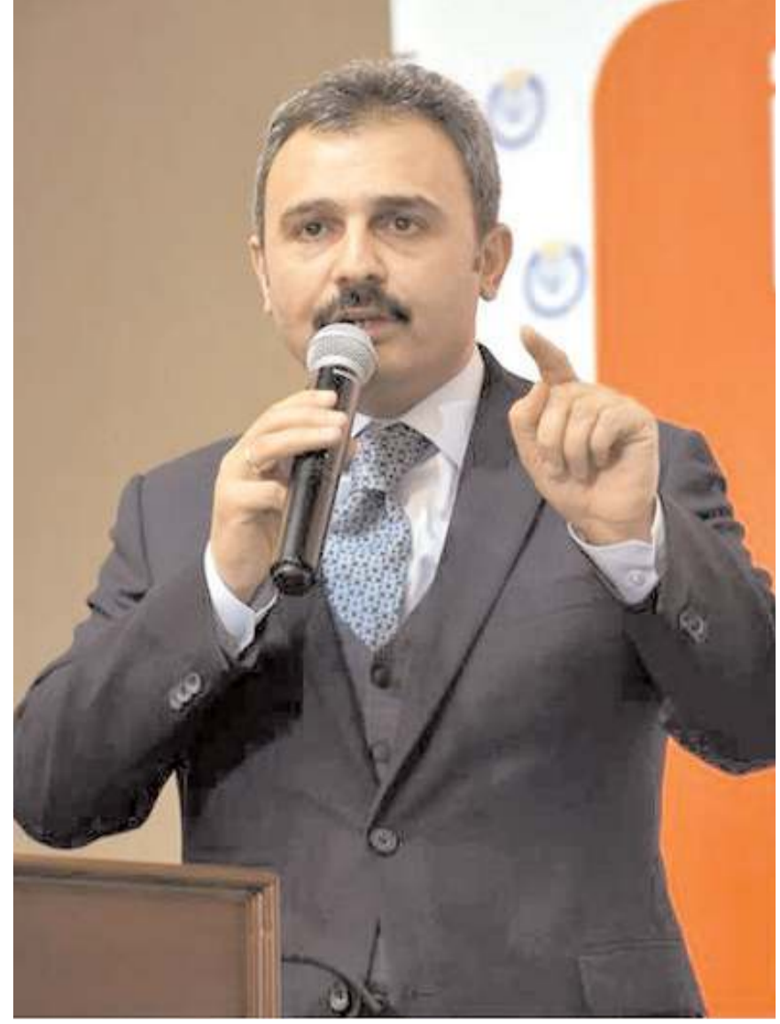
Önceki dönem Çorum Belediye Başkanı Avukat Muzaffer Külçü