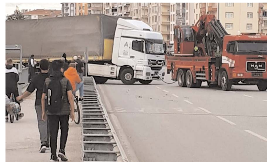
Tır uzun uğraşlar sonucunda yoluna devam edebildi.

Tırın, çekici marifetiyle olay yerinden kaldırılmasıyla trafik yeniden normale döndü. (İHA)