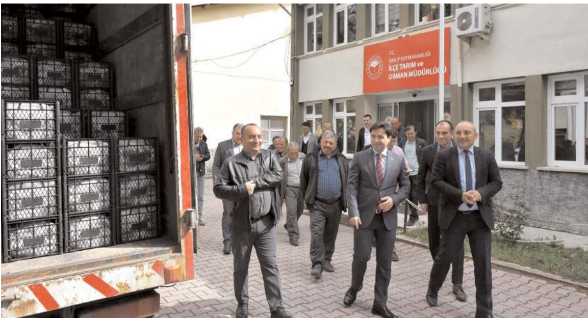
Çilek fideleri yapılan törenle çiftçilere dağıtıldı.

Törende 130 çiftçiye çilek fideleri teslim edildi. Kaymakam Vural, fidanların ilçedeki çilek üretimine katkı sağlaması temennisinde bulundu.(AA)