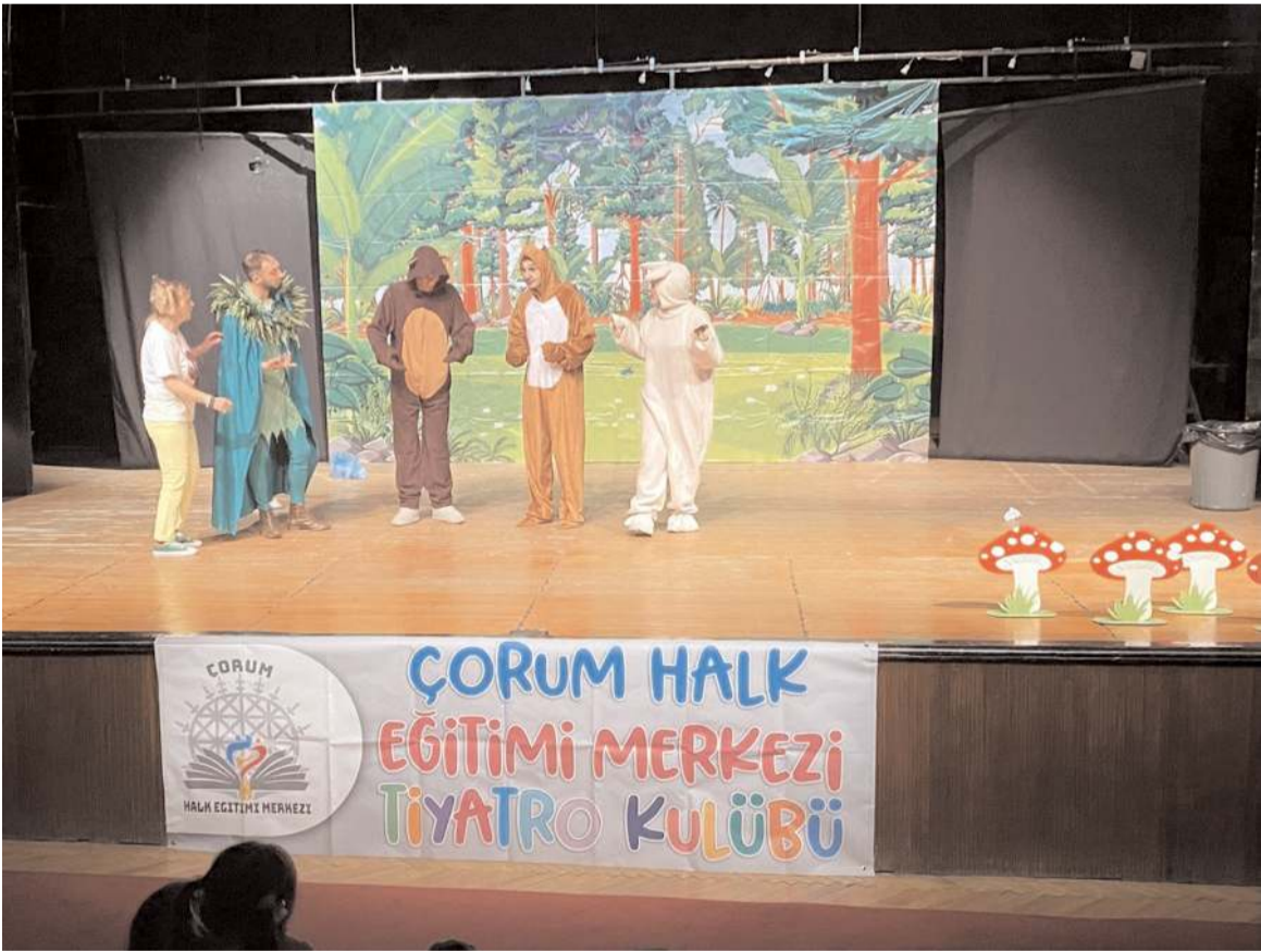
Oyun daha önce bazı okullarda da sahnelenmişti.

Mukadder Akaydın İlkokulu, Buhara Kültür Merkezi'nde Adnan Menderes ve 19 Mayıs İlkokulu ile Hürriyet İlkokulu'nda sahnelenen oyun Hayat Boyu Öğrenme Haftası kapsamında 31 Mayıs Çarşamba günü Devlet Tiyatro Salonunda dört seans halinde tüm çocuklar için sahne olarak 3500 çocuğa ulaşmış oldu. (Haber Merkezi)