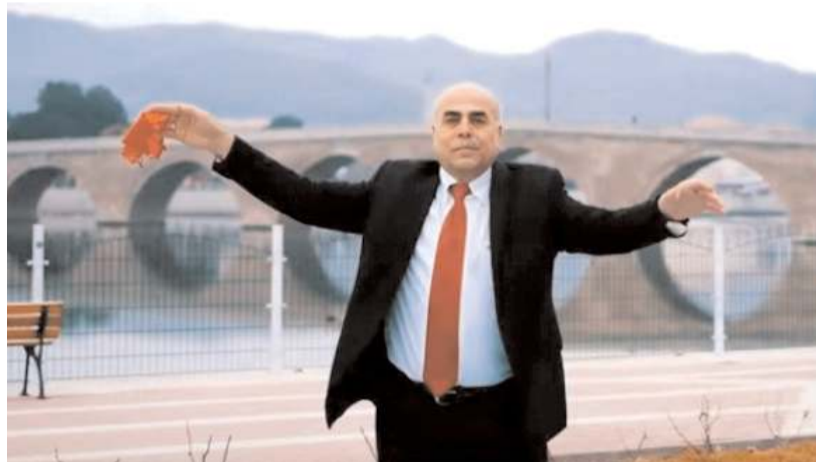
Çorumlu Namık 'Çorumun Leblebisi' isimli şarkının klibini il merkezi ile ilçelerde çekti.

Kaya, "Rabbim hayırlı hizmetlerde bulunmayı nasip etsin" dedi.