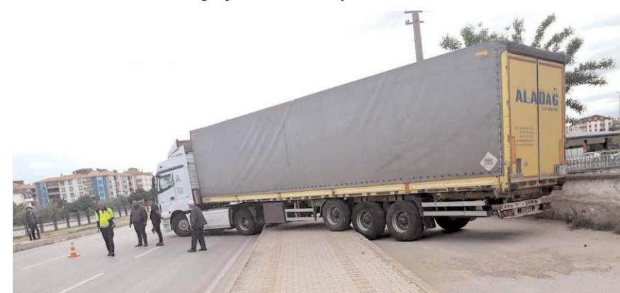
Trafikte aksamalar yaşandı.