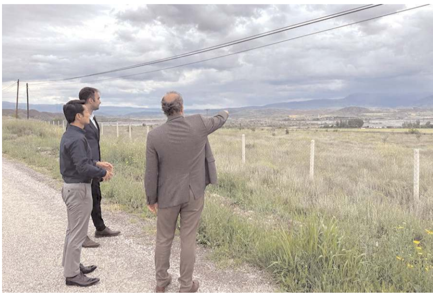
Firma yetkilileri fabrikanın yapılacağı arazide incelemede bulundu.