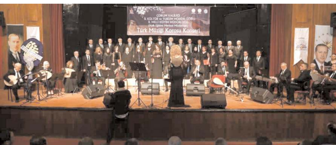
Çorum Halk Eğitimi Merkezi Türk Müziği Korosunun konseri bu akşam gerçekleştirilecek.

Çal köyü yakınlarında mahsur kalan iş makinesini Alaca Belediyesine iş makineleri tarafından kurtarma çalışmaları başlatıldı.