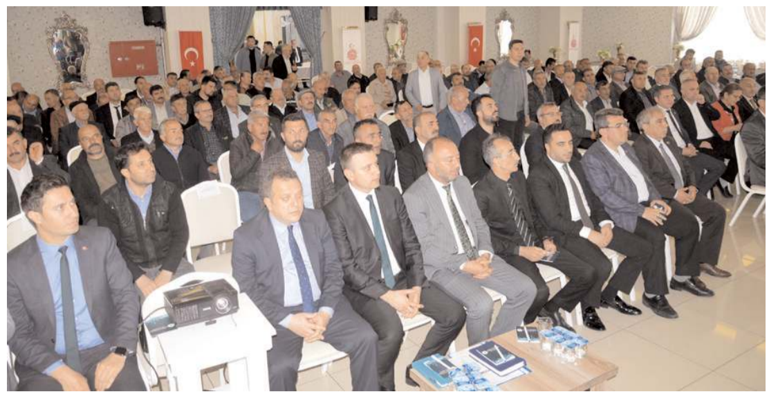
KÖYDES seçimlerine katılım yüksek oldu.