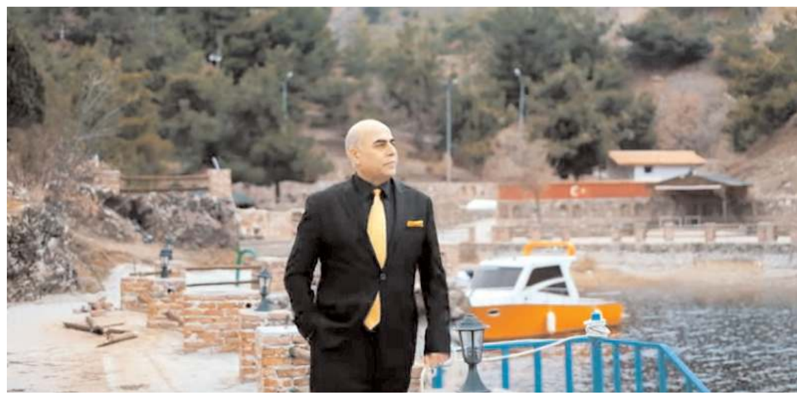
Klipte il merkez ile ilçelerin tarihi ve turistik yerleri tanıtıldı.