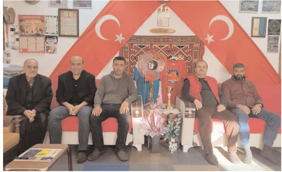
Her iki derneği yetkilileri birarada...

Teklif fiyatı ihale komisyonu tarafından aşırı düşük olarak tespit edilen isteklilerden Kanunun 38 inci maddesine göre açıklama istenecektir.