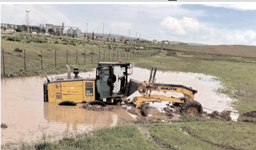
Yoğun yağışın ardından oluşan sele müdahale eden greyder çamura saplandı.

İlçeye bağlı Çal köyünde de sağanak yağmur nedeniyle taşkınlar oldu. Köy merkezi ve çevresi çamur deryasına dönerken köylüler İl Özel İdaresini arayarak yardım istedi. Bölgede çalışma