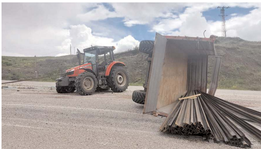
Kazada traktörde maddi hasar meydana geldi.

Alaca'da, kasa-sında demir profil yüklü traktörün devrilmesi sonucu sürücü yaralandı.