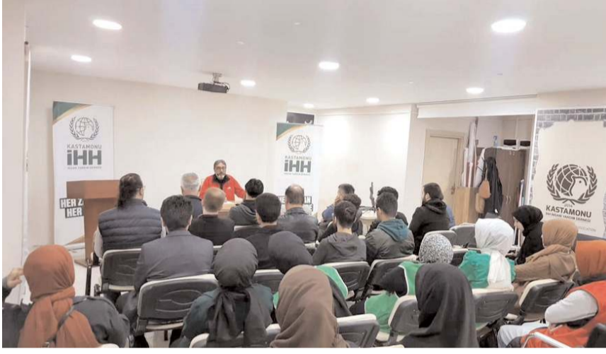
Çorum İHH, Kastamonu'da Mavi Marmara konferansı düzenledi.

Mavi Marmara Gemisi yola çıkmadan önce Türkiye'de kampanyalar yapıldı, kermesler düzenlendi ve bir filo oluşturuldu. Bu gemide yaşlılar, gençler ve kadınlar da vardı. Her din-den her ırktan insanın bulunduğu ge-