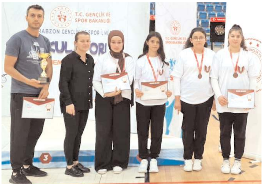
Türkiye dördüncüsü olan İskilip Sultan Hatun Mesleki ve Teknik Anadolu Lisesi takımı

Yedi maç sonunda çeyrek finale kadar yükselen İskilip Sultan Hatun Mesleki ve Teknik Anadolu Lisesi Dart takımı çeyrek finalde Niğde temsilcisi 3-0 yenerek yarı finale yükseldi ve kürsüyle garantiledi. Finalde yükselmek için Ordu temsilcisi ile karşılaşan İskilip okulu nefes kesen bir mücadeleye sahne olan bu maçı 3-2 kaybederek final şansını kaçırdı. Üçüncülük dördüncülük maçında ise Gaziantep'e yenilen İskilip Sultan Hatun Mesleki ve Teknik Anadolu Lisesi Dart takımı Türkiye dördüncülüğünü kazandı.