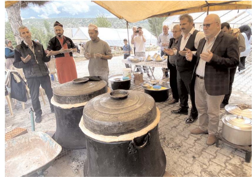
İskilip dolması kazanları duayla açıldı.

Dua programında davetlilere İskilip Dolması ikramında da bulunuldu. (Haber Merkezi)