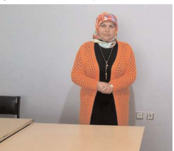
Toplantıya katılan isimler kültür ve sanat üzerine konuşmalar gerçekleştirdiler.

nun ilk toplantısını Eylül ayının ilk cumartesi günü gerçekleştirecek.