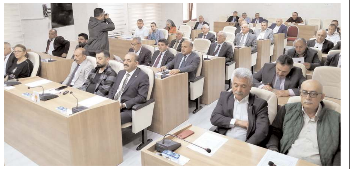
İl Genel Meclisi haziran ayı toplantılarına başladı.