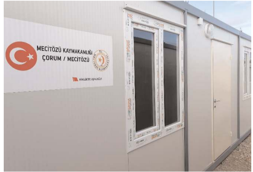
30 konteyner deprem bölgesine bu hafta gönderilecek.

Atış, "Ülkemizde asrın felaketi olarak nitelendirilen bu felakette mağdur olan depremzedelerin kullanımına sunulmak üzere halkımızın desteği ile yaptırılan