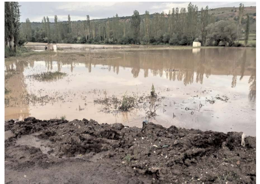
Sel nedeniyle araziler su altında kaldı.