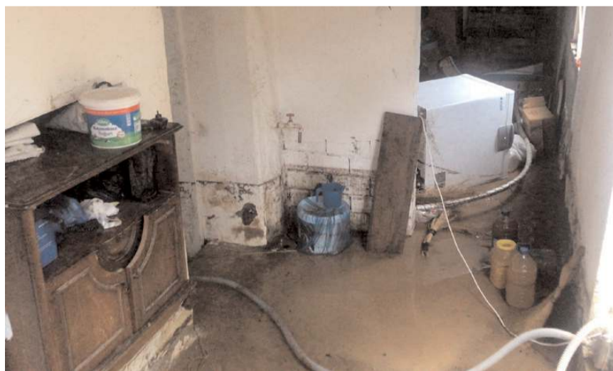
Kalehisar köyünde sağanak nedeniyle evleri su bastı

Çorum'da etkili olan sağanak dolayısıyla 2 ahır yıkıldı, 2 evi su bastı.