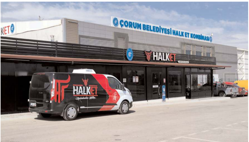
Çorum Belediyesi Halk Et Kombinası, İskilip Yolunda bulunuyor.