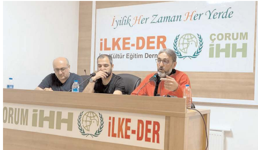
Çorum İHH'da Mavi Marmara konferansı gerçekleştirildi.