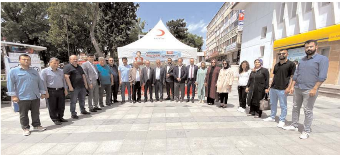
Kurban bağış standı Hürriyet Parkı önüne açıldı.

Ülkemizin geleceğinin, yarınlarının parlak olmasını ve şimdiden bütün insanlarımızın mutlu, sağlıklı, huzurlu, esenlik dolu bayramlar geçirmesini temenni ederiz." (Haber Merkezi)