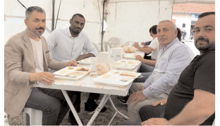
Program pazar günü öğle namazından sonra gerçekleştirildi.

Dua vesilesiyle bir araya gelme fırsatı bulunan Üyüklüler, bol bol hasret giderirken, birlik ve beraberliklerine önemli katkı sağlayan bu organizasyon için emeği geçen herkese teşekkür etti.