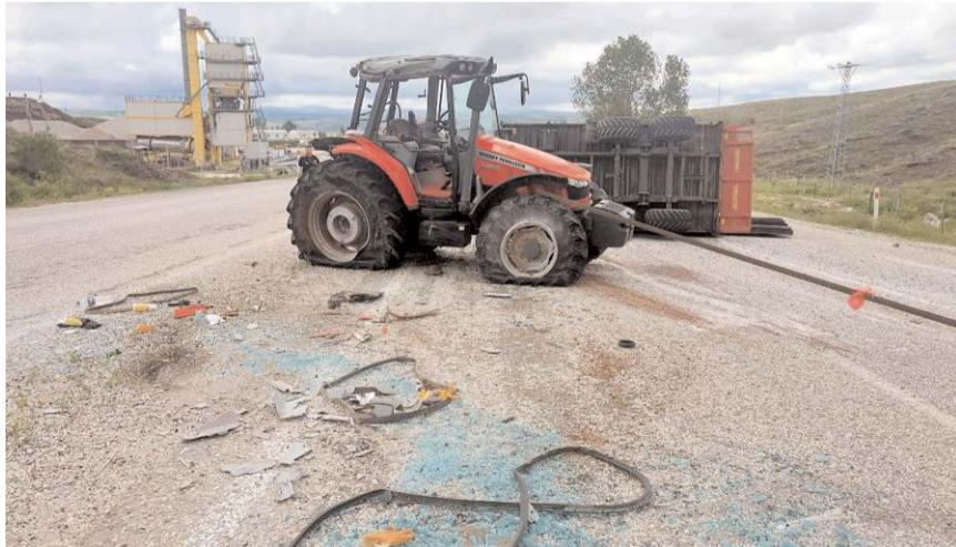
Kaza Küre köyü mevkinde meydana geldi.