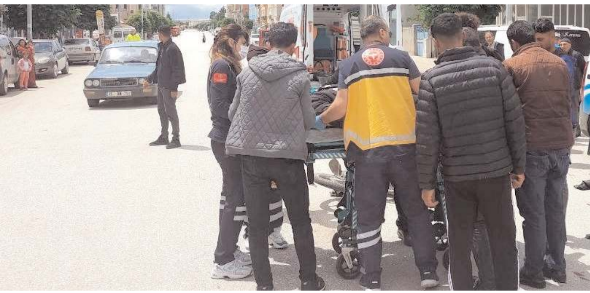
Kaza Ankara Caddesi'nde meydana geldi.