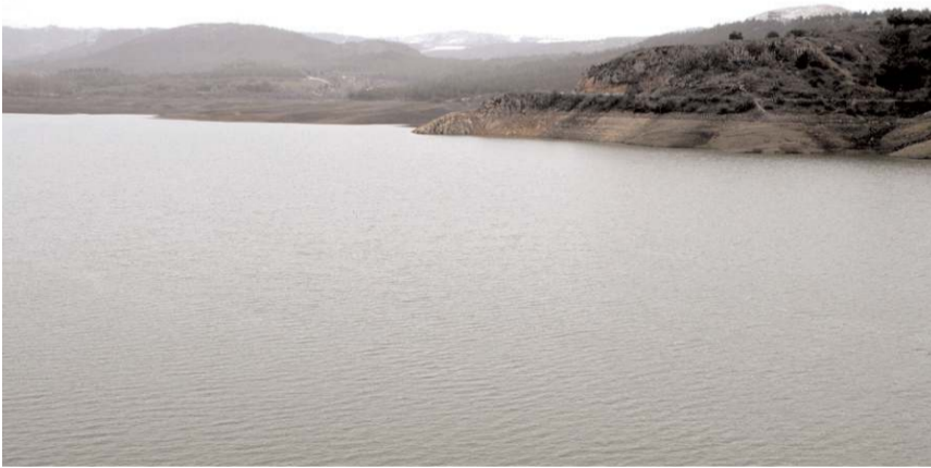
İlkbahar aylarının yağışlı geçmesi barajların doluluk oranlarının yükselmesine neden oldu.