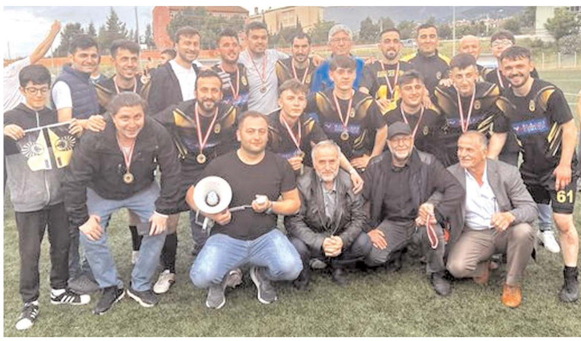
Maç öncesi Kargiserispor ile HE Kültürspor takım sporcuları ve idarecileri toplu halde görülüyor