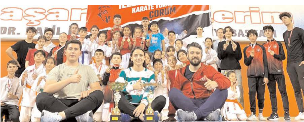
Turnuvada kupa ve madalyalara ambargo koyan Çorum takımı antrenör ve sporcuları bir arada