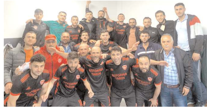
Düvenci Belediyespor ligdeki çıkışını Oğuzlar Belediyespor önünde de sürdürdü

mamlayan Düvenci Belediyespor ikinci yarıda rakibine bir gol izni verdi ve maçtan 3-1 galip ayrılarak ligdeki galibiyetini dörde puanını ise 12'ye çıkardı. Oğuzlar Belediyespor da 12 puanda kaldı.