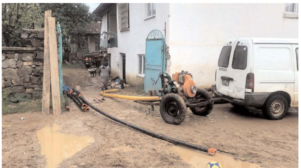
Su basan evlerden tahliye çalışması başlatıldı.

Ekiplerin incelemesinin ardından hasar tespit çalışmalarına başlandı.(AA)