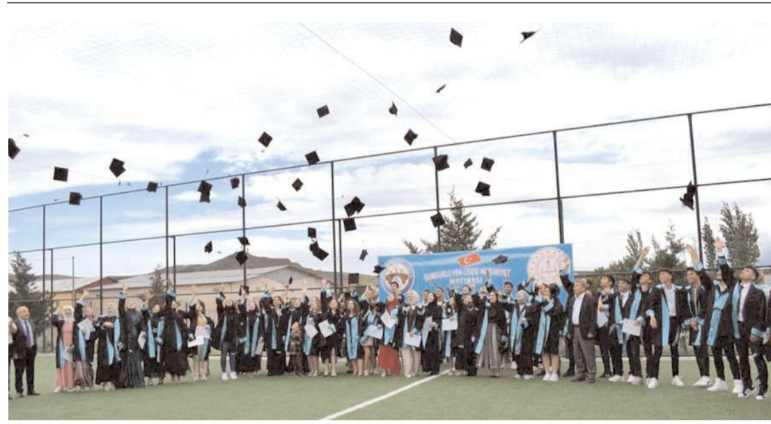
Öğrenciler kep atarak mezun olmanın sevincini yaşadılar.

Toplantının sonunda programa katılan temsilcilere günün anısına plaket takdim edildi.(AA)