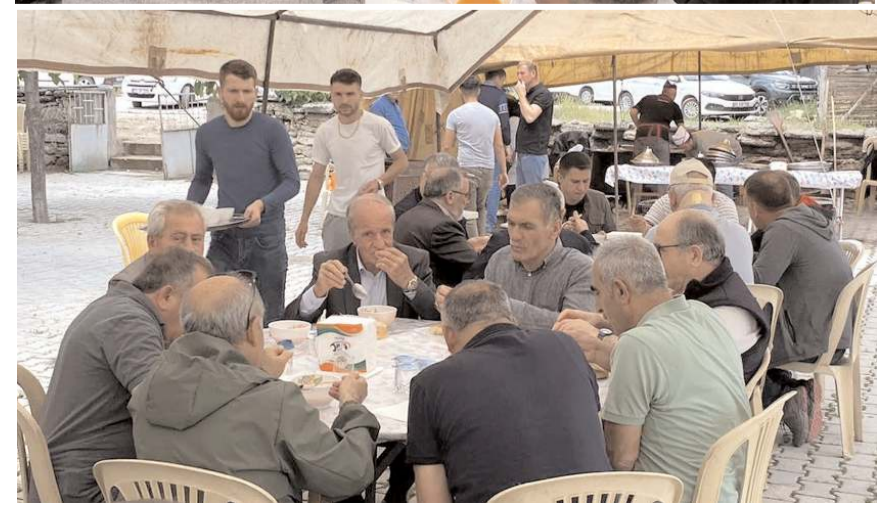
Duanın ardından vatandaşlara İskilip Dolması ikram edildi.