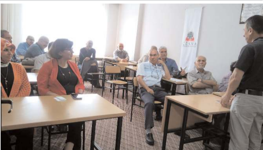
Toplantıya çok sayıda sanatsever katıldı.

Sanat Dostları'nın, sezonun son toplantısında konuşan ÇEKVA İl Temsilcisi