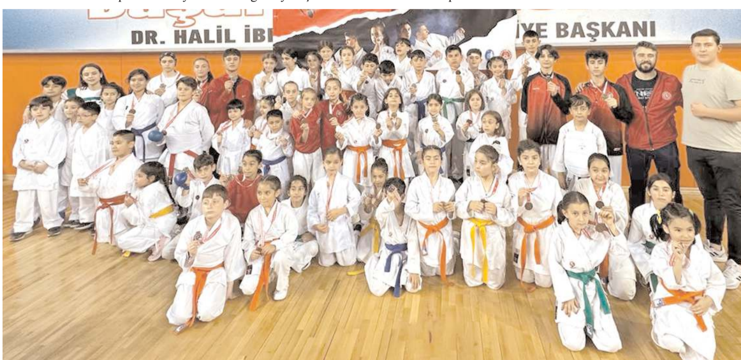
Karate Turnuvasında Çorum adına katılan ve madalya kazanan sporculara ödül töreni sonrasında toplu halde görülüyor