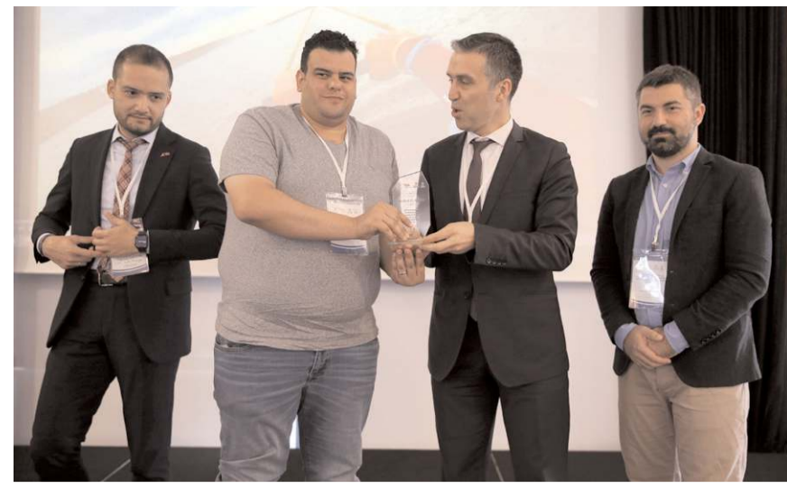
Toplantının sonunda temsilcilere günün anısına plaket takdim edildi.