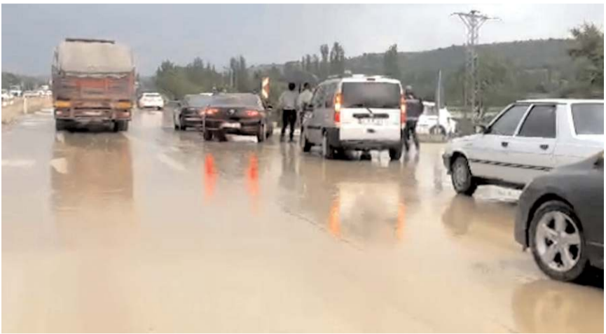
Sağanak ve dolu yağışı Ankara yolunda sele neden oldu.

Sungurlu'da etkili ardından sel sularının karayolunda sürücüler zor anlar yaşadı. Ankara-Çorum zor anlar yaşadı.