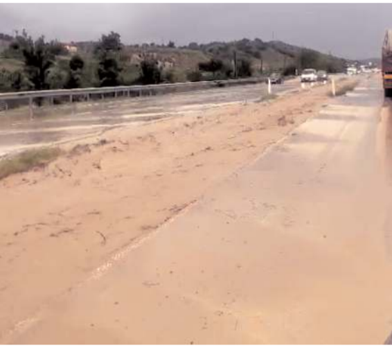
Sel nedeniyle trafikte aksamalar meydana geldi.