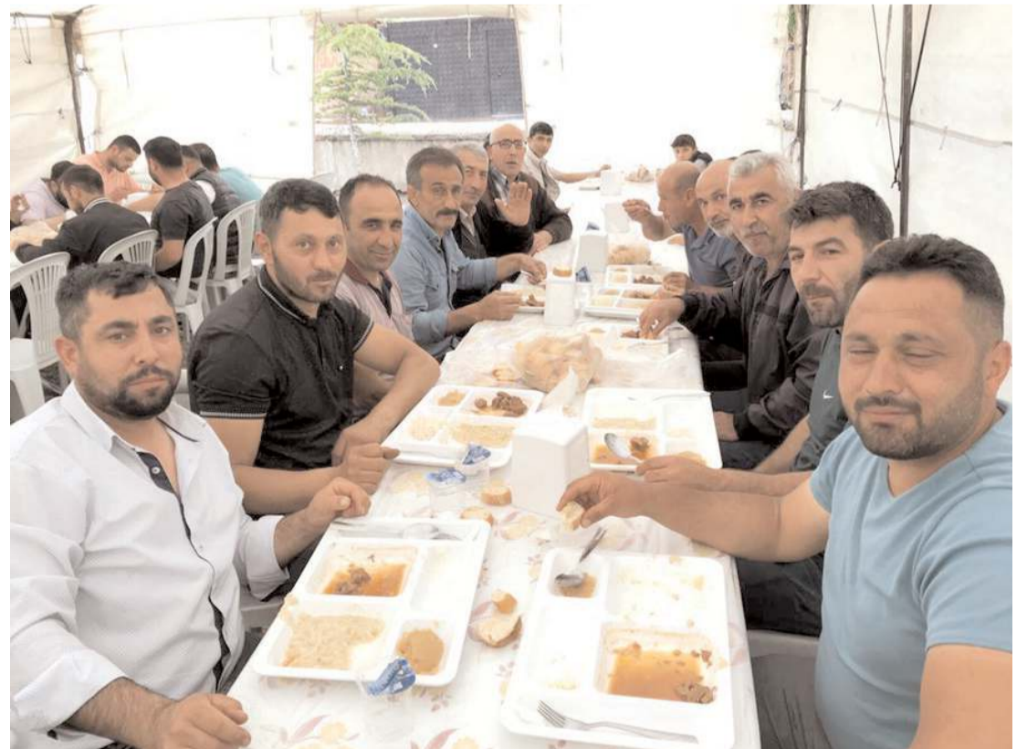
Üyüklüler, programda bol bol hasret giderdiler.