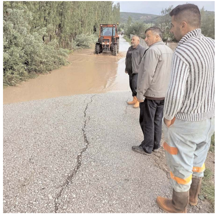
Sel köy yollarında trafiği olumsuz etkiledi.

Sungurlu ilçesine bağlı Hacı Musa köyünde ise sağanak yağış nedeniyle yüzlerce dönüm ekili arazi sular altında kaldı. Köyün yanından geçen dere taşarken, selin geliş anı bir vatandaş tarafından cep telefonu ile görüntülendi. (İHA)