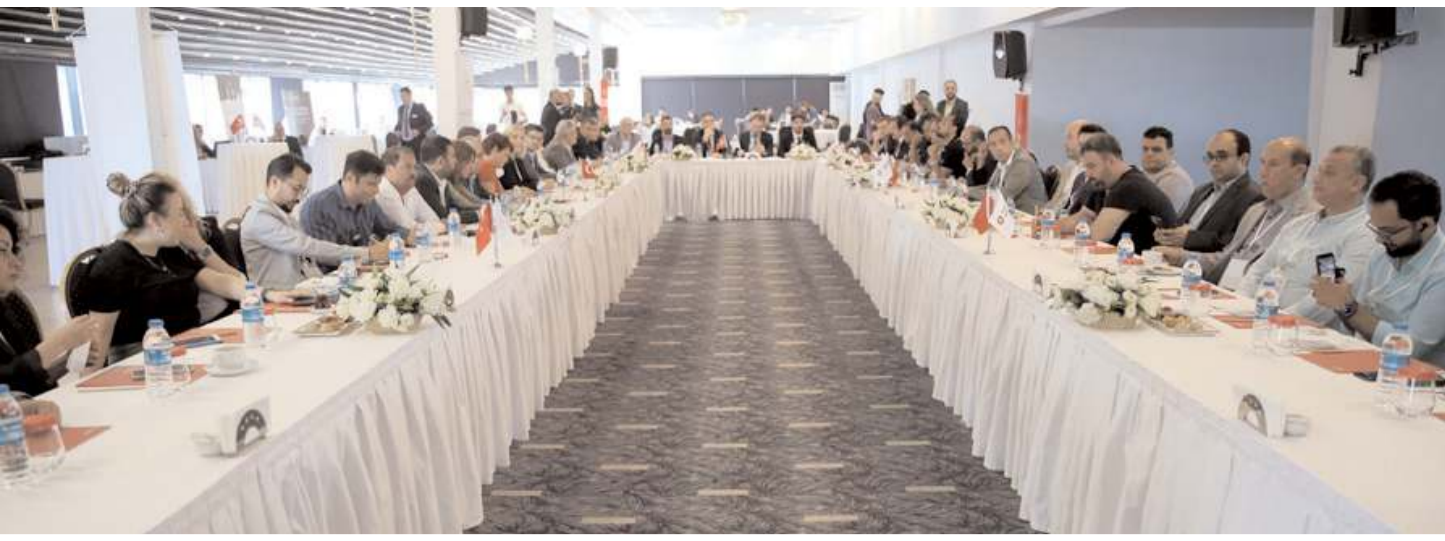
Toplantı Samsun'da yapıldı.