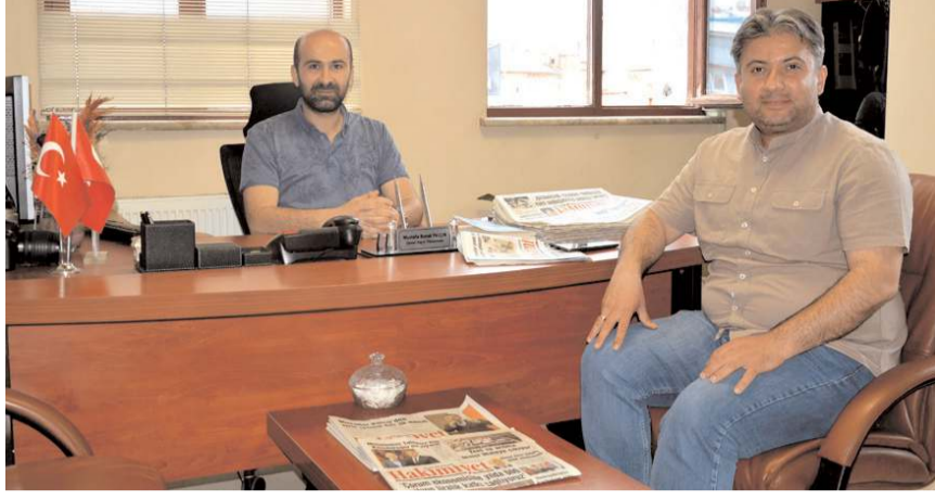
Ziyarete yerel basın üzerine sohbet edildi.