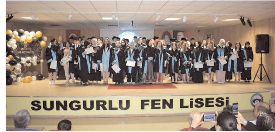
Sungurlu Fen Lisesi 12. sınıf öğrencileri için mezuniyet töreni yapıldı.