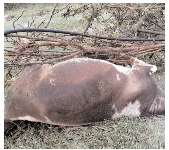
Sağanak yağışın ardından meydana gelen selde büyükbaş hayvanlar da telef oldu.