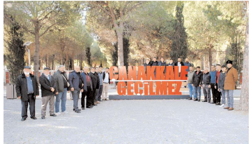
Fuar 8-11 Haziran 2023 tarihleri arasında İstanbul TÜYAP Fuar ve Kongre Merkezi'nde gerçekleştirilecek.