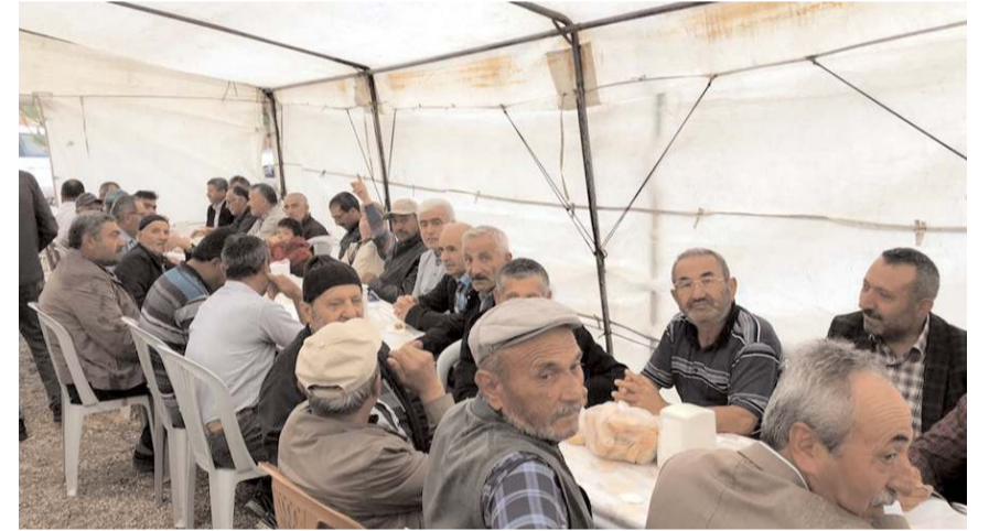
Şükür Duası programına katılım yüksek oldu.