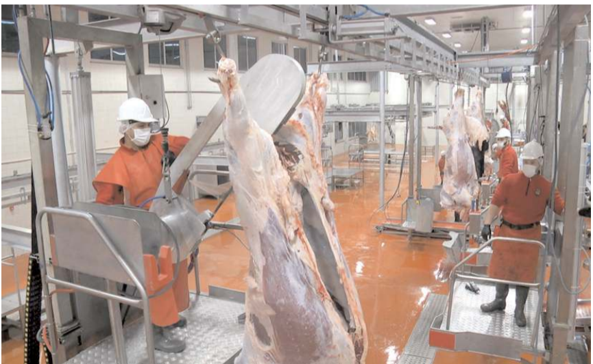
Halk Et Kombinası modern alt yapısı ile dikkat çekiyor.

Bilgi İçin: +90 552 720 19 19 (Haber Merkezi)