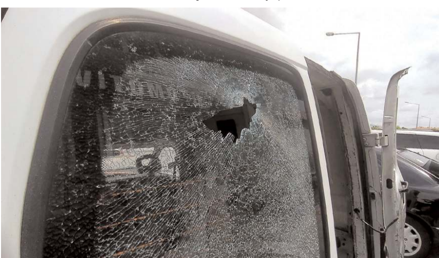
Kurşun, aracın arka camında hasara neden oldu.

Olayla ilgili başlatılan soruşturma sürüyor.(İHA)