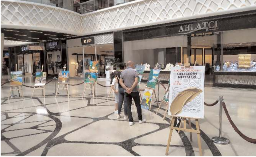
Mecitözü Atatürk Ortaokulu öğrencileri, ilk olarak AHL Park AVM'de resim sergisi açtılar.