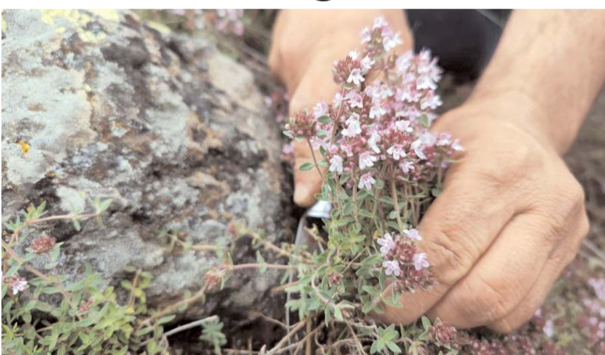
Kekik ilçenin 1400 rakımlı yüksek kesimlerinde toplanıyor.