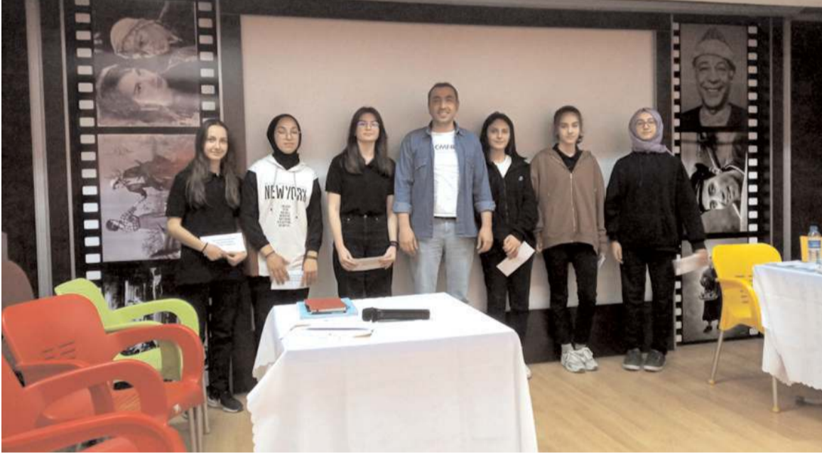
Yarışmada 10/C sınıfı öğrencileri birinci oldu.