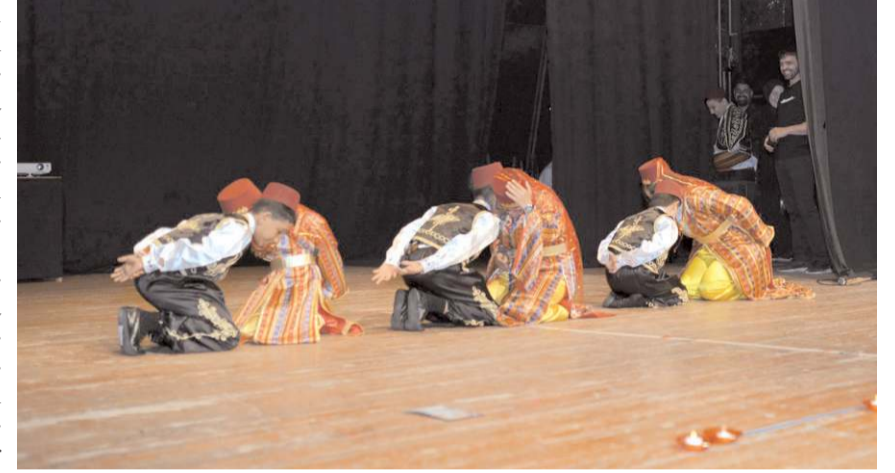
Öğrencilerin gösterileri bol bol alkış aldı.

Özel öğrencilerin modern dans, ritim, halk oyunları ve sıra gecesi gösterileri ile devam eden, okulun faaliyetlerinin anlatıldığı sinevizyon gösterisi izlendiği, şiirlerin okunduğu, öğrenci velisi Hatice Mehralı'nın duygu ve düşüncelerini dile getirdiği muhteşem gece 8/A ve 8/B sınıflarına diplomalarının verilerek kep giyme töreni ile son buldu. (Haber Merkezi)