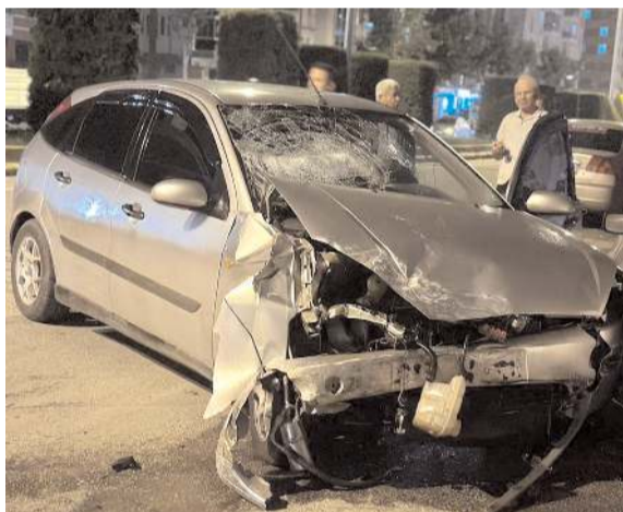
Olayda çok sayıda araçta maddi hasar meydana geldi.

Bu arada karayolları ekipleri de başka kazaların yaşanmaması için mazot dökülen kesimlerde tozlama yaptı.