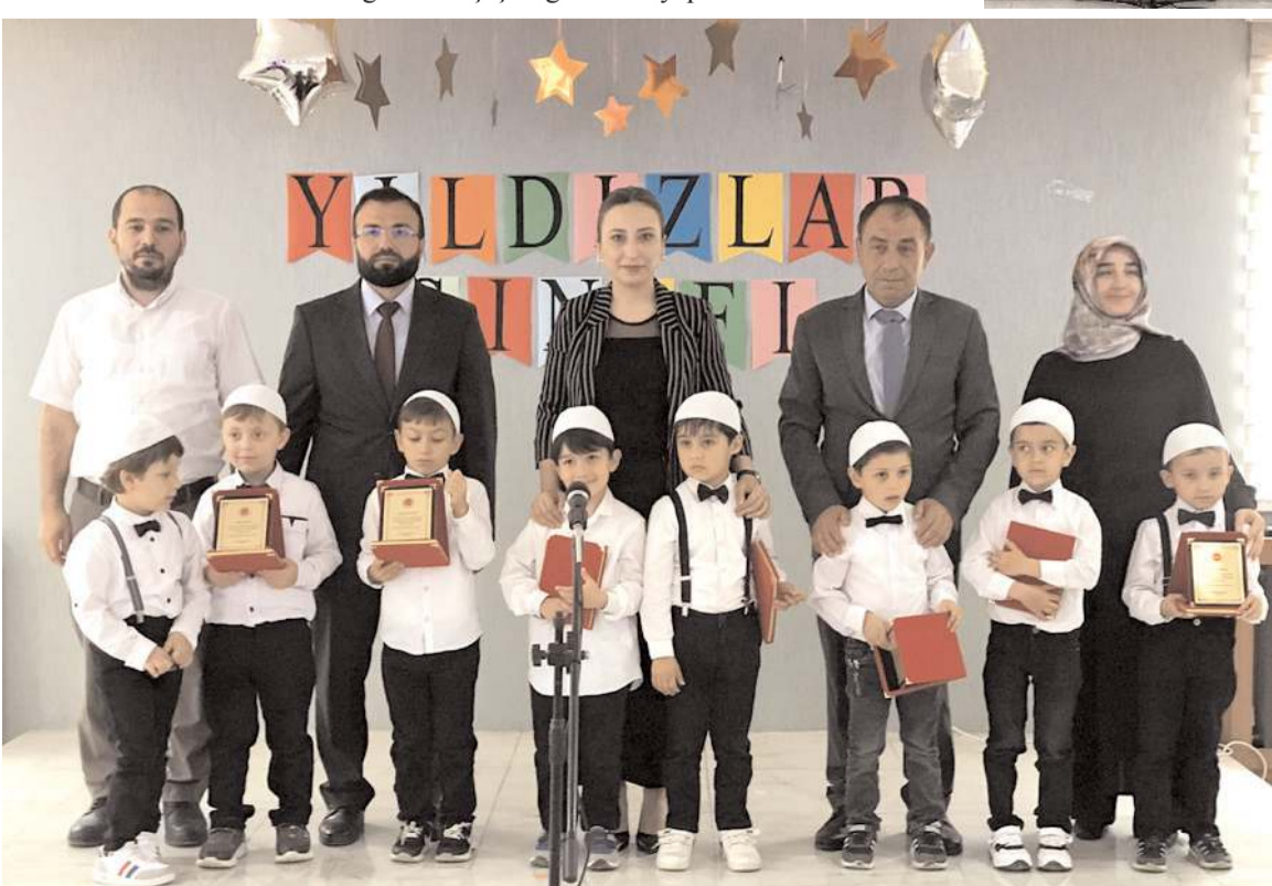
Kursu başarıyla tamamlayarak Kur'an okumayı öğrenen öğrencilere plaket ve hediye verildi.