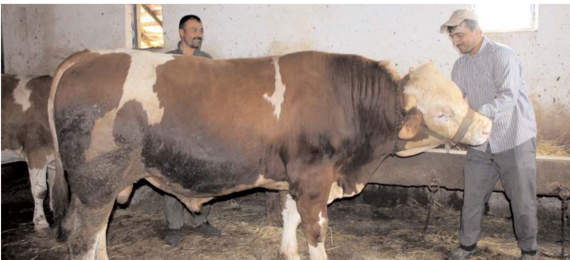
Paşa Kurban Bayramı öncesinde satılacağı günü bekliyor.