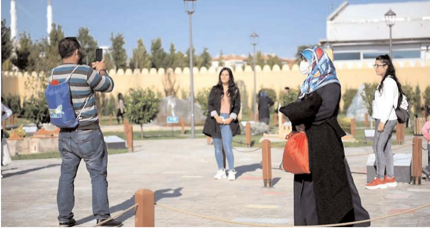
Çorumina'yı açıldığı günden bu yana 50 bin kişi ziyaret etti.

Çorum Belediyesi tarafından yaklaşık 2 yıl önce hayata geçirilen Çorumina, şehrin tanıtımına önemli katkılar sağlıyor. Çorumina'yı açıldığı günden bu yana 50 bin kişi ziyaret etti.