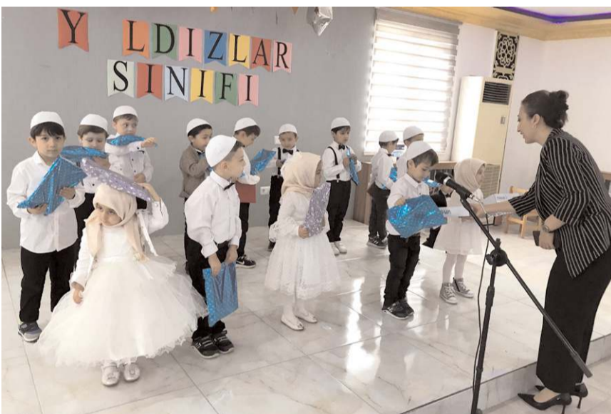
4-6 yaş grubu öğrencilerin kursu tamamlandı.