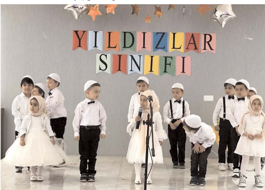
Etkinlikte öğrenciler çeşitli gösteriler yaptı.

Laçın'da Kur'an okumayı öğrenen 4-6 yaş grubu öğrenciler, plaket ve hediyelerle ödüllendirildi.