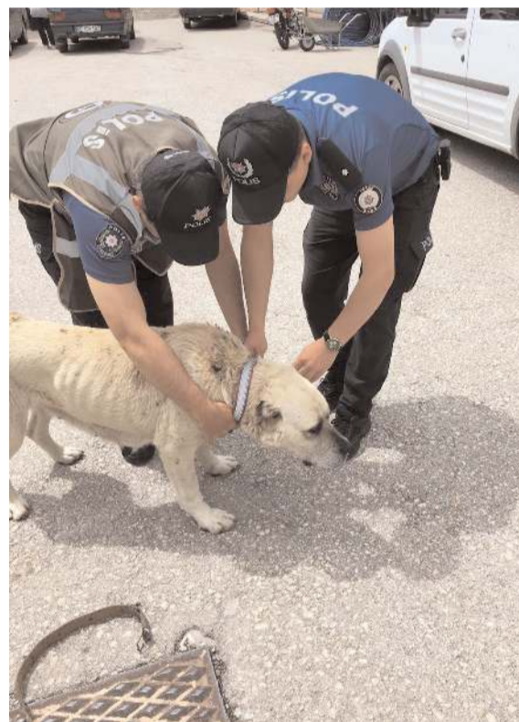
Sokak hayvanlarının trafik kazalarına neden olmaması için reflektörlü tasma takılıyor.