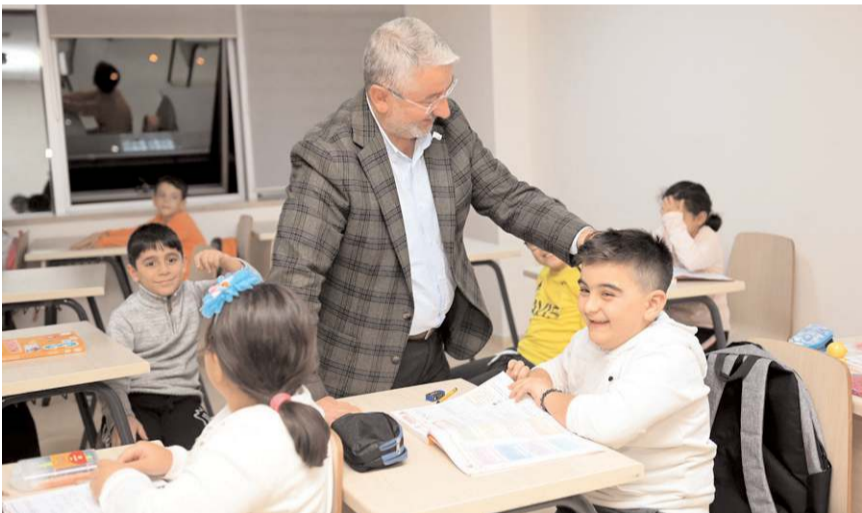
Yaz kurslarına kayıtlar 19 Haziran'da başlıyor.

Yaz kurslarına kayıt yaptırmak isteyen öğrenciler Buhara Kültür Merkezi, NFK Gençlik Merkezi, Mi-