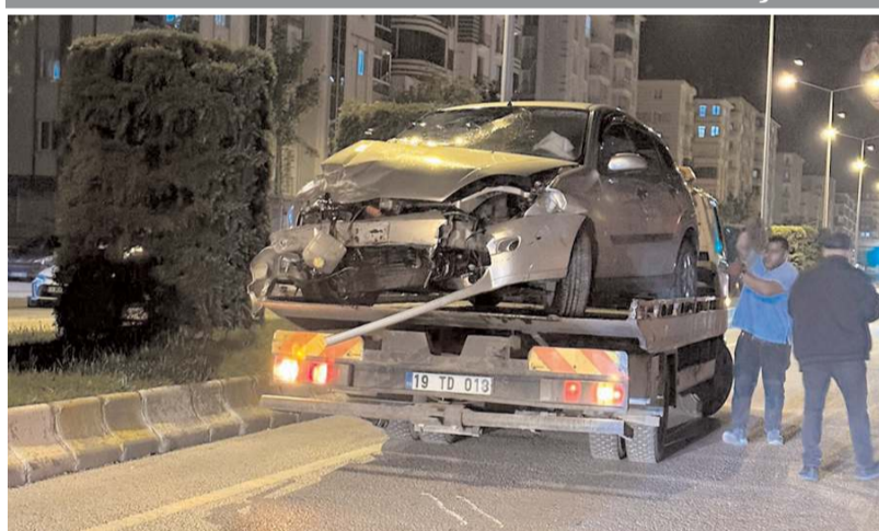
Araçlar çekiciler tarafından olay yerinden kaldırıldı.