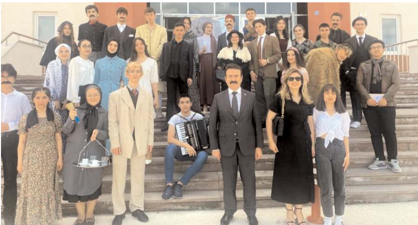
Öğrenciler 16 farklı roman, 27 roman kahramanı ile kitapseverlerin beğenisine sundular.

Mimar Sinan Anadolu Lisesi öğrencileri, Roman Kahramanları Festivali düzenledi.