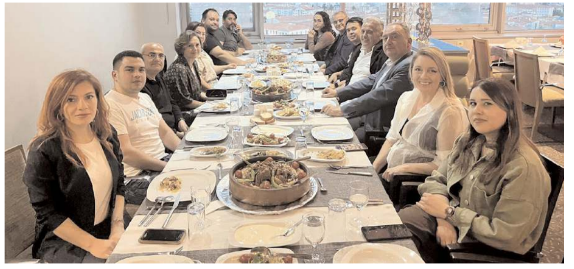
Tur operatörleri Çorum'un lezzetlerini tattılar.

Soru kökünü okuyun. Sonra paragrafı okuyun ve cevaplayın. Altı çizili ve koyu ifadelere dikkat edin. Zaman kaybı ve kaydırma riskine karşı önce soru kitapçığını hemen ardından cevap kağıdını işaretleyin. Sonuç olarak şunu söylemek isterim ki; sevgili gençler, sınavlar sizin yaşam ve değerlerinizi belirleyeceklerdir. Hepiniz çok değerlisiniz. Bunu belirleyecek tek kişi sizsiniz. Hepinize başarılar diliyorum" dedi. (Haber Merkezi)