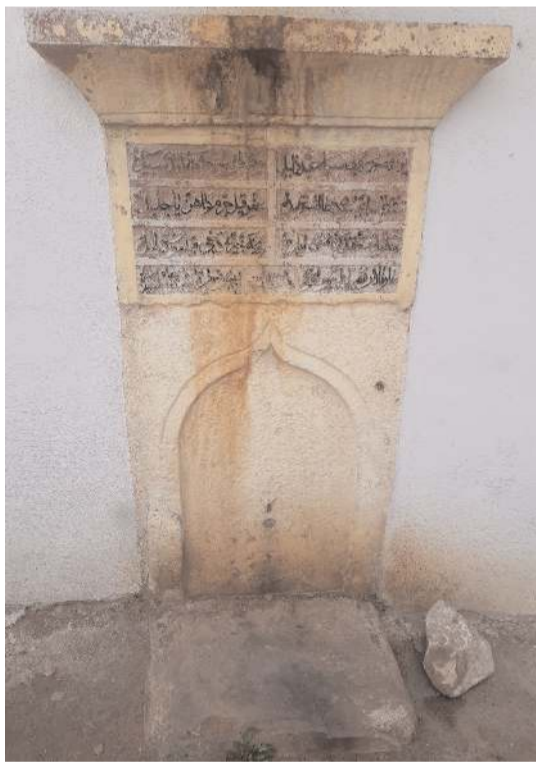
Her iki tarihi çeşmede restore edilmeyi bekliyor.