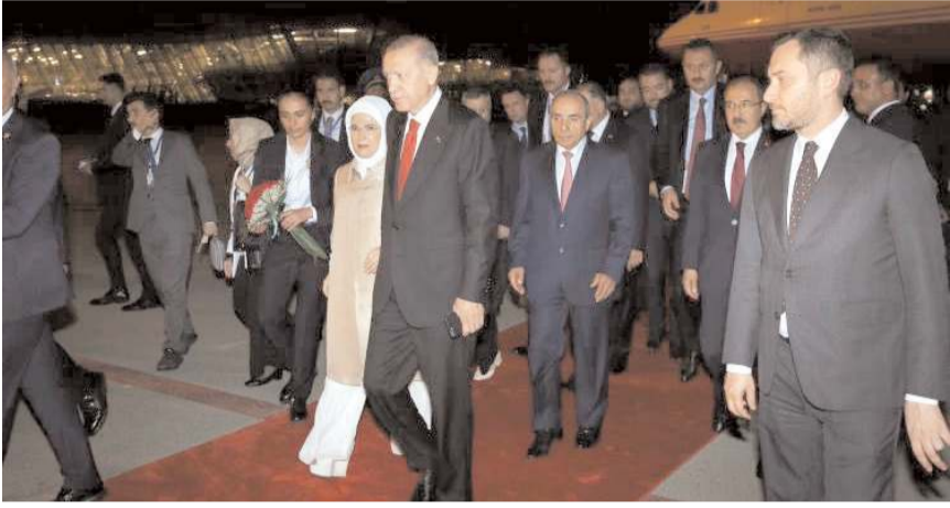
Cumhurbaşkanı Erdoğan'a Azerbaycan ziyaretinde bakanlarda eşlik ediyor.

Cumhurbaşkanı Recep Tayyip Erdoğan, Cumhurbaşkanı Erdoğan, Cumhurbaşkanı seçilmesinin yurt dışı ziyaretleri kapsamında Azerbaycan'a gitti.