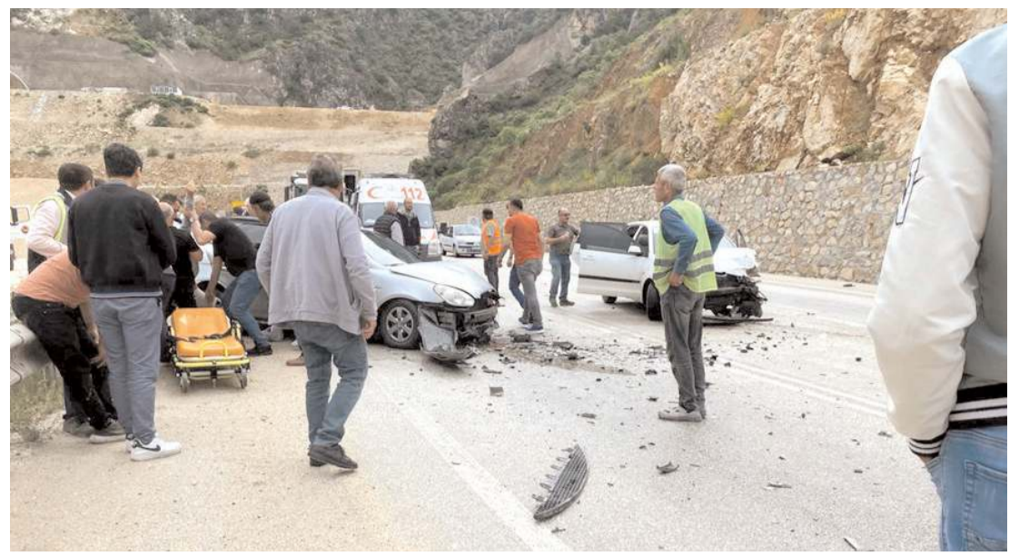
Yaralılara ilk müdahale olay yerinde 112 acil sağlık ekipleri tarafından yapıldı.

Jandarma ekipleri, darp ve bıçakla yaralama olayını gerçekleştiren şüphelilerin yakalanması için çalışma başlattı.(AA)