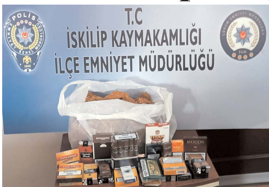
Operasyonda 3 kilo satışı yasak kıyılmış tütün ile çok miktarda gümrük kaçağı sigara ele geçirildi.

İskilip'te bir iş yerinde gümrük kaçağı sigara ve tütün ele geçirildi.