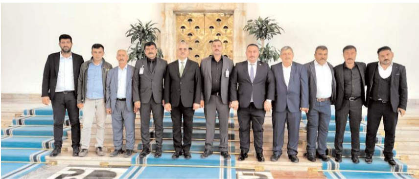
Çorum merkez köy muhtarları Milletvekili Yusuf Ahlatcı'ya hayırlı olsun dileklerini ilettiler.