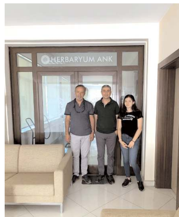
Ekibe Bilkent Üniversitesi UNAM, Hitit Üniversitesi Tıp Fakültesi ile Özel Elitpark Hastanesi de destek oldu.