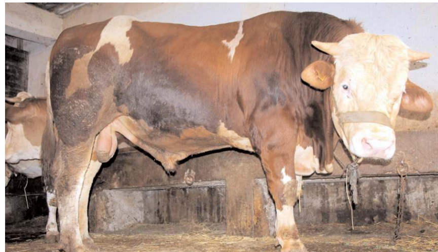
Paşa, 125 bin liraya alıcısını bekliyor.