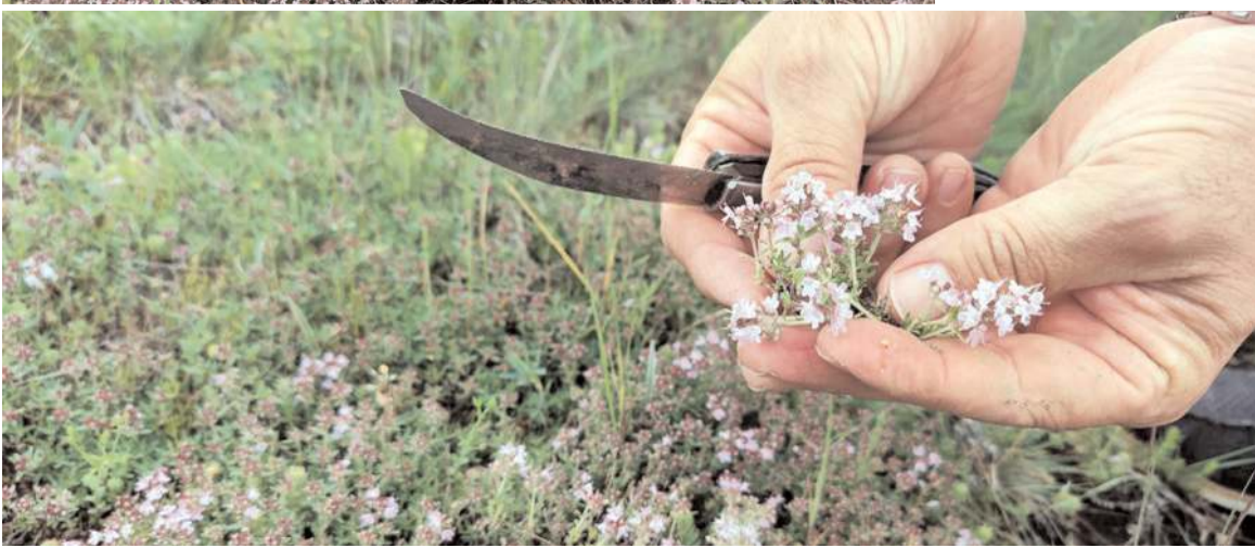
Kurutulan kekik çiçeği, pazarlarda satışa sunuluyor.

Oğuzlar'da vatandaşların kekik çiçeği toplama çalışmaları başladı.