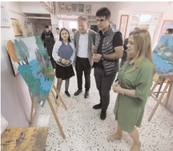
Öğrenciler ikinci resim sergisini ise okullarında açtılar.