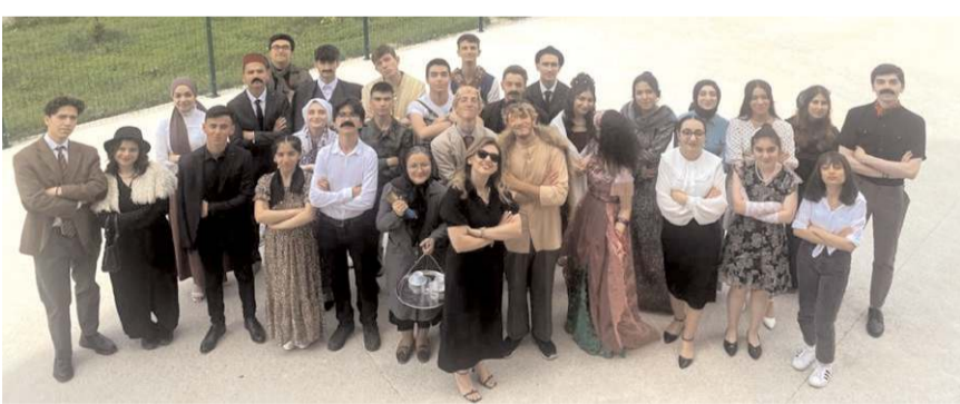
Festivali Mimar Sinan Anadolu Lisesi öğrencileri düzenledi.