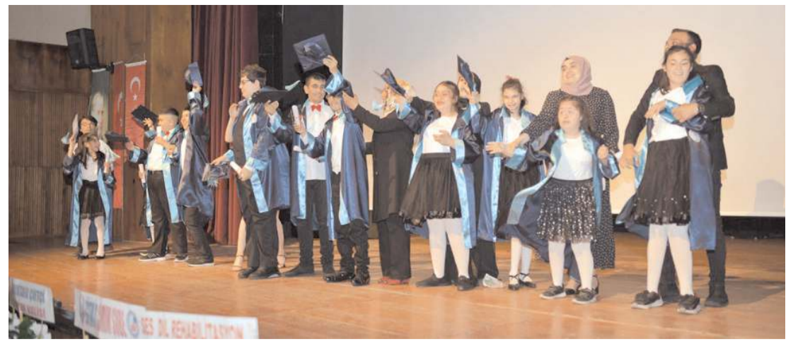
Program diplomaların verilmesi ve kep giyme töreni ile sona erdi.

Sokak hayvanlarıyla ilgili en önemli sorunlardan biri de düzensiz besleme konusudur. Hayvanserverler tarafından yol kenarlarına, refüjlere bırakılan yiyecekler sokak hayvanlarını sürü olarak yaşamaya zorlamakta, bu durum da zaman zaman hemşehrilerimiz arasında sorun oluşturmaktadır. Besleme yapan vatandaşlarımızın daha dikkatli olmalarını, besleme yaptıkları alanları insan yoğunluğunun daha az olduğu yerlerde seçmelerini ya da Belediyemiz görevlileri ile birlikte hareket etmelerini önem arz etmektedir" (Haber Merkezi)