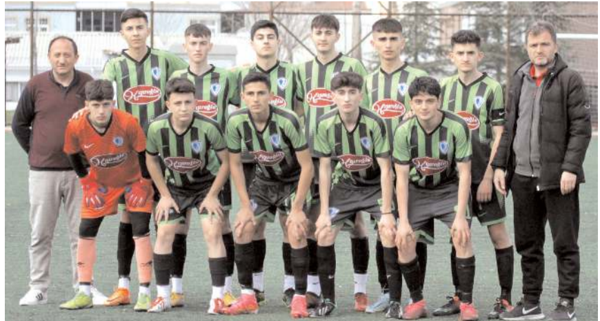
Mimar Sinan U 17 takımı Samsun grubunda yarı final için mücadele edecek