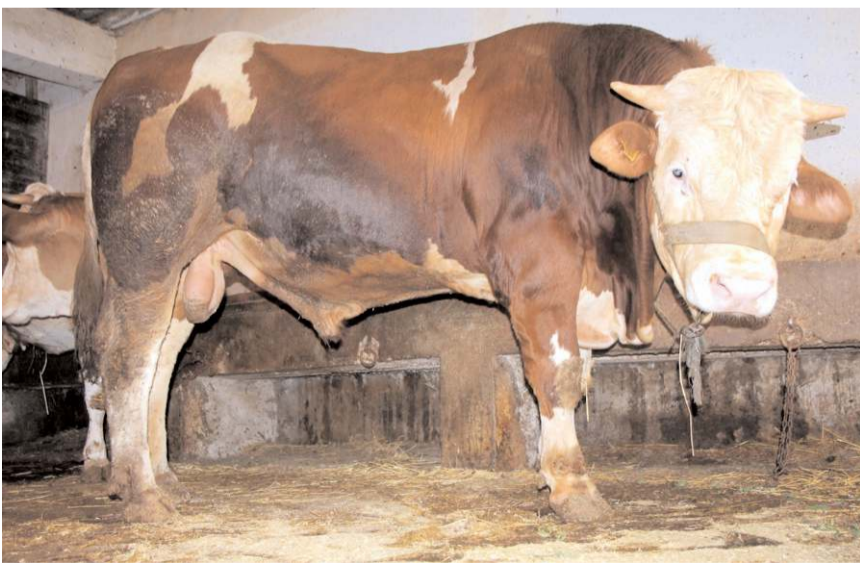
Paşa, 125 bin liraya alıcısını bekliyor.

Küçüklüğünden itibaren Paşa'nın kendisinde olduğunu söyleyen Emrah Bezeniroğlu, "Şu anda Paşa 2,5 yaşında. Boğamız 1 tona yakın. Akşam sabah ben bunun hizmetini yapıyorum. Benimle durmadan oyun oynamak istiyor. Şimdi alıcısına hayırlı olsun diyorum. İnşallah hayırlı yerlere gider. Çok üzülüyorum ama yapacak bir şey yok. Ayrılığın vakti geldi" diye konuştu. (İHA)