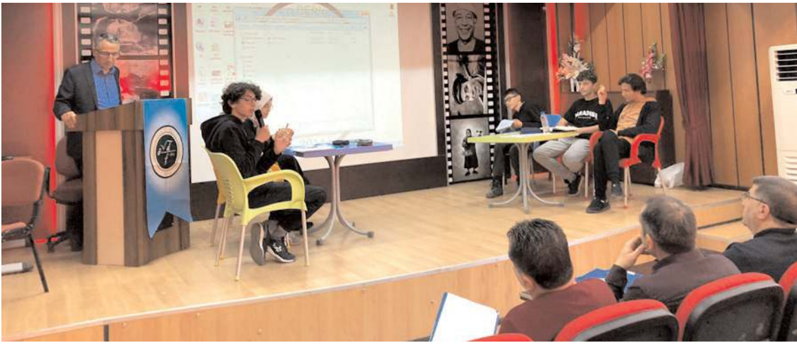
Öğrenciler üçerli guruplar halinde görüşlerini savundular.