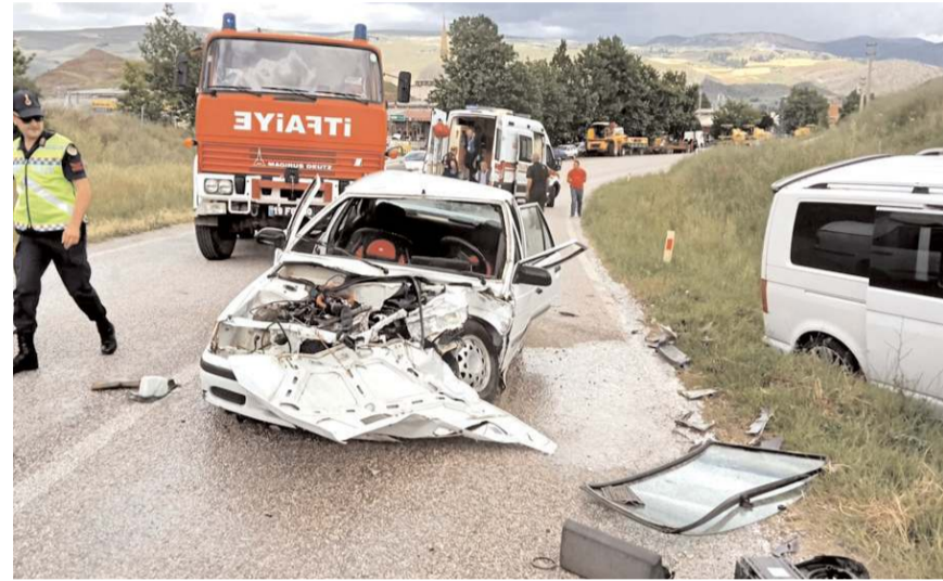
Kaza nedeniyle trafik bir süre durdu.

Kazayla ilgili başlatılan soruşturma sürdüğü bildirildi.