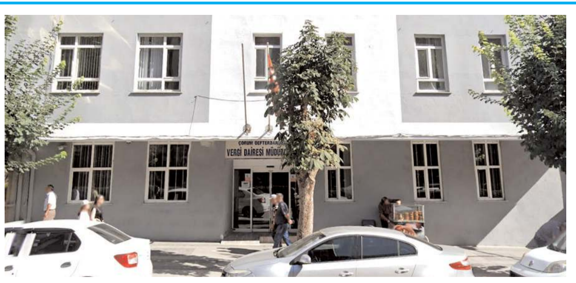
Vergi Dairesi'nin depreme dayanıklılık testi yapıldı.