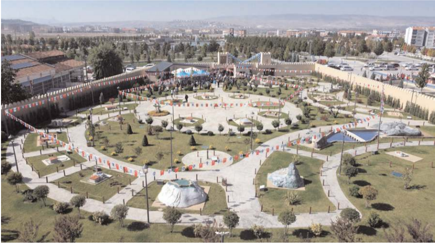
Çorumina, 2 yıl önce faaliyete başladı.