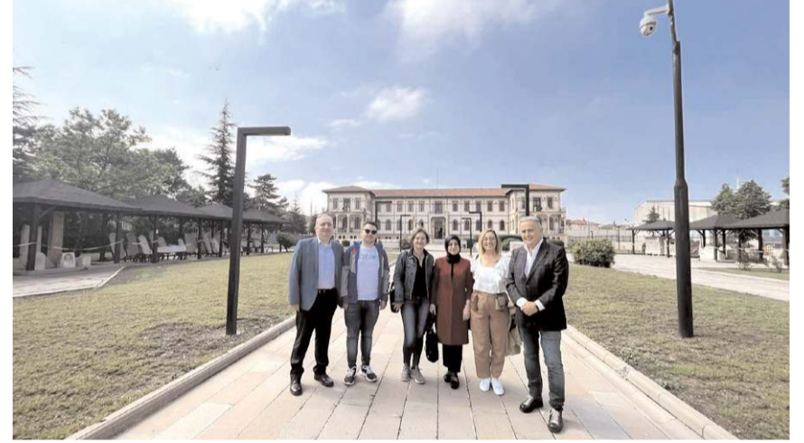
Tur operatörleri Çorum'un tarihi ve turistik yerlerini gezdiler.