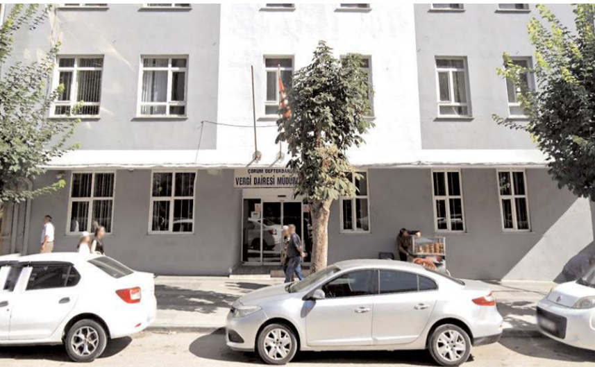
Vergi Dairesi'nin depreme dayanıklılık testi yapıldı.