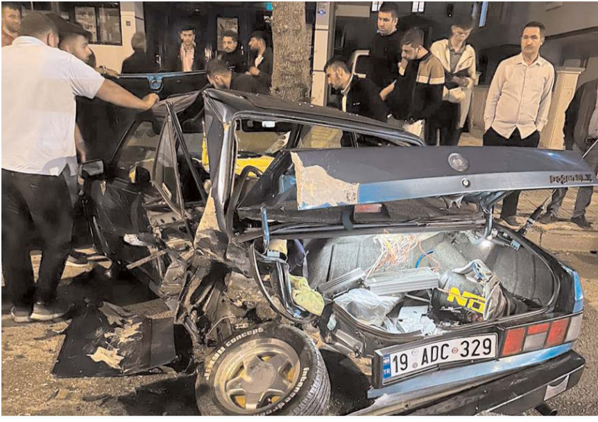
Olayda çok sayıda araçta maddi hasar meydana geldi.

■ Osmancık Caddesi'nde meydana gelen trafik kazasında hızını alamayan otomobil, park halindeki araçlara çarparak durabildi. Kaza sonrası cadde savaş alanına döndü.