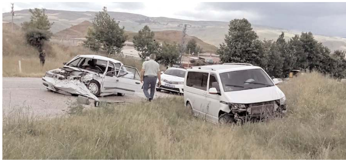
Kaza, İskilip-Çorum karayolunda meydana geldi.