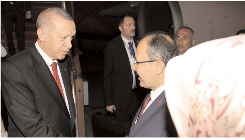
Cumhurbaşkanı Recep Tayyip Erdoğan'ı Türkiye'nin Bakü Büyükelçisi hemşehrimiz Cahit Bağcı karşıladı.