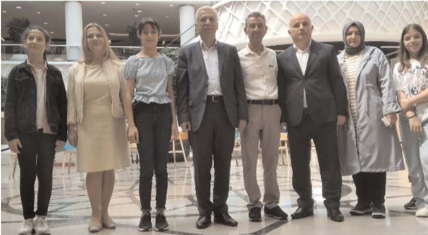
Serginin açılışını Vali Yardımcısı Erdoğan Kanyılmaz yaptı.