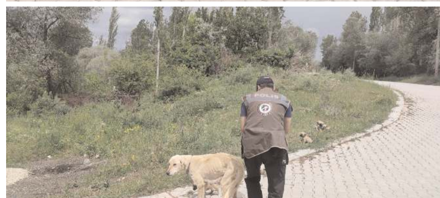
Yaklaşık 50 sahipsiz sokak hayvanına reflektörlü tasma takıldı.