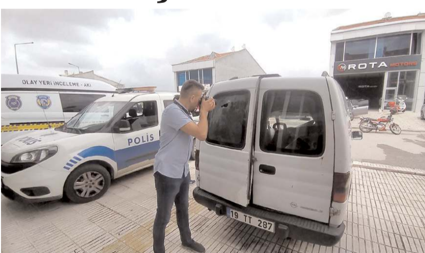
Polis araçta inceleme yaptı.

Çorum'da park halindeki hafif ticari araca kurşun isabet etti. Polis ekipleri olayla ilgili inceleme başlattı.