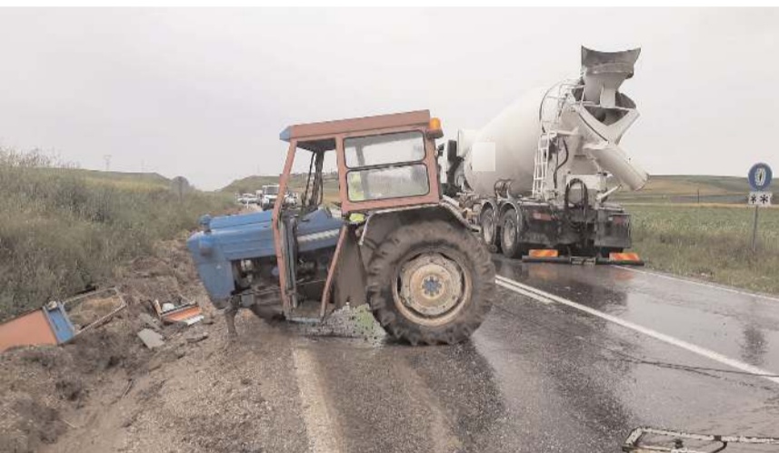
Kaza Ortaköy yolunda meydana geldi.

Kaza nedeni ile kapanan yolda kurtarma çalışmaları sonrası trafik normale döndü.(AA)