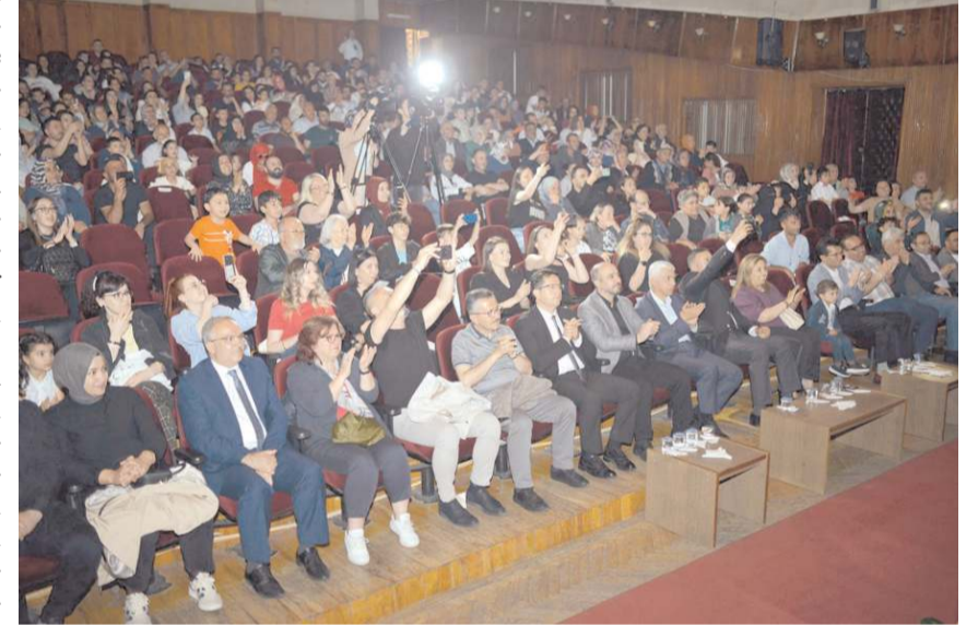
Programa çok sayıda davetli katıldı.