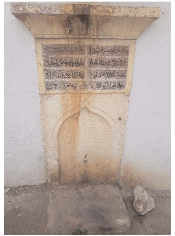
Her iki tarihi çeşmede restore edilmeyi bekliyor.