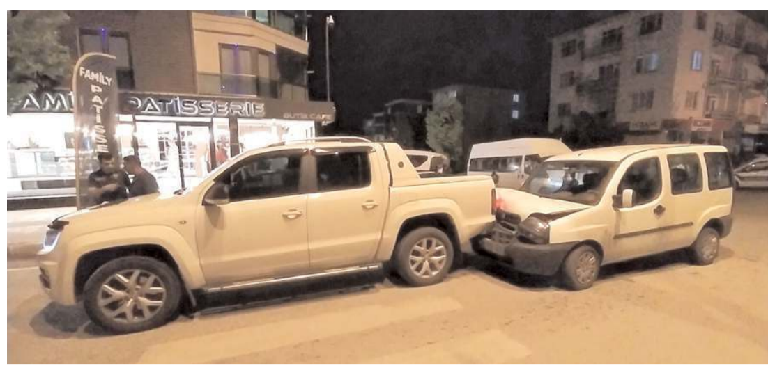
Kaza, Bahabey Caddesi'nde meydana geldi.