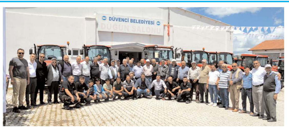
Topaktaş Kardeşler Case Bayii, Bakım Günü etkinliğini Düvenciler'de yaptı.

50 çiftçinin traktörüne ücretsiz bakım yaptılar