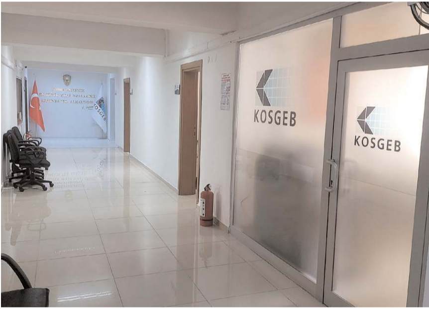
KOBİGEL Programı'na başvuran 56 işletmeden 52'si destek almaya hak kazandı.