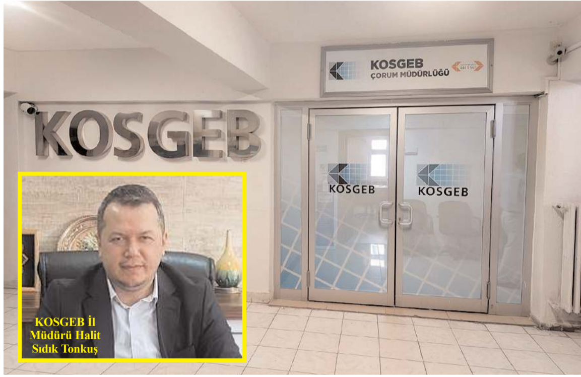
KOSGEB İl Müdürlüğü, Gazi Caddesi'nde Valilik ek binaya taşındı.