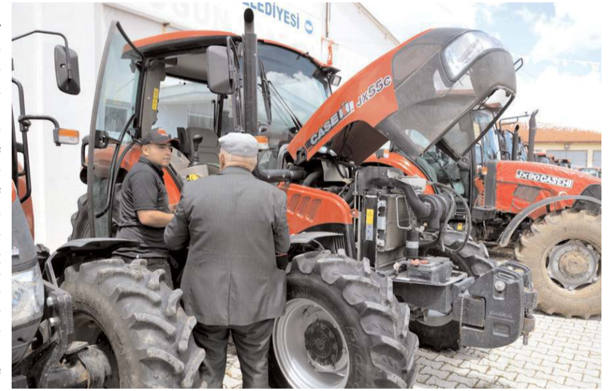
Firma yetkilileri etkinlik hakkında açıklamada bulundular.