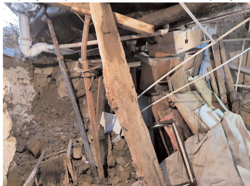
1 aydır yağın yağmurlara dayanamayan duvar çöktü.