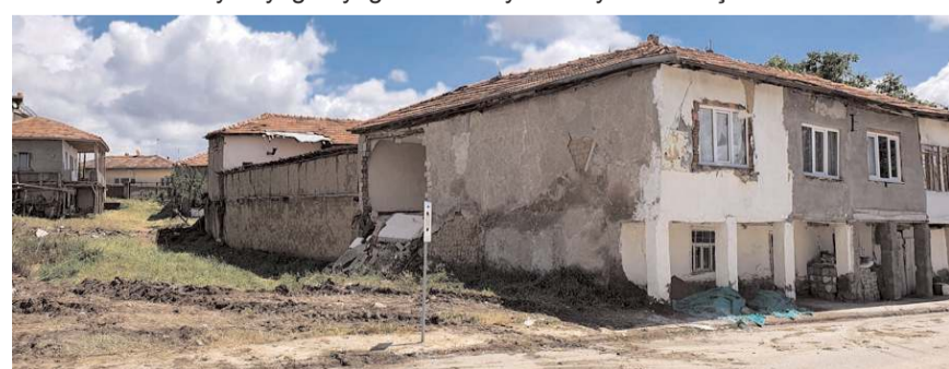
Maddi durumu iyi olmayan aile yardım bekliyor.

Sungurlu'da etkili olan sağanak yağış sebebiyle iki katlı evin duvarı çöktü. Ölen ya da yaralanmadığı olayda evde yaşayan 4 kişilik aile kendilerini dışarı atarak kurtuldu.