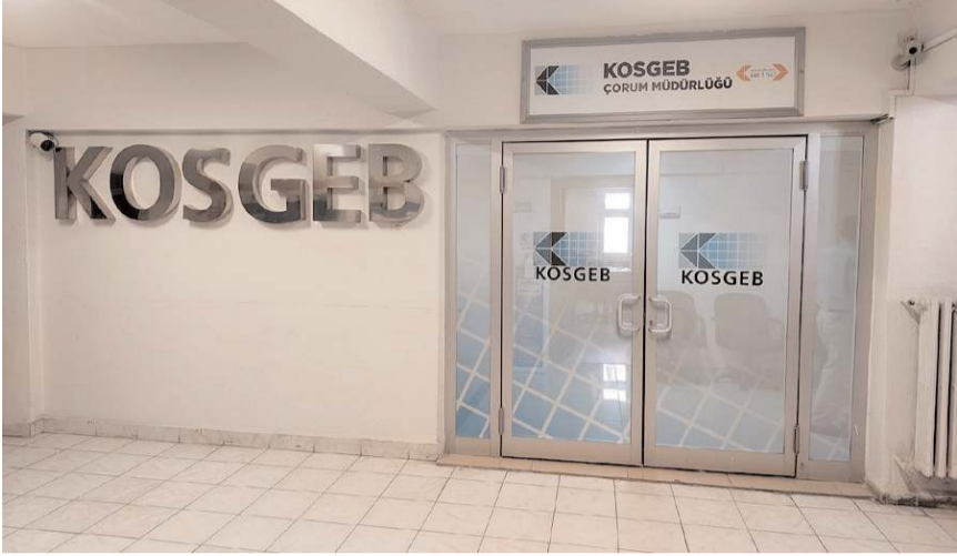
KOSGEB İl Müdürlüğü, Gazi Caddesi'nde Valilik ek binaya taşındı.