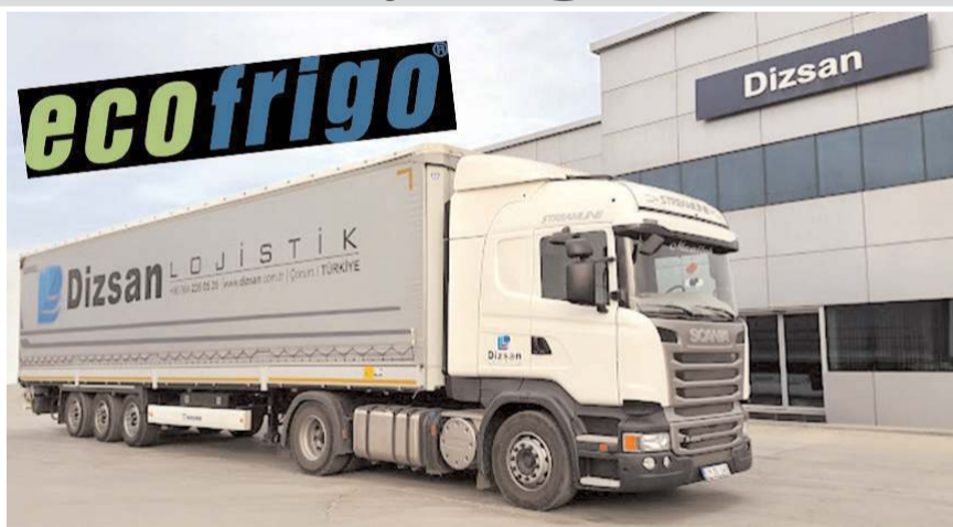
Eco Frigo Yetkili Bayi Dizsan Otomotiv yarın açılacak.

Güçlü dünya markalarını yanına alan ve firmalarının Ankara'dan Doğu Karadeniz'e kadar tüm hinterland içerisinde Scania servisindeki güçlü yanını treyler ve alt yapı ile daha da güçlendiren Dizsan Otomotiv, dünya standartlarına uygun frigorifik, insüle kamyon ve