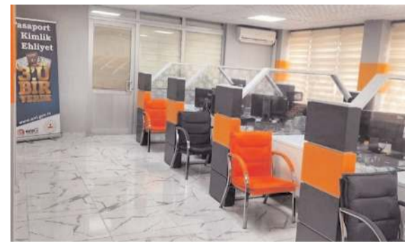
Yüksek Öğretim Kurumları Sınavı nedeniyle İl Nüfus ve Vatandaşlık Müdürlüğü hafta sonu belirlenen saatlerde açık olacak.