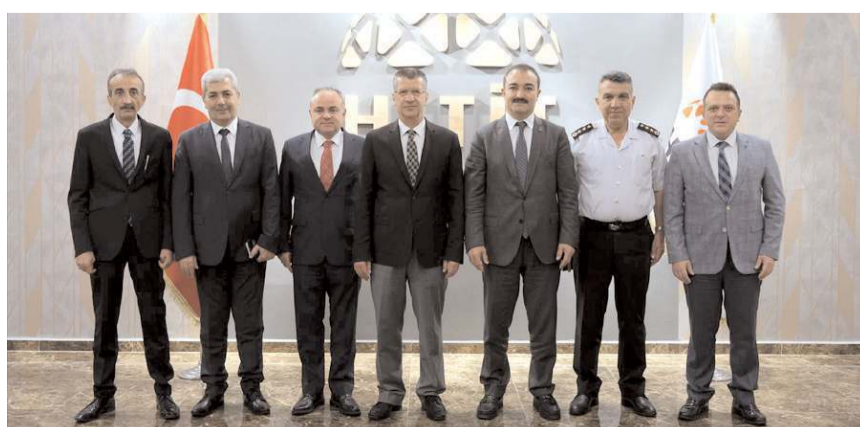
Toplantıda sınav ile ilgili alınacak tedbirler istişare edildi.

İl Sınav Koordinasyon Kurulu, haftasonu yapılacak olan Yükseköğretim Kurumları Sınavı (YKS) gündemiyle toplandı.