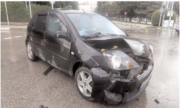
Kazada her iki araçta da maddi hasar meydana geldi.

Kaza ile ilgili başlatılan soruşturma sürüyor (İHA)