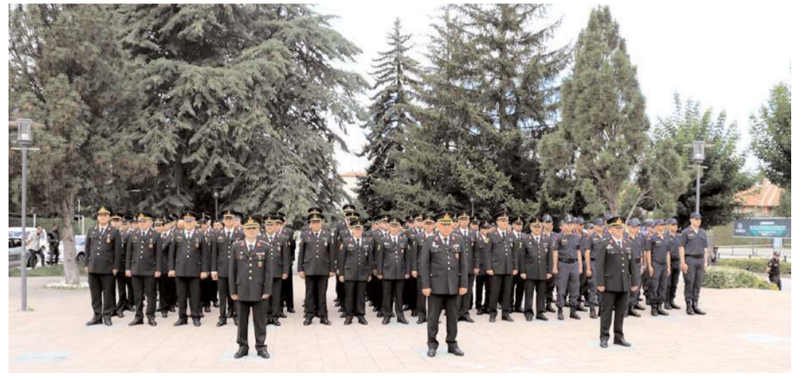
Jandarma Teşkilatının 184. kuruluş yıldönümü nedeniyle Atatürk Anıtı'nda tören yapıldı.

35 kişiden oluşan komisyon üyeleri parlamentonun denetim yetkisi çerçevesinde, kamu kaynağı kullanan kuruluşlardan olan 100'den fazla kurumu Sayıştay raporları doğrultusunda denetleyecek. (Haber Merkezi)