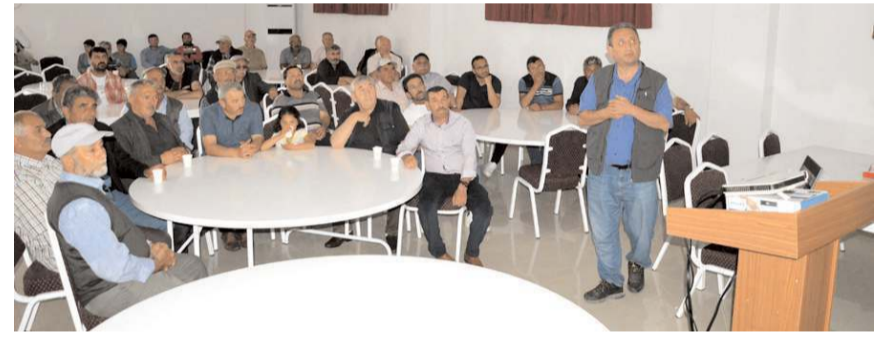
Topaktaş Kardeşler Case Bayii olarak yaklaşık 55 yıldır Çorum ve bölge çiftçisine traktör satış ve satış sonrası hizmet veriyor.