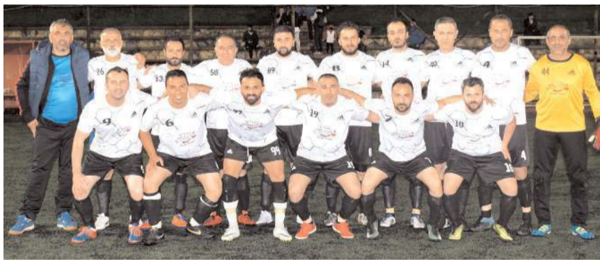
Radyo Double üçüncü maçını kazanarak çeyrek final için avantaj yakalamak istiyor

layacak günün ikinci maçında ise Siyah grupta üçüncü haftanın ilk maçında Radyo Double takımı ile Doğa Gıda takımları karşılaşacak.