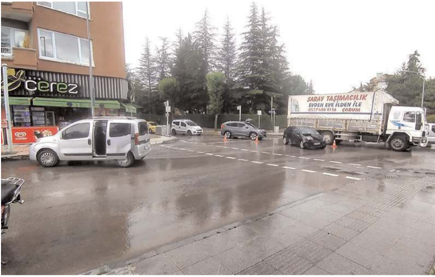
Kaza, Çamlık Caddesi'nde meydana geldi.

Çorum'da otomobil ile hafif ticari aracın çarpışması sonucu meydana gelen kazada 1 kişi yaralandı. Kaza, Çamlık Caddesi'nde meydana geldi. Edinilen bilgiye göre, Arap Can İ. yönetimindeki 19 ACN 075 plakalı otomobil, cadde üzerinde seyir halinde olan Ozan D. idaresindeki 06 FK 7986 plakalı hafif ticari araçla çarpıştı. Kazada hafif ticari araçta bulunan Emircan Ç. yaralandı. Yaralı sağlık ekiplerinin olay yerinde yaptığı ilk müdahalenin ardından kentteki özel bir hastaneye kaldırılarak tedavi altına alındı.