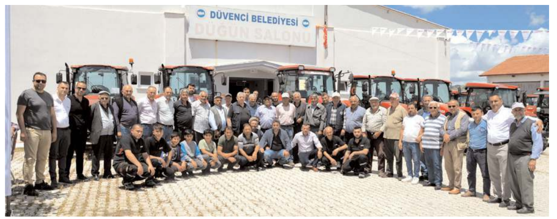
Topaktaş Kardeşler Case Bayii, Bakım Günü etkinliğini Düvenci'de yaptı.