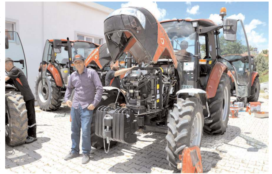
Etkinliğe Düvenci ve çevre köylerden gelen çiftçiler katıldı.

Düvenci Düğün Salonu önünde düzenlenen etkinlik kapsamında etkinliğe katılan çiftçilerin traktörlerini ücretsiz olarak bakımdan geçirdiklerini ifade eden Topaktaş; "Topaktaş ile hayalinizdeki Case IH traktörlerine kolaylıkla sahip olabilir, aracınızın bakım ve onarımlarını mümkün olan en kısa sürede güvenle yaptırabilirsiniz. Tarla ve bahçelerinizde en büyük destekçiniz olacak Case IH traktörlerini alırken, TürkTraktör Finans ayrıcalıkları ile ödeme koşullarınızı kendinize göre belirleyerek ihtiyacınızı kolaylıkla giderebilirsiniz. Topaktaş, her adımda mükemmel hedefleyen hizmet felsefesi, çözüm ve müşteri odaklı kurum kültürüyle çiftçimizin en büyük destekçisi olmaya ve her zaman en iyi hizmeti sunmaya devam edecektir." dedi