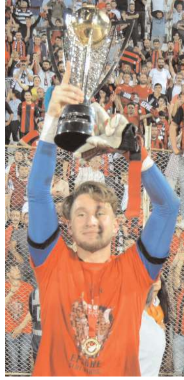
2018-19 sezonunda Çorum FK şampiyonluk kupası ile