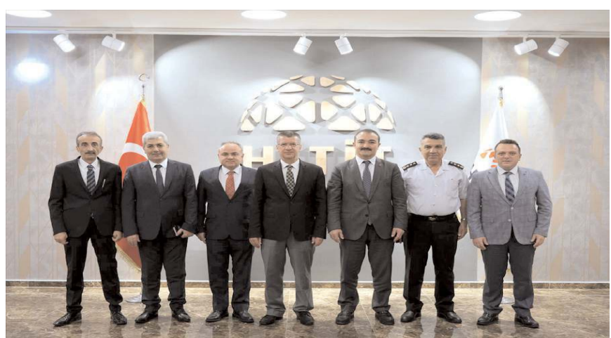
Toplantıda sınav ile ilgili alınacak tedbirler istişare edildi.