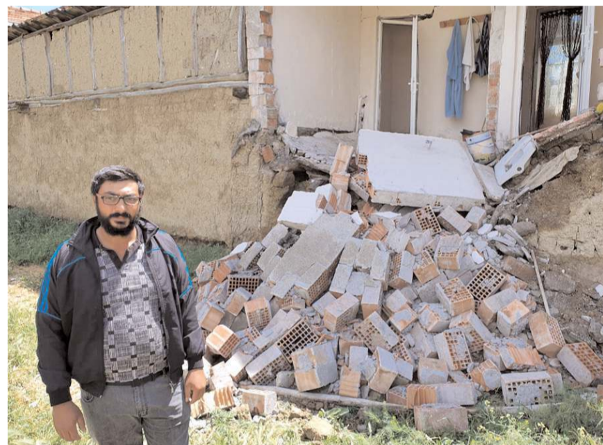
Olay Sungurlu Gürpınar Mahallesi İlhan Sartaltun Caddesi'nde meydana geldi.