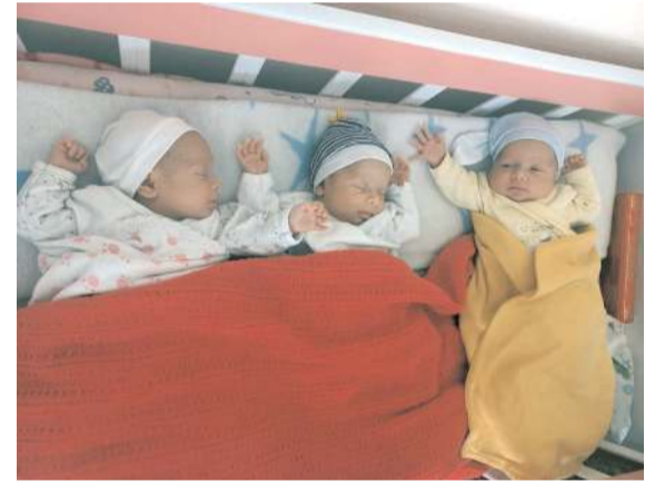
Üçüz bebekleri olan aile yardım bekliyor.