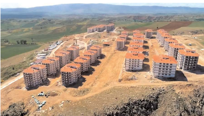
TOKİ Silmkent projesinde sona yaklaşıyor

Kıracı olanlar evsahipleri ile sorunlar yaşıyor. Bizler biran önce dairelerimizin teslim edilmesini istiyoruz" diyerek taleplerini dile getirdiler.