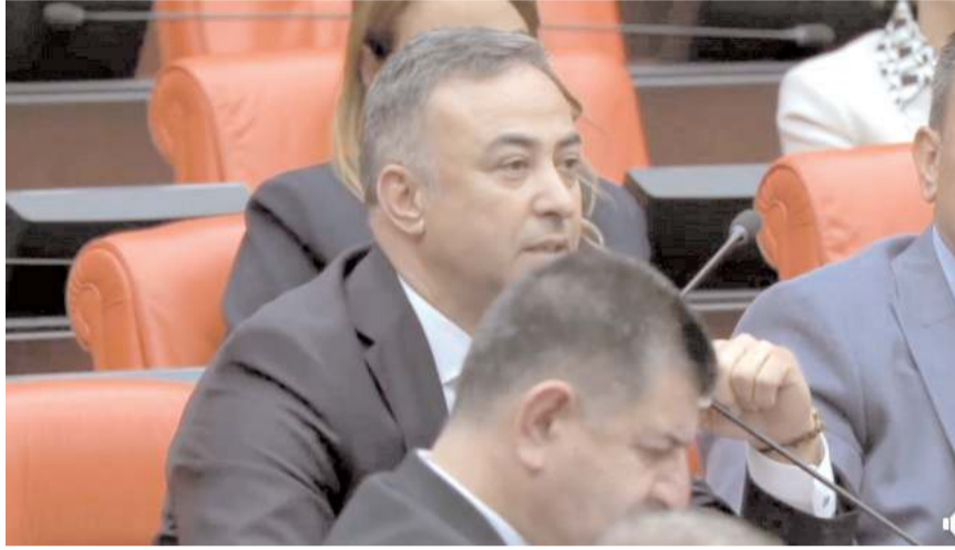
CHP Çorum Milletvekili Mehmet Tahtasız, Mecliste konuşma yaptı.

Ayrıca eski Devlet Hastanesi'nin bir kısmı yıkıldı fakat ihalesi bir türlü yapılamadı. İhalenin de ne zaman yapılacağı ile ilgili soru önergesi verdik. Çorum'un Hititlerin başkenti olması sebebiyle Hitit Barajı'mız var. Barajımız DSİ tarafından yapıldı. 13 milyon lira para harcadı fakat bir türlü işletmeye açılmadığından dolayı çürüyor. Bunu da soru önergesi olarak verdik."