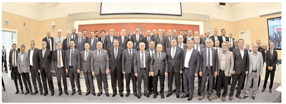
Türkiye Ürün İhtisas Borsası A.Ş.'nin 2022 Faaliyet Yılı Olağan Genel Kurul Toplantısı yapıldı.