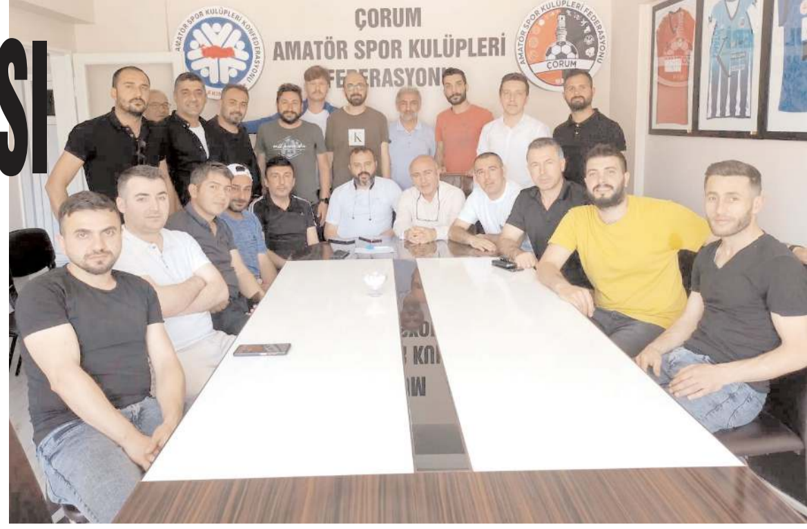
Dün yapılan Olağanüstü toplantıya katılanlar değerlendirme sonunda toplu halde görüşüyor

lantı sonunda turnuvaya dört gün ara verildi.