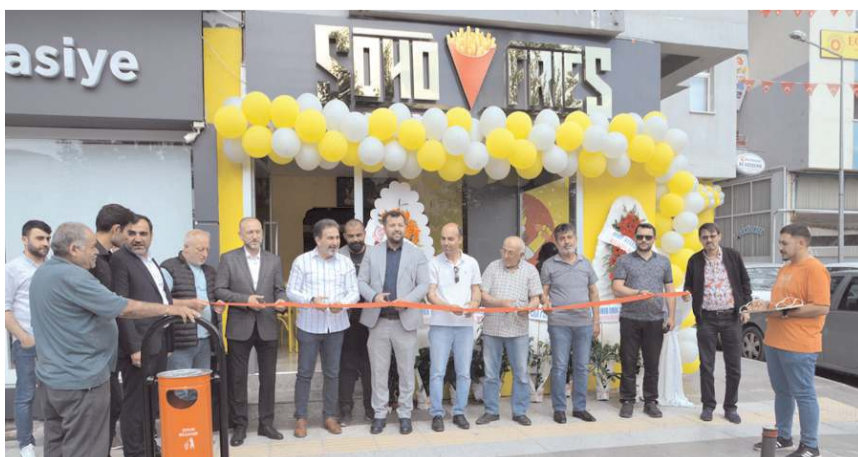
Yapılan duanın ardından açılış kurdelesini kesildi.