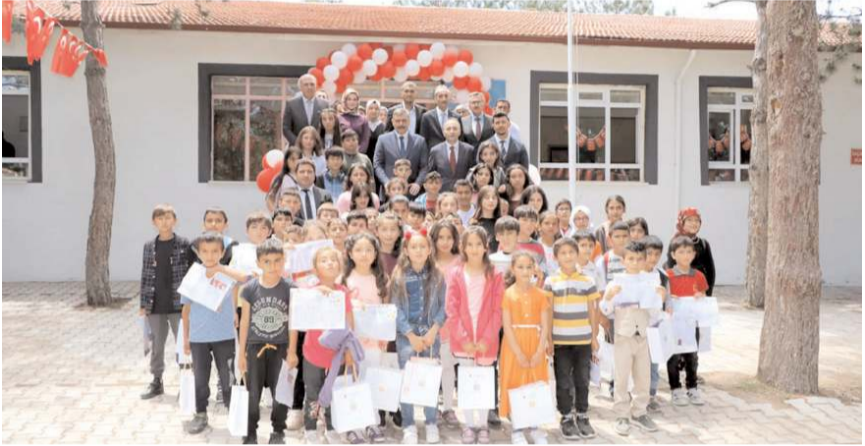
Protokol üyeleri ile öğrenciler hatıra fotoğrafı çektiler.