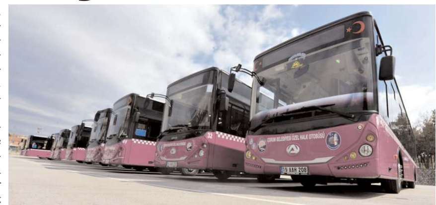
YKS'ye girecek üniversite adayları halk otobüslerinden ücretsiz yararlanacak.