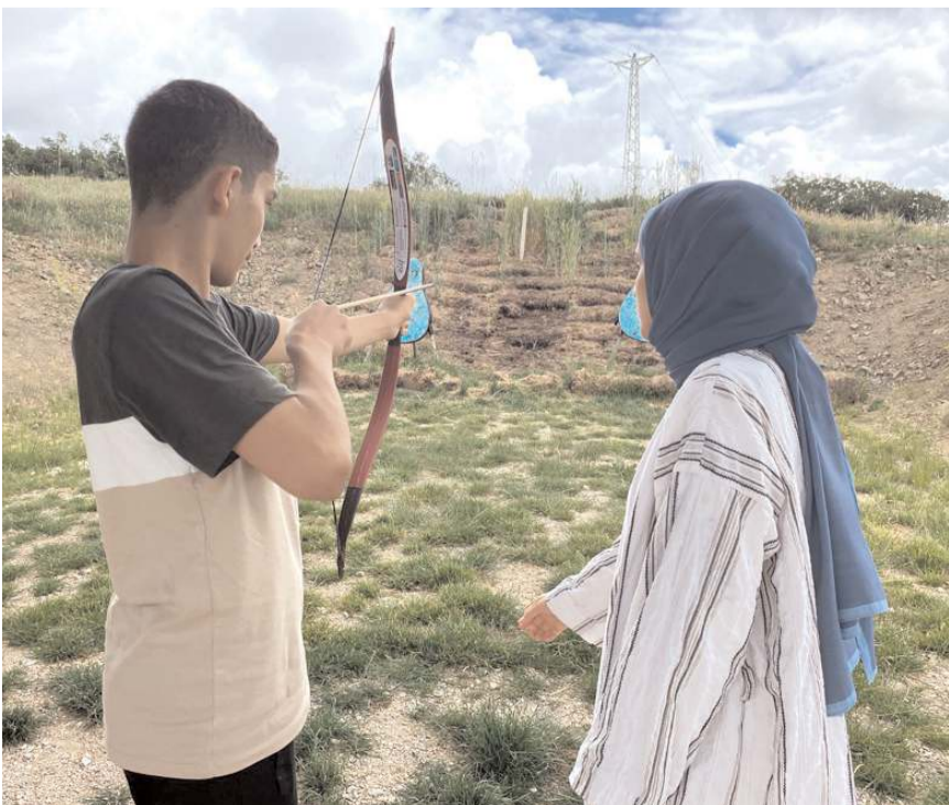
Öğrenciler Çorumlu Obasında ok atmayı öğrendi.