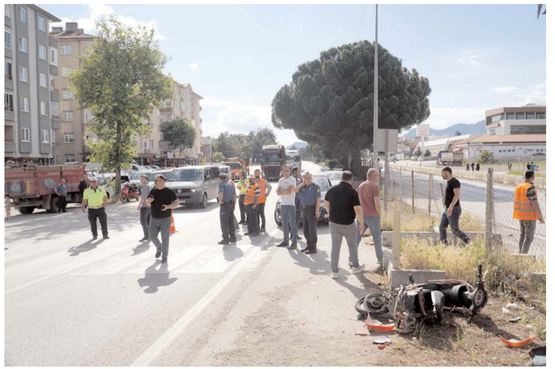
Kaza D100 kara yolu Danişment Caddesi'nde meydana geldi.

sı, sazangiller için kişi başı 5 olan olta sayısını aşmaması, 5/2 numaralı amatör tebliğde belirtilen boy ve sayı limitlerine riayet etmesi ve amatör balıkçılık faaliyetleri esnasında çevreye saygılı olmaları, ilimiz ve ülkemiz kaynaklarının sağlıklı bir şekilde gelecek neslimize aktarılabilmesi için elzemdir. Bununla birlikte 16 Haziran itibarıyla Müdürlüğümüz su ürünleri kontrol görevlilerince göl, gölet ve akarsularda gerçekleştirilecek kontrol ve denetimlerle, mevzuata aykırı su ürünleri avcılığı yaptığı tespit edilen balıkçılara yasal işlem uygulanacaktır."(AA)