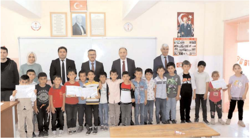
Resmi karne töreni İnalözü İlkokulu ve Ortaokulunda yapıldı.

Kodek, "Bu duygu ve düşüncelerle başta ülkemizi yasa boğan Kahramanmaraş merkezli depremlerde ve çeşitli sebeplerden dolayı kaybettiğimiz öğretmenlerimizi ve öğrencilerimizi rahmetle anıyor, bu dönem emekli olan öğretmenlerimizde de emeklilik hayatlarında sağlık ve huzur dolu bir yaşam diliyorum. Öğretmenlerimizin, yöneticilerimizin ve öğrencilerimizin iyi bir tatil geçirmesini canı gönülden temenni ediyorum." (Haber Merkezi)