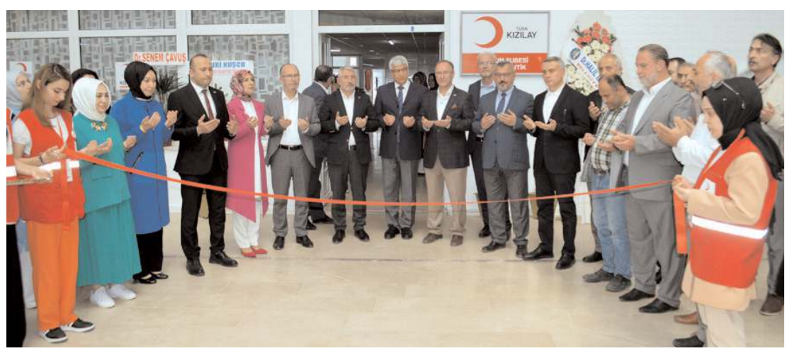
Yapılan duanın ardından açılış kurdelesi kesildi.