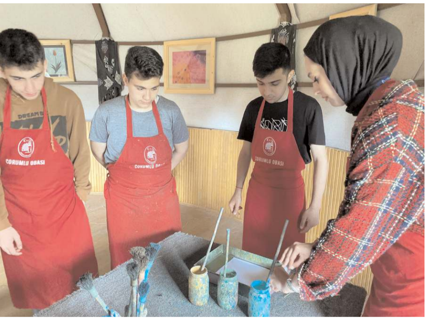
Öğrenciler merkezde çeşitli etkinliklere katıldılar.

İstanbul Hakkı Demir Anadolu İmam Hatip Lisesi öğrencileri de Çorumlu Obası'nın doğal güzellikleri ve samimi atmosferinden etkilendiklerini dile getirdi. (Haber Merkezi)