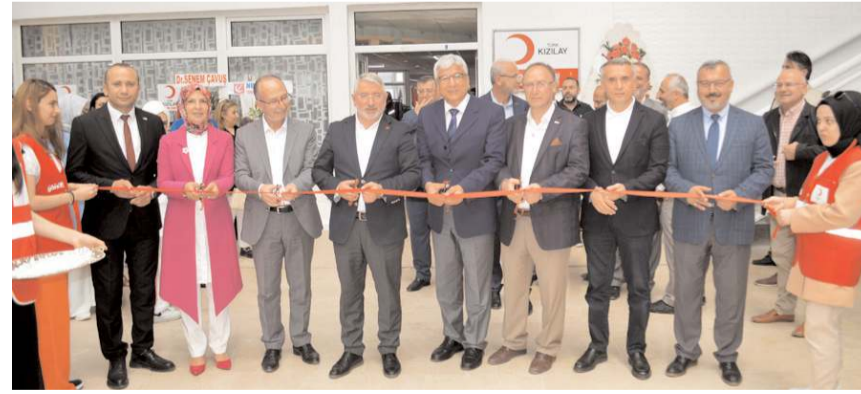
Yapılan duanın ardından açılış kurdelesini kesildi.