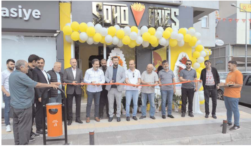
Yapılan duanın ardından açılış kurdelesi kesildi.