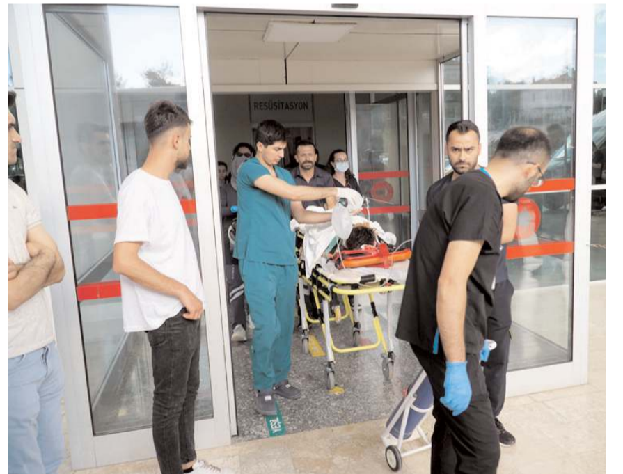
Osmancık Devlet Hastanesi'nde ilk müdahalesi yapılan yaralılardan T.A, Hitit Üniversitesi Erol Olçok Eğitim ve Araştırma Hastanesi'ne sevk edildi