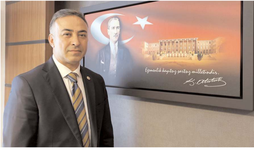
CHP Milletvekili Mehmet Tahtasız

"15-16 Haziran olayları; devlet ve sermayenin emrinde bir sendikal yaşam ve işçinin en temel silahı olan grev hakkını elinden almak isteyenlere, kısa sürede kurulup, örgütlenen ve emekçilerin gönülünü kazanan DI?SK'in 'Canına ot tıkmak' isteyenlere Türkiye işçi sınıfının verdiği en güzel yanıt olarak tarihteki yerini aldı. 15-16 Haziran işçi direnişi, sendika, ekmek ve bir onur mücadelesidir. Çalışma yaşamını ve temel sendikal hakları düzenleyen 274 sayılı Toplu İş Sözleşmesi, Grev ve Lokavt Yasası ile 275 sayılı Sendikalar Yasası'nda değişiklik yapılarak 1960 Anayasası'nın da etkisiyle işçi sınıfının direniş ve mücadele ile gittikçe ilerlettiği kazanımlarını 11 Haziran'da 1970'de yürürlüğe giren yasayla boğulmaya çalışıldı. Tüm yurda yayı-