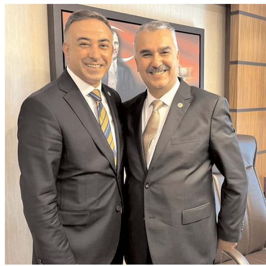
Milletvekili Mehmet Tahtasız, Milletvekili Yusuf Ahlatcı'yı ziyaret etti.

"15 Haziran 2023 tarihi itibarıyla üye seçimlerinde oy kullanacak üyelerimiz için, üye listeleri ilçe başkanlıklarımızda askıya çıkmıştır. İsimlerinizi 21 Haziran 2023 Çarşamba gününe kadar, 10.00-18.00 saatleri arasında ilçe başkanlıklarımızda kontrol edebilirsiniz." (Haber Merkezi)