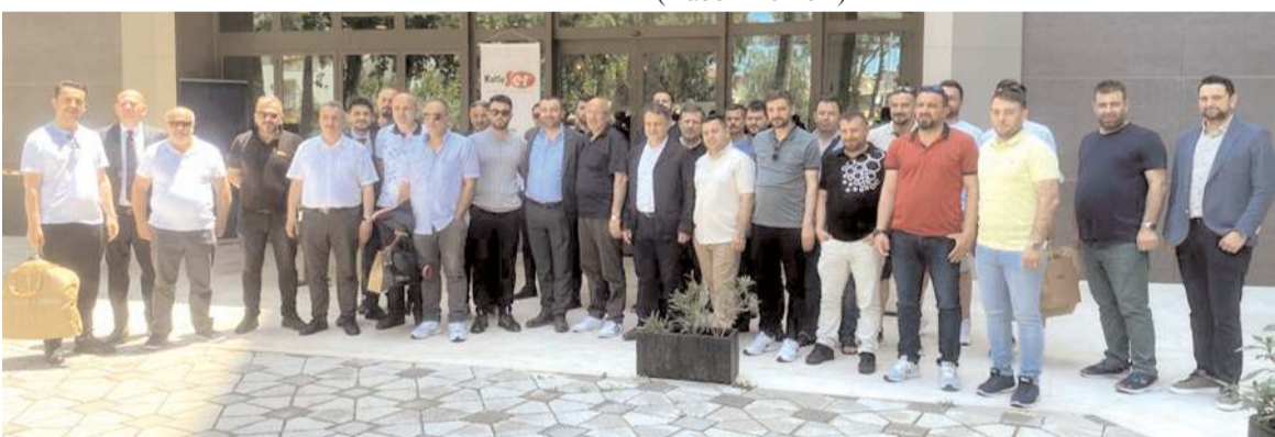
Programa 130 tali bayi katıldı.

vam etmek için omuz omuza çalışıyoruz. Organize ettiğimiz gezi ve toplantılarda sadece eğitim sunmakla kalmayıp, tali bayi kanallarımızın sorunlarını ve önerilerini dinleyerek taleplerini karşılamayı hedefliyoruz. Tali bayilerimizin başarısı bizim de öncelikli hedeflerimiz arasında yer aldığından, bu tür toplantıları düzenli aralıklarla gerçekleştirme konusunda kararlıyız. 5 gün boyunca düzenlediğimiz organizasyonumuza katılan tüm tali bayilerimize ayrı ayrı teşekkür ediyor; onlarla birlikte gelişmeye devam ederek gelecekteki başarılarımızı kutlamayı dört gözle bekliyoruz." dedi. (Haber Merkezi)