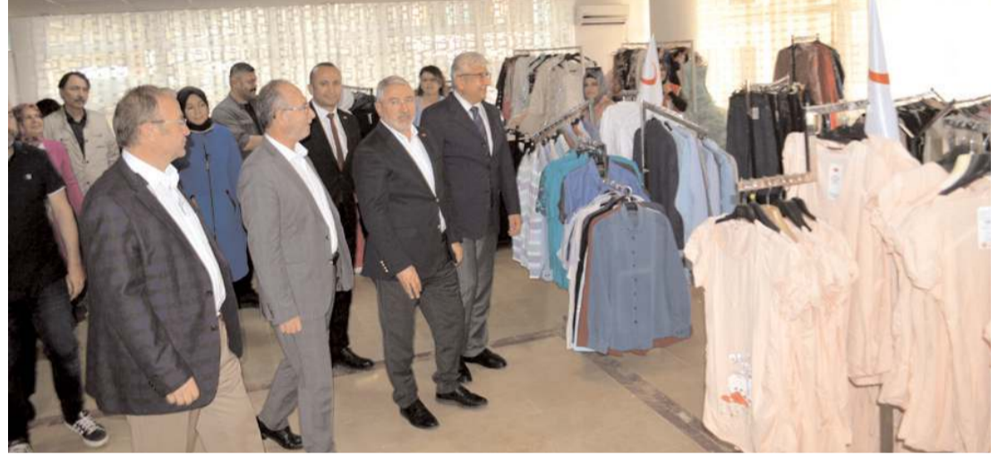
Kurdelenin kesilmesinin ardından protokol üyeleri merkezi gezdi.