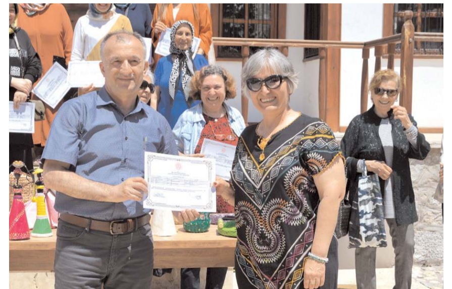
4 ay süren kurs sonunda 16 kursiyer sertifika almaya hak kazandı.