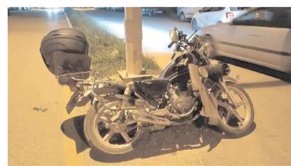
Kaza, Bahabey Caddesi'nde meydana geldi.