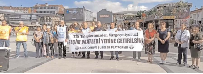
Eğitim Sen Çorum Şubesi Kadeş Meydanı'nda eylem düzenledi.

Başa maaş artışı vaadi olmak üzere seçim döneminde söylenen vaatlerin yıllardır yoksulluk ve sefalet ücretine mahkûm edilen, hakları budanan milyonlarda çalışma ve yaşam koşullarının düzenlenmesi noktasında bir beklenti oluşturduğunu belirten Beyaz; "6 milyonu aşkın kamu emekçisi ve emeklisi de bu bir an önce bu vaatlerin hayata geçirilmesini bekliyor. Çünkü yıllar önce aldığımız ikramiyeler kaldırıldı, sosyal