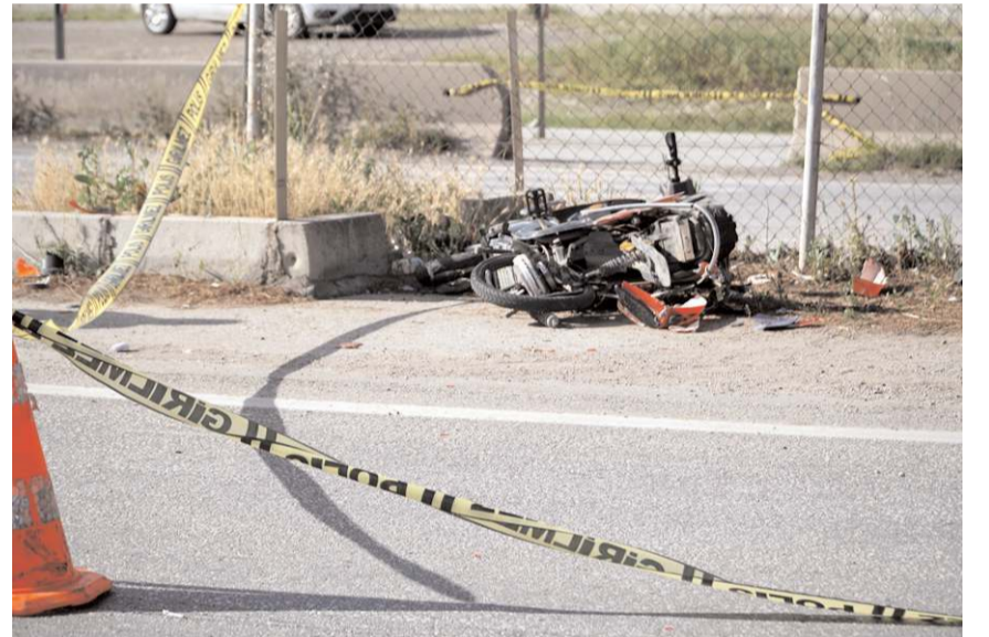
Kazada her iki araçta hurdaya döndü.

Yaralılardan hayatı tehlikesi bulunan elektrikli bisiklet sürücüsü T.A, Hitit Üniversitesi Erol Olçok Eğitim ve Araştırma Hastanesi'ne sevk edildi.(AA)