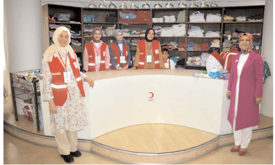
Merkezde ihtiyaç sahiplerine giyecek ve gıda yardımı yapılıyor.