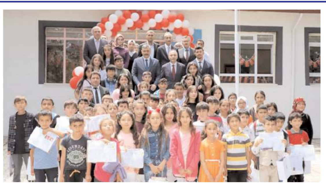
Resmi karne töreni in alözü İlkokulu ve Ortaokulunda yapıldı.