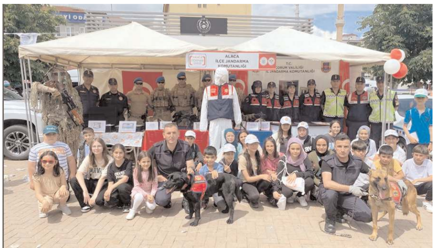
Öğrenciler şenlikte jandarmanın kullandığı ekipmanları da görme fırsatı buldular

Öğrenciler, Jandarma tarafından kurulan stanta yoğun ilgi göstererek, ilerde jandarma olmak istediklerini söylediler. (Haber Merkezi)