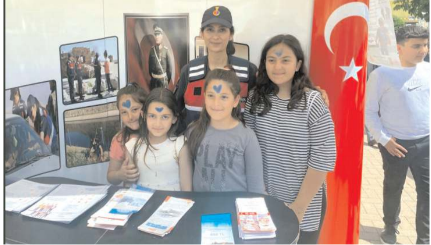
Öğrenciler jandarmayı yakından tanıdılar.

Çorum İl Jandarma Komutanlığı, Alaca ilçesinde gerçekleştirilen Öğrenme Şenliği'nde stant kurdu.