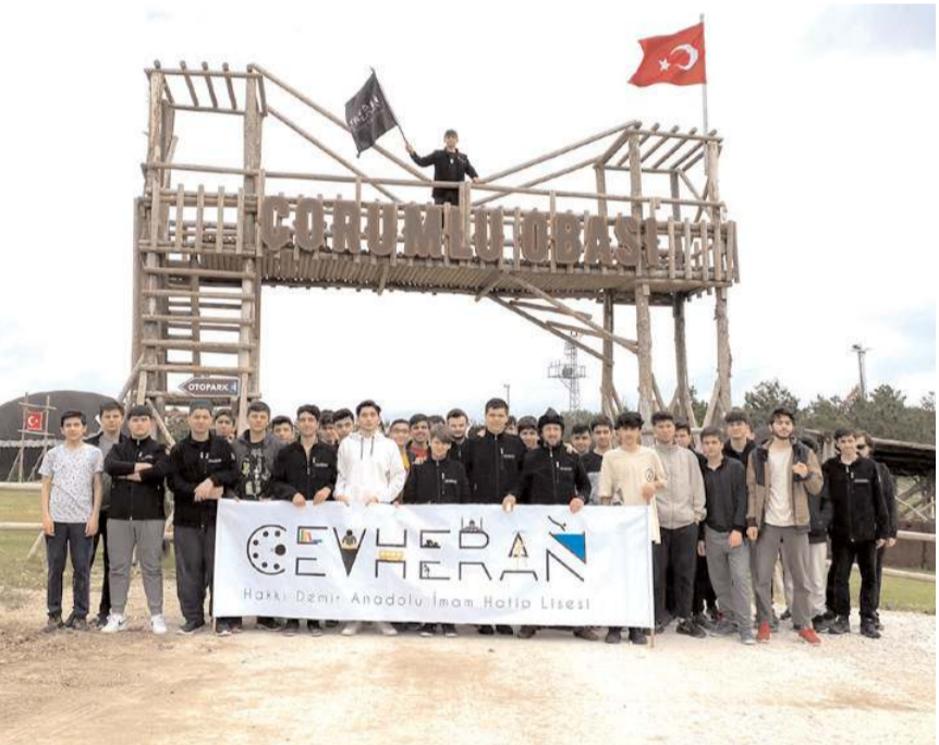
İstanbul Hakkı Demir Anadolu İmam Hatip Lisesi öğretmen ve öğrencilerinden Çorumlu Obası Gençlik Kamp Merkezi'nde kamp yaptı.

Çorum Belediyesi'nin gençlere yönelik hayata geçirdiği önemli projeler arasında yer alan Çorumlu Obası Gençlik Kamp Merkezi, günümüz ile tarihi bağların kurulması noktasında hizmet vermeye devam ediyor.