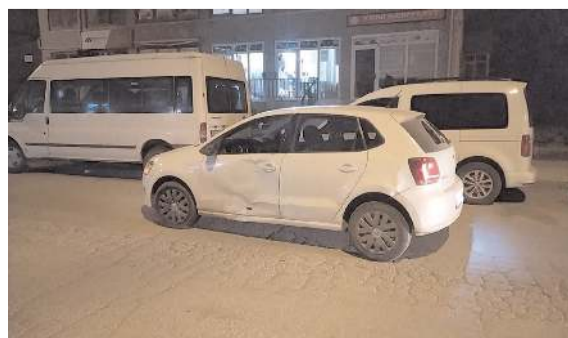
Kazada otomobile maddi hasar meydana geldi.

Kaza ile ilgili başlatılan soruşturma sürüyor. (İHA)