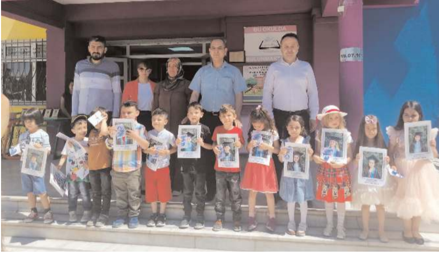
Karnesini alan öğrencilere çeşitli hediyelerde verildi.