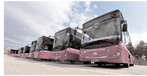
YKS'ye girecek üniversite adayları halk otobüslerinden ücretsiz yararlanacak.