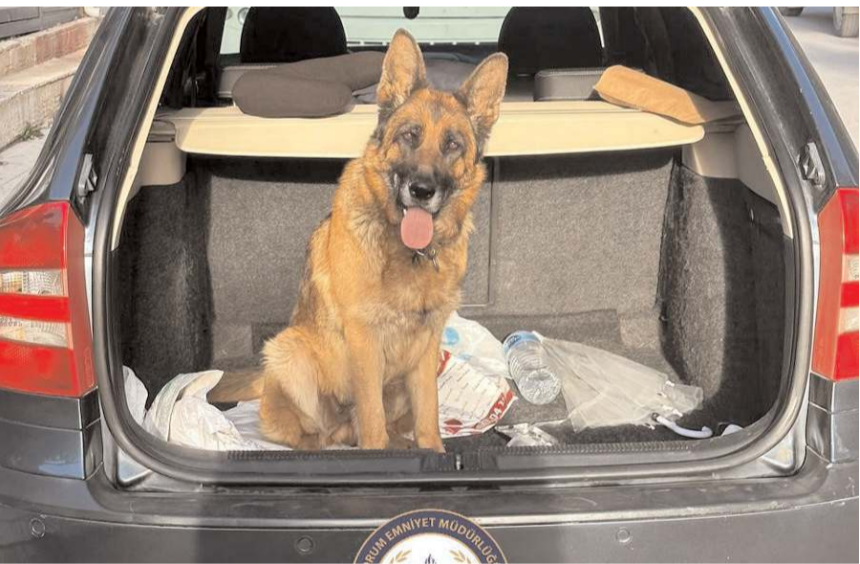
Çalınan köpek sahibine teslim edildi.