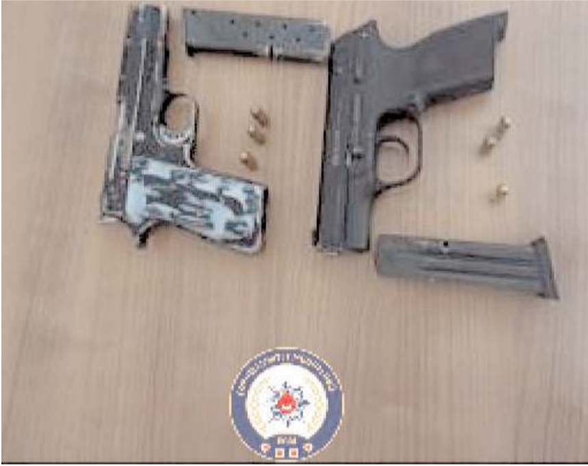
Şüphelilerden ele geçirilen silahlar

lunan 6 kişi arasında tartışma çıkmış, tartış-