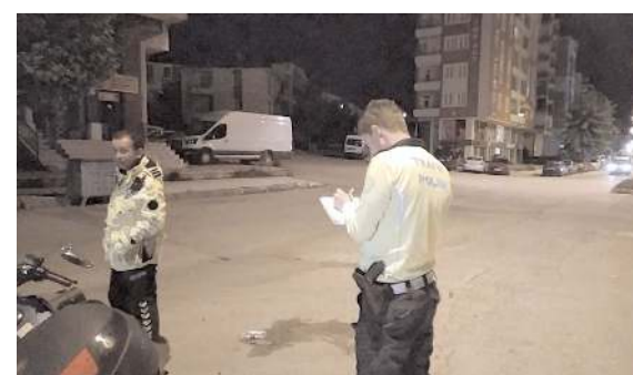
Trafik polisleri olay yerinde inceleme yaptı.