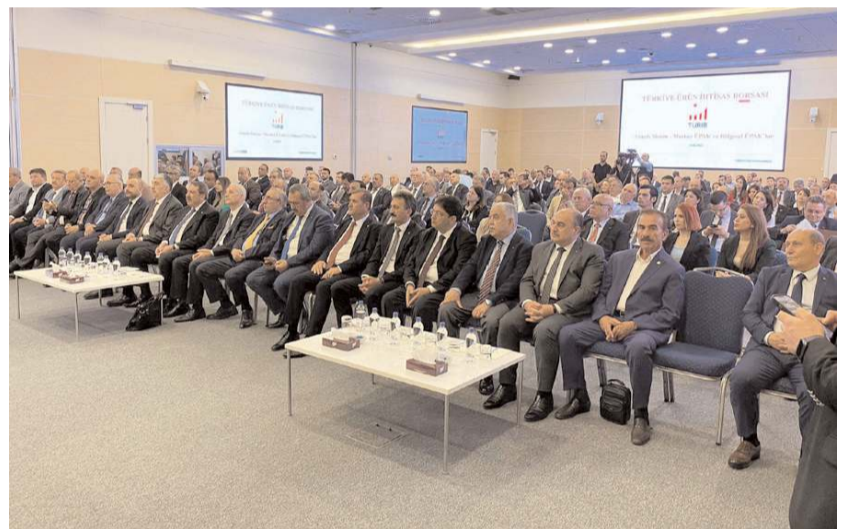
Toplantıda yapılacak çalışmalar ele alındı.