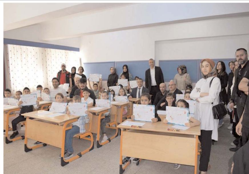
Sungurlu'da öğrencilere karnelerini protokol üyeleri verdi.