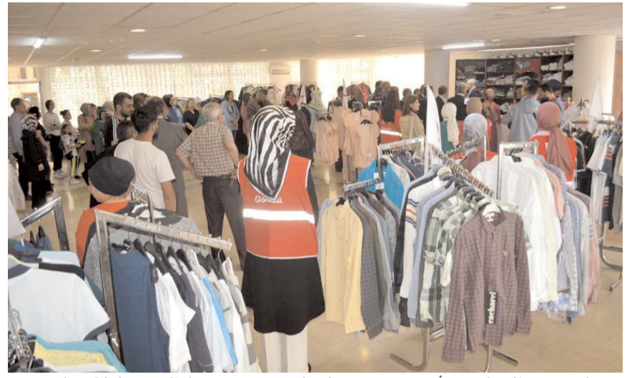
Kızılay Giyim ve Gıda Dağıtım Merkezi, Yunus Emre İş Merkezi'ne taşındı.