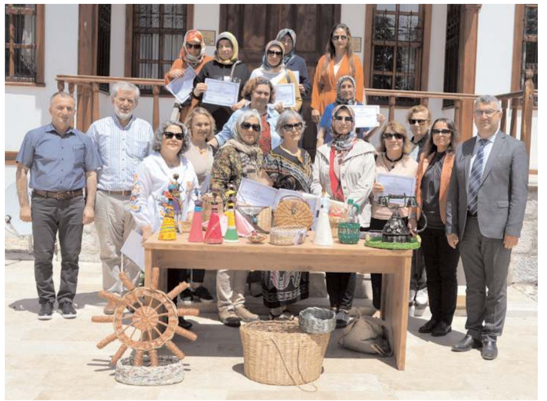
Dekoratif Sepet Örücülüğü Kursu sertifika töreni İl Kültür ve Turizm Müdürlüğü'nde yapıldı.