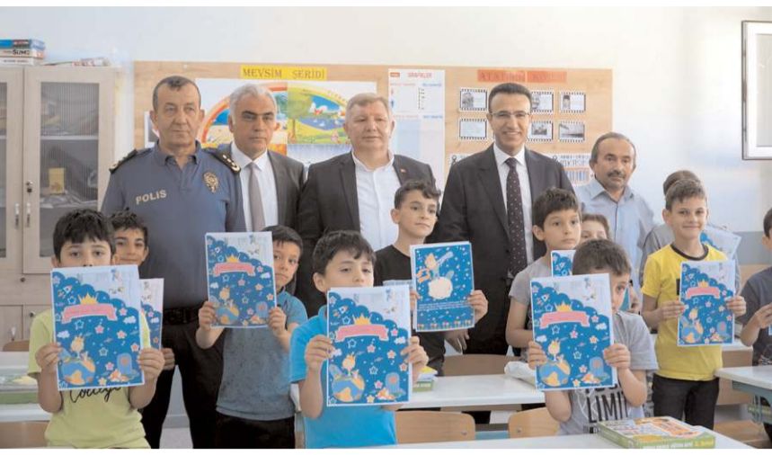
Osmançık'ta öğrencilerin karne sevincine protokol üyeleri de ortak oldu.