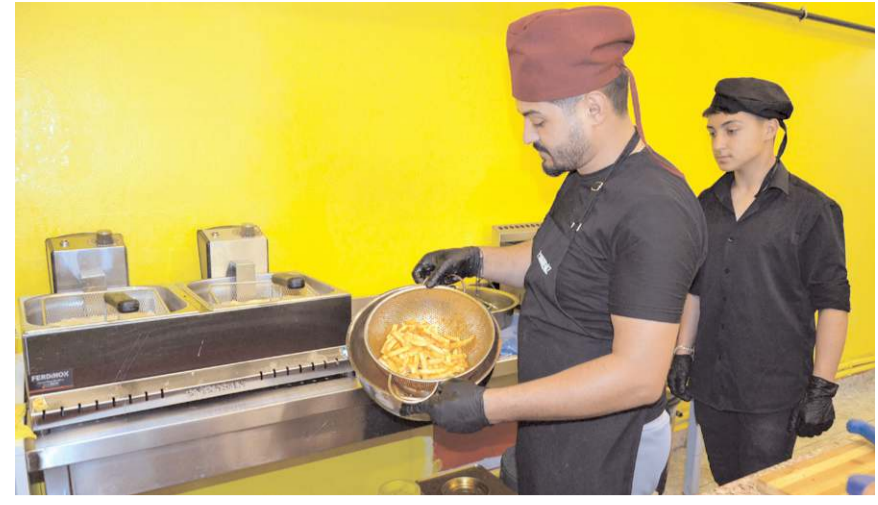
Soho Fries, kızarmış patatesleri müşterilerine 16 çeşit sosla sunuyor.