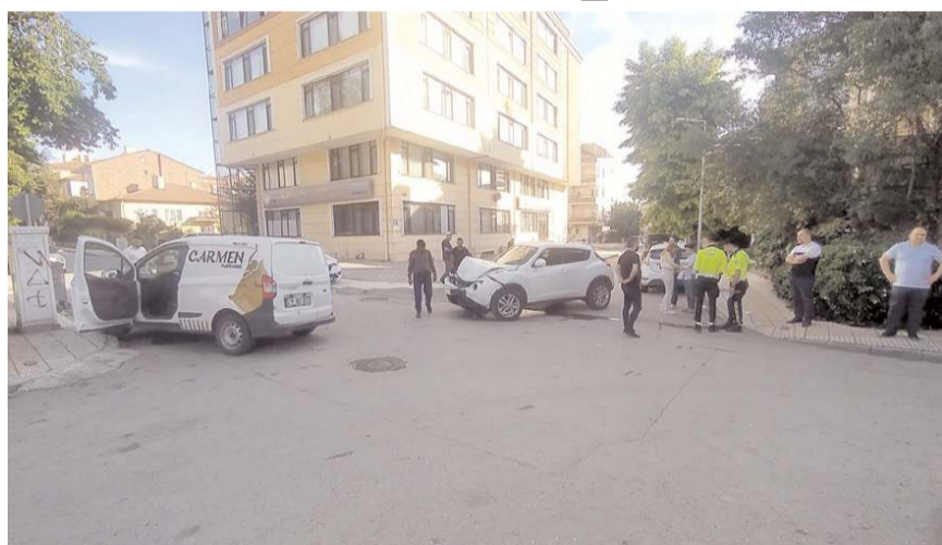
Kaza, Esnafevleri 4. Sokak'ta meydana geldi.