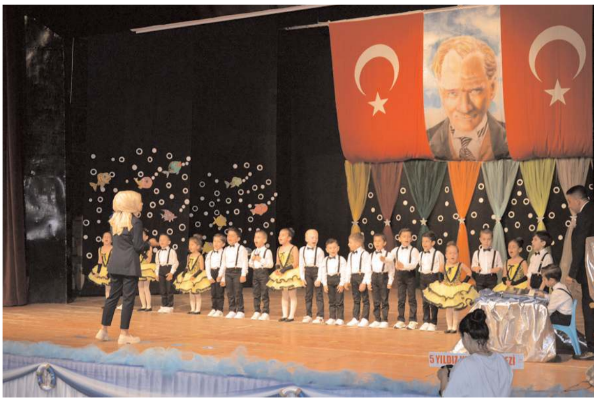
Özel Ümit Kreş, 2022-2023 eğitim-öğretim yılını yıl sonu gösterisi ile tamamladı.