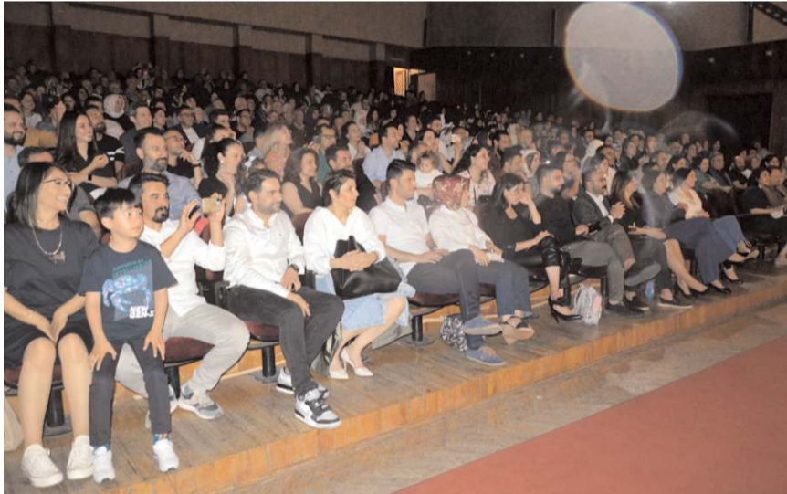
Miniklerin gösterilerini aileleri büyük bir heyecanla izlediler.