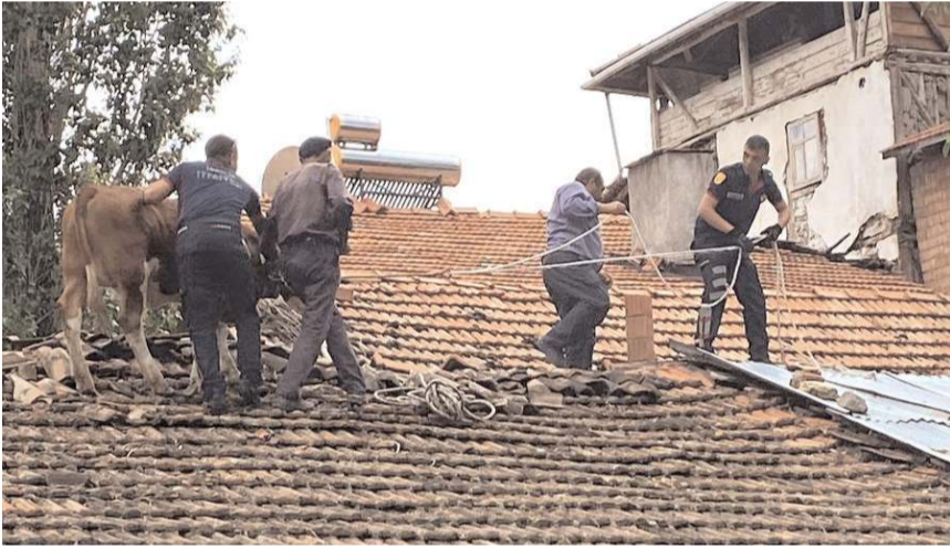
Olay, ilçeye bağlı Aşağı Örenseki köyünde meydana geldi.