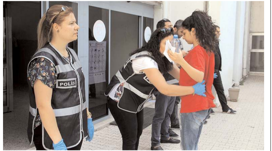
Üniversite sınavı geçtiğimiz hafta sonu yapıldı.

Öğrenciler görevlilerin kimlik ve belge kontrolü, polis ekiplerinin de üst araması yapmasının ar-