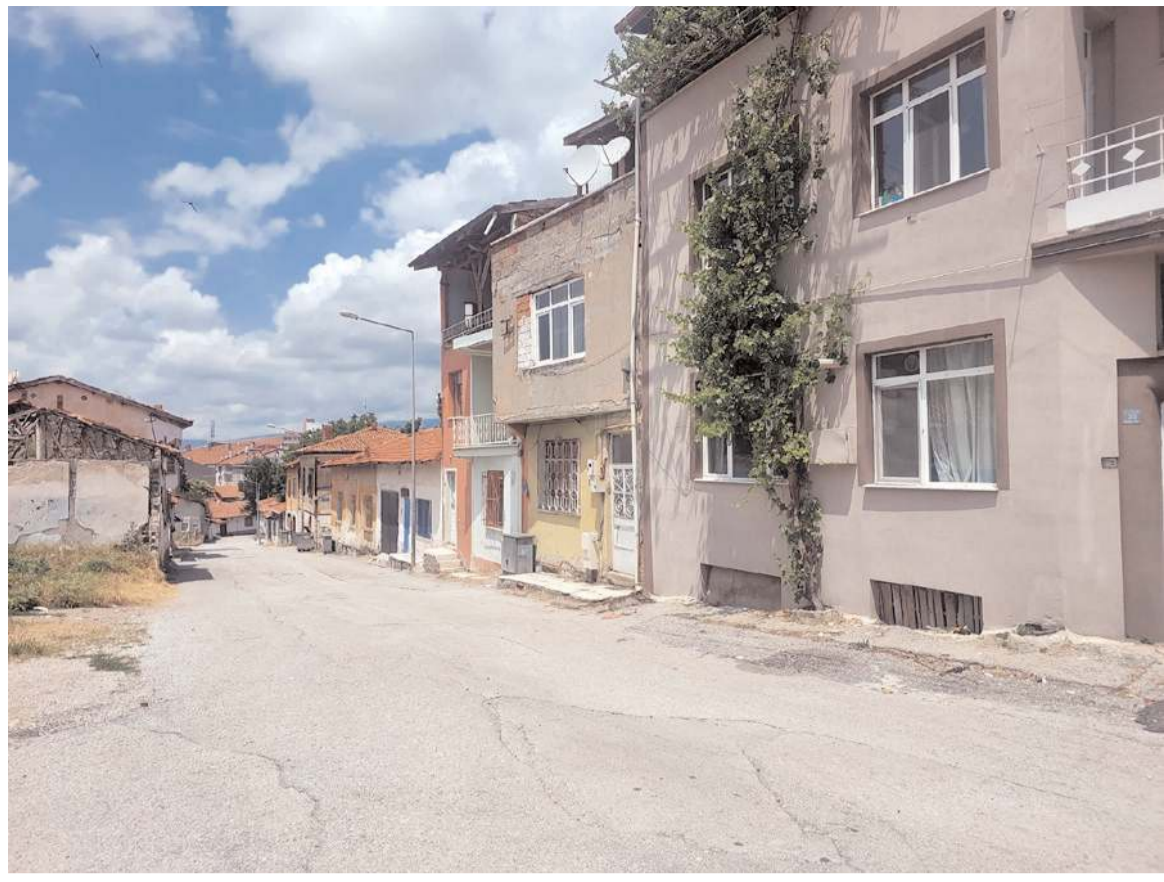
Kale Mahallesi sakinleri Çorum Kalesi ve çevresinin mezbelelik görüntüden kurtarılmasını istiyor.