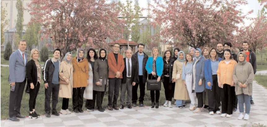
Günün anısına fotoğraf çekildi.