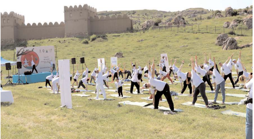
Dünya Yoga Günü dolayısıyla Boğazkale'de etkinlik yapıldı.