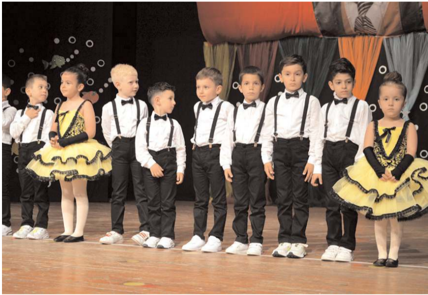
Minik öğrencilerin bir yıl boyunca hazırladıkları dans gösterileri davetlilerin büyük beğenisini kazandı.

Konuşmaların ardından öğrencilerin gösterilerine geçildi. Minik öğrencilerin dans ve müzik dinletileri geceye katılanlardan tam not aldı.