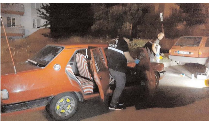
Olayda zanlıların kullandığı araç terk edilmiş halde bulundu.

Çorum'da 3 kişinin silahla vurularak yaralanmasıyla ilgili 3 zanlıdan 2'si gözaltına alındı.