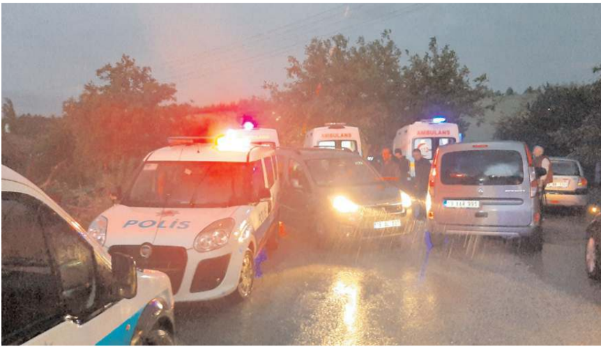
Olay yerine çok sayıda ambulans ve polis ekibi sevk edildi.