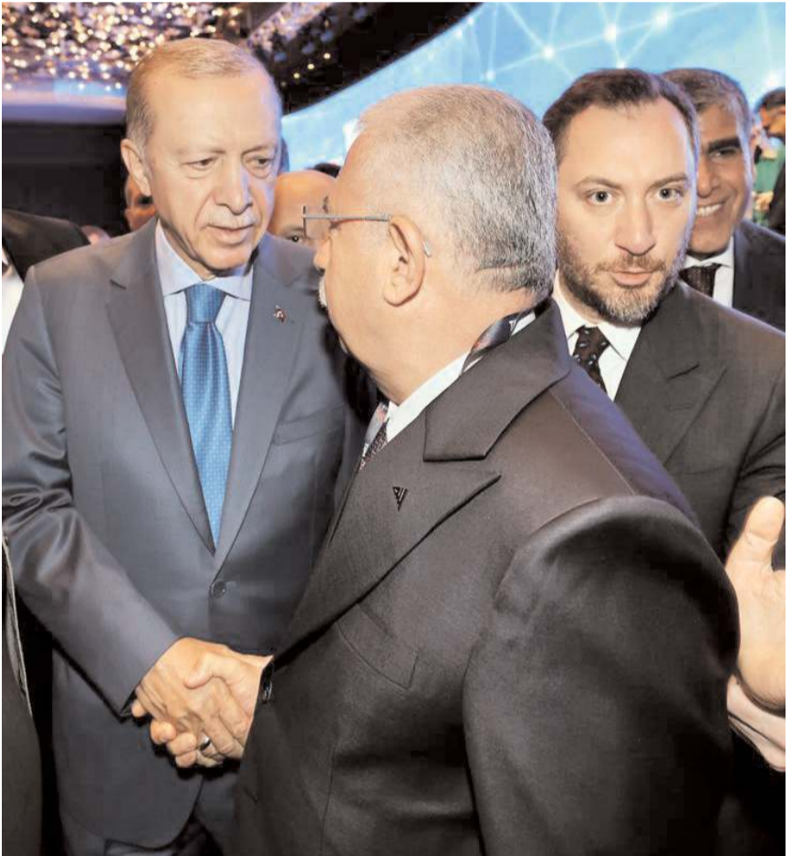
İşadamı Ahmet Ahlatcı, Cumhurbaşkanı Recep Tayyip Erdoğan ile de bir süre görüştü.