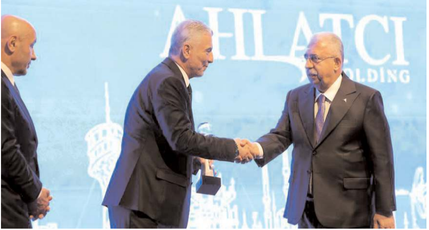
Ahlatcı Holding Yönetim Kurulu Başkanı Ahmet Ahlatcı, ödülünü Ticaret Bakanı Ömer Bolat'tan aldı.

Türkiye İhracatçılar Meclisi tarafından düzenlenen İhracat Şampiyonları Ödül Töreni'nde "Türkiye'nin Mücevher Sektörü İhracat Şampiyonu" ödülünü aldı.