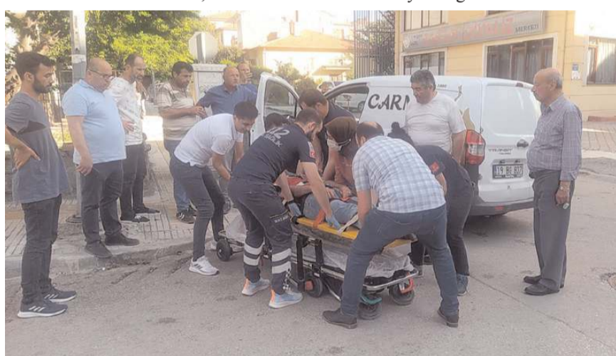
Kazada yaralanan ticari araç sürücüsü hastanede tedavi altına alındı.

Çorum'da cip ile hafif ticari aracın çarpışması neticesinde meydana gelen kazada 1 kişi yaralandı.