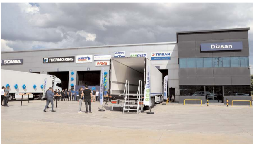
Firma 17 ülkeye ihraçat yapıyor.