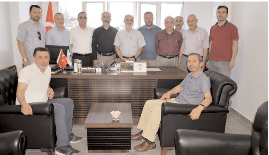
Diyanet Sen Çorum Şubesi, yeni yerinde faaliyete başladı.