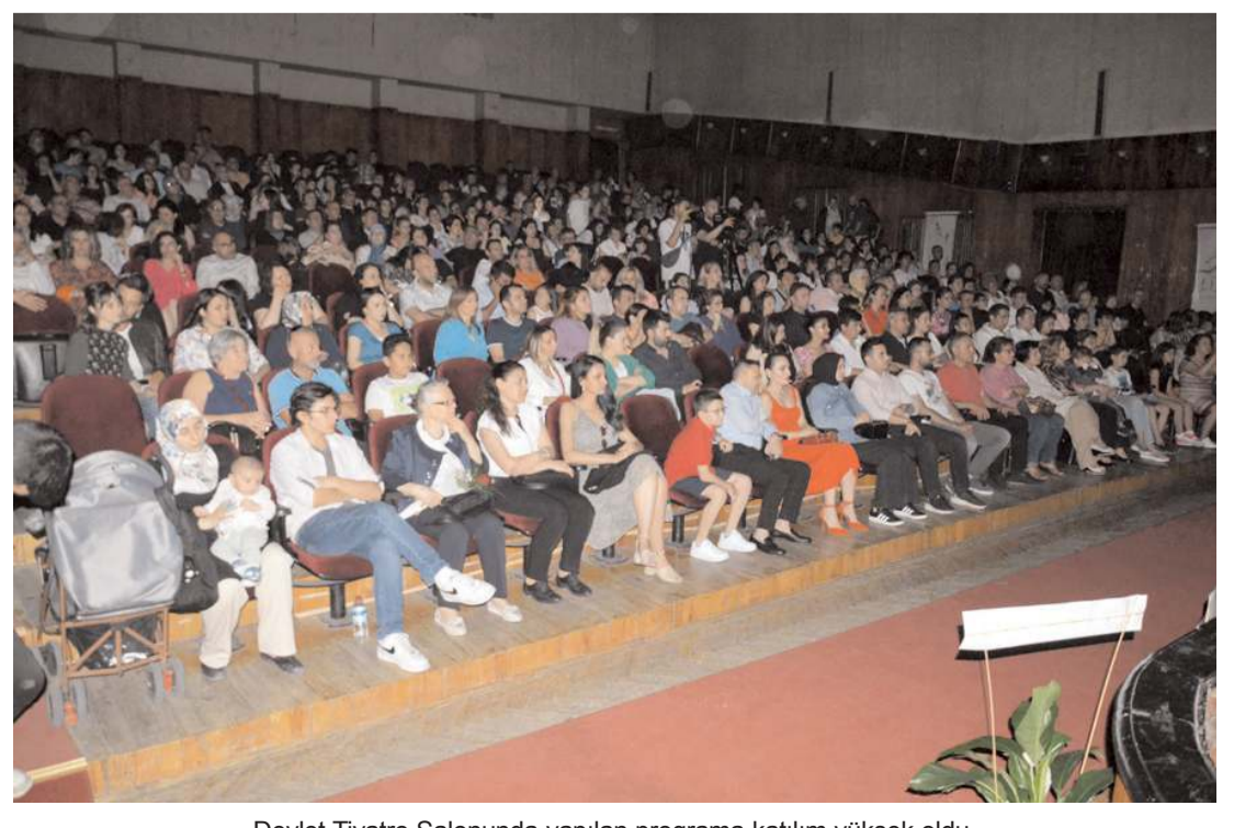
Devlet Tiyatro Salonunda yapılan programa katılım yüksek oldu.