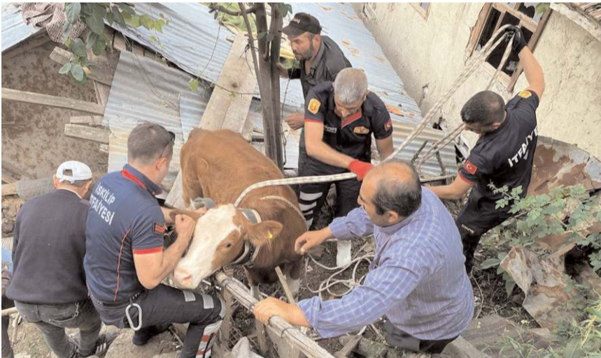
Ineği çıktığı çatıdan itfaiye ekipleri indirdi.