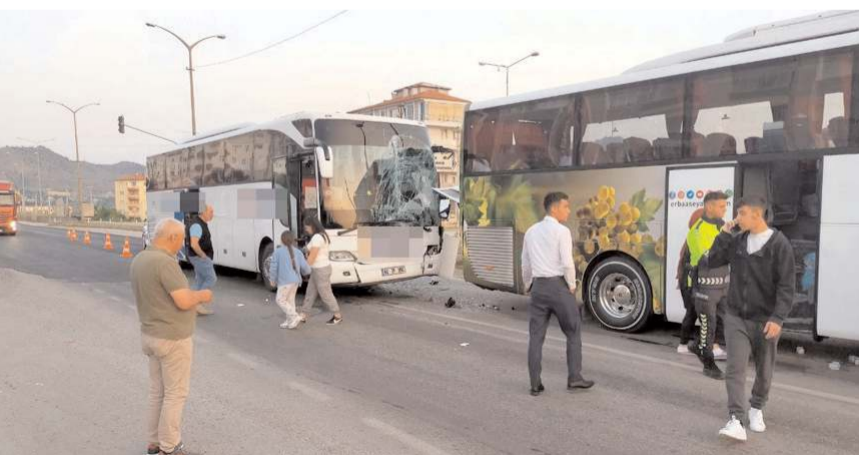
Kaza, D-100 Karayolu'nda meydana geldi.

Kaza ile ilgili olarak başlatılan soruşturmanın sürdüğü öğrenildi. (İHA)