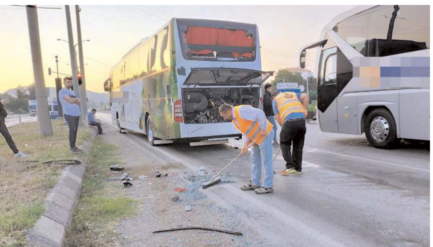
Karayolları ekipleri yola dökülen parçaları temizledi.