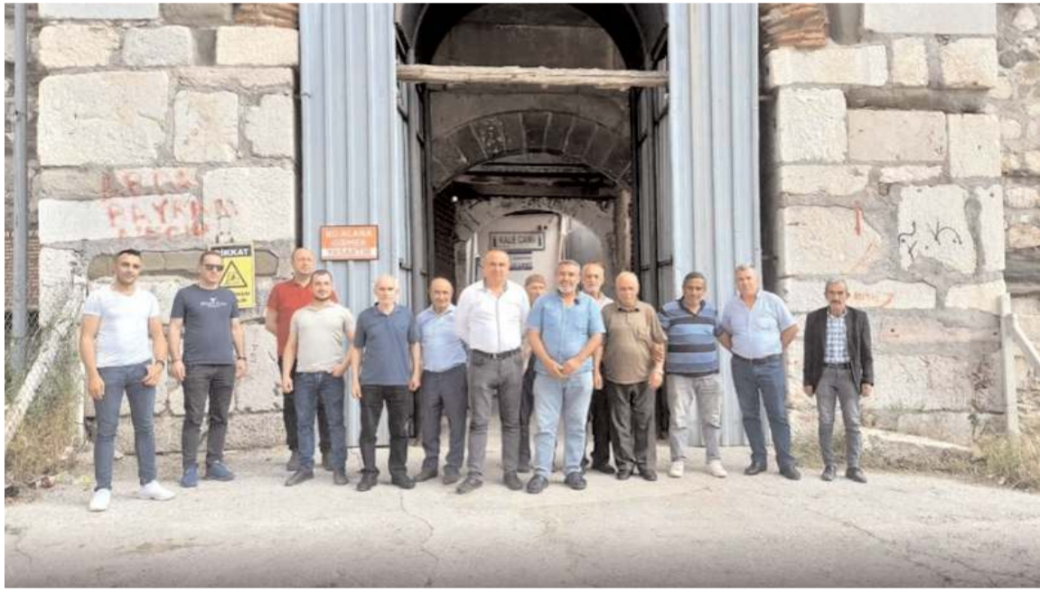
Kale Mahallesi sakinleri önceki gün Kale'nin önünde bir araya gelerek açıklama yaptı.