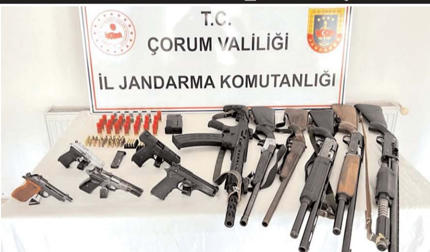
Operasyonda çok sayıda ateşli silah ve bunlara ait fişekler ele geçirildi.

Olayla ilgili 4 şüpheli hakkında adli soruşturma başlatıldı. (Haber Merkezi)