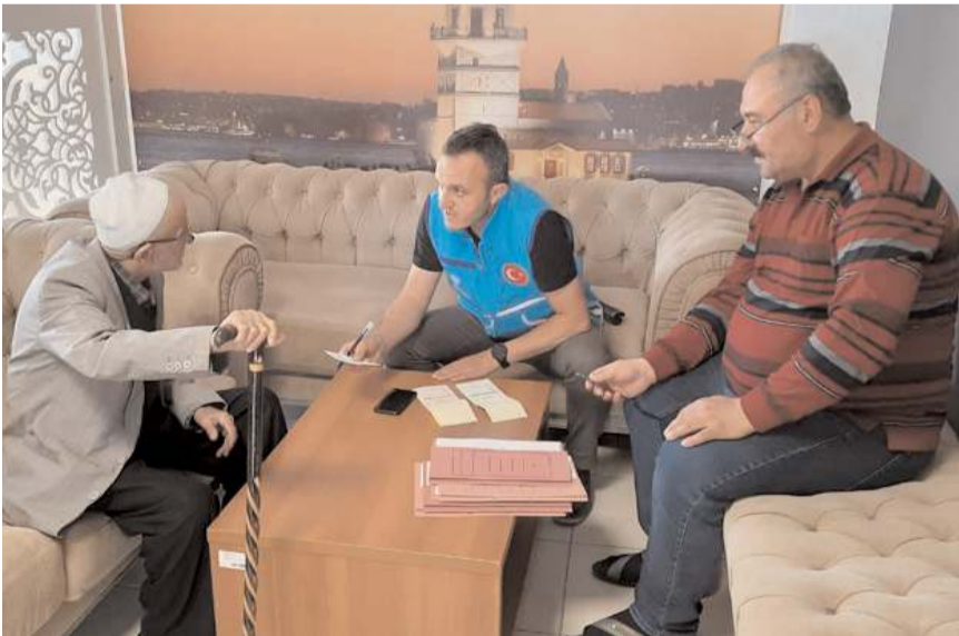
Türkiye Diyanet Vakfı yetkilileri huzur evine giderek vekaleten kurban bağıışı işlemlerini yaptılar.