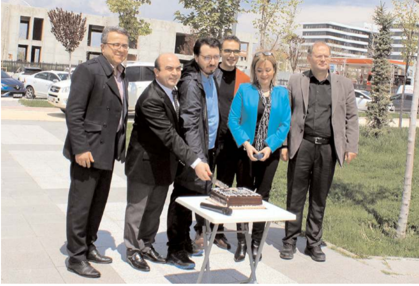
Azak, başarısını doktor arkadaşlarıyla pasta keserek kutladı.