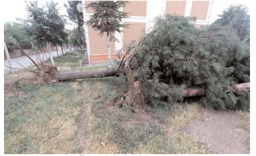
Fırtına ağaçları kökünden söktü.

rı dallarından kırıldı. Vatan Caddesi'nde bulunan bir evin çatısı şiddetli fırtınayla uçtu, evin önünden geçen elektrik tellerini kopardı. Aynı cadde üzerinde bulunan otobüs durağının camı vidalarından söküldü. Bazı evlerin çatılarından kiremitler düştü. Kızılırmak Nehri'ndeki su seviyesi sağanak sonrası yükseldi. Gecek köyünde sel suları karayoluna taşınca trafik tek şeritten sağlandı. Fırtına ve sağanak sonrası ekipler teyakkuzca geçerek hasar tespit çalışmalarına başladı. (İHA)