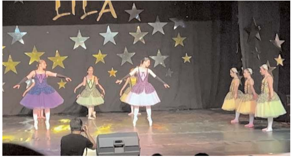
Lila Akademi Sanat Merkezi 17.kuruluş yıl dönümünü kutladı.