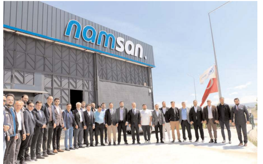
MÜSİAD heyeti için fabrika gezisi düzenlendi.