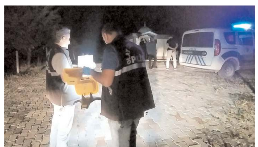
Olay, Bahçelievler Mahallesinde meydana geldi.

Polis ekipleri silahla yaralama olayını gerçekleştiren kişi yada kişilerin yakalanması için çalışma başlattı. (İHA)