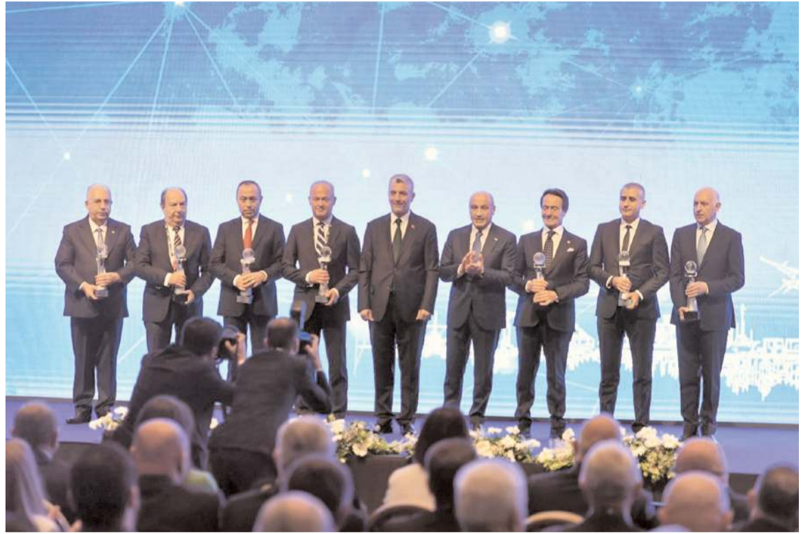
Türkiye İhracatçılar Meclisi (TİM) 30. Genel Kurulu ve İhracatın Şampiyonları Ödül Töreni İstanbul'da düzenlendi.