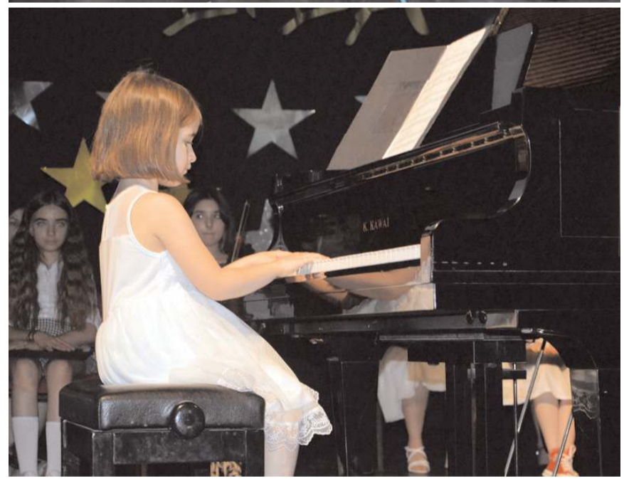
Öğrenciler piyano resitali gerçekleştirdi.