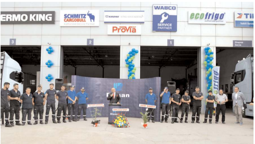
Dizsan Otomotiv Eco Frigo'nun açılış geçtiğimiz hafta sonu yapıldı.