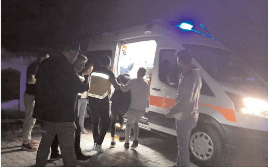
Yaralılar hastanede tedavi altına alındı.

Şüphelilerin yakalanması için çalışma başlatıldı.(AA)