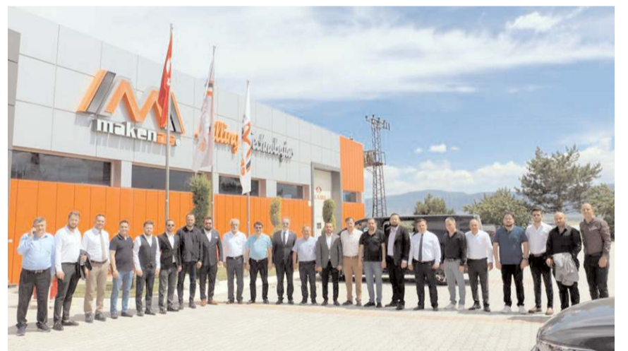
MÜSİAD heyeti fabrikalar hakkında yetkililerden bilgi aldı.

ma fırsatı yakalayacağız. Bu etkinlik, sadece kişisel bağlarımızı güçlendirmekle kalmayacak, aynı zamanda şehrimizin ve ülkemizin ekonomisine katkıda bulunacak somut projelerin temellerini atacak" dedi.