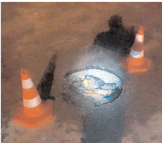
Sağanak sonrasında Mehmet Akif Ersoy 3. Caddede çukur oluştu.