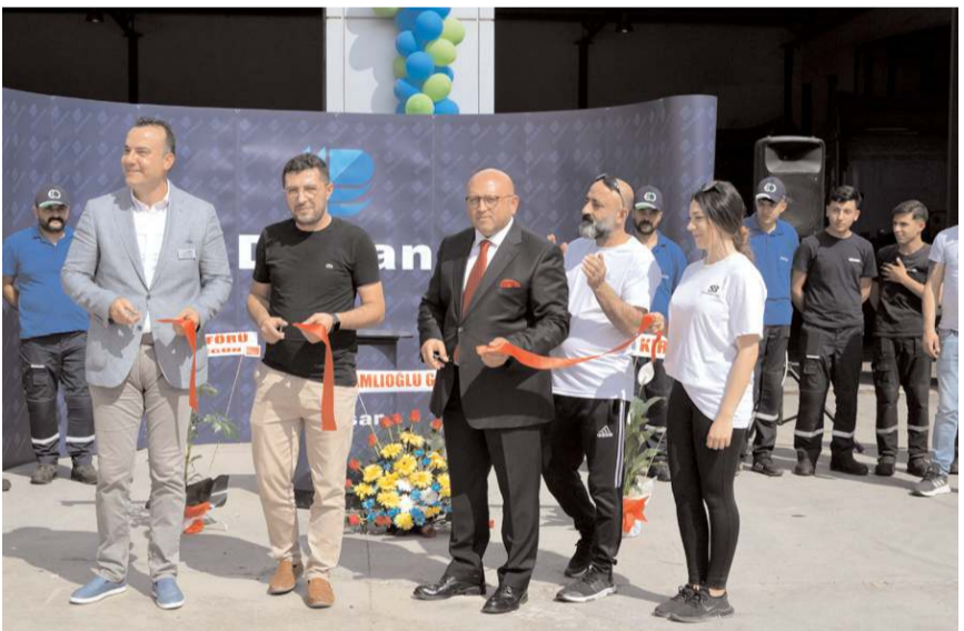
Dizsan Otomotiv Eco Frigo'nun açılış kurdelesini kesildi.