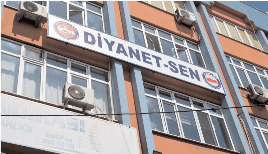
Diyanet Sen Çorum Şubesi Turgut Özal İş Merkezi'ne taşdı.