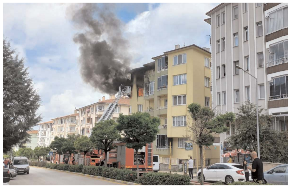
Yangına Çorum Belediyesi itfaiye ekipleri müdahale etti.

Zanlıların üzerlerinde yapılan aramada 2 tabanca ele geçirildi. Polis ekipleri, olayla ilgili üçüncü zanlının yakalanması için çalışmalarını sürdürüyor.(AA)