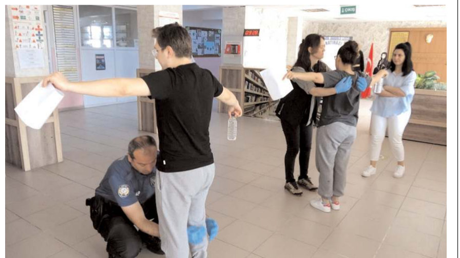
Öğrenciler sınava geniş güvenlik önlemleri altına alındılar.