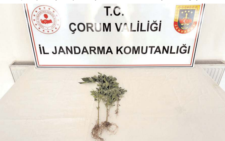
Jandarma ekipleri kenevir bitkisi de ele geçirdi.