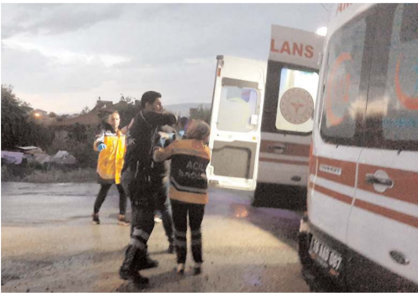
Yaralıları ilk müdahale olay yerinde yapıldı.