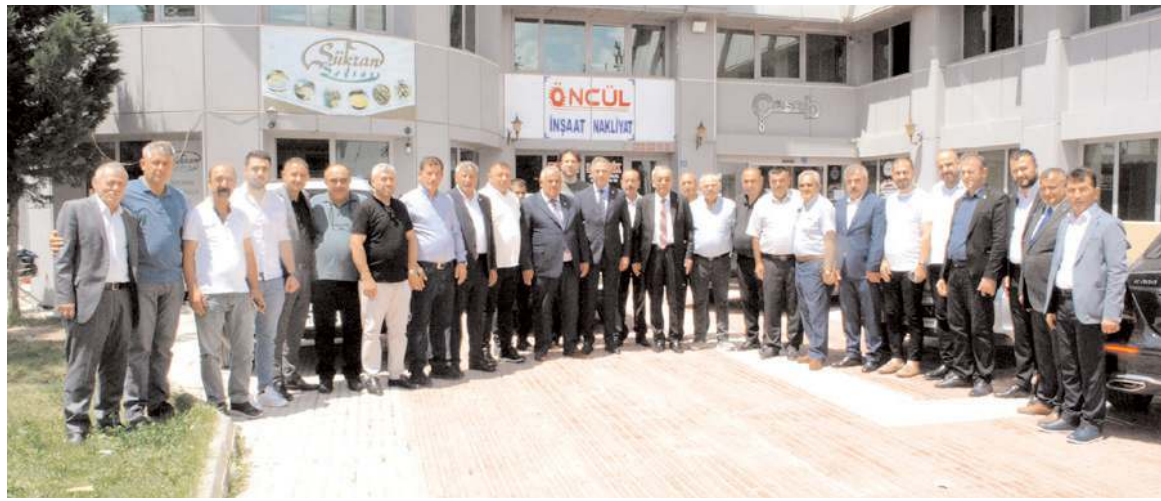
Esnafar ÇESOB'te bayramlaştı.