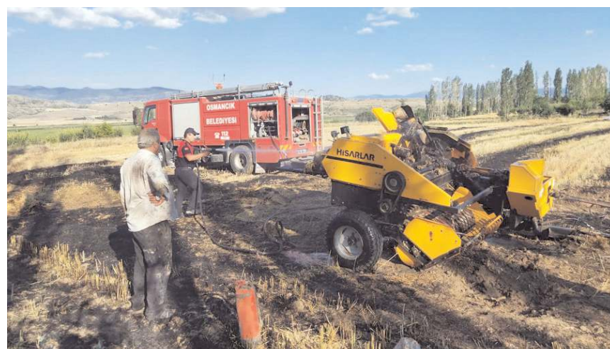
Yangında toplanan saman balyaları ve tarladaki anızlar yanarak zarar gördü.

Sap makinesinden çıkan kıvılcımın neden olduğu belirlenen yangında makine ile toplanan saman balyaları ve tarladaki anızlar yanarak zarar gördü. (İHA)