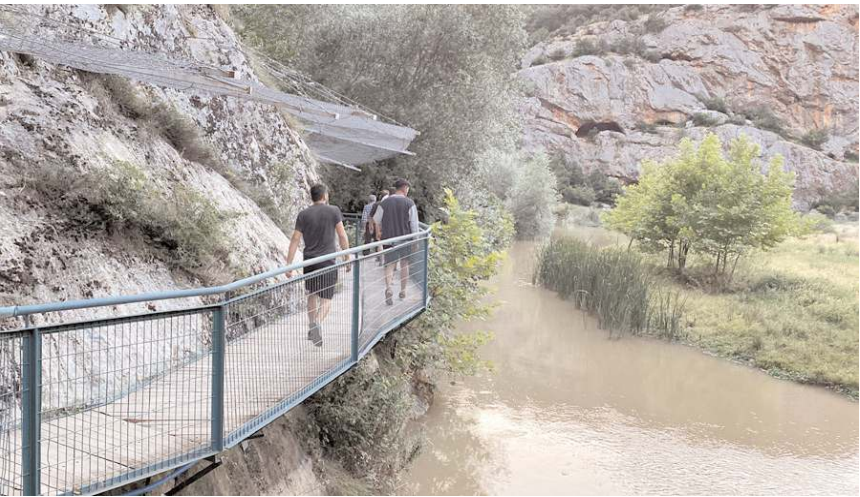
İncesu Kanyonu Kurban Bayramı tatilinde vatandaşlardan yoğun ilgi gördü.