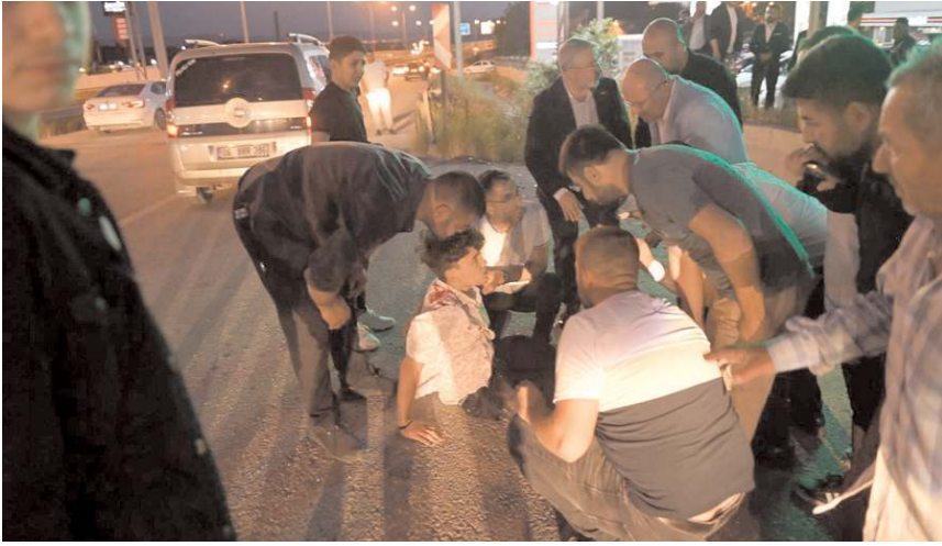
Kaza, önceki akşam Beyaz Düğün Salonu karşısında meydana geldi.