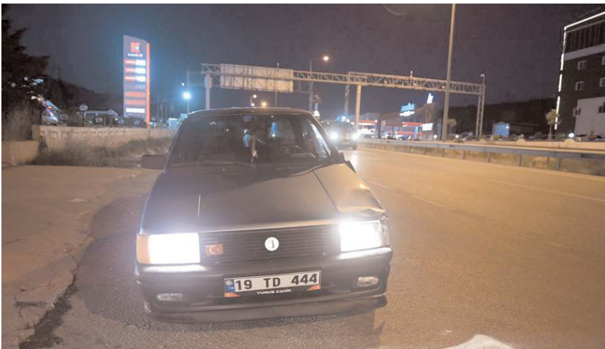
Karşıdan karşıya geçmeye çalışan A.K. isimli gence otomobil çarptı.