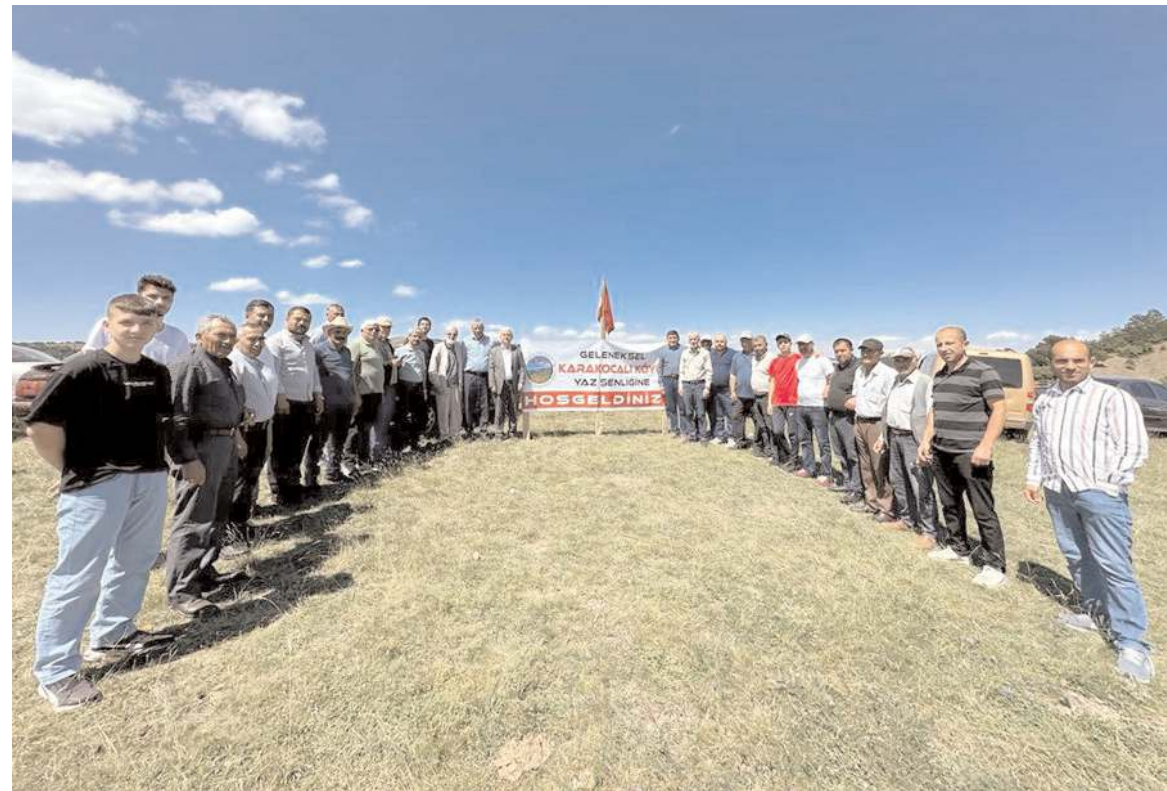
Şenliğe çok sayıda davetli katıldı.