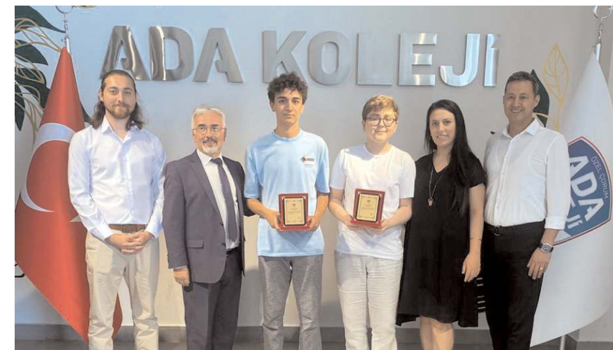
LGS'de derece elde eden öğrenciler teşekkür plaketi verildi.

Ortaokulu ve şehir için değil ülke için de zorunlu bir anlayış olması gerektiğini ifade etti.