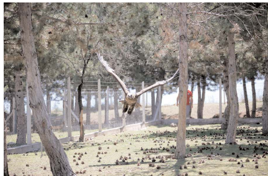
Tuğla fabrikasına düşen akbaba koruma altına alındı.

Akbabanın tedavinin ardından uçuş yetisini kazanması durumunda doğal yaşam alanına bırakılacağı, aksi takdirde merkezde misafir edileceği bildirildi. (AA)