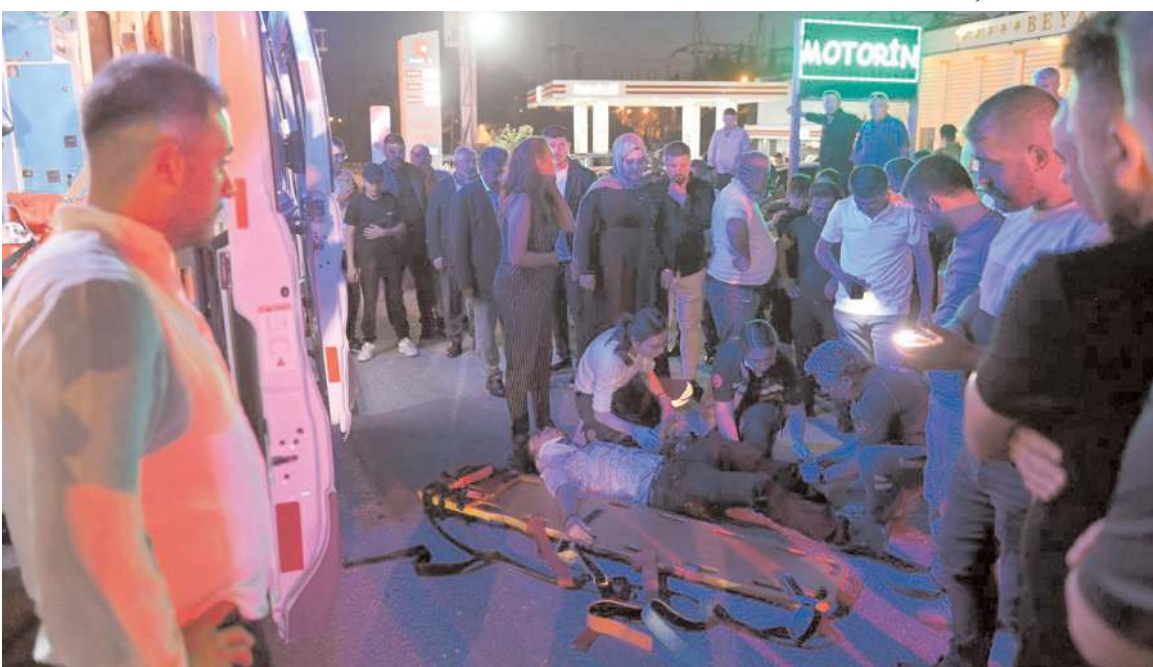
Yayaya ilk müdahaleyi olay yerinde sağlık ekipleri yaptı.