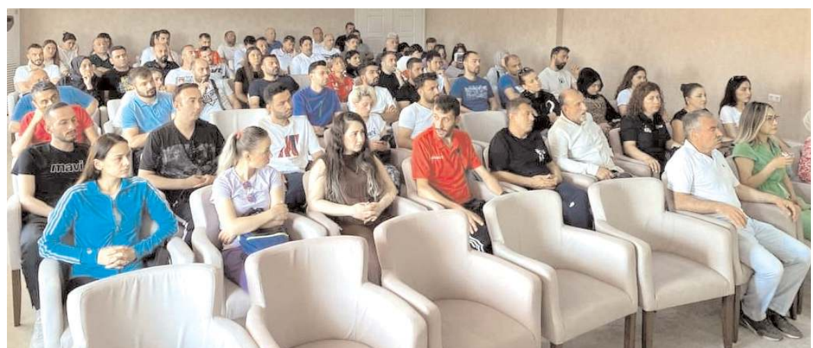
İl Müdürlüğü Toplantı Salonu'nda yapılan buluşmaya Yaz Spor Okulunda görev yapacak antrenörler katıldı