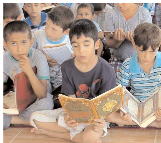
Yaz Kur'an kursları 3 Temmuz - 11 Ağustos 2023 tarihleri arasında yüz yüze gerçekleştirilecek.