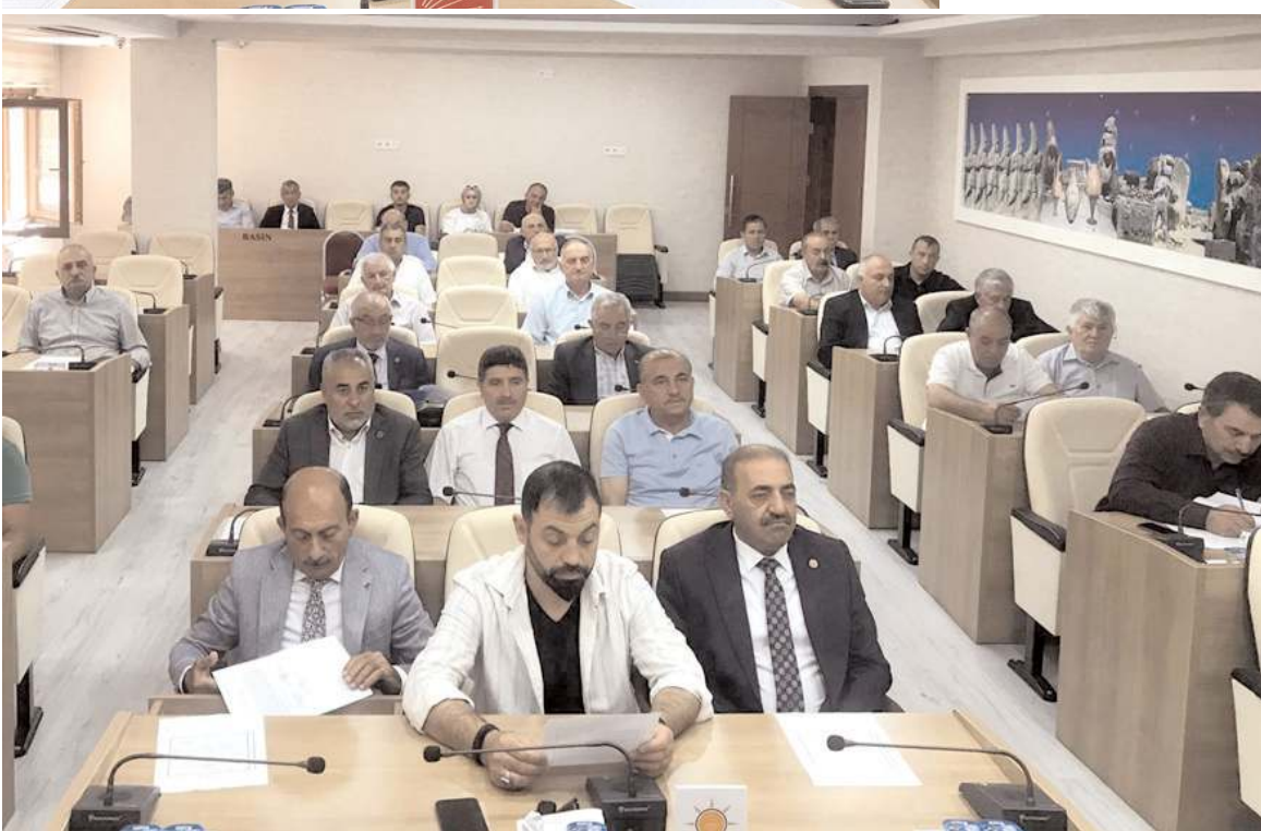
Gündem maddelerinin görüşülmesinin ardından toplantı sona erdi.