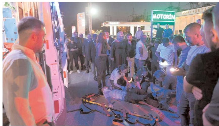
Kaza,önceki akşam Beyaz Düğün Salonu karşısında meydana geldi.