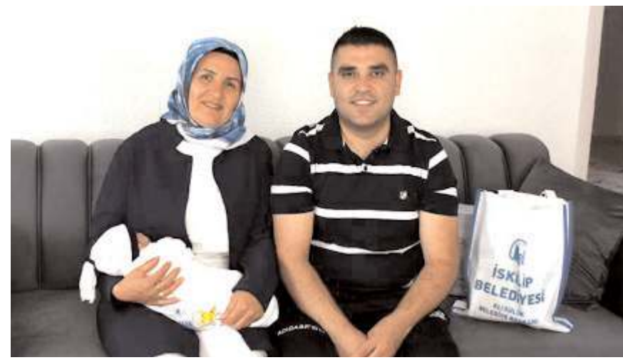
İskilip Belediyesi'nin "Hoş Geldin Bebek Projesi" devam ediyor.

sosyal belediyeçilik alanında çalışmalar yürüttüklerine dikkati çekerek, "Ailelerin mutluluğunu paylaşıp, insan odaklı sosyal belediyeçilik anlayışıyla hayata geçirdiğimiz 'Hoş Geldin Bebek Projesi' kapsamında, gözlerini hayata açan miniklerimizi ziyaret ediyor ve ailelerin ihtiyaçlarını karşılamak amacıyla yeni doğan bakım setini sunuyoruz. Projenin başlangıcından bugüne 518 bebeğimizin hayatına dokunarak onlara ve ailelerine destek olduk ve daha nicelerine olmaya devam edeceğiz." ifadelerini kullandı. (A.A)