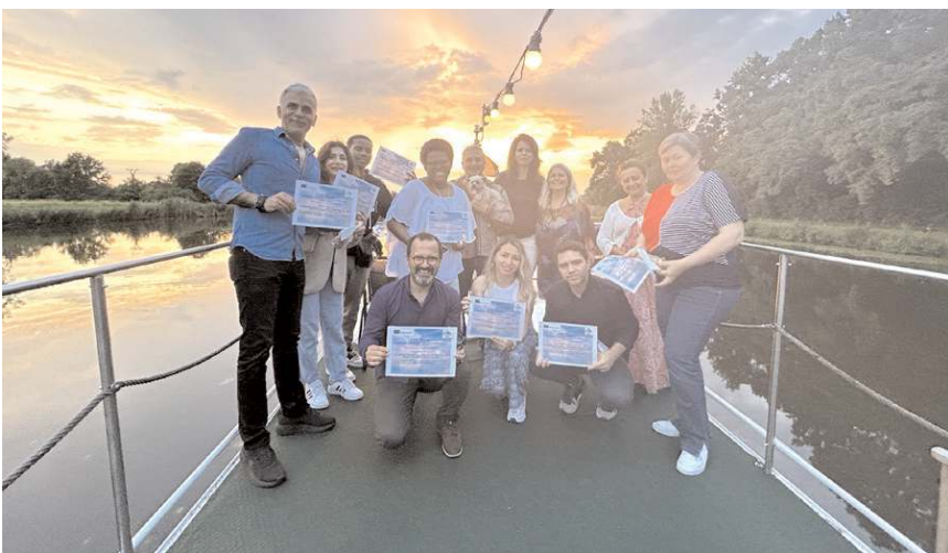
Projenin ilk hareketliliği Çekya koordinatörlüğünde yapıldı.