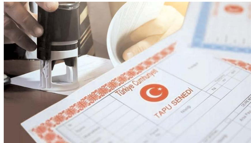
Tüm taşınmaz satışlarının noterliklerde yapılması için hazırlanan uygulama bugün başlıyor.

Başvurunun kabulüyle noter tarafından taşınmazla