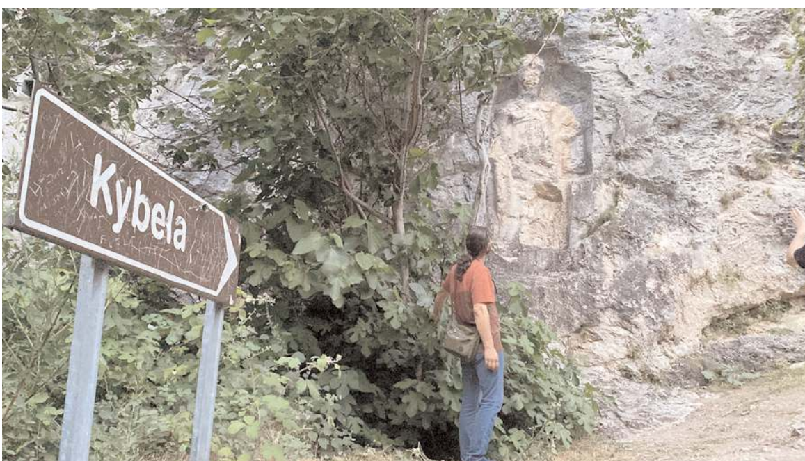
Kabartmayı gören vatandaşlar, 2 bin yıllık tarihe böylesine zarar görmesine tepki gösterdi.

gibi bir heykel, büyük bir tanrıçanın heykelini bu halde görmek bizi çok üzdü. Daha sağlam bir şekilde görmeyi bekliyordum. Keşke korunsaydı" dedi. (İHA)