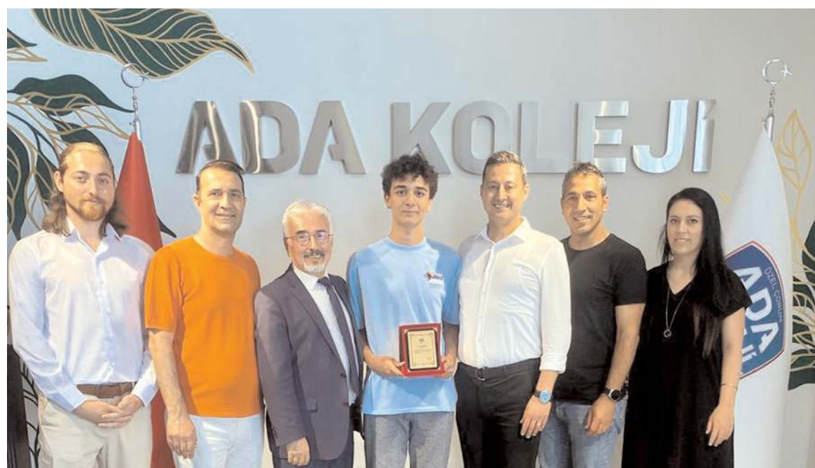
Okul idarecileri başarılı öğrencileri tebrik ettiler.

Akçal, gelecekte bu haklı gurura ortak olmak isteyen tüm öğrenciler ve değerli veliler için kapıların sonuna kadar açık olduğunu söyledi. (Haber Merkezi)