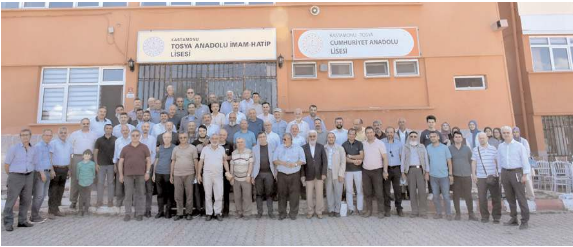
Günün anısına hatıra fotoğrafı çekildi.