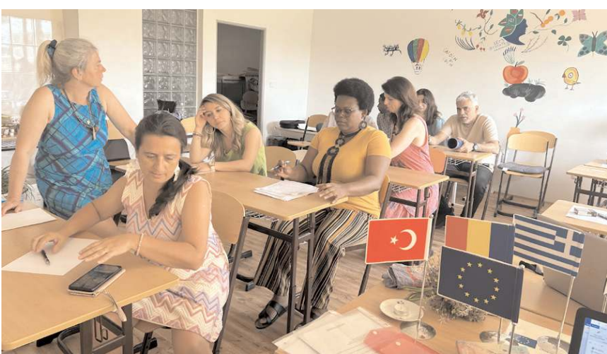
Hitit Üniversitesi Tıp Fakültesi ile Mehmetçik Anadolu Lisesi, birlikte Erasmus+ projesine imza attılar.