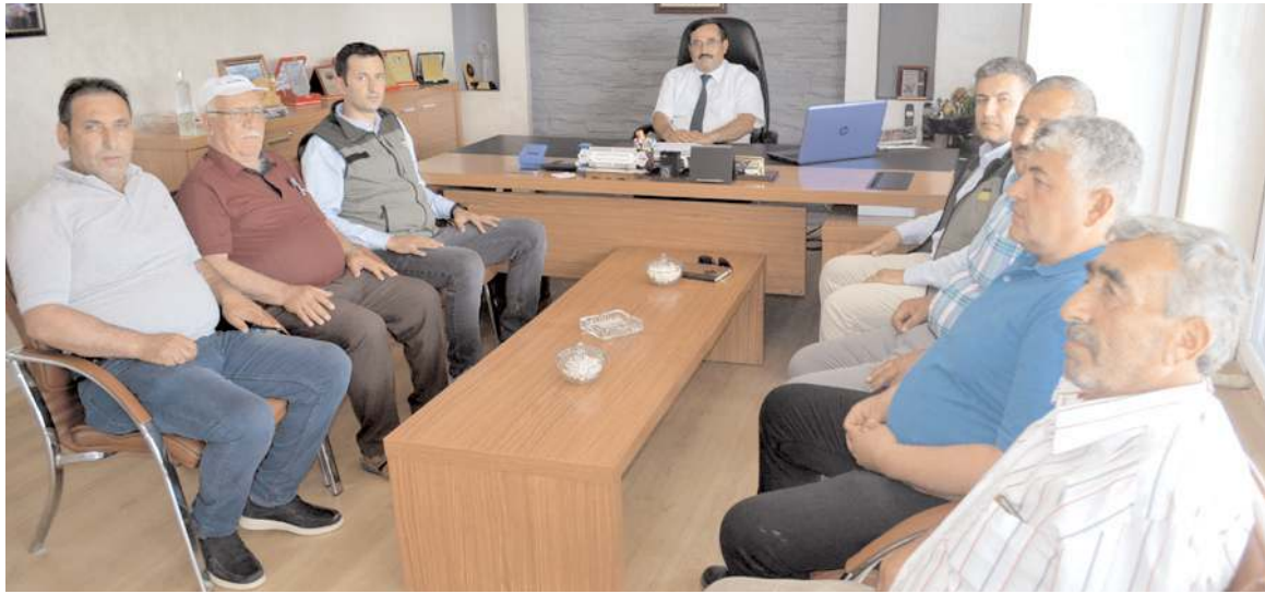
Çorum Ziraat Odası'nda yapılan toplantıda çiftçilerin TMO'da yaşadıkları randevu sorunu konuşuldu.