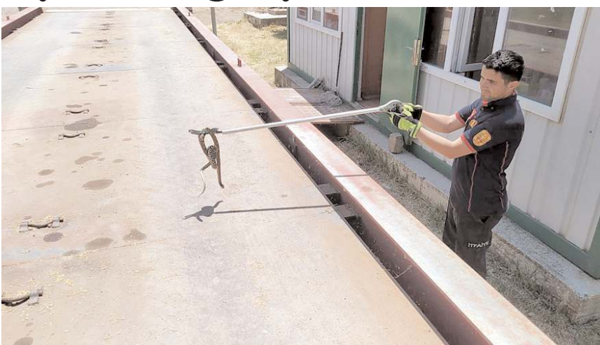
İtfaiye görevlileri, yılanı yakalayarak yaşam alanına bıraktı.

Çorum'un İskilip ilçesinde Toprak Mahsulleri Ofisi (TMO) bahçesinde giren yılan, yakalanarak doğal yaşam alanına salındı.