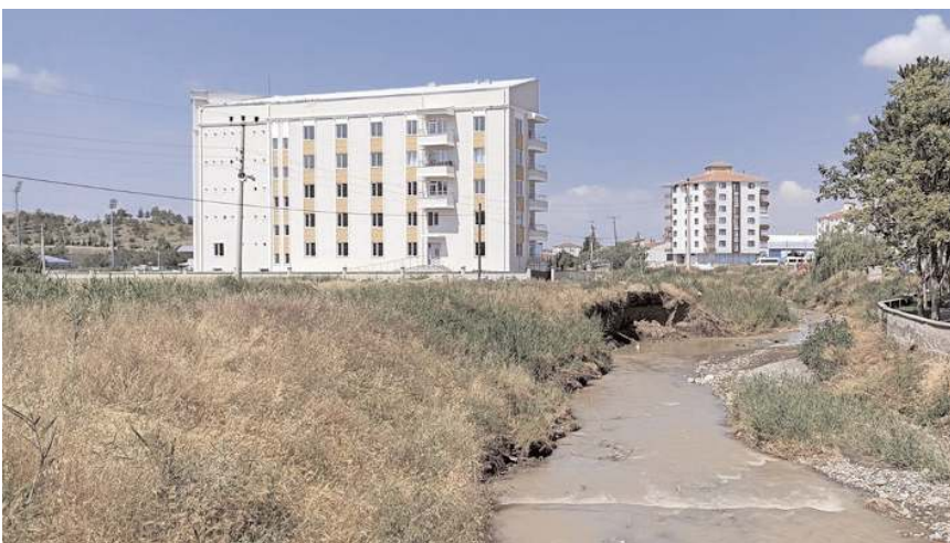
Budaközü çayı ıslah edilmeyi bekliyor.

çevresindeki binalar, can ve mal güvenliği için tehlike arz ediyor. Budaközü çayında oluşan toprak kaymasını fotoğraflayan Hüsnü Güngör, "Bir an önce yetkililerin Budaközü çayında ıslah çalışmalarını tamamlaması, bu bölgede yaşayan insanlar adına yapılacak en öncelikli çalışmalarından biridir. Yetkililerden ricamız, Budaközü çayının gerekli çevre düzenlemesi yapılarak güvenli hale gelmesi" ifadelerini kullandı. (İHA)