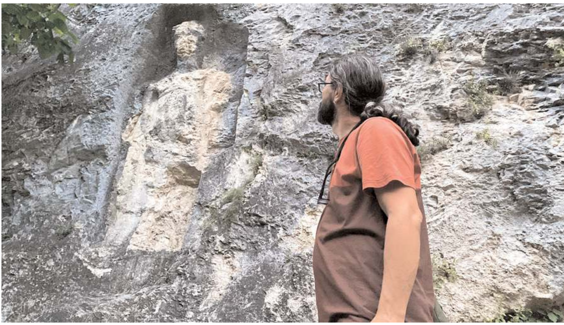
Kibele kabartmasını ziyaret eden vatandaşlar, gördükleri manzara karşısında büyük üzüntü yaşıyor.