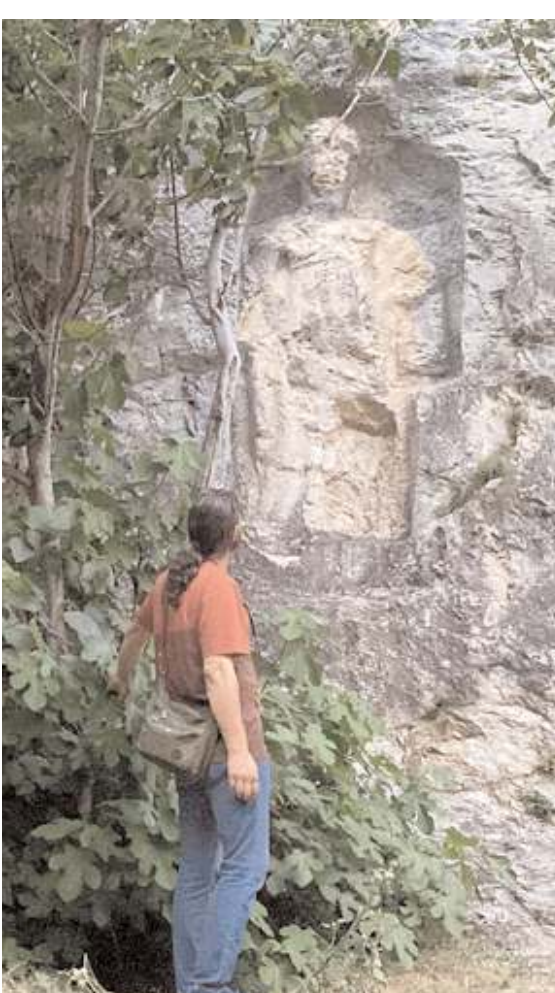
Kibele kabartmasını ziyaret eden vatandaşlar, gördükleri manzara karşısında büyük üzüntü yaşıyor.