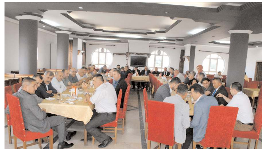
ÇESOB'ta gerçekleştirilen bayramlaşmaya katılım yüksek oldu.