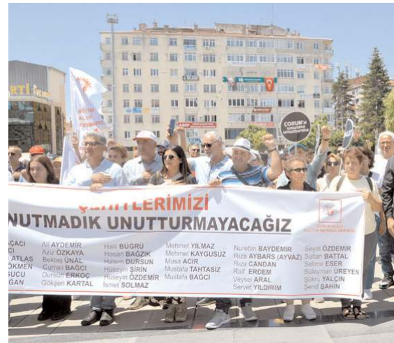
Çorum olaylarının yıldönümü nedeniyle anma programı yapıldı.