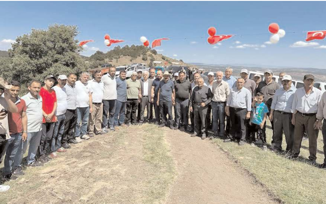
İlki yapılan şenliğe katılım yüksek oldu.

arkadaşlarımızı, dostlarımızı gördük ve mutlu olduk Allah nasip ederse, İstanbul’da çok daha büyük bir organizasyona imza atacağız. İstanbul’dan sonra da inşallah Ankara’da böyle bir organizasyon yapacağız” ifadelerini kullandı.