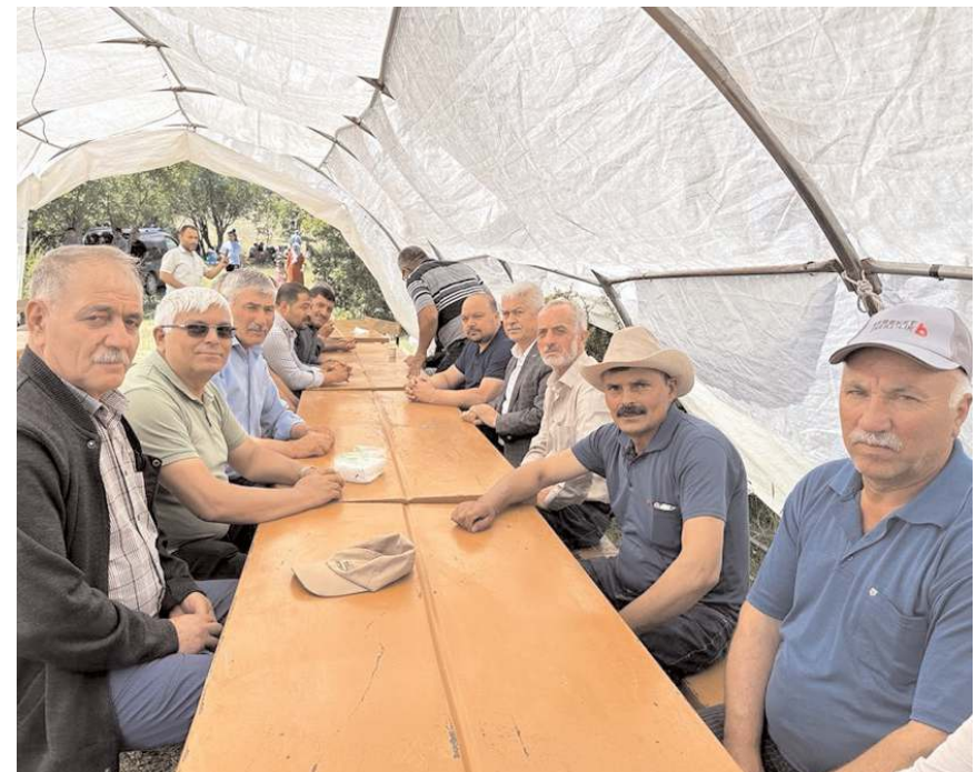
Şenliğin geleneksel hale getirilmesi hedefleniyor.

Konuşmaların ardından yaz şenliğinde çeşitli yarışmalar düzenlendi. Halat çekme ve çuval yarışmasında köylüler birbirleriyle kıyasıya yarışırken, yaz şenliğinde köylüler müzik eşliğinde doyasıya eğlendi. (İHA)