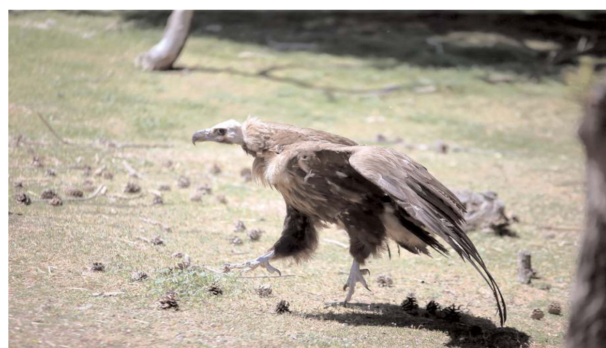
Akbaba, tedavisinin ardından doğaya bırakılacak.