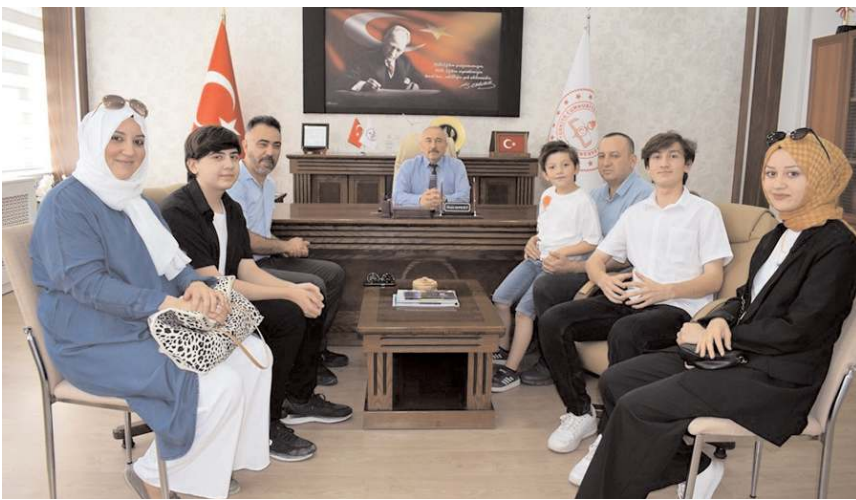
öğretmenlerini tebrik ediyorum" şeklinde konuştu. (İHA)