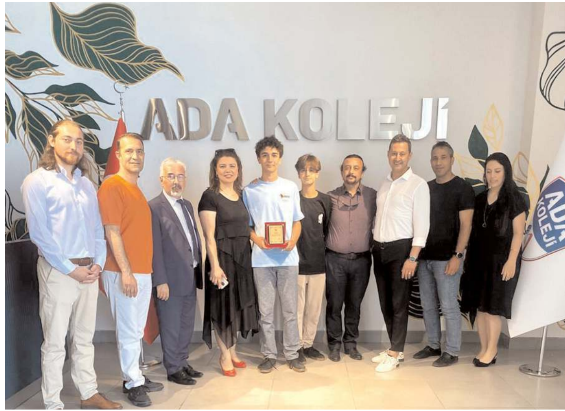
Özel Çorum Ada Koleji Ortaokulu öğrencileri LGS'de başarıları ile dikkat çektiler.