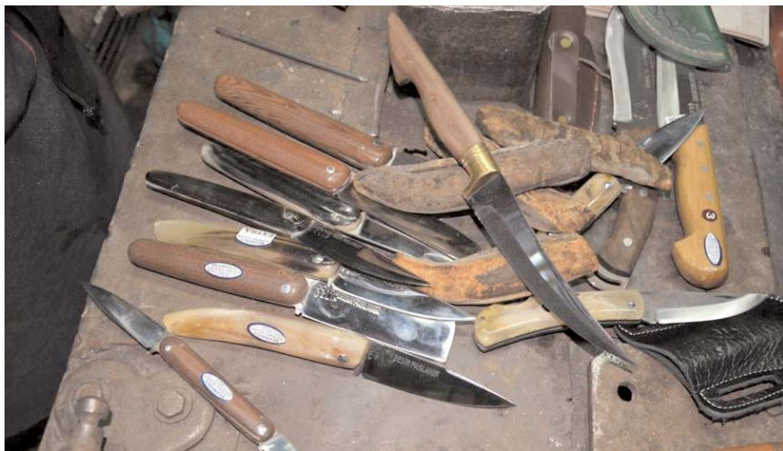
Bıçak sapları sağlam ve uzun ömürlü olması için keçi ve koyun boynuzundan yapılıyor.