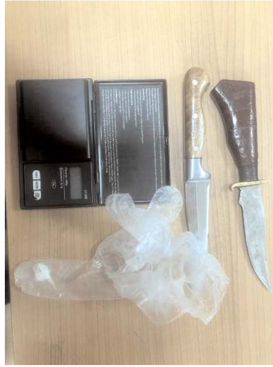
Olayla ilgili 1 adet ruhsatsız tüfek, 55 adet av fişegi, 2 adet bıçak, hassas terazi ve bir miktar metamfetamin ele geçirildi.

Belediye Başkanı Halil İbrahim Aşgin ile AK Parti İl Başkanı Murat Günay da düğün çıkışı tesadüfen denk geldikleri kaza da aileyi sakinleştirdi.