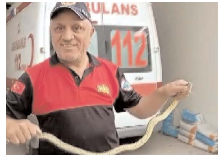
Ekipler, çalışmanın ardından yılanı yakalamayı başardı.

Yakalanan yılan yerleşim alanından uzak bir bölgede doğaya salındı. (İHA)